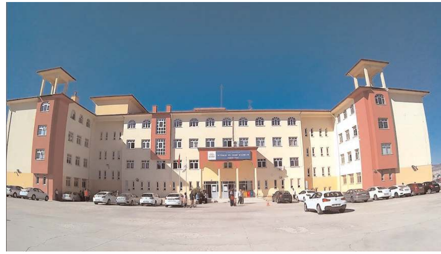
İşletme Bölümüne 2023-2024 eğitim-öğretim yılında 30 öğrenci alınacak.

İşletme Bölümünde, 2019 yılında Hitit Üniversitesi bünyesinde oluşturulan uluslararasılaşma