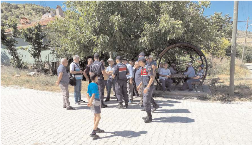
Köy halkı duruma tepkisini dile getirdi.

gecikeceğine dikkati çeken Şahiner, "Ancak verimde düşüş olacağını sanmıyorum, iyi bir verim bekliyoruz. Çiftçilerimize hayırlı, bereketli bir sezon geçirmelerini temenni ediyorum." ifadelerini kullandı.(AA)