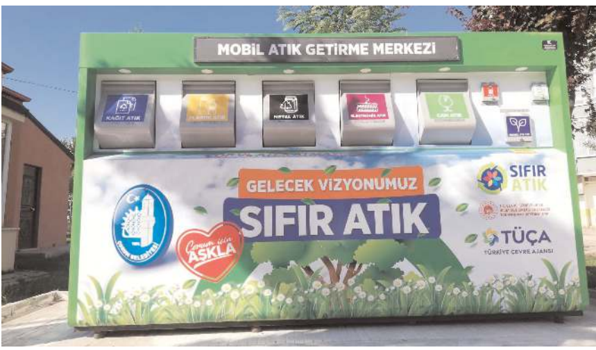
20 adet mobil atık getirme merkezi, belirlenen bölgelerde kurulmaya başlandı.

Sıfır atık üzerine eğitim merkezi olarak kullanılan 1. Sınıf Atık Getirme Merkezi'ni 2021 yılında hizmete açtıklarını ifade eden Belediye Başkanı Dr. Halil İbrahim Aşgın, "Belediyemizin sıfır atık çalışmaları çerçevesinde çevre kirliliğini önlemek ve geri dönüşümü mümkün atıkları ekonomiye yeniden kazandırmak adına 13 farklı atığı topluyoruz. Kağıt ve kartonlar, plastik, metaller, camlar, ahşaplar, tekstil, elektronik ekipmanlar, kurşunlu piller, floresan ve cıva içeren atıklar, akümülatörler,