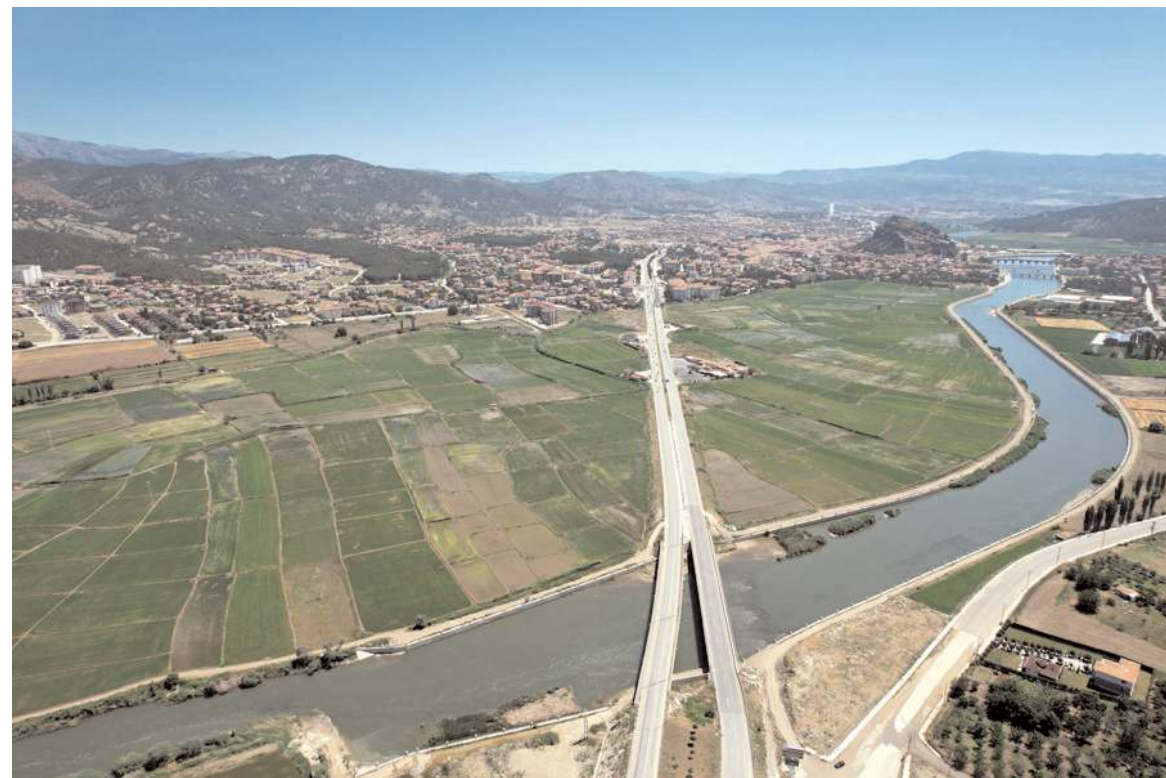
İlçede 24 bin dekar alanda çeltik ekimi yapılıyor.