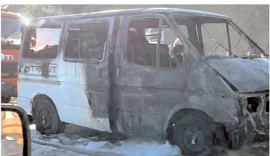
Olayda minibüs kullanılmaz hale geldi.

Yangında ölen yada yaralanan olmazken, minibüs kullanılmaz hale geldi.