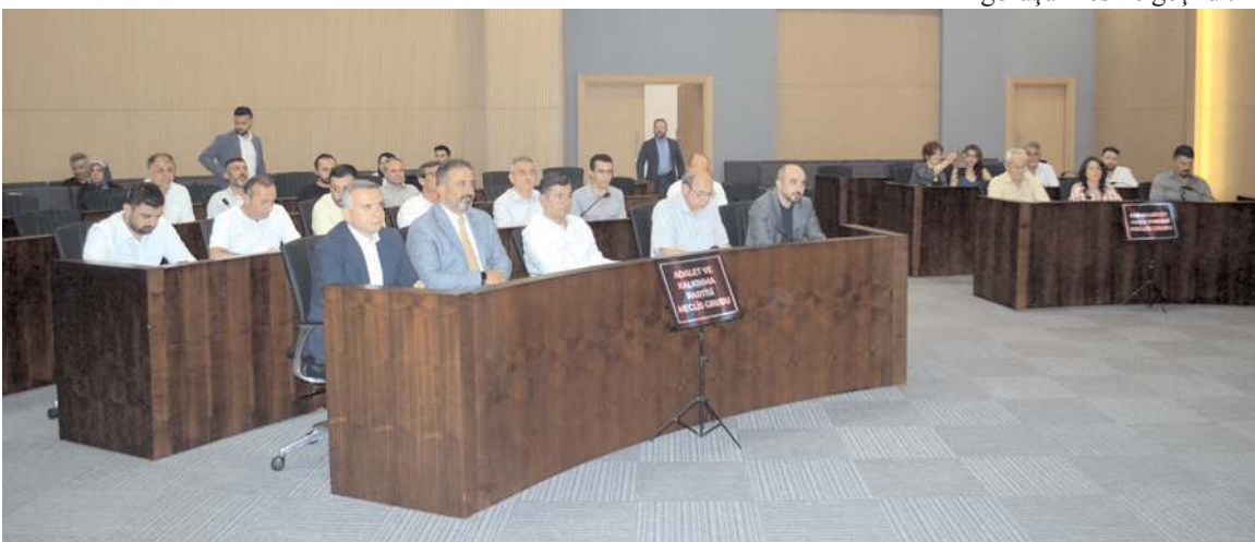
Gündem maddelerinin görüşülmesinin ardından toplantı sona erdi.