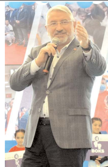
elimizden gelen çabayı gösteriyoruz.

Türkiye Yüzyılı'nın mimarları olarak çocuklarımızı ve gençlerimizi geleceğe en güzel şekilde hazırlamak için spor büyük önem taşıyor. Günümüzün hastalığı sosyal medya ve teknoloji bağımlı gençlerden spor alanlarında spor yapan gençlerle buluşturmak için