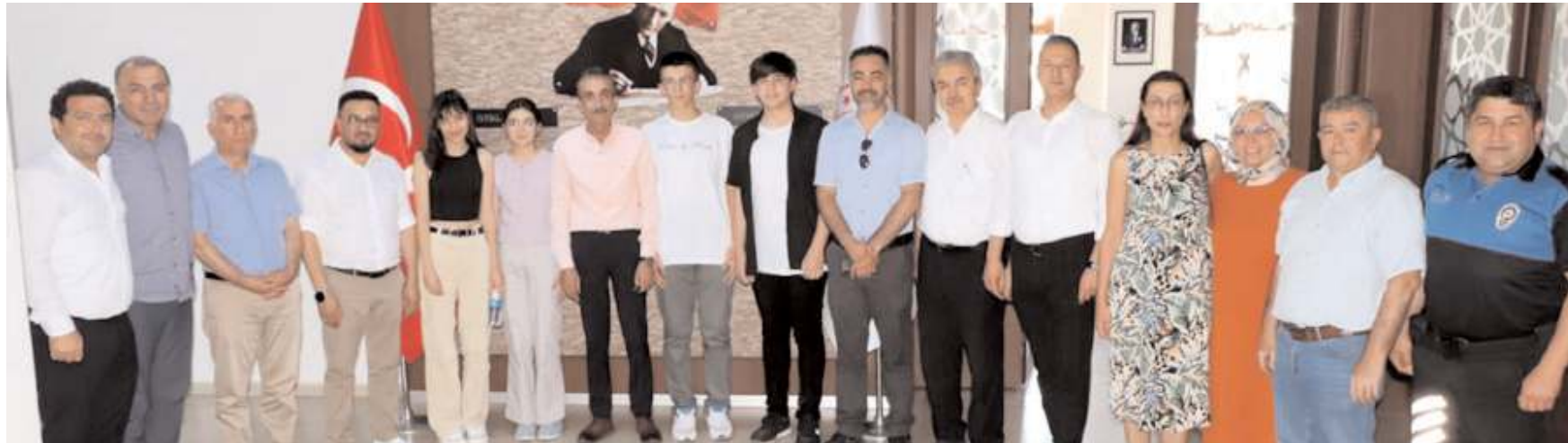
Ödül töreninin ardından öğrenciler ve aileleri toplu hatıra fotoğrafı çekindiler.

Millî Eğitim Müdürü Abdullah Kodek, gururlu olduklarını belirterek, "Çorum, liselere giriş sınavında bu yıl önemli başarı elde etti. Okul ve ilçeler bazında analiz çalışmalarını değerlendirerek gelecek senelere daha iyi bir seviyede olmanın gayretinde olacağız. Bizim arzumuz çocuklarımızın geleceğe en iyi şekilde hazırlanması için bu başarı oranlarını daha ileriye taşımak. Öğrencilerimizi, emeği geçen öğretmenlerimizi ve ailelerimizi bu başarılarından dolayı tebrik ediyorum. Öğrencilerimiz inşallah arzu ettikleri, hayallerini kurdukları liselere kayıtlarını yaptıracağız" dedi. (İHA)