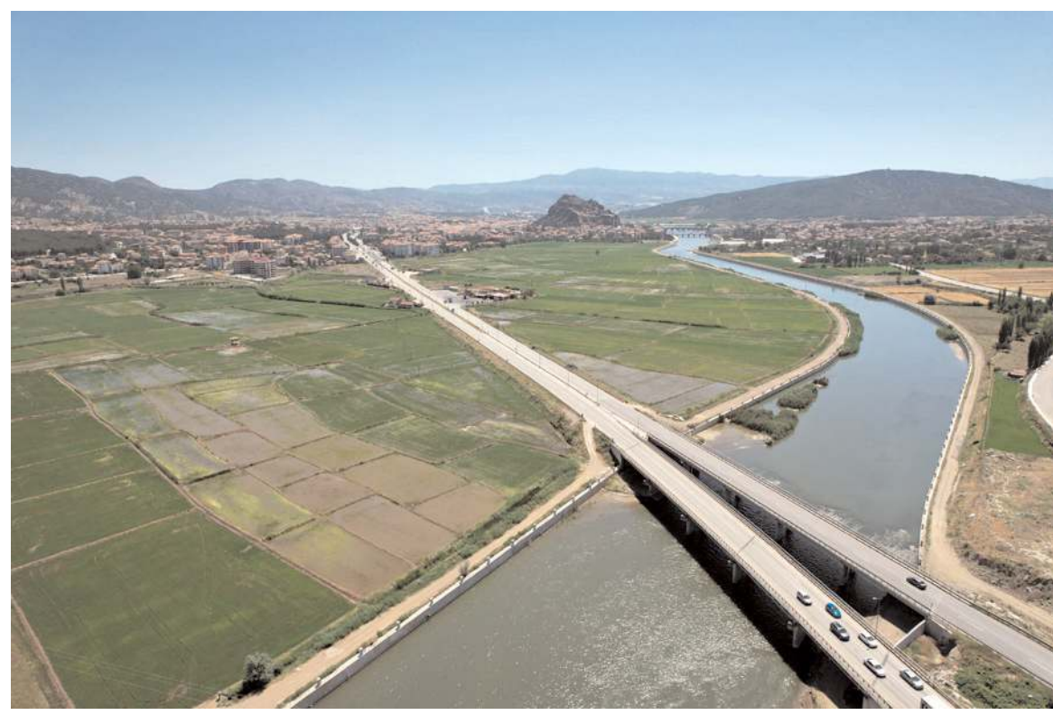
Türkiye'nin önemli pirinç üretim merkezlerinden Osmancık'ta çeltik tarlaları doğayı yemeşil yaptı.