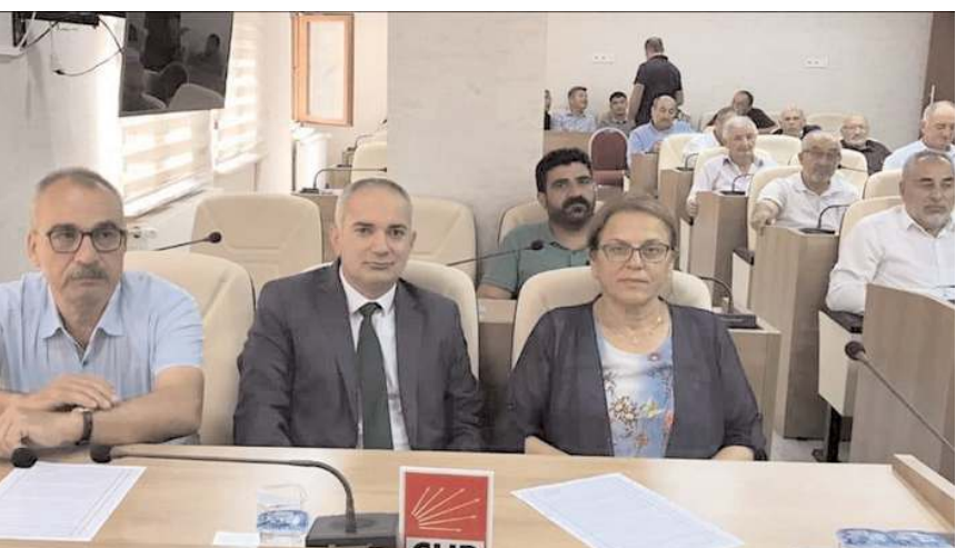
Gündem maddelerinin görüşülmesinin ardından toplantı sona erdi.