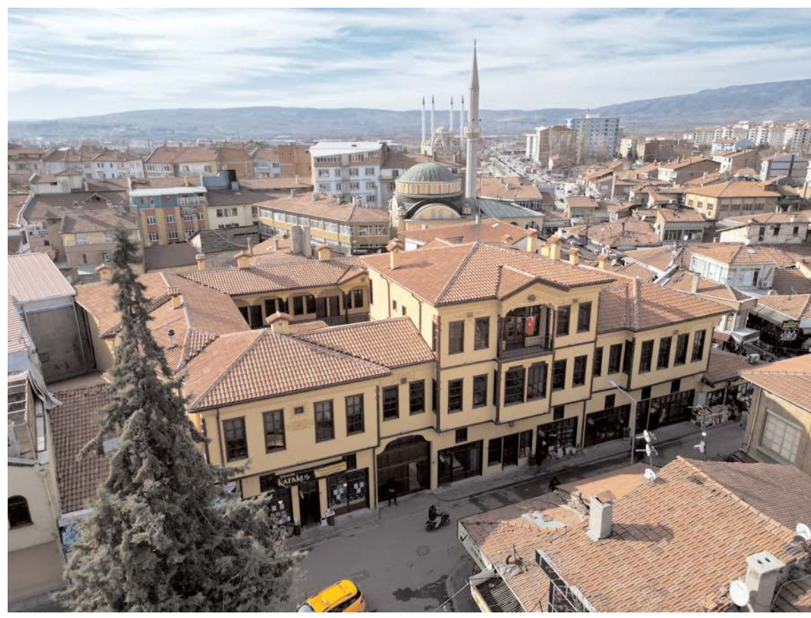
Yöresel Çorum Mutfağı Restoranı, Velipaşa Hanı'nda faaliyete başlayacak.