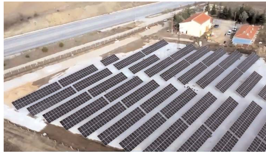
Çorum Belediyesi tarafından Eskice Köyünde kurulan Güneş Enerjisi Santrali.

Konaklı Köyünde bizim bir terfi istasyonumuz var ve çok önemli miktarda enerji sarfiyatı oluyor. Oradaki arazimizin uygun görülen bir bölüme Güneş Enerjisi Santrali yapacağız. Böylece enerji üretim potansiyelimizi daha da