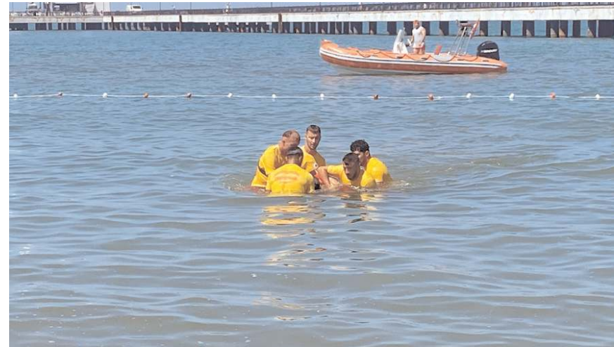
Samsun'da mavi bayraklı 13 plaj bulunuyor.