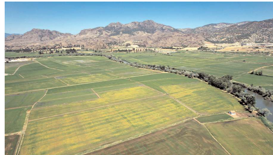
Türkiye'nin çeltik üretiminin yaklaşık yüzde 5'i Çorum'da yapılıyor.