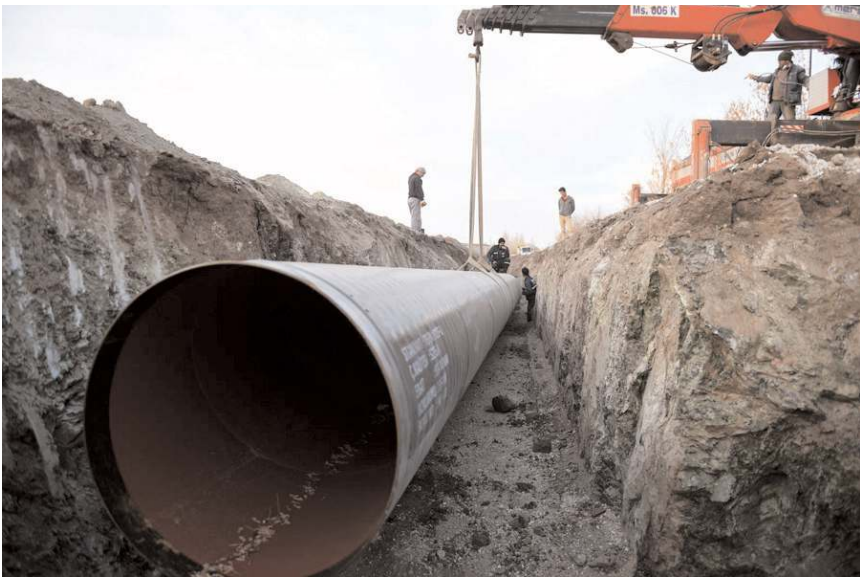
Proje kapsamında 17 km uzunluğunda yeni hat dönecek.