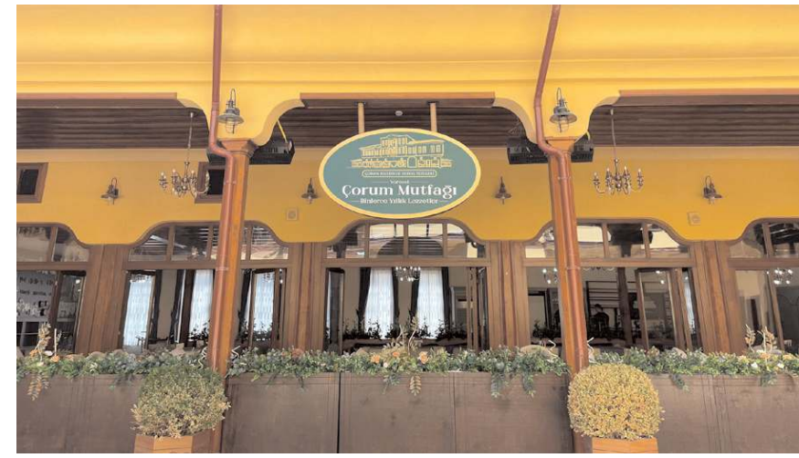
Restoran da yöresel yemekler yer alacak.

Açılış töreninin 10 Temmuz Pazartesi günü