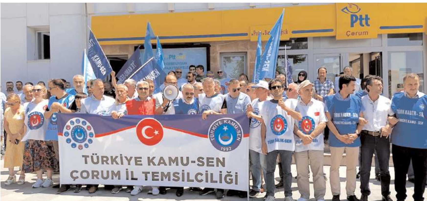
Türkiye Kamu Sen'e bağlı sendikaların üyeleri taleplerini dile getirdiler.

Bu çerçevede Türkiye Kamu-Sen olarak Temmuz ayında memur maaşlarına yapılan artışların yetersiz ve eksik olduğunu ifade ediyoruz. Yüzcüncü kuruluş yıldönümünü kutlayacağımız Türkiye Cumhuriyetimizin, kadim devlet geleneğimizin miras aldığı köklü bir kamu yönetimi ve memur anlayışı vardır. Güçlü devletler, temsilcisi olan memurlarını da güçlü kılar. Biliyoruz ki Devletimiz güçlüdür; memurlarını ve emeklilerini mağdur etmemiştir; bundan sonra da etmeyecektir. Sayın Cumhurbaşkanımıza da bu konudaki güvenimiz sonsuzdur. Türk memurunun ve emeklilerimizin taleplerini mutlaka dikkate alacağına ve ifade ettiğimiz sorunları en kısa sürede çözüme kavuşturacağına yürekten inanıyoruz. Bu bakımdan maaş artışlarıyla ilgili ifade ettiğimiz aksaklıklar, TBMM'de mutlaka değerlendirilmeli, bu teklif revize edilerek aileleriyle birlikte 20 milyonu bulan memur ve emeklilerimiz için devletimizin toplu sözleşme hükümlerine ilave olarak yaptığı bu iyileştirme, tam anlamıyla amacına ulaşmalıdır. Türkiye Kamu-Sen olarak sıraladığımız aksaklıkların düzeltilmesi için her türlü girişimde bulunacak, her platformda mücadelemizi sürdüreceğiz."