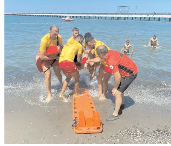
Cankurtaranlar sahil bandında 22 Eylül'e kadar görev yapacak.

Tüm vatandaşlarımızı sudan çıkartmamıza rağmen 5 vatandaşımız maalesef rahmetli oldu. Bunun için vatandaşlarımızın cankurtaran ekiplerimizin uyarılarına kulak asmalarını istiyoruz. Terme, Çarşamba, Atakum ve Yakakent ilçeleri sahil bandında 22 Eylül'e kadar hizmetimiz devam edecektir." ifadesini kullandı.(AA)