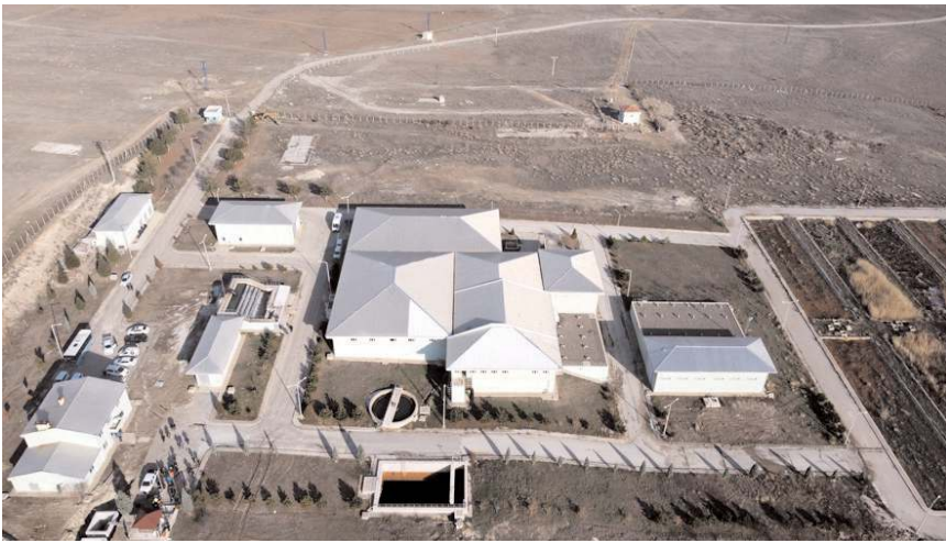
2. Kademe İçmesuyu Arıtma Tesisi 60 bin m3 kapasiteli olacak.