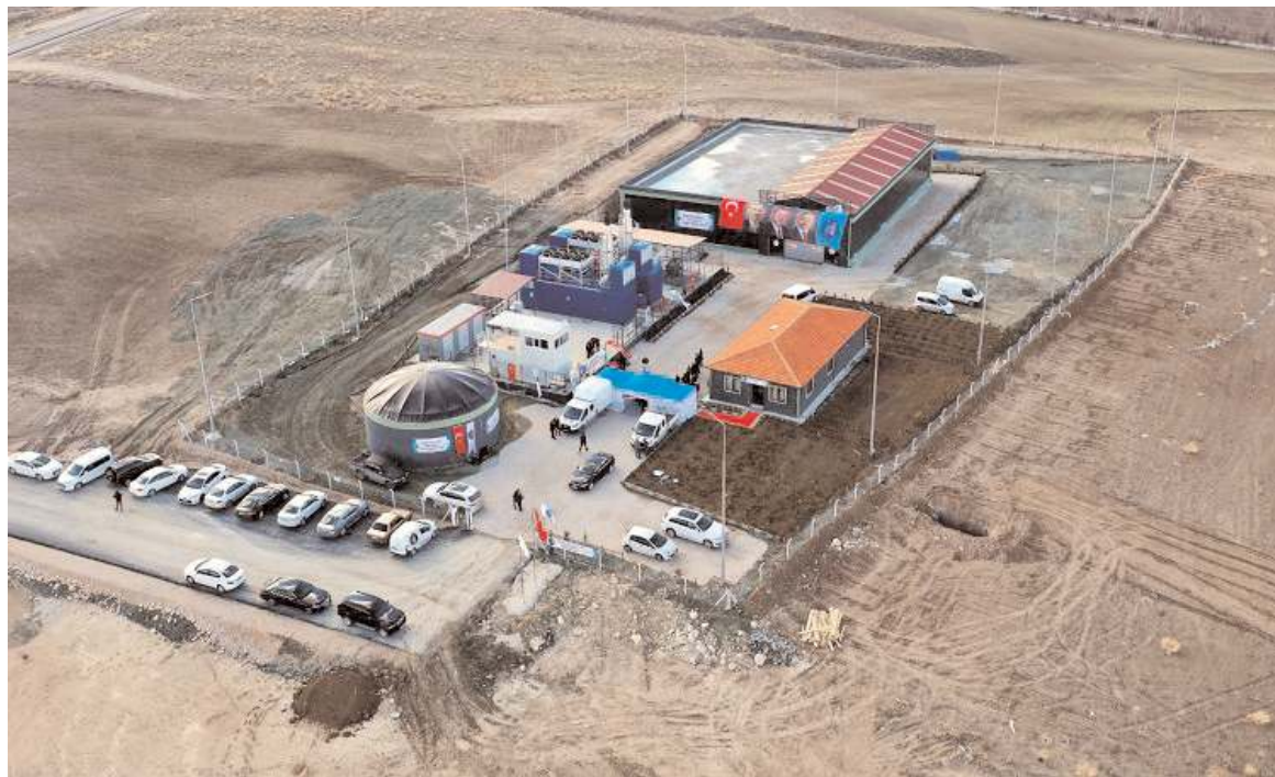
Çorum Belediyesi'nin katkılarıyla Karapürçek mevkinde kurulan çöpten elektrik üretim tesisi.