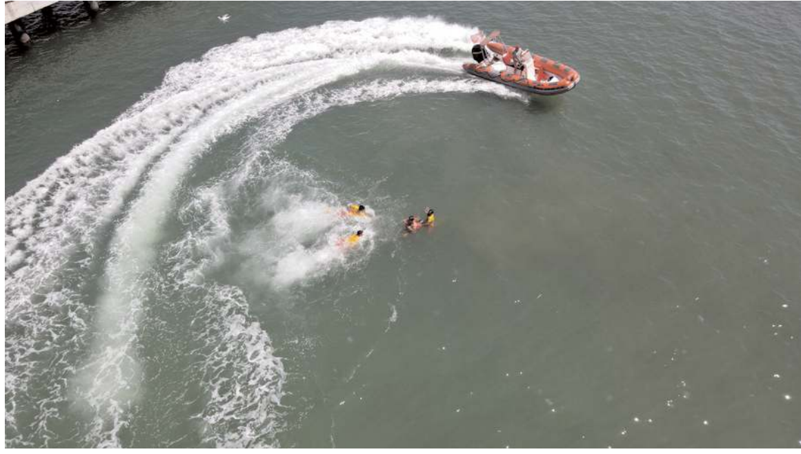
Kesintisiz 30 kilometrelik sahil bandında 80 cankurtaran göreve başladı.

Memur maaşlarına yapılan 8 bin liralık seyyanen zammın maaş katsayısı hesabına dahil edilmemesi ücretin daha da yükselmesinin önüne geçti. Bu nedenle temmuz ayında bedelli askerlik ücretinin endekslendiği memur maaş katsayısı sadece yüzde 17.55 oranında arttı. Böylece temmuzdan aralık dönemine kadar olan ücret 122 bin lira seviyesinde belirlendi.