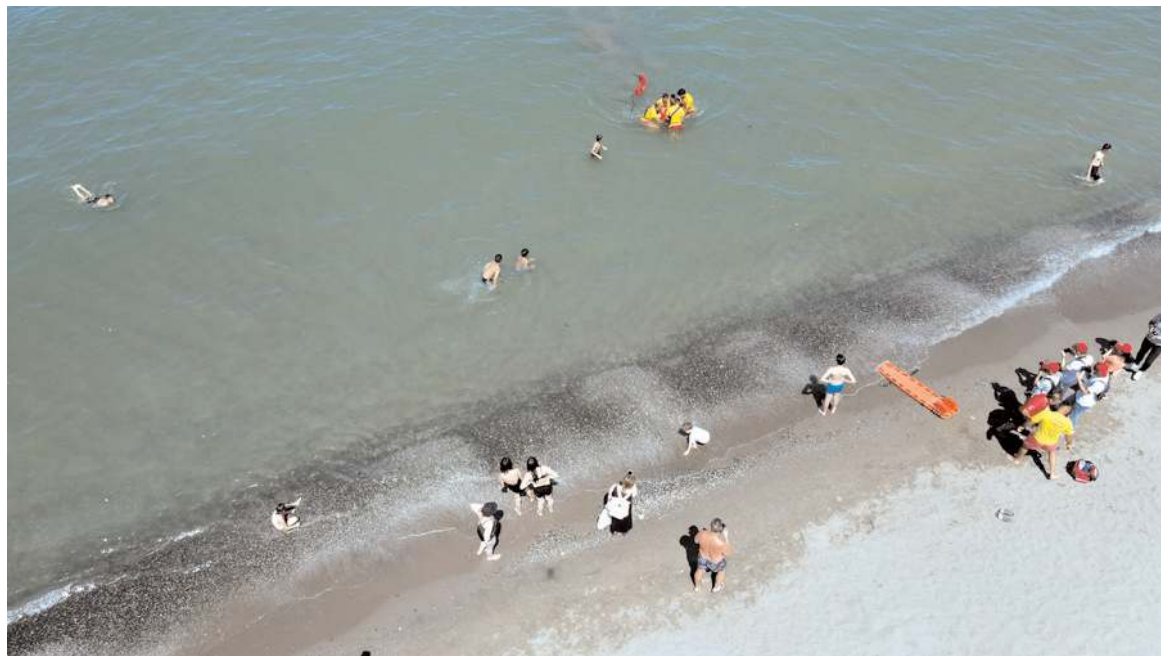
Rüzgarlı havalarda denize girmemesi gerektiği belirtiliyor.