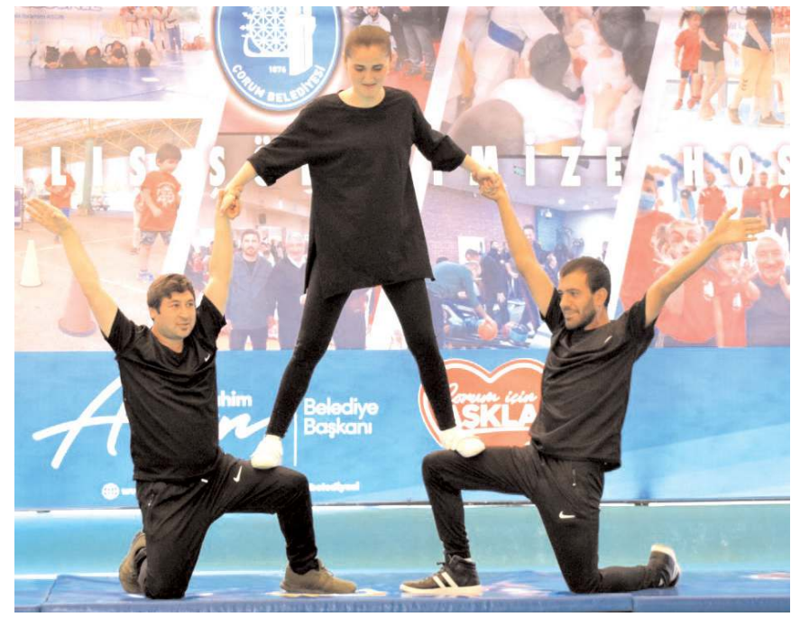
Çorum Belediyesi Engelli Merkezi öğrencilerinin gösterisi büyük alkış aldı

Program, halk oyunları gösterisi, Engelli Eğitim Merkezi'nin jimnastik gösterisi, masa tenisi, güreş, karate ve çocuk dansı gösterileri ile sona erdi.