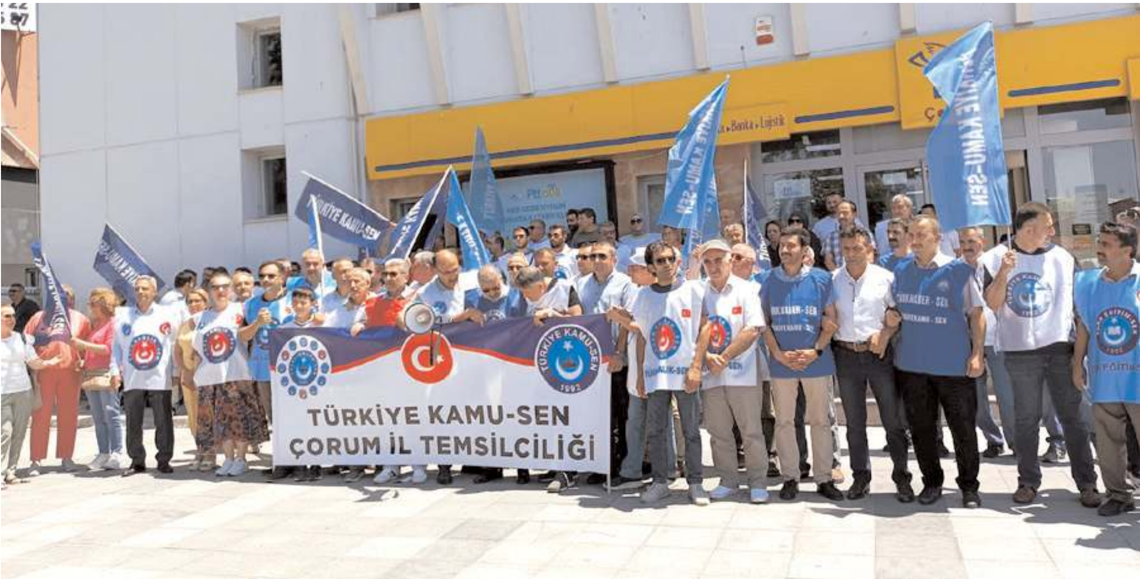
Türkiye Kamu Sen Çorum İl Temsilciliği PTT önünde düzenlediği eylemle memur maaşlarına yapılan zamların yeniden hesaplanmasını talep etti.