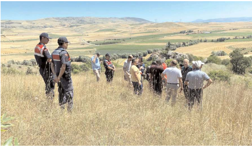
Mahkemenin görevlendirdiği bilirkişi heyeti tesislerin yapılacağı alanda keşif yaptı.