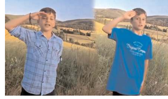
Çocuklar bir sürücünün tekmi emrine tekbir ile karşılık verdiler.