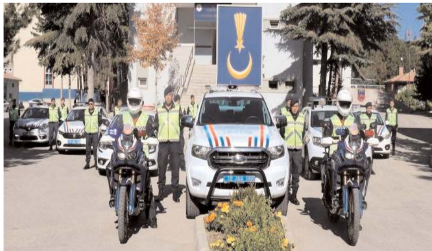
Toplam 1.538 şahsın hakkında adli soruşturma başlatıldı.