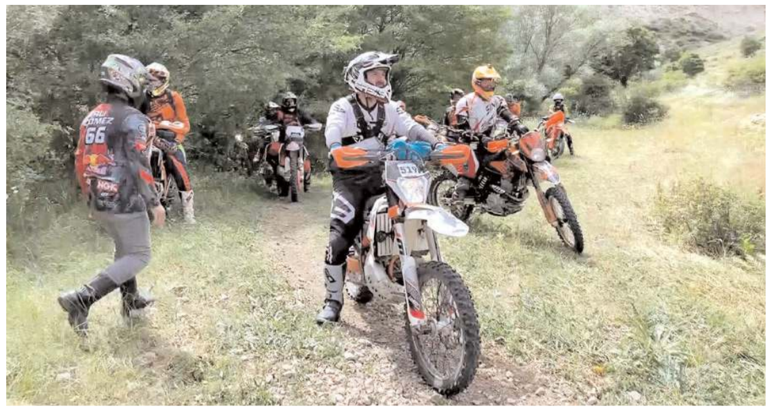
Yozgat'ta, çeşitli illerden gelen motosiklet tutkunları adrenalin coşkusunu doyusya yaşadı.