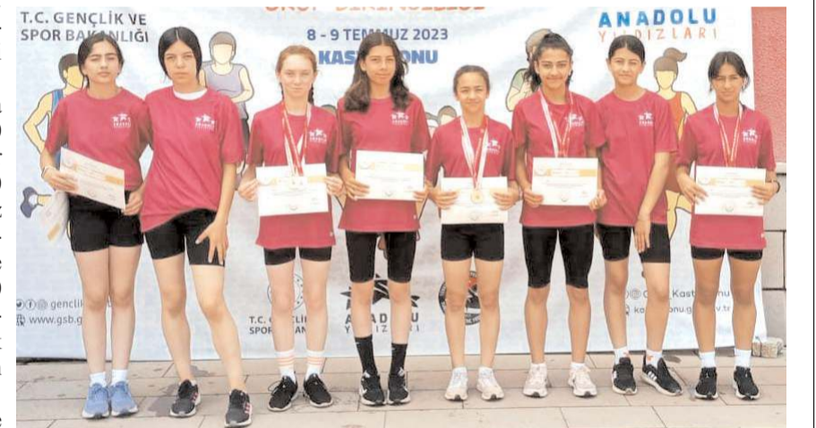
Kastamonu'da Analig Atletizm'e yarışan Çorum takımı bayan sporcuları ödül töreninde

Yetgin bronz madalya kazandı. Kastamonu'da dereceye giren Atletler Erzincan'da yapılacak olan yarı final grubunda mücadele edecekler.