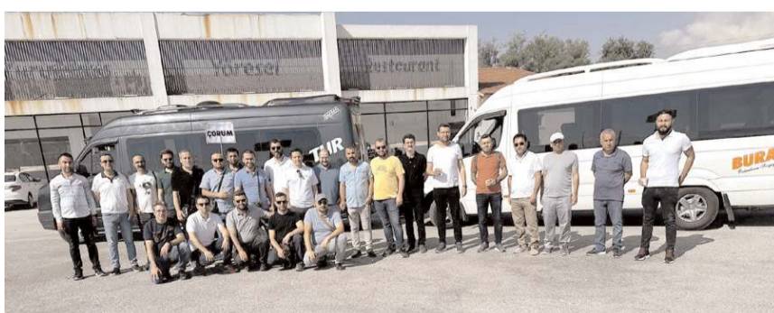
Eyleme Çorum'dan da mühendisler katılarak taleplerini dile getirdiler.