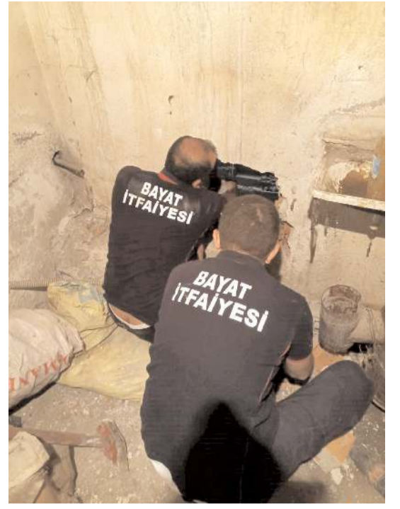
İtfaiye ekipleri yavru kediyi kurtarmak için duvarı deldi.