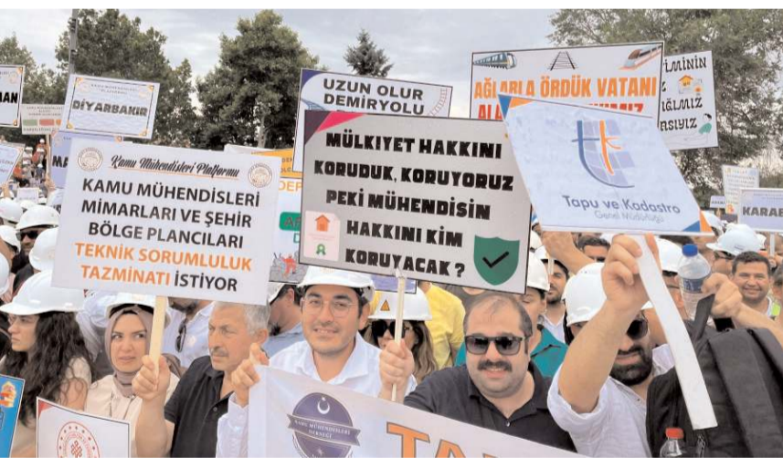
Ankara'da gerçekleştirilen eyleme katılım yüksek oldu.