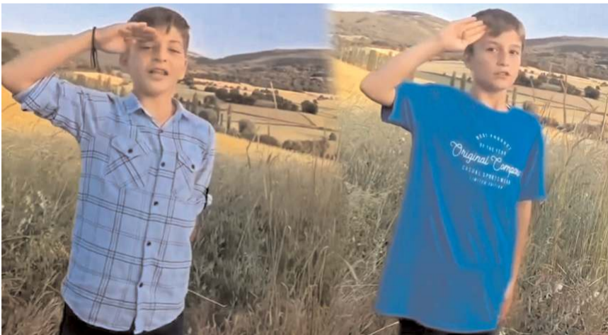
Çocuklar bir sürücünün tekniler emrine tekbir ile karşılık verdiler.

Çocuklar tekniler olarak algılayarak "Allah-u Ekber" diye bağırmağa başladılar.