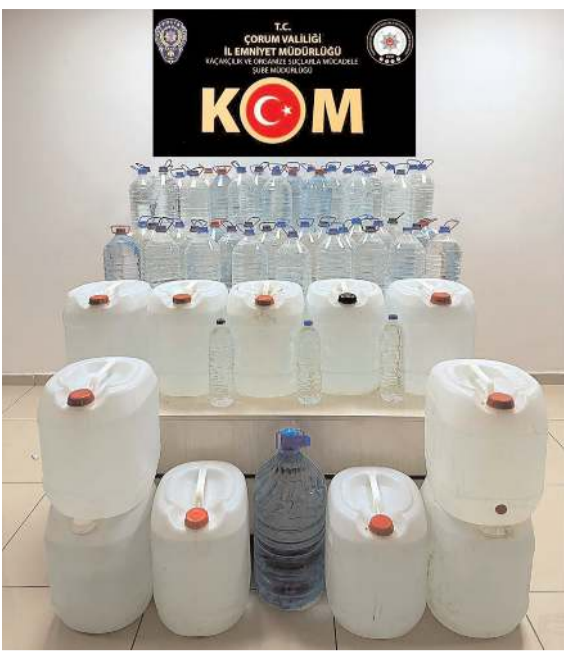
Operasyonda 630 litre kaçak el yapımı alkollü içki ele geçirildi.