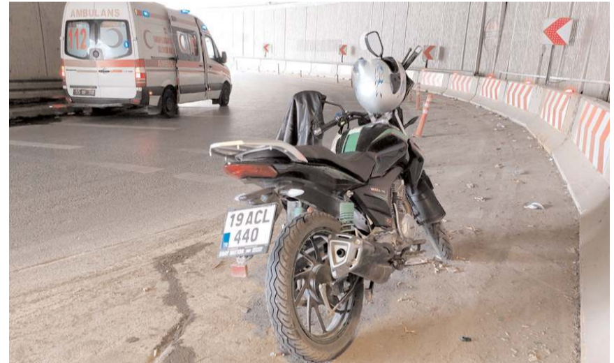
Kazada motosiklet sürücüsü yaralandı.