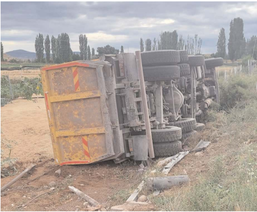
Kaza Kemallı köy yakınlarında meydana geldi.

Sağlık ekiplerince ilk müdahalesi yapılan sürücü, ambulansla Sungurlu Devlet Hastanesi'ne kaldırıldı.(AA)