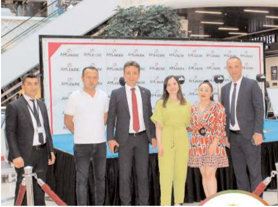
Kampanyanın çekilişi geçtiğimiz cumartesi günü yapıldı.

AHL Pay Kart kampanyasının talihlileri belli oldu