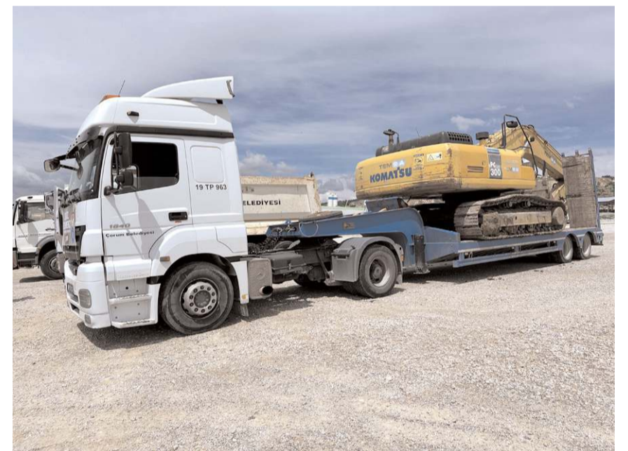
Makine ve kamyonlar dün yola çıktı.