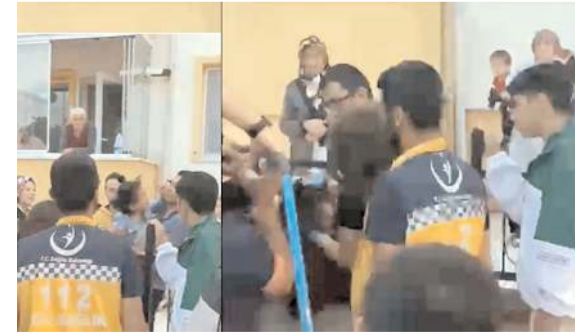
Olay İbrahim Çayın 4.Sokak'ta bir evin bahçesinde meydana geldi.

Kafası demir korkuluğa sıkışan çocuğu itfaiye kurtardı