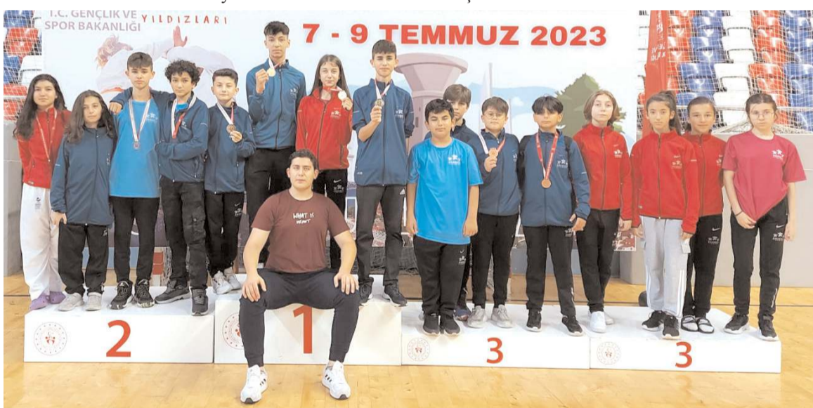
Karate Yarı Final grubunda büyük başarıya imza atan Çorum kız ve erkek takımları madalya töreni sonunda toplu halde

Takım sıralamasında ise Çorum 55 puanla birinci olurken Erzurum 48 puanla ikinci Trabzon ise 47 puanla üçüncü oldu.