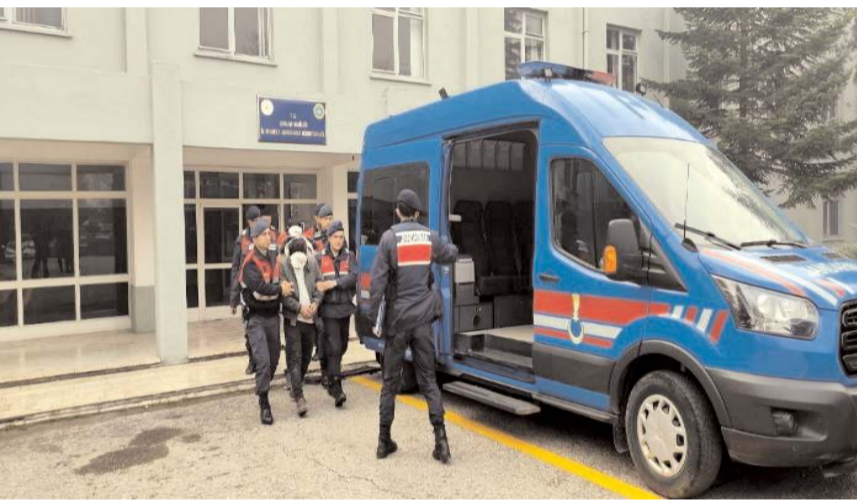
Jandarma ekipleri yılın ilk 6 ayında 2 kasten öldürme ve 136 kasten yaralama olayının tamamını aydınlattı.

kavak futbol sahasının zemini daha sonra sentetik çim yapıldı. Bu sahada yağlı güreşler artık yapılmaz. Akent Mahallesi'nde bulunan Atletizm Stadyumu'nun ortasında büyük bir yeşil alan bulunuyor. Geleneksel yağlı güreşler burada yapılabilir. Sporcular için her türlü alt yapının hazır olduğu Atletizm Stadyumu böyle büyük bir organizasyona ev sahipliği yaparak hem atıl durmaktan kurtarılmış hem de yağlı güreşler de yeni bir merkez kazanmış olacak" diyerek talebini dile getirdi.