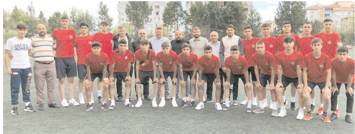
Mimar Sinan Gençlikspor'u Aksaray yarı final grubuna başarı dilekleri ile yolcu edildi

Grupta ilk maçta bugün saat 16'da Karaman Başakspor ile Ankara Kavaklıdereşpor karşılaşacak. Mimar Sinan'ın bay geçeceği B grubunda ise ilk maçta saat 18'de Ankara Güneşspor ile Kayseri Kocasinan Şimşekspor takımları mücadele edecek. Mimar Sinan Gençlikspor yarın saat 16'da bugünün kaybedeni ile beraberlik halinde ise Ankara Güneşspor ile karşılaşacak. Grup maçları pazar günü oynanacak final ile sona erecek.