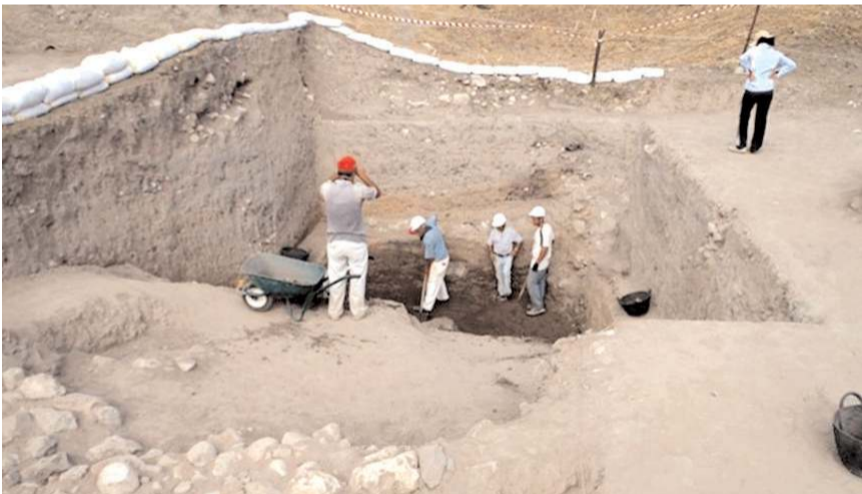
Başvurular İŞKUR üzerinden yapılacak.

Çorum'un Alaca İlçesi sınırları içinde yer alan Eskiyapar, Hiti'nin iç çekirdek bölgesi olarak tanımlanan Boğazköy ve Alaca Höyük çevresindeki üçüncü bir merkez. Sungurlu Alaca yolu üzerinde Alaca-Hüseyinabad Ovası'nda, Alaca'nın 5 km batısında, kara yolunun güneyinde bulunan Eskiyapar, çevresindeki üç önemli merkeze hakim bir geçiş noktasında. Boğazköy'e 20,7 km, Alaca Höyük'e 10,5 km ve Ortaköy'e 42 km uzaklıkta.