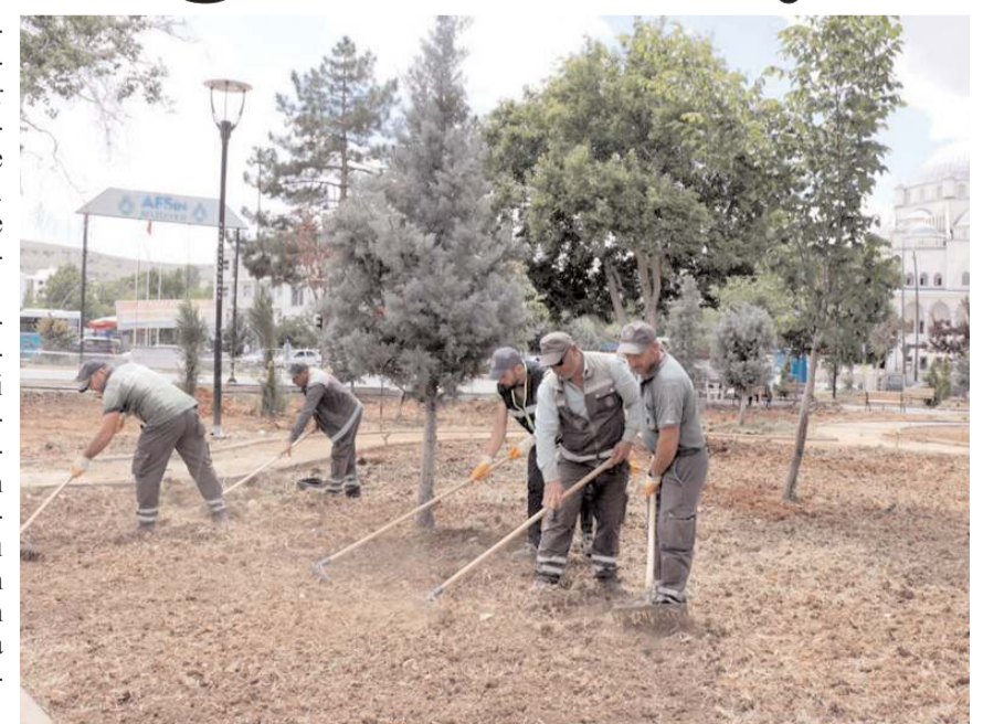
Belediye ekipleri Şehit Ömer Erüstün Meydanı'nda düzenleme yaptılar.