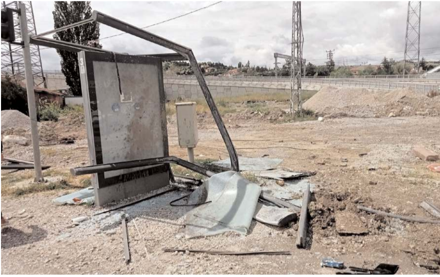
Otobüsün çarptığı durak kullanılmaz hale geldi.