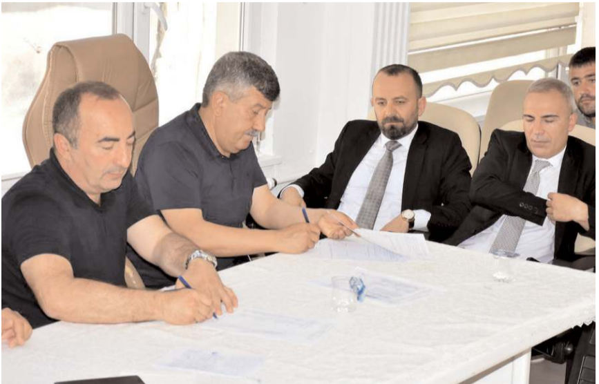
İskilip Sanayici ve İşadamları Derneği toplantısında yönetim kurulu oluşturuldu.