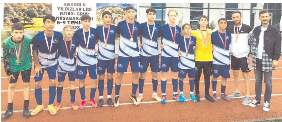
Çorum takımı Bartın'da baraj maçını kazanarak yarı final grubuna yükseldi. Çorum takımı ödül töreninde toplu halde