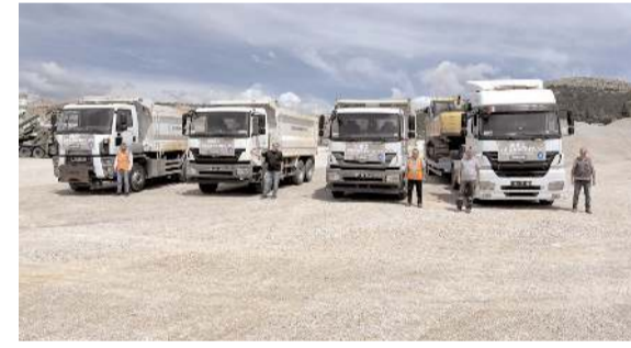
Belediye afet bölgesine 3 adet kamyon ve 1 adet ekskavatör ile 4 personel gönderdi.