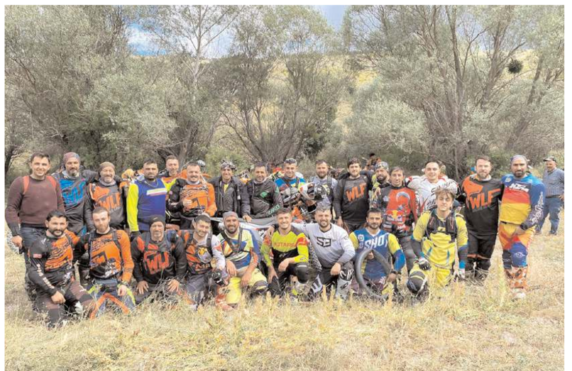
Etkinliğin sonunda toplu hatıra fotoğrafı çekildi.