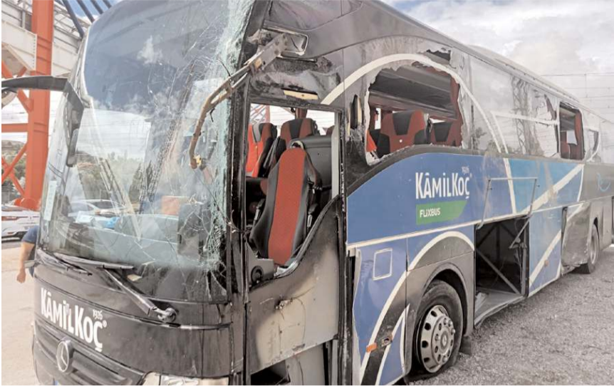
Kaza, Mamak'ta 19 Mayıs Bulvarı'nda meydana geldi