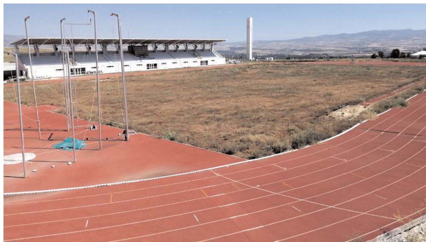
Akent Mahallesi'nde bulunan Atletizm Stadyumu'nun yağlı güreşler içinde kullanılabilirliği belirtildi.