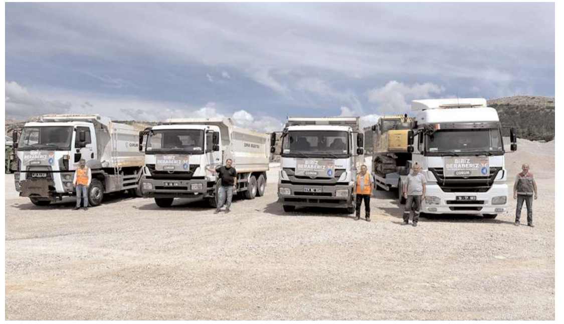
Belediye afet bölgesine 3 adet kamyon ve 1 adet ekskavatör ile 4 personel gönderdi.