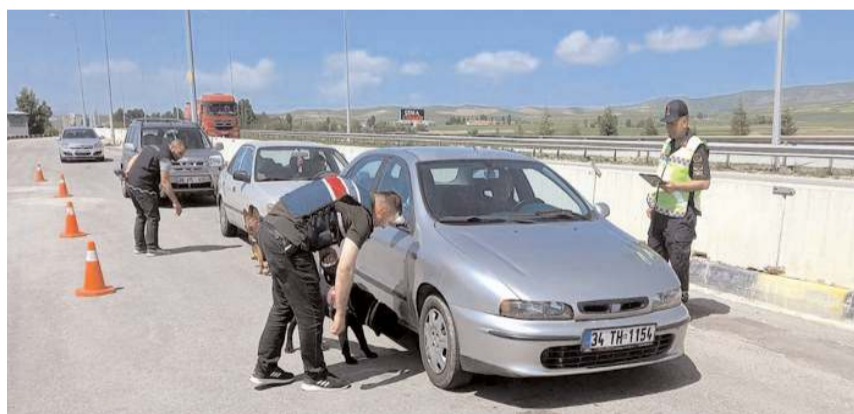
Toplam 12.541 denetim faaliyetinde 156.783 araç ve sürücü kontrol edildi.

projesi kapsamında öğrencilere olmak üzere 2023 yılında toplam 6.471 kişiye trafik eğitimi verilmiştir. 2023 yılı içinde, eğitim ve projeler kapsamında, afiş, broşür, boyama kitabı, kırmızı düdüğü, trafik dedektifi kartı, not defteri, kalem