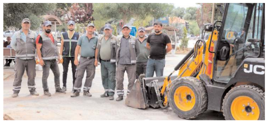
Çorum Belediyesi Park ve Bahçeler Müdürlüğü'ne bağlı bir ekip Afşin'e gitti.