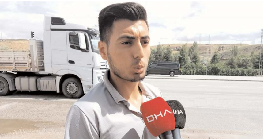
Kazanın tanıkları olay anını anlattı.

Ankara'da sürücüsünün kayganlaşan yol sebebiyle kontrolünü kaybettiği şehirlerarası yolcu otobüsü önce bir araca, ardından da otobüs durağına çarptı. 4 kişinin yaralandığı kazada sürücüsünün kırmızı ışık ihlalinde bulunduğu iddia edildi.