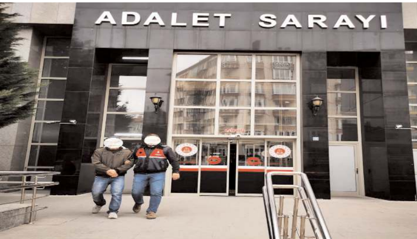
Hakkında yakalama kararı bulunan 3 FETÖ/PDY, 2 PKK/KCK ve 2 TKP/ML olmak üzere toplam 7 şahıs yakalandı.