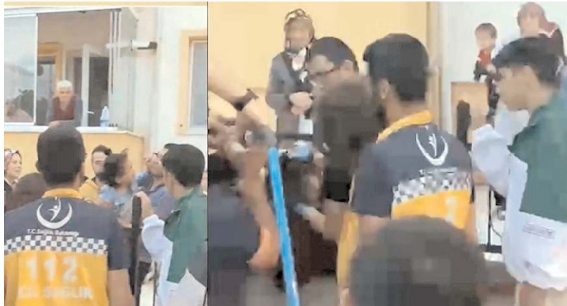
Olay İbrahim Çayırı 4.Sokak'ta bir evin bahçesinde meydana geldi.