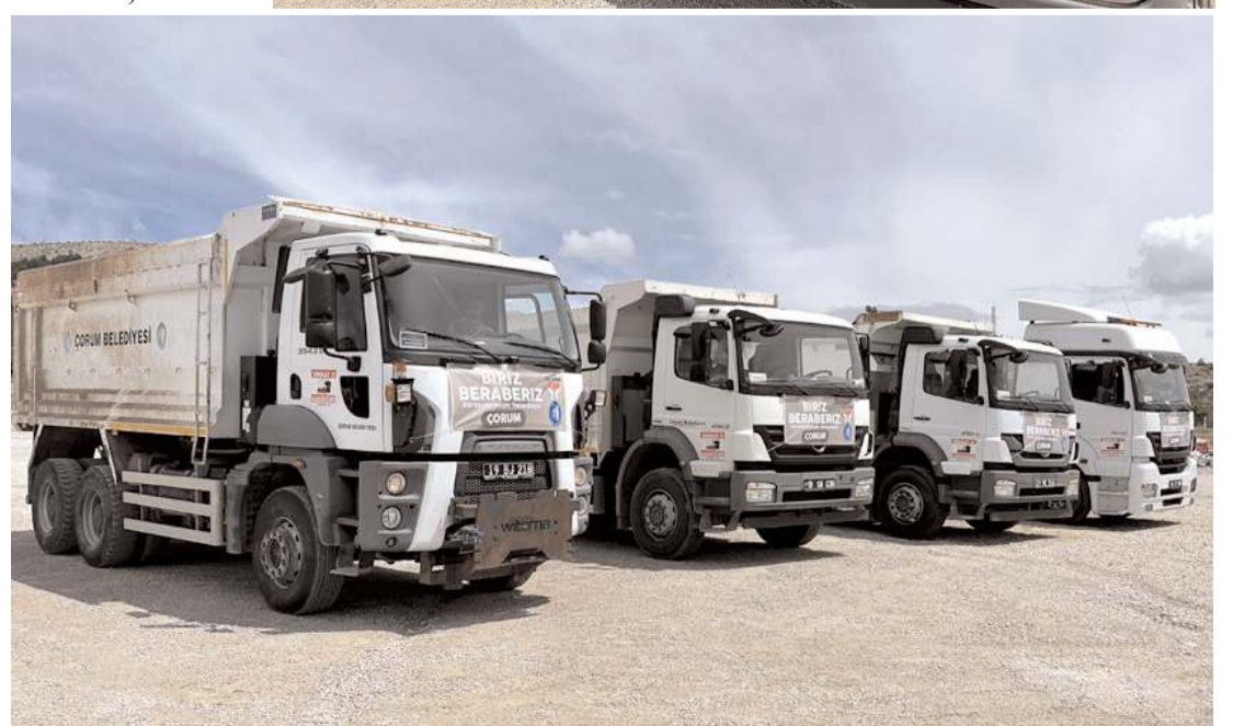
Araçlar Bartın'da selin izlerini silmek için çalışacak.