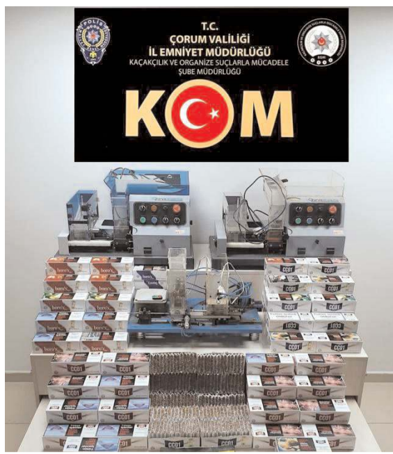
Operasyonda 38 bin adet makaron sigara ele geçirildi.