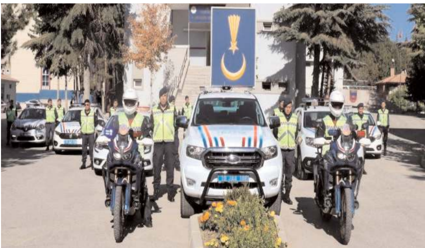
Toplam 1.538 şahısın hakkında adli soruşturma başlatıldı.

Jandarma 1.028 olayın %96'sını aydınlattı