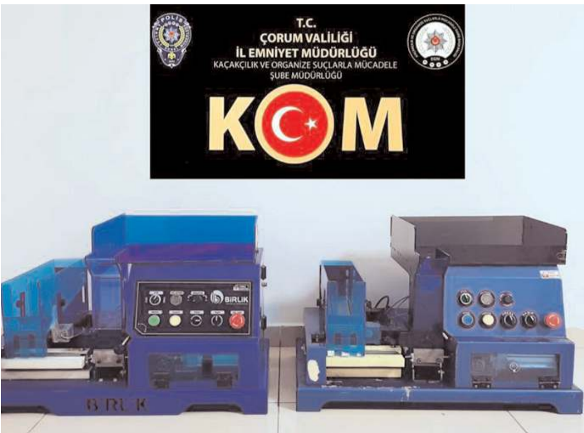
5 adet sigara doldurma makinesine el konuldu.

Emniyet Müdürlüğünden yapılan açıklamada, "Halkımızın sağlığını tehdit eden kaçakçılığın her tür-lüsünün men ve takibine yönelik çalışmalarımız kararlılıkla devam edecektir" ifadelerine yer verildi. (İHA)