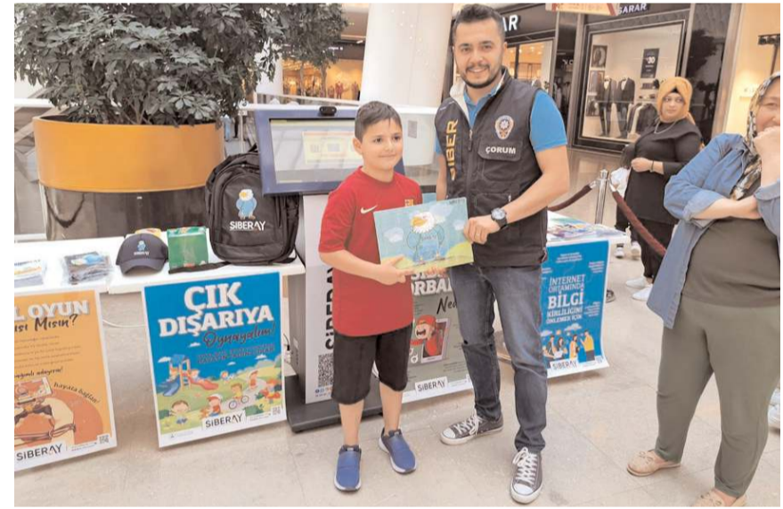
KİOKS cihazı ile bilgi yarışması düzenlendi.