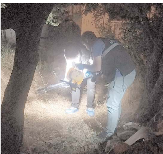
Operasyonda 5 pompalı tüfek ele geçirildi.