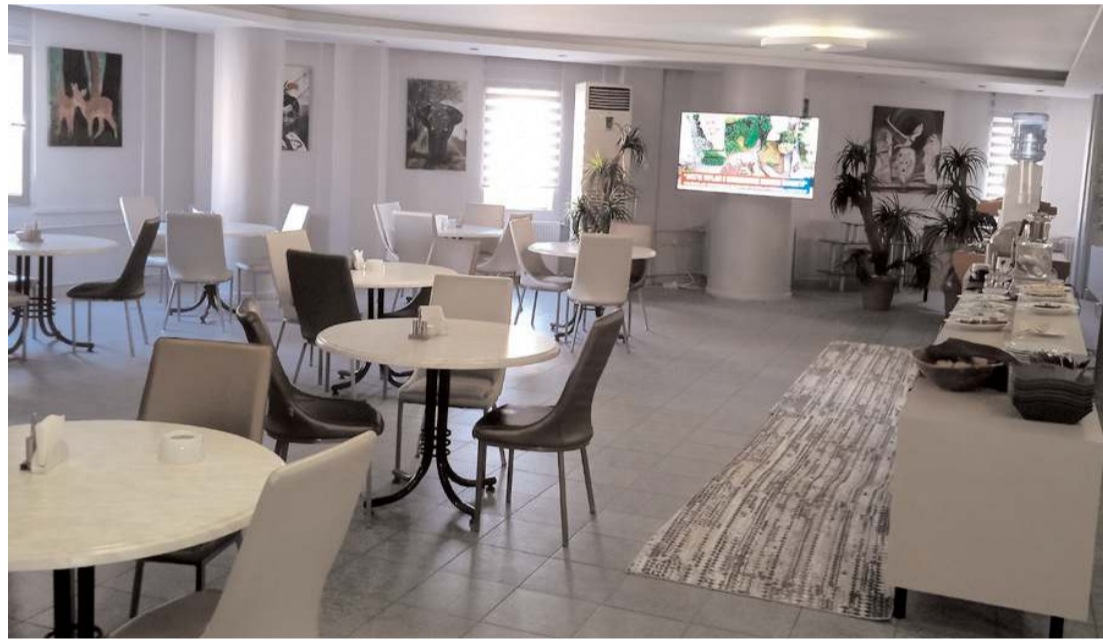
Pithana Otel, oyun ve bilardo salonunu Çorum halkının hizmetine açtı.

sıyla hizmet verdiklerini belirten Yurttutar kardeşler, "Sıcak-soğuk içecekler, hamburger, tost, cips, kek gibi yiyecek ve içeceklerin bulunduğu oyun salonunuza tüm Çorum halkını bekliyoruz. Ayrıca otelimizde doğum günü ve özel günlerde rahatça hizmet alabileceğiniz organizasyon hizmetimiz devam etmekte. Otelimizin kendine ait otoparkı olup, park sorunu bulunmamaktadır. Bilgi ve rezervasyon için 0 364 224 36 21- 0 364 224 43 36 numaralarını arayabilirsiniz" ifadelerini kullandılar.