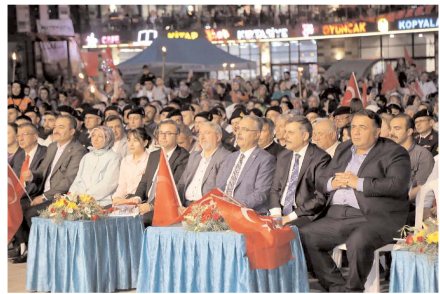
Programa protokol üyeleri ile çok sayıda vatandaş katıldı.

Kadeş Meydanı'nda düzenlenen 15 Temmuz Demokrasi ve Milli Birlik Günü etkinlikleri demokrasi nöbeti ile sona erdi. Kadeş Meydanı'nda bazı vatandaşlar sabah namazı kılarak demokrasi nöbeti tuttu. Vatandaşlara Çorum Belediyesi tarafından sıcak çorba ikram edildi.