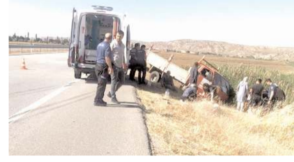
Olay, Delice ilçesine bağlı Evliyalı köyünde meydana geldi.