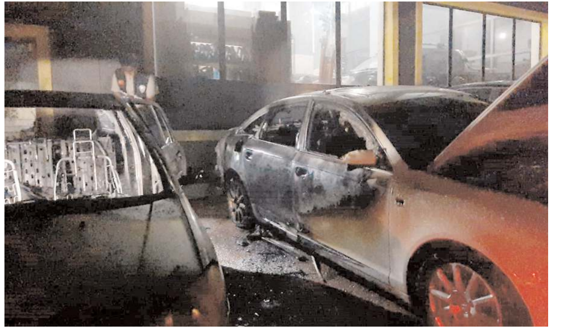
Olay Çorum Sanayi Sitesi'nde faaliyet gösteren oto tamirhanesine meydana geldi.