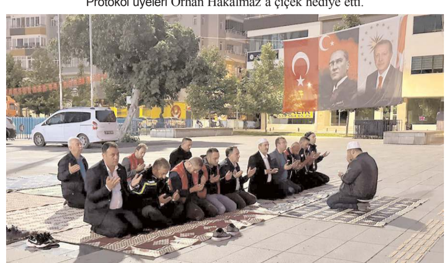
Kadeş Barış Meydanı'nda bazı vatandaşlar sabah namazı kılarak demokrasi nöbeti tuttu.