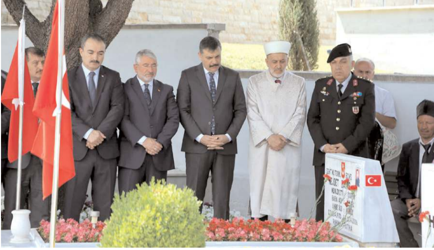
Protokol üyeleri 15 Temmuz'un yıl dönümünde Şehitliği ziyaret etti.