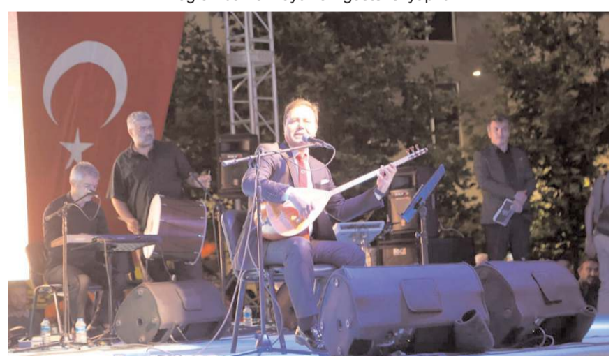
Programın sonunda ünlü sanatçı Orhan Hakalmaz sahne aldı.