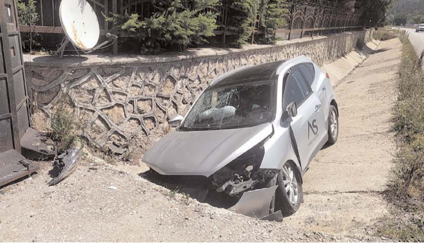
Kaza, Çorum- Samsun karayolu üzerinde meydana geldi.

Kaza ile ilgili başlatılan soruşturma sürüyor. (İHA)