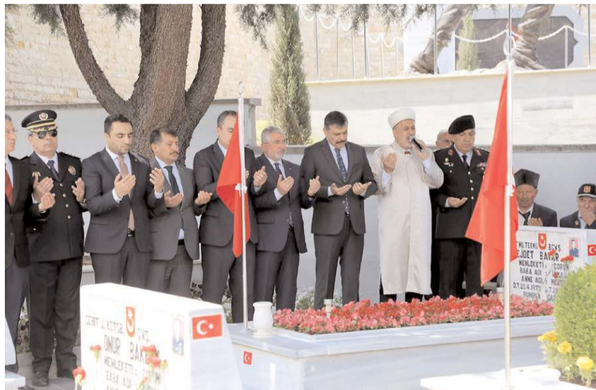
Çorum Şehitliği'nde yapılan törende Kur'an-ı Kerim okunup dua edildi.

■ 15 Temmuz Demokrasi ve Milli Birlik Günü etkinlikleri kapsamında Çorum Şehitliği'nde tören düzenlendi. Şehitlikte yapılan törende Kur'an-ı Kerim okunup dua edildi.