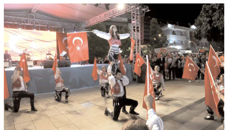
Programda halk oyunları gösterisi yapıldı.