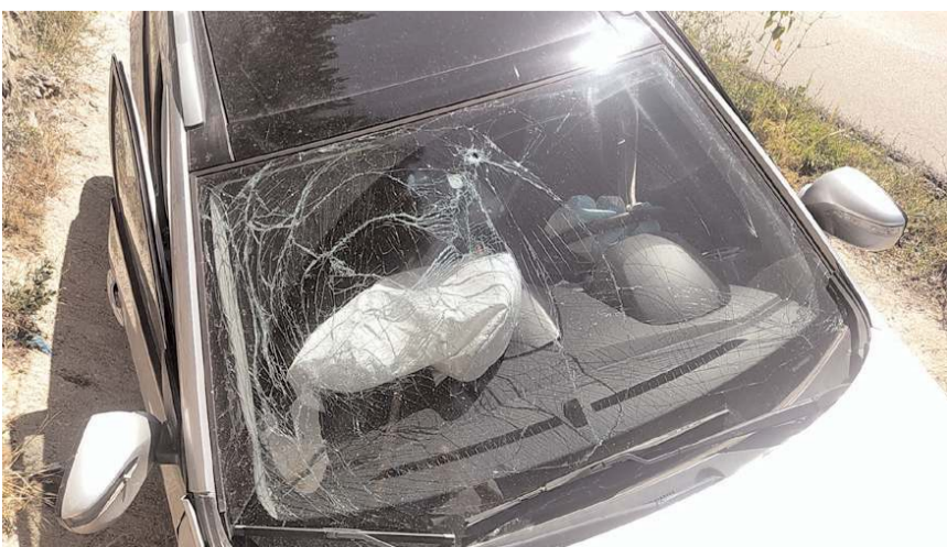
Kazada araçta maddi hasar meydana geldi.