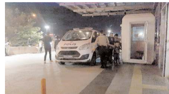
Çeşitli suçlara karıştığı tespit edilen 14 yabancı uyruklu polis ekiplerince gözaltına alındı.