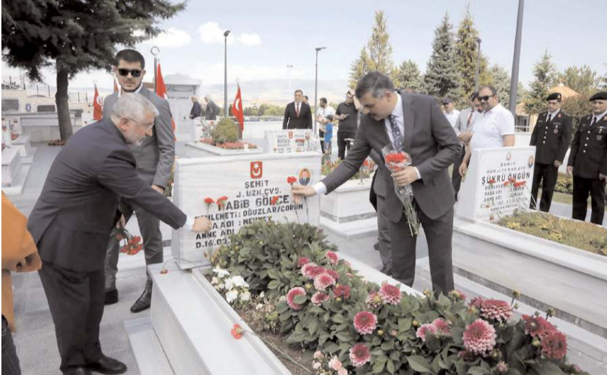
Protokol üyeleri şehitlerin kabirlerine çiçek bıraktı.