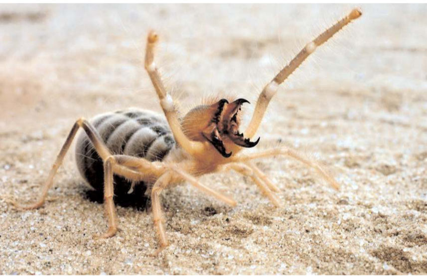
'Sarıkız' türünün zehirli değil, faydalı ve korunması gereken bir tür olduğu belirtildi.