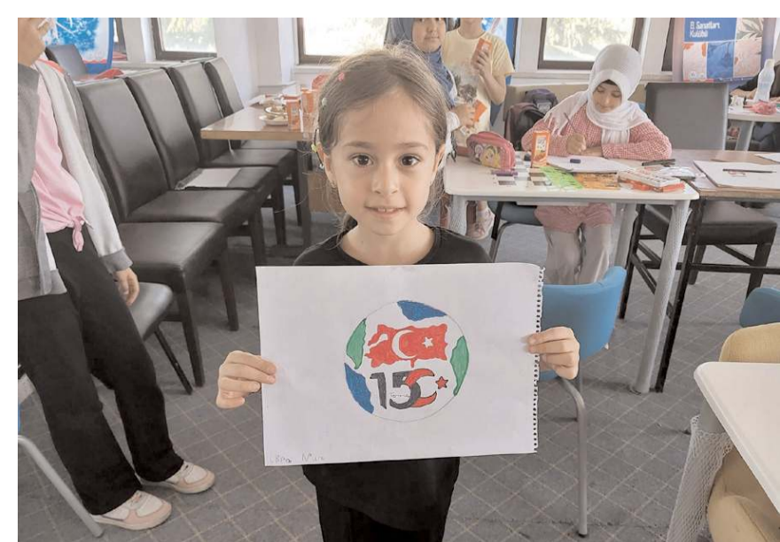
Öğrenciler, 15 Temmuz Demokrasi ve Milli Birlik Günü'nü anlatan resimler çizdiler.

Öğrencilerin çizdiği resimler, ilçedeki Mahmut Atalay Spor Salonu'nun pencerelerine asıldı. (AA)