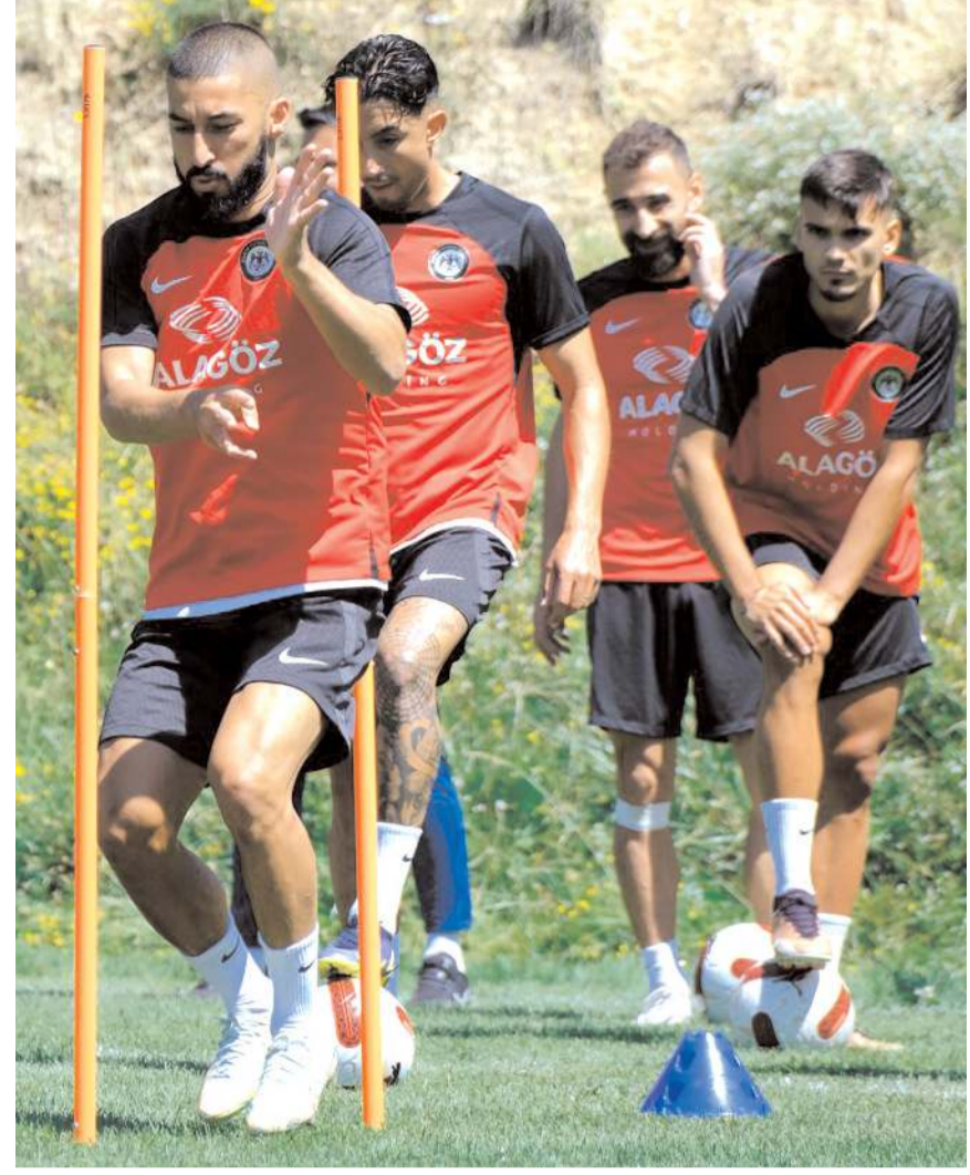
Ankaragücü ile saat 18'de karşılaştı. Kırmızı Siyahlı takım bugün sabah akşam yapacağı çift antrenmanla yeni sezon hazırlıklarını sürdürecektir.

Çorum FK dün akşam lig öncesindeki ilk hazırlık maçında Bolu Termal Otel sahasında