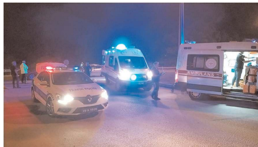
Yaralılar hastanede tedavi altına alındı.