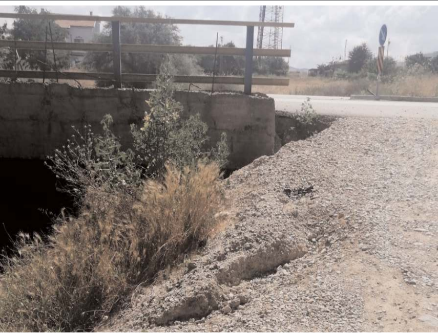
Sel suları nedeniyle ana yoldan bağlara dönüş kısmında bozulma meydana geldi.