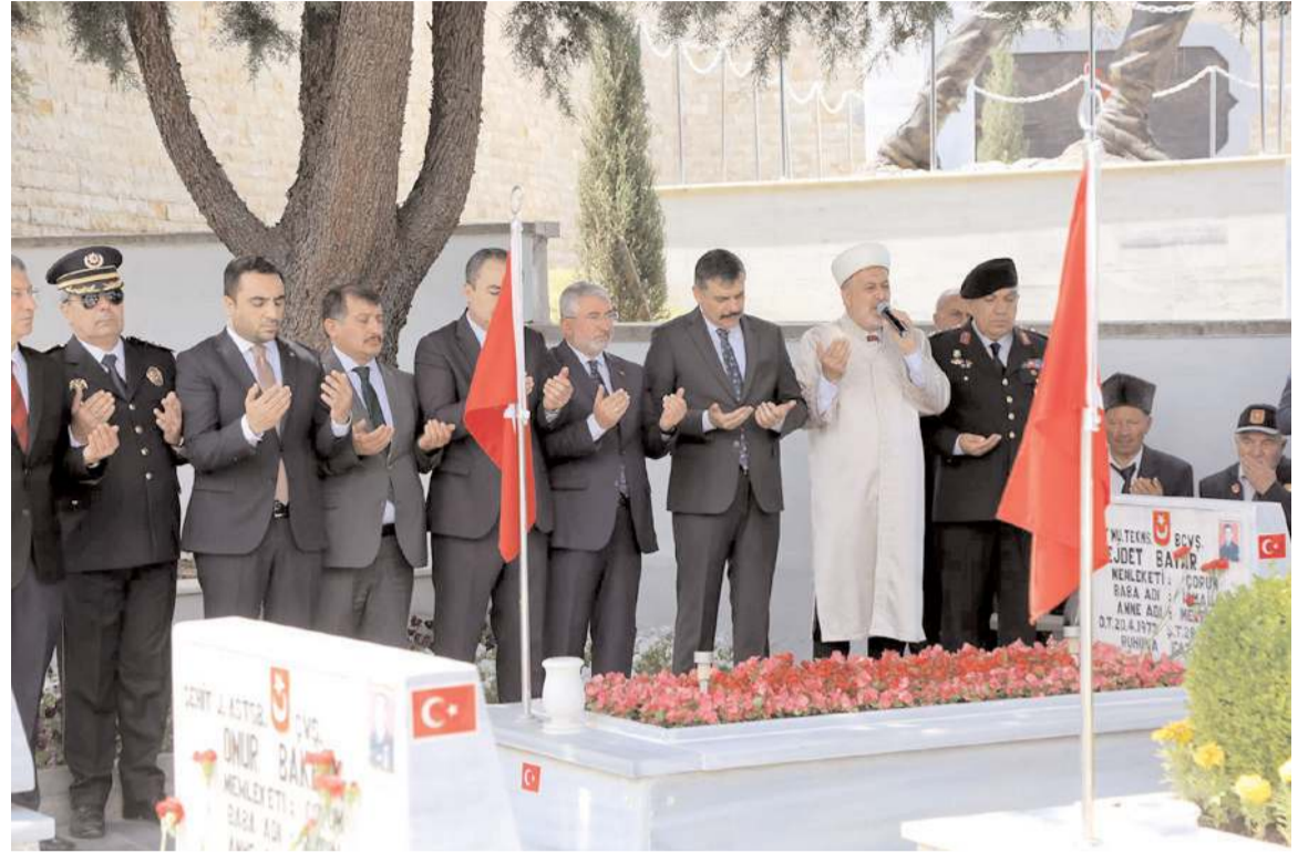
Çorum Şehitliği'nde yapılan törende Kur'an-ı Kerim okunup dua edildi.