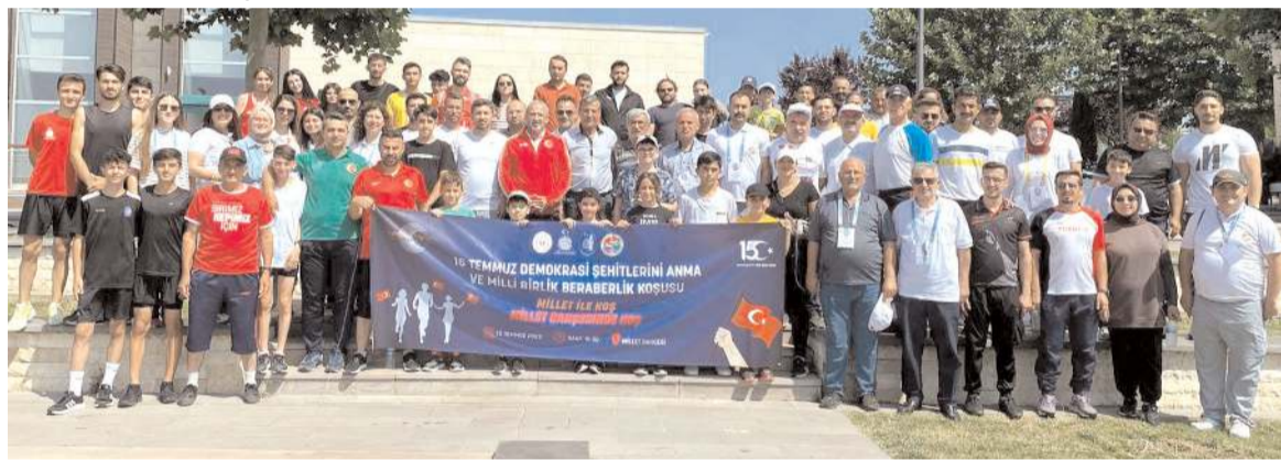
Millet Bahçesinde düzenlenen 'Millet ile Koş, Millet Bahçesinde koş' sloganı ile yapılan 15 Temmuz Demokrasi Şehitleri koşusuna katılanlar toplu halde görülüyor