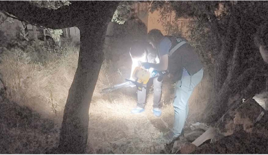
Operasyonda 5 pompalı tüfek ele geçirildi.

Edinilen bilgilere göre, Gülabibey Mahallesi Güzelyurt 25. Sokak üzerinde bir düğün töreninde silahla havaya ateş açıldı. Vatandaşların şikayeti üzerine olay yerine çok sayıda yunus ekibi sevk edildi. Çevrede güvenlik önlemi alan yunus ekipleri düğün evi ve çevresinde arama yaptı. Polis ekiplerinin yaptığı çalışmalar sonucu metruk bir evin bahçesi ve boş arazide 5 adet tüfek ve 2 kutu tüfek fişegi ele geçirildi.