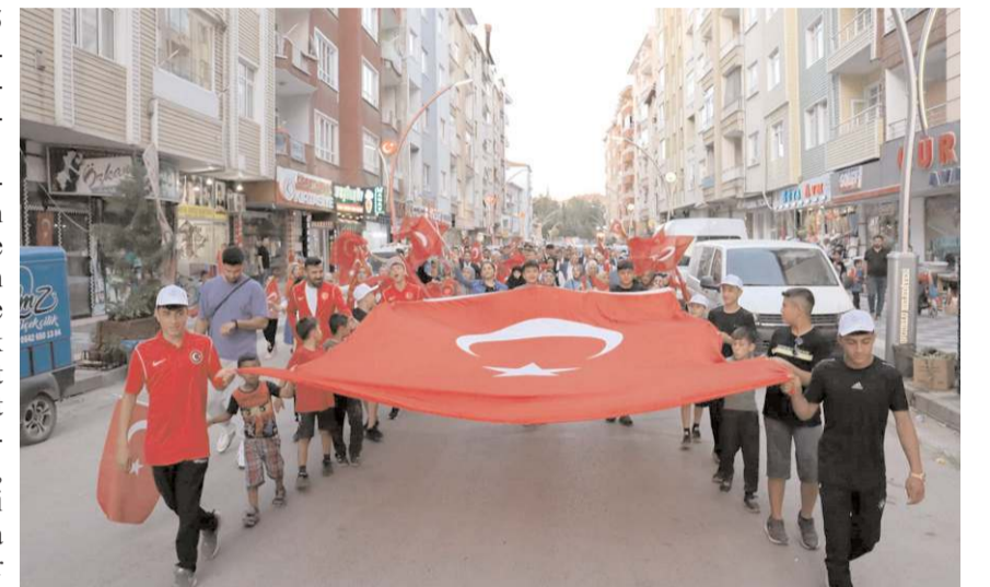
Yürüyüşe ellerinde Türk bayrakları ile çok sayıda vatandaş katıldı.

Yürüyüşe katılanlar, tek birleşiminde Atatürk Meydanı'nda düzenlenen anma programı ile devam etti.