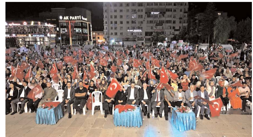
Konserine ilgi yüksek oldu.