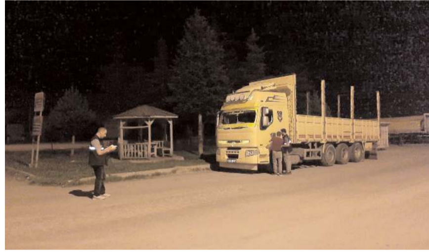
Olay Çorum Sanayi Sitesinde meydana geldi.

Çorum'da park halindeki kamyonun 2 bin lira çalındığı iddia edildi.