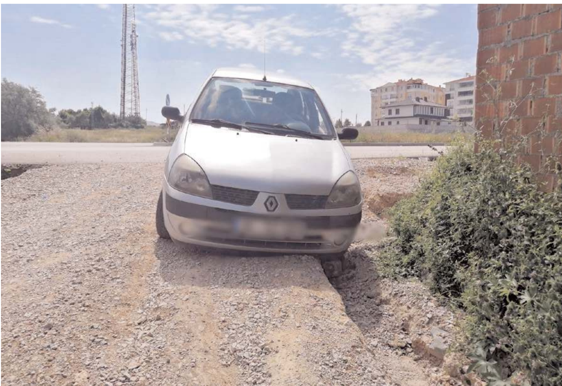
Yolun bozuması nedeniyle araçlar dereye uçma tehlikesi yaşıyor.