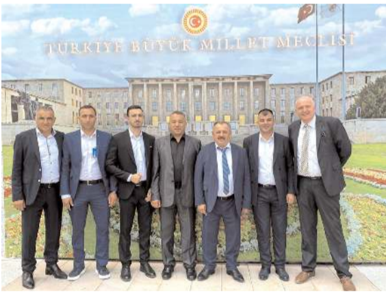
Zanaatkarlar Yapı Kooperatifi heyeti, Ankara'da Çorumlu Milletvekilleri ile bürokratlardan ziyaret etti.