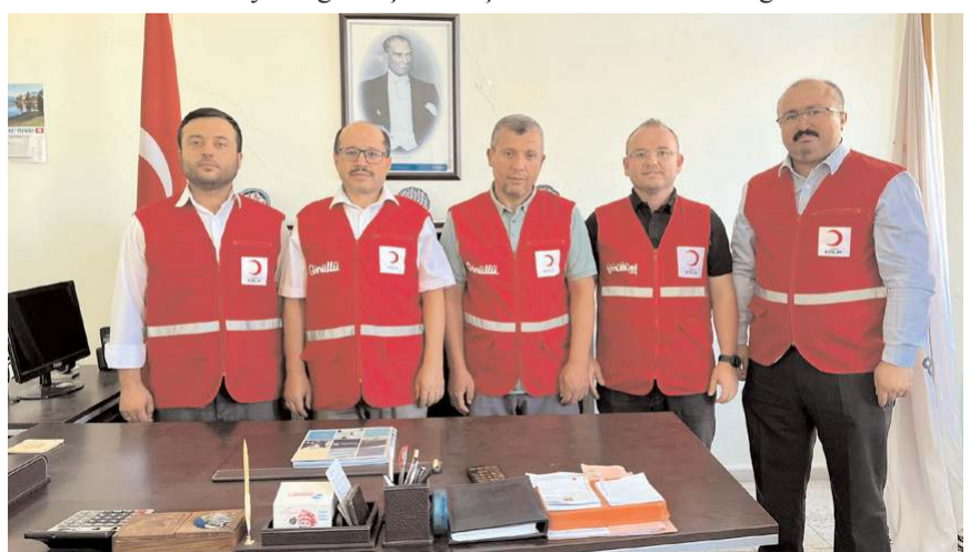
Kızılay Sungurlu Şubesi'nin kurucu yönetim kurulu üyeleri

ile hareket edip mağdurların yanında olacağız inşallah. Tüm kardeşlerimizin dua ve desteklerini bekliyoruz" dedi.