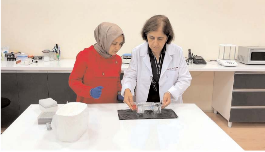
Amasya Üniversitesinden 4 akademisyen projeyi Çorum TEKNOKENT'te yürütüyor.

Çorum KOSGEB İl Müdürlüğü'nün desteğiyle ilk yıl "Probiyotik Instant Toz Çikolatalı İçecek Üretimi