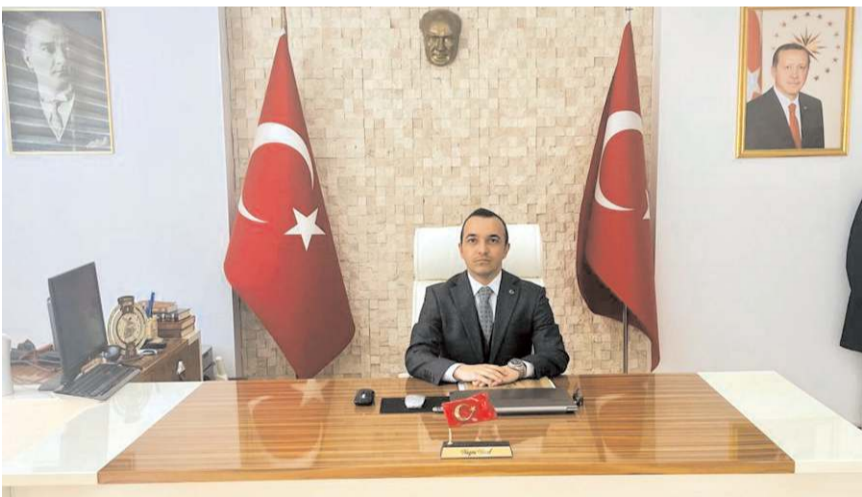
Boğazkale Kaymakamı Nazmi Yücel

görev süresince devletin engin şefkatini göstermeye gayret ettiğini kaydetti.(AA)