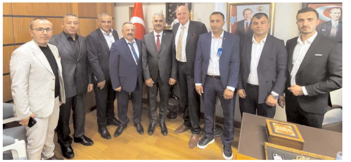
Zanaatkarlar Yapı Kooperatifi heyeti, AK Parti Çorum Milletvekili Yusuf Ahlatcı'yı ziyaret etti.

Derslerin işlenişinde sözel görsel olarak ön hazırlıkların ardından, öğrenciler DALLE-2 uygulamasının metin yoluyla görsel üretme yöntemini kullandı. Metin oluşturma 5 kriter, bir boyama tekniği ve bir de akım isminin kullanılması şartı ile İngilizce cümleler kuruldu. Sonuç olarak yapay zekânın oluşturduğu görsel çalışmalar elde edildi. (Haber Merkezi)