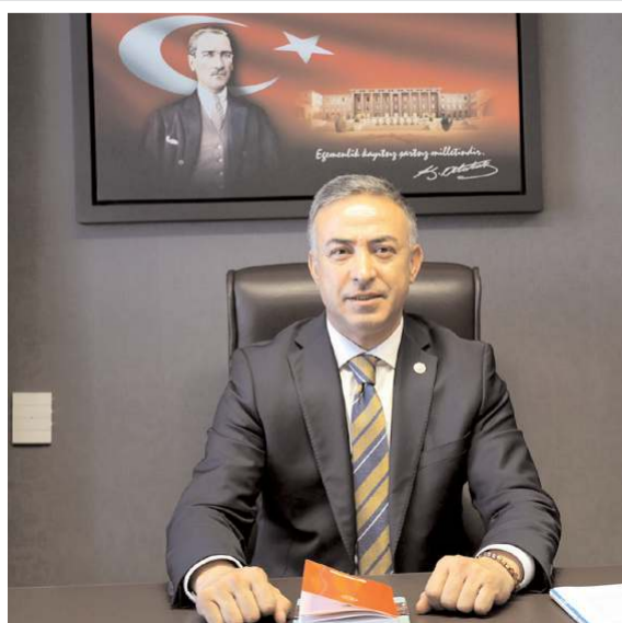
CHP Çorum Milletvekili Mehmet Tahtasız

15 Temmuz darbe girişiminin 7'nci yıldönümünde demokrasimize ve milletimize kasteden te-