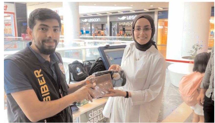
Yarışmayı kazananlara çeşitli hediyeler verildi.