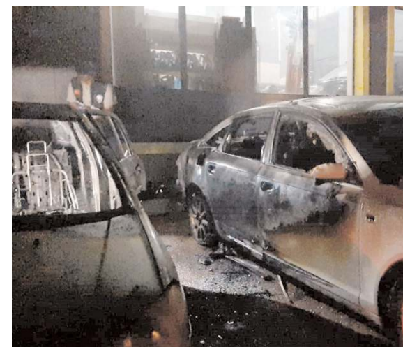
Olay Çorum Sanayi Sitesi'nde faaliyet gösteren oto tamirhanesine meydana geldi.

■ Çorum'da çeşitli suçlara karıştığı tespit edilen 14 yabancı uyruklu şahıs polis ekiplerince gözaltına alındı. * HABERİ 5'TE