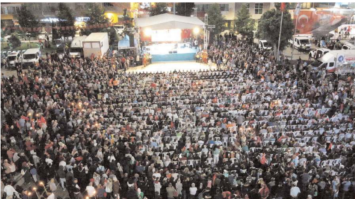
Kadeş Barış Meydanı'nda yapılan etkinliğe katılım yüksek oldu.