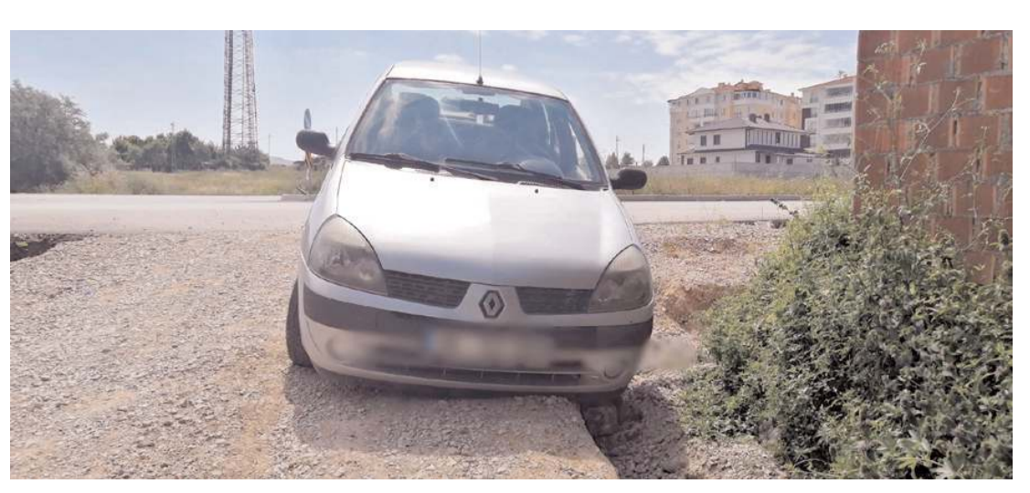
Yolun bozuması nedeniyle araçlar dereye uçma tehlikesi yaşıyor.