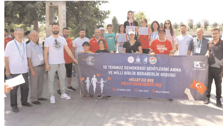
Koşu sonunda katılanlara madalya ve katılım belgeleri verildi