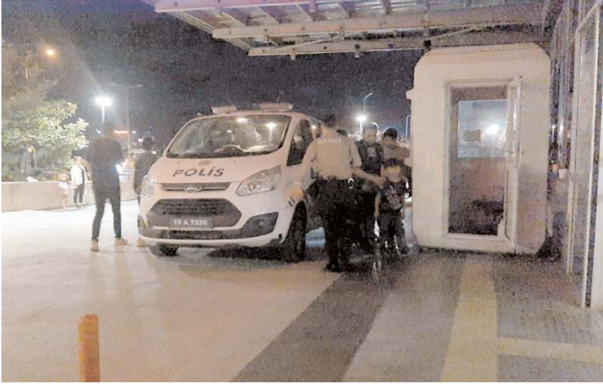
Çeşitli suçlara karıştığı tespit edilen 14 yabancı uyruklu polis ekiplerince gözaltına alındı.

Çorum'da çeşitli suçlara karıştığı tespit edilen 14 yabancı uyruklu şahıs polis ekiplerince gözaltına alındı.