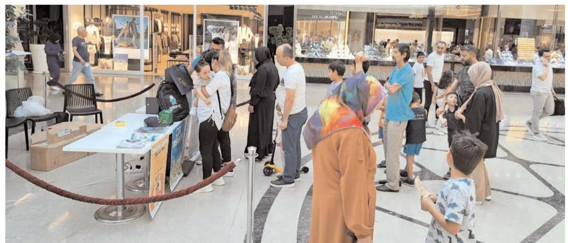
SİBERAY Projesi kapsamında AHL Park AVM'de stant açıldı.