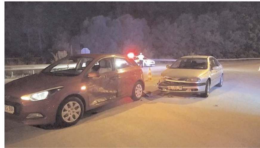
Kaza, Samsun-Çorum karayolunda meydana geldi.

Kaza ile ilgili başlatılan soruşturma sürüyor. (İHA)