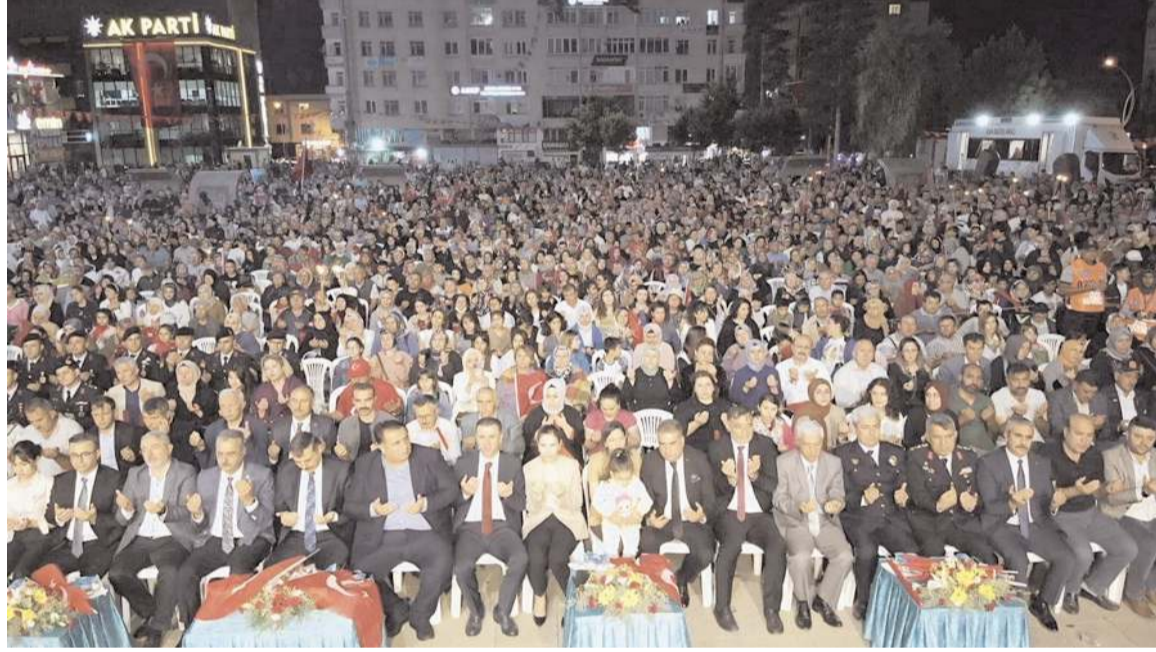
15 Temmuz Demokrasi ve Milli Birlik Günü nedeniyle Kadeş Meydanı'nda etkinlik yapıldı.