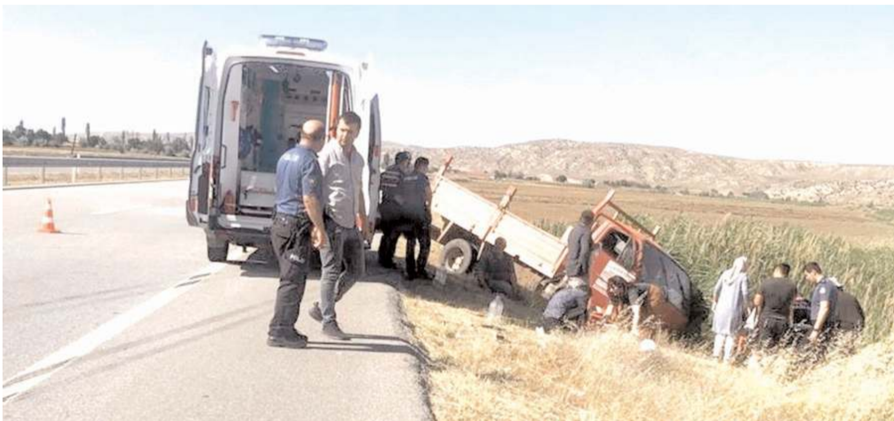
Olay, Delice ilçesine bağlı Evliyalı köyünde meydana geldi.

Çare topyekün bir ahlak ve dindarlaşma seferberliğidir. Toplumda adaletsiz ve ahlaksız olanlara karşı topyekün olumsuz tavrıdır. Bu tavır onları temel insan haklarından mahrum bırakmak değildir, itibar bakımından herkesi hak ettiği yerde tutmaktır. Aksine davranış zulümdür, kötülüğe prim vermektir, hadisteki ifade ile kıyamettir.