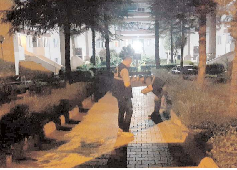
Olay Lozanevler Sitesi'nde meydana geldi.

Çorum'da bir kişiyi darbeden kişiler, site bahçesinde silahla havaya ateş ederek olay yerinden uzaklaştı.