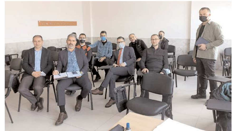
Okul kalite yönetim ekibi belgeyi almak için uzun süre çalıştı.