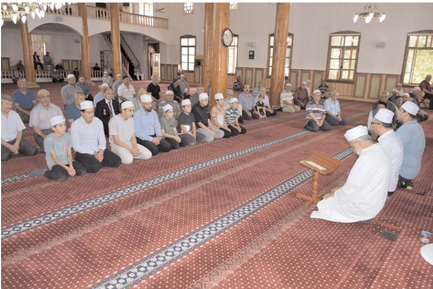
İskilip Ulu Cami'nde şehitler için mevlidi şerif okutuldu.