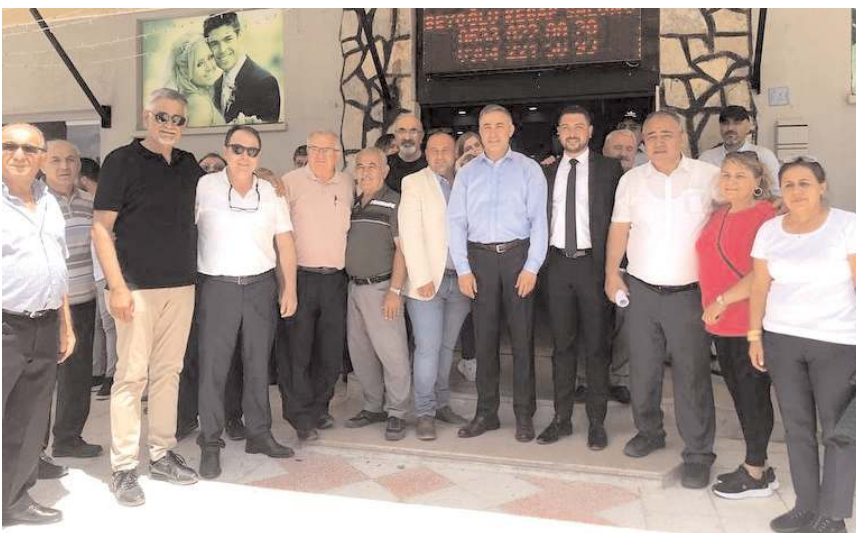
Yavruturna ve Kale Mahalleri delege seçimlerinde "sarı liste" kazandı.

delege seçimi yapıldı. 673 parti üyesinin oy kullandığı seçimde sarı liste 383, mavi lis-