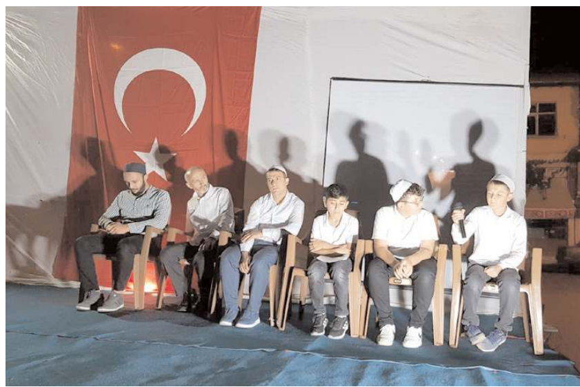
Hafızlar şehitler için Kur'an-ı Kerim okudular.