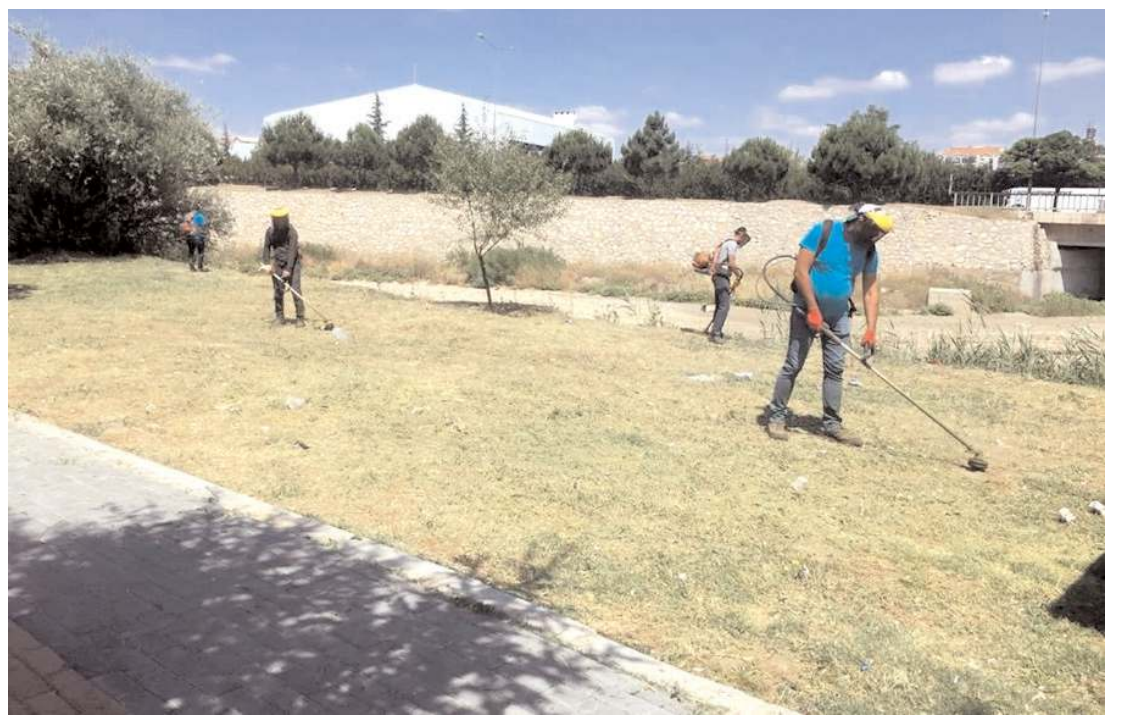
Sungurlu Belediyesi Temizlik İşleri Müdürlüğü ekipleri, ilçe genelinde ot temizliği yaptı.