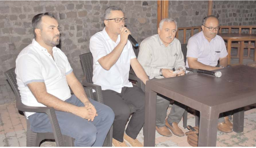
Programda Kur'anı Kerim okunup dua edildi.