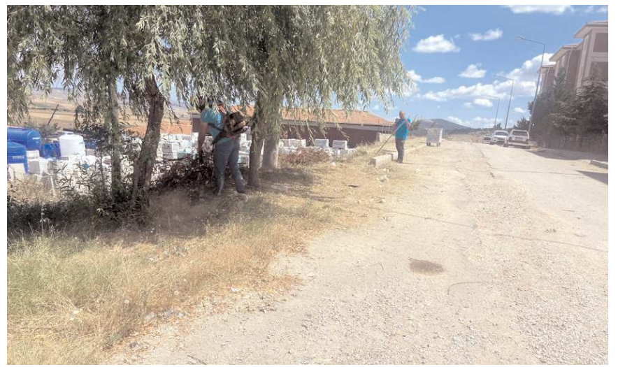
Bazı mahallelerde yabancı otlar biçilerek temizleme çalışmaları tamamlandı.

Sungurlu Belediye Başkanı Abdulkadir Şahiner, Boş arsa ve kaldırımlarda büyüyen otların kuruma sonrası yangınlara neden olduğunu belirterek, bunu ortadan kaldırmak ve bu alanların temizlenmesi amacıyla çalışmaların aralıksız devam ettiğini söyledi.(İHA)