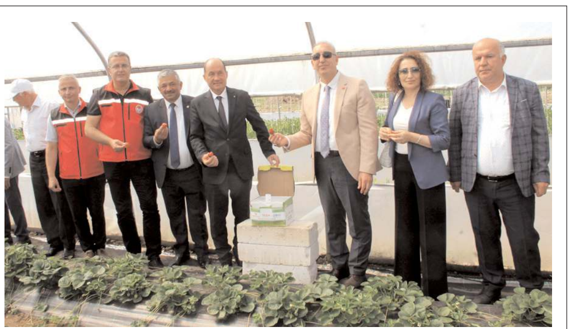
Proje Doğu Karadeniz Projesi (DOKAP) tarafından destekleniyor.