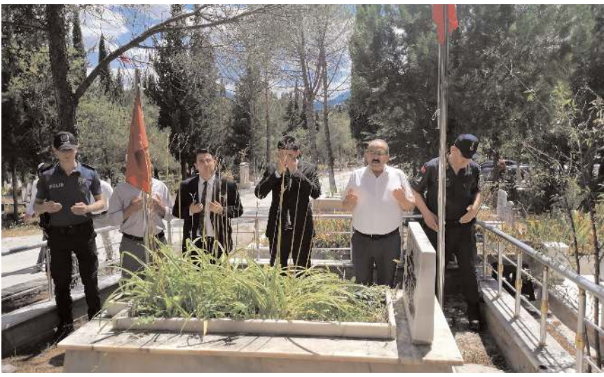
İlçe protokolü şehit kabirlerini ziyaret ederek dua etti.

Kargı'da 15 Temmuz Demokrasi ve Milli Birlik Günü dolayısıyla Kargı Şehitliği ziyaret edildi.