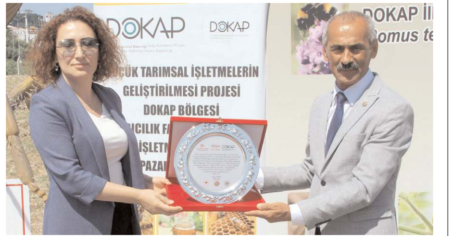
Enstitü tarafından projeye destek verenlere plaket ve teşekkür belgesi verildi.