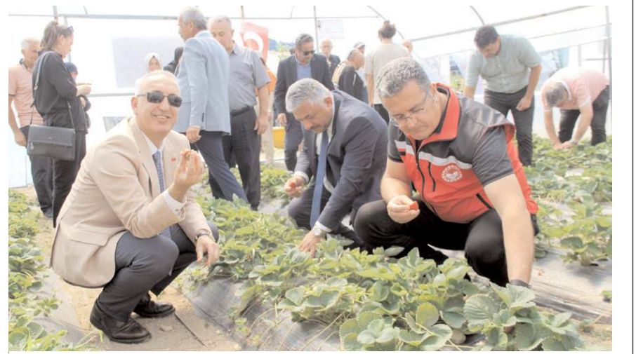
Projenin tanıtım toplantısı, ziraat odasının 7'den 77'ye Tarım Eğitim ve Üretim Kampüsü'nde düzenlendi.

Cınbrtoğlu, Ordu ilinden başlamak üzere DOKAP'a bağlı 11 ildeki Samsun, Giresun, Çorum,