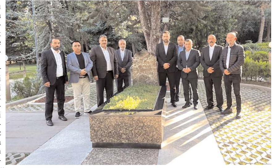
Önceki dönem MHP yöneticileri Başbuğ Alparslan Türkeş'in kabrini ziyaret ederek dua ettiler.