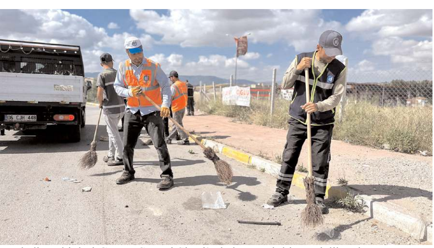
Belediye ekipleri Çorum Sanayi Sitesi'nde hummalı bir temizlik çalışması yaptı.

Bu arada Çorum Belediyesi'nin Çorum Sanayi Sitesi'nde devam eden yol çalışmalarını da esnafı memnun etti. Necmettin Uzun, Sanayi Sitesi 17. Cadde ve Mimar Sinan 9. Cadde'deki 1.800 metre uzunluğundaki yolda çalışmalarını sürdüren belediye ekiplerine kolaylık dilerken, bu çalışmalarından dolayı da Belediye Başkanı Dr. Halil İbrahim Aşgın'a ayrıca teşekkür etti. (Haber Merkezi)