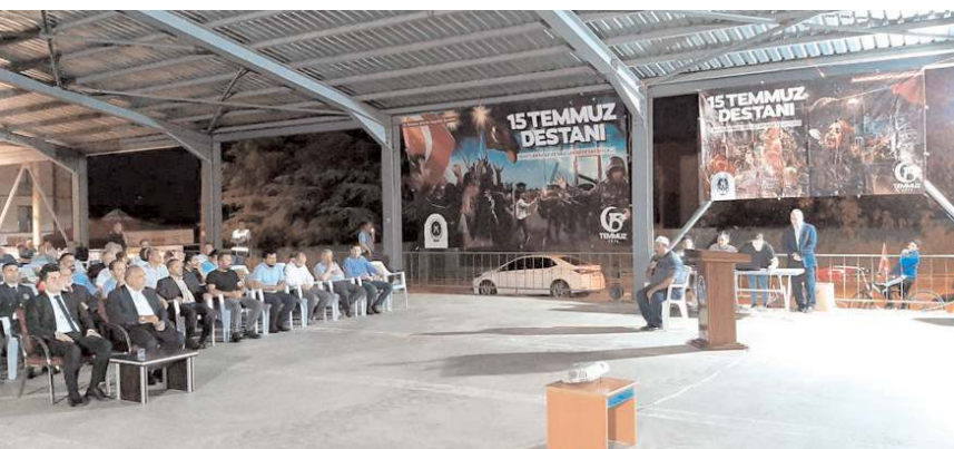
Kapalı Pazar Alanı'nda yapılan tören Kur'an-ı Kerim tilavet ile başladı.