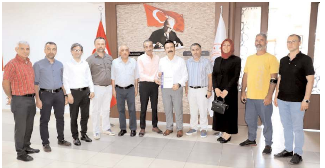
Mimar Sinan Anadolu Lisesi ISO 9001 Kalite Yönetim Sistemi belgesini almaya hakkazandı.