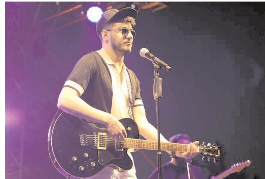
Semicenk konseri, 24 Temmuz 2023 Pazartesi günü yapılacak.

Semicenk, ilk olarak 'Yüzü Tanıdık Değil' ve 'Kalbim Usandı' gibi parçaları çıkardı. 2021 yılında Aralık ayında çıkardığı 'Düşer Aklıma' isimli