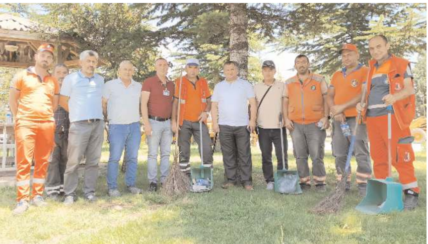
Oda Başkanı Necmettin Uzun, belediye personeline teşekkür etti.