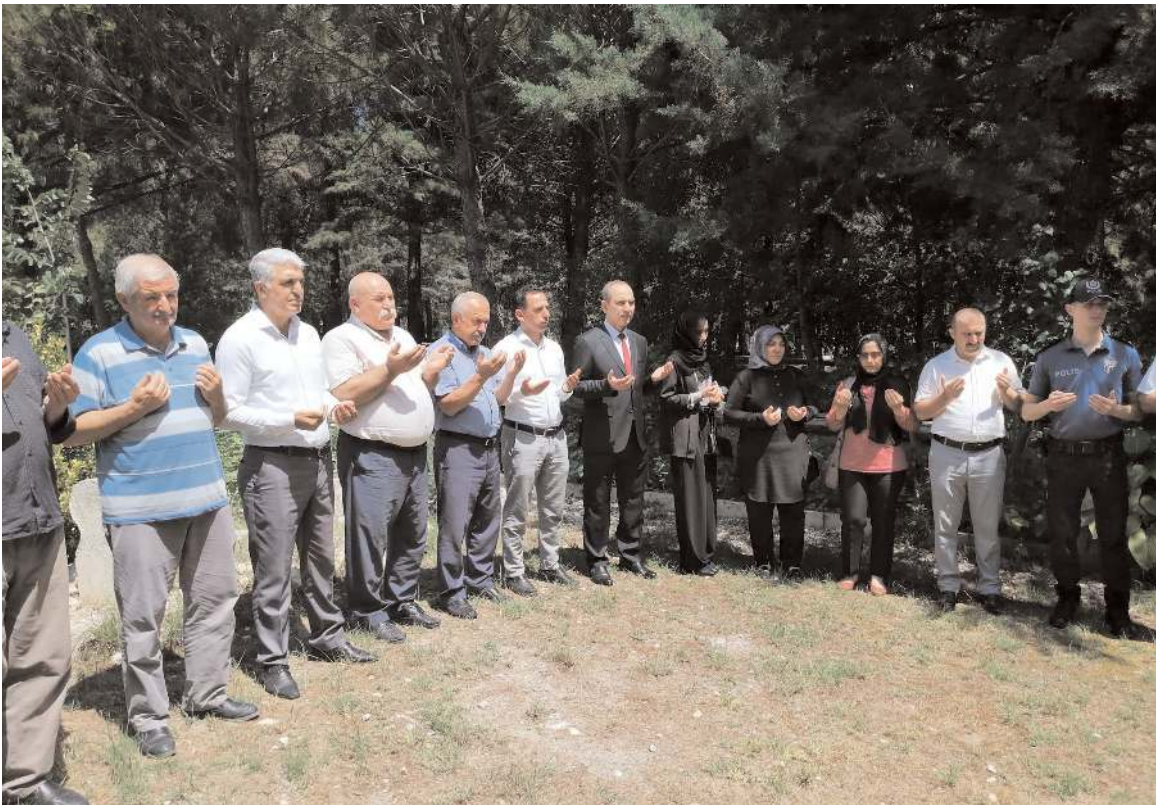
Programda şehitler için Kur'an-ı Kerim okunup dua edildi.

Ziyaretin ardından şehitler için mevlit okundu.