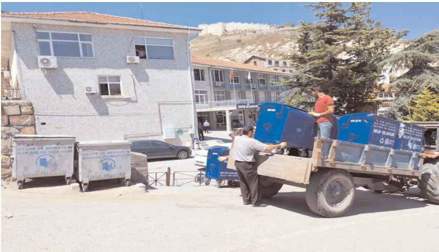
İskilip Belediyesi eskiyen çöp konteynerlerini yeniliyor.

Sülük, "Belediyemiz Zabıta Müdürlüğü Temizlik işleri ekipleri halk sağlığını koruması, sinek, kötü koku ve görüntü kirliliğini önlemek amacıyla cadde ve sokaklardaki çöp konteynerleri köpük ve basınçlı su ile yıkayıp temizledi. Kullanılmayacak durumda olan çöp konteynerleri yenisi ile değiştirildi. Yaz mevsimi boyunca çöp konteynerleri periyodik olarak temizlenmeye devam edecek." ifadelerini kullandı.(AA)