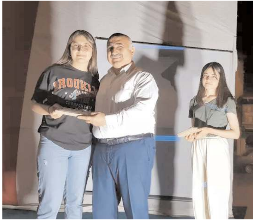
Yarışmalarda derece elde eden öğrencilere ödülleri verildi.