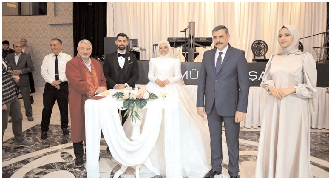
Belediye Başkanı Halil İbrahim Aşgın'ın kıydığı nikaha Vali Mustafa Çiftçi'de katıldı.