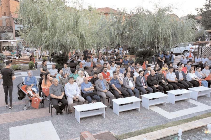
Program Belediye Parkı'nda yapıldı.