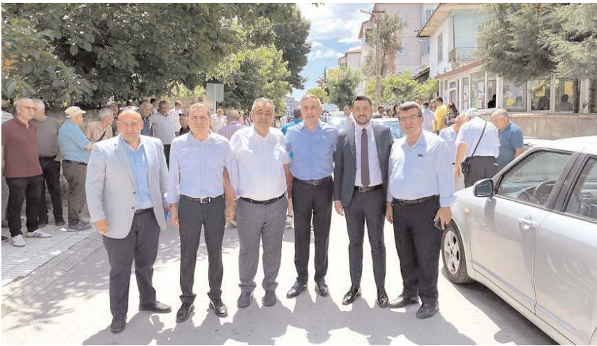
Haftasonu Yavruturna ve Kale Mahallerinde delege seçimleri yapıldı.