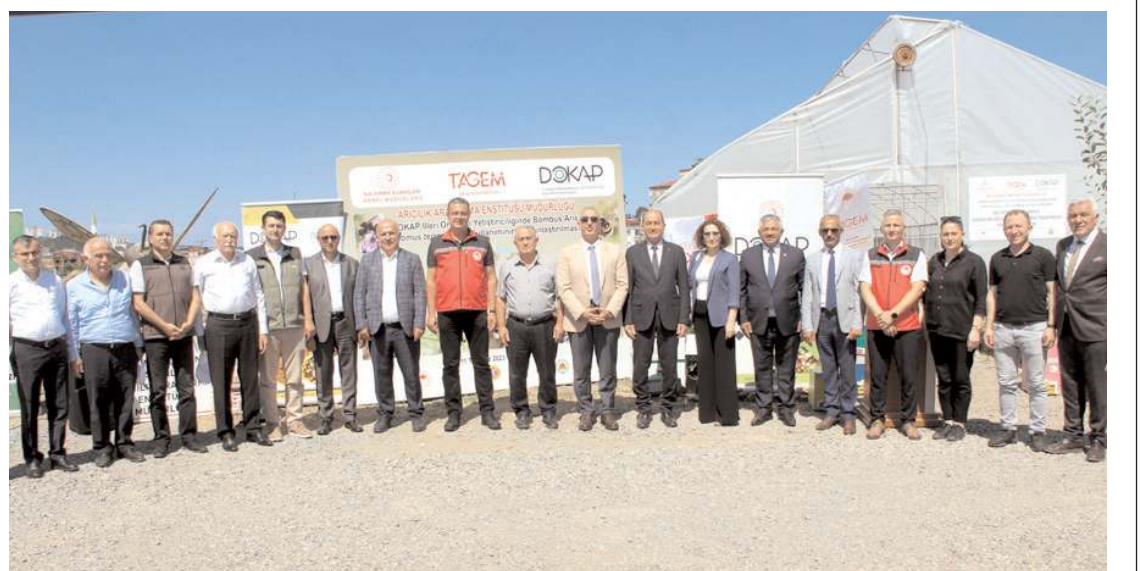
Tören ardından toplu hatıra fotoğrafı çekildi.

Enstitü tarafından projeye destek verenlere plaket ve teşekkür belgesinin verildiği programda, kampüs alanındaki seralar gezilerek bombus arısının kullanımı ile artan verim ve kalite incelendi.(AA)