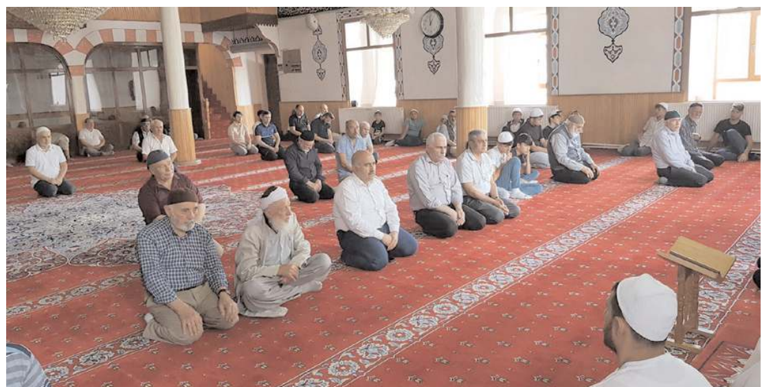
Şehit Ömer Halisdemir Camiinde Mevlid-i Şerif okutuldu.

Bayat 15 Temmuz Demokrasi ve Milli Birlik Günü'nde şehitler düzenlenen törenlerle anıldı.