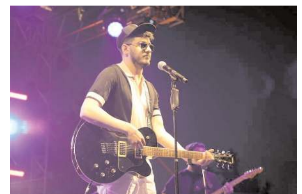
Semiceken konseri, 24 Temmuz 2023 Pazartesi günü yapılacak.