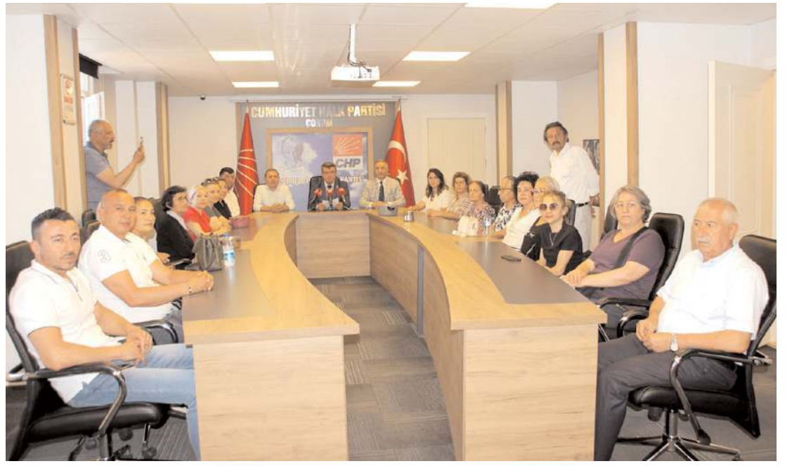
CHP'de gerçekleştirilen basın toplantısında zamlar, hayata pahalılığı ve yüksek enflasyon eleştirildi.