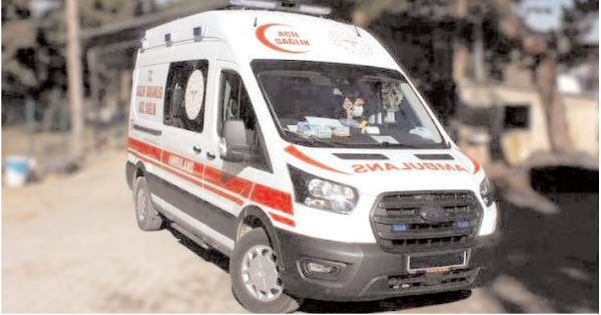
Olay Evcioirtakışla Köyü'nde meydana geldi.

Çorum'da tarlada kalp krizi geçiren kişi hayatını kaybetti.