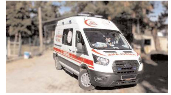
Olay Evcirtakışla Köyü'nde meydana geldi.