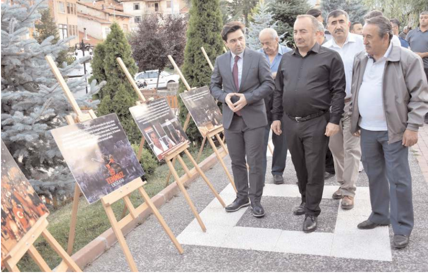
Protokol üyeleri 15 Temmuz gününe ait fotoğrafların sergilendiği fotoğraf sergisini gezdi.