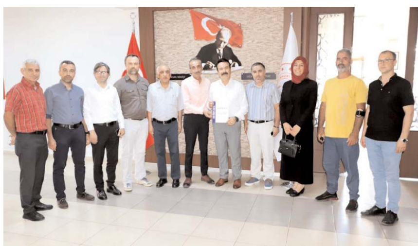
Mimar Sinan Anadolu Lisesi ISO 9001 Kalite Yönetim Sistemi belgesini almaya hakkazandı.