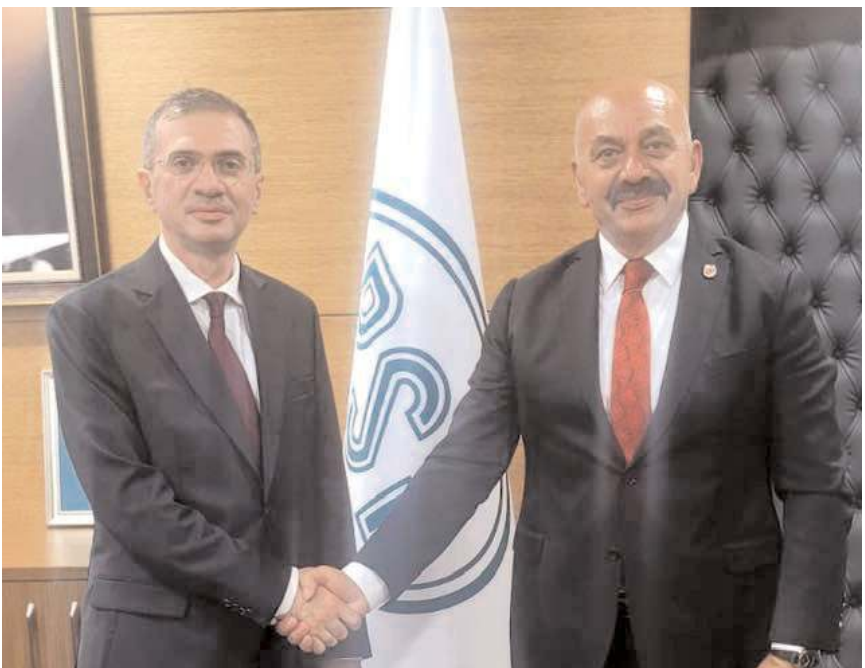
Ortaköy Belediye Başkanı Taner İsbir, ziyaretinde ilçenin taleplerini ilettili.

Ortaköy Belediye Başkanı Taner İsbir, DSİ Genel Müdürlüğü'ne ziyaret ederek ilçenin eksik ve taleplerini ilettili.