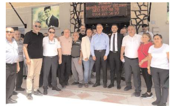
Haftasonu Yavruturna ve Kale Mahallerinde delege seçimleri yapıldı.