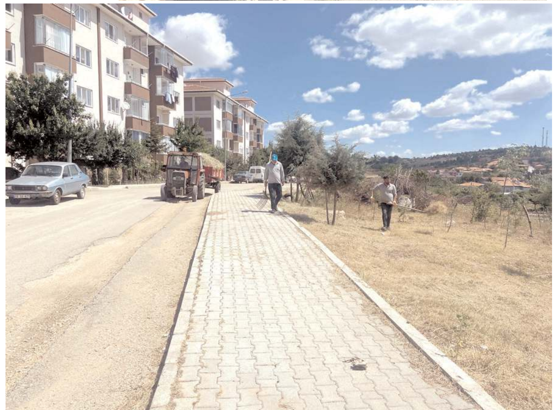
Kaldırımlardaki yabancı otlar temizlendi.