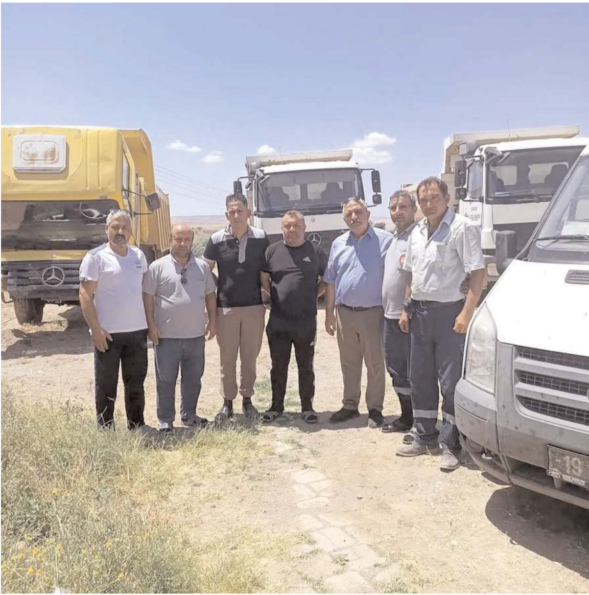
İl Özel İdaresi ekipleri yol yapım çalışmalarına başladı.