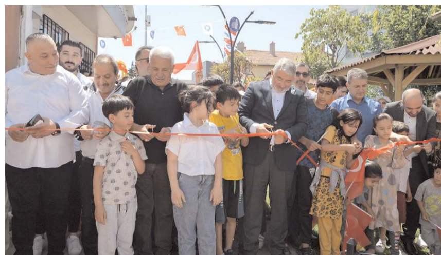
Yapılan konuşmaların ardından açılış kurdelesi kesildi.