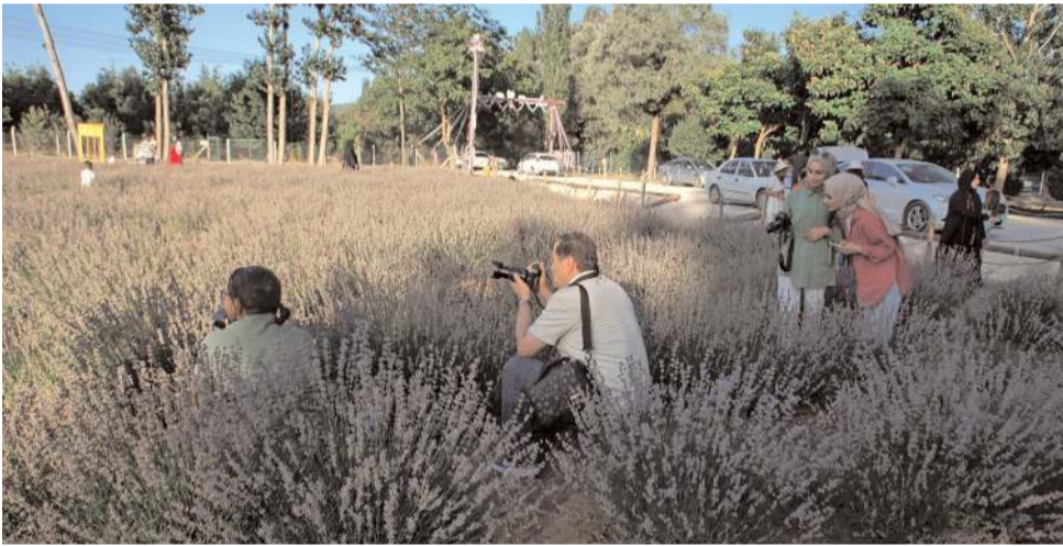
Lavanta bahçesi fotoğraf tutkunlarının yeni uğrak yeri oldu.