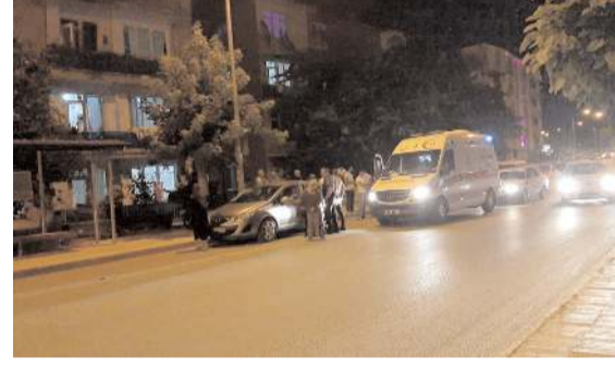
Her iki olayda farklı mahallelerde meydana geldi.