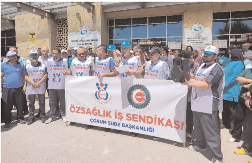
Sağlık işçileri basın toplantısında taleplerini dile getirdiler.

dönük alacağımız paranın bu enflasyonist ortam karşısında pula dönüşme-