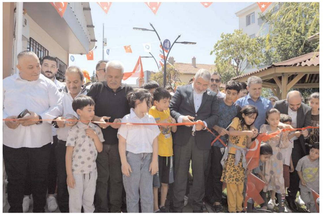
Yapılan konuşmaların ardından açılış kurdelesi kesildi.