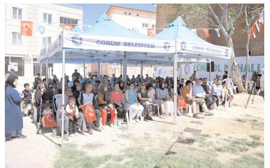
Açılışa mahalle sakinleri katıldı.