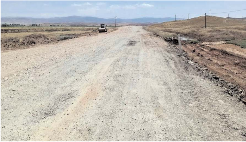
Yol baştan aşağıya yeniden yapılıyor.