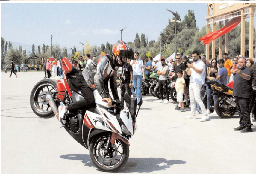
Motosiklet Festivali renkli gösterilere sahne olacak.