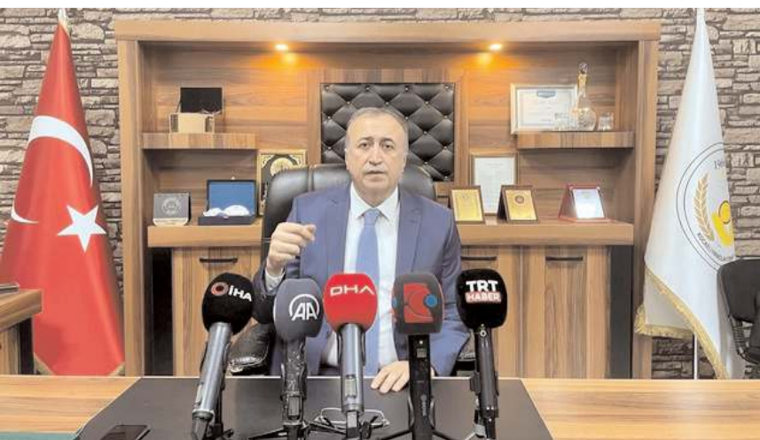
Türkiye Fırıncılar Federasyonu Başkanı Halil İbrahim Balcı

Gelecek haftalarda, Tarım ve Orman Bakanlığı ile Ticaret Bakanlığına, sektörün sorunlarının iletileceğini ve bunların çözülmesi için çalışmaların yapılacağını dile getiren Balcı, bunun hem tüketiciye olumlu yansıyacağını hem de ekmek fiyatlarında pozitif bir etki yapacağını sözlerine ekledi. (AA)