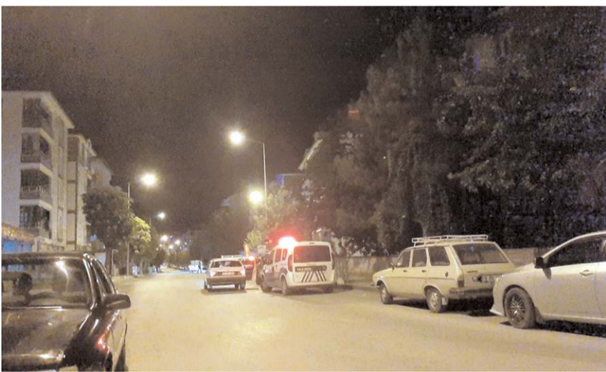
Her iki çocukta hastanede tedavi altına alındı.

Çorum'da evlerinin balkonlarından düşerek yaralanan 2 çocuk, hastaneye kaldırıldı.