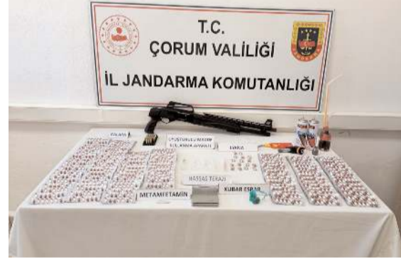
Operasyonda çok miktarda uyuşturucu madde ele geçirildi.