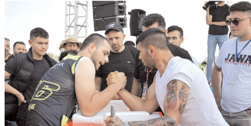
Motosiklet Festivalinde çeşitli yarışmalar yapılacak.