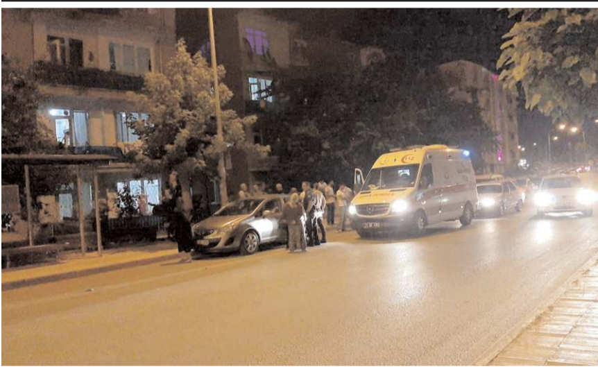
Her iki olayda farklı mahallelerde meydana geldi.