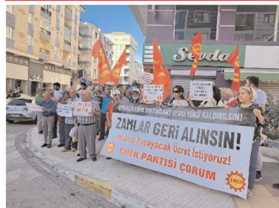
EMEP İl Örgütü tarafından düzenlenen eylemde zamlara tepki gösterildi.

■ Çorum'da jandarma ekipleri tarafından düzenlenen operasyonda çok sayıda uyuşturucu madde ile ruhsatsız av tüfeği ele geçirildi. * HABERİ 4'DE