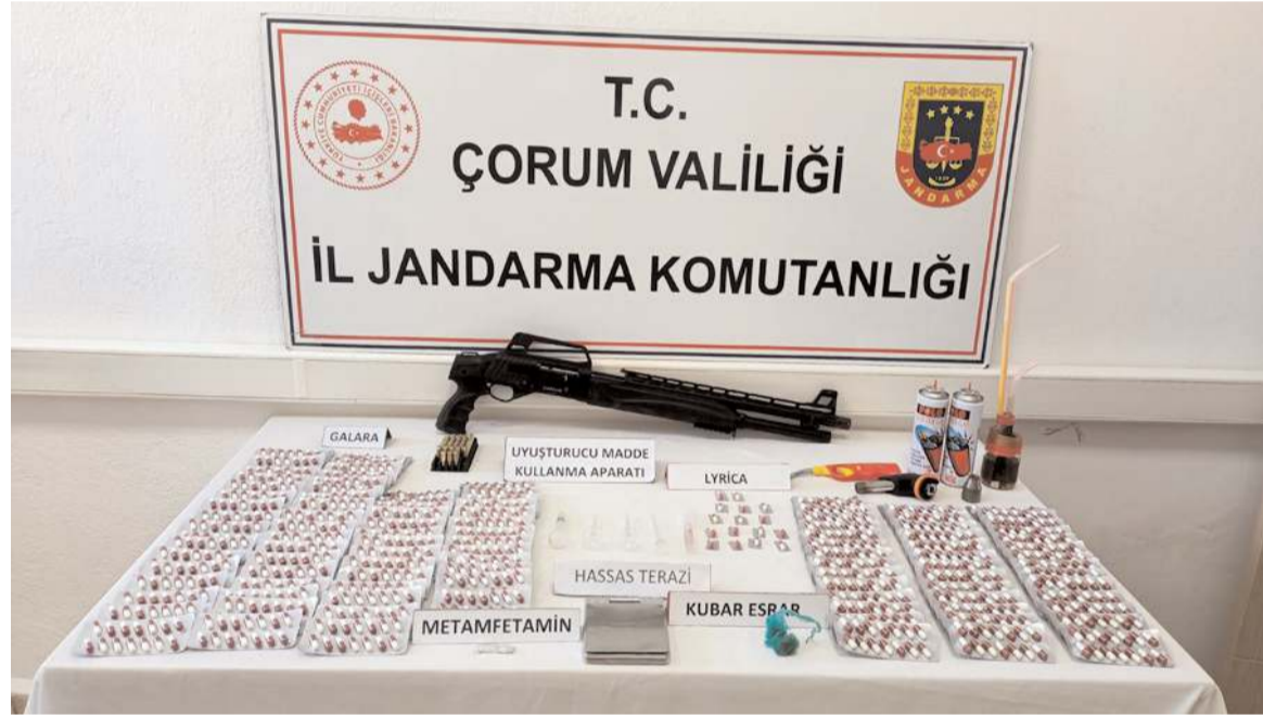
Operasyonda çok miktarda uyuşturucu madde ele geçirildi.

av tüfeğine el koyan jandarma ekipleri, şüpheli şahsı gözaltına aldı. Şüpheli şahıslar hakkında Türk Ceza Kanunu'nun 191'inci maddesinde yer alan 'uyuşturucu madde bulundurmak ve kullanmak' suçundan adli işlem başlatıldı. (İHA)