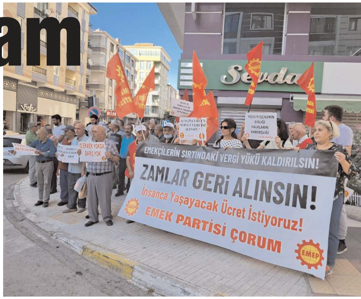
EMEP İl Örgütü tarafından düzenlenen eylemde zamlara tepki gösterildi.