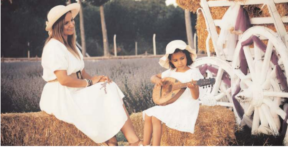
ÇOF SAD üyeleri birbirinden güzel fotoğraf çektiler.