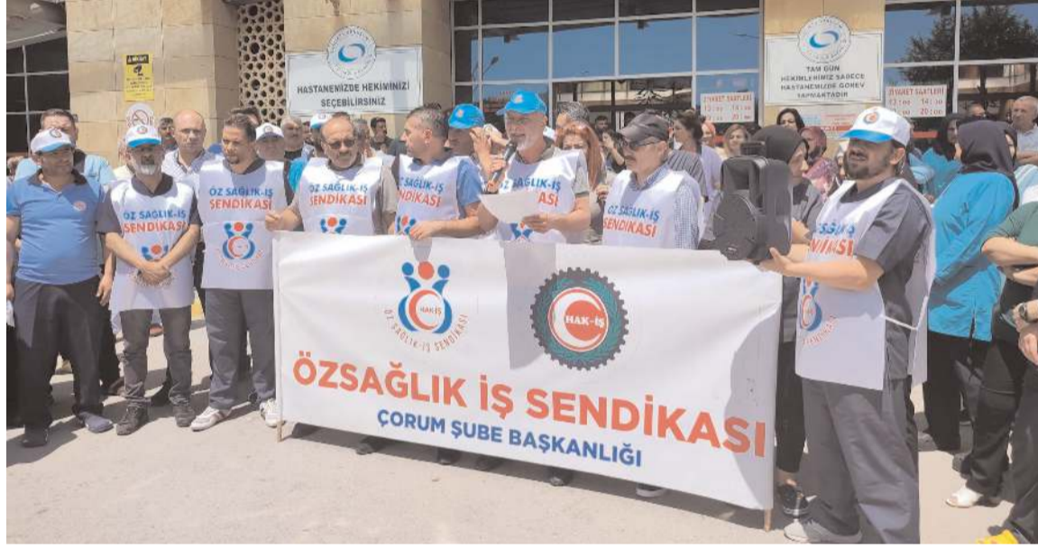
Sağlık işçileri basın toplantısında taleplerini dile getirdiler.