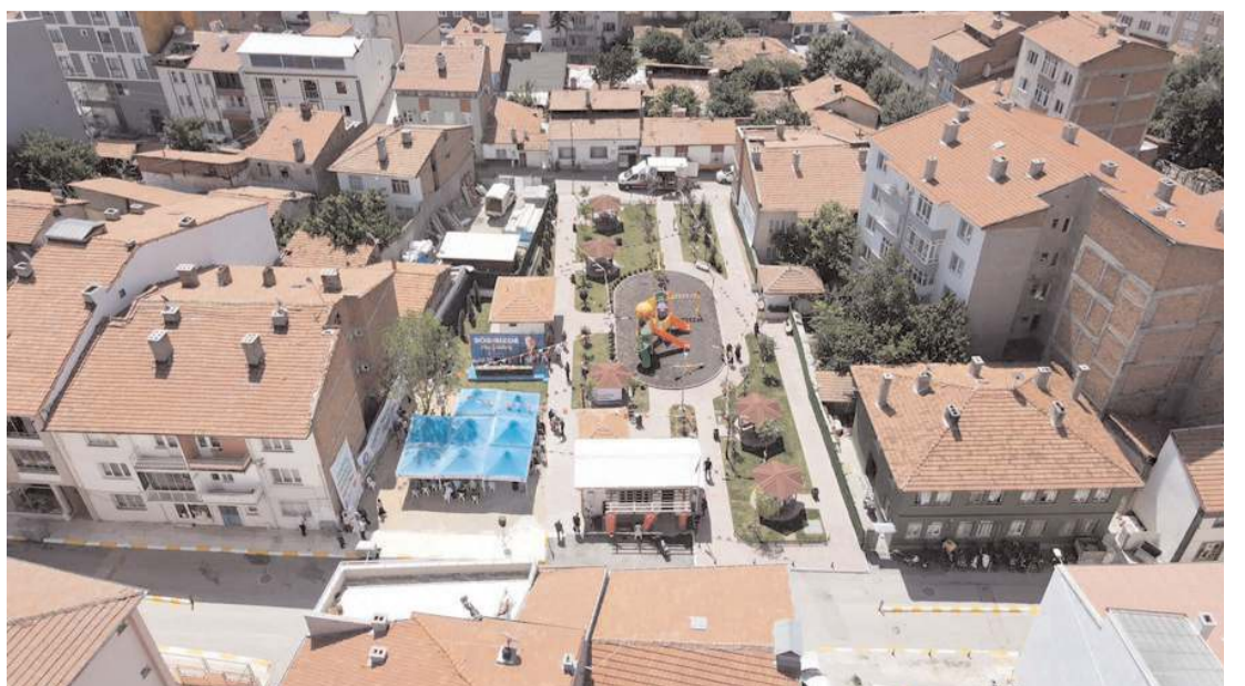
Semt parkı Yeni Yol Mahalle Muhtarlığının yanında bulunuyor.

HAKİMİYET, merhuma Allah'tan rahmet, ailesi ve sevenlerine başsağlığı diler. (Haber Merkezi)