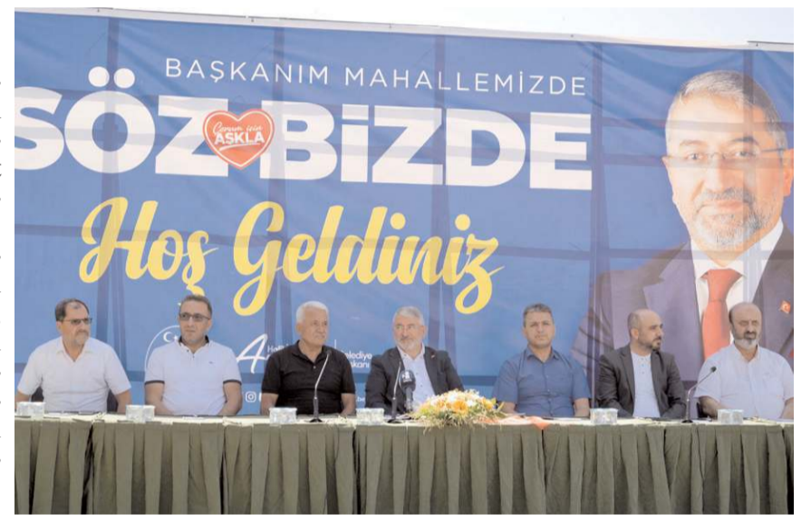
Yeni Yol Mahallesi Semt Parkı düzenlenen törenle açıldı.

hangi bir bahaneyle sığınmadan sadece yapma gayretimizi ortaya koyacağız" diye konuştu. Konuşmaların ardından semt parkı hizmete açıldı.