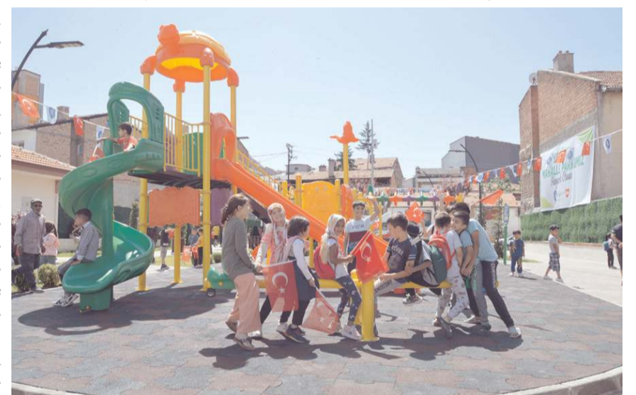
Çocuklar parkta gönüllerince eğlendiler.