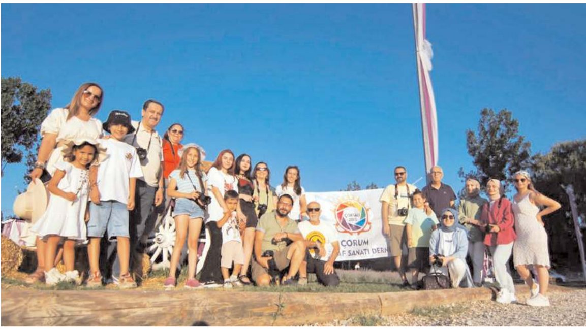
ÇOF SAD üyeleri günün anısına toplu fotoğraf çekindiler.