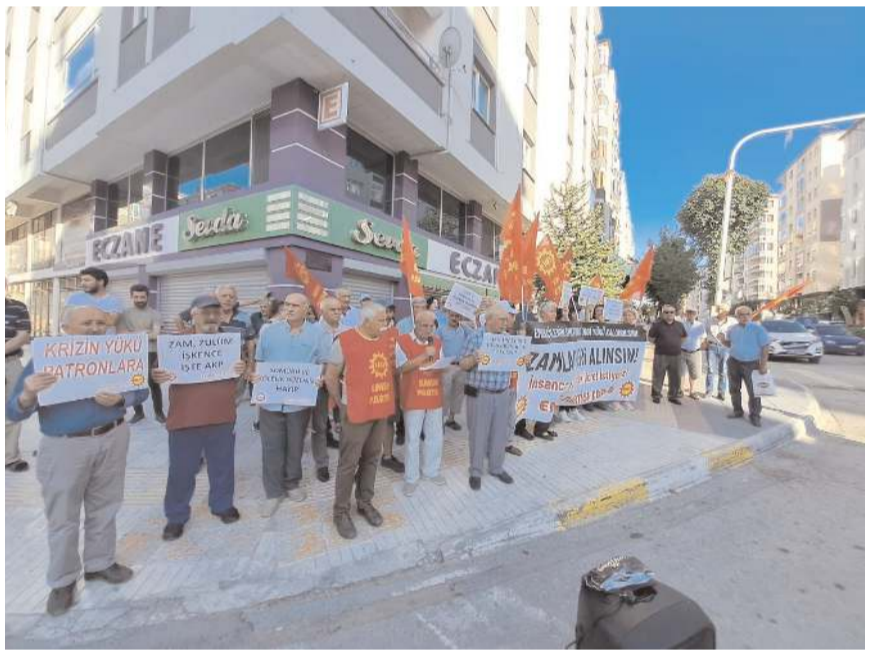
Basın açıklaması Özdoğanlar Kavşağı'nda yapıldı.