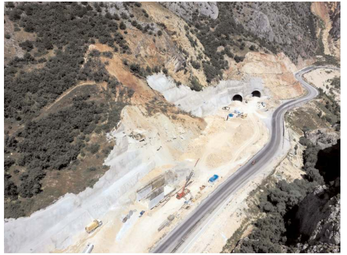
2021 yılında T1 tüneli çıkışı yarma şevinde heyelan meydana gelmişti.

Saat Kulesi'nden Her Saat Baş Ring Servislerle