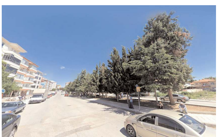
Vatandaşlar Alaaddin Cami'nin yanında bulunan çamlığın çevresinin tel örgü ile kapatılmasını istiyor.

bulunan çamlığın tel örgü ile kapatılmasını istediler.