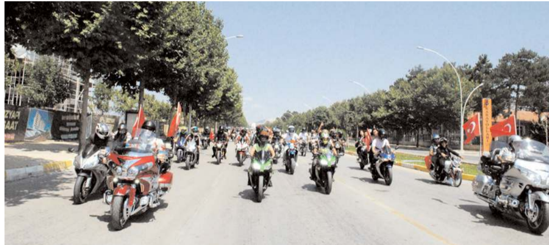
Motosiklet tutkunları ilk olarak şehir turu gerçekleştirdi.