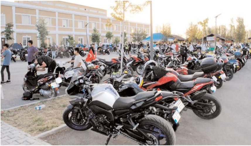
Festivalde ilgi yüksek oldu.