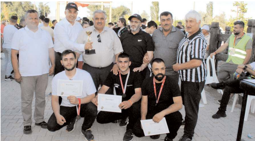
Bilek güreşi müsabakalarında derece elde edenlere başarı belgesi ve madalya verildi.

Çorum Valiliği, Çorum Belediyesi ve ÇESOB'un katkılarıyla Çorum Oto Tamirciler, Makine Yedek Parça Satıcıları, Tornacılar Esnaf ve Sanatkarlar Odası tarafından bu yıl 4.'sü organize edilen Hitit Motosiklet Festivali her yıl olduğu gibi bu yılda nefes kesti.