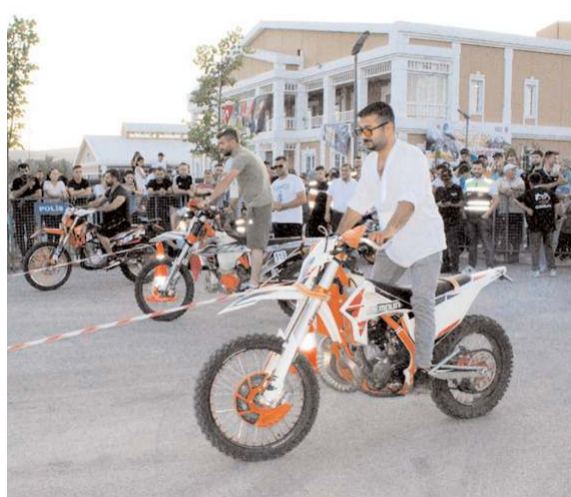
En ağır motor sürme yarışı yapıldı.

Geceyi de kamp kurarak Çorum Belediyesi Atlı Spor Kulübü Kompleksi'nde geçiren motor tutkunları gün boyu gerçekleştirdikleri motor showları ile katılımcılara unutulmaz anlar yaşattı. Deniz Soydan ve Bir Dakka Grubu'nun konserleri ve havai fişek gösterileriyle coşkun tavan yaptığı festival sonunda motor tutkunları bir sonraki seneye buluşmak üzere Çorum'dan mutlu bir şekilde ayrıldılar. (Haber Merkezi)