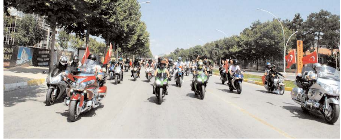
Motosiklet tutkunları ilk olarak şehir turu gerçekleştirdi.