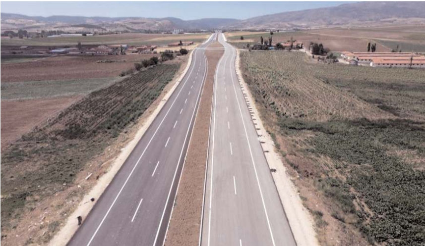
Bölünmüş yolda platform genişliği 25 m., tek yolda platform genişliği 12 metre.