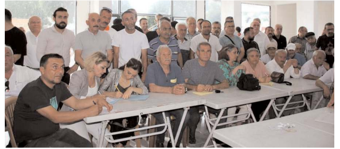
Delege seçimlerine ilgi yüksek oldu.