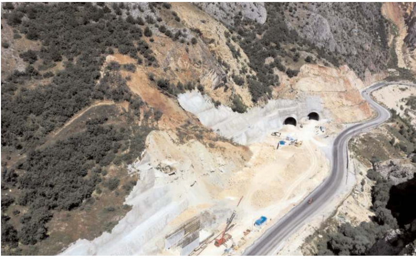
2021 yılında T1 tünelli çıkışı yarma şevinde heyelan meydana gelmişti.

■ Kırkdilim'de T1 tünelli çıkışında yarma şevinde 2021 yılında meydana gelen heyelan nedeniyle buraya aç-kapa tipinde tünel yapılmaya başlandı.