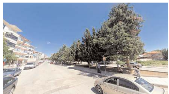
Vatandaşlar Alaaddin Cami'nin yanında bulunan çamlığın çevresinin tel örgü ile kapatılmasını istiyor.