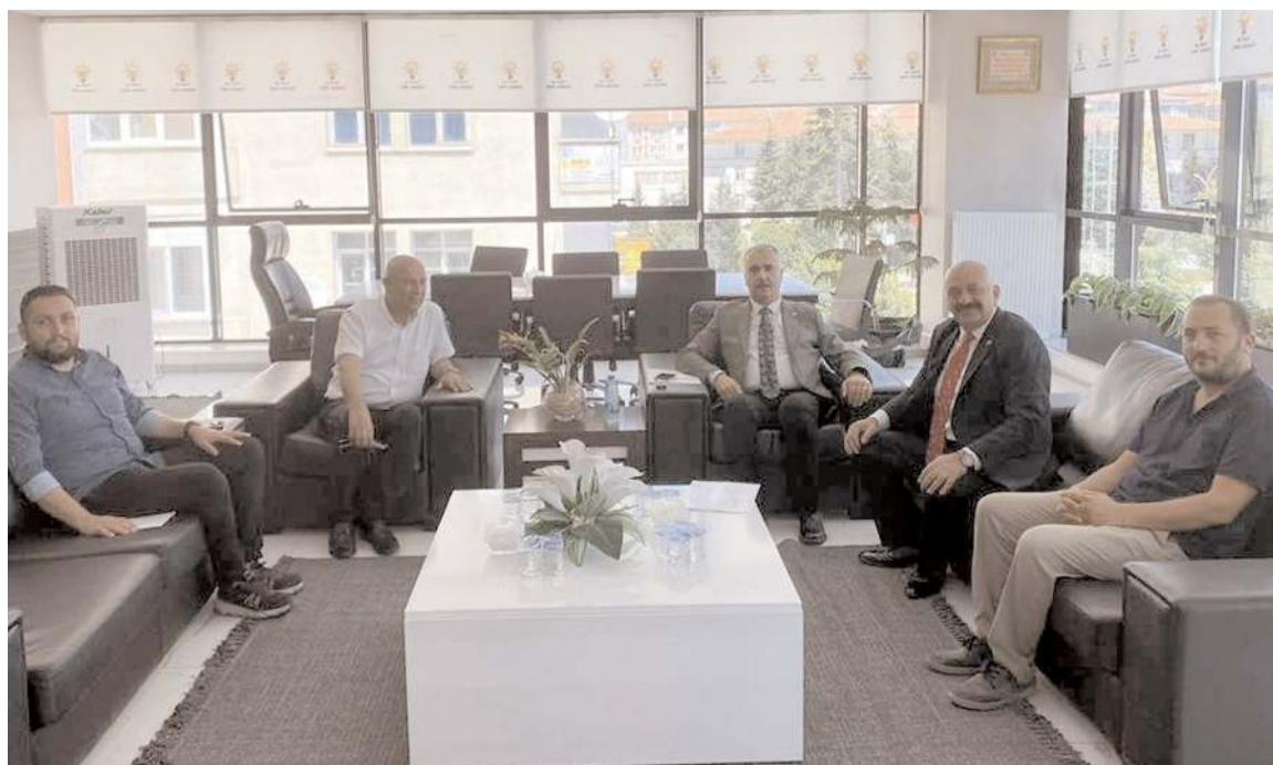
Toplantıda Cemilbey-Ortaköy yolunda çalışmaların son durumu hakkında görüş alışverişini yaptılar.