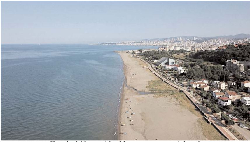
Karadeniz'de son 10 yılda yüzme veya serinlemek için denize giren 253 kişi boğuldu.

Kendilerinin havanın güzel ve sakin olduğu günlerde denize girdiklerini dile getiren Uysal, "Denize girenlerin çoğu yüzme bilmiyor, buna çok şahit oldum. Özellikle açıldıktan sonra panik halinde, 'kurtarın beni' diyenler oluyor. Bunun şakası yok. Çocukluğumdan beri burada yaşadığım için çok boğulma tehlikesine şahit oldum. İnsanlar bunu çok normalleştirmiş ve basitleştirmişler." ifadelerini kullandı.(AA)