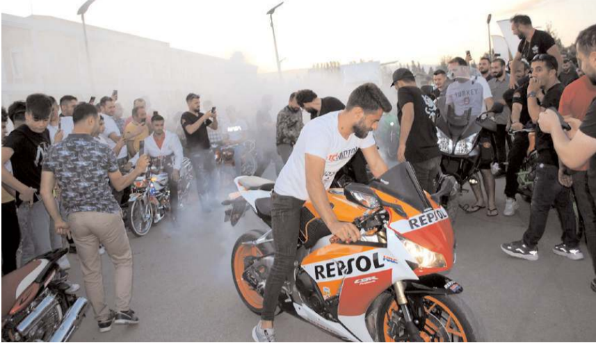
Etkinlik boyunca yapılan gösterileri ilgi çekti.