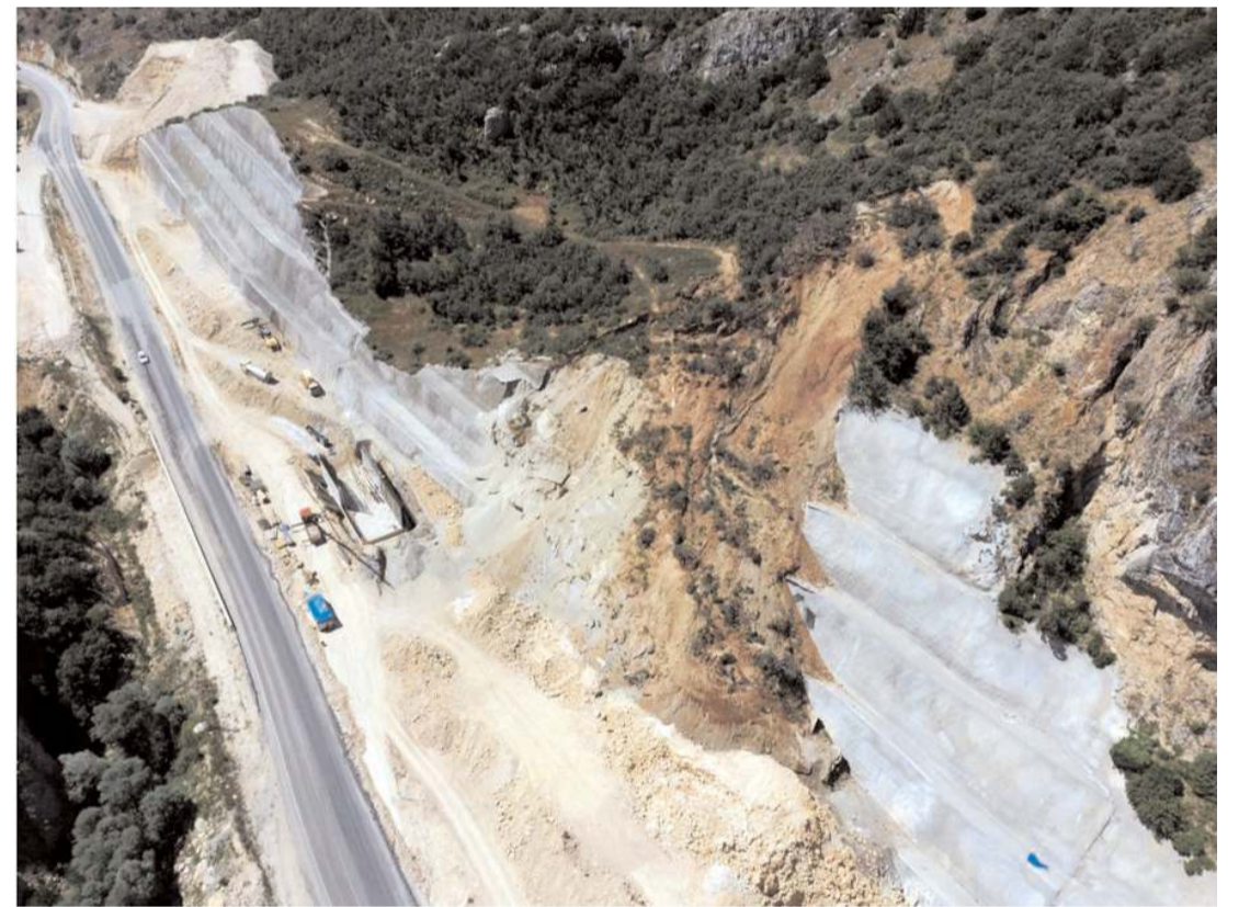
Tünel imalatları %85 oranında tamamlandı.

"T1 tüneli 1.389 m uzunluğunda olup sol tüp 123 Ano, sağ tüp 119 Ano toplam 242 Ano imalatı tamamlanmıştır. T1 tüneline çalışmalar devam etmektedir. T2 tüneli 1.157 m ve T3 tüneli 1.553 m uzunluğunda olup nihai beton imalatları tamamlanmıştır. %85 tünel imalatları tamamlanmıştır. T1 tüneli çıkışında yarma şevinde meydana gelen heyelan nedeniyle Genel Müdürlüğümüzce Geoteknik Proje hazırlanarak onaylanmış olup 130 m 9x6 ebatındaki aç-kapa imalatına başlanmıştır.