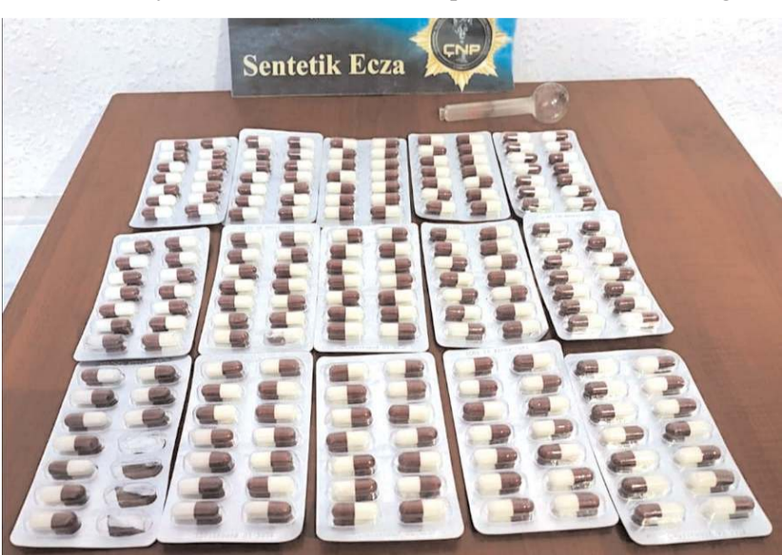
Operasyonda 206 adet sentetik uyuşturucu hap ele geçirilmiştir.

Haklarında düzenlenen soruşturma evrakıyla birlikte adli makamlara sevk edilen zanlılardan 3'ü tutuklandı. (İHA)