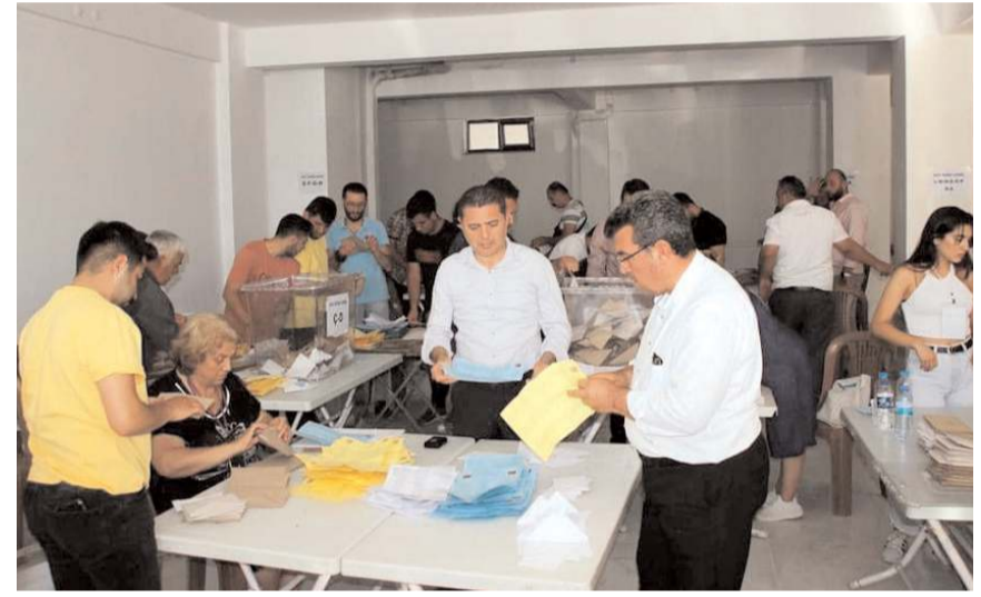
Hafta sonu Bahçelievler ile Üçtutlar Mahallerinde delege seçimleri yapıldı.

Üçtutlar Mahallesi delege seçiminde ise sarı liste 32 oy alarak seçimi önde tamamladı. Seçimde mavi liste 18 beyaz liste ise 8 oy aldı. Sarı liste Üçtutlar Mahallesi seçimlerinde 20 delege çıkarttı.