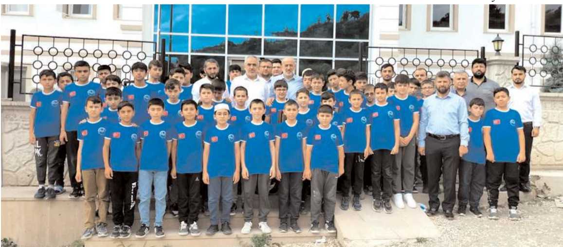
Ziyaretin sonunda toplu hatıra fotoğrafı çekildi.