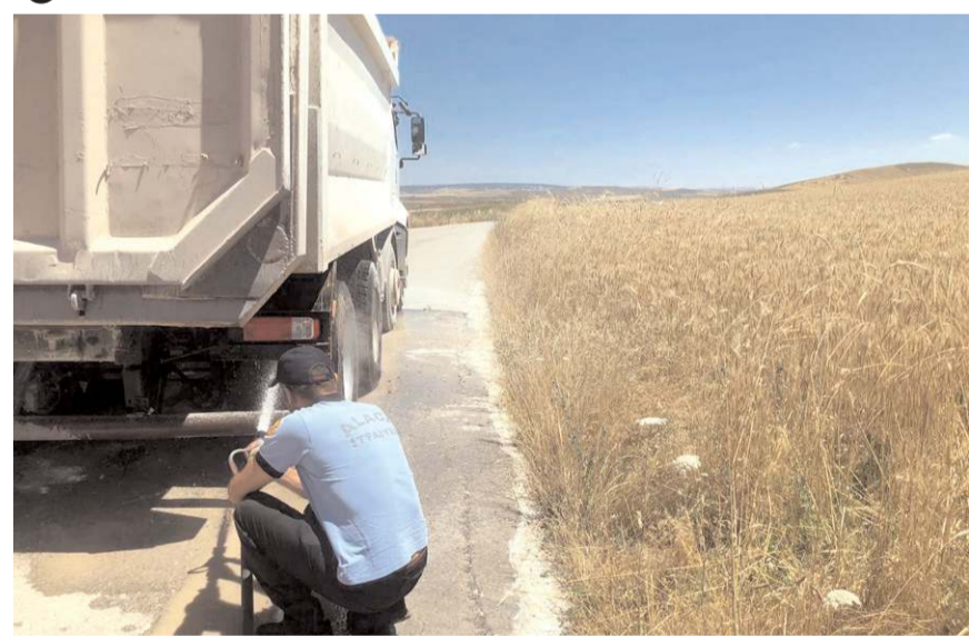
Yangında kamyonun maddi hasarı meydana geldi.

Yangın sonucu araçta hasar oluştu. (İHA)