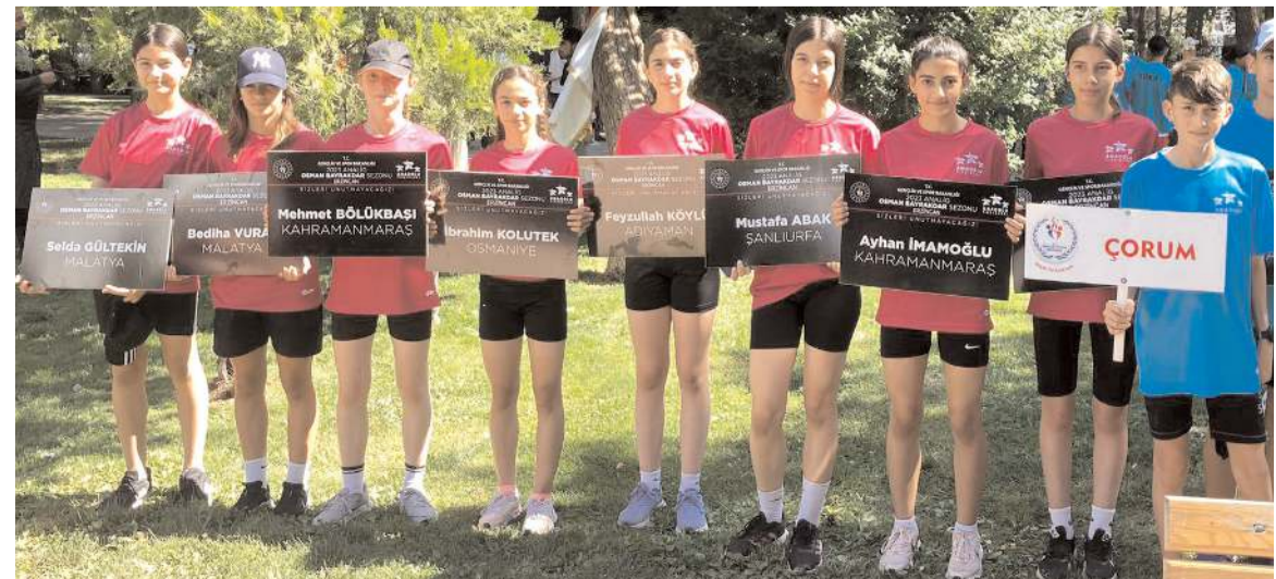
Erzincan'da yapılan yarı final grubunda mücadele eden Çorum atletizm takımı toplu halde görülüyor