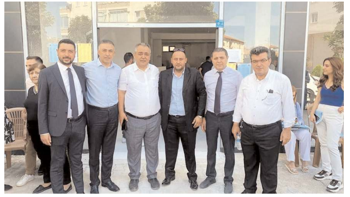
Cumhuriyet Halk Partisi'nin mahalle delege seçimleri devam ediyor.