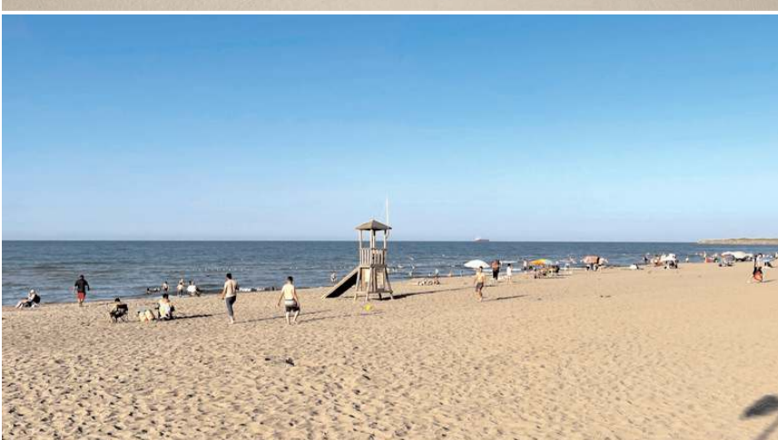
Vatandaşlardan cankurtaranlara yakın bölgelerde deniz girmeleri istendi.