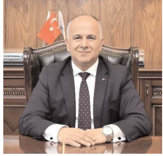
TCDD Genel Müdürü Hasan Pezük

TCDD Genel Müdürü Hasan Pezük, demiryolu ağının geliştirilmesi için tamamlanan ve yapıyı süreren projeler hakkında bilgiler vererek, Türkiye'nin dört bir yanını demiryolu ağı ile buluştur-