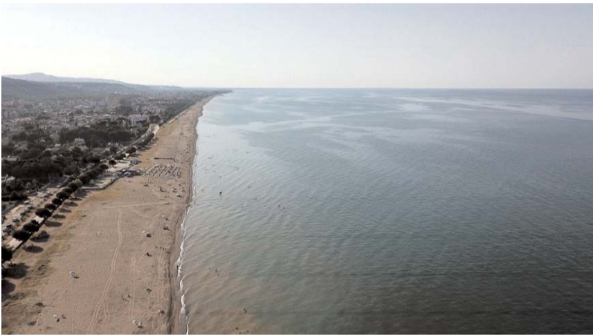
Son 10 yılda denizde arama kurtarma faaliyetlerinde ise 54 kişiye ulaşılmadı.