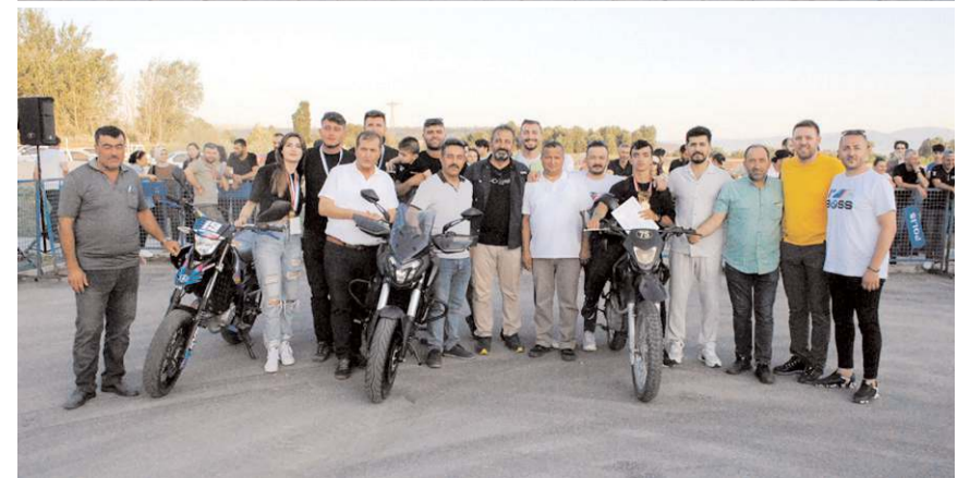
Motosiklet tutkunları bir sonraki seneye buluşmak üzere ayrıldılar.