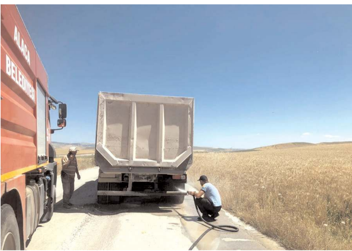
İtfaiye ekipleri yangını büyümeden söndürdü.