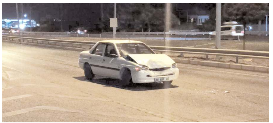
Kaza, Sungurlu-Kırıkkale kara yolunda meydana geldi.