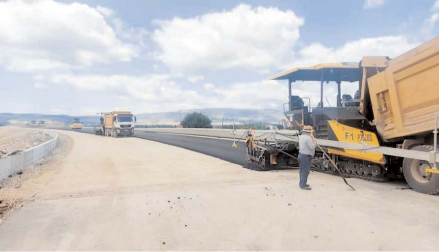
Çorum-İskilip Devlet Yolu'nun proje güzergahı 51 km uzunluğunda.

Bu arada Çorum-İskilip yolunda çalışmaların yeniden başlaması dolayısıyla vatandaşların servis yoluna yönlendirildiği, bu yolunda bozuk olmasından dolayı şikayetçi olduğu öğrenildi.