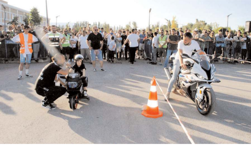
Festivalde çok sayıda yarışmada yapıldı.