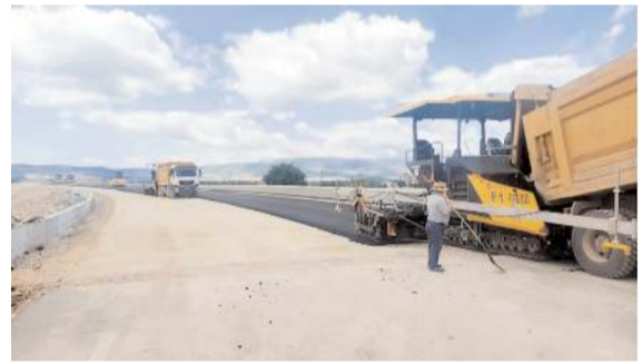
Çorum-İskilip Devlet Yolu'nun proje güzergahı 51 km uzunluğunda.