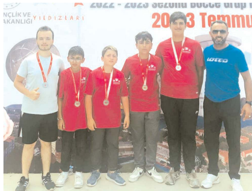
delettiği maçlar sonunda Çorum Bocce takımı üçüncülük kupa-

pasını alarak yarı final grubuna yükselmeye başardı. Yarı final grup maçları 14-16 Ağustos tarihlerinde Sam-