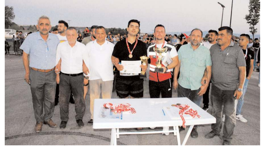
Yarışmalarda derece elde edenlere ödülleri verildi.