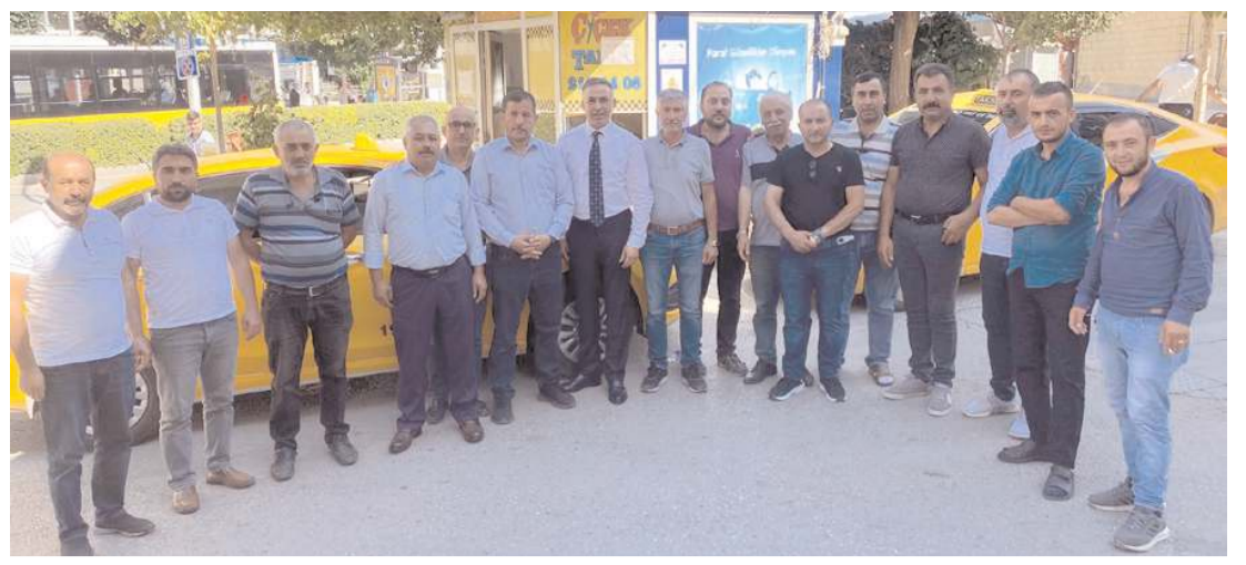
CHP Çorum Milletvekili Mehmet Tahtasız, taksici esnafı ile buluştu.