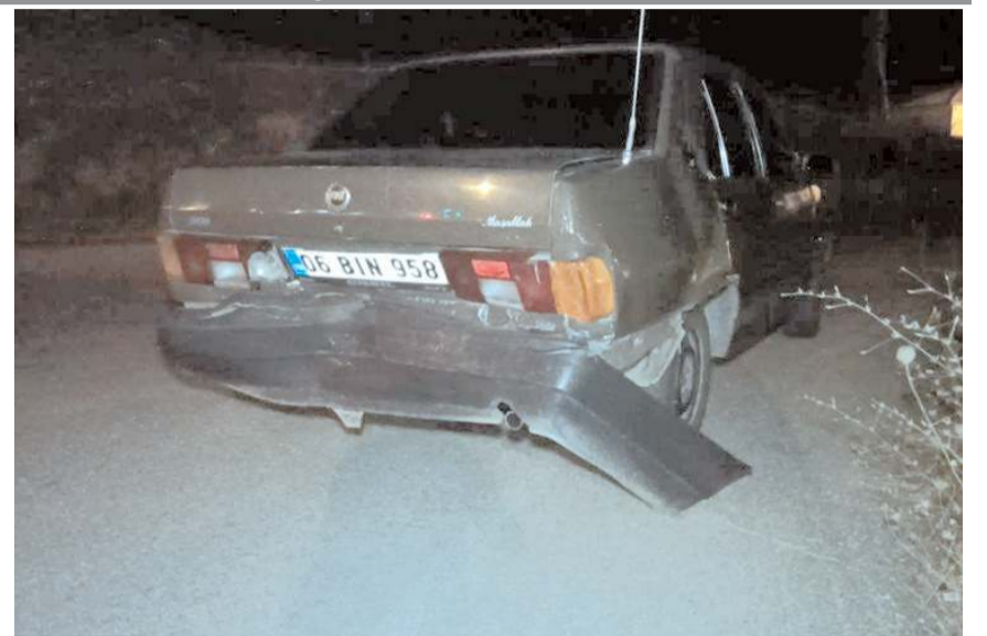
Kazada her iki araçta da maddi hasar meydana geldi.

Kazayla ilgili soruşturma başlatıldı. (İHA)