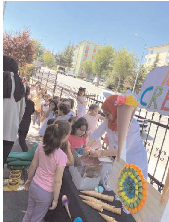
Çocuklar şenlikte güzel bir gün geçirdiler.

Kursta, hafız adaylarıyla hoş bir sohbet gerçekleştiren Biçer, ziyaret sonunda bir soruya en güzel ve doğru cevabı veren öğrenciye Kur'an'ı Kerim hediye etti.