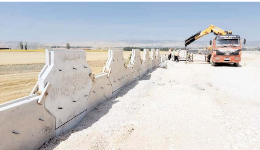
Yolda çalışmalar devam ediyor.