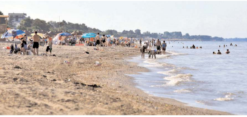
Boğulma vakalarında rip akıntı ve dalgalar etkili oldu.