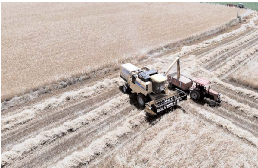
Bayat Belediyesi 500 dönüm araziden 100 ton arpa hasat etti.

Bayat Belediyesi olarak 500 dönüm arazide tarım yaptıklarını belirten Başkan Ekrem Ünlü, "Cumhurbaşkanımızın çağrısı üzerine tarım arazilerini ekil hale getirmek için çalışma başlattık. 500 dönüm arazide tarım yapıyoruz. Burada üretilen ürünleri de satarak bütçemize katkı olarak sunuyoruz. Bu yıl ektiğimiz arazilerden 100 ton arpa hasadı gerçekleştirdik. Tahmini 700 bin TL'lik bir geliri kasamıza girdi. Tüketen bir belediye değil, kum ocağıyla santraliyle tarım arazileriyle üretim yapan bir belediyeçiliği ortaya koyduk. Buradan elde edilen gelirlerle halkımıza hizmet ettik" dedi.