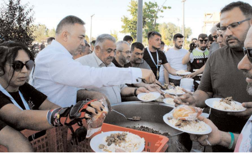
Protokol üyeleri katılımcılara yemek ikram ettiler.