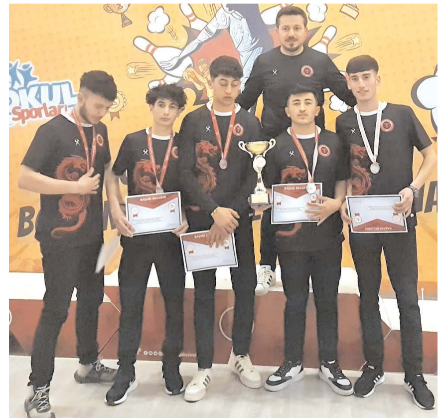
Liseli Genç erkekler Bowling'de finalde kaybederek Türkiye ikincisi olan Spor Lisesi bu kategoride Çorum'a ilk kupa kazandıran okul oldu.