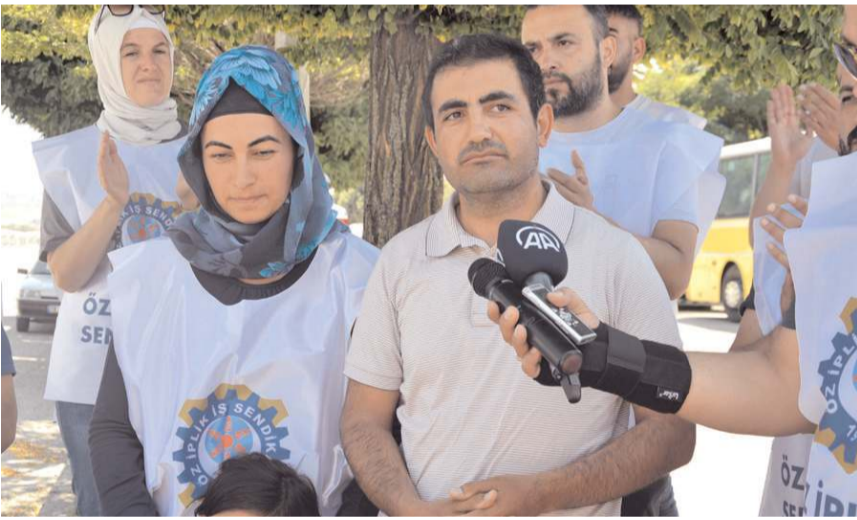
İşten çıkartılan işçiler mücadeleye devam edeceklerini belirttiler.