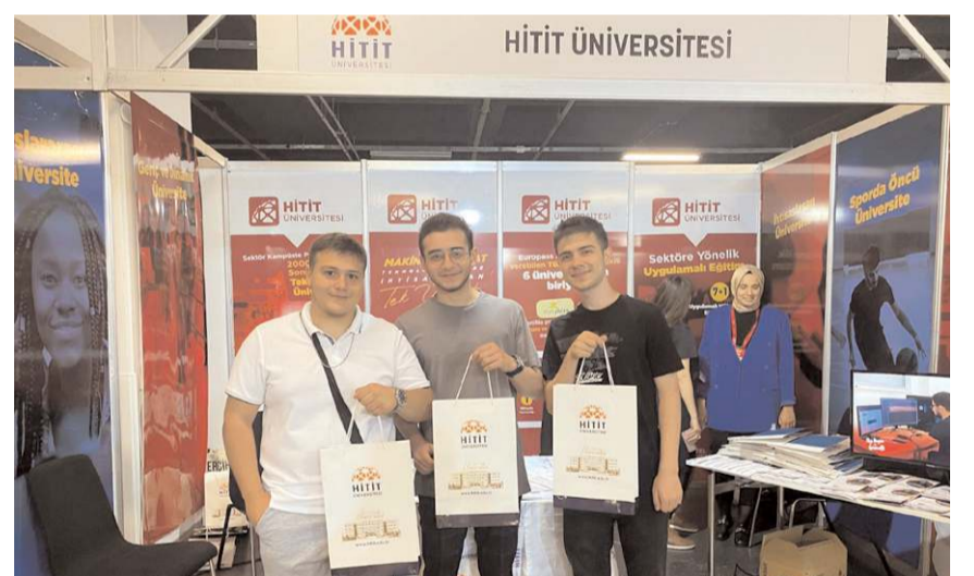
Öğrenci adaylarına üniversite ile ilgili dökümanlar verildi.