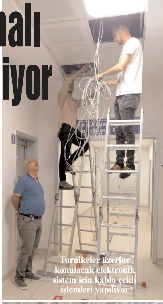
Turnikeler üzerine konulacak elektronik sistem için kablo çekiş işlemleri yapılıyor

Gençlik ve Spor İl Müdürlüğü stadyumun maça kadar eksiksiz hale gelmesi için ihale süreçlerinin tamamlandığı ve yüklenici firmaların çalışmalarını sürdürdüğünü belirtilerek her hangi bir sorun olmadığını belirtti.