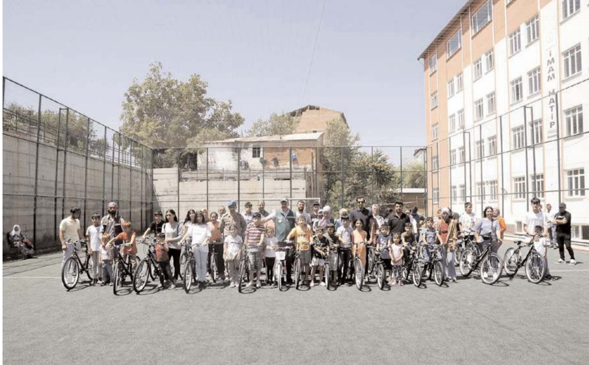
Çocuklar bisiklet sahibi olmanın mutluluğunu yaşadılar.