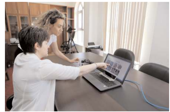
Araştırmayı Hitit Üniversitesi İktisadi ve İdari Bilimler Fakültesi akademisyenleri yaptı.