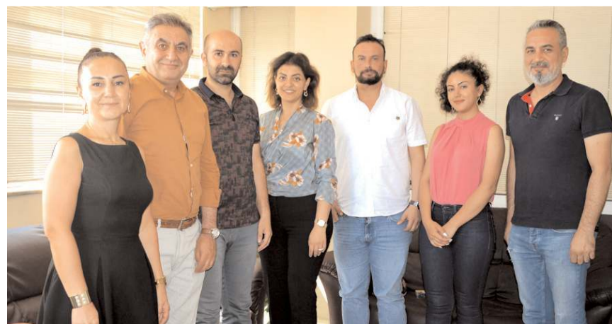
Genç Girişim ve Yönetişim Derneği, Gazeteciler ve Basın Bayramı nedeniyle gazetemizi ziyaret etti.