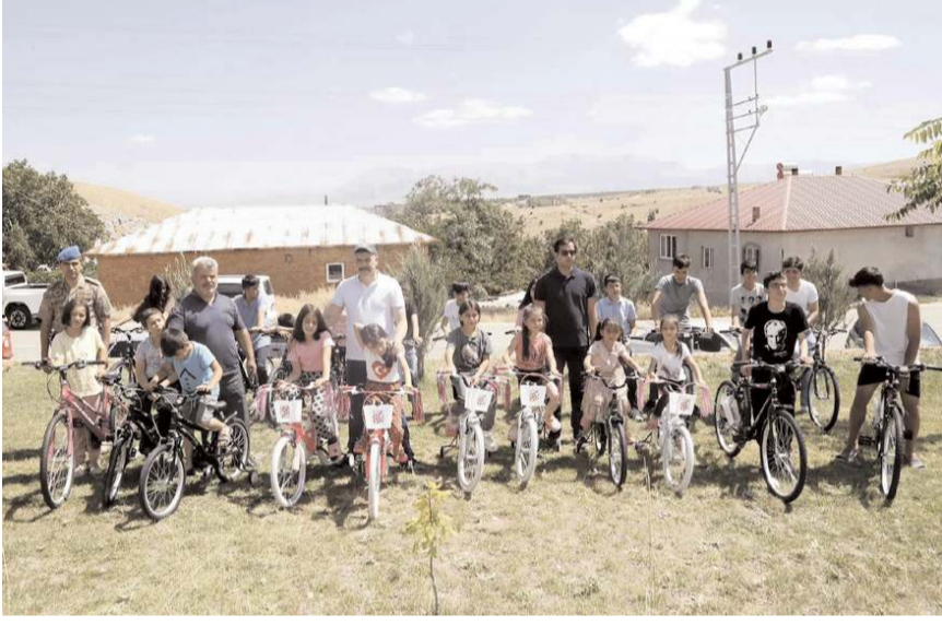
Çocuklara 200 bisiklet hediye edildi.