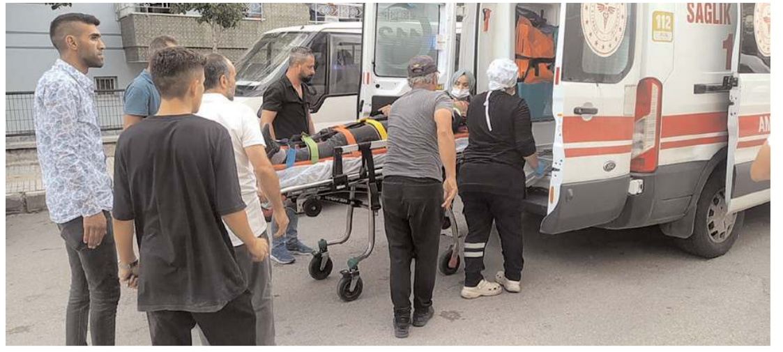
Kaza, Anadolu 7. Sokak'ta meydana geldi.

Kazayla ilgili inceleme başlatıldı. (İHA)