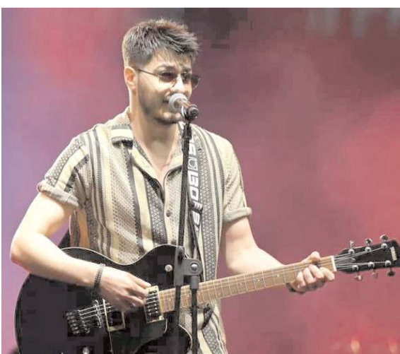
Semicenk, konserde birbirinden güzel şarkılarını seslendirdi.