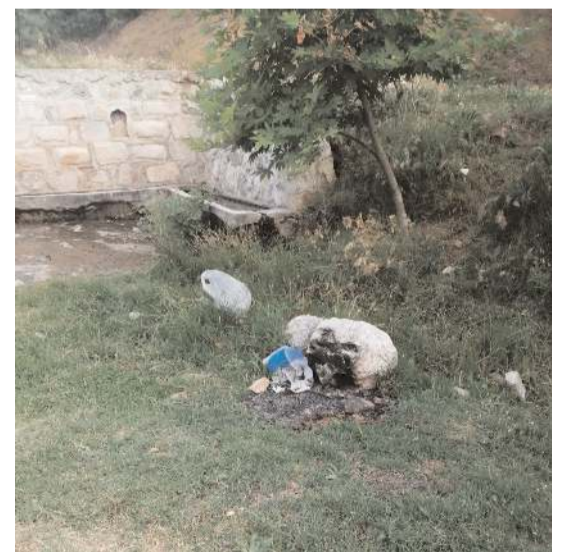
madı. İlgili kuruluşları önlem almaya davet ediyoruz" dediler.

Bölgede yapılan kesim sonrası ağaçlardan kalan dallar ve çalılırların kuruduğu için şu anda adeta çıra görevi gördüğünü vurguyan köy sakinleri, "Kırkdilim orman köyü. Bir kişinin atacağı izmarit dahi yangını başlatmaya yeter. Endişe ediyoruz. Durumu yetkililere bildirmemize rağmen bir ses çık-