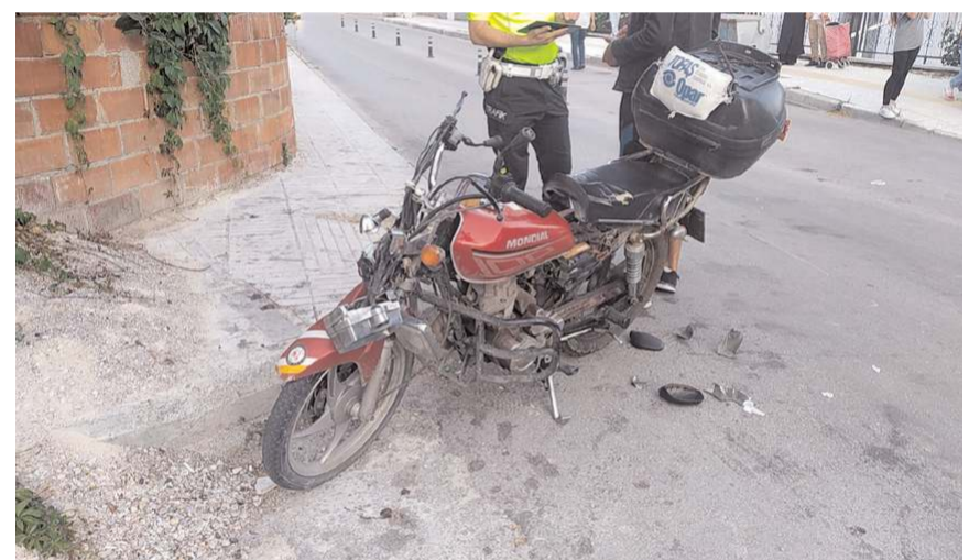
Kazada motosiklet sürücüsü yaralandı.