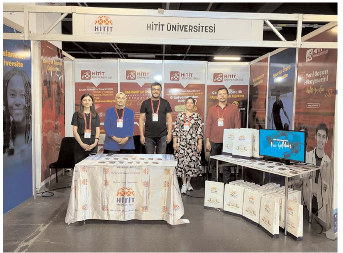
Hitit Üniversitesi, İstanbul'da düzenlenen "Üniversite Tercih Fuarı"na katıldı.

bizi göreve layık gören Genel Başkanımız Sayın Devlet Bahçeli Bey'e teşekkür ediyorum. Ömrünü adadığı davamızda Liderimizin ardında her zaman ki duruşumuzla yürüyeceğimizi ve Genel Başkanımıza, davamıza sadakatimizin son nefese kadar süreceğini beyan ediyorum. Görev süremiz boyunca bizlere destek olan tüm dava arkadaşlarıma teşekkür ediyorum. Rabb'im Genel Başkanımız Sayın Devlet Bahçeli Bey'i başımızdan eksik etmesin. Var olsun Milliyetçi Ülkücü Hareket. Var olsun teşkilatımız"