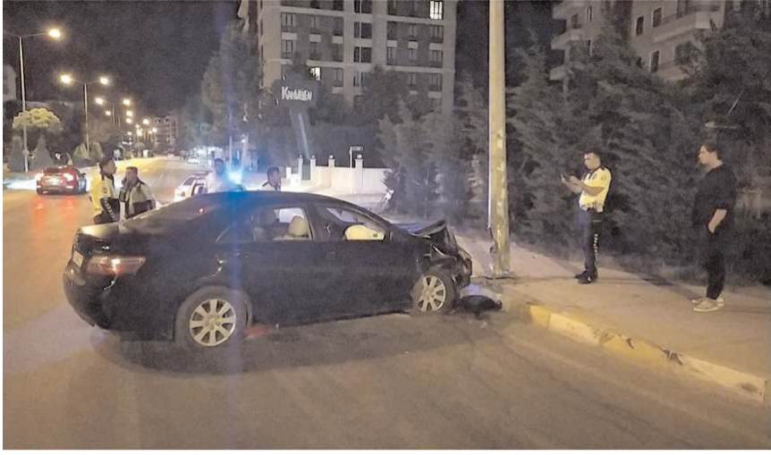
Kaza, Üçtutlar Mahallesi İlhan Gürel Caddesi'nde meydana geldi.