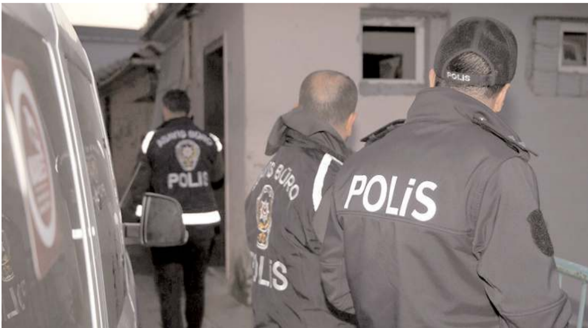
Emniyet güçleri aranan ve kayıp şahıslara yönelik çalışmalarına devam ediyor.

ce yakalama kararı bulunan ve kayıp olduklarına dair müracaatta bulunulan şahıslara yönelik yapılan araştırmalar ve çalışmalar neticesinde, 17-24 Temmuz 2023 tarihleri arasında, haklarında çeşitli mahkemelerce yakalama kararı bulunan 24 şahıs yakalanmış, ilimizde haklarında kayıp olduklarına dair müracaatta bulunulan 2 erkek, 1 kadın şahıstan, 1 erkek ve 1 kadın şahıs görevlilerimiz tarafından bulunmuştur. Vatandaşlarımızın huzur ve güvenliğine yönelik çalışmalarımız aralıksız olarak devam edecektir." (Haber Merkezi)