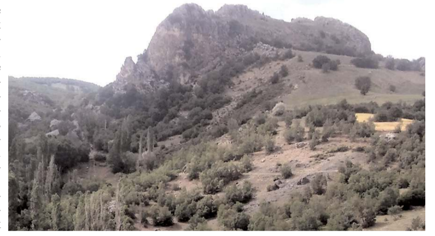
Kale Hattuşa'ya yaklaşık 40 km uzaklıkta bulunuyor.