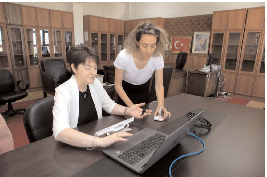
Araştırmada oyuncaklı fast food menülerinin çocuk obezitesi üzerindeki etkisi incelendi.