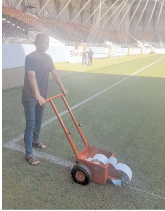
Var sistemini test etmek için saha çizgileri çizildi