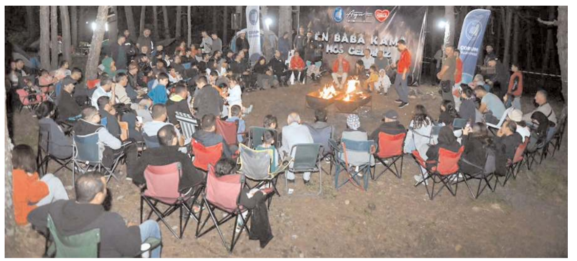
"En Baba Kamp" etkinliğinin bu yıl üçüncüsü yapıldı.