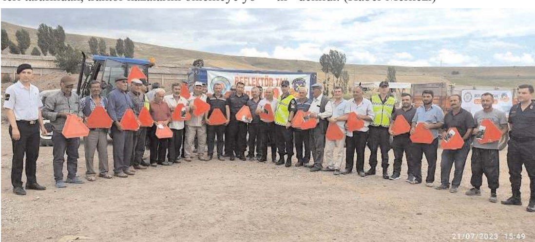
Jandarma, traktör sürücülerine 100 adet reflektör dağıttı.

nelik alınacak tedbirler ile bu tedbirler kapsamında trafikte görünürlüğünü arttıran reflektör ve sürücülerin devrilen traktörün altında kalmasını engelleyen ROPS (koruma çerçevesi) demirinin önemi anlatılarak, traktör sürücülerine reflektör ve eğitim broşürleri dağıtıldı. Proje çalışmaları ile traktörlerin neden olduğu trafik kazalarının önlenmesi, özellikle gece görünürlüğünü arttıran reflektör kullanımına yönelik farkındalık oluşturulması ve trafikte ki tüm yol kullanıcılarının güvenli seyahatlerini sağlamak amacıyla, Çorum İl Jandarma Komutanlığı olarak trafikte denetim, eğitim ve bilgilendirme faaliyetlerimiz devam edecektir" denildi. (Haber Merkezi)