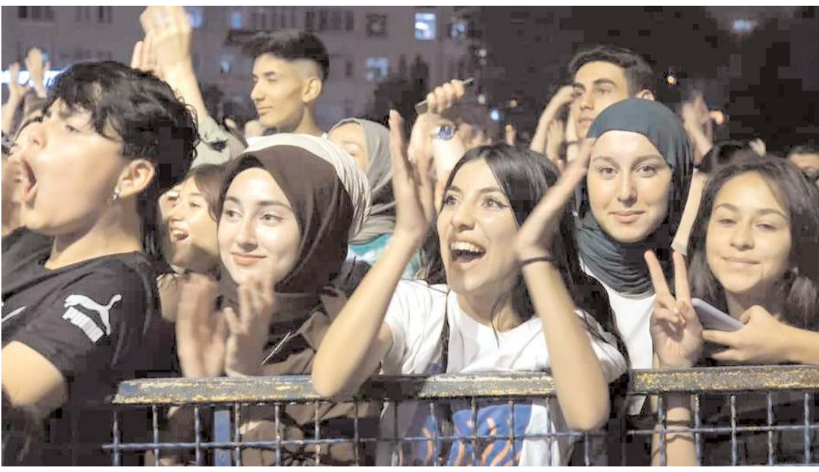
Gençler ünlü şarkıcı Semicenk'in şarkılarıyla gönüllerince eğlendi.