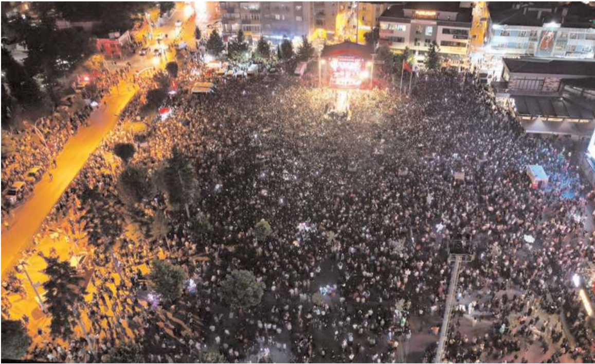
Kadeş Barış Meydanı'nda yapılan konsere ilgi yüksek oldu.