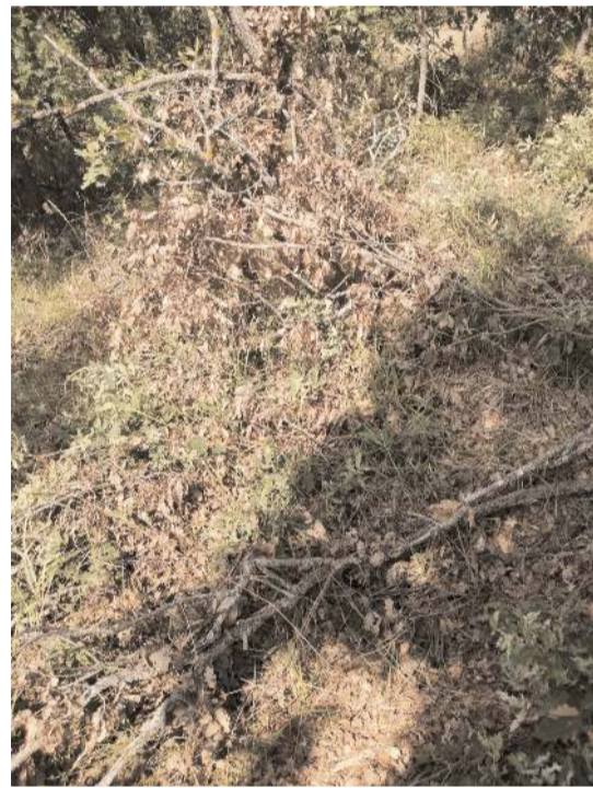
Köy sakinleri yangın riskine karşı ilgili kurumları önlem almaya davet ettiler.