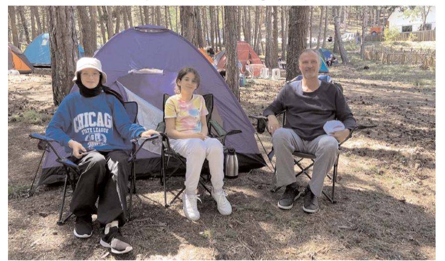
Etkinliğe babalar çocukları ile katılarak çadırda konakladı.