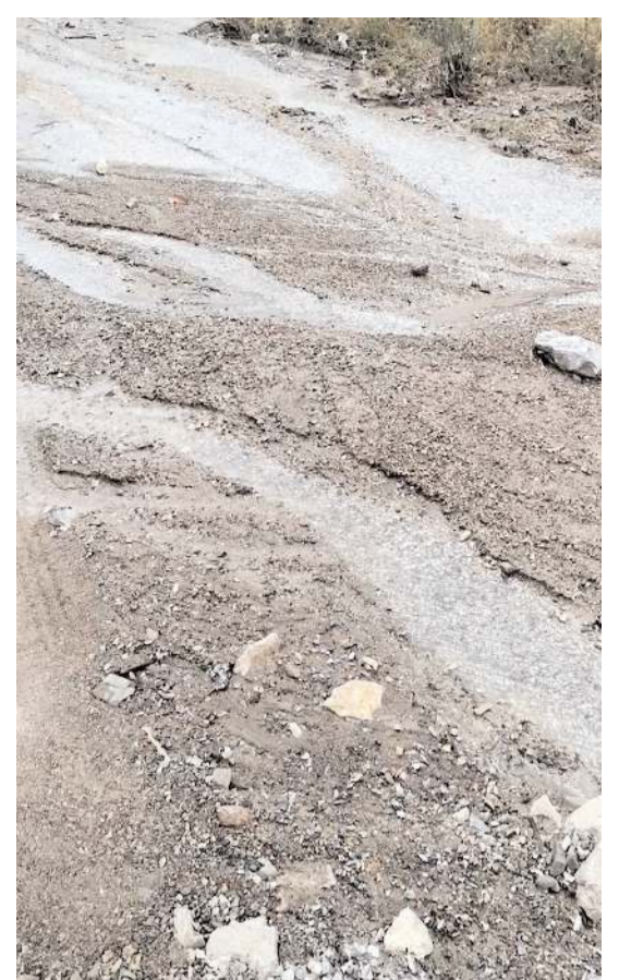
Çoraklık Bağları sakinleri yollarının yapılmasını istedi.