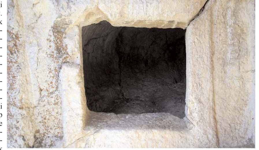
Kalede ki ayin çukuru dikkat çekiyor.