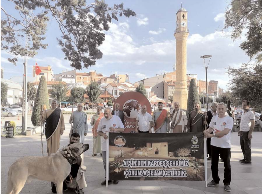
Ashab-ı Kefh Gönül Elçileri Derneği üyeleri, Ashab-ı Kefh hikayesini anlatmak amacıyla o döneme ait temsili kıyafetlerle Çorum'da gezdi.