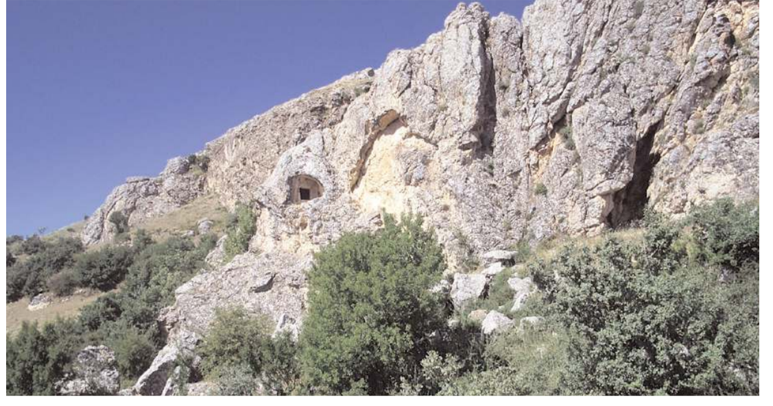
Muratkolu Kalesi Muratkolu köyünde yer alıyor.