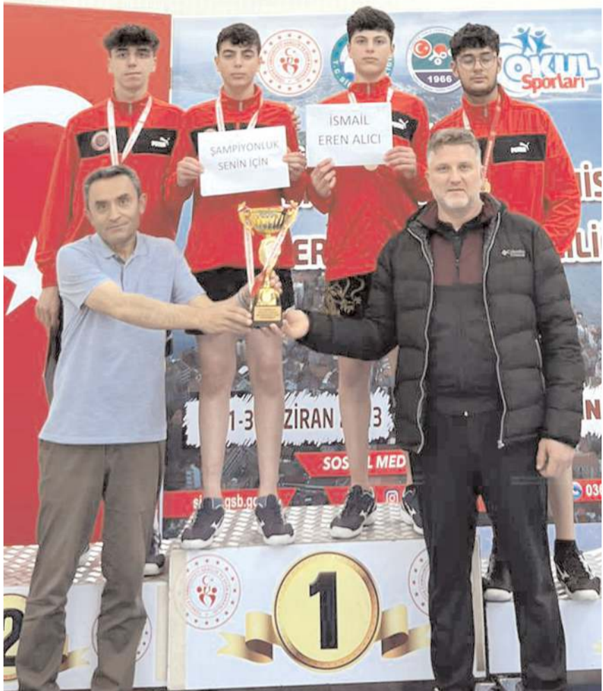
Liseli Genç Erkekler Masa Tenisinde Türkiye Şampiyonu olan Spor Lisesi