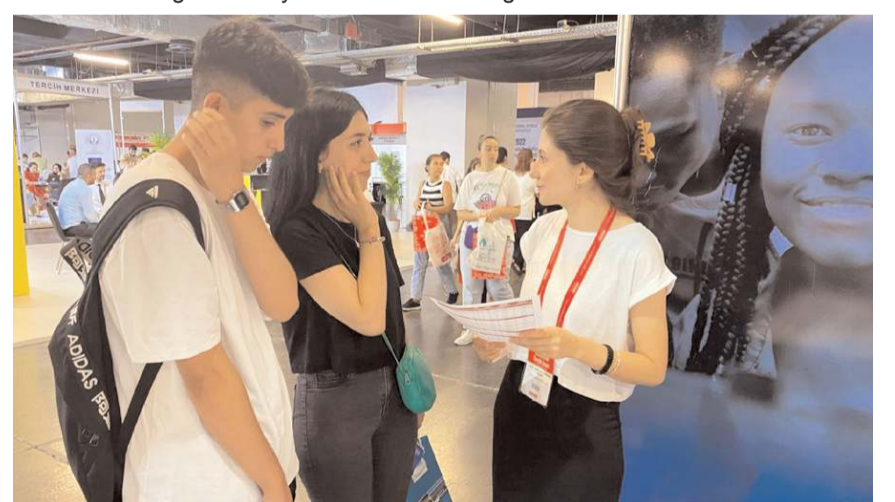
Görevliler Hitit Üniversitesi ve Çorum ile ilgili sorulara cevap verdiler.