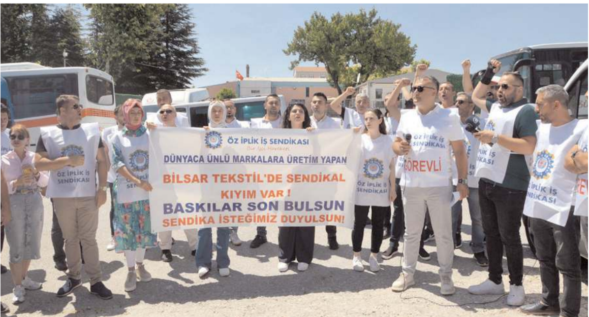
650 kişinin çalıştığı fabrikada Öz İplik İş Sendikası'na üye olduğu iddiasıyla 28'e yakın işçi işten çıkartıldı.