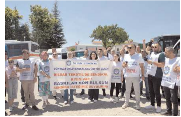
650 kişinin çalıştığı fabrikada Öz İplik İş Sendikası'na üye olduğu iddiasıyla 28'e yakın işçi işten çıkarıldı.

Tekstil fabrikasında 28 kişi işten çıkarıldı