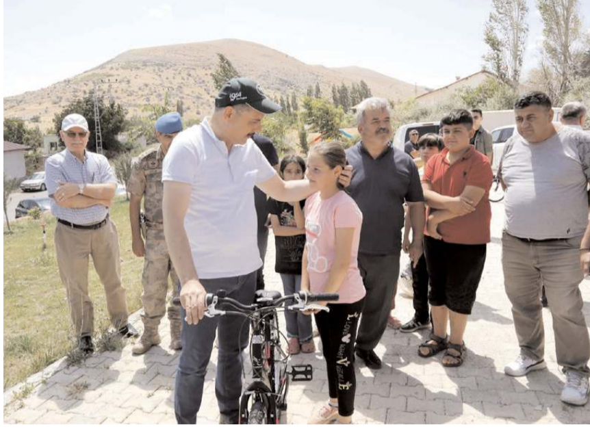
Bisikletleri Vali Mustafa Çiftçi, çocuklara teslim etti.

Dernek yetkililerine teşekkür eden Çiftçi, Afşin'e ziyaretlerinin devam edeceğini, Türkiye'yi derinden etkileyen felaket sonrası yaşanan olumsuzlukların giderilmesi için başlattıkları çalışmaların hız kesmeden süreceğini sözlerine ekledi.(AA)