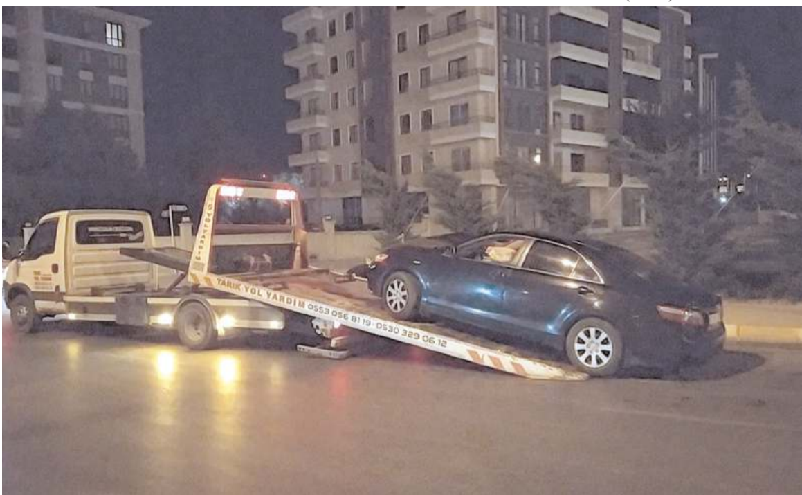
Kaza yapan araç çekici ile olay yerinden kaldırıldı.

Çorum'da bir sürücü kaza yaptığı otomobili bırakarak olay yerinden kaçtı.