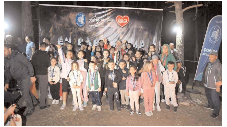
Etkinlik Çatak Tabiat Parkında gerçekleştirildi.

Çorum Belediyesi'nin üçüncüsünü düzenlediği "En Baba Kamp" etkinliği minik katılımcılardan