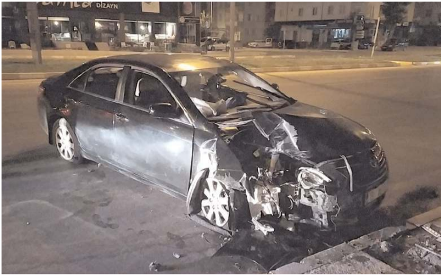
Kazada otomobilde maddi hasar meydana geldi.