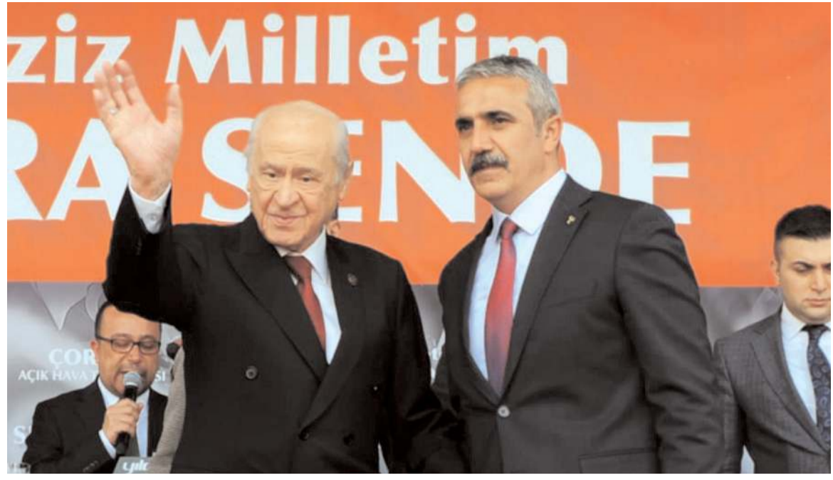
Devlet Bahçeli'nin Çorum mitinginden...