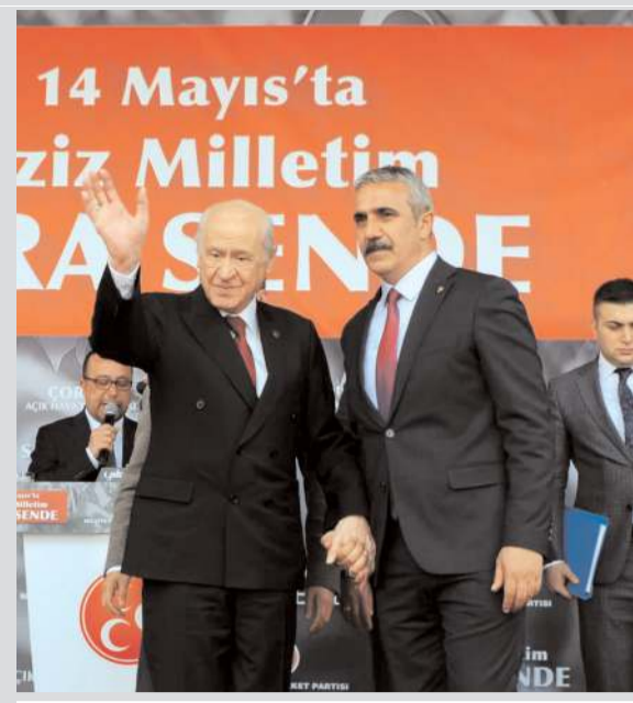
Devlet Bahçeli'nin Çorum mitinginden... bir çok kademesinde şahsımıza güvenerek

Karapıçak, açıklamasında şunları kaydetti: "Ülkücü Hareketin