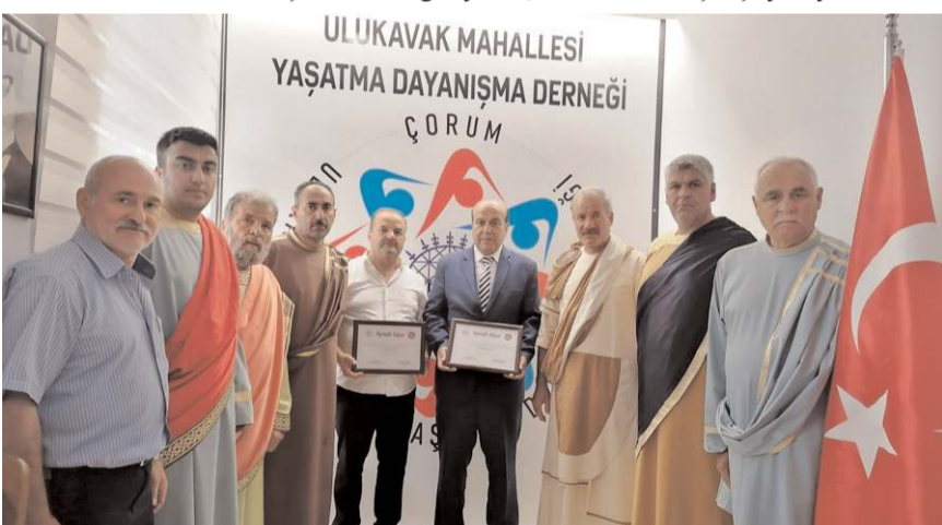
Ashab-ı Kefh Gönül Elçileri Derneği üyeleri, Ulukavak Mahallesi Yardımlaşma Dayanışma Derneği'ni ziyaret etti.