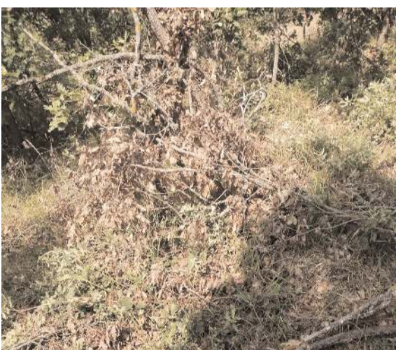
Köy sakinleri yangın riskine karşı ilgili kurumları önlem almaya davet ettiler.