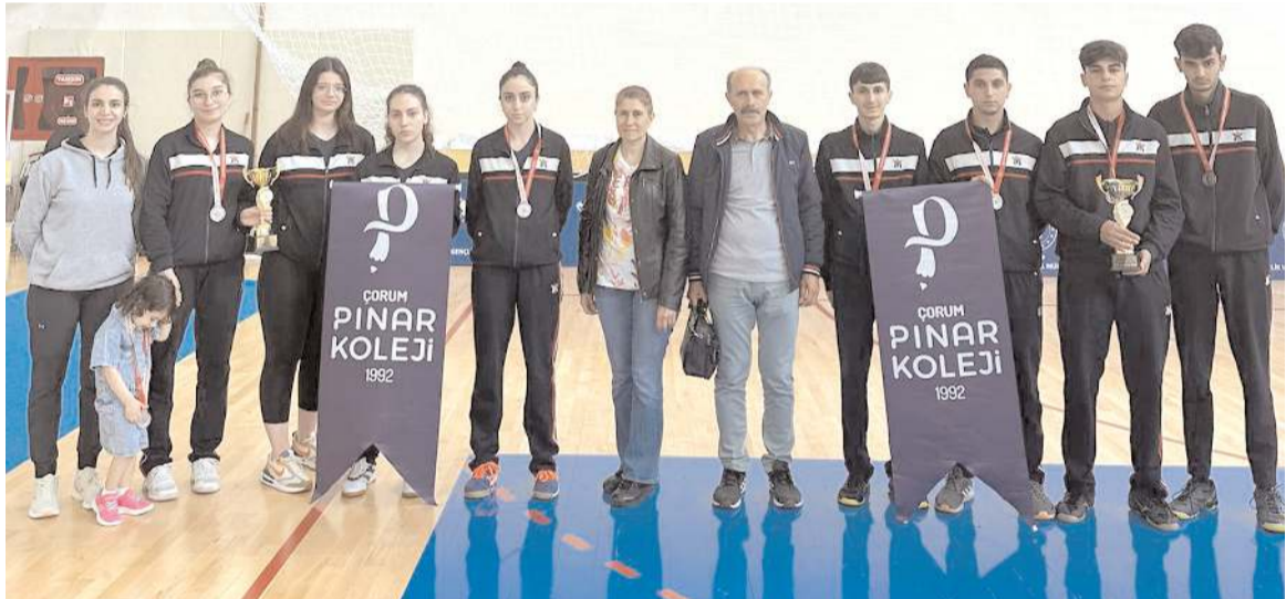
Liseler Masa Tenisinde kız ve erkeklerde Türkiye ikincisi olan Özel Pınar Koleji takımları kupaları ile toplu halde