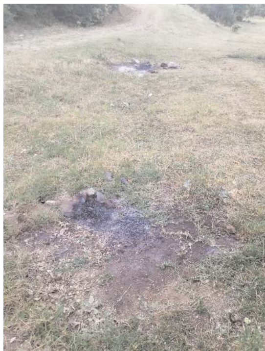
Köy sakinleri yasak olmasına rağmen ormanda piknik yapılmasına tepki gösterdiler.