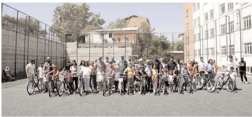
Çocuklar bisiklet sahibi olmanın mutluluğunu yaşadılar.

■ Çorum Valiliği koordinesinde temin edilen 200 bisiklet, 6 Şubat'taki depremlerin merkezi Kahramanmaraş'ta çocuklara dağıtıldı.