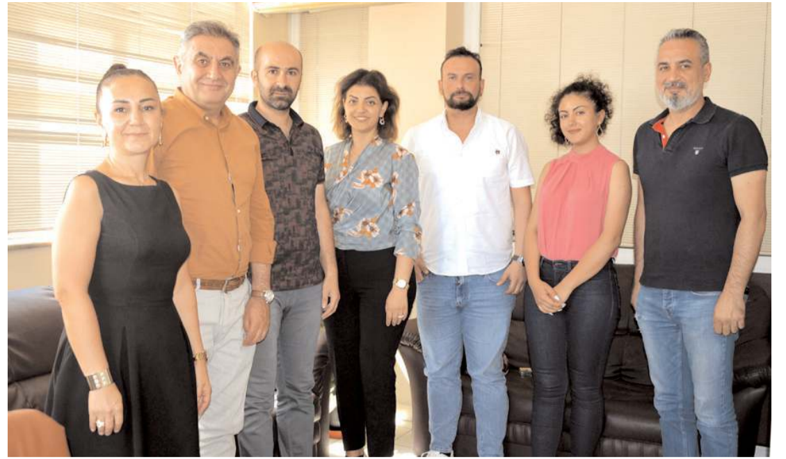
Genç Girişim ve Yönetişim Derneği, Gazeteciler ve Basın Bayramı nedeniyle gazetemizi ziyaret etti.