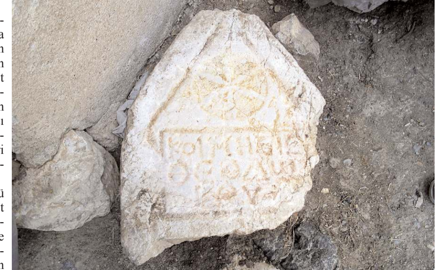
Bölgede Bizans dönemine ait yazılı mezar taşları bulunuyor.