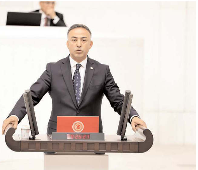
CHP Çorum Milletvekili Mehmet Tahtasız

"Zam hükümetinin milletvekillerini, belediye başkanını göreve çağırıyorum. Sayın Valimizi, STK'ları, iş insanlarını, kanaat önderlerini göreve davet ediyorum. Çorum için birlikte çalışalım. Havaalanı, demir yolu başta olmak üzere devlet hastanemizi, ilçe ulaşım yollarımızı, tarımsal sulama göletlerimizi bitirelim. Çorum'un tarımını, turizmını, sanayisini canlandıralım" diye konuştu. (Haber Merkezi)