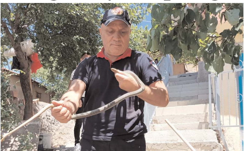
Ekipler, 10 dakika süren aramanın ardından yılanı yakalamayı başardı.

Sungurlu'da, bir eve giren yılan itfaiye ekipleri tarafından yakalandı.