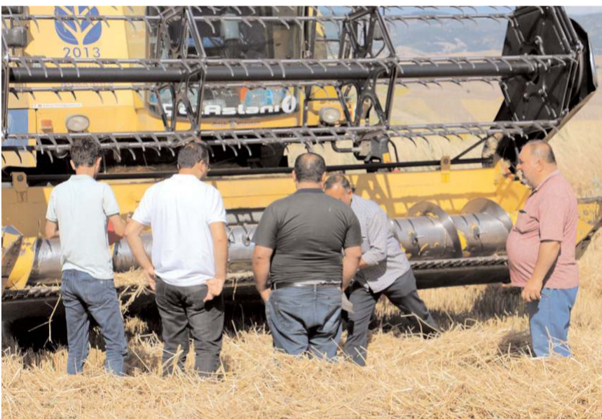
Denetimleri Boğazkale İlçe Tarım ve Orman Müdürlüğü ekipleri yaptı.

Çiftçileri gerekli konularda yönlendirdiklerini belirten Bakırcı, "Hasat dönemi çalışma-