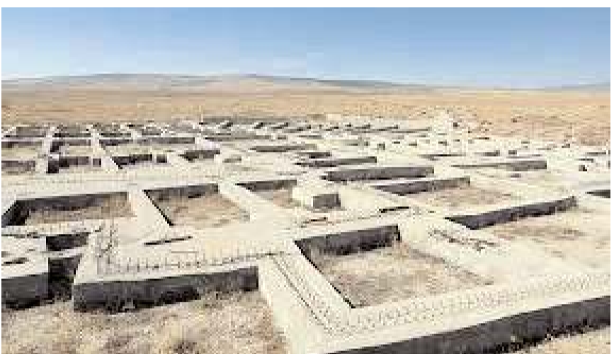
Çorum havaalanı inşaatı yarım kalmış halde duruyor.