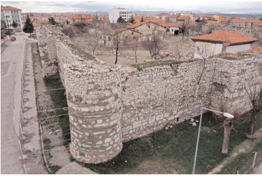
Proje kapsamında Kale içinde bulunan mescitte restore edilecek.

belirterek "Ülkemizin, şehrimizin kültürel varlıklarının korunması adına çok önemli bir adımı atıyoruz. Tarihi Çorum Kalesi Restorasyonu projemizle ilgili olarak Bakanlığımızdan aldığımız destekle ilgili işbirliği protokolü imza törenindeyiz. Bu işbirliğini çok önemsiyoruz. Kültürel varlıklarımızın tekrar ayağa kaldırılması, ihyası noktasında bizlere destek olmaya devam ediyorlar. Sayın Bakanımızın nezdinde tüm bakanlık çalışanlarına teşekkür ediyorum. Hususen de tüm bu güzel hizmetlerin başında yer alan Cumhurbaşkanımız Sayın Recep Tayyip Erdoğan'a şükranlarımı sunuyorum." dedi.