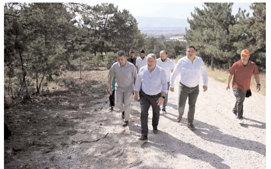
Başkan Aşgın, çalışmalarını yerinde inceledi.