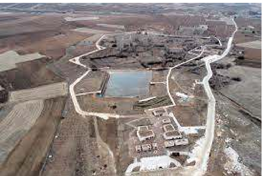
Hitit Barajı projesi tamamlandıktan sonra atıl duruma geldi.