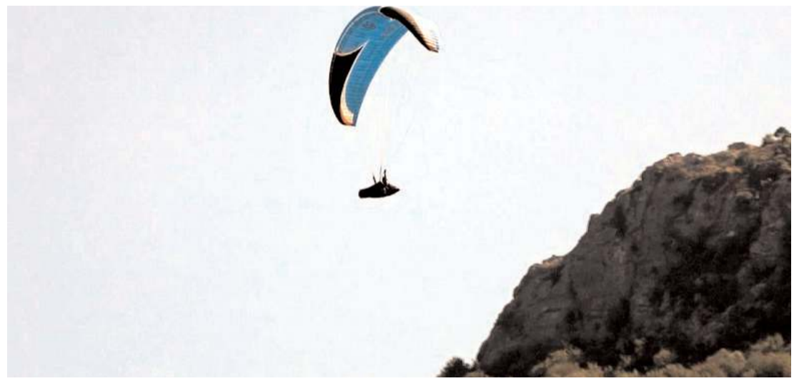
"Uluslararası Kapıkaya Doğa Sporları ve Kültür Festivali"ne Çorum'dan da katılım oldu.

Asayiş Şube Müdürlüğü'ne bağlı Aranan Şahıslar Büro Amirliği ekipleri tarafından 19-26 Temmuz tarihleri arasında yapılan şok uygulamalar ile şüpheli ve ihbar üzerine yapılan çalışmalar sonucunda haklarında çeşitli suçlardan aranma ve kesinleşmiş hapis cezaları bulunan 10 şahıs yakalanarak, haklarında adli işlem başlatıldı. Bin 298 kişinin GBT kontrolü yapılırken, 5 adet tabanca, 2 adet tüfek ile 1 adet kuru sıkı tabanca olmak üzere toplam 8 adet silah, 77 adet fişek, 1 adet çelik yelek ile 17 adet sentetik ecza maddesi ele geçirildi. Asayiş uygulamasında da 321 araç denetlendi. (İHA)