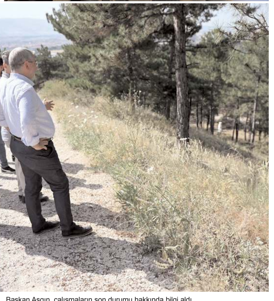
Başkan Aşgın, çalışmaların son durumu hakkında bilgi aldı.