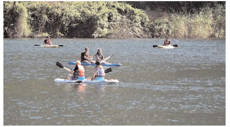
Festival boyunca su sporları da yapıldı.