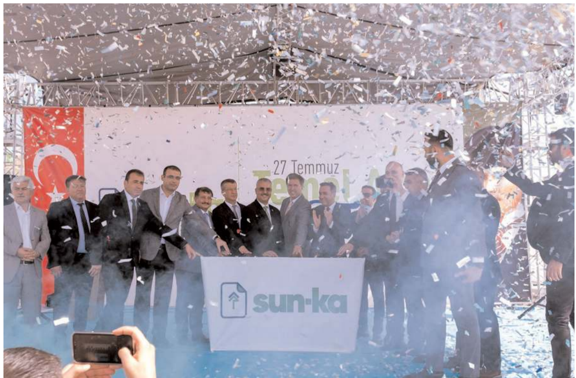
Temeli atılan tesis 25 bin metrekaresi kapalı olmak üzere toplam 45 bin 500 metrekaresine alanı sahibiz.