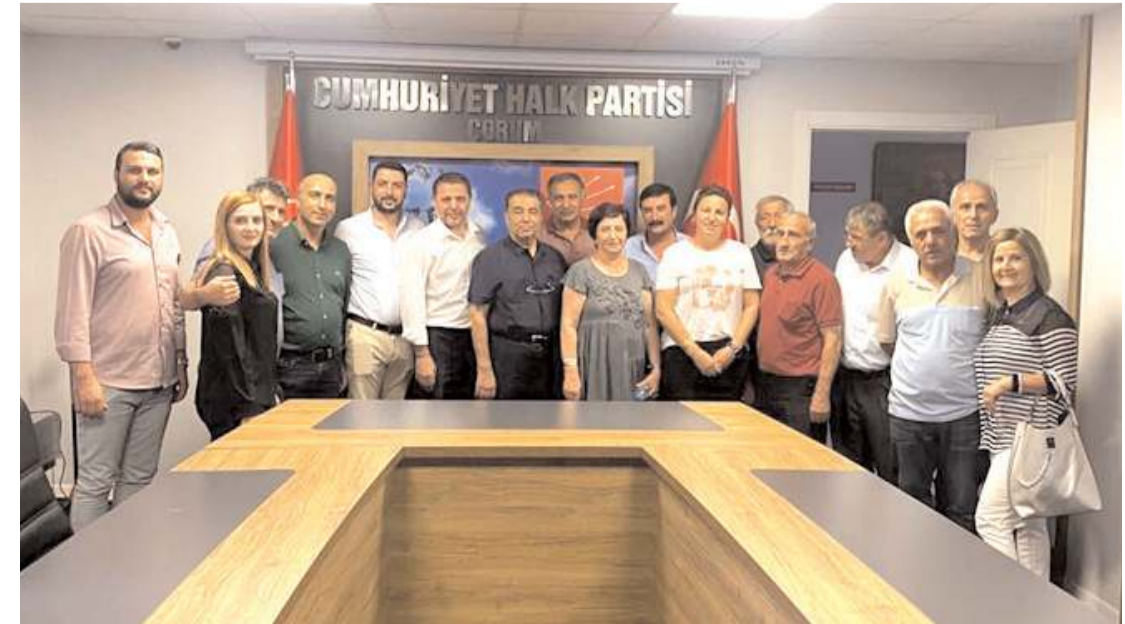
CHP'nin merkez mahallelerde delege seçimleri tamamlandı.

Çorum Belediyesi İtfaiye Müdürlüğü kayıtlarına göre 2022 yılında 181, 2023'ün ilk 7 aylık döneminde 108 anız - ot yangına müdahale ettiklerinin altını çizen Balcı, "Yakılması yasak olmasına rağmen anız yakma olayları ile çok sık karşılaşmaktadır. Anız yangınlarına karşı vatandaşları bilinçlendirmek için muhtarlarımıza ve tüm vatandaşlarımıza önemli görevler düşmektedir" şeklinde kaydetti. (Haber Merkezi)