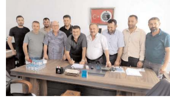
Zanaatkarlar Küçük Sanayi Sitesi Yapı Kooperatifi ile geçtiğimiz günlerde sözleşme imzalanmıştı.

■ Kırım Kongo Kanamalı Ateşi (KKKA) hastalığıyla ilgili, Amerika'dan Maryland Üniversitesi ile Hitit Üniversitesi ortak proje yapacaklar. * HABERİ 7'DE