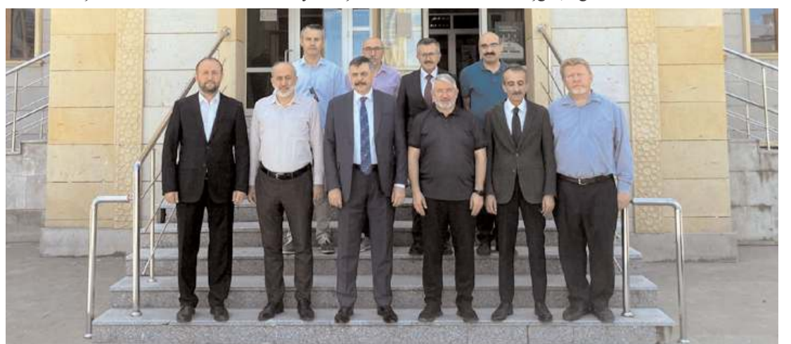
Ziyaretin sonunda hatıra fotoğrafı çekildi.