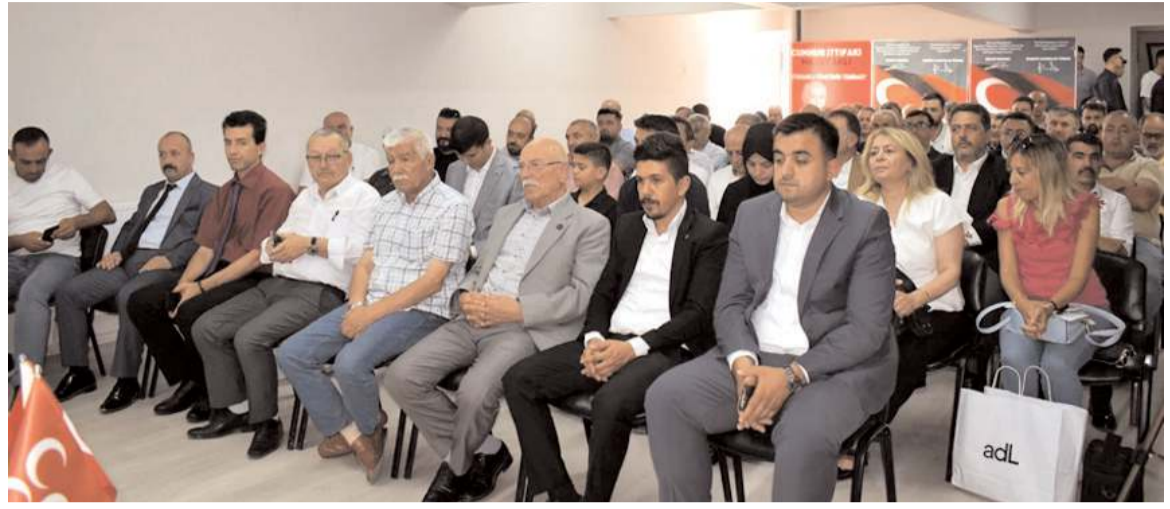
MHP il binasında devir teslim töreni yapıldı.

Keresteci esnafının yıllardır kanayan yarası olan taşınma problemini çözülmesi esnaf tarafından sevinçle karşılandı. (Haber Merkezi)