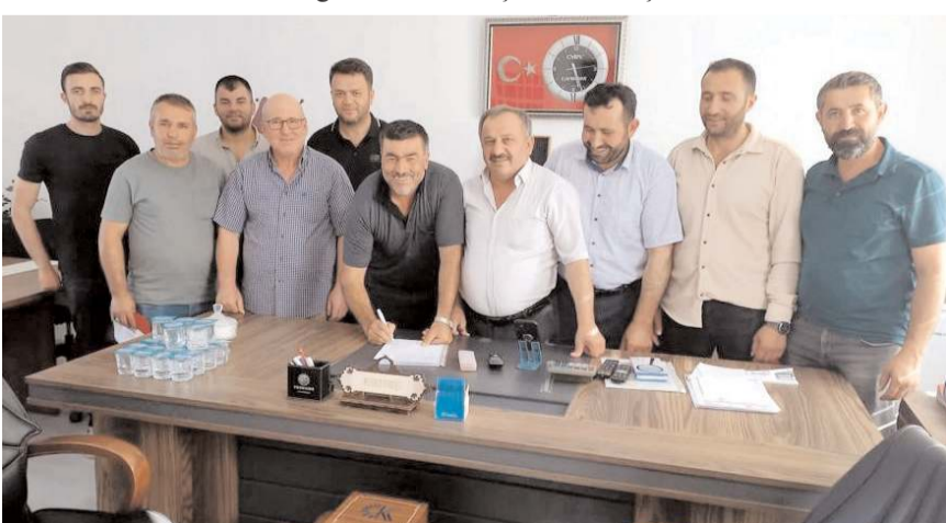
Zanaatkarlar Küçük Sanayi Sitesi Yapı Kooperatifi ile geçtiğimiz günlerde sözleşme imzalanmıştı.