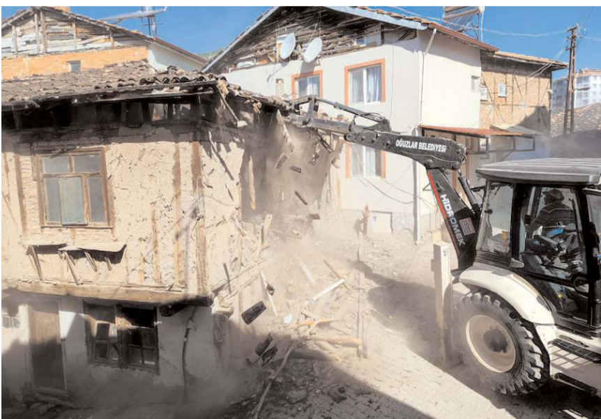
Yıkılan evlerden çıkan odunlar ihtiyaç sahiplerine dağıtılıyor.

Oğuzlar'da belediye ekiplerince yıkılan metruk evlerden çıkan odunlar, yakacak olarak kullanılmak üzere ihtiyaç sahiplerine dağıtılıyor.