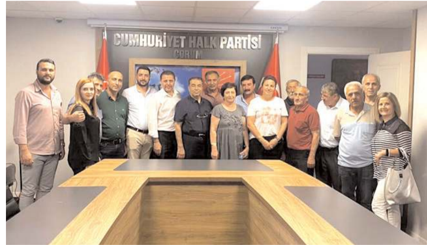
CHP'nin merkez mahallelerde delege seçimleri tamamlandı.