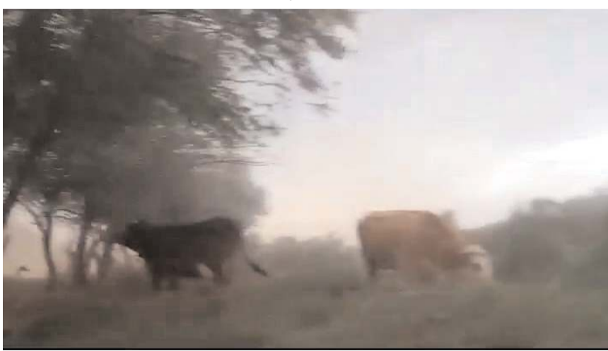
Kum fırtınasına arazide yakalanan şahıs zor anlar yaşadı.