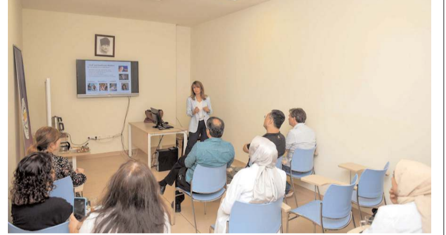
Ziyarette Kırım Kongo Kanamalı Ateşi hastalığıyla ilgili bilgi ve deneyimleri paylaşıldı.