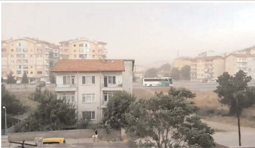
Kum fırtınası hayatı olumsuz etkiledi.

Bahçelievler Mahallesi'nde bulunan bir sitenin bahçesindeki parkta oyun oynayan çocuklar ise, kum fırtınasının başlamasıyla birlikte çığlık atarak evlerine doğru koşarak uzaklaştılar. (İHA)