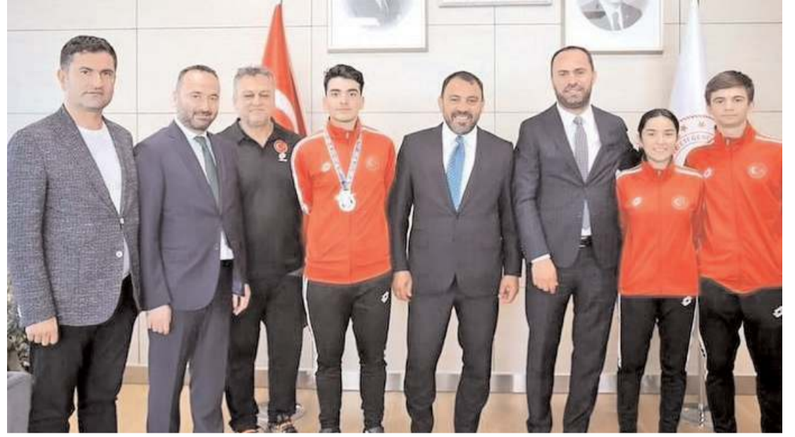
Milli takım kafilesi Bakan Yardımcısı Hamza Yerlikaya'ya ziyaretinde bir arada

Bak ve Yerlikaya ise milli takımı başarısından dolayı tebrik ederek önümüzdeki şampiyonalarda da bu başarıların artırarak devam ettirmelerini diledi.