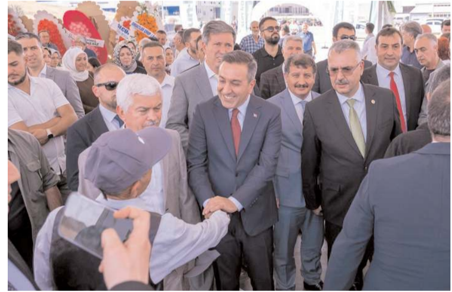
Fabrikada mevcut iş gücüne ilaveten 125 kişi istihdam edilecek.