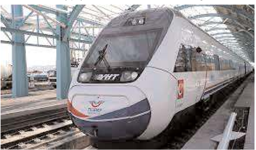
Demiryolu projesinin ne zaman hayata geçirileceği merakla bekleniyor.