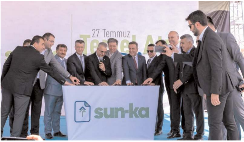
Yapılan duanın ardından temel atıldı.

Türkiye'nin ikinci büyük gri karton üretim tesisinin temeli Sungurlu Organize Sanayi Bölgesi'nde (OSB) düzenlenen törenle atıldı. Fabrika sayesinde 2 milyon 500 bin ağaç kesilmekten kurtulacak. Sungurlu'nun önde gelen firmalarından SUN-KA, Sungurlu OSB'ye 45 bin 500 metrekaresine kapalı alan gri karton üretimi yapacak Türkiye'nin ikinci büyük tesisini kuruyor.