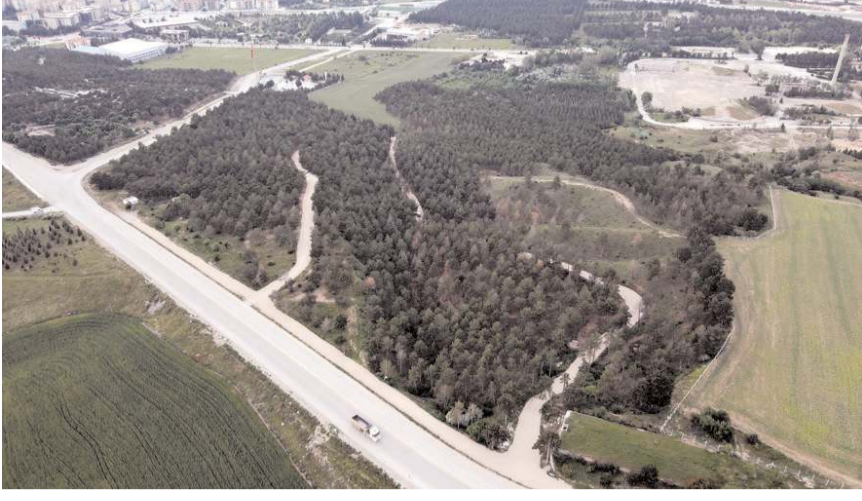
Çorum Belediyesi'nin Bahabey Çamlığı'nda yürüttüğü çalışmalar tamamlandı.

■ Çorum Belediyesi'nin Bahabey Çamlığı'nda yürüttüğü çalışmalar tamamlandı. Çorum Belediye Başkanı Dr. Halil İbrahim Aşgın, projeye eko-turizm alanına dönüşen Bahabey Çamlığı'nın halkla kapalı olan kısmının da 10 Ağustos'ta hizmete açılacağı müjdesini verdi. * HABERİ 3'TE