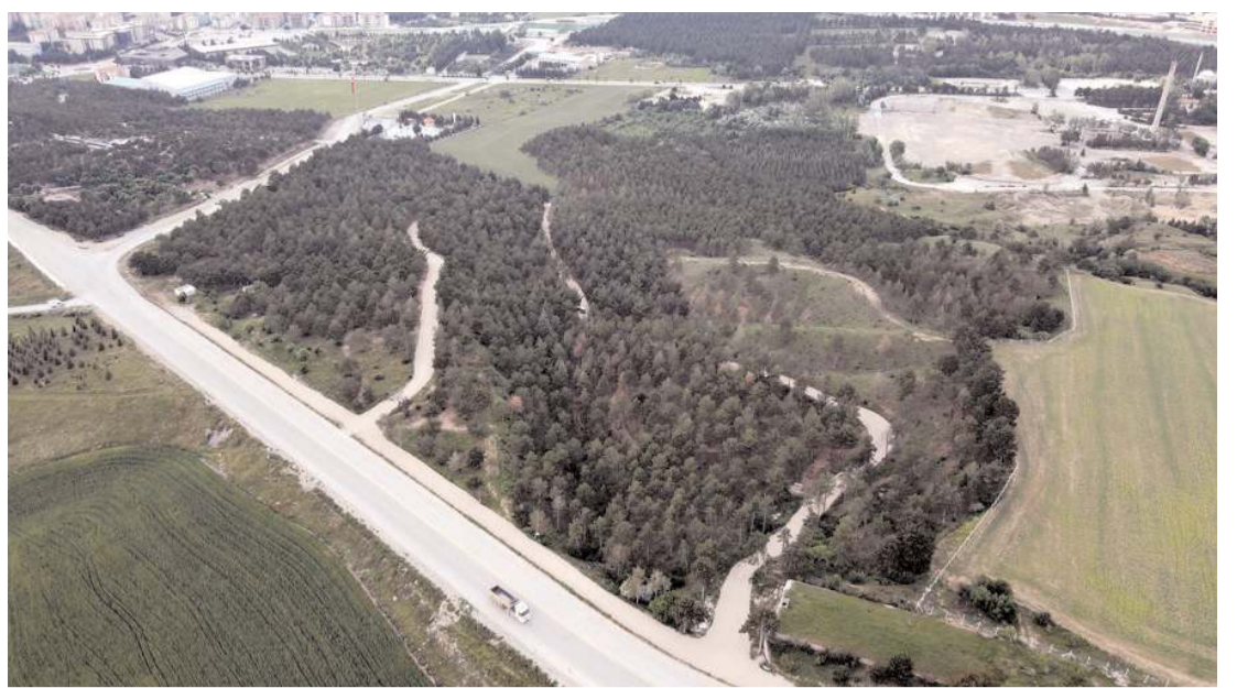
Çorum Belediyesi'nin Bahabey Çamlığı'nda yürüttüğü çalışmalar tamamlandı.

Balaban tedavisinin ardından taburcu edilirken, sağlık durumunun iyi olduğu öğrenildi.