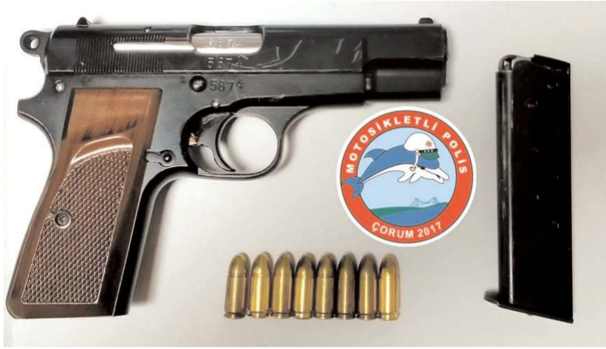
Yapılan aramalarda silahlarda ele geçirildi.