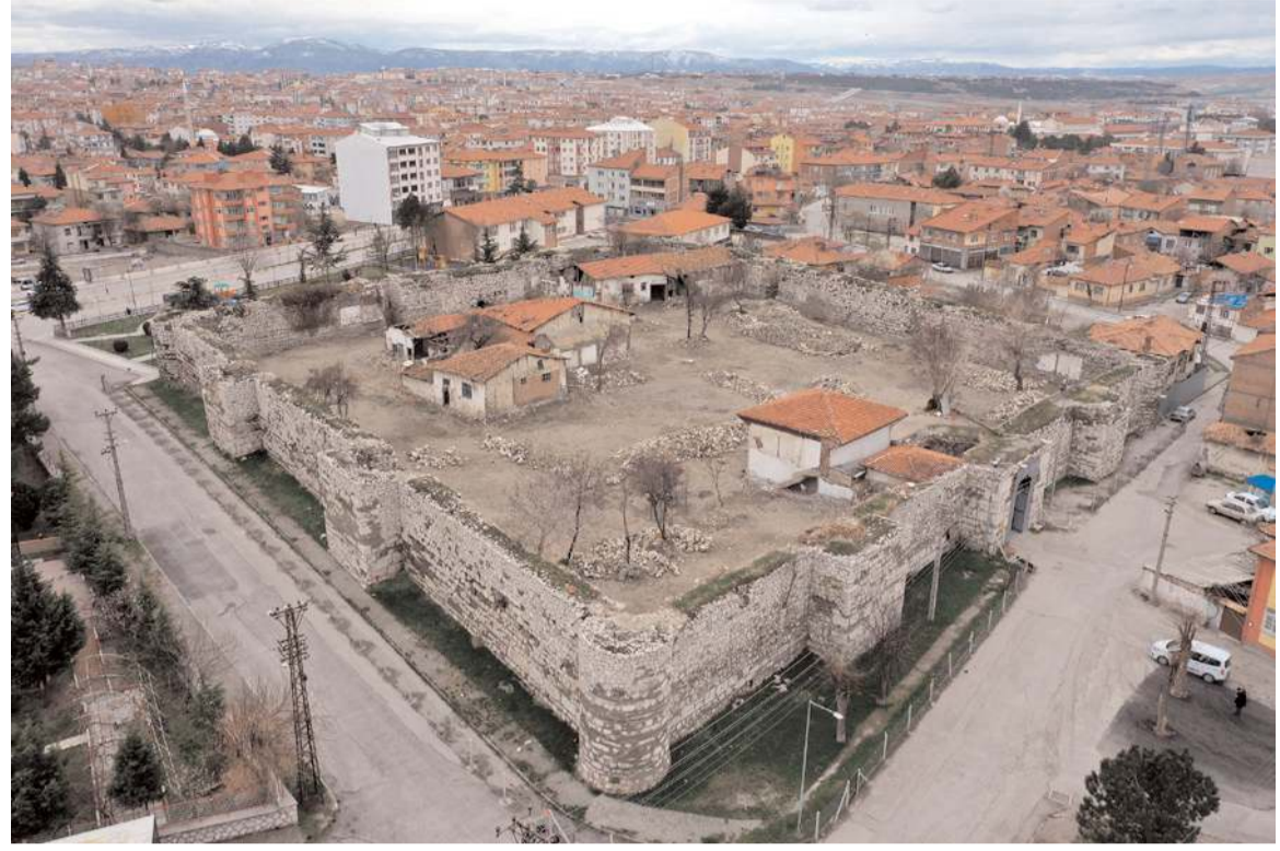
Proje kapsamında Kale'nin bedenleri restore edilecek.