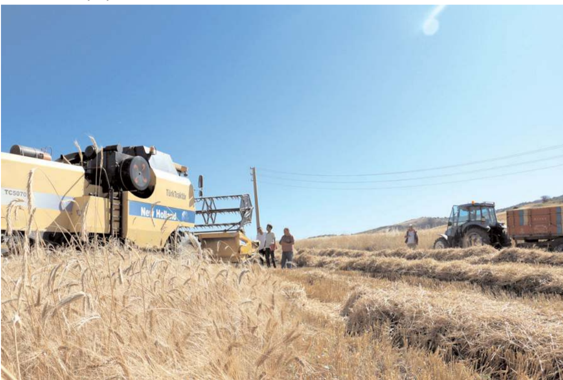
Denetimlerle biçerdöverlerde hasat sırasında dane kaybının azaltılması hedefleniyor.

yoruz. Tüm çiftçilerimizle bereketli bir hasat dönemi diliyorum." dedi.(AA)