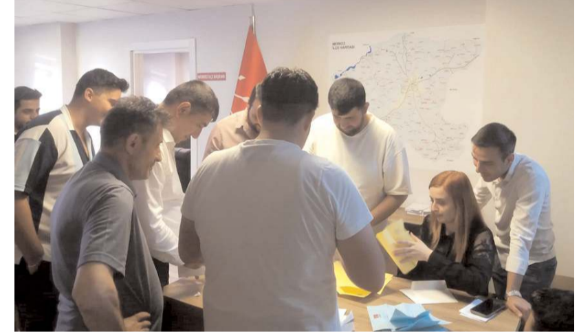
Merkeze bağlı köylerdeki delege seçimleri ise 28 Temmuz Cuma günü başladı.

toplam 30 delege kazanırken, Ulaş Tokgöz'ün çıkardığı mavi liste ise Mimar Sinan ve Karakeçili'de birer, Gülabibey Mahallesi'nde ise 12 olmak üzere 14 delege kazandı.