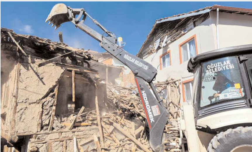
Oğuzlar Belediyesi ilçede ki metruk evleri yıkıyor.