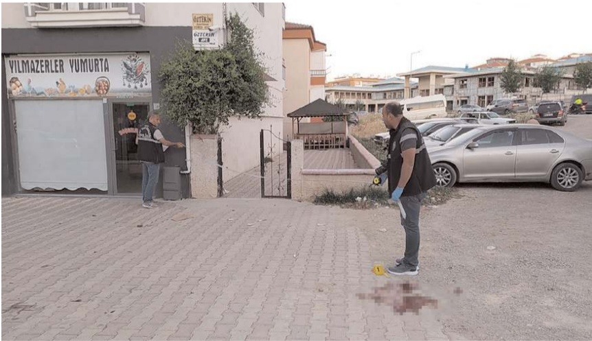
Polis ekipleri olay yerinde incelemede bulundu.

Çorum'da meydana gelen silahlı kavga bir kişi bacağından vurularak yaralandı.