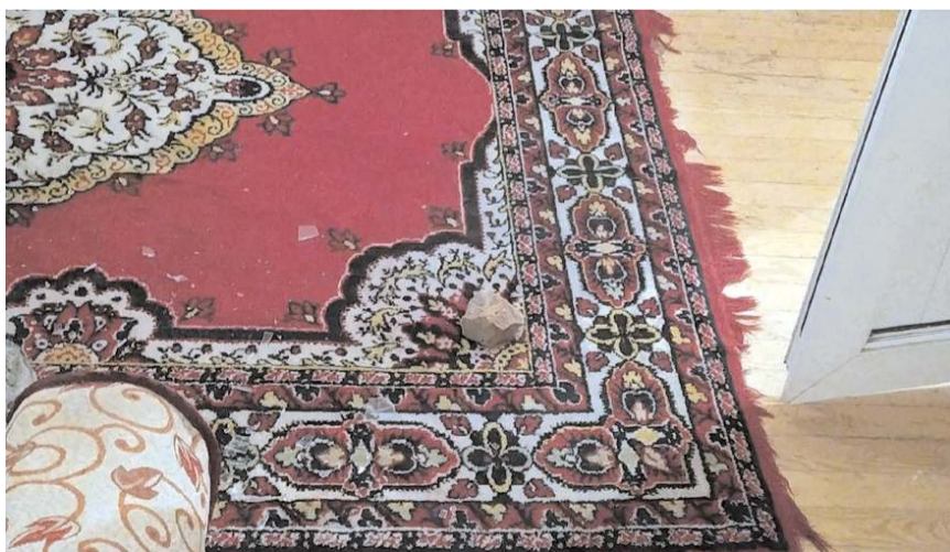
Şüphelilerin attıkları taşlar evin içine düştü.

Çorum'da kimliği belirsiz kişilerce 78 yaşındaki kadının evinin camları taşla kırıldı.