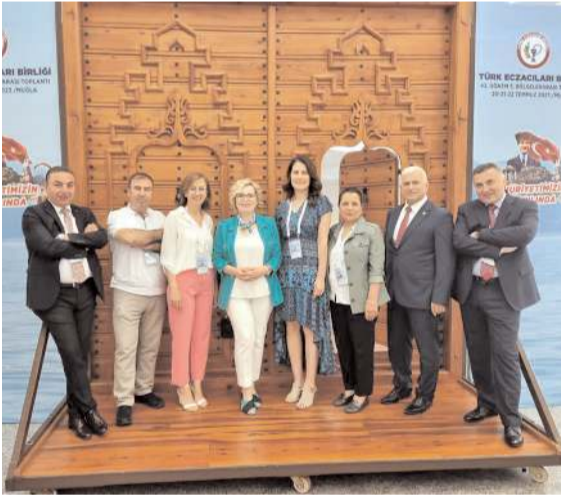
Toplantıya katılan Çorum Eczacı Odası heyeti.