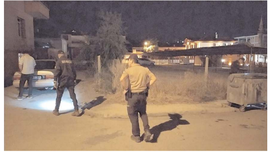
Polis ekipleri olay yerinde inceleme yaptı.