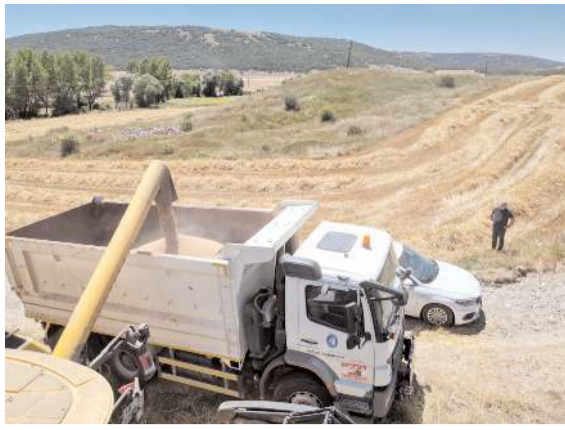
Belediye 80 dönümlük araziden buğday hasadı yaptı.