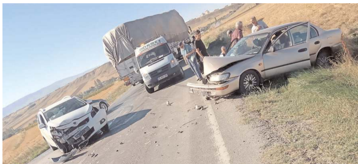
Kaza, Karacaköy yol ayrımında meydana geldi.

Operasyonda gözaltına alınan şüpheli, ifadesi alınmak üzere emniyete götürüldü.(AA)