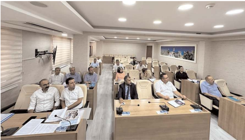
Toplantıya İl Özel İdaresi'nin birim müdürleri katıldı.