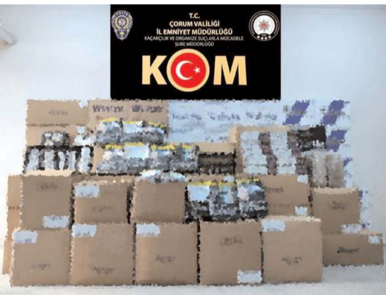
Operasyonda 390 bin dolu makaron ele geçirildi.

Çorum'da 390 bin makaron (filtreli sigara kağıdı) ile tütün ele geçirildi.