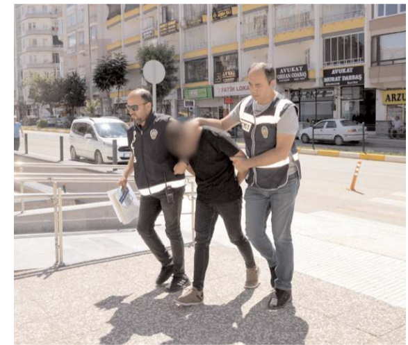
Çocuk yaşta dolandırıcıyı çıkartıldığı, mahkeme tarafından tutuklandı.