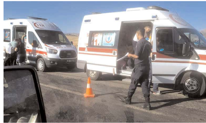
Jandarma ekipleri olay yerince inceleme ayptı.

Yaralılar, sağlık ekiplerince hastaneye kaldırılarak tedavi altına alındı.