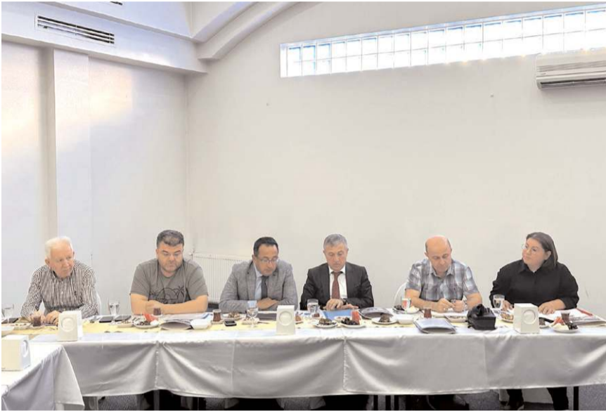
Toplantı Hitit Uygulama Otelinde yapıldı.