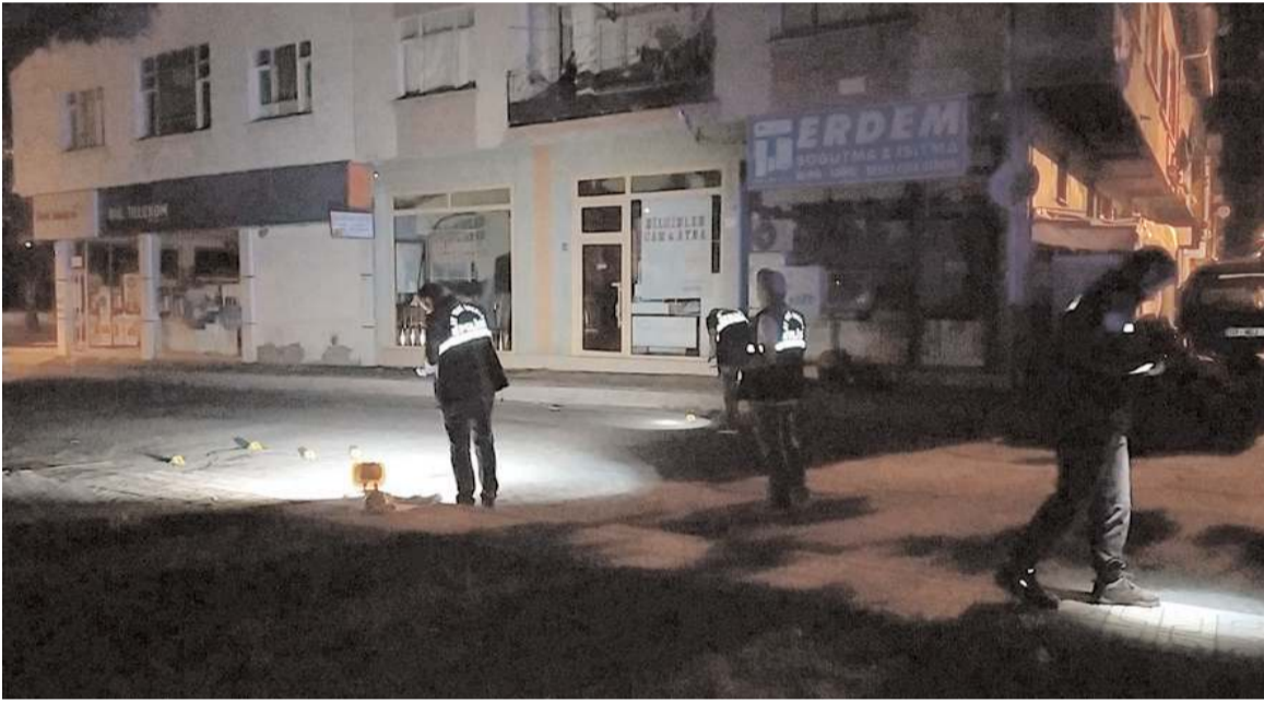
Polis ekipleri olay yerinde inceleme yaptılar.

Çorum'da faaliyet gösteren bir dernek binasına, gece saatlerinde pompalı tüfekle ateş açıldı.