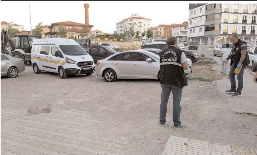
Olay, Gülabibey Mahallesi Bağcılar 4. Caddede meydana geldi.