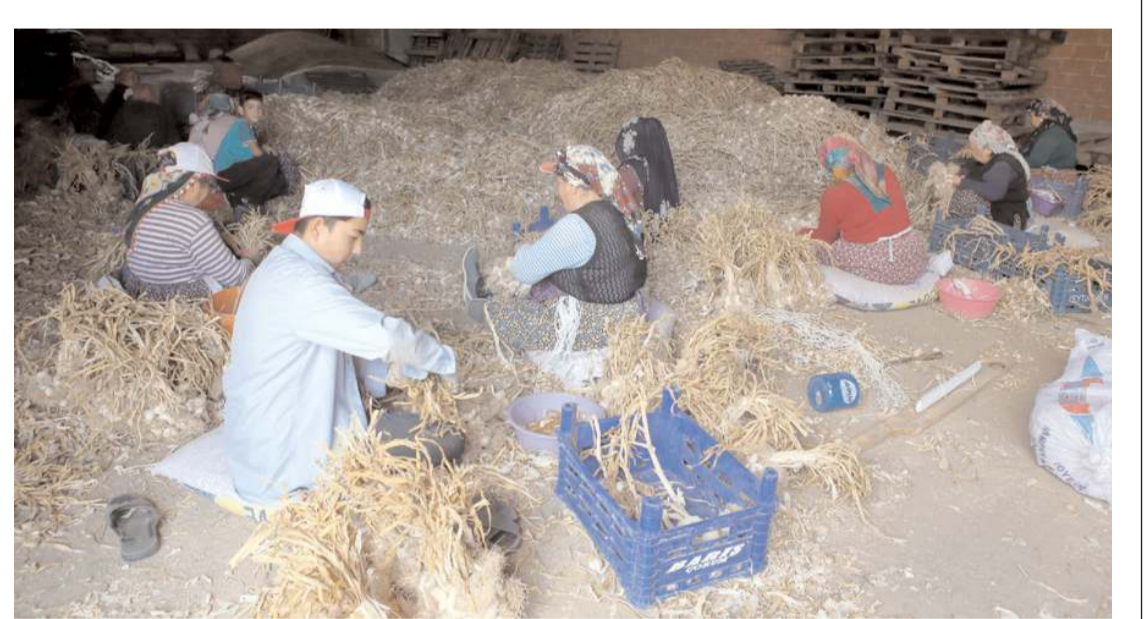
Üyük köyünde yetişen sarımsak keskin aromasıyla öne çıkıyor.