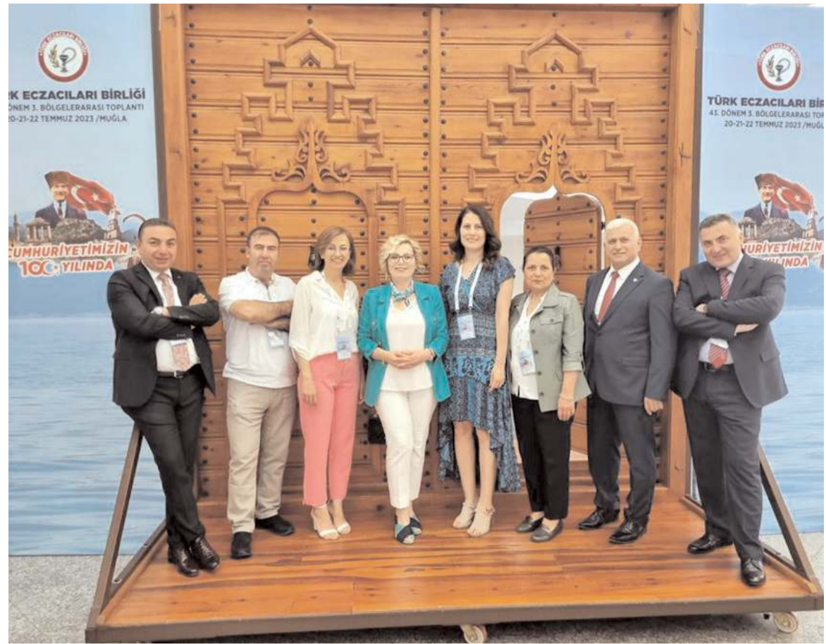
Toplantıya katılan Çorum Eczacı Odası heyeti.

4- Ülkemizde Eczacılık fakültesi sayıları ve kontenjanları her geçen gün artmaktadır. Uluslararası standartlarda eczacılık eğitiminin sağlanması için fakültelerin akademik kadroları gözden geçirilmeli ve mevcut fakültelerin durumu değerlendirilerek, Ar-Ge merkezlerine dönüştürülmelidir. Eczacılık fakültelerine giriş için başvuru sıralaması 50.000 ile