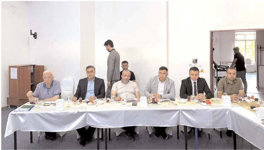
Toplantıda devam eden yada hayata geçirilecek olan yeni projelerin son durumu konuşuldu.