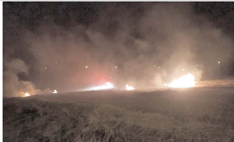
Yangın, Bahçelievler Mahallesi Dumlupınar 56. Sokak üzerinde çıktı.

İtfaiye ekiplerinin hızlı müdahalesi ile yangın büyümeden kontrol altına alınarak söndürüldü. (İHA)