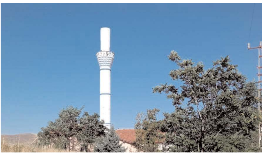
Olay Kavşut köyünde meydana geldi.

Kavşut köyünde etkili olan fırtına caminin minaresinin külâhını yıktı. Yıkılan minarenin külâhı büyük bir gürültü ile çatıya düşerken, o sırada camide cemaatin bulunmaması yaşanabilecek bir faciayı önledi.