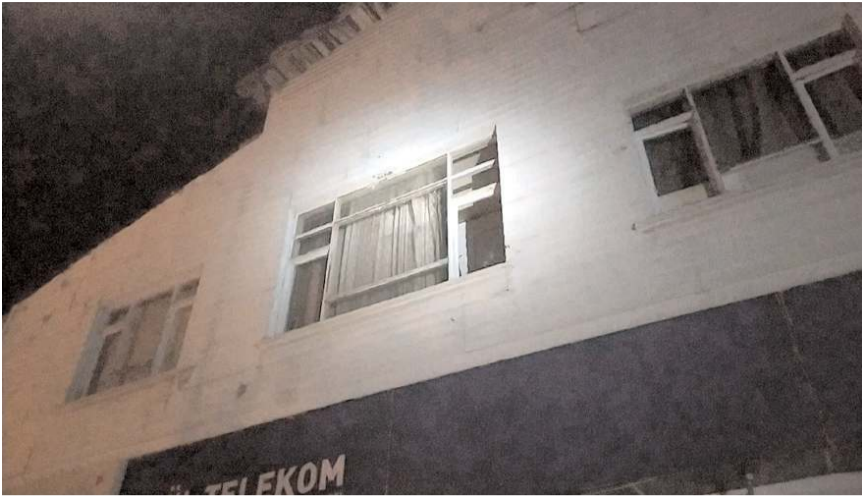
Olay, Gülabibey Mahallesi Sanayi 1. Sokak'ta meydana geldi.