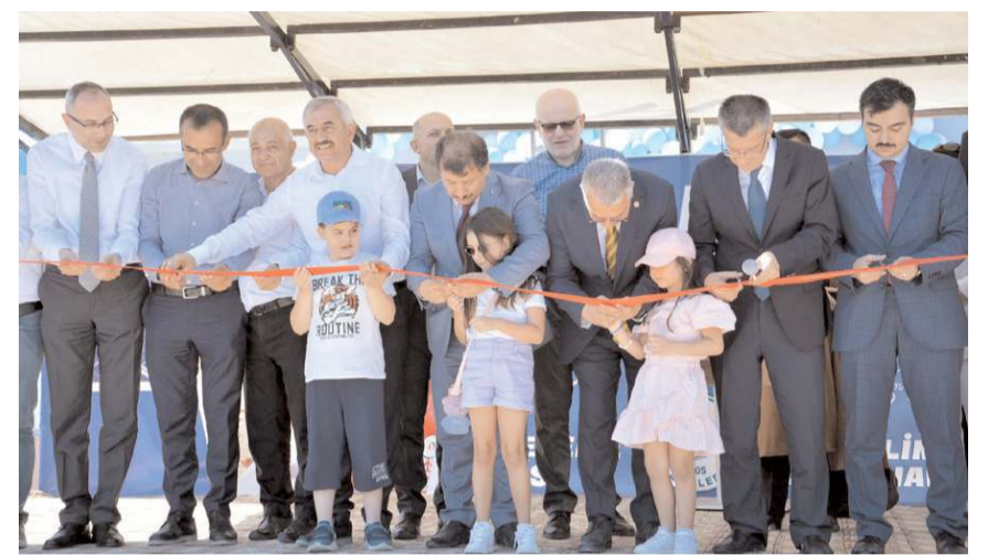
Tesislerin açılış kurdelesi protokol üyeleri tarafından kesildi.

Saygı duruşunda bulunulması, akabinde ise İstiklal Marşı'nın okunmasıyla başlayan programda protokol konuşmaları gerçekleştirildi. Daha sonra Yarı Olimpik Yüzme Havuzu, Güneş Enerji Santrali, Soğan Eleme Tesisi ve Battal Dede Millet Bahçesi yerinde incelendi.