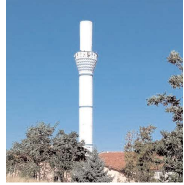
Olay Kavşut köyünde meydana geldi.