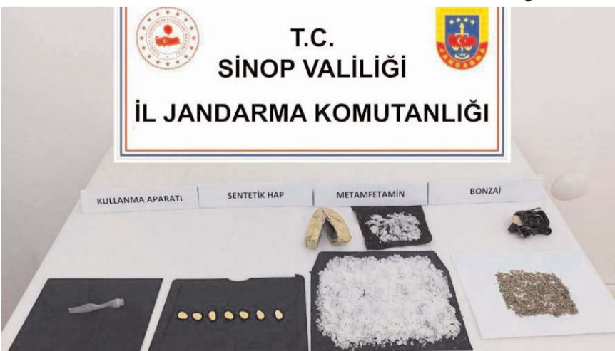
Araçta yapılan aramada çok miktarda uyuşturucu madde ele geçirildi.

Sinop-Çorum karayolu üzerinde bir araçta yapılan aramada uyuşturucu ele geçirildi.