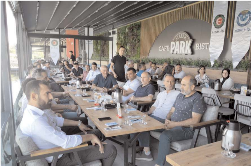
İskele Park'ta yapılan toplantıda sendikal çalışmalar değerlendirildi.