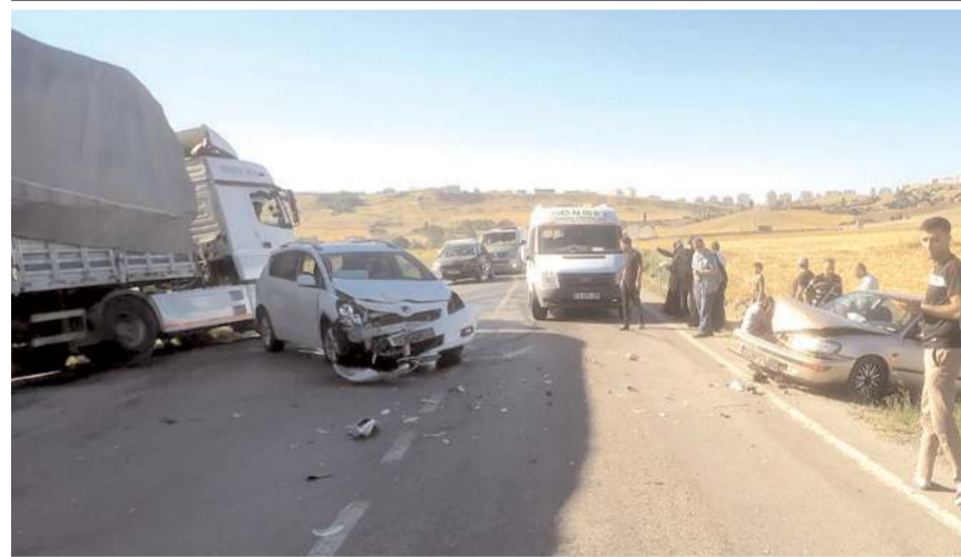
Kazada her iki araçta da maddi hasar meydana geldi.

■ Çorum-Ortaköy yolunda meydana gelen trafik kazasında iki kişi yaralandı. Kaza, Karacaköy yol ayrımında meydana geldi.