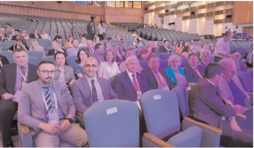
Toplantı Muğla Sıtkı Koçman Üniversitesi Atatürk Kültür Merkezinde yapıldı.