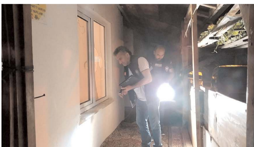
Olay, Bahçelievler Mahallesi Dumlupınar 58. Sokak üzerinde meydana geldi.