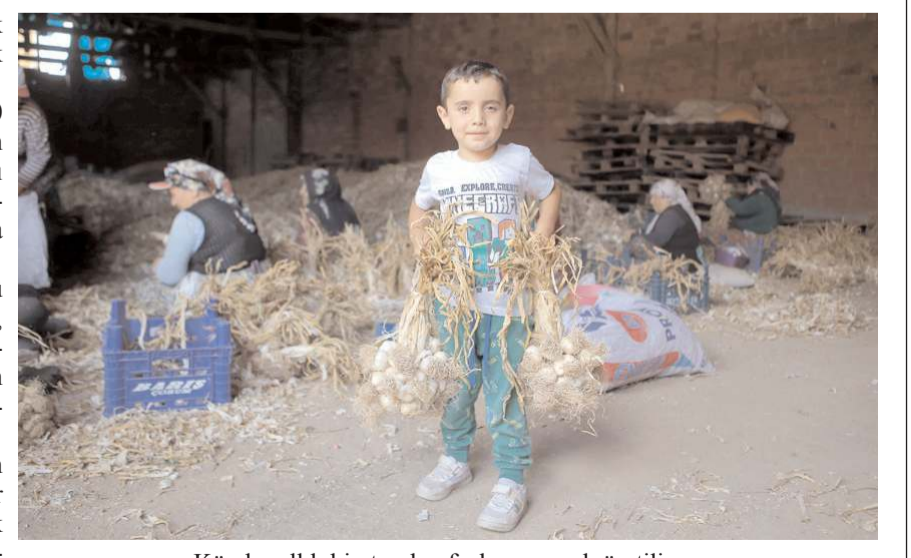
Köyde yıllık bin tondan fazla sarımsak üretiliyor.

Üyük köyünde yetiştirdikleri sarımsağın kes-