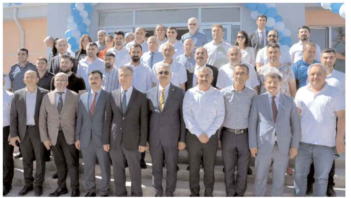
Alaca Belediyesi tarafından hayata geçirilen projeler için açılış töreni yapıldı.

Çorum'u modern yollarla buluşturacaklarını söyleyen Ahlatcı, "Halkımızın güvenli ve modern yollarla ulaşımını sağlamak, su kaynaklarını etkin ve verimli bir şekilde yönetmek için işbirliği içinde çalışıyoruz" açıklamasında bulundu.