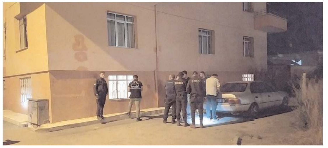
Olay, Kale Mahallesi meydana geldi.

Olayı gerçekleştiren kişi ya da kişilerin yakalanması için çalışma başlatıldı. (İHA)