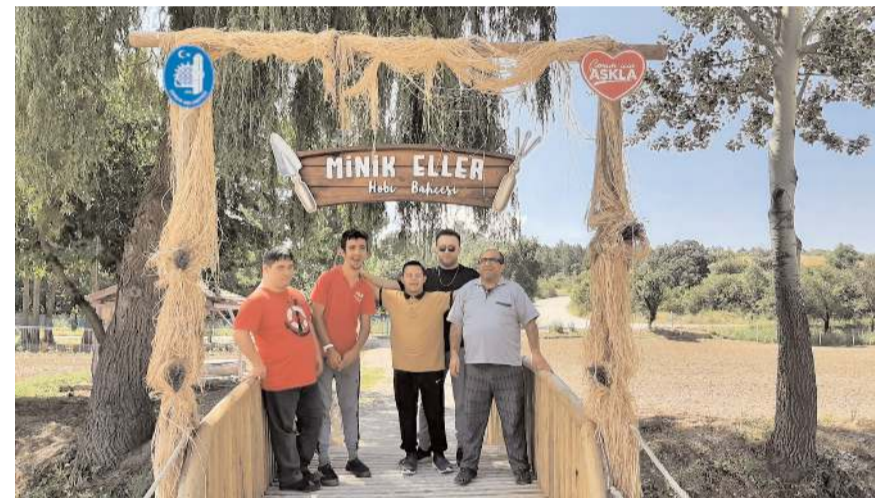
Gençler bol bol hatıra fotoğrafı çekindiler.

Etkinliklere katılan öğrenciler doyusya eğlendikleri bir gün geçirirken etkinlik aralarında ikramlar da unutulmadı. Açık hava etkinliğine katılan gençlere pamuk şekere, meyve suyu ve kek ikram edildi. (Haber Merkezi)