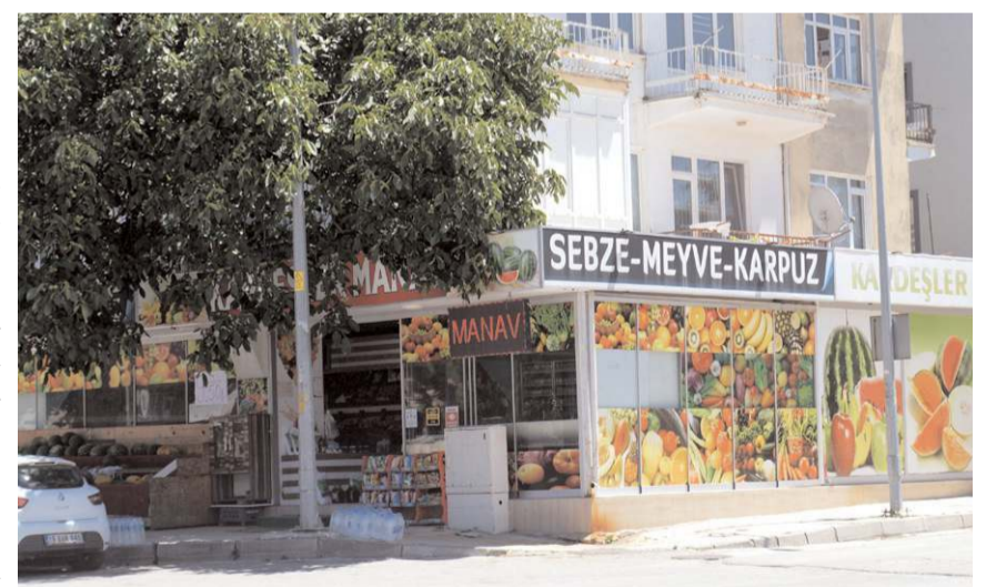
Kardeşler Manavı'nın ikinci şubesi Alaeddin Cami karşısında bulunuyor.