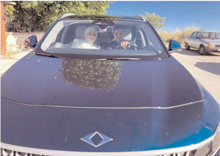
Belediye Başkanı Halil İbrahim Aşgın'ın makam aracı TOGG, gelin arabası oldu.

Belediye Başkanı Halil İbrahim Aşgın da genç çifte bir ömür boyu mutluluklar dileyerek; "TOGG ilk kez bir gelin ve damatla buluştu. Çok da yakıştı. Gençlerimize bir ömür mutluluklar diliyorum." dedi.