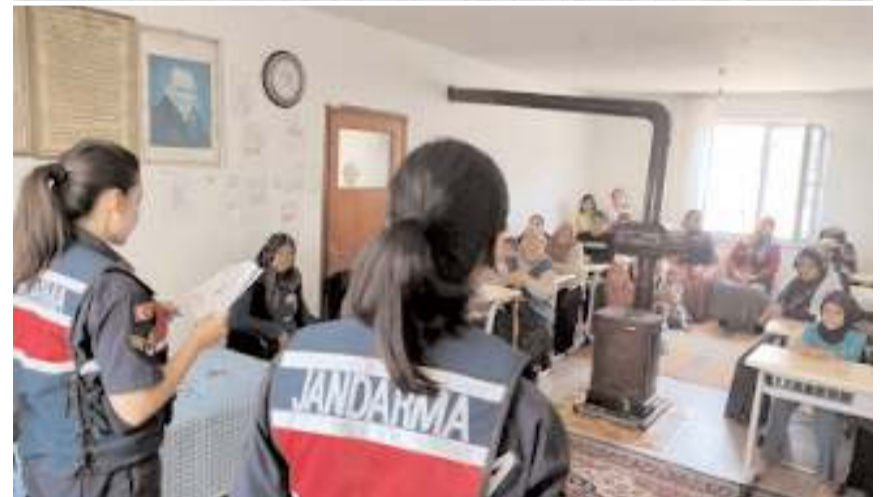
Toplantılarda Kadın Acil Destek (KADES) Uygulaması hakkında bilgi verildi.