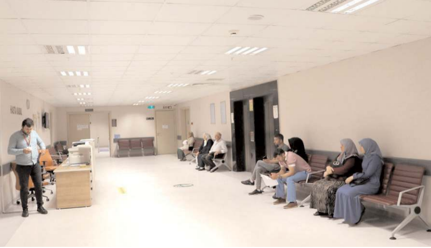
Merkeзде Çorum'dan da tedavi olmak için gidenler var.