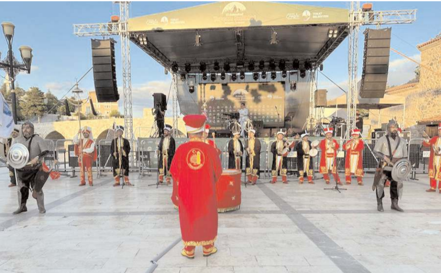
Şenliklere Çorum Belediyesi Mehter Takımı renk kattı.

Ordu ve Tokat Halk Oyunları ekiplerinin sahne aldığı etkinliklerde, Tokat'ın meşhur Omuz Halayı da sergilendi. Halk oyunları ekibinde bulunan