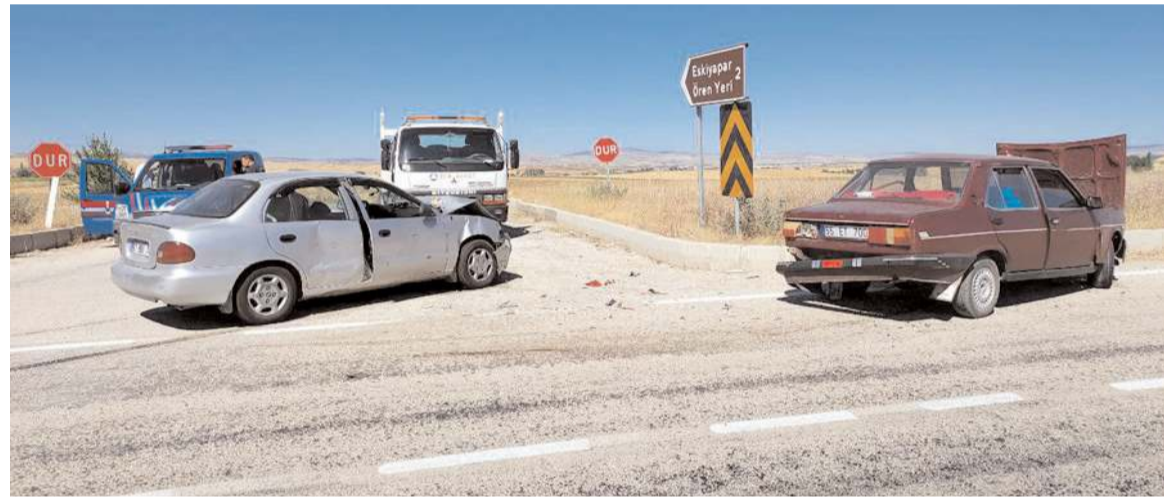
Kaza Ankara-Tokat kara yolu Perçem köyü yakınlarında meydana geldi.