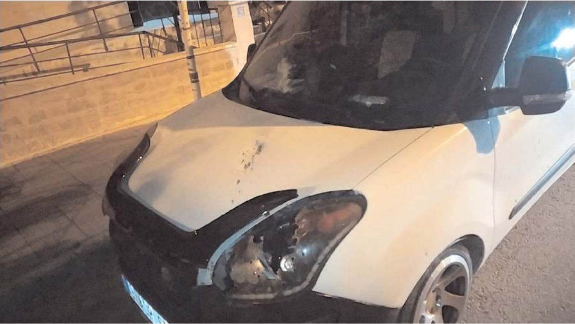
Saldırı sonrasında otomobilde maddi hasar meydana geldi.

Turna, dokuz gündür tedavi gördüğü hastanede müdahaleye rağmen kurtarılamadı.(AA)