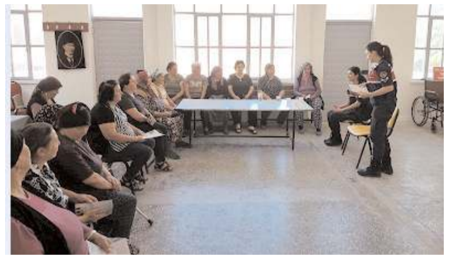
Toplantılarda kadına yönelik şiddetin önlenmesi amacıyla bilgilendirme yapıldı.

Etkinlikte, 'Şiddete Sıfır Tolerans' prensibiyle, şiddet veya şiddet tehdidinin önlenmesi amacıyla Jandarmanın 7/24 görevde olduğu vatandaşlara hatırlatıldı. (Haber Merkezi)