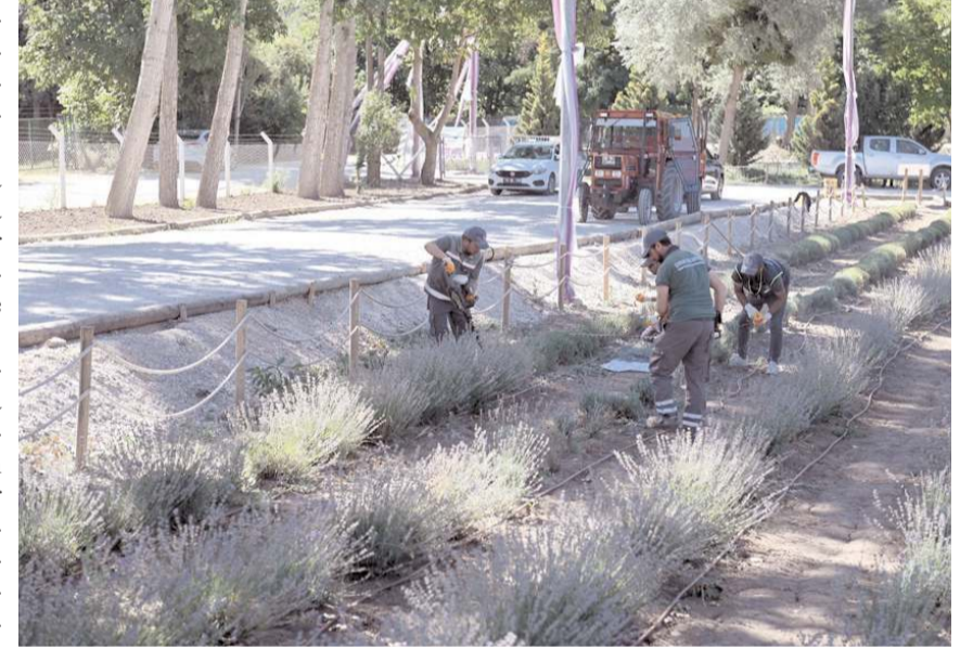
Lavanta hasadını belediye ekipleri yaptı.