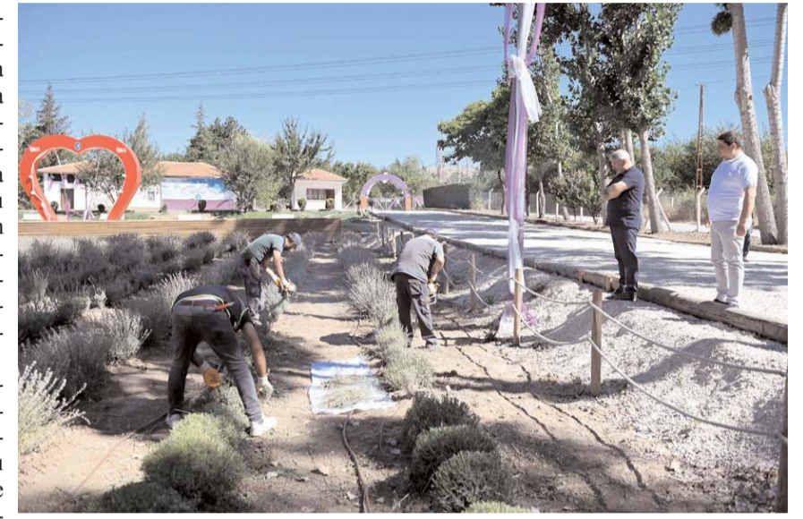
Solun lavantalar dün ilk kez hasat edildi.

Başkan Aşgın, hasadı yapılan lavantaların Kadın Kültür Merkezlerinde sabun ve araç kokusu olarak değerlendirileceğini söyledi. Aşgın, Türkiye'ye örnek çalışmalar yaptıklarını sözlerine ekledi. (Haber Merkezi)