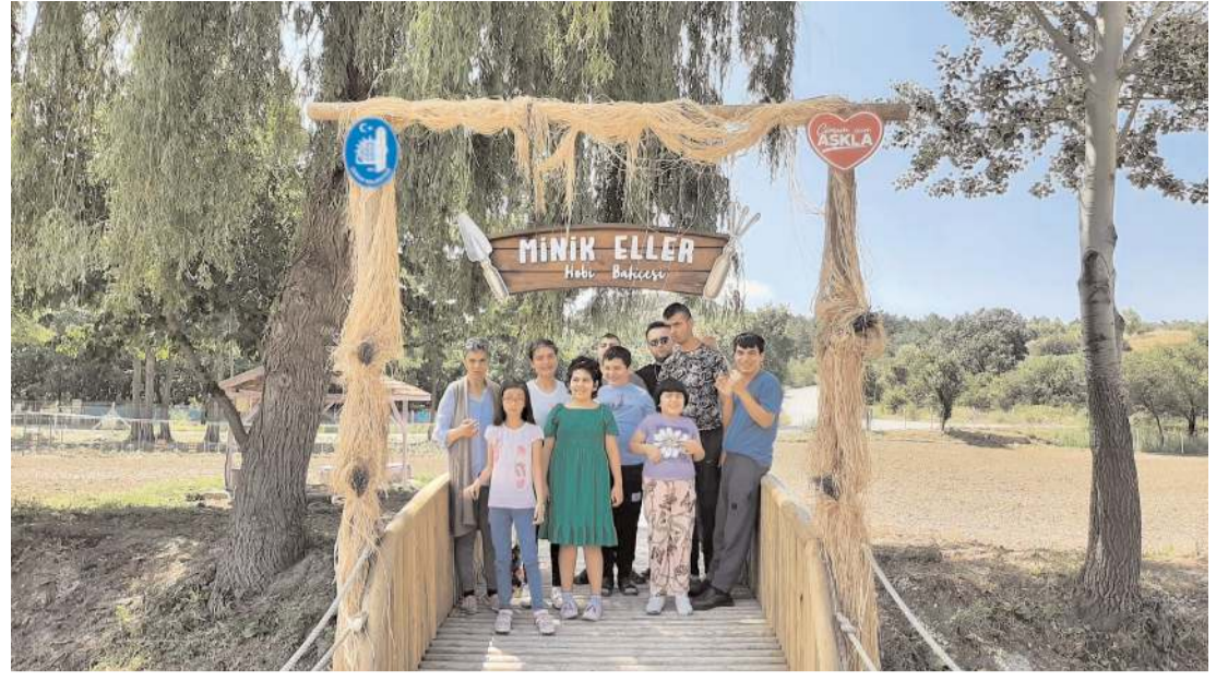
Çorum Belediyesi Engelli Eğitim ve Rehabilitasyon Merkezi öğrencileri Çomar Barajı etrafında açık hava etkinliklerine katıldı.

Sülük, "Muharem ayındaki ikramlarımızı gelecekselleştirerek inançlarımızın gereğini yerine getiriyoruz. Aşuremiz bereketli, birliğimiz daim olsun. Bu vesileyle Türk -İslam aleminin hicri yılını ve muharem ayını kutluyor, hayırlara vesile olmasını diliyorum." ifadelerini kullandı.(AA)