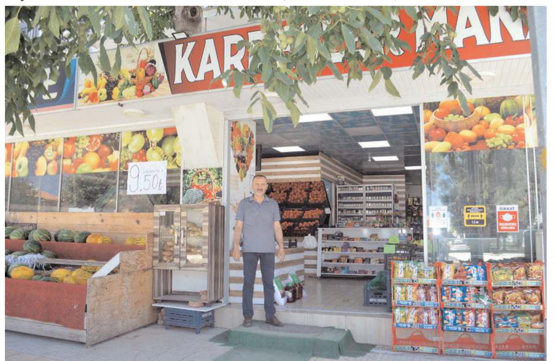
Kardeşler Manavı kaliteli ürünü uygun fiyata müşterileri ile buluşturuyor.