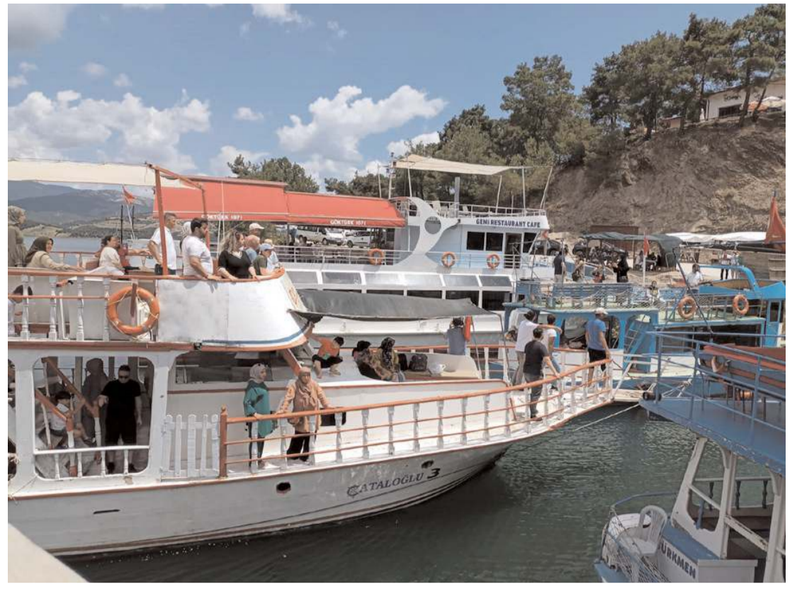
Samsun'da bulunan tabiat parklarına ilgi artıyor.