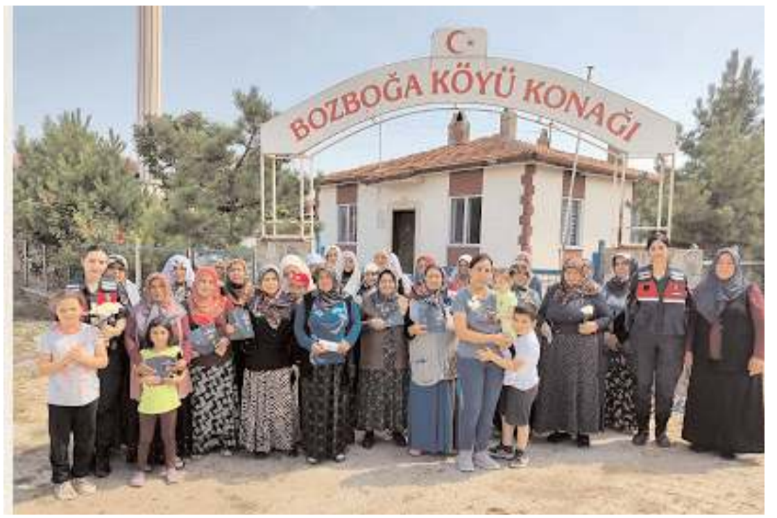
Jandarma ekipleri Eskiekin, Bozbağa, Büyükdivan köyleri ile Mecitözü'ne bağlı İbek köyünde vatandaşlarla biraraya geldi.