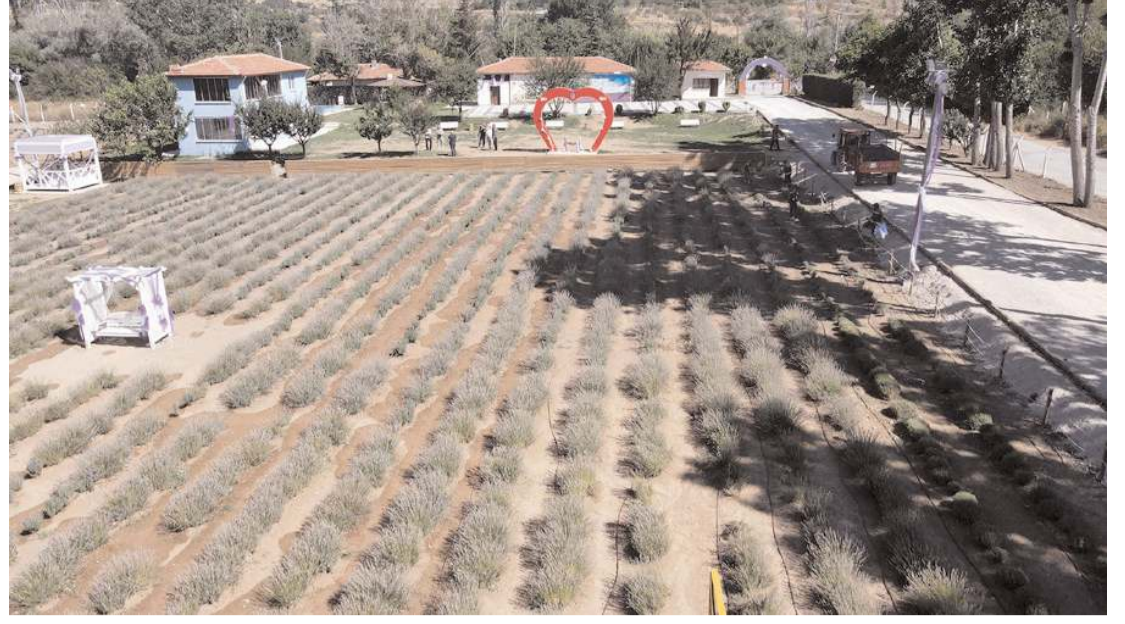
Çorum Belediyesi tarafından Çomar Barajı yanında oluşturulan Lavanta Bahçesi büyük ilgi gördü.

Çorum'un Bayat ilçesine bağlı Yoncalı (Lapa) köyü nüfusuna kayıtlı olduğu öğrenilen gencin cenazesinin Kırıkkale'de toprağa verileceği öğrenildi.