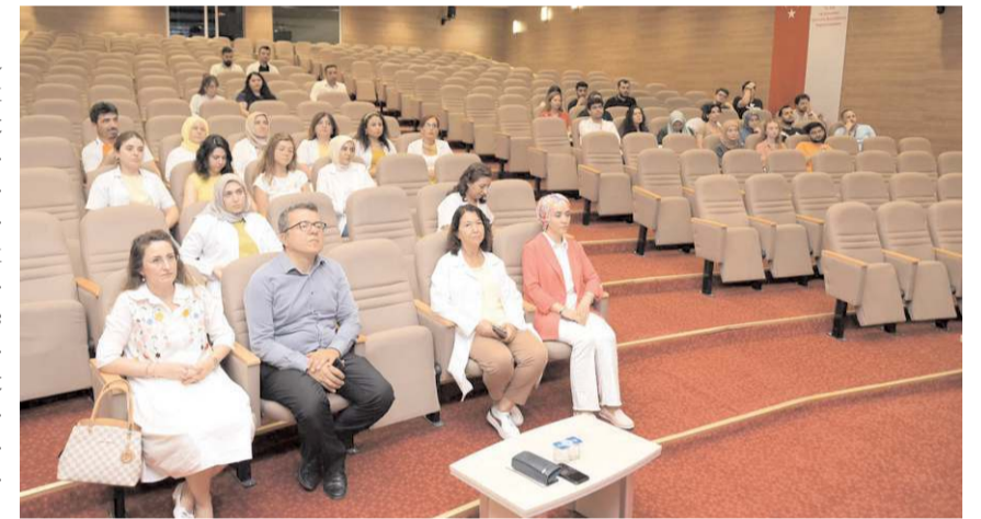
Programa sağlık personeli katıldı.