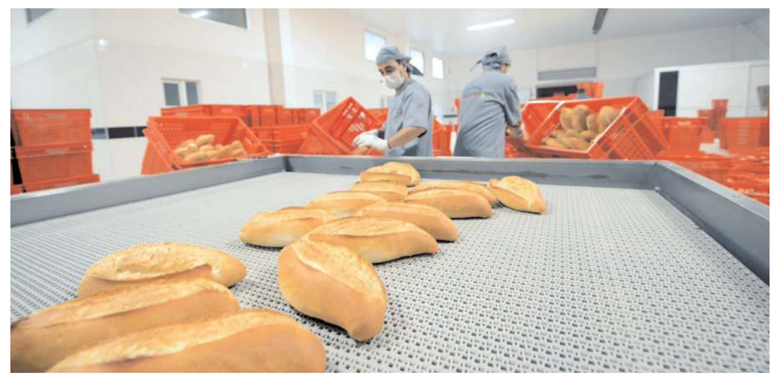
Halk Ekmek, 200 gr. ekmek fiyatını 5 TL olarak belirledi.