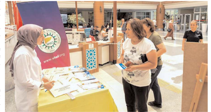
Hastanede vatandaşlara hepatit ile ilgili bilgilendirici broşürler dağıtıldı.

100'e yakındır ve hastalık bir daha tekrarlamamaktadır. Tedavi edilen hastalarda siroz ve kansere bağlı ölümler önemli ölçüde azalmaktadır. Tedavinin gecikmesi uzun dönemde maliyetleri artırmaktadır. Bugün için tedavi edilebilir bu hastalık farkındalığı arttırmak çok önemli bir hale gelmiştir. Kronik Hepatit B tedavisinde hastalar günde 1 tablet ile tedavi edilebilmekte ve hastalık kontrol altına alınabilmektedir. Ancak bu tedavi uzun yıllar hatta bazen ömür boyu devam edebilmektedir."