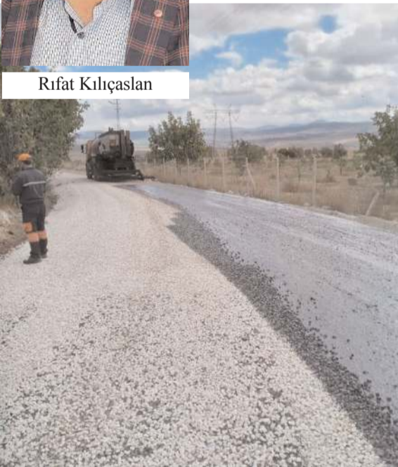
Belirli noktalarda genişletme çalışmaları yapılan 5 km'lik yola sıcak asfalt serildi.

Muhtar Kılıçaslan, yolun asfaltının atılmasında emeği geçen herkese teşekkür etti. (Haber Merkezi)