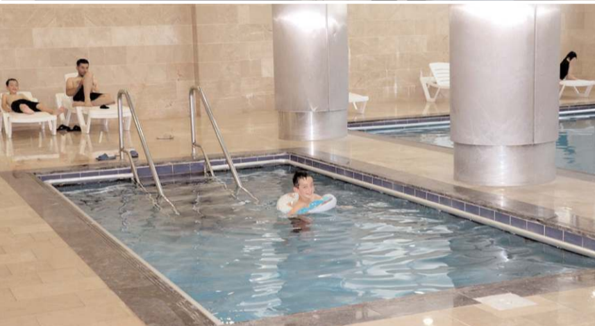
Merkeзде her türlü fizik tedavi ve rehabilitasyon hizmeti kaplıca tedavisiyle uygulanıyor.