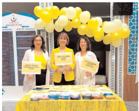
Hastanede içerisinde açılan stantlarda hepatite dikkat çekildi.