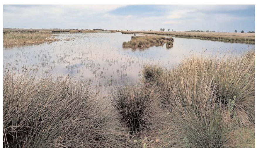
Kızılırmak Uluslararası Sulak Alanı'nı (Ramsar) 3 bin 755 kişi ziyaret etti.

Doğaya yerleştirme faaliyetlerinde de 2023'te 14 bin adet sülün Türkiye'deki birçok ilde doğaya bırakılacak. Özellikle kene vakalarının yaşanabileceği illerden Ordu, Trabzon, Rize, Zonguldak, Bartın, Giresun, Iğdır, Batman, Diyarbakır, Bitlis, Sirt ve Samsun'da 14 bin adet sülün doğaya salınacak. Öte yandan müdürlük tarafından 2023 yılına kadar Giresun, Gümüşhane, Samsun ve Çorum illerinde 83 adet kızıl geyik doğaya bırakıldı. Çorum'da ise bu yıl 4 adet kızıl geyik salını yapıldı. (İHA)