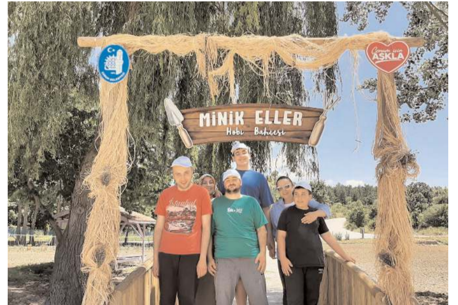
Öğrenciler lavanta bahçesini gezerek bol bol fotoğraf çekindiler.