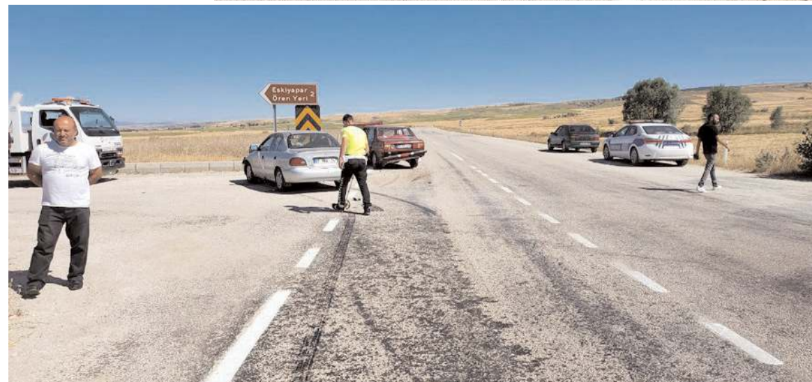
Kaza nedeniyle trafik bir süre kontrollü olarak verildi.