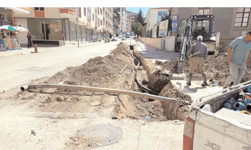
Meydan ve Erenler Mahallelerini besleyen hatta revizyon başlatıldı.

ilçenin yüksek kesimlerinde su iletiminin kısıtlı olmasından dolayı sorun yaşanan bölgelerde çalışmaların sürdüğü bildirildi.