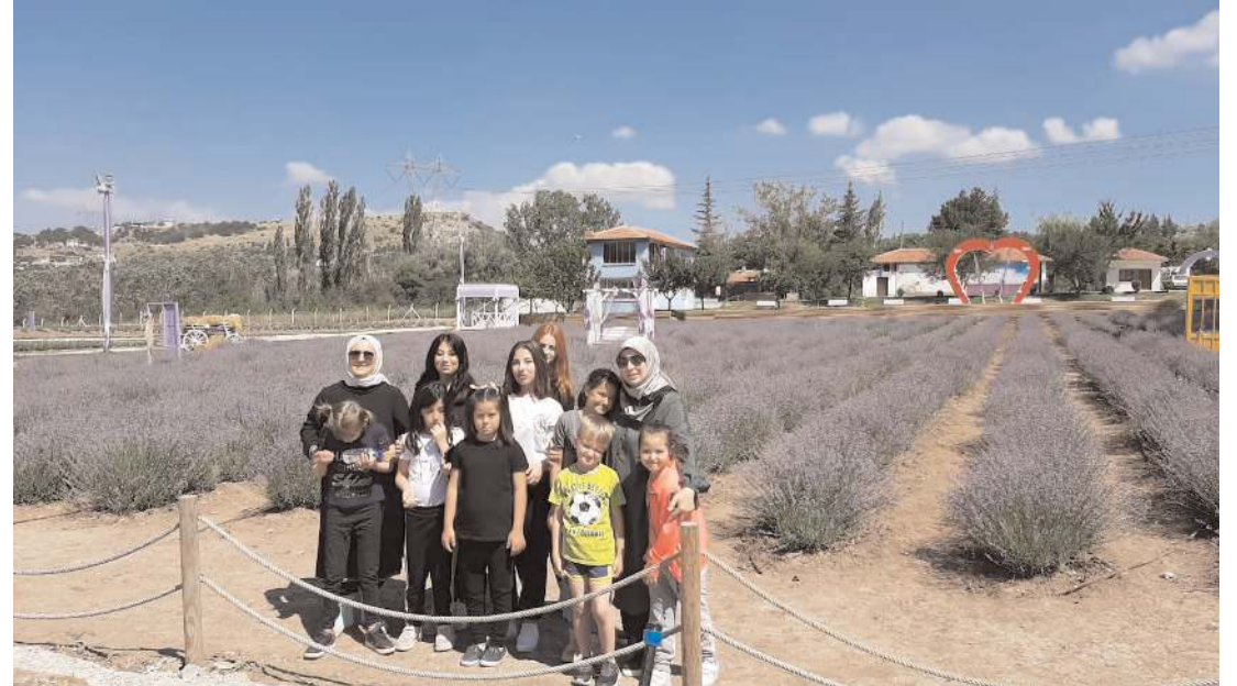
Öğrenciler lavanta bahçesini gezerek bol bol fotoğraf çekindiler.