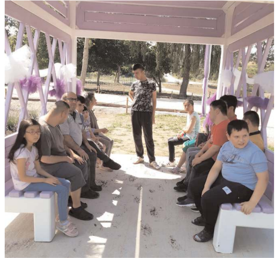
Engelli Eğitim ve Rehabilitasyon Merkezi öğrencileri güzel bir gün geçirdi.