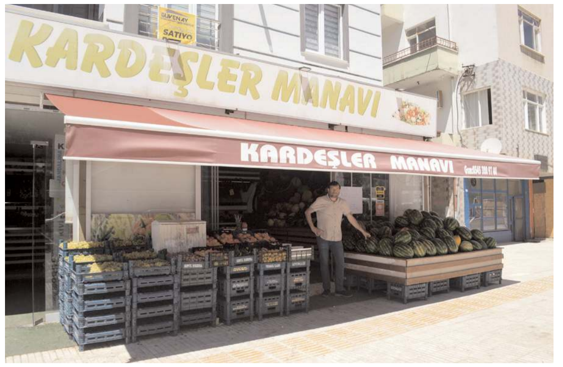
Kardeşler Manavı Cemilbey Caddesi Şubesi