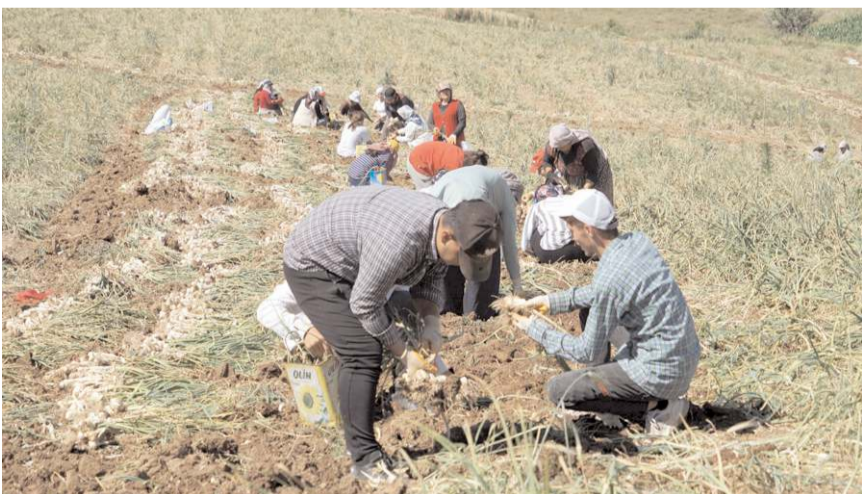
Kastamonu'da kene sebebiyle hayatını kaybeden olmazken, hastanede tedavi altına alınan 6 kişiden 1'i Çorum 'a sevk edildi.