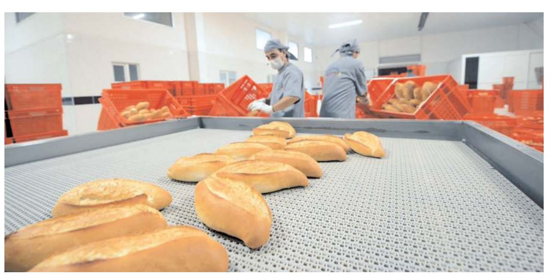
Halk Ekmek, 200 gr. ekmeğin fiyatını 5 TL olarak belirledi.