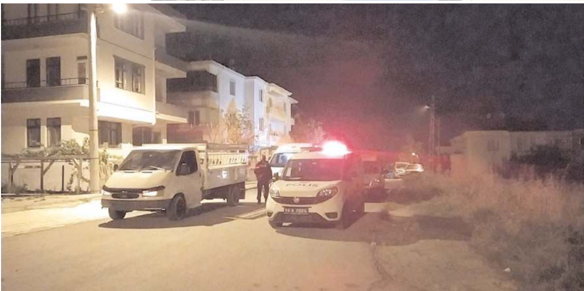
Olay, önceki gün gece saatlerinde Gülabibey Mahallesi Bağcılar 85. Sokak'ta meydana geldi.