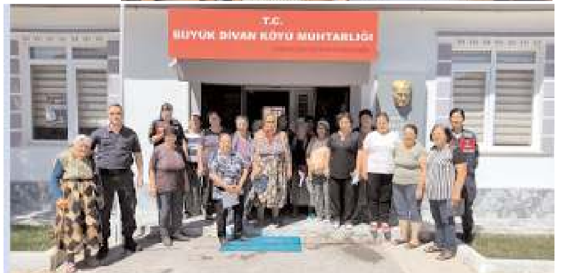
Toplantılarda şiddetin tanımı ve çeşitleri, doğurduğu sonuçlar ve çocuklar üzerindeki etkileri anlatıldı.