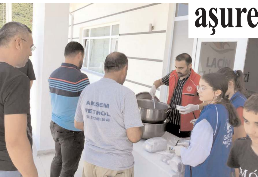
Aşure Laçın Gençlik Merkezi bahçesinde dağıtıldı.