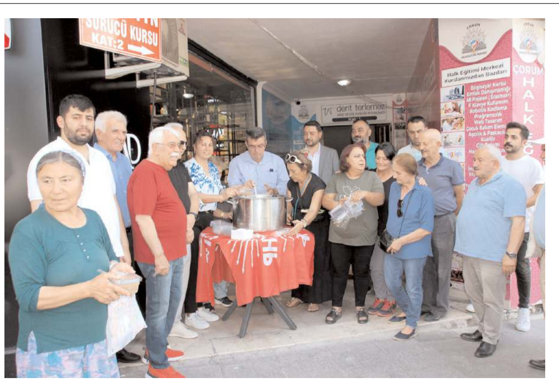
Aşure dağıtımı Cumhuriyet Halk Partisi İl Binası önünde yapıldı.

Hakimiyet, merhume Allah'tan rahmet, ailesine ve yakınlarına başsağlığı diler.