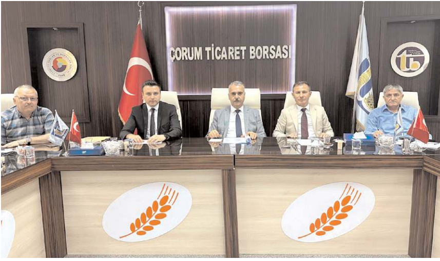
Toplantı Çorum Ticaret Borsası'nda yapıldı.