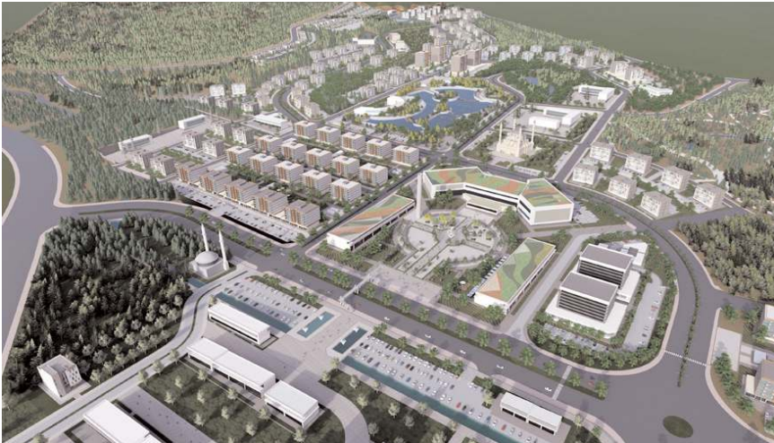
Eski Çimento Fabrikası arazisi 1 milyon 870 bin m 2 büyüklüğünde.

"İçerisinde konutlar sosyal donatı alanlarına, yeşil alanlara, kamu alanlarına, ticarethanelerine kadar birçok yönüyle düşünülerek hazırlanan projeyi 7 Ağustos Pazartesi günü saat 20.00'de Kadeş Barış Meydanı'nda hemşehrilerimizle paylaşacağız. Tüm hemşehrilerimizi, tarihi ana şahitlik etmeye davet ediyoruz." (Haber Merkezi)