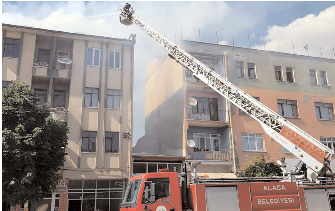
Alaca Belediyesi İtfaiye ekipleri yangını çevre binalara sıçramadan söndürdü.

Yangınla ilgili başlatılan soruşturma sürüyor. (İHA)