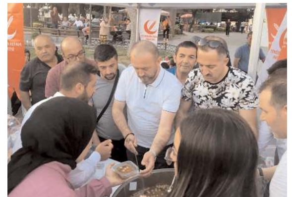
Yeniden Refah Partisi Çorum Teşkilatı Hürriyet Parkı yanında aşure dağıttı.