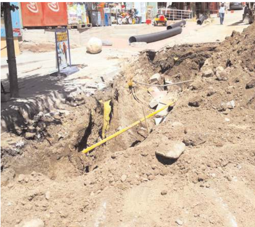
İş makinesiyle yapılan altyapı çalışması sırasında, doğalgaz hattı delindi.

Ekipler, daha sonra hattın onarılması için çalışma başlattı.