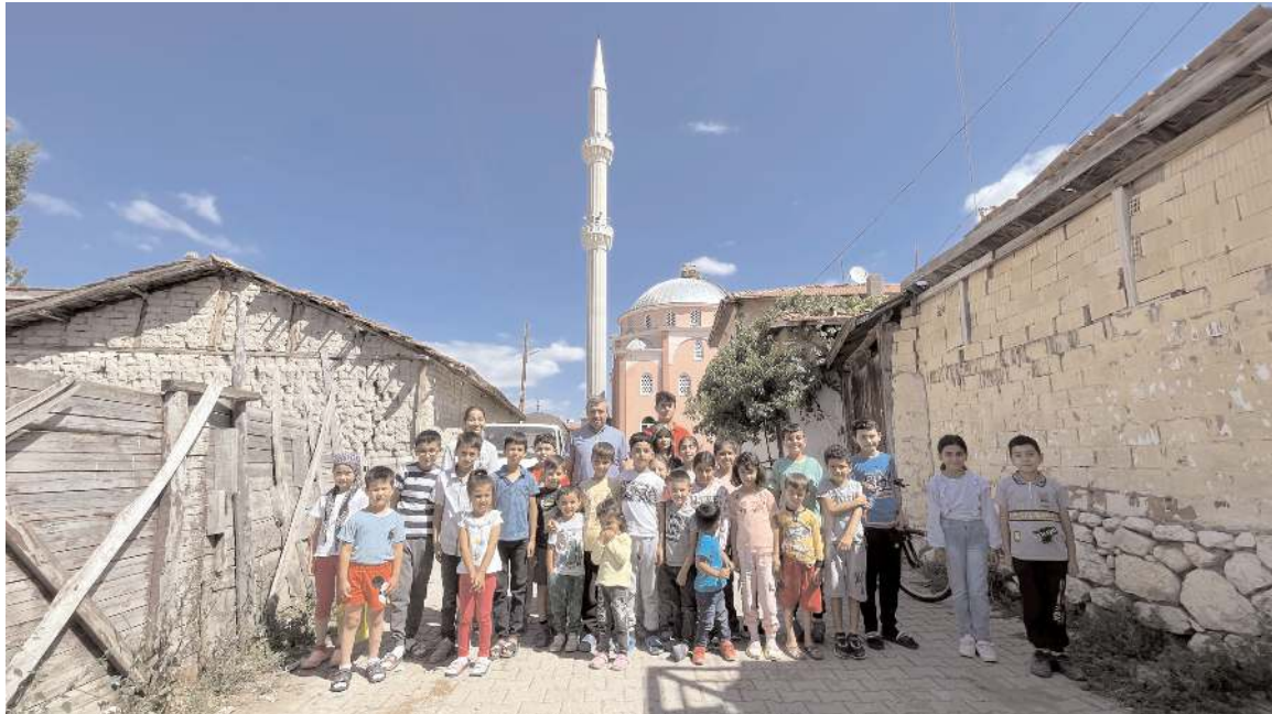
Köylüler, yaklaşık bir yılda 3 tona yakın atık plastik malzeme biriktirdi.