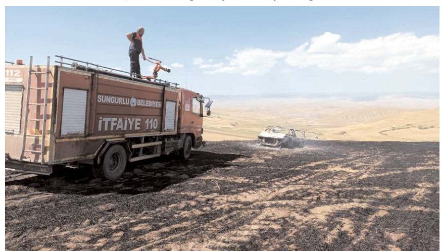
Otomobille birlikte tarlada yandı.