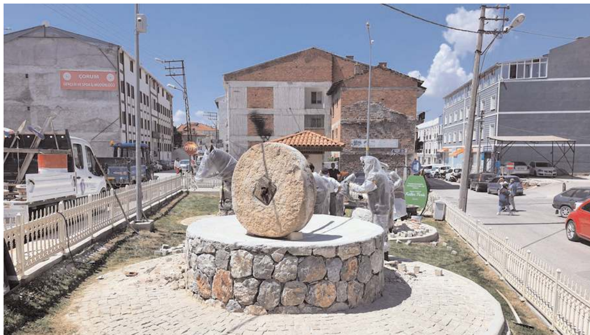
Parkta geçmişte kullanılan soku, arsana, çamaşır taşı ve tarihi sokak çeşmesi bulunuyor.