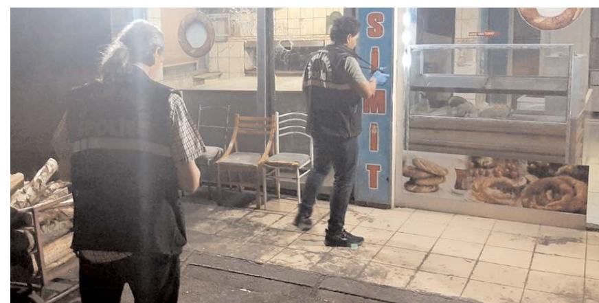
Olay Kunduzhan Mahallesi'nde meydana geldi.

Saldırdan sonra olay yerinden uzaklaşan şüphelilerin yakalanması için çalışma başlatıldı. (AA)