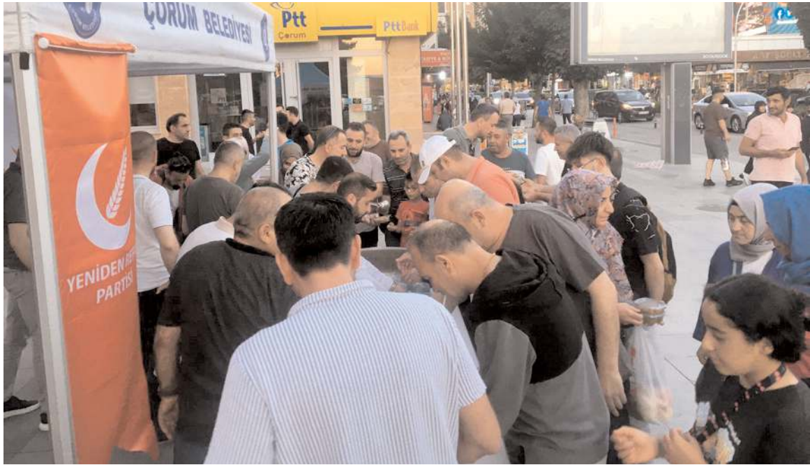
Aşure ikramına ilgi yüksek oldu.