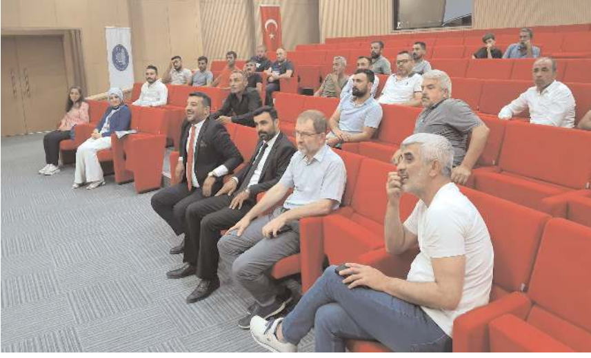
Toplantıya hurdacı esnafı katıldı.