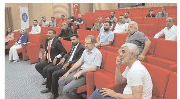
Toplantıya hurdacı esnafı katıldı.