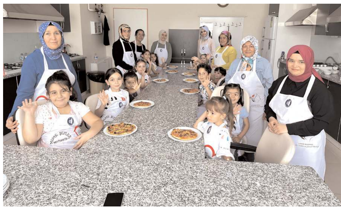
Etkinlik Çorum Belediyesi Buhara Kadın Kültür Merkezi'nde yapıldı.

Kayıt şartları ile ilgili detaylı bilgiye http://cocukuniversitesi.hitit.edu.tr adresinden ulaşılabilir. (Haber Merkezi)