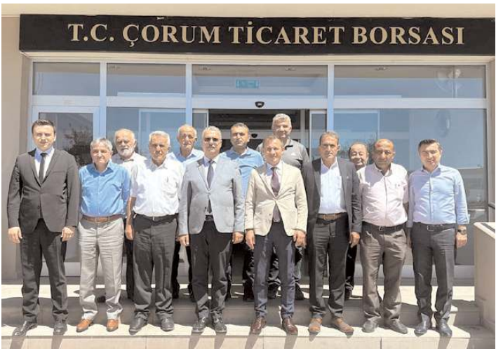
Toplantının ardından toplu hatıra fotoğrafı çekildi.

■ AK Parti Çorum Milletvekili Yusuf Ahlatcı, Ticaret Borsası'nda çiftçi sivil toplum kuruluşlarının temsilcileri ile yaptığı toplantıda, "Tarımsal üretimin sürdürülebilirliği ve çiftçilerimizin refahını artırmak için kararlıyız. Bu doğrultuda, çiftçilerimize destek olacak yeni projeler ve çalışmalar üzerinde çalışmaya devam edeceğiz" dedi.