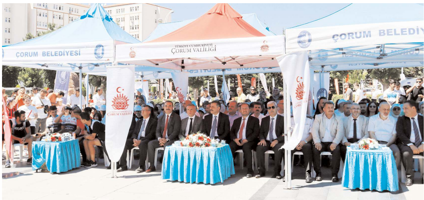
Kadeş Barış Meydanı'nda düzenlenen programa protokolün ilgisi yoğun oldu.