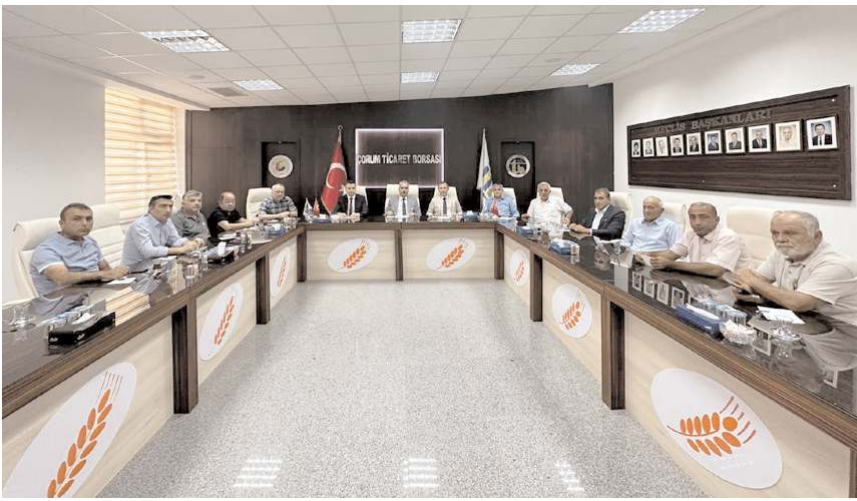
Toplantıda çiftçilerin sorun ve talepleri ele alındı.