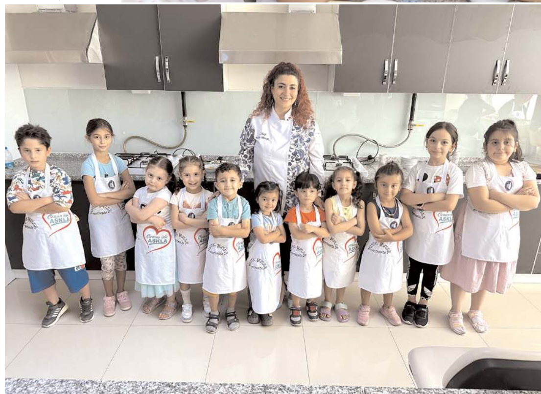
Çocuklar bir sonraki etkinliklerde cup cake ve kurabiye yapacak.