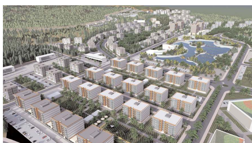
Projede, ticarethaneler, konut alanları ve sosyal donatılar yer alacak.