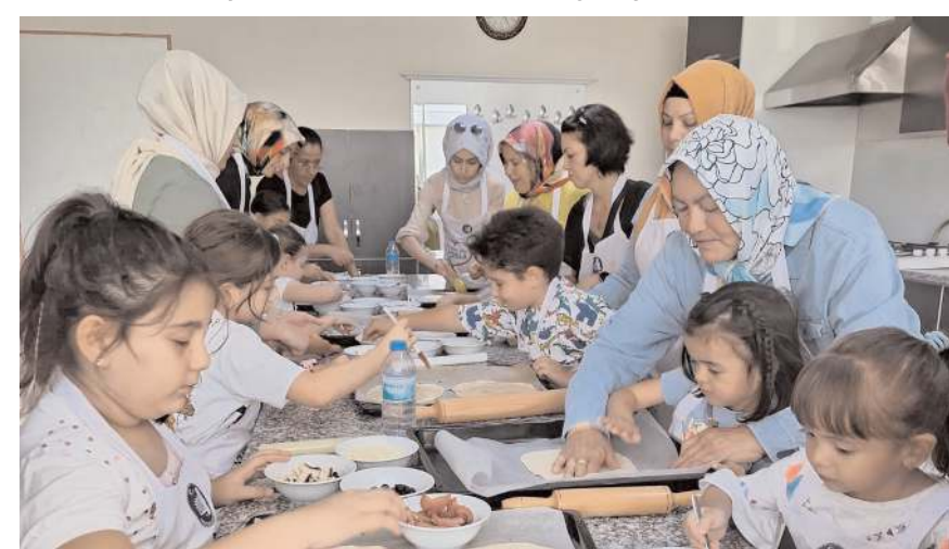
Minikler pizza yapmayı öğrendiler.