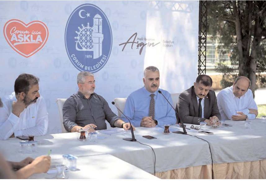
AK Parti Çorum Milletvekili Yusuf Ahlatcı, toplantıda değerlendirmelerde bulundu.

mine katkı sağlamak için var gücümüzle çalışacağız. Yol, sağlık, eğitim, tarım, sanayi, turizm ve daha pek çok alanda projeleri birlik ve beraberlik içinde destekleyerek, şehrimizin zengin değerlerini en iyi şekilde ön plana çıkaracağız" ifadelerini kullandı.