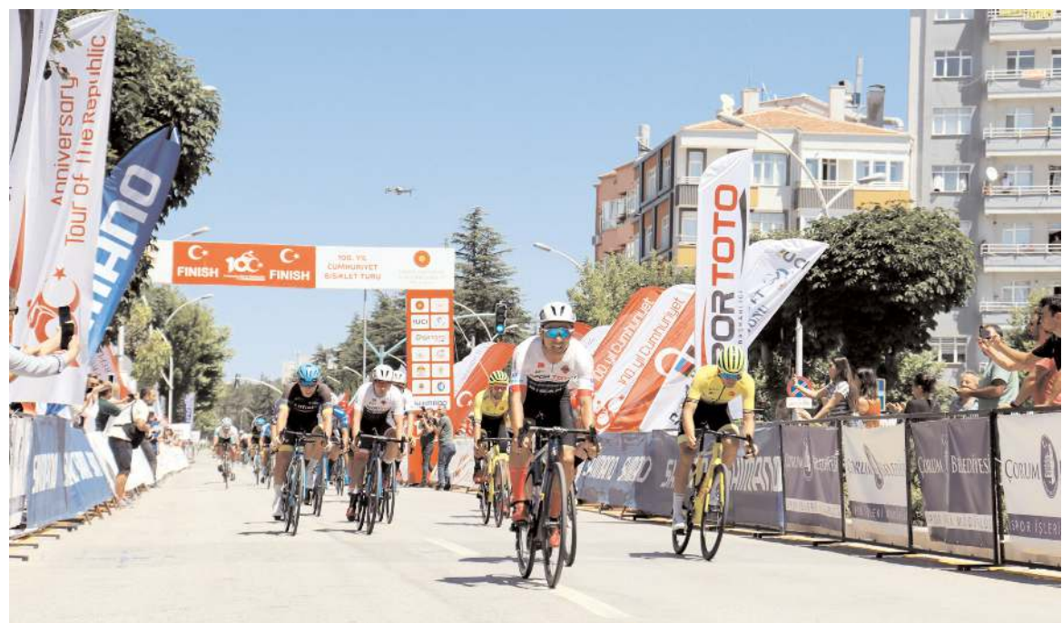
Sporcular 176 kilometrelik Samsun-Çorum etabını pedal çevirerek tamamladı.

Türkiye Bisiklet Federasyonu Asbaşkanı Bahattin Akyön ise yarışmanın geçmişle gelecekte arasında bir köprü olduğunu