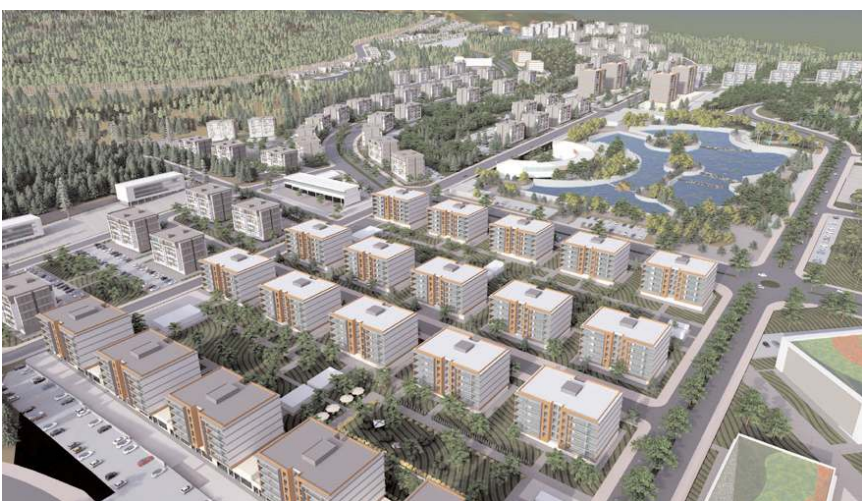
Projede, ticarethaneler, konut alanları ve sosyal donatılar yer alacak.