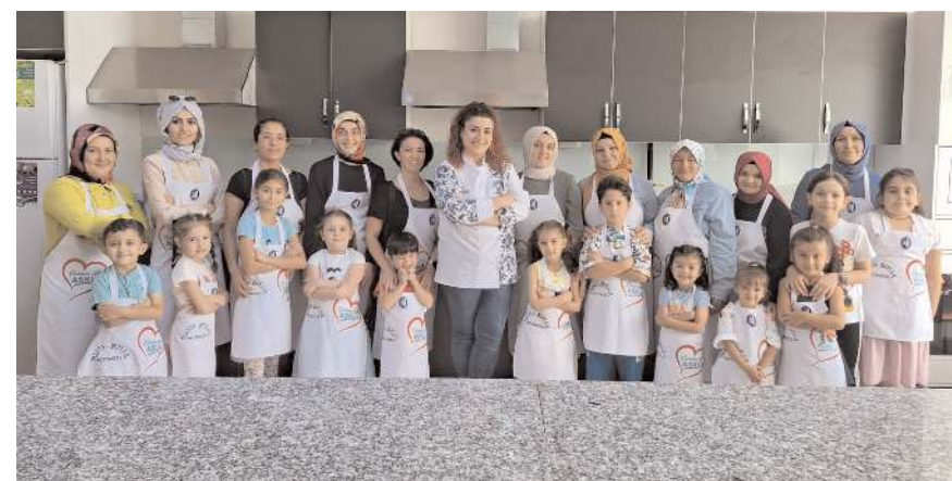
Çocuklar ve anneleri hatıra fotoğrafı çektirdiler.