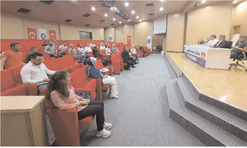
Toplantıda hurdacı esnafının taşınma konusu istişare edildi.

Çorum Belediyesi'nde yapılan toplantıda hurdacı esnafının taşınma konusu ele alındı.