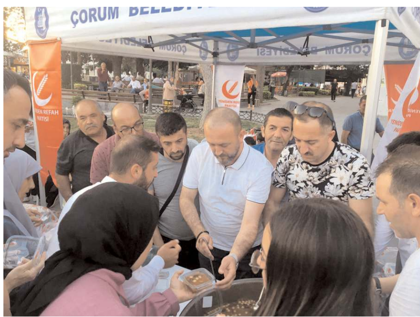
Yeniden Refah Partisi Çorum Teşkilatı Hüriyet Parkı yanında aşure dağıttı.

Yeniden Refah Partisi Çorum Teşkilatı vatandaşlara aşure ikram etti.