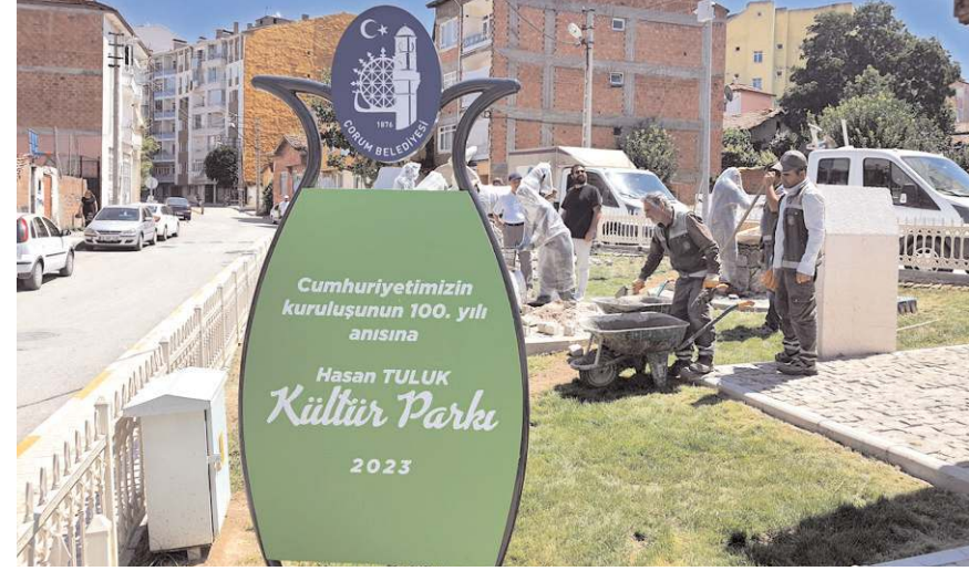
Park Kadeş Barış Meydanı yanında bulunuyor.

Çorum'un kaybolmaya yüz tutmuş kültürel mirası, Çorum Belediyesi'nin hayata geçirdiği projeye gelecek nesillere aktarılacak. Geçmişte kullanılan soku, arsana, çamaşır taşı ve tarihi sokak çeşmesinden oluşan kültür parkı, adeta bir açık hava müzesi haline geldi. Projenin son aşamasında, soku, arsana ve çamaşır taşında çalışan insan ve hayvan figürleri de yerlerini aldı. Projenin danışmanlığını yürüten metal sanatçısı Hasan Tuluk'un adını taşıyan kültür parkının açılışı 11 Ağustos Cuma günü yapılacak. (Haber Merkezi)