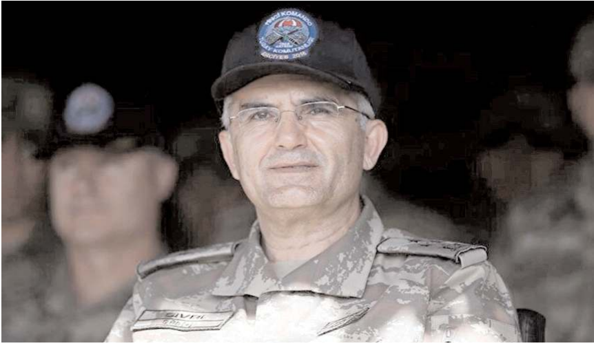
1.Ordu Komutanı hemşehrimiz Ali Sivri

19 Ağustos 2022 tarihinden bu yana 1'inci Ordu Komutanlığı görevini yürütüyor.