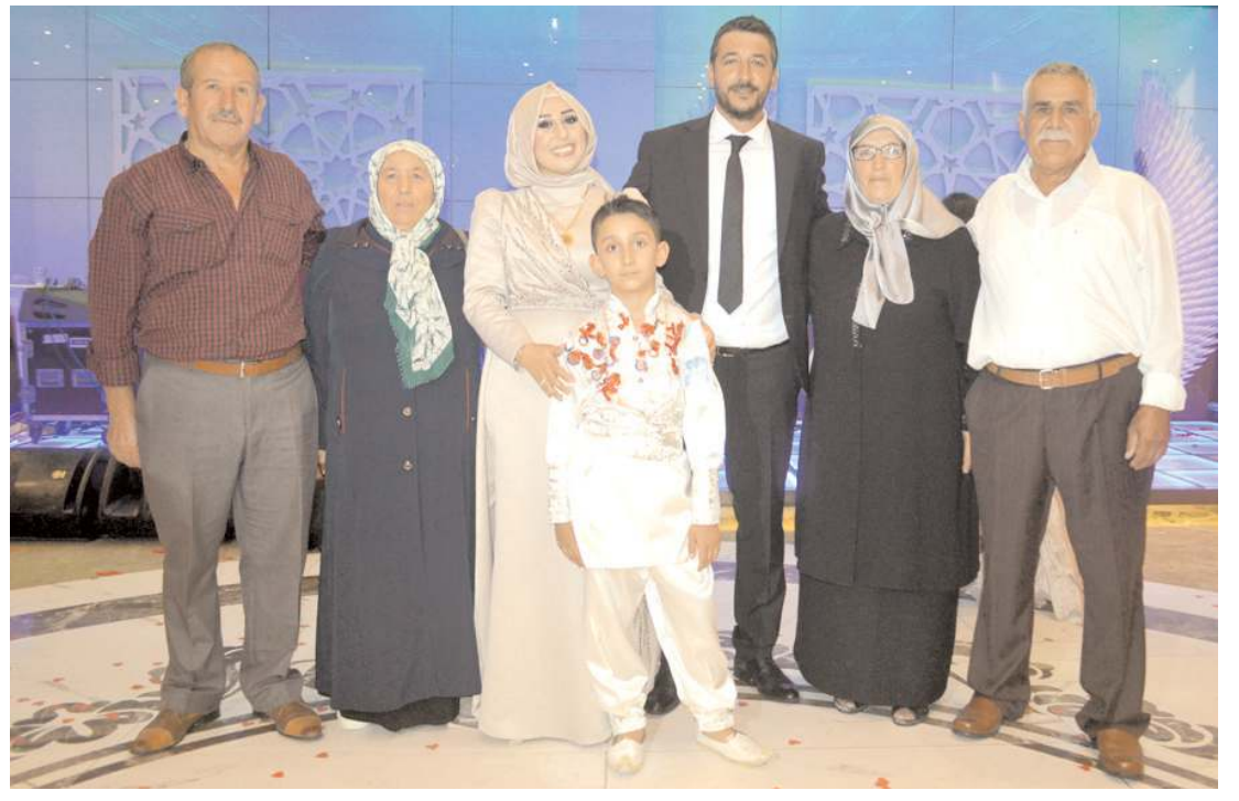
Sünnet düğünü Kültür Balo Salonu'nda yapıldı.

Metal, kağıt, plastik gibi atıkların mevzuata uygun şekilde toplanması, işlenmesi ve geri dönüşümün daha etkili bir şekilde yürütülmesi konularının değerlendirildiği toplantıda, şehirde farklı bölgelerde faaliyet gösteren hurdacı esnafının belli bir alanda toplanması konusunda da esnafın fikir alışverişinde bulunduğu bulundu. (Haber Merkezi)