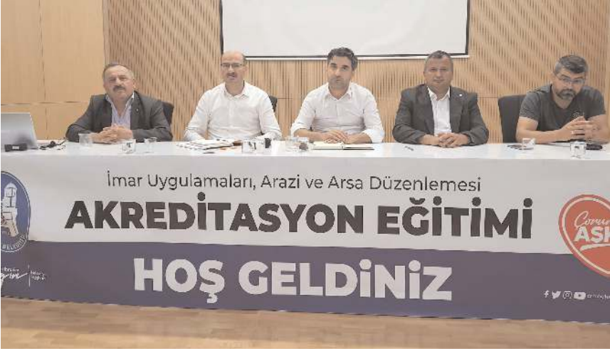
Toplantı belediye konferans salonunda yapıldı.