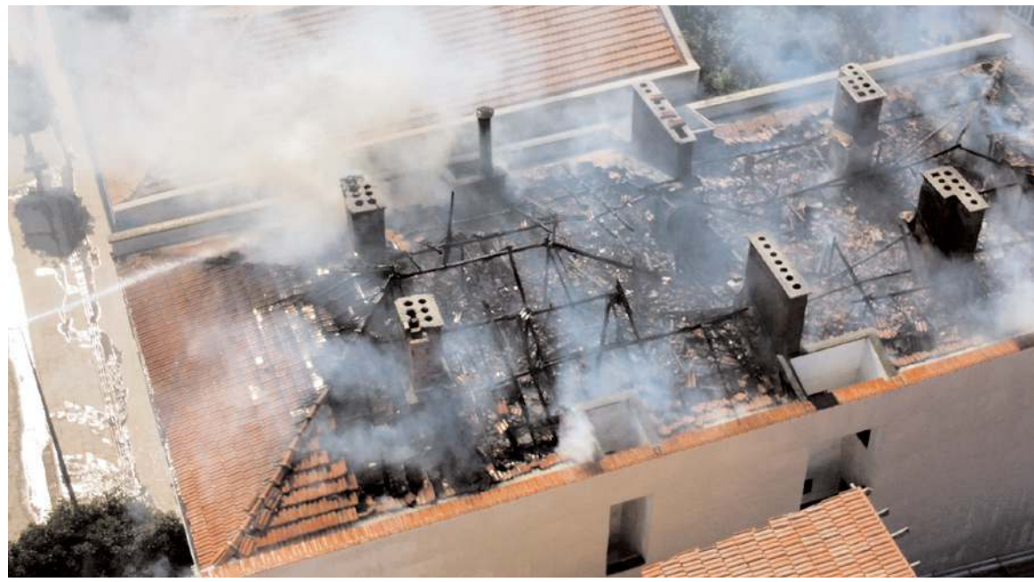
Olay Ayhan Mahallesi Ankara Caddesi üzerinde bulunan bir apartmanda meydana geldi.

Dolayısıyla, Disney+ ya da herhangi bir medya platformunun adına dizi ya da film yayınlaması Atatürk'ü büyütmeceği gibi, baskılar sonucu kararını iptal etmesi de değerini eksiltmez. Olsa olsa o medya platformunun insanlık değerlerine bakış açısını ve aldığı kararların arkasında durma cesaretini ortaya koyar. Atatürkçü Düşünce Derneği olarak, bu medya platformu yetkililerini 100 yıllık emperyalist propaganda ürünü "Ermeni Soykırımı" yalanına teslim olmak yerine Ermenistan'ın ilk Başbakanı Ohannes Kaçaznuni'nin 1923 tarihli raporunu okuyup gerçekleri öğrenmeye davet etmeye gerek görmüyoruz, çünkü değmez. Gereken yanıt Türk Ulusu ve dünya kamuoyu elbette verecektir."