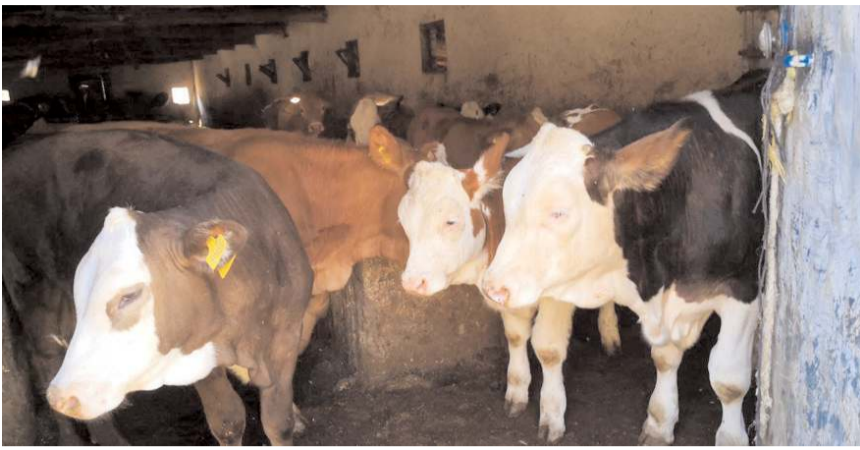
Şap hastalığı nedeniyle 15 köy ve merkez mahalleleri karantinaya alındı.