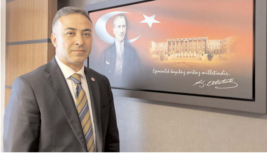
CHP Çorum Milletvekili Mehmet Tahtasız

■ Cumhuriyet Halk Partisi (CHP) Çorum Milletvekili Mehmet Tahtasız, Çorum'da inşası devam eden yolları Meclis gündemine taşıdı.