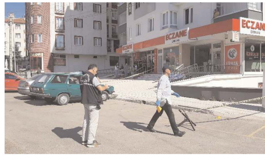
Olay Pazartesi Pazarı içinde meydana geldi.

Zanlıların yakalanması için çalışma başlatıldı.