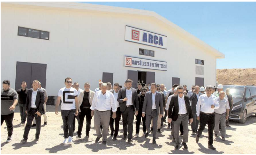
Fabrikada seri üretim süreci başladı.