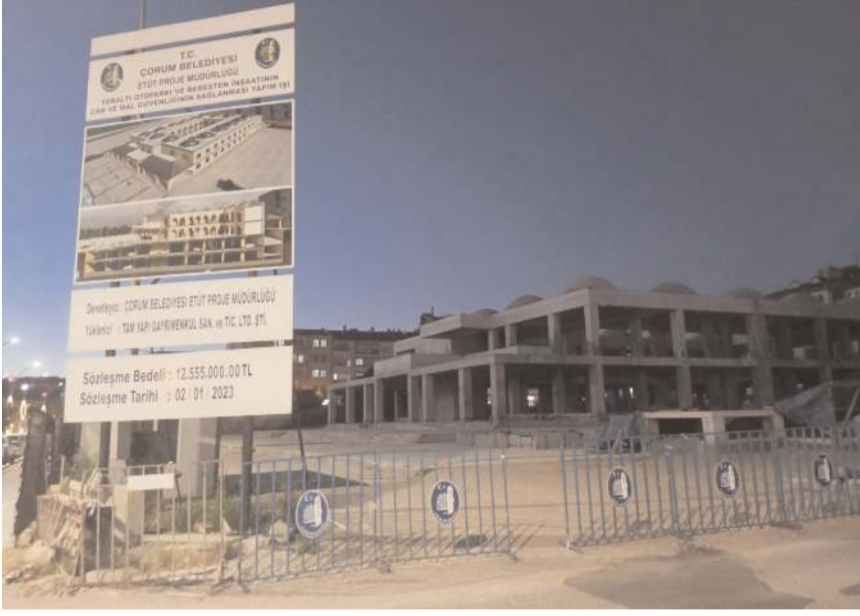
Bedesten'in kaba inşaatı tamamlandı.

Yüzde 70'i tamamlanan bedesten inşaatın tamamlama ihalesinin ardından kalan kısmı tamamlanarak hizmete açılması planlanıyor.