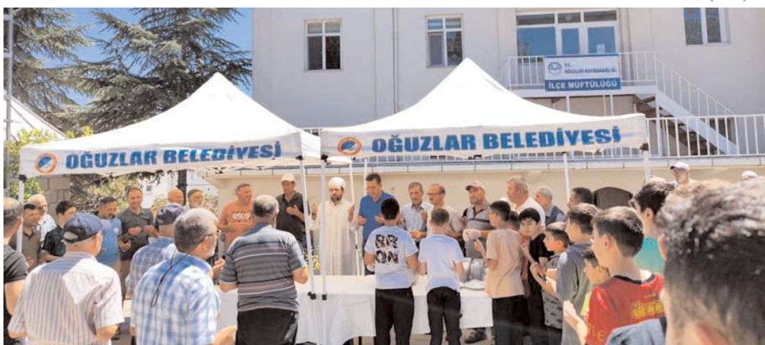
Aşure dağıtımında dua edildi.