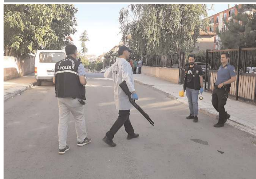
Polis ekipleri olay yerinde inceleme yaptı.