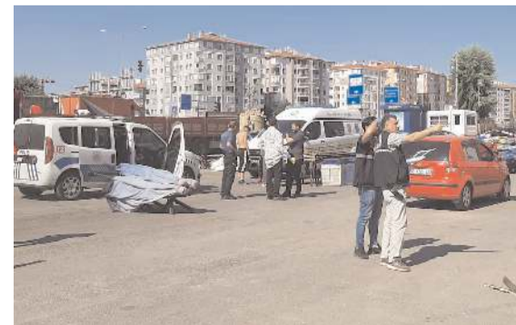
Polis ekipleri olay yerinde inceleme yaptı.