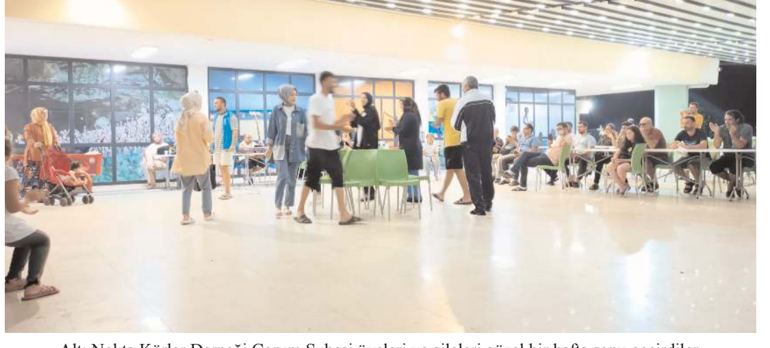
Altı Nokta Körler Derneği Çorum Şubesi üyeleri ve aileleri güzel bir hafta sonu geçirdiler.