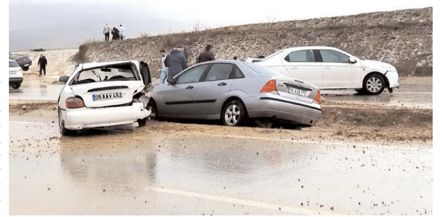
38 km uzunluğundaki Çorum-Mecitözü yolunun 22,8 km'si tamamlandı.

43,4 km'lik kesiminde yapım çalışmaları devam etmektedir. Ayrıca Kırkdilim geçişinde T1, T2 ve T3 tünelleri olarak adlandırılan 3 adet tünel bulunmaktadır. T2 ve T3 tünelleri tamamlanmıştır. T1 tünelinin ise kazı destek imalatları tamamlanmış olup nihai beton kaplama çalışmaları devam etmektedir. Tünellerin 2024 yılında tamamlanması hedeflenmektedir" diye konuştu.