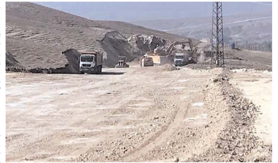
Çorum-Ortaköy yolunun ikinci etabı olan Cemilbey-Ortaköy arasında çalışmalar sürüyor.