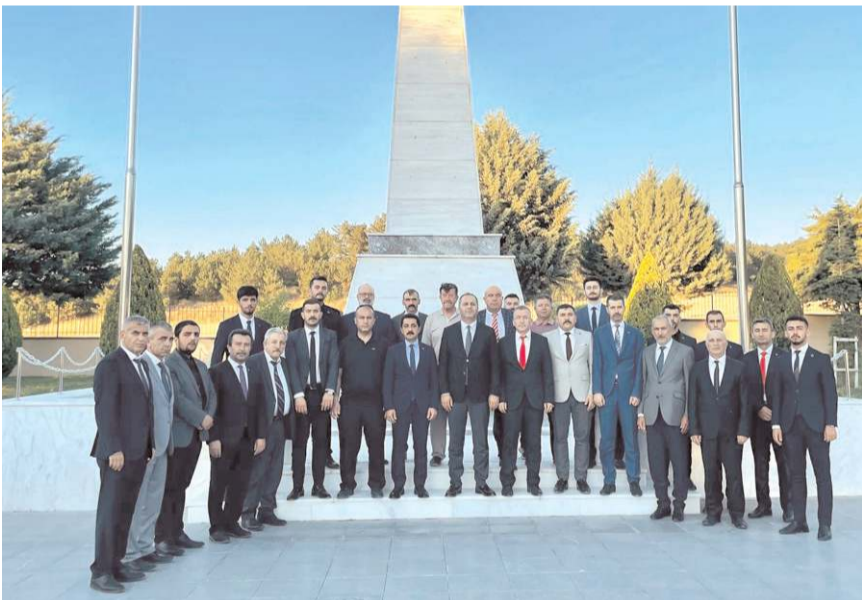
Çorum Şehitliğinde hatıra fotoğrafı çekildi.