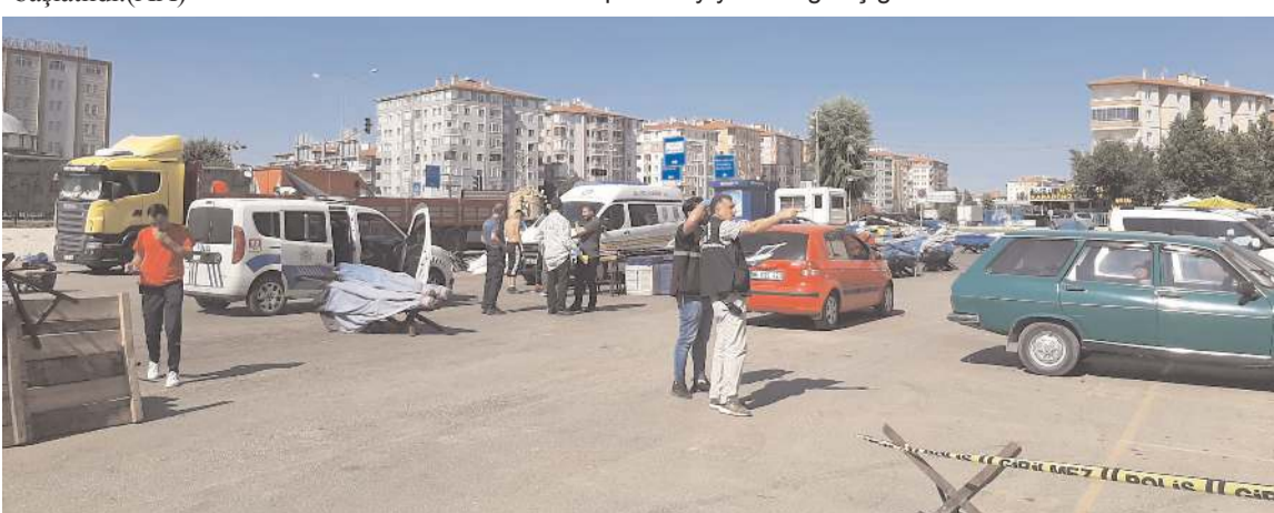
Polis ekipleri olay yerinde inceleme yaptı.