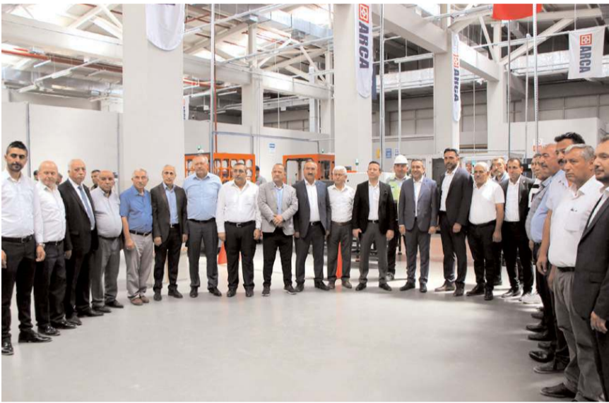
Fabrikada yıllık 1.2 milyar adet kapsül üretilecek.