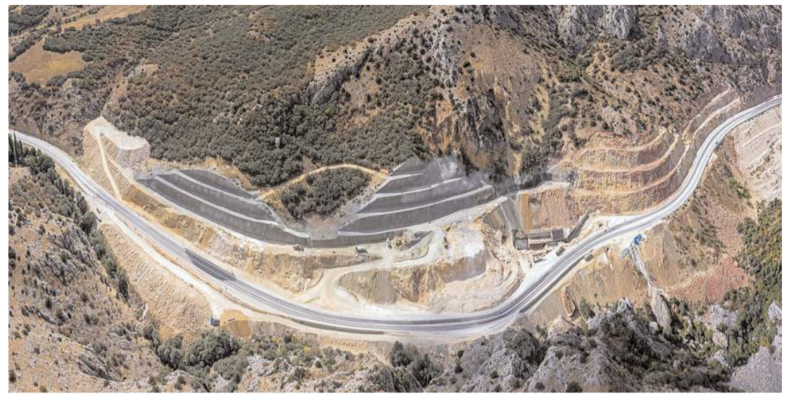
Çorum-Laçın yolu Kırkdilim bölgesinde çalışmalar devam ediyor.