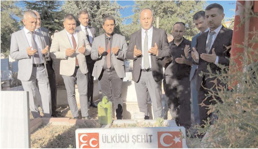
Ziyarette şehitler için dua edildi.