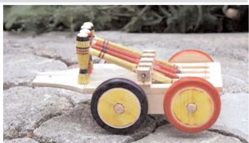
Tokmaklı Kağnı'nın coğrafi işaret tescili için yapılan başvuru sonuçlandı.

re ve çocukluğumuza ait Tokmaklı Kağnı'mız da Coğrafi İşaret olarak İskilip adına tescillendi. Hayırlı olsun." ifadelerini kullandı.(AA)