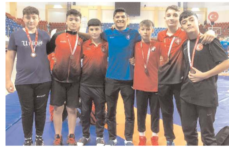
Türkiye Şampiyonasında mücadele eden Çorum takımı sporcuları toplu halde