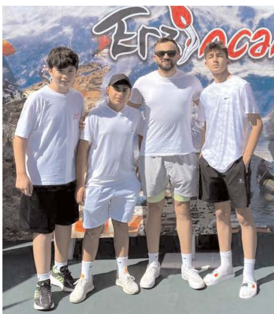
Erzincan'da üçüncü olan Tenis erkek takımı