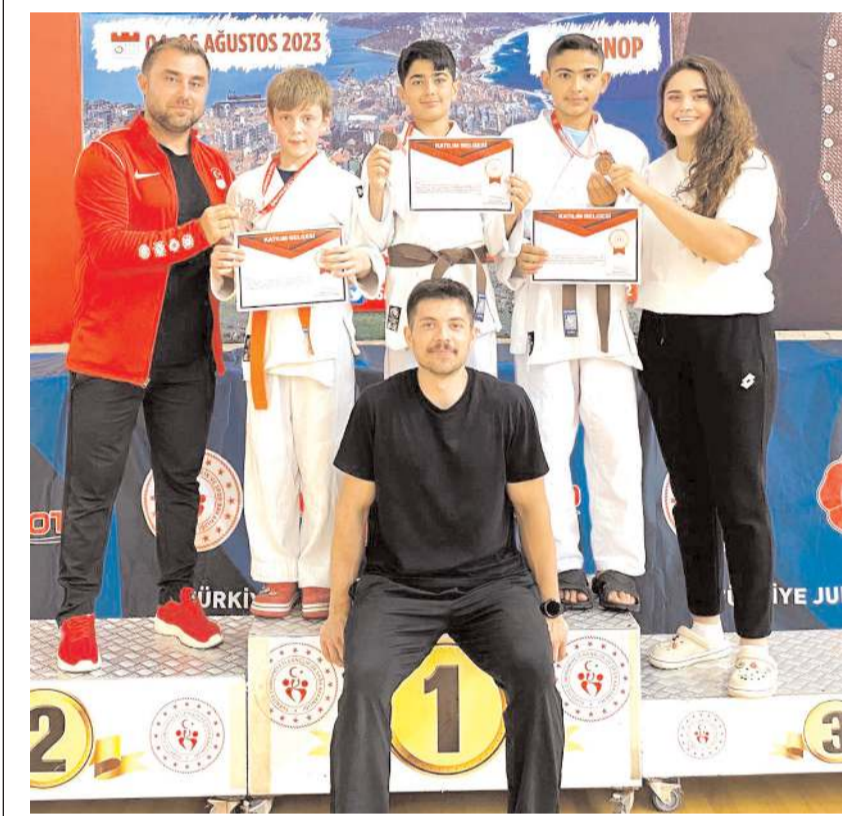
Sinop'da madalya kazanan sporcular idareci ve antrenörleri ile birlikte toplu halde

16 Ağustos'ta başlayacak turnuvada gruplar tek devreli lig statüsünde oynanacak maçlar sonunda A ve B gruplarından üçer diğer beş gruptan ilk iki takım olmak üzere toplam 16 takım ikinci tura yükselecek. Bu turdan sonra ise çekilecek kura sonucunda tek maçlı elemasyon sistemine göre oynanacak eleme maçları sonunda şampiyon belli olacak. İkinci tura 7 grup birincisi ve A grup ikincisi seri başı olarak diğer sekiz takım ile kura ile eşleşecek.