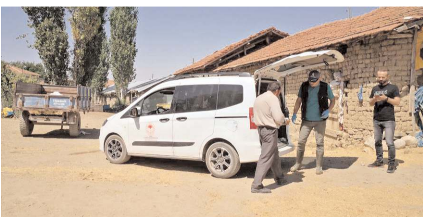
İlçe Tarım ve Orman Müdürlüğüne bağlı ekipler, Küçükpolatlı köyünde hayvanlara şap aşısı yaptı.