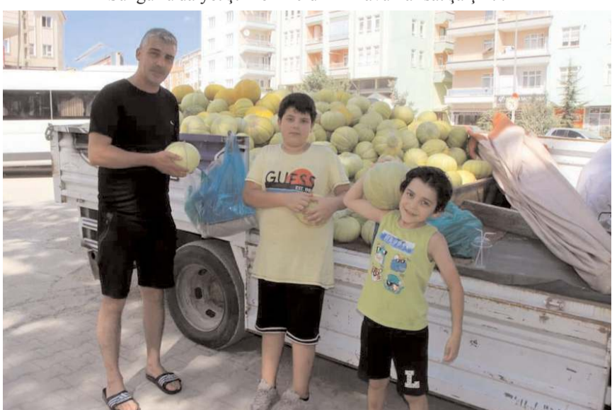
Kavun ilçede 32 yıl önce ekilmeye başlanmış.