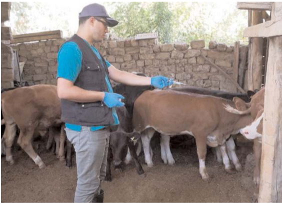
İlçe Tarım ve Orman Müdürlüğüne bağlı ekipler, Küçükpolatlı köyünde hayvanlara şap aşısı yaptı.