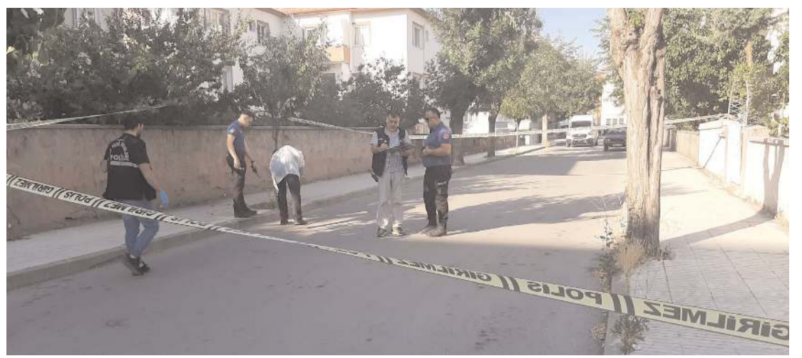
Olay Gülabibey Mahallesi Yenidoğan 1. Sokak'ta meydana geldi.

İtfaiye ekipleri, sıkışan kediyi yaptıkları çalışmayla kurtardı. Kedinin sıkıştığı yeden çıkarılmasını heyecanla bekleyen çevre sakinleri, kediyi kurtaran itfaiyenin itfaiyecilere teşekkür etti. (İHA)