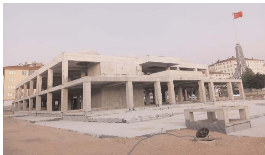
Bedesten'in kaba inşaatı tamamlandı.