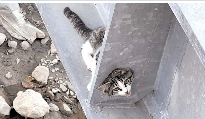
Kedi uzun süre kurtarılmayı bekledi.