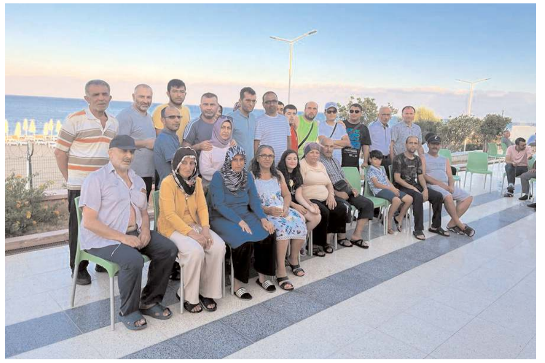
Altı Nokta Körler Derneği Çorum Şubesi üyeleri ve aileleri, Gençlik Spor Bakanlığı Mersin Silifke 23 Nisan Kampında tatil yaptı.

Şehitlikte yapılan duanın ardından şehit aileleriyle görüşen Mehmet İhsan Çıplak, “Bu vatan için canını feda eden kahramanlarımız ve o kahramanları yetiştiren yiğit anne babalarımız, kahramanlarımızın evlatları başımızın tacı, gözümüzün nurudur. Onlara teşkilatımızın kapısı da gönül kapımız da ardına kadar açıktır. Onlar için ne yapsak azdır. Bugün burada, şehitlerimizin aziz ruhları önünde tazimle eğilirken, taşıdığımız sorumluluğu, ulaşmak istediğimiz gayeyi yeniden idrak ettik. Bu şuurla memleketimiz için gece gündüz çalışacağımızı bir kez daha beyan ediyoruz” ifadelerini kullandı. (Haber Merkezi)