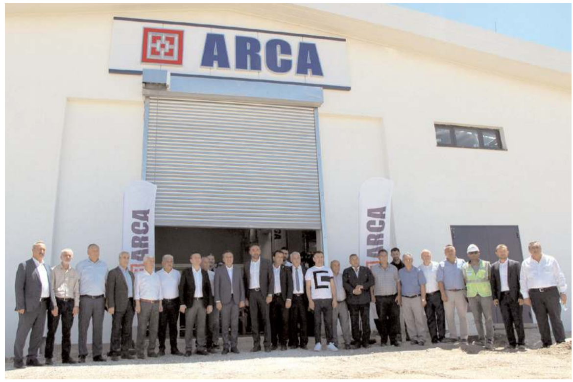
Fabrika Sungurlu Organize Sanayi Bölgesine 1 milyon metrekare üzerine kuruldu.

İsmail Terlemez, fabrikaların kurulmasında desteği olanlara teşekkür ederek, "Önceki dönem Milli Savunma Bakan Yardımcısı Sayın Muhsin Dere'nin buraya bu kadar emek vermesi Cumhurbaşkanımız Sayın Recep Tayyip Erdoğan'ın desteği ve güveni bizlere güç verdi. Bizlere destek olan başta Cumhurbaşkanımız, bakanlarımız ve yerel yöneticilere teşekkür ederiz" dedi. (Haber Merkezi)