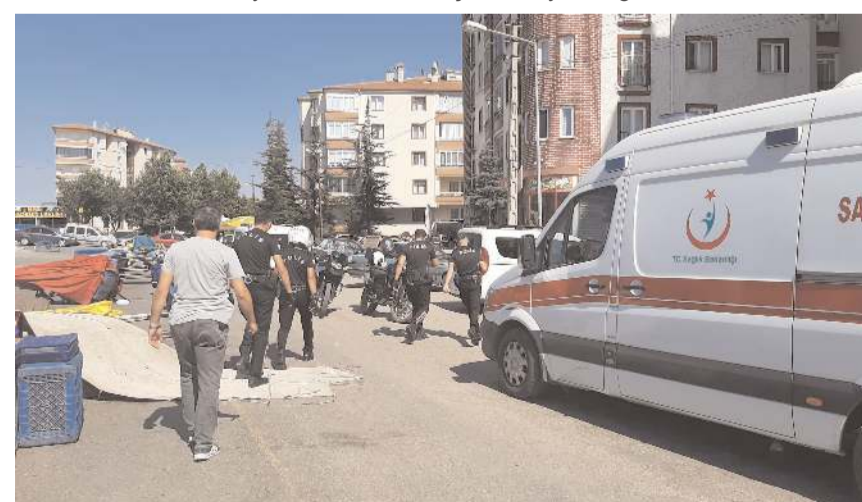
Polis ekipleri olay yerinde geniş güvenlik önlemi aldı.