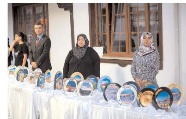
Kermeste 27 kadın kursiyerin yaptığı ürünler yer alıyor.

Projeyle dahil olan kadınların kurslarda meslek edinme fırsatı bulduklarının altını çizen Akpay "Kadın kursiyerlerimize yönelik hediye eşya ve yöresel gıda olmak üzere iki ayrı kurs açtık. Üç ay boyunca Aile Destek Merkezimizde eğitim aldılar. Kursları tamamlayanlar sertifika sahibi oldular. Dolayısıyla kursların kadın kursiyerlerimizin iş hayatında başarılı olmalarına katkı sunacağını düşünüyorum." diye konuştu.