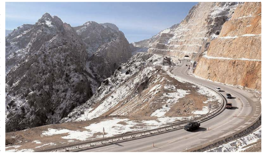
38 km uzunluğundaki Çorum-Mecitözü yolunun 22,8 km'si tamamlandı.