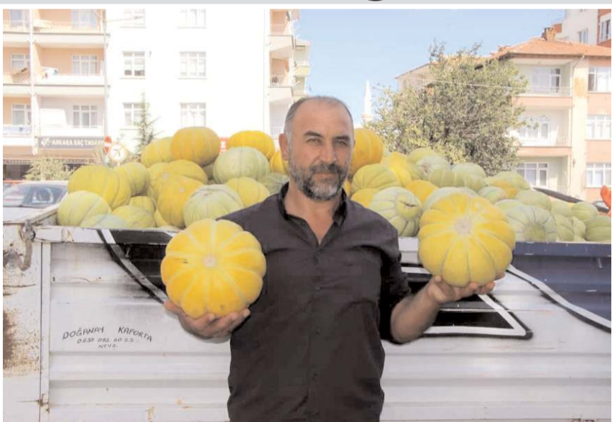
Sungurlu'da yetiştirilen '10 dilim' kavunlar satışa çıktı.

'10 dilim' kavun ilçede yaklaşık 32 yıl önce ekimine başlanmış ve zamanla bölgeye özgü yetiştirilerek çok sayıda çiftçinin gelir kapısına haline geldi. Kavunun en önemli özelliği bir kökten 5 ile 7 arasında ürün alınmasının yanı sıra ayrıca kendine has kokusu, aroması ve uzun ömürlü olması da kavunun başlıca özelliğidir. 10 dilim kavunda dekar başına yaklaşık 2 ton ürün, 3 ay gibi kısa bir sürede alınabilmektedir. Kavun üretiminde en son alınan ürünler genellikle kelek olarak toplanıp turşu yapımında kullanılmaktadır. Kurulan pazarlarda ve satış noktalarında ülkenin her yerine kavun gönderiliyor. (Haber Merkezi)