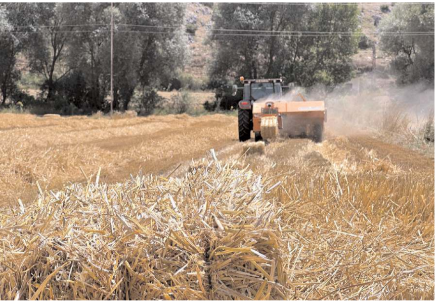
Buğday hasadının ardından 900 balya elde edildi.

Aynı zamanda, hasat sonrasında oluşan samanın da değerlendirilmesine özen gösteren Çorum Belediyesi, tarladan topladığı 900 balya samanı Veteriner İşleri Müdürlüğü aracılığıyla hayvanların beslenmesi için kullanacak. Bu şekilde, tarımsal üretimin artışı olan samanların hayvanların beslenmesinde değerlendirilerek çevresel sürdürülebilirliğe katkı sağlanmış olacak. (Haber Merkezi)