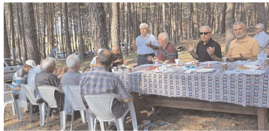
Programda ölenlere rahmet kalanlara hayırlı bir hayat olması dileğiyle okunan hatimlerin duasını yaptık.