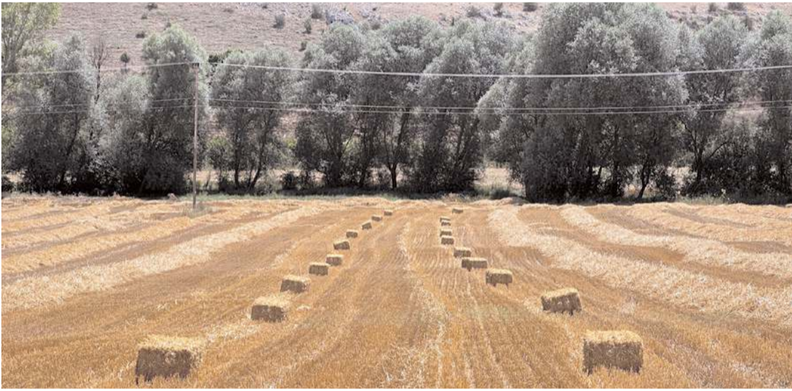
Belediye tarladan 20 ton buğday elde etti.

HAKİMİYET, Güven ve İlbaş ailelerini kutlar, genç çifte ömür boyu mutluluklar diler. (Haber Merkezi)