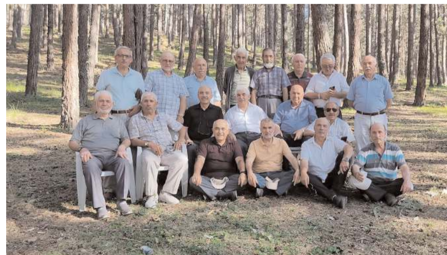
Buluşma programı Abdullah Yaylasında yapıldı.