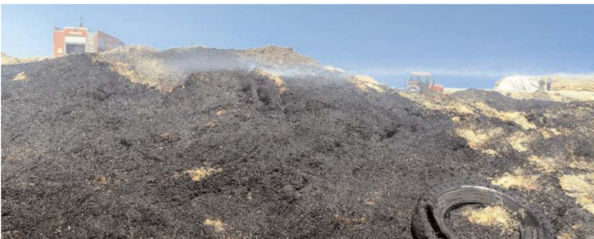
Yangında maddi hasar meydana geldi.

Amasya'da devrilen un yüklü tırın sürücüsü hayatını kaybetti. Genç sürücünün çalan telefonunu açan polis, acı haberi sürücünün babasına söyleyemedi.