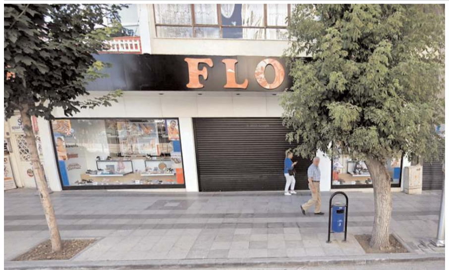
Türkiye'nin en büyük ayakkabı mağazası zinciri caddedeki şubesini kapattı.