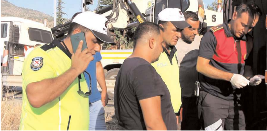
Sürücünün peş peşe çalan telefonunu açan trafik polisi, acı haberi babaya söyleyemedi.