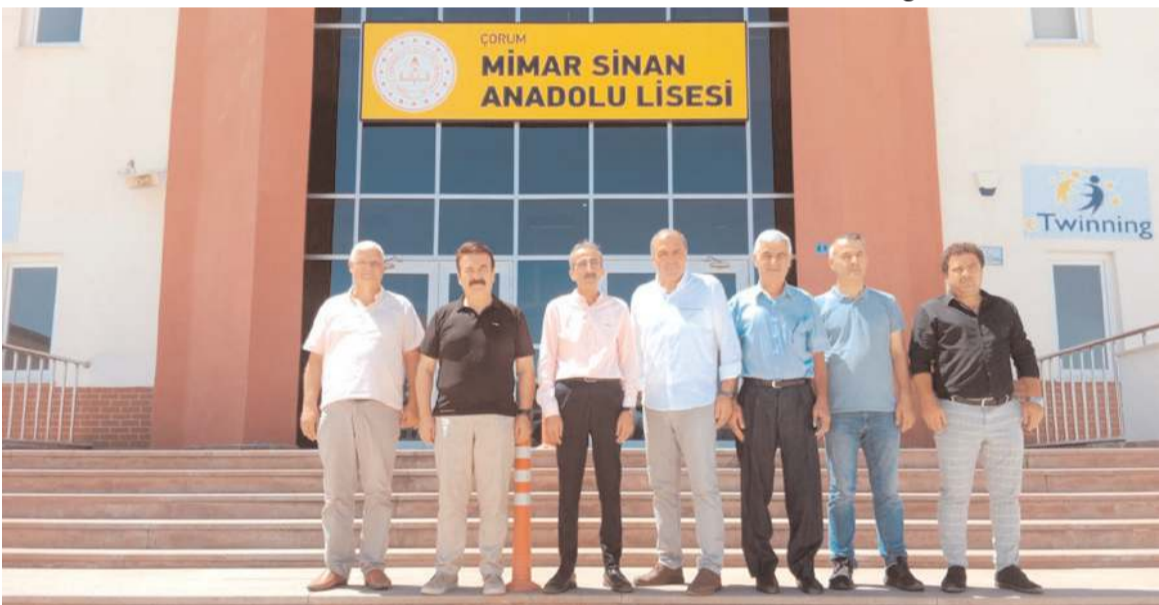
Kodek Mimar Sinan Anadolu Lisesi'nde bakım çalışmalarını inceledi.