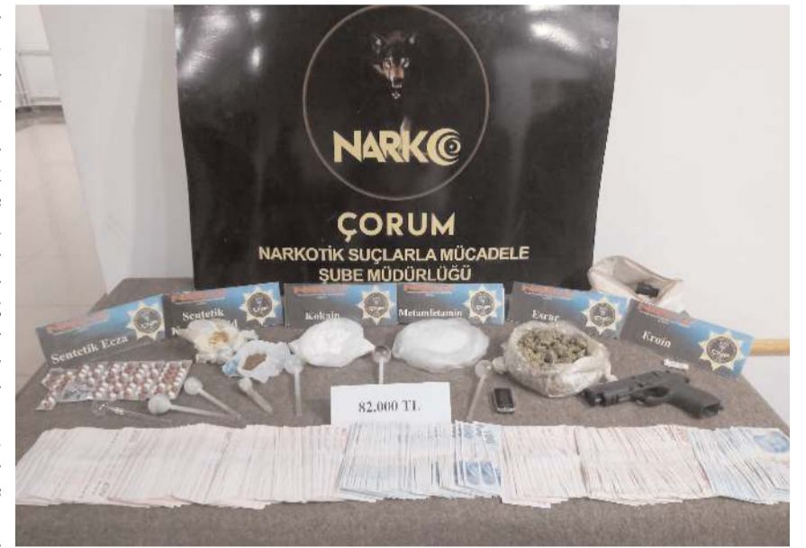
Operasyonda suçtan elde edildiği değerlendirilen 82 bin lira ele geçirildi.

Operasyonda gözaltına alınan 6 zanlı hakkında,