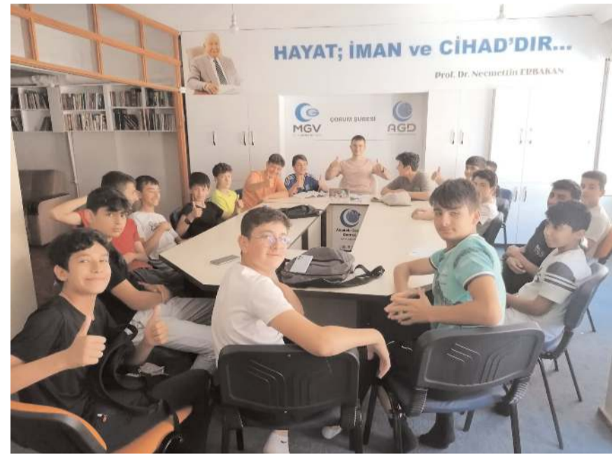
İki derneğin Kur'an Kursu faaliyetlerine öğrenciler yoğun ilgi gösterdi.