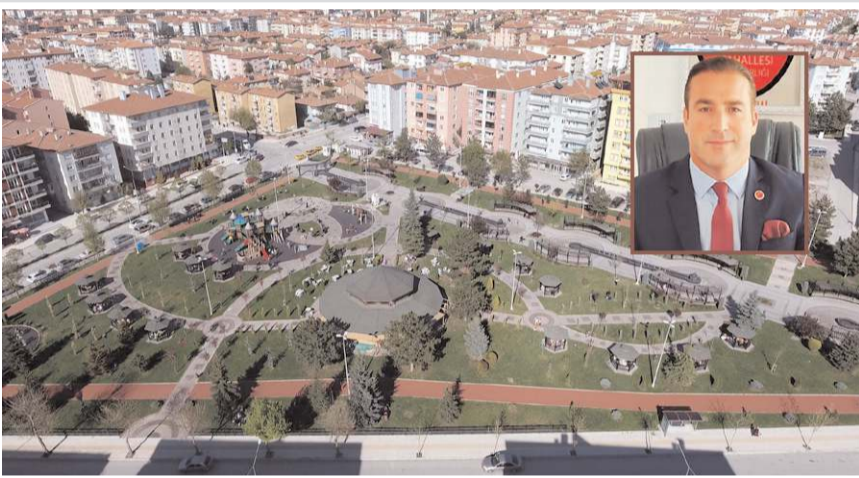
Rüstem Eren Parkı'nda sık sık yaşanan olaylardan dolayı güvenlik önlemi alınması isteniyor.