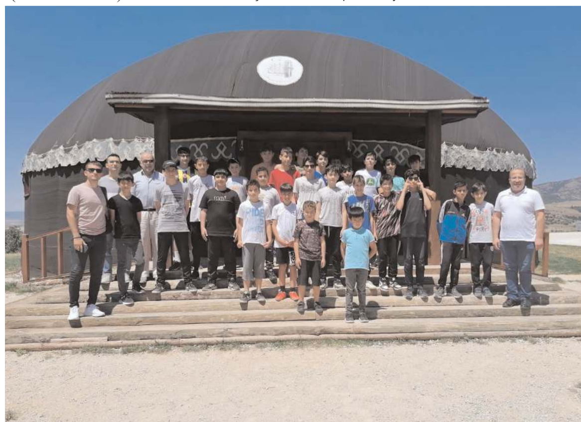
Çorum Obası'nda düzenlenen kurs sonunda