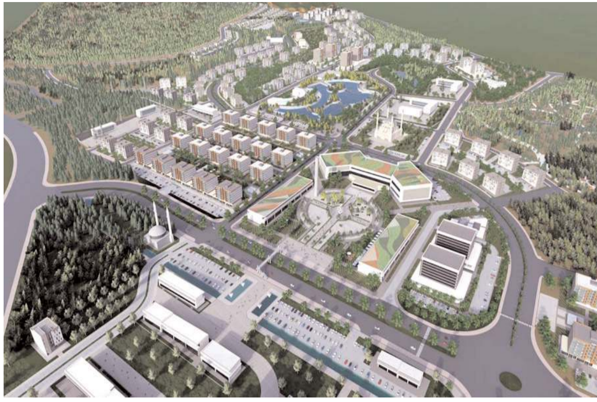
Yeni Şehir Projesi'nden bir kare...