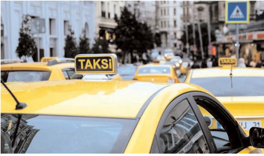
Çorum'da taksi açılış ücreti 20 lira oldu.

FATİH BATTAR Çorum'da taksi ücretlerinde zam yapıldı. Zamlarla birlikte taksi açılış ücreti 14 liradan 20 liraya yükseltildi.