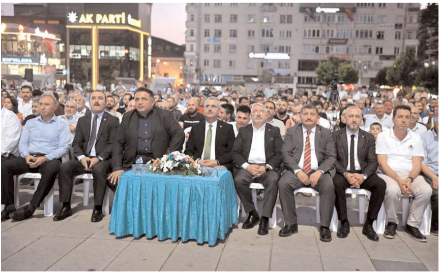
Protokol üyeleri projeyi ilgilie takip etti.