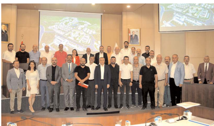
Yeni Şehir Projesi imar değişikliği talebinin kabul edilmesinin ardından günün anısına toplu fotoğraf çekildi.

■ Çorum Belediye Meclisi'nin Ağustos ayı toplantısında, Çimento arazisine Çorum Belediyesi tarafından hayata geçirilecek olan Yeni Şehir Projesinin imar değişikliği talebi oy çokluğu ile kabul edildi. * HABERİ 3'TE