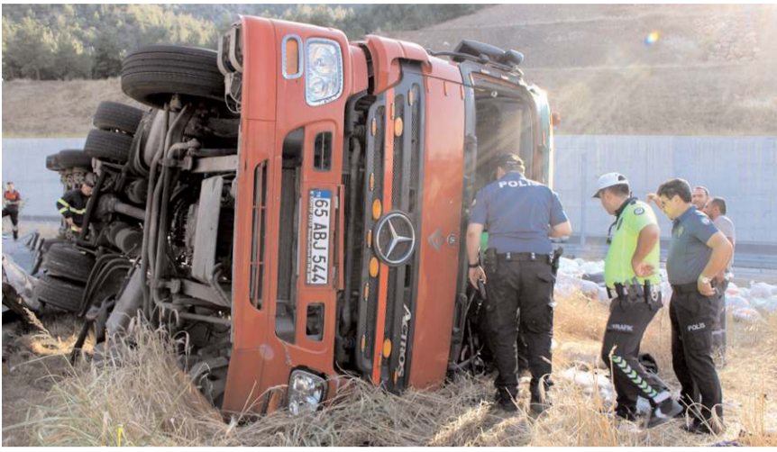
Erkan Çelik (21) yönetimindeki 65 ABJ 544 plakalı tır, Amasya otoyol kavşağında devrildi.