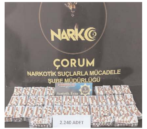
Operasyonda çok sayıda uyuşturucu madde ele geçirildi.