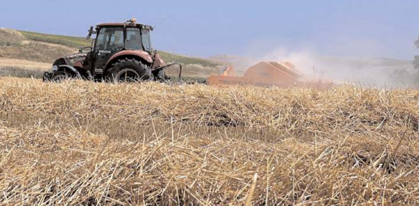
Balyalar Veteriner İşleri Müdürlüğü aracılığıyla hayvanların beslenmesi için kullanılacak.