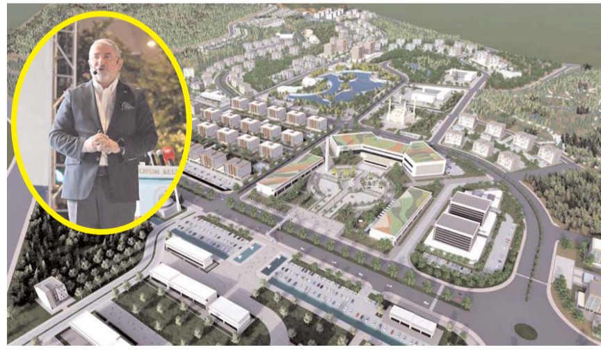
Yeni Şehir Projesi'nden bir kare...