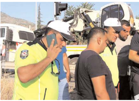
Sürücünün peş peşe çalan telefonunu açan trafik polisi, acı haberi babaya söyleyemedi.