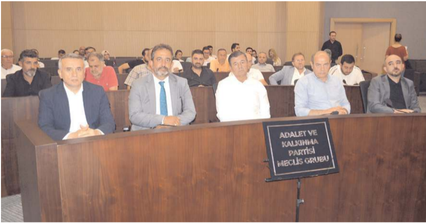
Toplantıda 16 gündem maddesi görüşülerek kabul edildi.