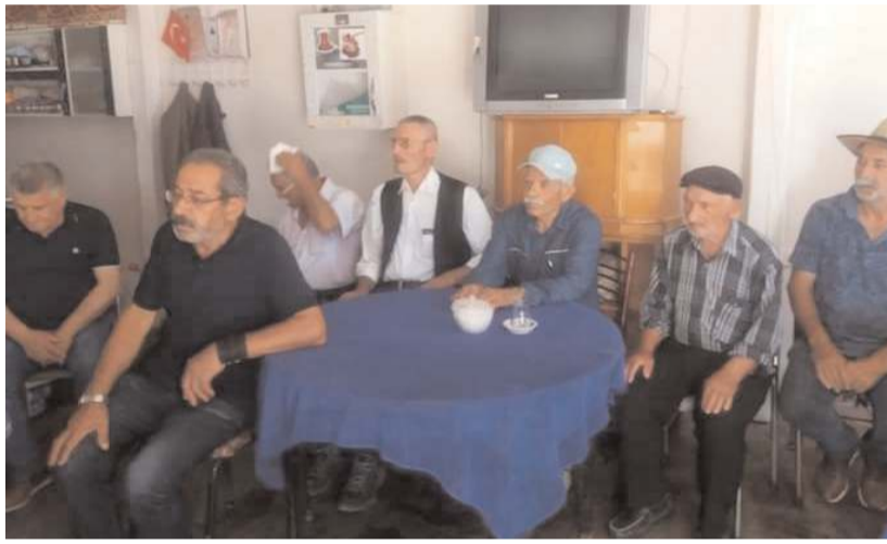
Kongreye katılım yüksek oldu.

14 Mayıs ve 29 Mayıs Seçimleri'ne ilişkin görüşlerini dile getiren İl Başkanı Ümit Er, Kılıçdaroğlu'nun 2017 yılında gerçekleştirdiği Adalet Yürüyüşü'ne de dikkat çekti. Ümit Er, "CHP'liler olarak Genel Başkanımız Sayın