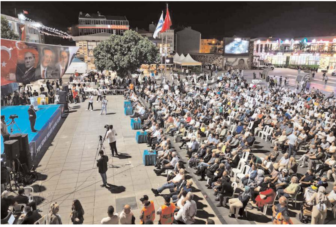
Kadeş Meydanı'nda düzenlenen tanıtım toplantısına çok sayıda vatandaş katıldı.