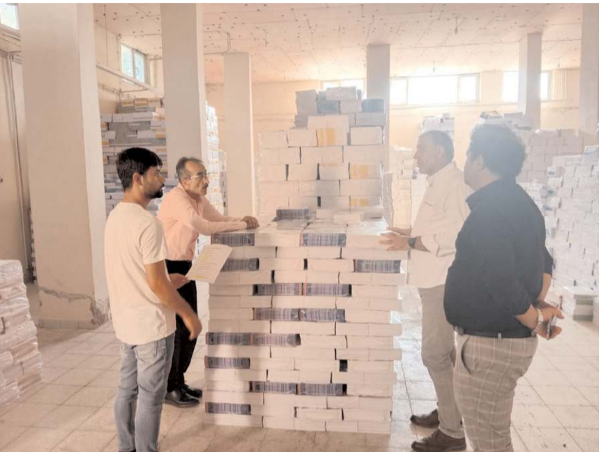
Kitapların yüzde 70'i dağıtımına hazır.