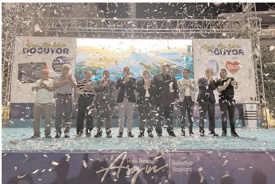
Toplantı sonrası protokol üyeleri hep birlikte poz verdi.