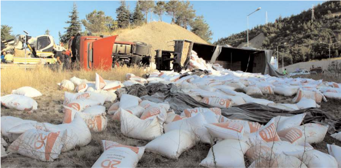
Tırda yüklü un çuvaları etrafa dağıldı.