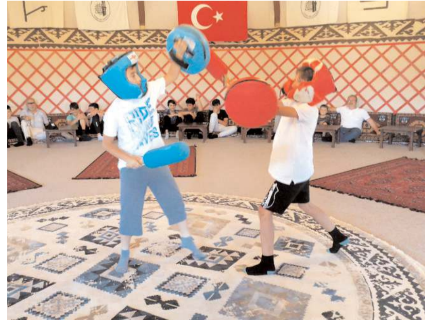
Çocuklar kursta sportif faaliyetlere de katıldı.