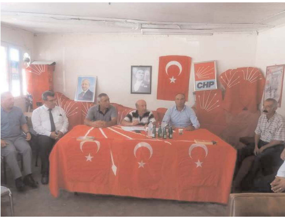
Kongrede ilk olarak divan heyeti belirlendi.