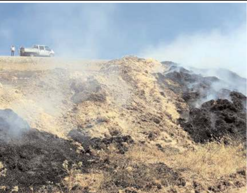
İtfaiye ekipleri yangını ekili arazilere sıçramadan söndürdü.

Yangınla ilgili başlatılan soruşturma sürüyor. (İHA)