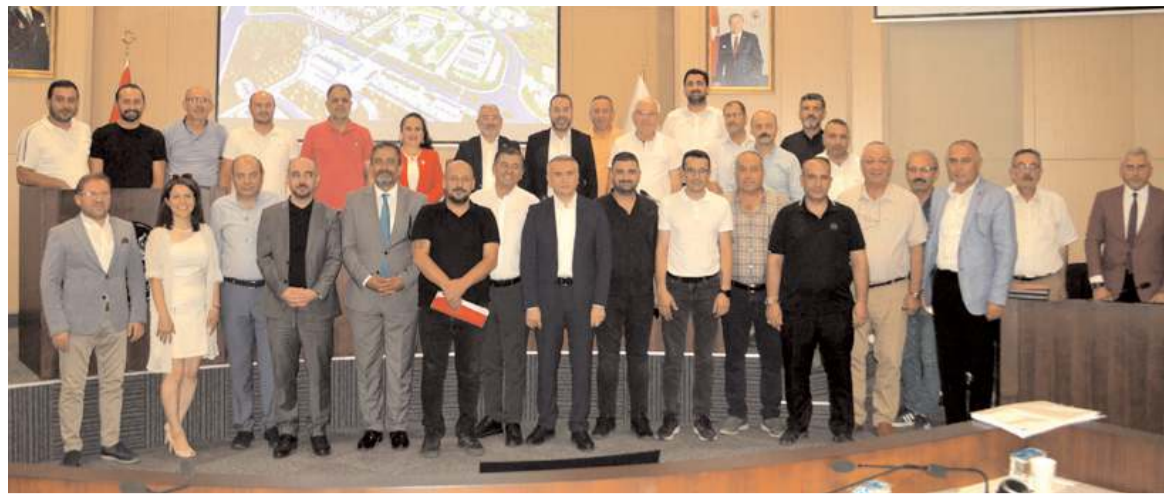
Yeni Şehir Projesi imar değişikliği talebinin kabul edilmesinin ardından günün anısına toplu fotoğraf çekildi.

Yeni bir uygulamaya geçileceğini ifade eden Başkan Aşgın, "Birlik ilk etapta sahihsiz köpeklerde kısırlaştırma çalışmalarına ağırlık verdi. Kısa zamanda bunun sonuçlarını alacağımızı tahmin ediyoruz. Şuan da 4 farklı noktada doğal yaşam alanları oluşturulması ile ilgili hazırlık yapıyoruz. Bu doğal yaşam alanlarından bir tanesi Çatak yolu üzerinde çok büyük bir alan. Çorum merkez, Ortaköy ve Mecitözü ilçelerini kapsayacak. Sokak hayvanlarına burada doğal yaşam alanları bakılacak. Osmançık, Sungurlu, İskilip'te de doğal yaşam alanları yapılacak. Birlik bu yönde çalışmalarına devam ediyor. Doğal yaşam alanları ile ilgili süreci de yönetiyoruz. Sahipsiz sokak hayvanlarının tamamını devletimiz sahiplenmiş olacak. Doğal yaşam alanlarında muhafaza edilecek" dedi.