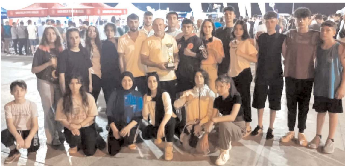
Samsun'da yapılan Muay Thai turnuvasında mücadele eden Çorumlu sporcular ve antrenörler toplu halde