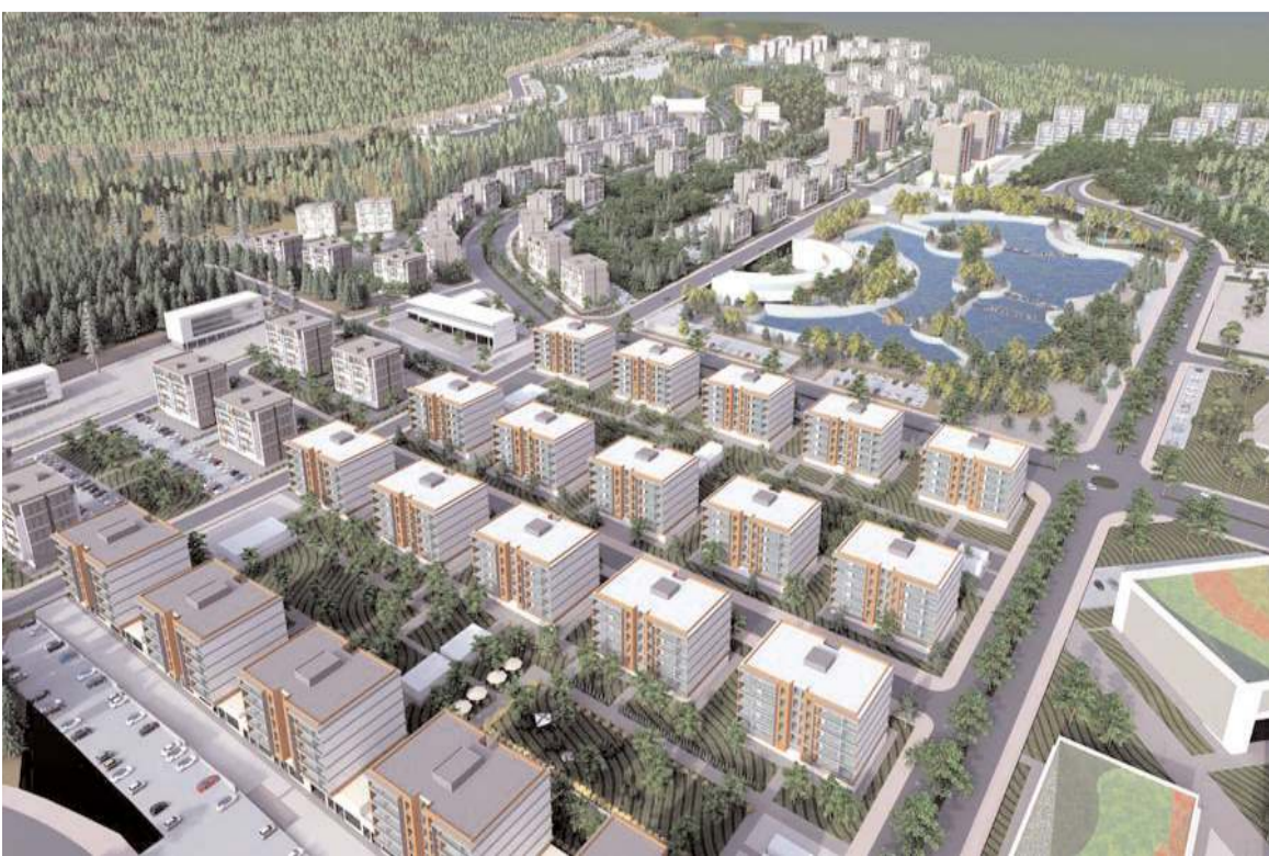
1 milyon 870 bin metrekare alanda hayata geçirilecek "Yeni Şehir Projesi" tamamlandığında böyle olacak.