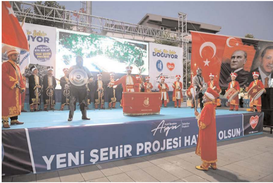
Tanıtım toplantısı Mehteran Takımı'nın gösterisi ile başladı.

Başkan Aşgın, Çimento Fabrikası'nın geçmişte sosyal tesis olarak kullandığı arazinin çevre yoluna bakan 270 dönümlük kısmında ticaret ve turizm alanı olarak planlandığını belirtti. Projede ticaret ve turizm merkezi ola-