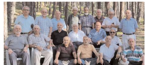
Buluşma programı Abdullah Yaylasında yapıldı.