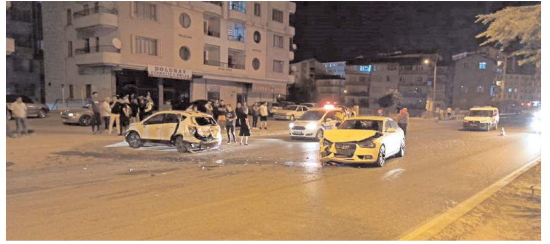
Kaza, Sungurlu-Kırıkkale kara yolunda meydana geldi.

Yangında bahçedeki 15 ceviz ağacı zarar gördü.