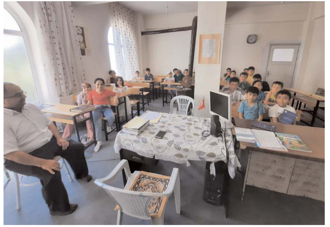
İlçe genelinde 64 camide yaz Kur'an kursu açıldı.

Eskiye Köyü’ndeki Su Terfi İstasyonundaki Güneş Enerji Santralinde yıllık 800 bin kilowatt saat elektrik üretimi yapıyor.