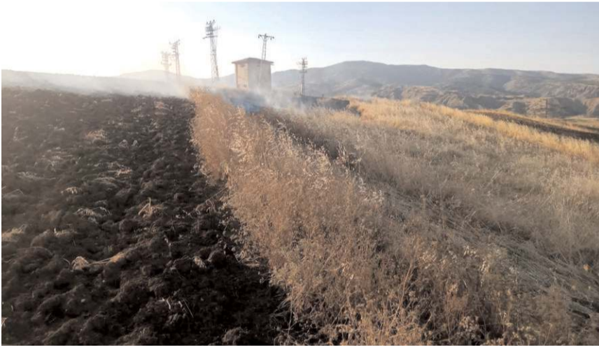
Olayda yaklaşık 10 dönüm anız yandı.