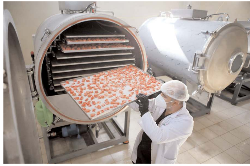
400 kilogram işleme kapasitesine sahip dondurularak kurutma tesisinin kapasitesi günlük 3 bin kilograama çıkartılacak.