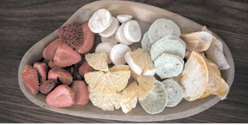
Ürünler dondurularak kurutuluyor.