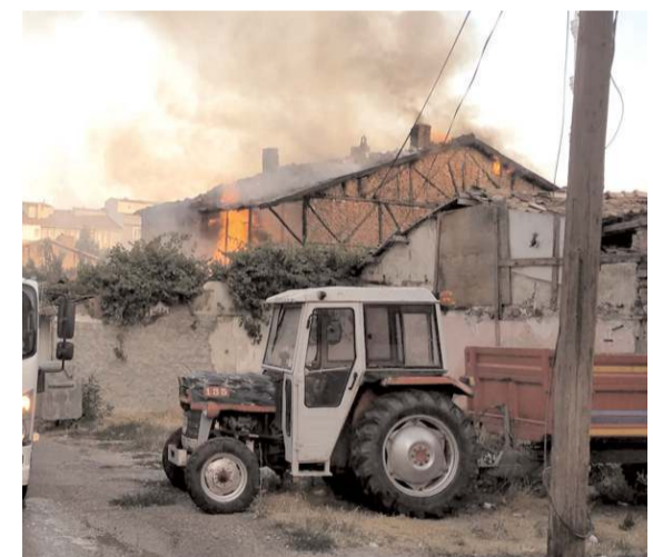
Yangın Çepni Mahallesi Ömür 2.Sokak'ta bulunan metruk evde çıktı.

■ Merzifon-Çorum kara yolunda meydana gelen zincirleme trafik kazasında 1 kişi öldü, 3 kişi de yaralandı. * HABERİ 5'TE