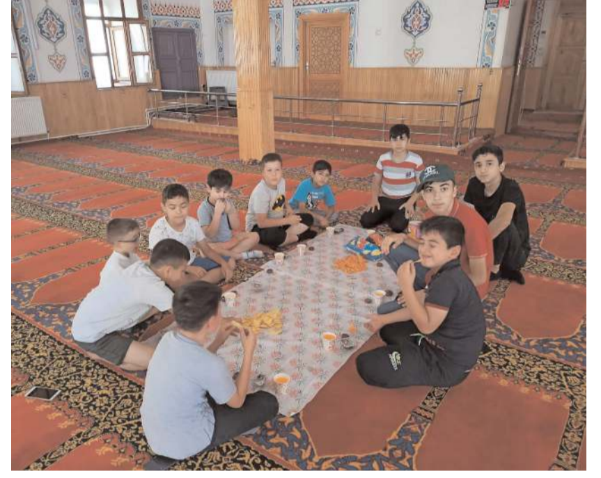
Çocukların camilere ilgisini artırmak için çeşitli etkinlikler yapılıyor.

Çocukların camilere ilgisini artırmak isteyen vatandaşlar da kimi zaman çocuklara dondurma, kek, meyve suyu gibi ikramlarda bulunuyor.(AA)