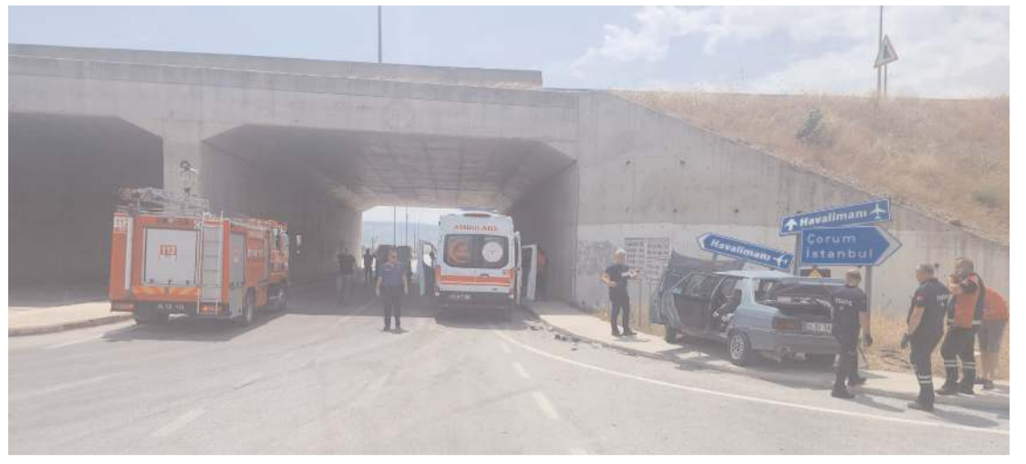
Kaza Merzifon-Çorum kara yolunun Havalimanı yol ayrımında meydana geldi.

Şahin, verdiği soru önergesinde Çevre, Şehircilik ve İklim Değişikliği Bakanı Mehmet Özhasseki'nin yanıtlanması istemiyle şu soruları sordu: "Hak sahibi emeklilere söz konusu konutların inşaatı bitirilerek anahtar teslimi hangi tarihte gerçekleştirilecektir? Bu konutların geç teslimi nedeni ile hak sahibi emeklilerin uğradığı zararların tazmini için herhangi bir işlem yapılacak mıdır?" (Haber Merkezi)