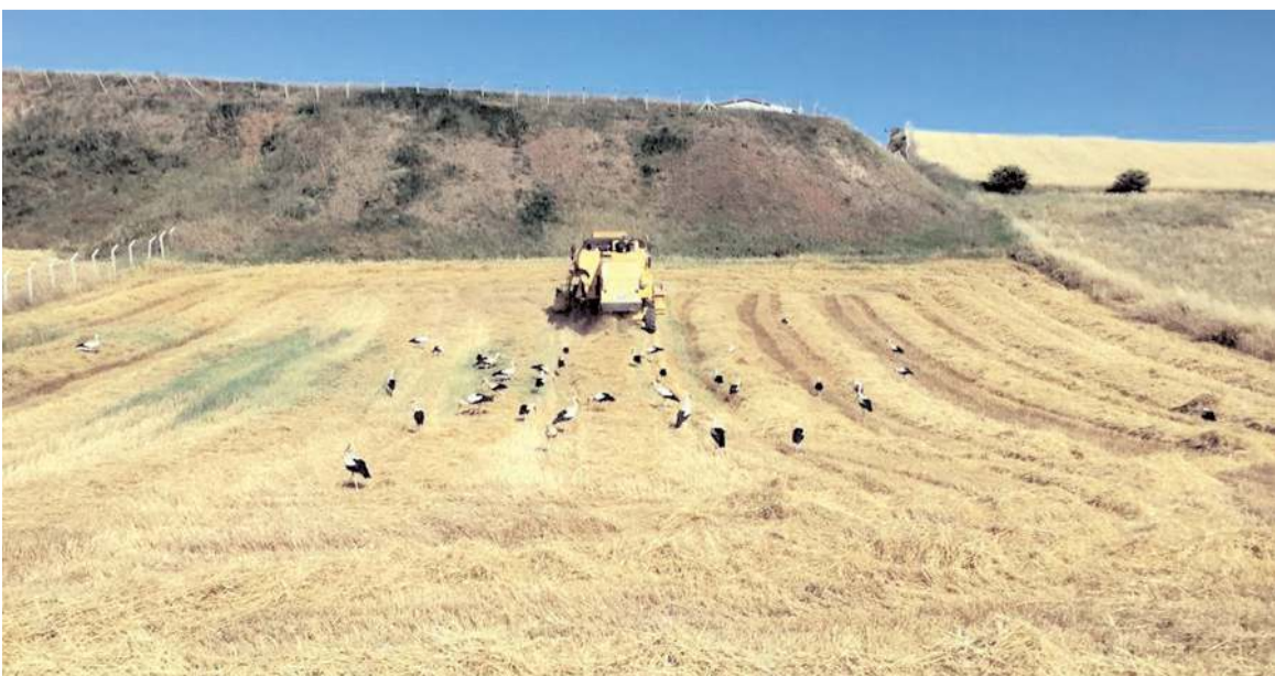
Leylek sürüsü hasat yapılan tarlaya konarak karınlarını doyurdu.

Çevredeki çiftçiler, çalışmalarına ara vererek cep telefonlarıyla leylekleri görüntüledi.