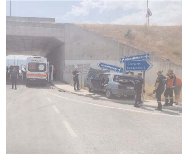
Kazada minibüste bulunan Çorumlu güvenlik görevlisinin de aralarında olduğu 3 kişi yaralandı.