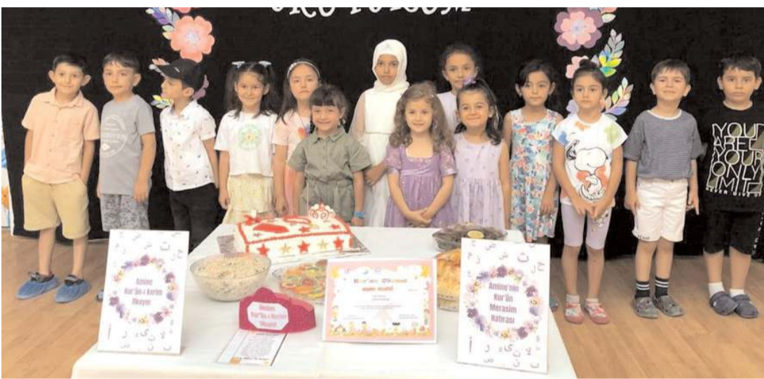
Öğrenciler salavatlar ve ilahiler eşliğinde sahneye geldi.