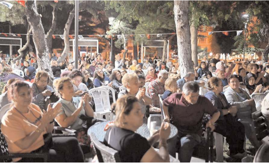
Konsere ilgi yüksek oldu.