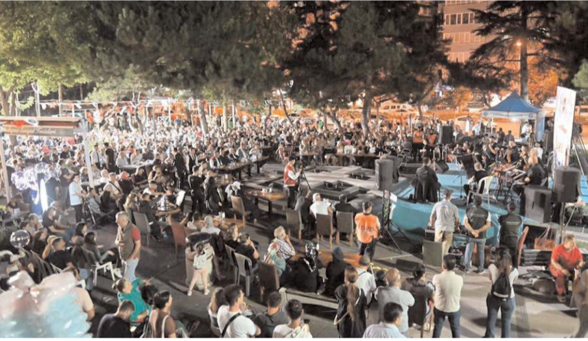
Vatandaşlar Türküler eşliğinde güzel bir akşam geçirdiler.