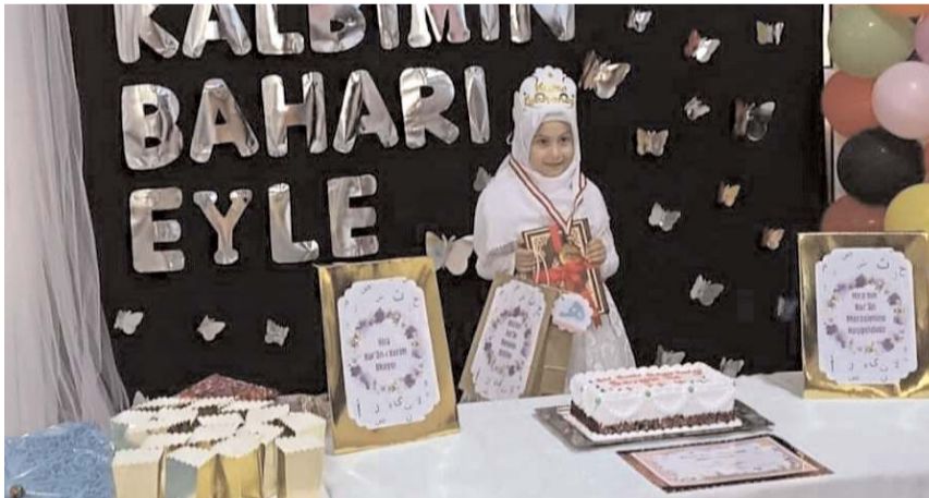
Öğrencilere Kur'an-ı Kerim hediye edildi ve Kur'an tacı giydirilerek çeşitli hediyeler verildi.