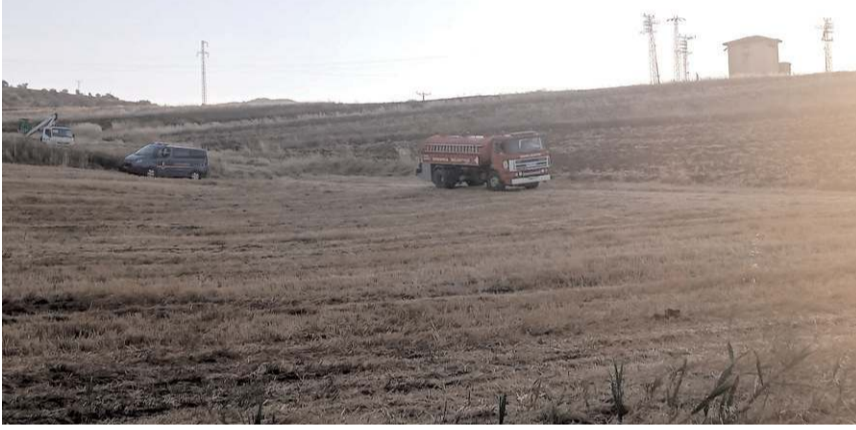
Olay Gepür mevkiinde meydana geldi.

Bölgedeki elektrik trafosundan sıçrayan kıvılcımdan kaynaklandığı tahmin edilen yangın nedeniyle yaklaşık 10 dönüm anız yandı.(AA)