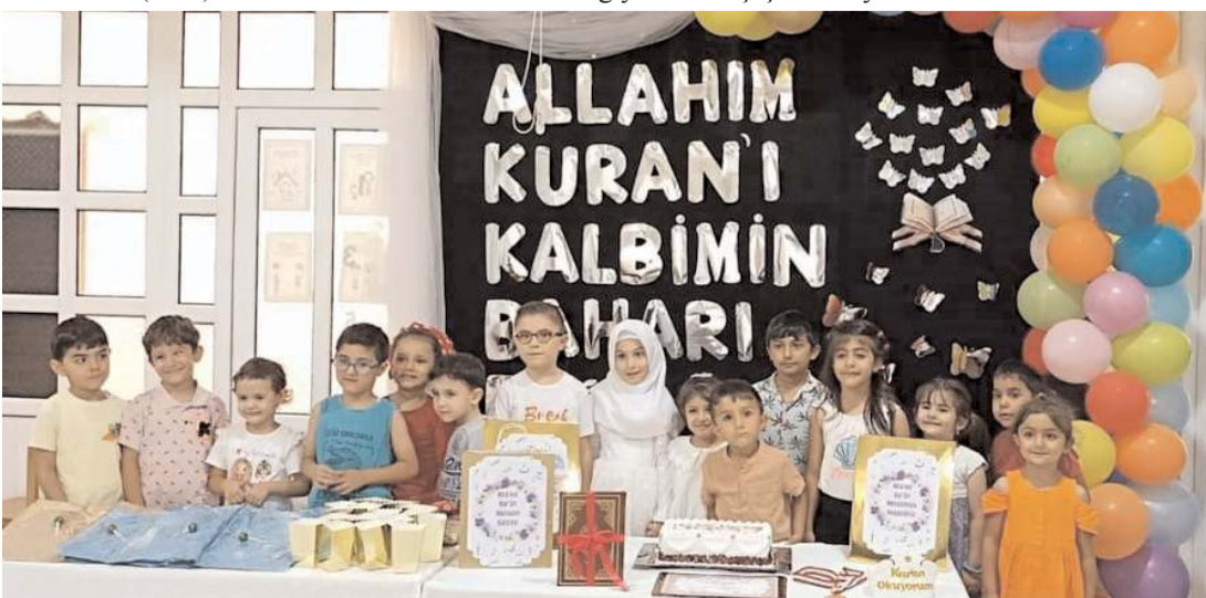
Günün anısına toplu fotoğraf çekildi.