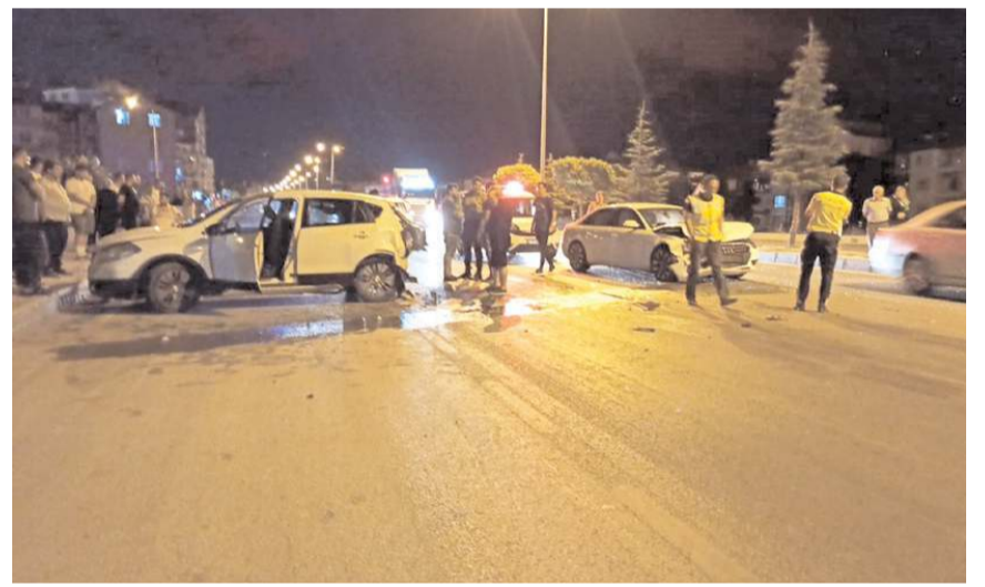
Kaza nedeniyle trafik bir süre durdu.