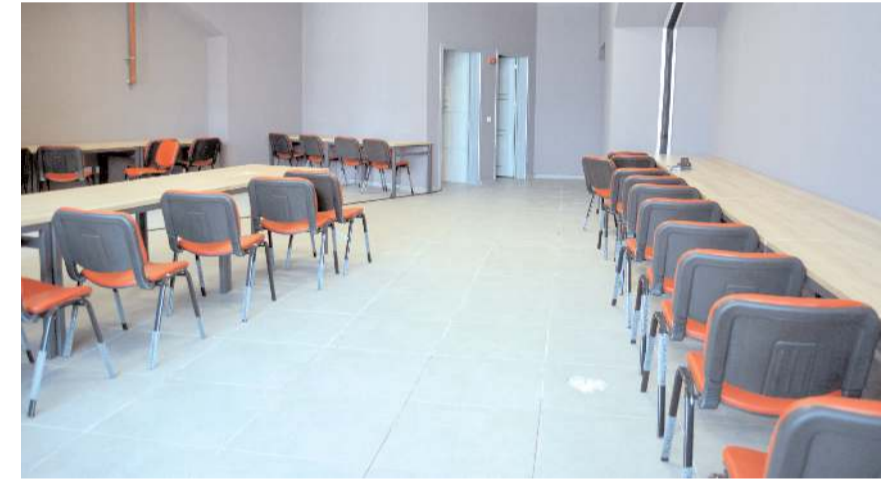
Saha içi basın mensupları için oluşturulan basın çalışma odası hazır