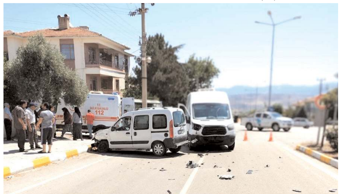
Kazada her iki araçta da maddi hasar meydana geldi.

Kazada yaralanan hafif ticari araç sürücüsü, sağlık ekiplerince yapılan ilk müdahalenin ardından kaldırıldığı Dodurga Devlet Hastanesi'nden Hitit Üniversitesi Erol Olçok Eğitim Araştırma Hastanesi'ne sevk edildi.(AA)