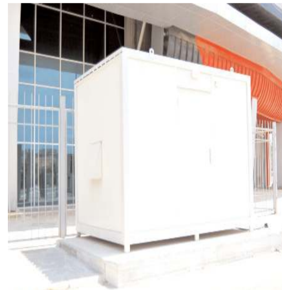
Canlı yayın için kullanılacak bu odada en modern sistemde hizmet vermeye hazır