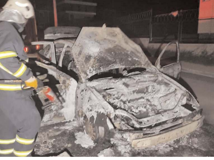
Olayda otomobil hurdaya döndü.

Çorum'da yangın çıkan otomobil kullanılamaz hale geldi.