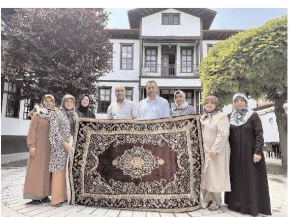
Kadın Kültür ve Sanat Merkezi'nde açılan ipek halı dokuma kursu tezgahından ilk ürün çıktı.