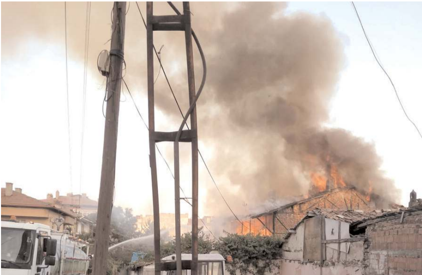
Yangın Çepni Mahallesi Ömür 2.Sokak'ta bulunan metruk evde çıktı.