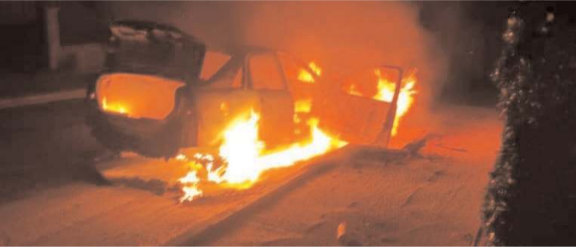
Olay Kale Mahallesi Ata 44. Sokak'ta meydana geldi.

Çorum Belediyesi İtfaiye ekiplerinin müdahalesiyle söndürülen yangında araç kullanılamaz hale geldi.(AA)