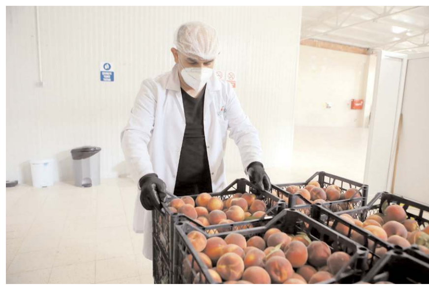
Tesis Çorum Organize Sanayi Bölgesi'nde (OSB) 12 bin metrekare alana kuruldu.