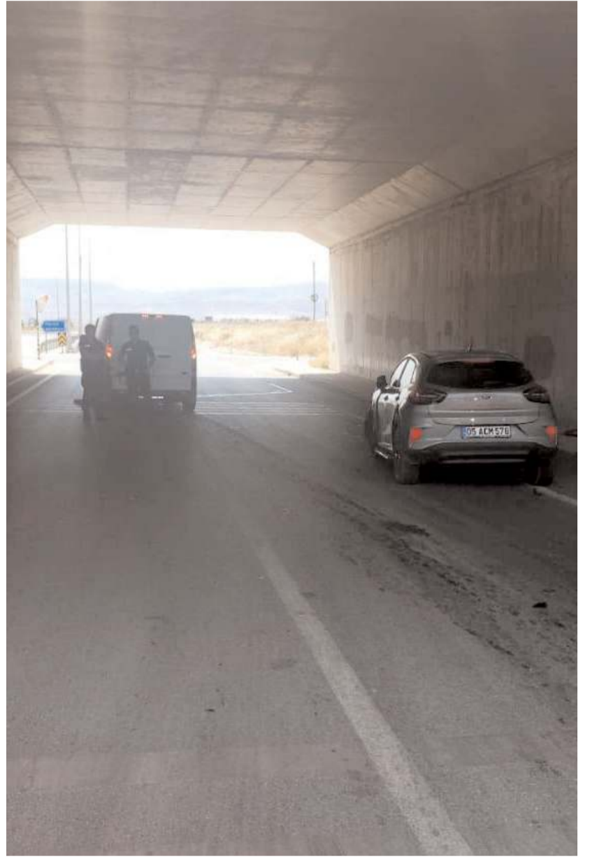
Kazada minibüste bulunan Çorumlu güvenlik görevlisinin de aralarında olduğu 3 kişi yaralandı.

Yaralılar olay yerinde yapılan ilk müdahalenin ardından