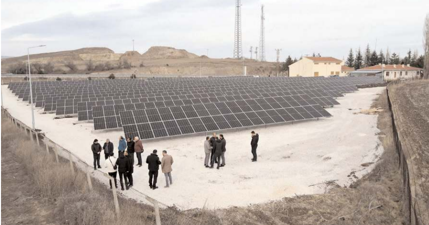
Çorum Belediyesi'nin Ladik'te bulunan Rüzgar Enerjisi Santrali.

Eskiye Köyü’ndeki Su Terfi İstasyonundaki Güneş Enerji Santralinde yıllık 800 bin kilowatt saat elektrik üretimi yapıyor.