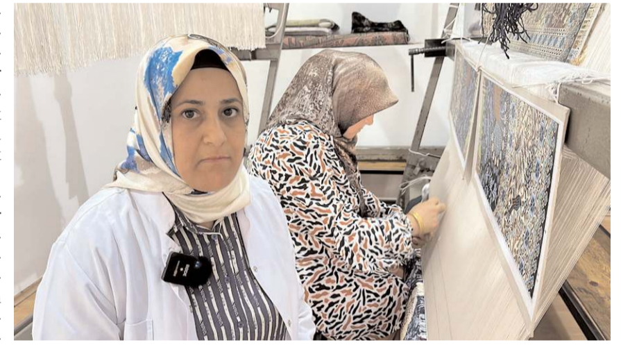
Velipaşa Kadın Kültür ve Sanat Merkezi'nde yaklaşık bir yıldır kurslara devam eden ev hanımları aldıkları eğitimle halı dokumayı öğrendi.