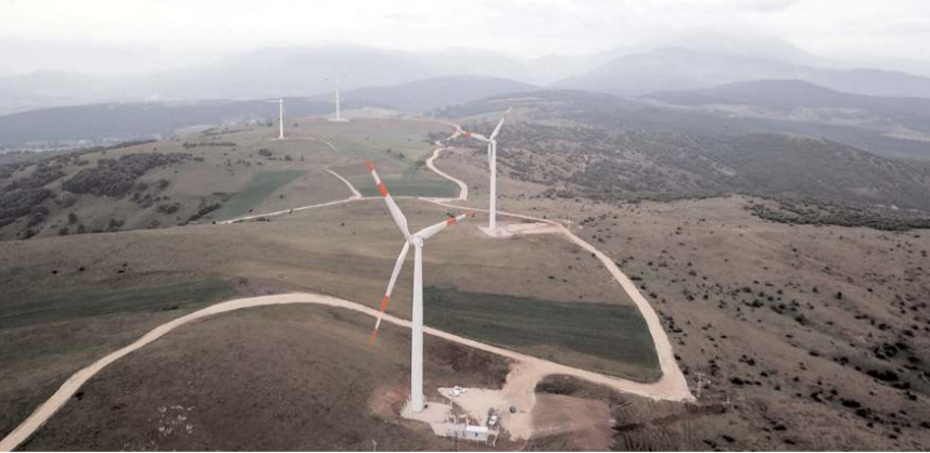
Çorum Belediyesi'nin Ladik'te bulunan Rüzgar Enerjisi Santrali.