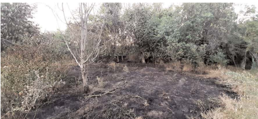
Olay Dodurga-İskilip kara yolunda meydana geldi.