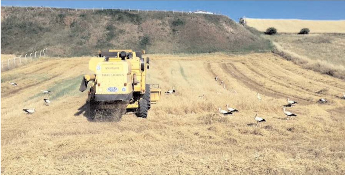
İlkbaharda bölgeye gelen leylekler, güneyde kışı geçirmek için sürüler halinde göçe başladı.