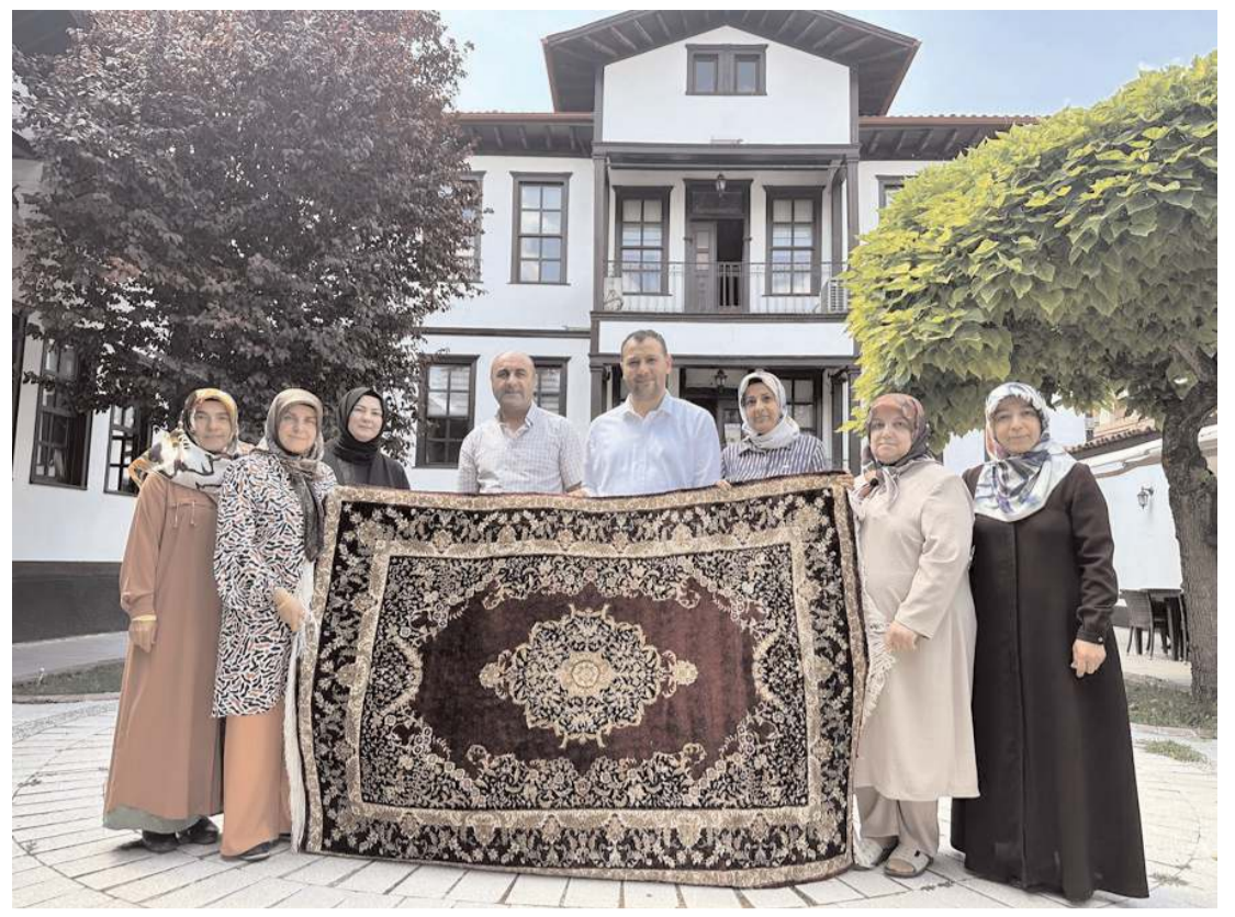
Kadın Kültür ve Sanat Merkezi'nde açılan ipek halı dokuma kursu tezgahından ilk ürün çıktı.