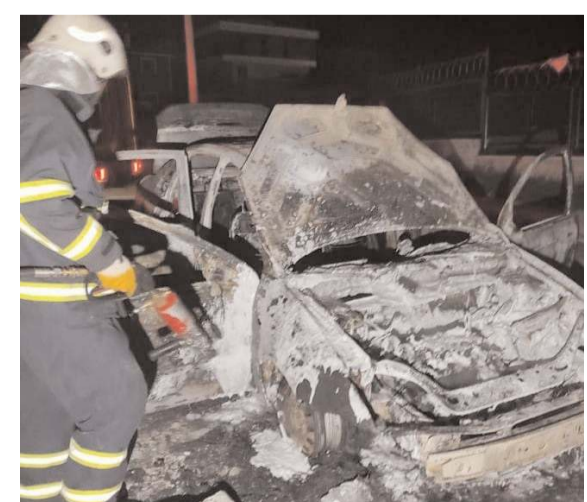
Olayda otomobil hurdaya döndü.