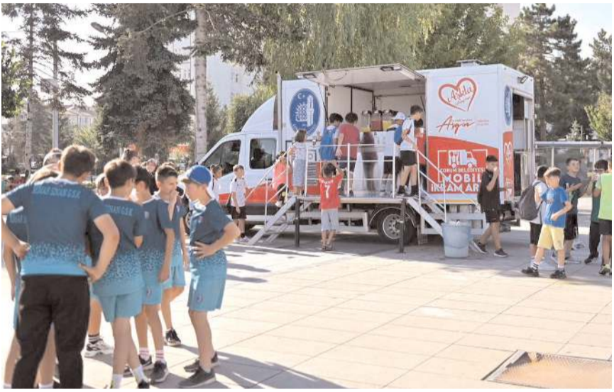
Çorum Belediyesi ikram aracı minik sporculara soğuk içecek ikram etti