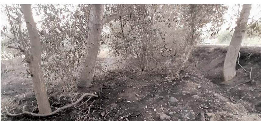
Yangında bahçedeki 15 ceviz ağacı zarar gördü.

Dodurga'da çıkan yangında 15 ceviz ağacı zarar gördü.