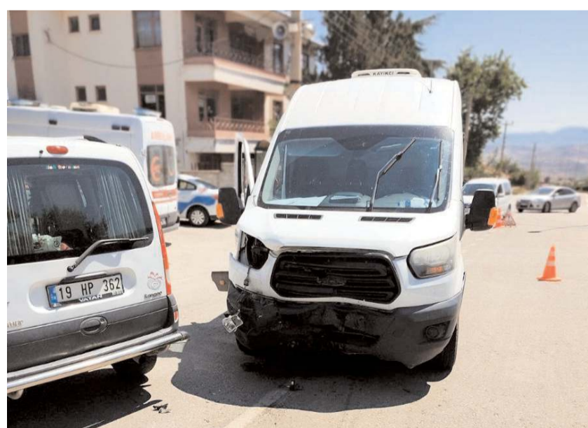
Kaza Çorum Caddesi Yunus Emre Parkı Kavşağı'nda meydana geldi.

Dodurga'da minibüsle çarpışan hafif ticari aracın sürücüsü yaralandı.