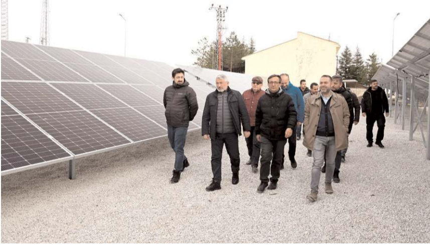
Çorum Belediyesi'nin Ladik'te bulunan Rüzgar Enerjisi Santrali.