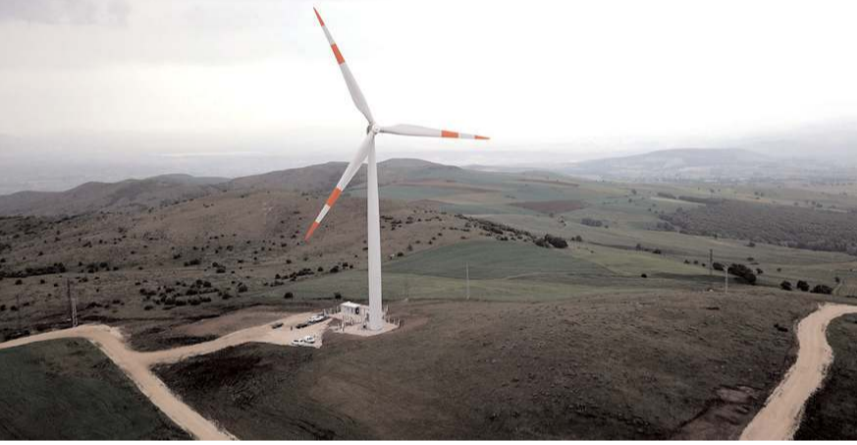
Çorum Belediyesi'nin Ladik'te bulunan Rüzgar Enerjisi Santrali.