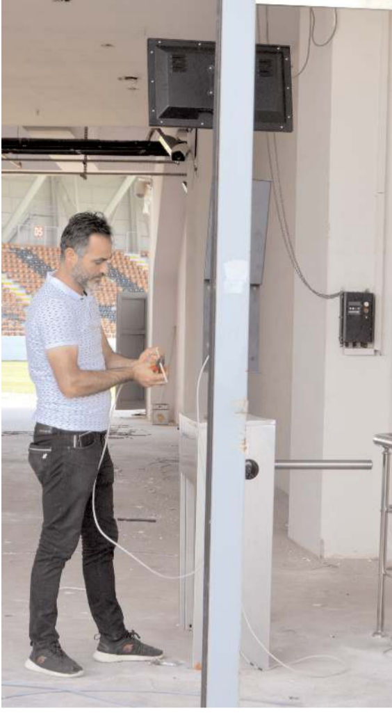
Tüm kapılara yüz tanıma sistemi kurulumunda sona gelindi

montajına başlanacağı ve ligin ilk maçına kadar büyük oranda tamamlanacağı belirtildi.