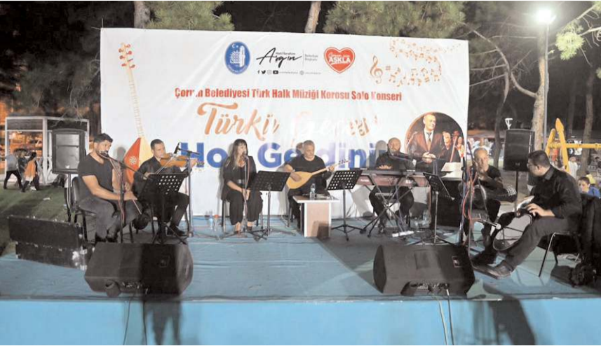
Konser Pir Baba Parkı'nda yapıldı.