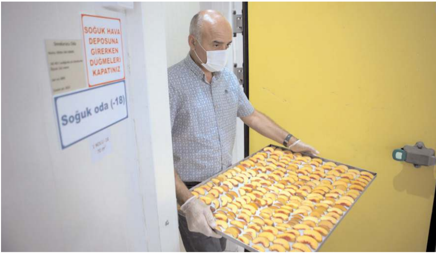
Ürünler İngiltere, Almanya, Amerika, Suudi Arabistan ve Rusya'ya ihraç ediliyor.