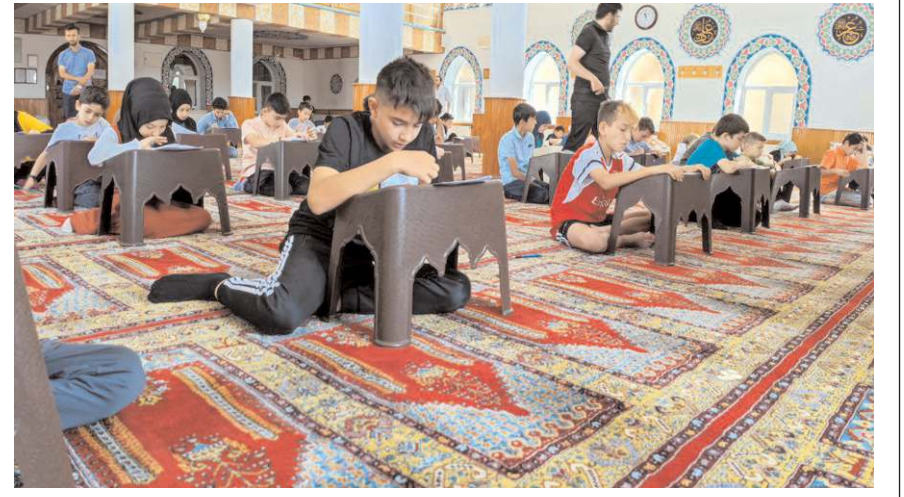
Oğuzlar ilçesindeki Kur'an kurslarında eğitim gören öğrenciler arasında ödüllü bilgi yarışması yapıldı.