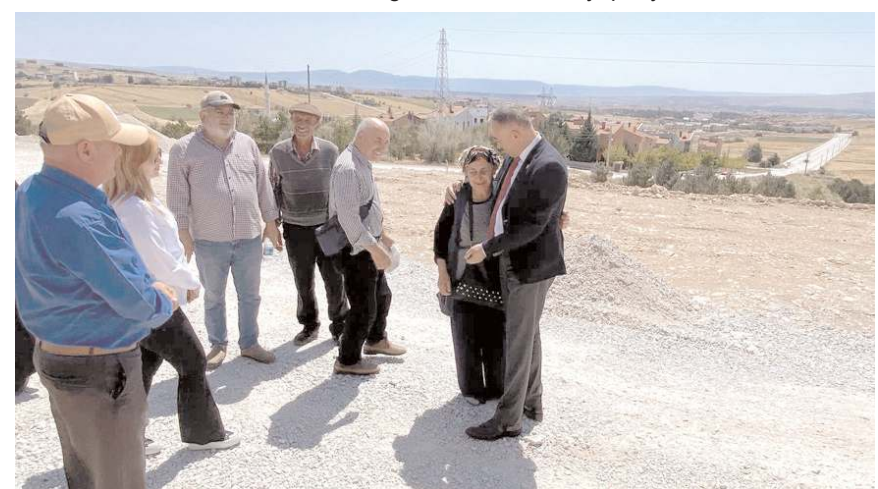
Milletvekili Mehmet Tahtasız, vatandaşların sorunlarını dinledi.

olsaydı burada 100 değil, 400 kişi çalışırdı ve konutlar da söz verildiği tarihte biterdi” dedi.