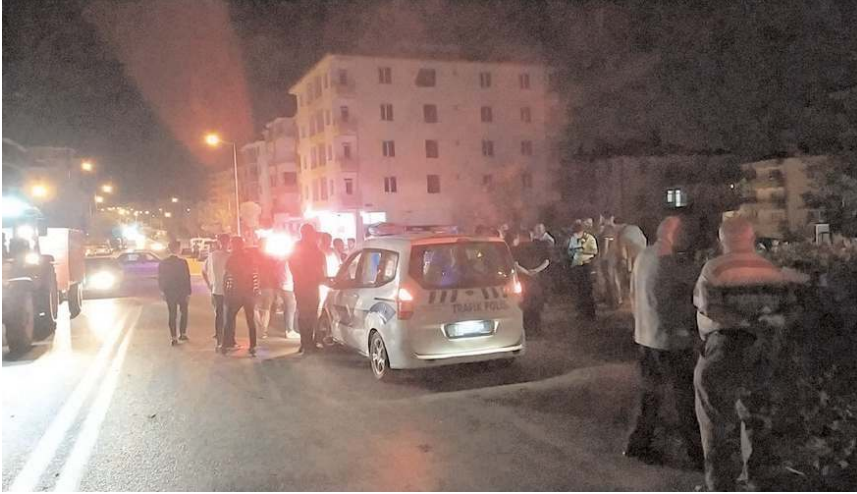
Polis ekipleri olay yerinde incelemede bulundu.