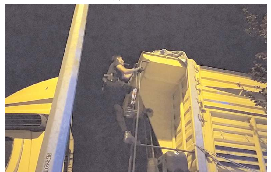
Ekipler bölgede şüpheliyi aradı.