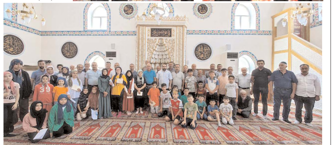
Ayrıca yarışmaya katılan bütün öğrencilere çeşitli hediyeler verildi.