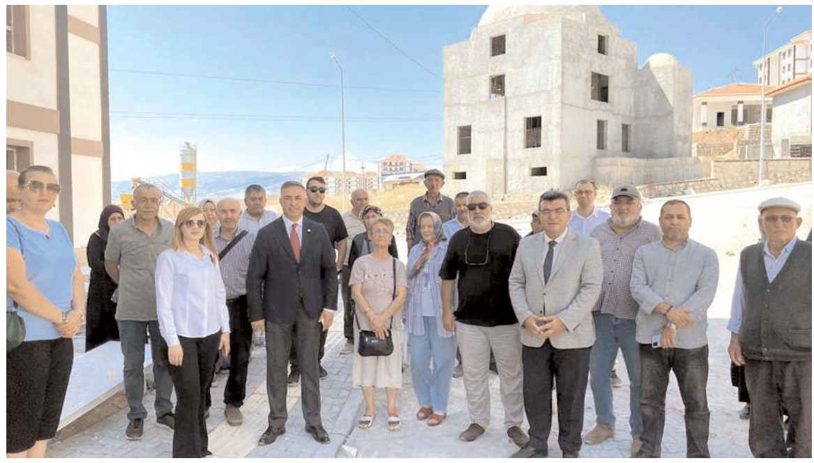
Bazı hak sahipleri Silmkent TOKİ konutları önünde toplanarak eylem yaptılar.

Yaz başından bu yana klima yetersizliği nedeniyle hastaların mağdur olduğunu kaydeden Tahtasız, “Yetkililerden aldığım bilgiye göre yeni klima üniteleri için ihale yapılmış ancak en erken 1.5 ay sonra tamamlanacak. Ülke genelinde ve ilimizde devam eden aşırı sıcaklıklar nedeniyle Hitit Üniversitesi Erol Olçok Eğitim ve Araştırma Hastanesi'nde klimalar yetersiz kalıyor. Hastalar sıcağın bunalıyor. Ayrıca sıcak hava ile birlikte mikropların çoğalma riski de artıyor. Şu an yalnızca Acil Servis, Ameliyathane ve yoğun bakım sağlıklı bir şekilde soğutuluyor. Sıra beklemekten perişan olan hastaları bir de sıcaklar bunalıyor. Bu sorunun bir an önce çözülmesini bekliyoruz” dedi. (Haber Merkezi)