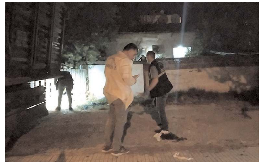
Polis ekipleri olay yerinde incelemede bulundu.