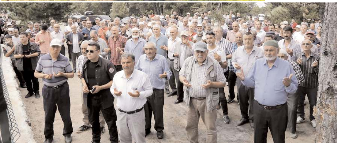
Yapılan duanın ardından açılış kurdelesini kesti.