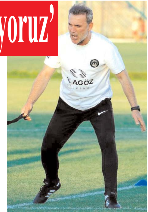
hasmanında taraftarımızın gücünü arkamızda hissedeceğiz. Bu güç ile birlikte sezona iyi bir sonuçla başlamayı hedefliyoruz.

Biz gücümüzü taraftarımızdan alıyoruz. O yüzden taraftarımızdan ricam takımımızı maçın başlangıç düdüğünden son düdüğe kadar desteklemesini istiyorum. Biz Tuzla dep-