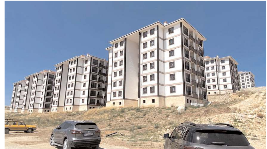
TOKİ Silmkent bölgesinde 743 konut yapılıyor.