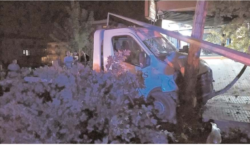
Kaza, Çorum il merkezi Gülabibey Mahallesi Bağcılar 4. Caddede meydana geldi.