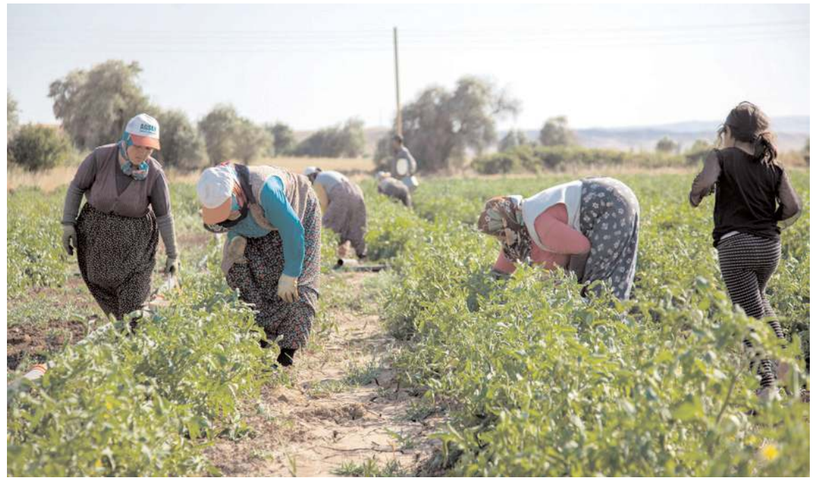
Çorum'da 18 bin 136 dönüm alanda domates üretimi yapılıyor.