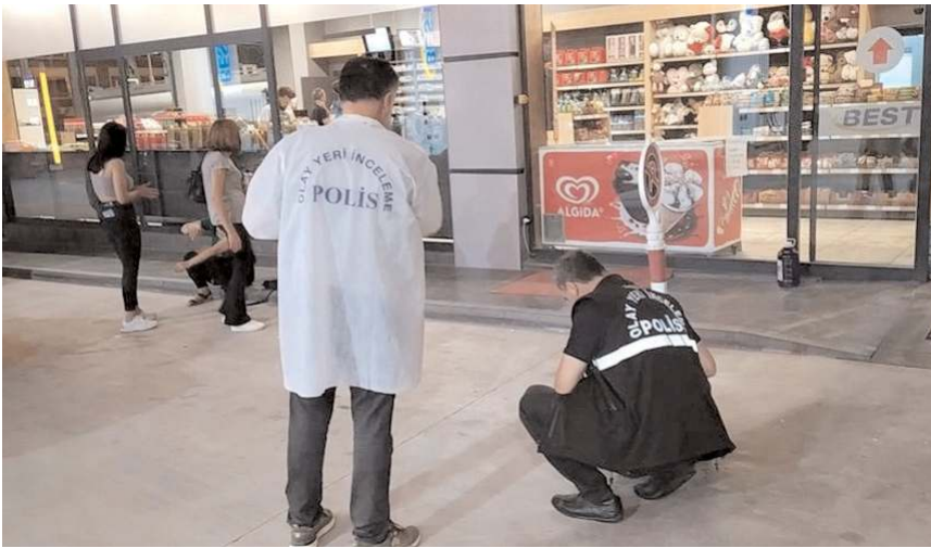
262 bin 590 erkek nüfusu olan Çorum'da suç sayısı 2286 olarak belirtildi.

Özellikle 15-25 yaş arası gençlerin ellerinde silahları gören vatandaşlar tedirgin olurken, yetkililerin bu konuda caydırıcı adımlar atması için gerekli çalışmaları yapmasını istiyor.