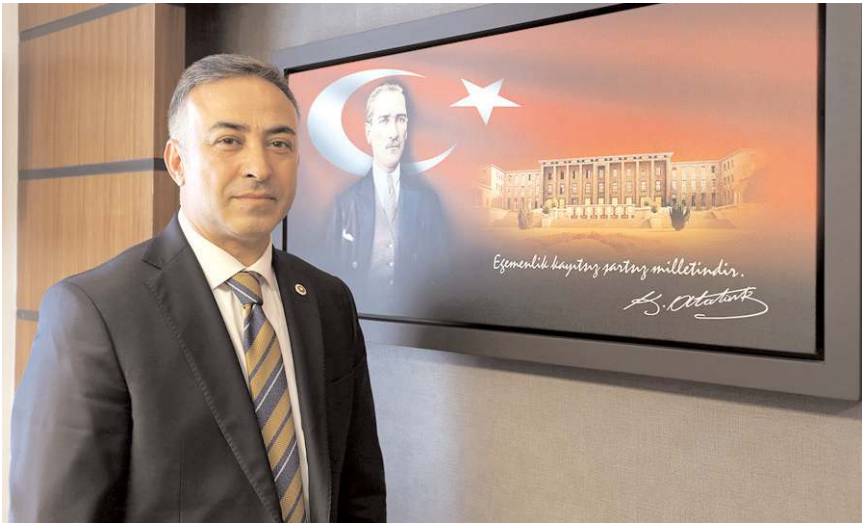
CHP Çorum Milletvekili Mehmet Tahtasız