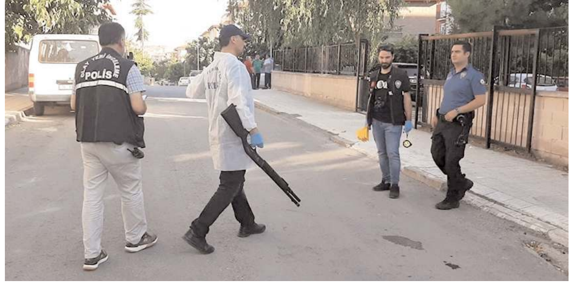
Çorum'da özellikle 15-25 yaş gençler arasında silahlanma arttı.