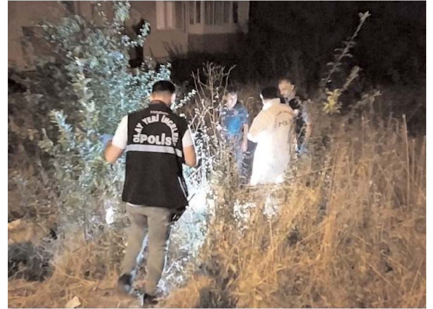
Olay, Bahçelievler Mahallesi 7. Sokak'ta meydana geldi.