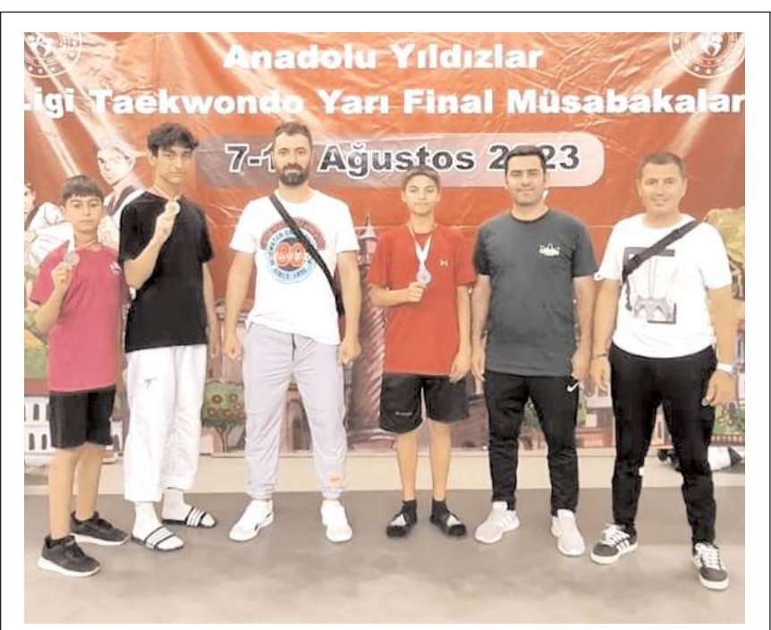
Yarı finalde madalya kazanarak finallere giden sporcular antrenörleri ile birlikte