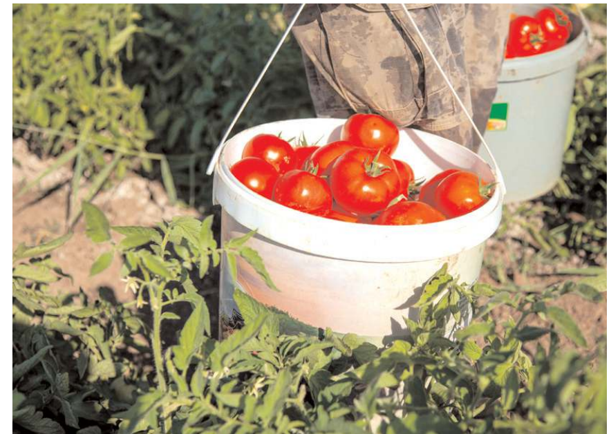
Çorum'da yıllık ortalama 66 bin 679 ton domates üretiliyor.

Masaloğlu, hasat döneminde ortalama 10 kadına iş imkanı sağladığını sözlerine ekledi. (AA)