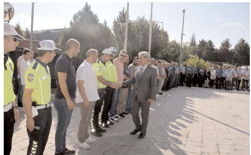
Mehmet Gülser için Emniyet Müdürlüğü bahçesinde veda programı yapıldı.