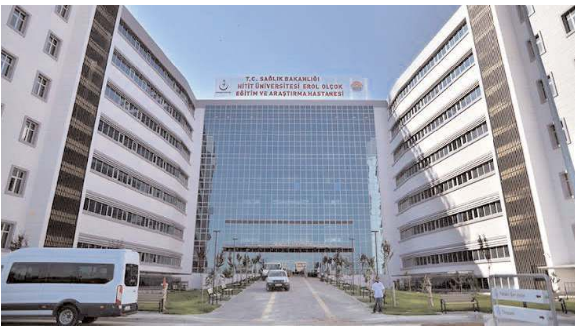
Hastane yönetimi iklimlendirme sistemini güçlendirme için ihale yaptı.