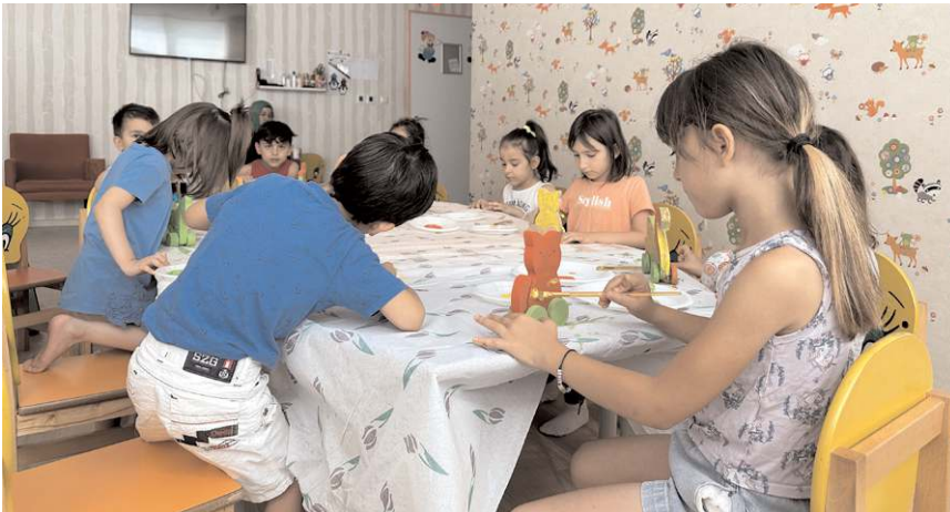
Etkinlikler hafta içi her gün ve Cumartesi günleri, sabah ve öğleden sonra ikişer grup halinde gerçekleşiyor.