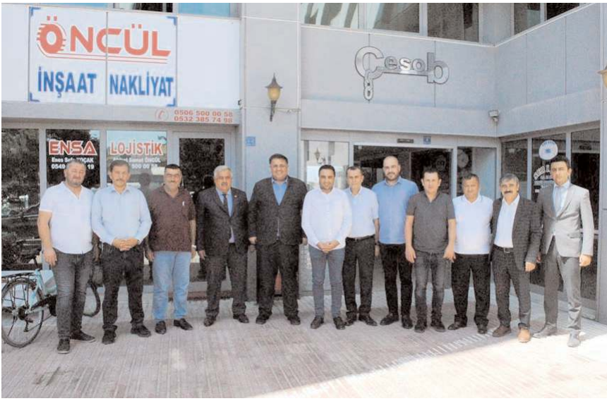
Ziyaretin anısına toplu fotoğraf çekildi.