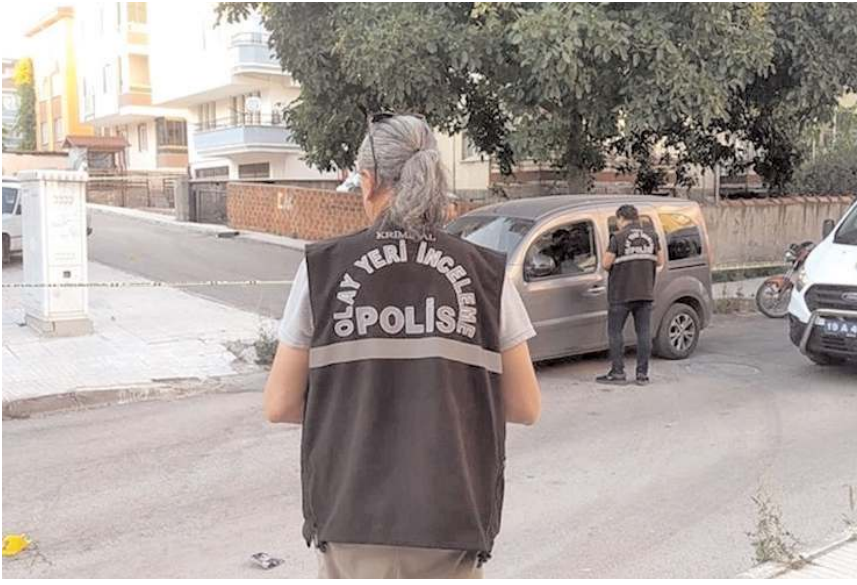
Vatandaşlar asayiş olaylarının önlenmesi için tedbir alınmasını istiyor.