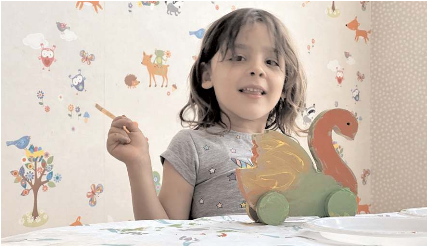
Etkinlikler kapsamında ahşap oyuncak boyama atölyesi faaliyetleri yapılacak.