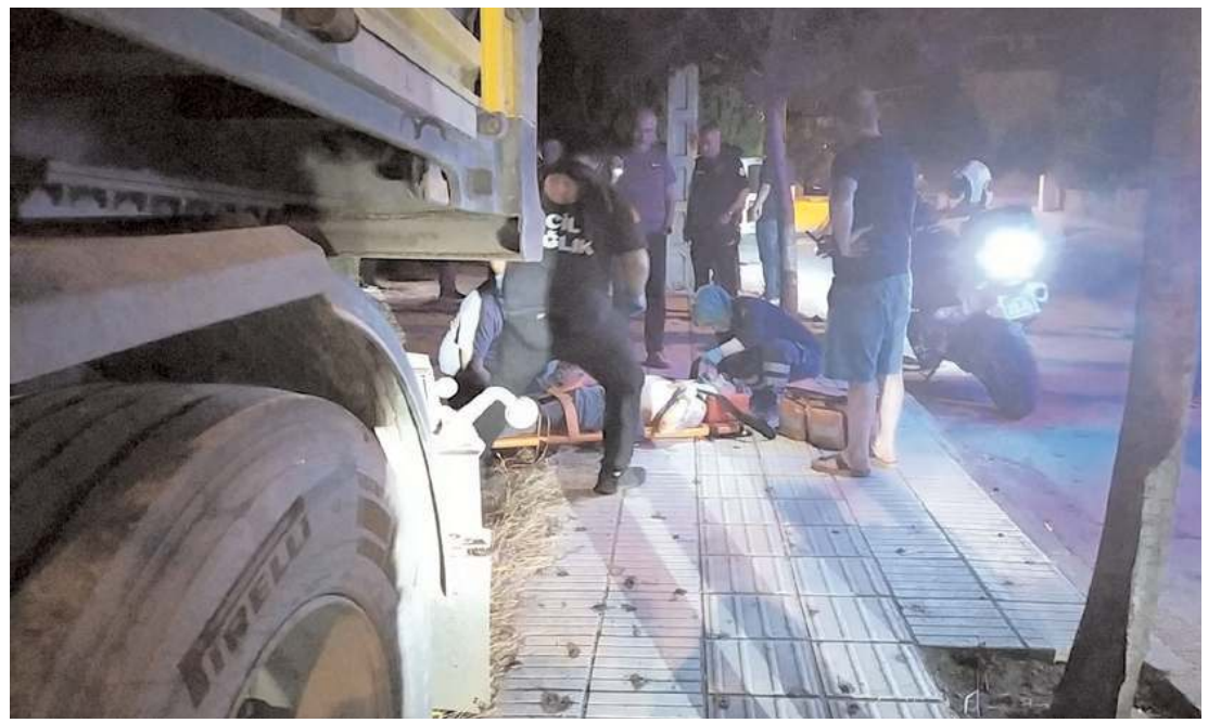
Yaralıya ilk müdahale 112 acil sağlık ekipleri tarafından olay yerinde yapıldı.

Kazayla ilgili inceleme başlatıldı. (İHA)