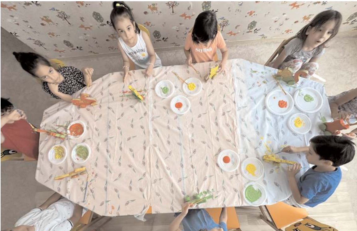
Etkinliklerin ilk gününde ahşap oyuncak boyama çalışması yapan çocuklar, keyifli bir gün geçirdi.

Çorum Belediyesi, ailelerin birlikte keyifli vakit geçirmesini sağlamak ve çocukların gelişimine katkıda bulunmak amacıyla "Ailem ve Ben" Yaz Atölyeleri Etkinliği düzenledi. 26 Ağustos tarihine kadar gerçekleşecek olan etkinlikler Buhara Kadın Kültür Merkezi'nde başladı.