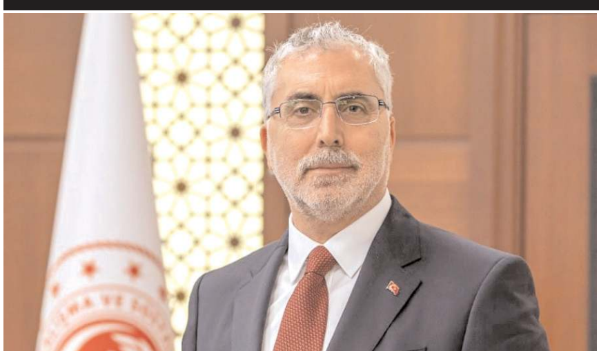
Çalışma ve Sosyal Güvenlik Bakanı Prof. Dr. Vedat Işıkhani

■ Çalışma ve Sosyal Güvenlik Bakanı Prof. Dr. Vedat Işıkhani, AK Parti'nin "Şehir Buluşmaları" kapsamında bugün Çorum'da olacak.