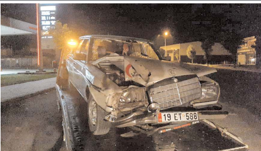
Kaza Mimar Sinan 11. Caddede meydana geldi.