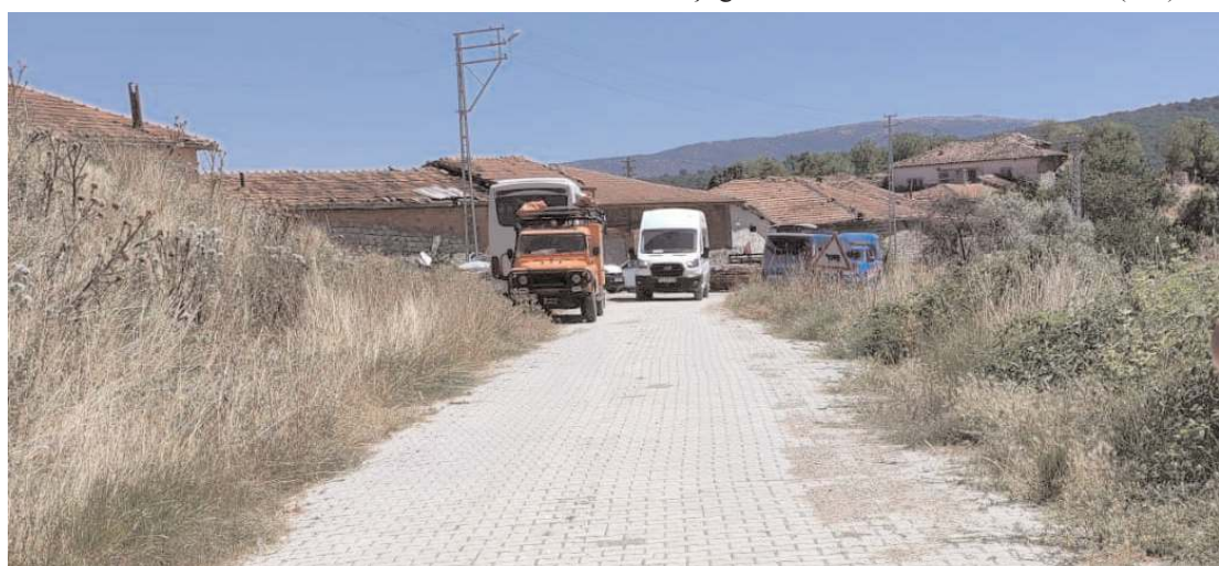
Neşet Acar'ı arama çalışmalarına Jandarma ve AFAD ekipleri katılıyor.

Jandarma ve AFAD ekipleri, köy çevresi ile civar köylerde arama çalışmalarını sürdürdü. Çalış-