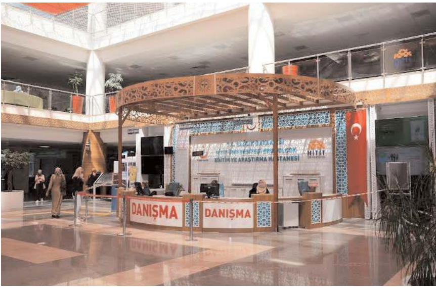
Hastanenin iklimlendirme sisteminde bir süredir sorun yaşanıyor.