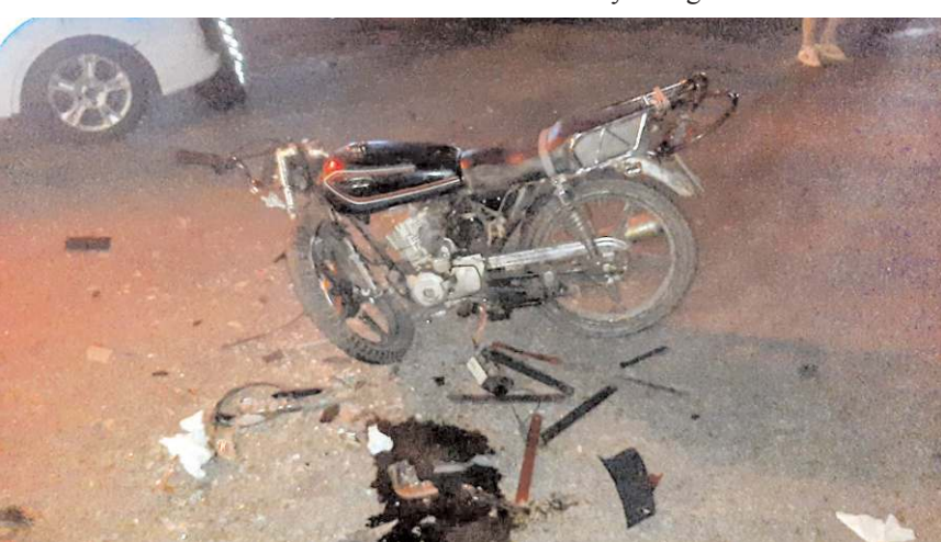
Kazada motosiklet hurdaya döndü.

Çorum'da otomobil ile çarpışan çekici, kontrolden çıkarak aydınlatma direği ve park halindeki araçlara çarptı. Kazada 1 kişi yaralandı.