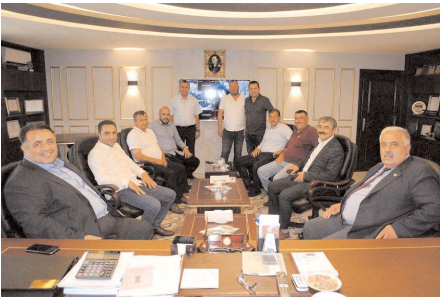
Ziyarette esnafın sorun ve talepleri konuşuldu.