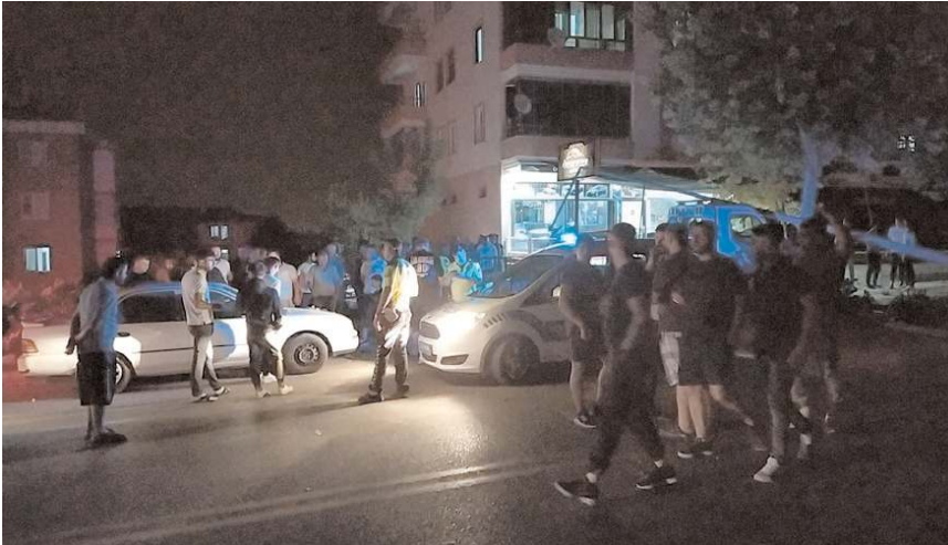
Kazada 1 kişi yaralandı.