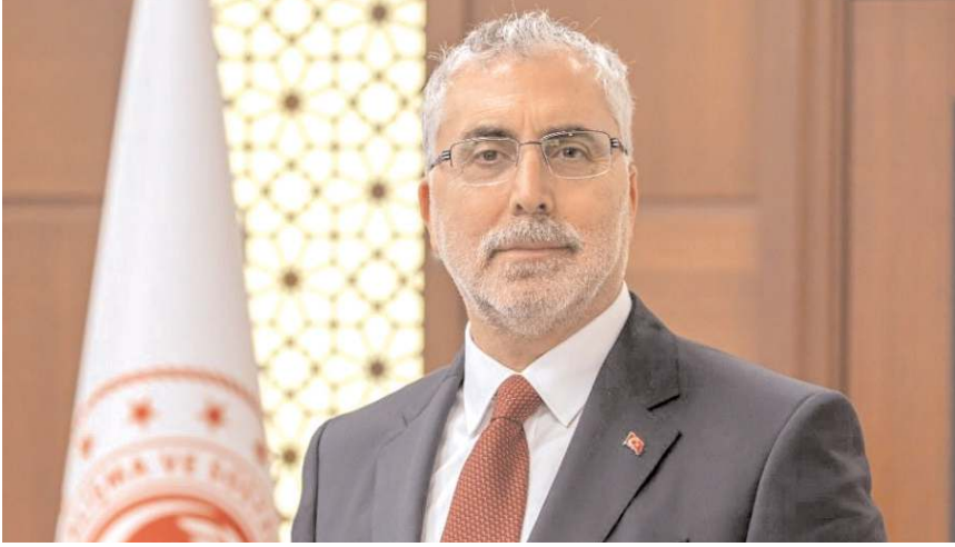
Çalışma ve Sosyal Güvenlik Bakanı Prof. Dr. Vedat Işıkhan

rişimcilerle Buluşma" programının ardından Ankara'ya hareket edecek.