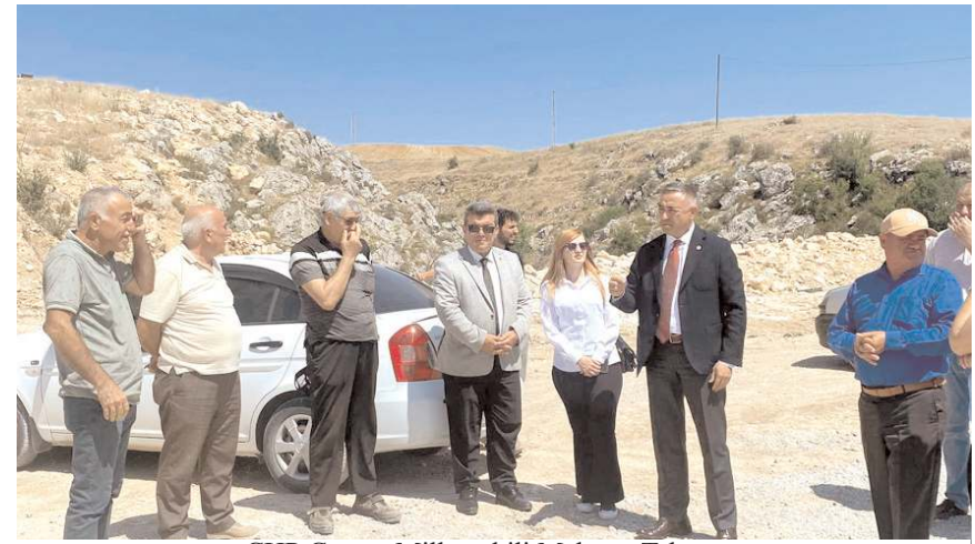
CHP Çorum Milletvekili Mehmet Tahtasız, sorunun kısa sürede çözülmesini istedi.

Yapımı devam eden konutları gezdiğini ve bilgi aldığını dile getiren Tahtasız, “Şantiyede az sayıda işçi çalışıyor. Şayet firmaya gerekli hak edişler verilmiş