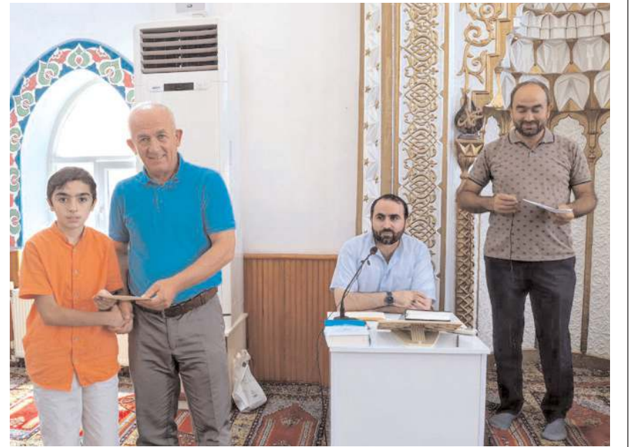
Yarışmada derece elde eden öğrencilere ödülleri verildi.