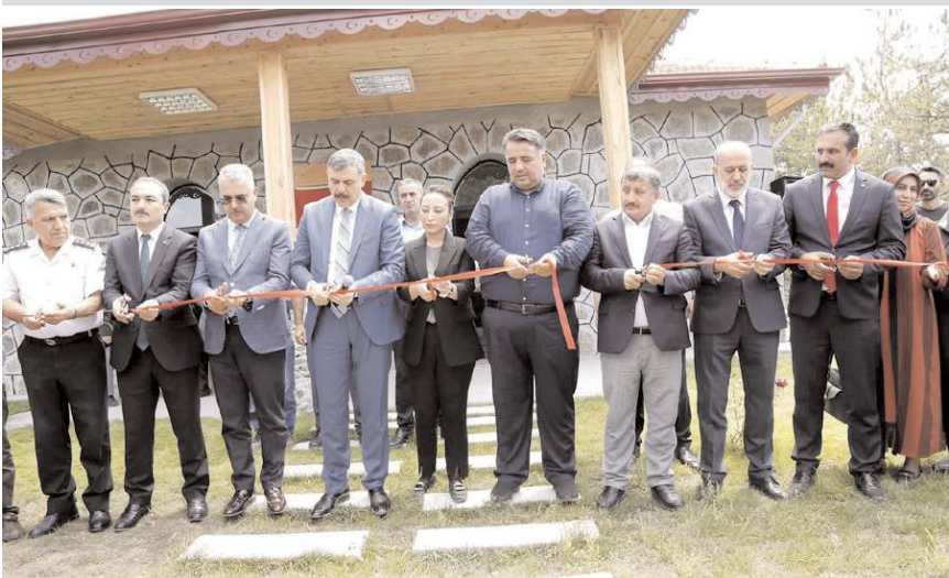
Açılış kurdelesini protokol üyeleri kesti.