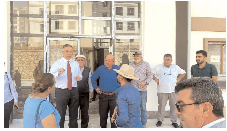
CHP Çorum Milletvekili Mehmet Tahtasız, vatandaşlara destek verdi.

Çorum'da Silmkent'te yapımına 6 yıl önce başlanan 743 konutluk projenin aradan geçen zamana rağmen tamamlanamaması tepkilere neden oluyor.