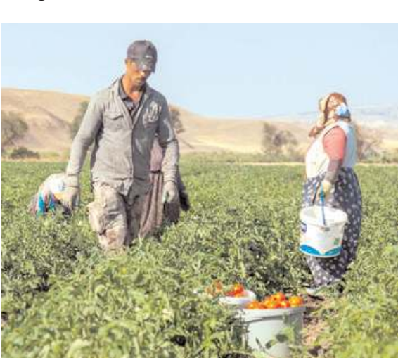
Çorum'da 18 bin 136 dönüm alanda domates üretimi yapılıyor.