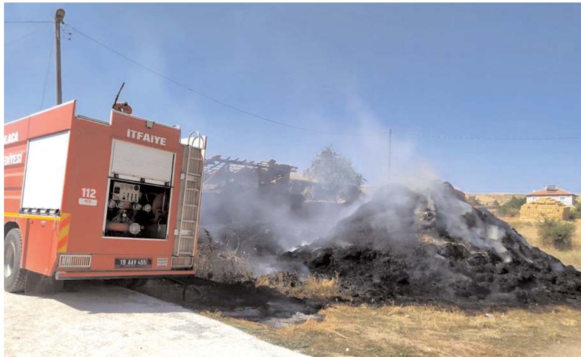
Olay Alaca'ya bağlı Sarısüleyman köyünde meydana geldi.