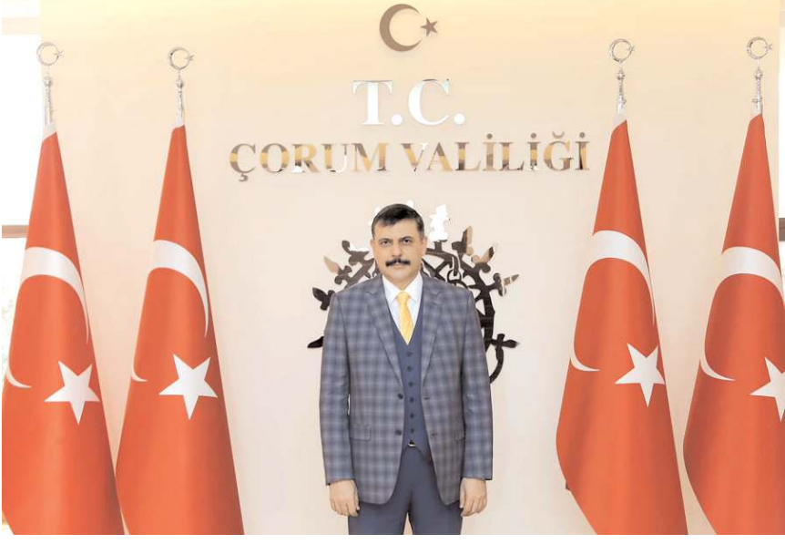
Mustafa Çiftçi, veda mesajı yayınlarken Çorumlulardan helallik istedi.

Erzurum'a Vali olarak atanan Mustafa Çiftçi, veda mesajı yayınlarken Çorumlular'dan helallik istedi. Vali Çiftçi için bugün saat 10.00'da Valilik konağında uğurlama töreni yapılacak.