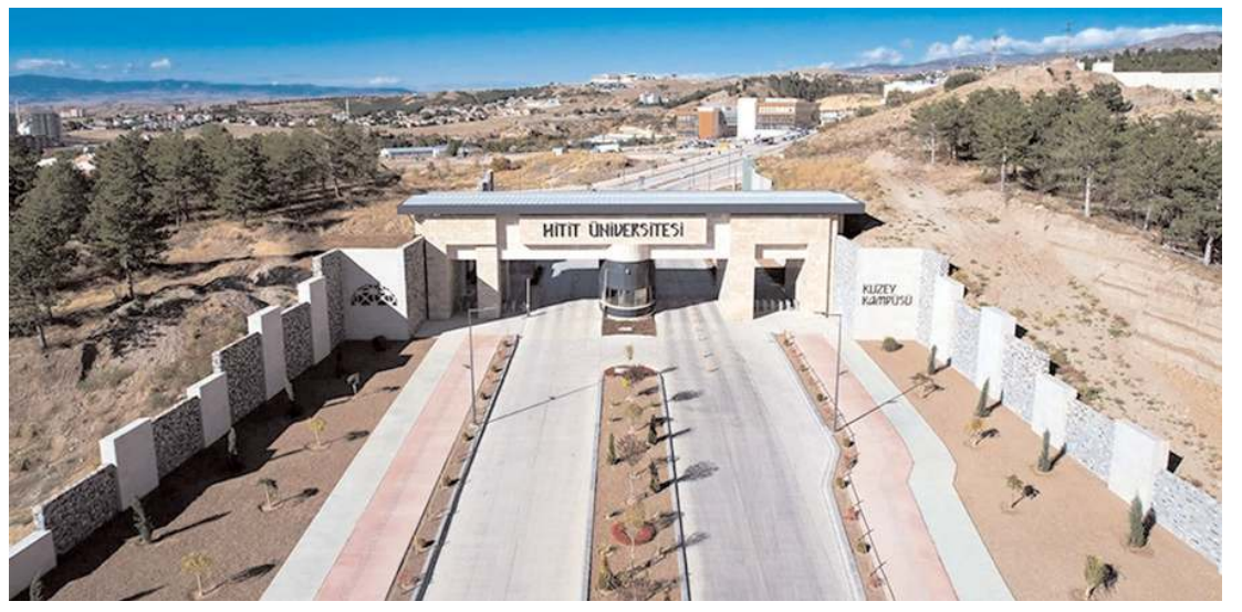
Hitit Üniversitesi yaptığı tanıtım faaliyetleri ile milyonlarca kişiye ulaştı.