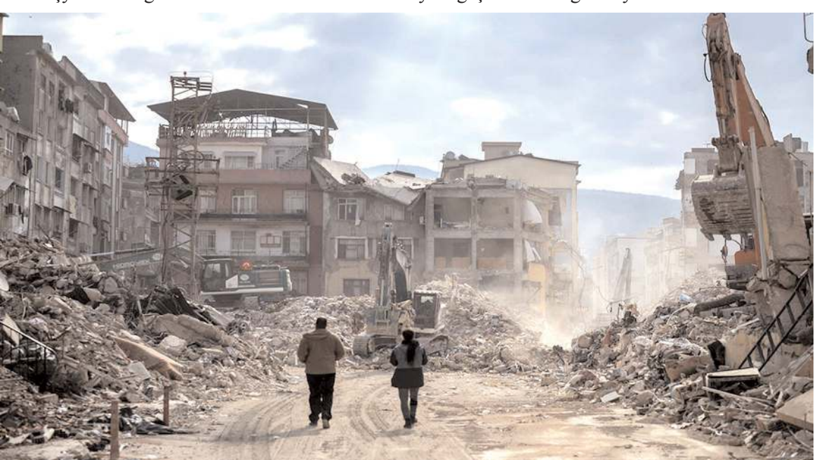
Deprem Sigortası'nın adı Afet Sigortası olarak değişecek.

YENİ DÖNEM 2024'TE BAŞLAYACAK Kesin bir tarih açıklanmadı ancak bu değişikliklerin 2024 yılının Ocak ayı itibarıyla hayata geçirilmesi öngörülüyor.