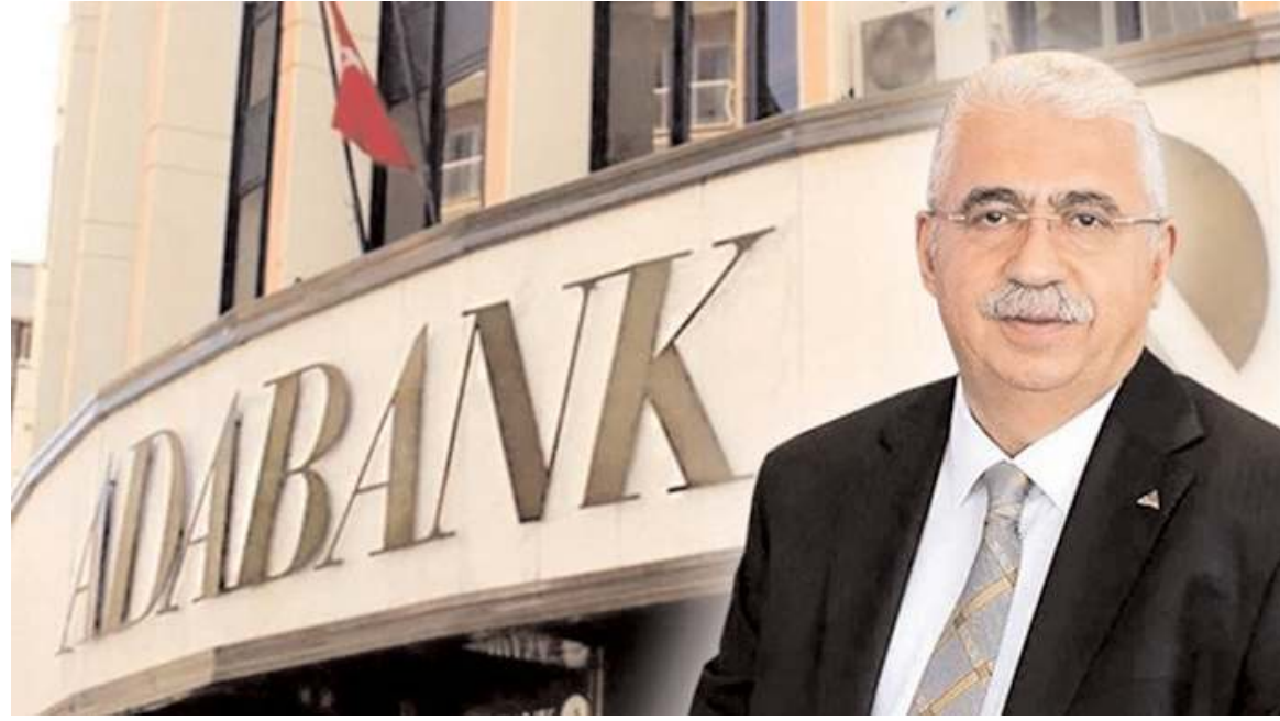
BDDK Adabank'ın AHL Ahlatcı Finansal Yönetim tarafından devralınmasına onay verdi.

24.05. 2023 tarihinde Kamuyu Aydınlatma Platformu'nda yapmış olduğumuz açıklamada özetle, Şirketimizin