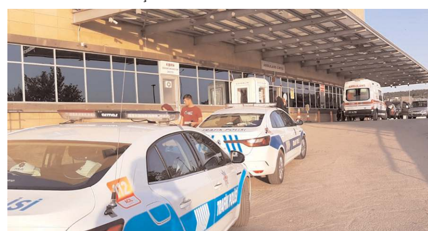
Polis motosiklet sürücüsünün yakalanması için çalışma başlatıldı.

Kaçan motosiklet sürücüsünün yakalanması için çalışma başlatıldı.(AA)