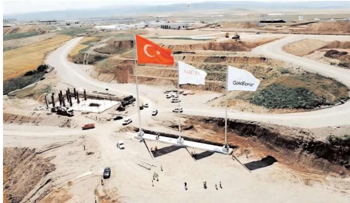
Gold Force için Sungurlu OSB'de 1630 dönüm arazi tahsis edildi.

OSB'de firmaya tahsis edilen toplam 1630 dönüm araziden 710 dönüm alana Küresel Barut Üretim Tesisinin ana hammaddeleri olan Nitroselüloz ve Nitrogliserin tesisleriyle birlikte kurulacağını belirten Barut Fabrikası Genel Müdürü Mehmet Tök, "Etaplar halinde tamamlanması planlanan üretim tesislerinden 1. etap yılsonunda tamamlanarak devreye alınacak. Ocak ayında deneme üretimine başlayacağız ve akabinde seri üretime geçeceğiz. 15-20 Şubat tarihleri arasında Cumhurbaşkanımız Sayın Recep Tayyip Erdoğan'ın teşrifleriyle tesisin açılışını yapacağız" dedi.