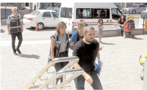
2 şüpheli adli makamlara çıkarıldı.