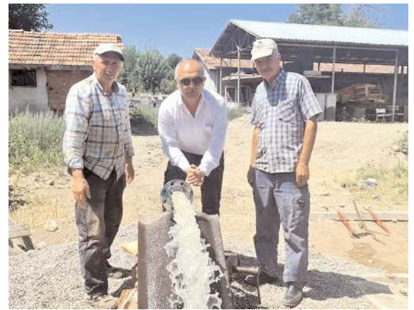
Kaynak saniyede 10 litre su kapasitesine sahip.