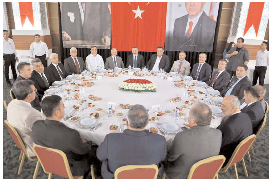
Anitta Otel’de yapılan programa çok sayıda davetli katıldı.

Temmuz ayında Rusya Federasyonu vatandaşları Türkiye’den 772 konut satın aldı. Rusya Federasyonu vatandaşlarını sırasıyla 272 konut ile İran, 204 konut ile Irak ve 146 konut ile Ukrayna vatandaşları izledi.