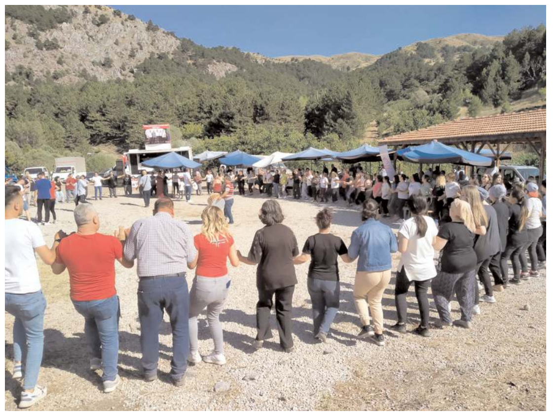
Kızılınar Köyü Geleneksel 16. Karagöl Fasulye Şenliklerine katılanlar halay çekerek günlerini eğleniyor.