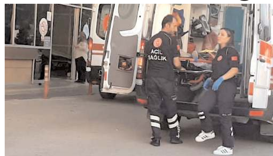
Yaralı çocuk hastanede tedavi altına alındı.

Çorum'da motosikletin çarptığı 7 yaşındaki çocuk yaralandı.