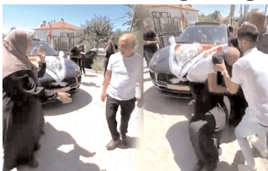
Kaynana ile kayınpeder gelin arabadan inmeden önce gürleşmeye başladı.