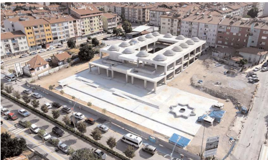
Proje 75 m 2 'lik 25 adet işyeri ve 211 araçlık yer altı otoparkı bulunuyor.