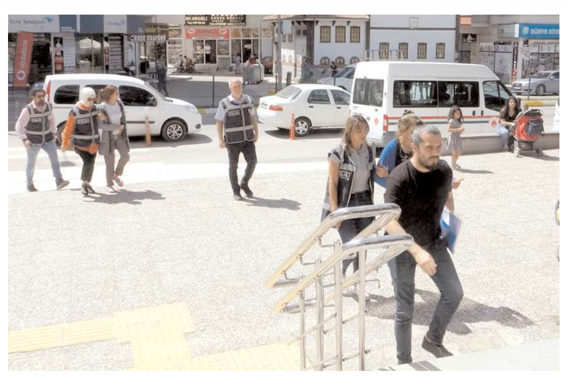
2 şüpheli adli makamlara çıkartıldı.