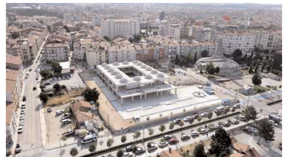
Proje 75 m2'lik 25 adet işyeri ve 211 araçlık yer altı otoparkı bulunuyor.