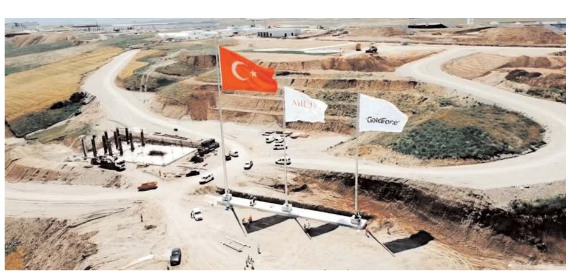
Gold Force için Sungurlu OSB'de 1630 dönüm arazi tahsis edildi.