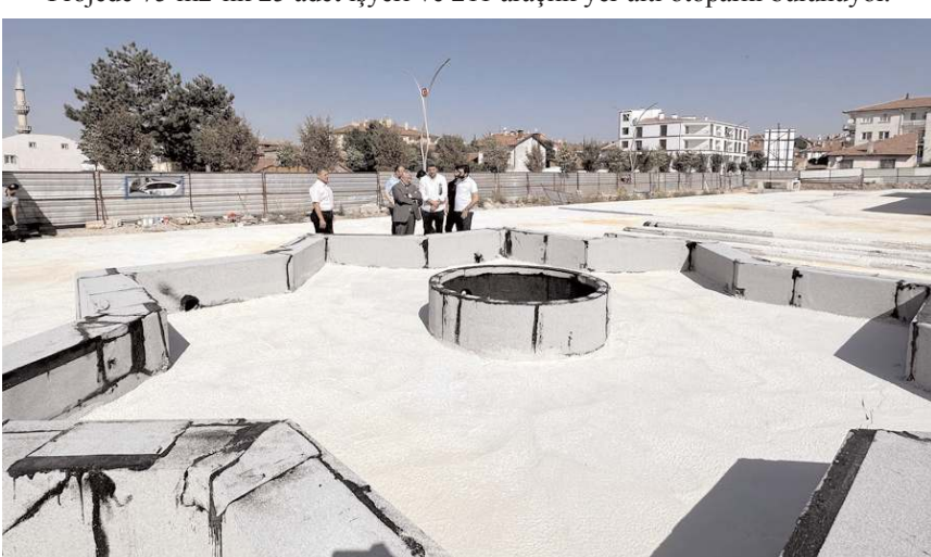
Başkan Aşgın, projenin son durumu hakkında bilgi aldı.