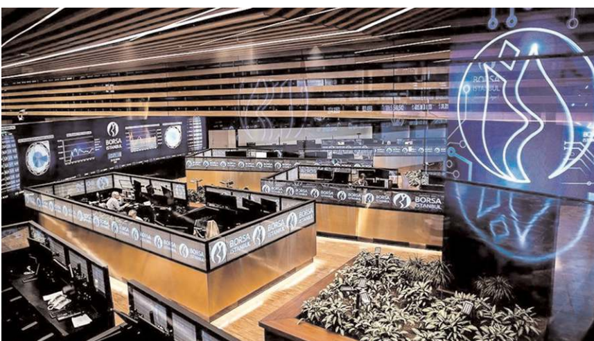
Enerya Enerji AŞ'nin halka arz büyüklüğü 3 milyar 461 bin 640 TL olacak.