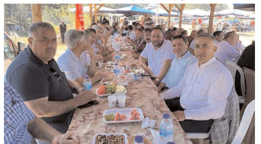
Şenliğe protokol üyeleri ile çok sayıda davetli katıldı.