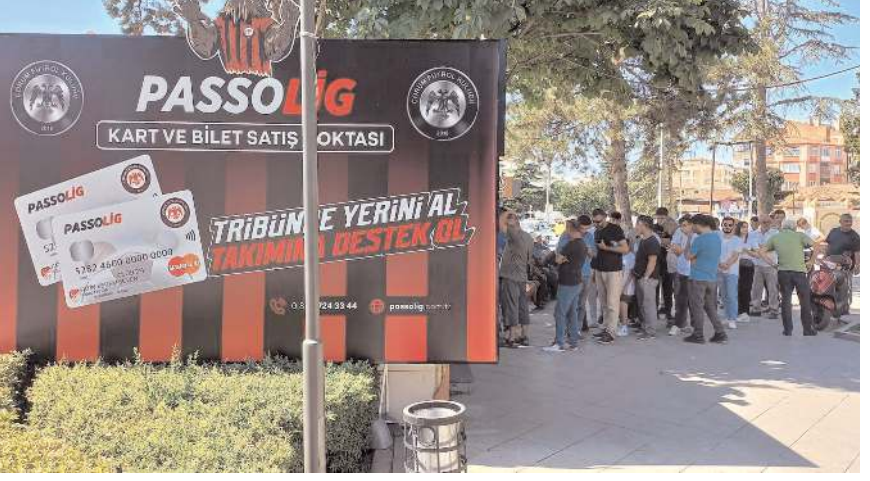
Dün gün boyu satış noktası önünde taraftarlar uzun kuyruklar oluşturdu

Hürriyet Parkındaki Pasolig bürosunda dün gün boyu uzun kuyruklar oluştu. Bilet almak isteyen taraftarlar uzun süre sıcak altında beklediler bayırlar oldu. Taraftarların Pasolig bürosunda eleman sayısının artırılması yolundaki talepleri üzerine dün akşam saatlerinden itibaren ikinci gişe devreye girdi.