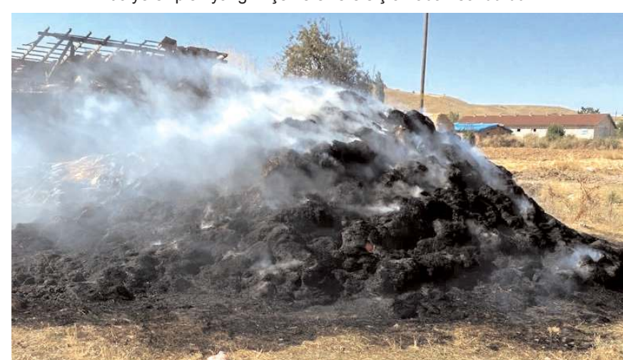
Olayda 400 saman balyası, 8 ton odun ile bir tandırın çatısı yandı.