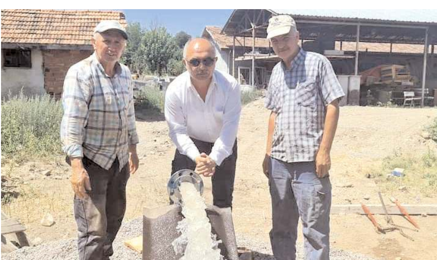
Kaynak saniyede 10 litre su kapasitesine sahip.

Dodurga Belediyesi tarafından yürütülen sondaj çalışmasında yeni bir su kaynağına ulaşıldığı