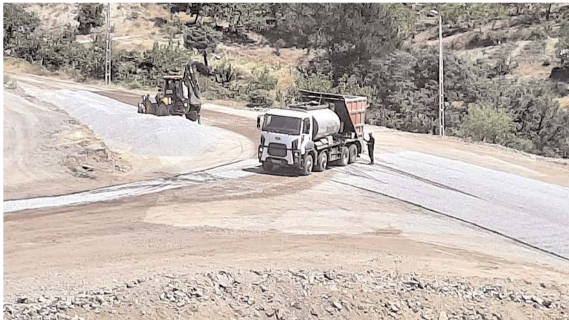
Oğuzlar Belediyesi, TOKİ konutları ve Oğuzlar Devlet Hastanesi yoluna stabilize asfalt serdi.

Çağrı Merkezi'ne yapılan ihbarla olay yerine sağlık, polis ve jandarma ekipleri sevk edildi. Kazadan yara almadan kurtulan sürücü, sağlık görevlilerinin hastane talebini reddetti. Trafik ekiplerince çalışmanın ardından kazada kullanılan hale gelen otomobil çekici yardımıyla otoparka kaldırıldı. (İHA)