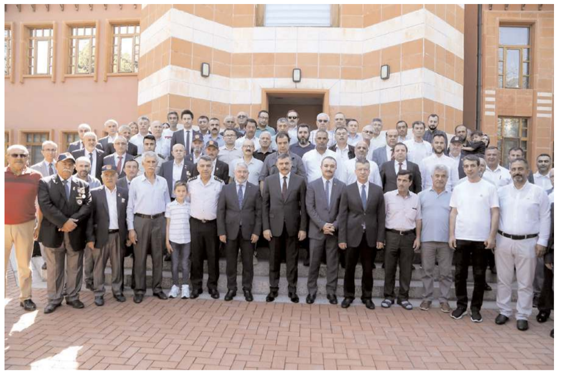
Erzurum Valiliğine atanan Mustafa Çiftçi için Çorum'da uğurlama töreni düzenlendi.

Bu çalışmalarımız sırasında, siz değerli hemşherlerimizim başta olmak üzere saygıdeğer milletvekillerimiz, tüm siyasi partilerimiz, il, ilçe, belde belediye başkanlarımız, üniversitemiz, kamu ve özel sektör kurum ve kuruluşlarımız, muhtarlarımız, oda ve meslek kuruluşlarımız, toplumun diğer bütün kesimleri ve kamuoyu adına denetim ve bilgilendirme görevi üstlenen saygıdeğer basın mensuplarımızla Çorum'umuza daha fazla katkıda bulunabilmenin çabası içerisinde olacağız. Bu duyularla, Çorum Valiliği görevini devraldığımız değerli meslektaşım Valimiz Sayın Mustafa Çiftçi'ye hizmetleri için teşekkür ediyor, kendilerine yeni görev yerinde başarı ve muvaffakiyetler diliyorum. Siz değerli Çorumlu hemşherilerime en derin saygı ve muhabbetlerimi sunuyorum. Görev sürem boyunca, siz değerli Çorumlularla birlikte, şehrimizi daha iyiye, daha güneze taşımak için çalışacağım. Bu kutlu yolda Rab-bim yar ve yardımcımız olsun."