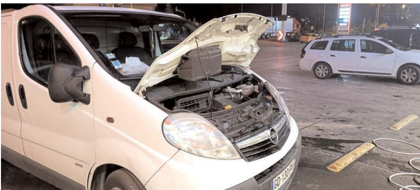
Araç sürücüsü yavru kediyi sıkıştığı yerden kutardı.

Aracın alt kısmına girdiği belirlenen kedi, aracın altına giren çocuk tarafından çıkarıldı. (İHA)