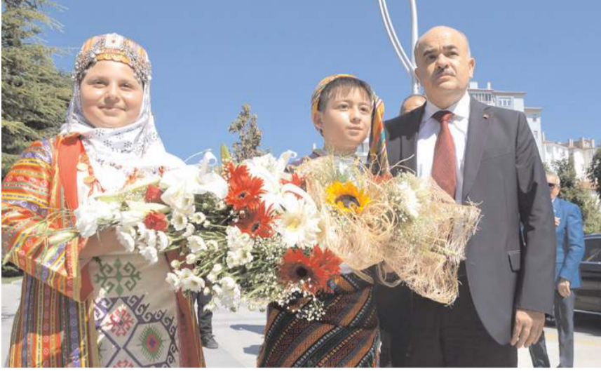
Vali Zülkif Dağlı, çiçeklerle karşılandı.

Valiler Kararnamesi ile Çorum'a atanan Vali Zülkif Dağlı dün görevine başladı. Valilik'te bir basın toplantısı düzenleyerek ilk mesajını veren Vali Dağlı, "Çorum'umuzu göç veren değil, göç alan bir kent misyonuna taşımak adına sürdürülebilir bir sosyo-ekonomik gelişme hedefleyeceğiz" dedi.