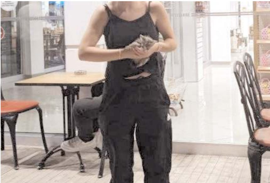
Ordu'da girdiği aracın motor kısmından çıkamayan yavru Sungurlu'ya kadar geldi.

Ordu'da girdiği aracın motor kısmından çıkamayan yavru kedi 400 kilometre yolculuk yaptı. Sungurlu'ya kadar gelen kedi vatandaşlar tarafından kurtarıldı.