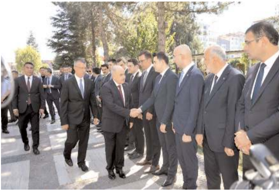
Vali Zülkif Dağlı'yı protokol üyeleri karşıladı.