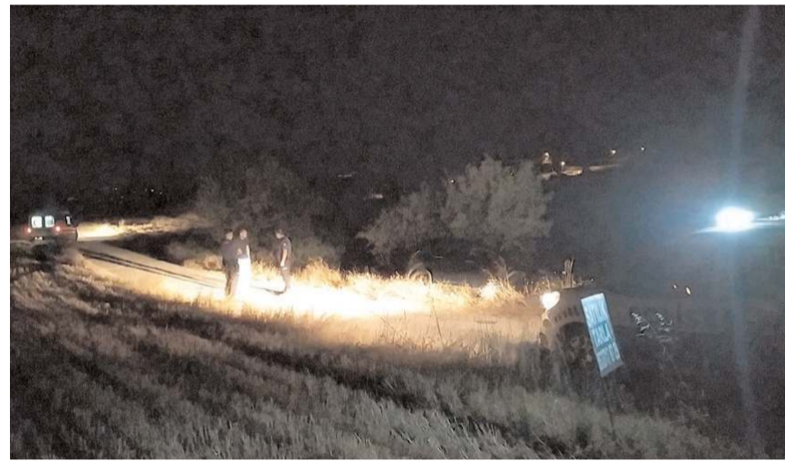
Kazada otomobilde maddi hasar meydana geldi.

meydana geldi. Edinilen bilgiye göre, M.Ş. idaresindeki 10 ACG 830 plakalı otomobil, sürücüsünün direksiyon hakimiyetini kaybetmesi neticesinde tarım arazisine devrildi. 112 Acil