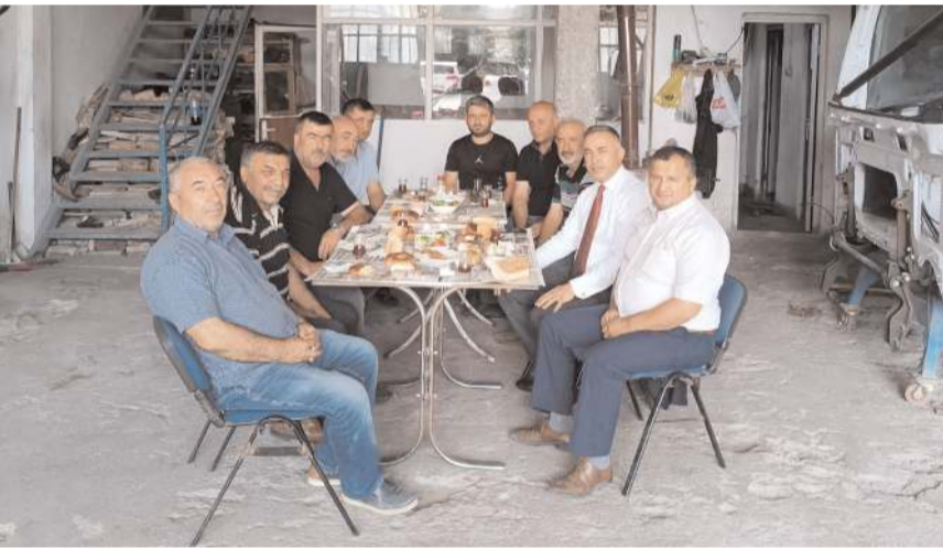
CHP Çorum Milletvekili Mehmet Tahtasız, oto tamirci esnafıyla buluştu.

Artan fiyatlar ve tedarikte yaşanan sıkıntılar nedeniyle vatandaşlar sıfır araç alamazken, ikinci el araçlara olan talebin artması oto tamircilerinin işlerine olumlu yansıyor. İş yoğunluğundan şikayet etmeyen oto tamircileri çirak bulamamaktan dert yaşıyor. Tamirci esnafı çirak ve yetişmiş eleman krizinin daha da büyümeden hükümetin meslek liselerini teşvik etmesi ve staj ücretlerinin yükseltilmesini istiyor.