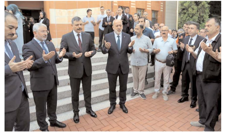
Uğurlama öncesinde dua edildi.