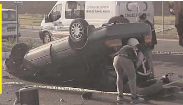
Kaza yapan araçta sıkışan sürücüyü itfaiye ekipleri çıkarttı.