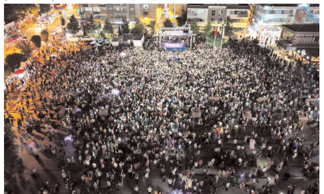
Konsere ilgi yüksek oldu.