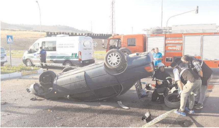
Kaza yapan araçta sıkışan sürücüyü itfaiye ekipleri çıkarttı.

Çorum'da otomobilin devrilmesi sonucu sürücü hayatını kaybetti, babası yaralandı.