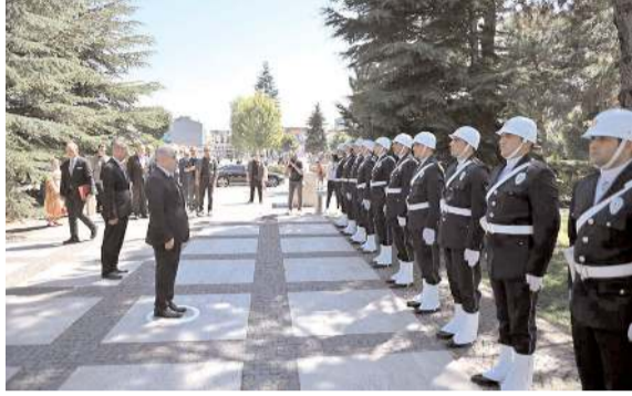
Vali Zülkif Dağlı, Valilik önünde polis mangasını selamladı.

Vali Dağlı polis mangasını selamladıktan sonra makamına geçerek göreve başlama yazısını imzaladı.