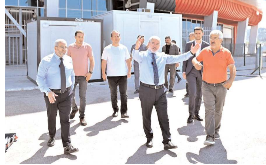
Stadyum etrafında yapılan çalışmalar yerinde incelendi