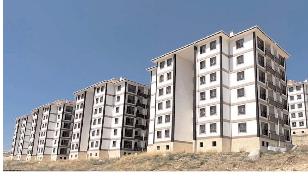
Silmkent TOKİ projesinde konutlar tamamlanırken çevre düzenlemesinin yapılması bekleniyor.