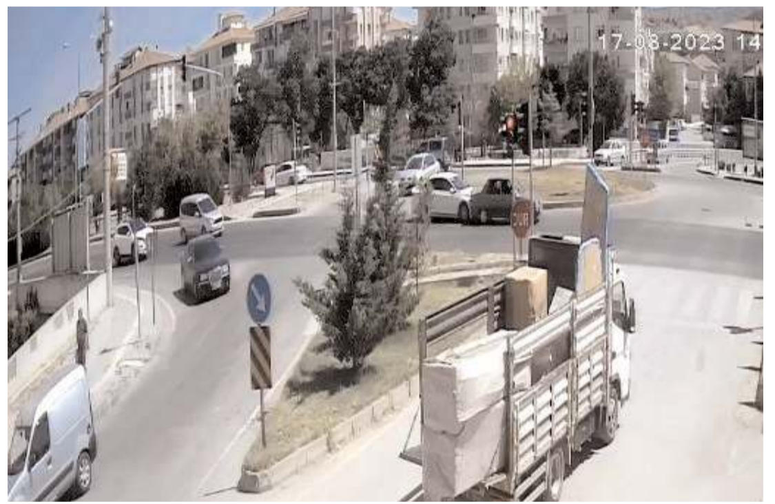
Kaza anı bir işyerine ait güvenlik kamerası tarafından saniye saniye kaydedildi.