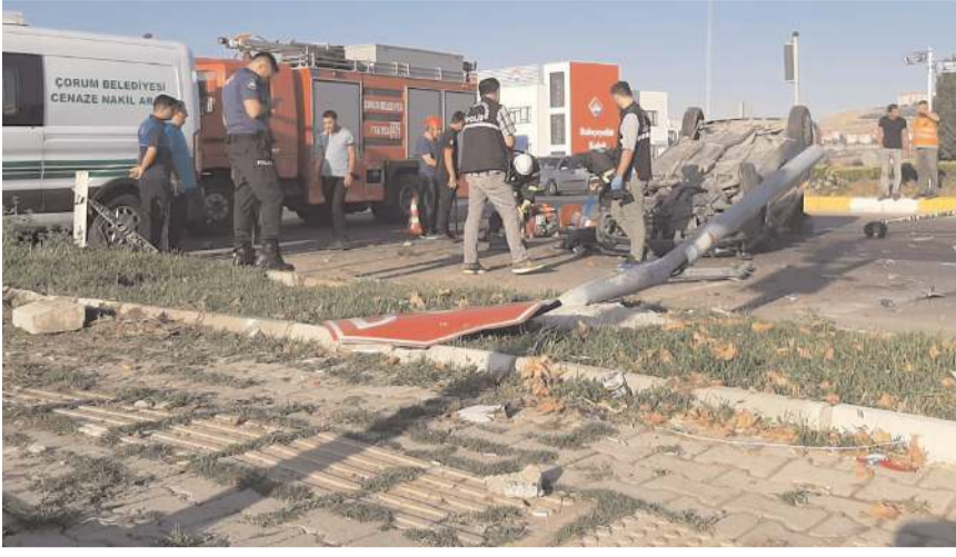
Kaza Burunçiftlik Kavşağı'nda meydana geldi.