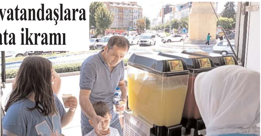
Çorum Belediyesi mobil ikram aracı, Saat Kulesi yanında vatandaşlara limonata ikram etti.

Çorum Belediyesi, sıcak havalardan bunalan vatandaşlara rahat bir nefes aldirmek amacıyla mobil ikram aracıyla soğuk limonata ikram ediyor. Hava sıcaklıklarının mevsim normallerinin üzerinde seyrettiği bu günlerde, şehrin farklı noktalarında konumlanan mobil ikram aracı, vatandaşları bir nebze olsun serinletiyor. (Haber Merkezi)