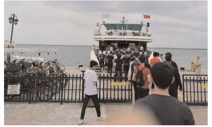
Kamp kapsamında tekne turu gerçekleştirildi.