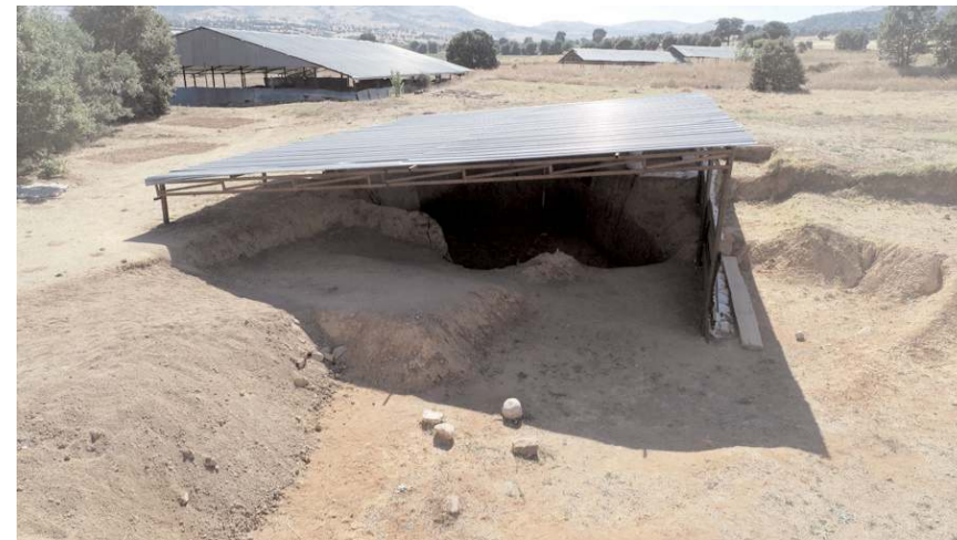
Şapinuva'da yürütülen arkeolojik kazılarda 3 bin 500 yıllık hububat silosu bulundu.