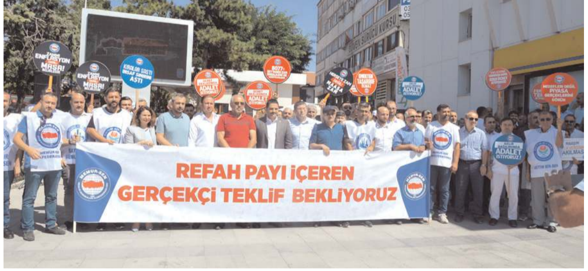
Çorum Memur Sen eylemi PTT önünde gerçekleştirdi.

Strateji uygulayarak çözümsüzlüğe sevk etmek değildir. Biz, Kamu İşverenininde ayakları yere basan teklifini, kamu görevlilerinin sesini ve piyasanın gerçeklerini gören teklifini duymak istiyoruz. Refah payı dedik, ses yok... En düşük memur maaşında hesap hatası var, düzeltinsin dedik, ses yok. Emekli maaşıyla ilgili feryatları dile