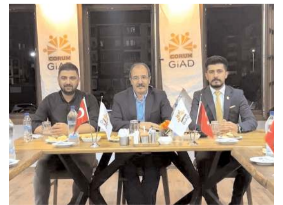
Toplantıda Azerbaycan ile Çorum arasında yapılabilecek işbirlikleri konuşuldu.

Bağcı, GIAD'ın iş forumu ve Azerbaycan'a ihracat amaçlı program için önerilerde bulundu. (Haber Merkezi)