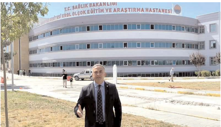
CHP Çorum Milletvekili Mehmet Tahtasız, sağlıkta yaşanan sıkıntıları değerlendirdi.

Erol Olçok Hastanesi'nde uzman doktor eksikliğinin yanında bu sıcak yaz günlerinde klimaların da çalışmadığını kaydeden Milletvekili Tahtasız, "Klimalar yetersiz kaldığı için hastalar sıcaklıkla da boğuşuyor. Yine bir yıl önce ilimize 'İme Merkezi' sözü verildi. Halen yapılmadı. Beyne veya akciğere pıhtı attığında en geç 6 saat içerisinde anjiyo yapılmalı. Ama ilgili merkez olmadığı için o da yapılamıyor" ifadelerini kullandı. (Haber Merkezi)