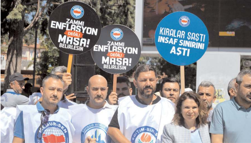
Memurlar eylemde taleplerini dile getirdiler.