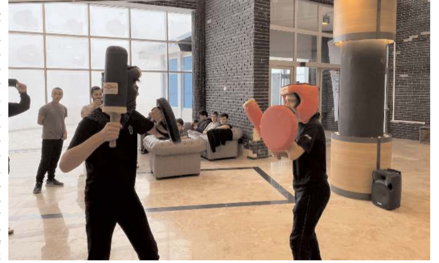
Kampta çeşitli etkinlikler yapıldı.