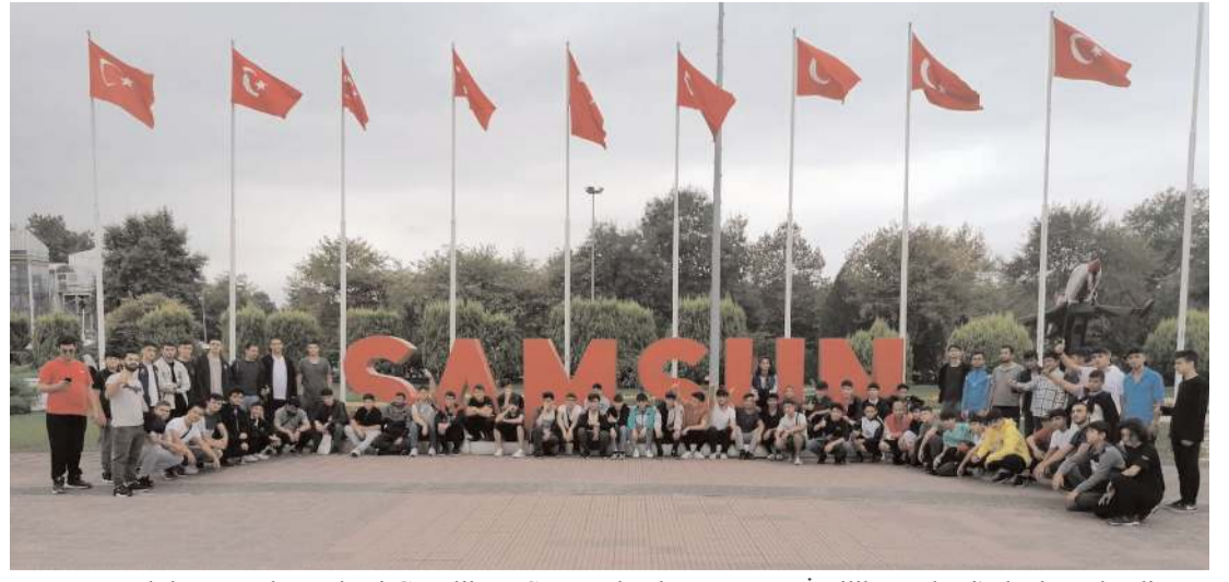
Kamp Akdağ Kayak Merkezi Gençlik ve Spor Bakanlığı Doğa ve İzcilik Merkezi'nde düzenlendi.