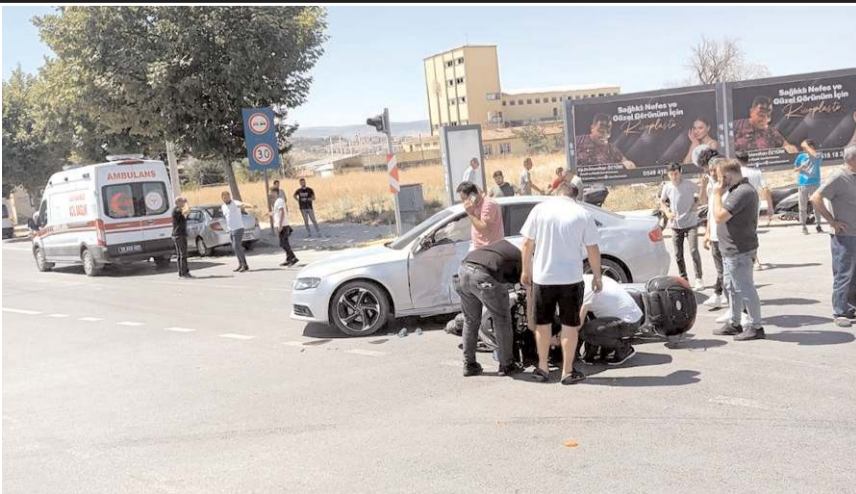
Kazada motosiklet sürücüsü yaralandı.