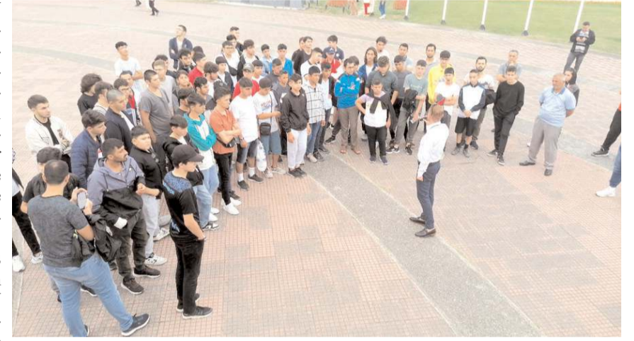
Kampa AGD-MGV Şanlıurfa, Sivas, Tokat ve Çorum Lise Komisyonları katıldı.