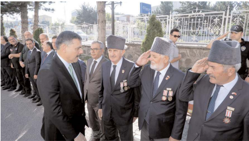
Vali Mustafa Çiftçi için karşılama töreni yapıldı.

Erzurum'un yine bin 900 metreye yakın rakımıyla Türkiye'nin en yüksek vilayetlerinden birisi olduğunu hatırlatan Vali Çiftçi, "Ahmet Hamdi Tanpınar'ın buraya ilgili güzel bir tanımı var. Rahmetli Tanpınar diyor ki, Erzurum Türkiye manzarasına bin sekiz yüz doksan üç metre yükseklikten bakan bir şehirdir. Dolayısıyla ilimizin bu şekilde bir yükseltiyeye sahip olması kiş sporları açısından, özellikle kayak sporu açısından burayı önemli bir merkez, cazibe merkezi haline getiriyor. Yine ilimizin bu şekilde yüksek olmasının hayvancılık açısından da gerek tarihi ve turistik açıdan gerekse tarım ve hayvancılık açısından sanayi ve ticaret açısından, alan büyüklüğü açısından Erzurum, doğunun başkenti ünvanını fazlasıyla hak eden bir şehir. Aynı zamanda yine Erzurum'la ilgili söyleyebileceğim burası bir hafızlar şehri. Bin bir hatmin okunduğu böyle bir geleneği uzun yıllardır böyle bir geleneğin olduğu bir şehir. Bu açımda mübarek bir şehir olduğunu düşünüyorum. Beni bu şehre hizmetkar eyleyen Cenab-ı Hakk'a sonsuz şükürler ediyorum. Herkese nasip olmaz diye değerlendiriyorum" diye konuştu. (İHA)