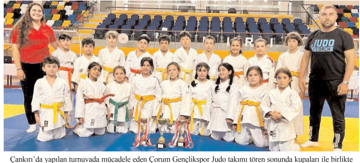
Çankırı'da yapılan turnuvada mücadele eden Çorum Gençlikspor Judo takımı tören sonunda kupaları ile birlikte