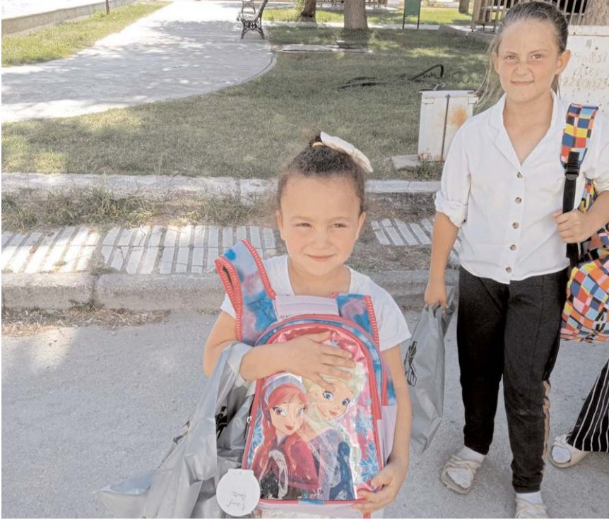
Nefes Yardımlaşma ve Dayanışma Derneği, yardım faaliyetlerine devam ediyor.