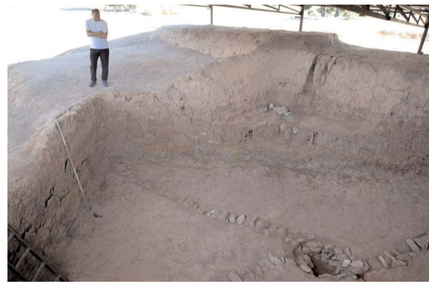
Keşfedilen silo Hitit kentlerindeki hububat silolarından farklı olarak toprağın içine oyularak inşa edilmiş.

Silo yapısının özellikleri ve teknik yapısı hakkında da bilgi veren İpek, "Silonun ana özelliklerinden birisi ana toprağın oyulması ile yapılmış. Silo 10x5 metre ebatlarında, 3 metre 40 santimetre derinliğinden oluşuyor. Teknik olarak da Hattuşa'da ve Alacahöyük'te bulunan silolar gibi tabanı taş döşemeli bir yapıya sahip değil. Silonun tabanı taş döşeme yerine topraktan oluşuyor. Ayrıca Hattuşa'da ve Alacahöyük örneklerinde olduğu gibi silo içerisindeki nemin tahliye edilmesi için dört farklı yönden kanal açılarak kanalların üzeri yassı taşlarla kapatılmış. Bu kanallar, içerideki nemin merkezdeki sızıntı çukuruna tahliye edilmesi için yapılmış. Bu tekniği diğer Hitit kentlerinde de gözlemliyoruz. Ayrıca yaptığımız inceleme de kanalların belirli bir eğimle sızıntı kuyusuna bağlandığını tespit ettik. Buradan aldığımız bazı toprak örneklerinin de incelemesi yapılıyor. Burada hangi hububatın depolandığını da yapılan incelemeler sonucu ortaya çıkacak" ifadelerini kullandı. (İHA)