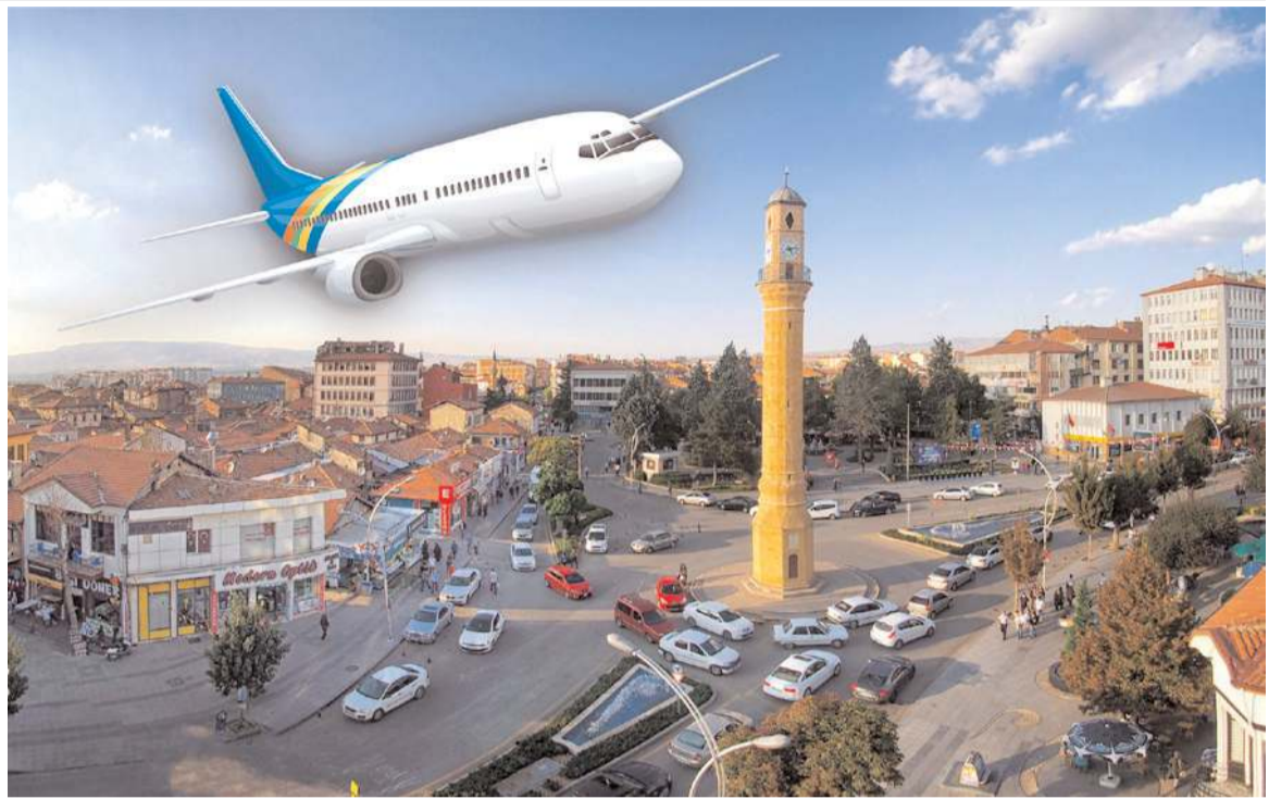
Çorum'a havaalanı ile birlikte ikinci 5 yıldızlı otelin yapılması isteniyor.

Çorum'un her geçen gün küçülmeye, kan kaybetmeye, rezil olmaya devam ettiğine dikkati çeken Yıldız, "Bir Süper Lig maçını dahi Çorum'da oynatamayan, halkımızın umutlarını kursağında bırakan yöneticiler bu şehre ne kazandırabilir?" dedi. (Haber Merkezi)