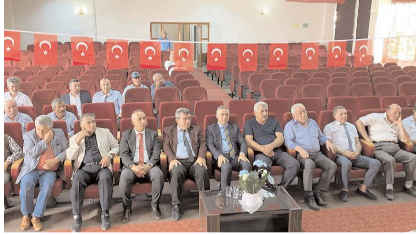
Kongrede her iki adaya da aynı oy çıkınca kura çekildi.