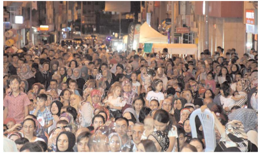
Geçen yıl festivale halkın ilgisi yüksek olmuştu.