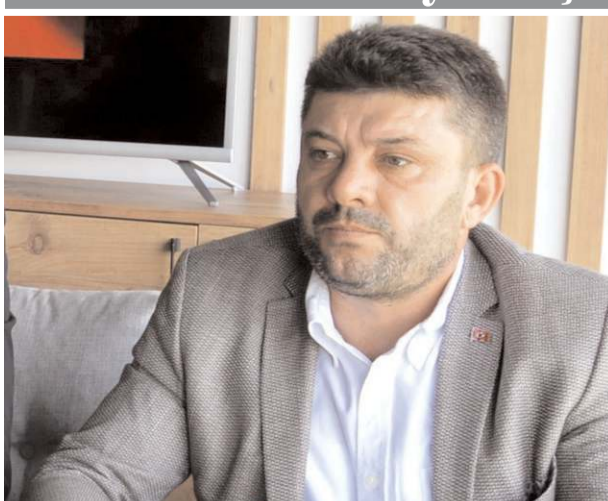
MHP Merkez İlçe Başkanı Reşit Büzükaya