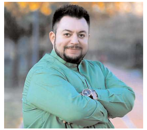
Festivalde ünlü sanatçılar Zara ve Hüseyin Kağıt konser verecek.