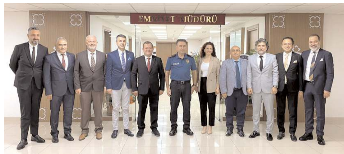
Ziyaretin anısına toplu hatıra fotoğrafı çekildi.