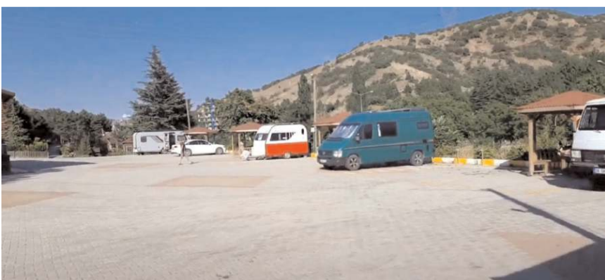
Karavan Parkı'nda karavancılar için tüm imkanlar düşünülmüş.

Karavan Parkı, karavan turu yapan gezginlere rahat ve konforlu bir konaklama imkanı sunuyor. Park, gezginlerin dinlenme, tuvalet ve temel ihtiyaçlarını karşılayabileceği tesisleri içeriyor. Karavan sahipleri