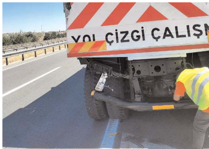
Kaza, Kırıkkale-Çorum D.200 kara yolunun 38. kilometresindeki Balışeyh ilçesi yakınlarında meydana geldi.

Kırıkkale'de yol çizgi çalışması yapan kamyon ile otomobilin çarpıştığı kazada bir kişi yaralandı.