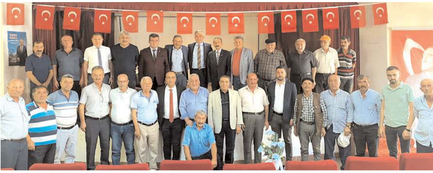
Cumhuriyet Halk Partisi Bayat İlçe Kongresi'nin ardından toplu hatıra fotoğrafı çekildi.