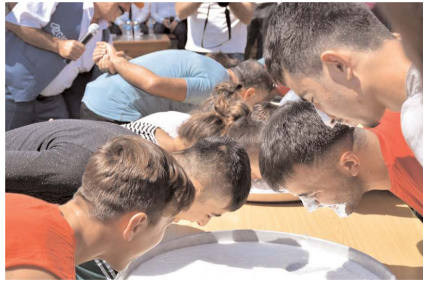
Festivalde çeşitli yarışmalarda yapılacak.