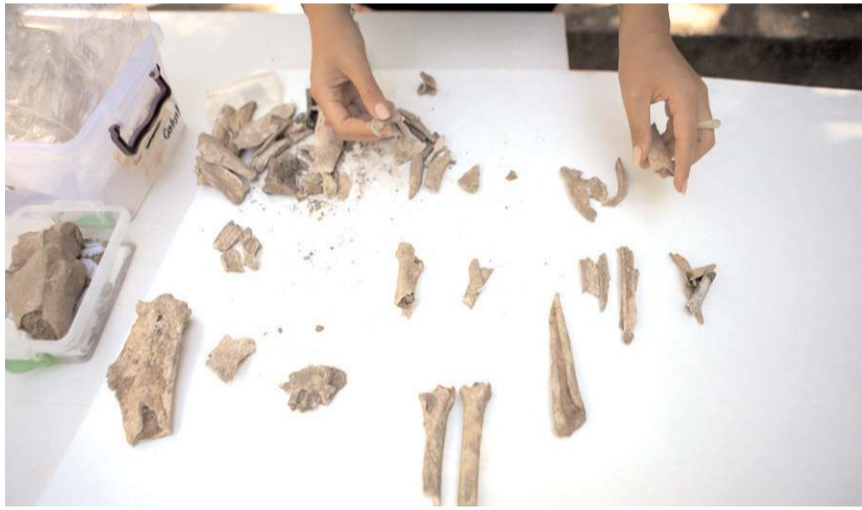
Evcil ve yabani hayvanların kemikleri incelenerek Hititlerin beslenme alışkanlıkları araştırılıyor.