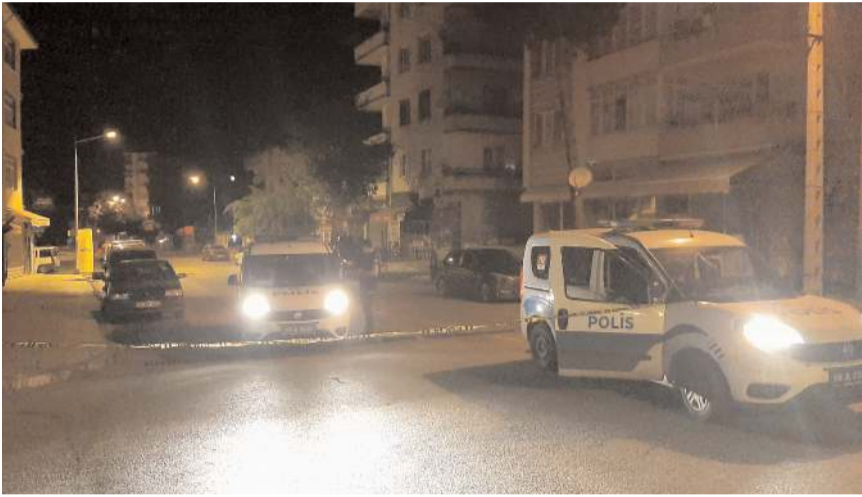
Olay Kale Mahallesi Emek Caddesi'nde meydana geldi.