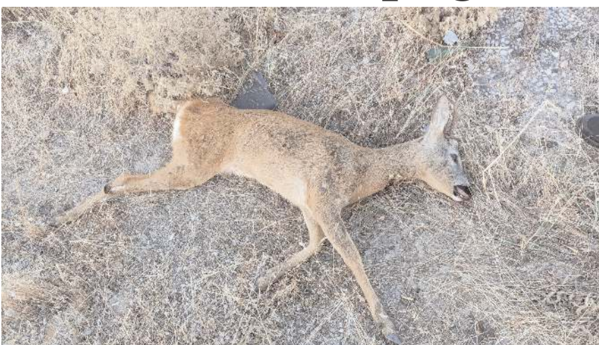
Olay Küre köyü mevkinde meydana geldi.

Alaca'da otomobilin çarptığı karaca öldü.