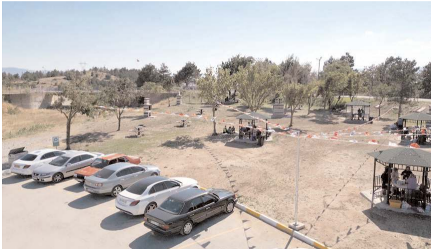
Belediye, Çomar Barajı'nda çevre düzenlemesi yaptı.