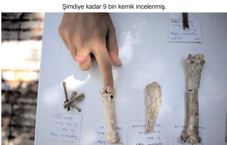
Şimdiye kadar 9 bin kemik incelendi.