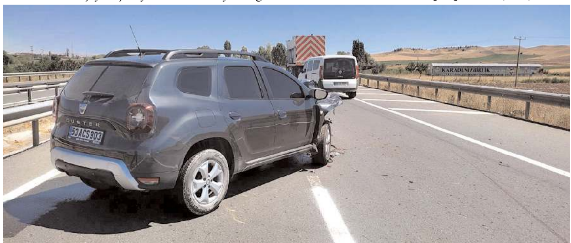
Kazada otomobilde maddi hasar meydana geldi.

Kaza, Kırıkkale-Çorum D.200 kara yolunun 38. kilometresindeki Balışeyh ilçesi yakınlarında meydana geldi. Edinilen bilgiye göre, 53 ACS 903 plakalı otomobil, yol çizgi çalışması yapan 54 AFY 074 plakalı kamyon ile çarpıştı. Kazada otomobil sürücüsü yaralandı. Çevredekilerin ihbarı üzerine olay yerine sağlık, polis ve jandarma ekipleri sevk edildi. Kazada yaralanan sürücü, ambulansla hastaneye kaldırıldı. Tedavi altına alınan sürücünün hayatı tehlikesinin bulunmadığı öğrenildi. (İHA)