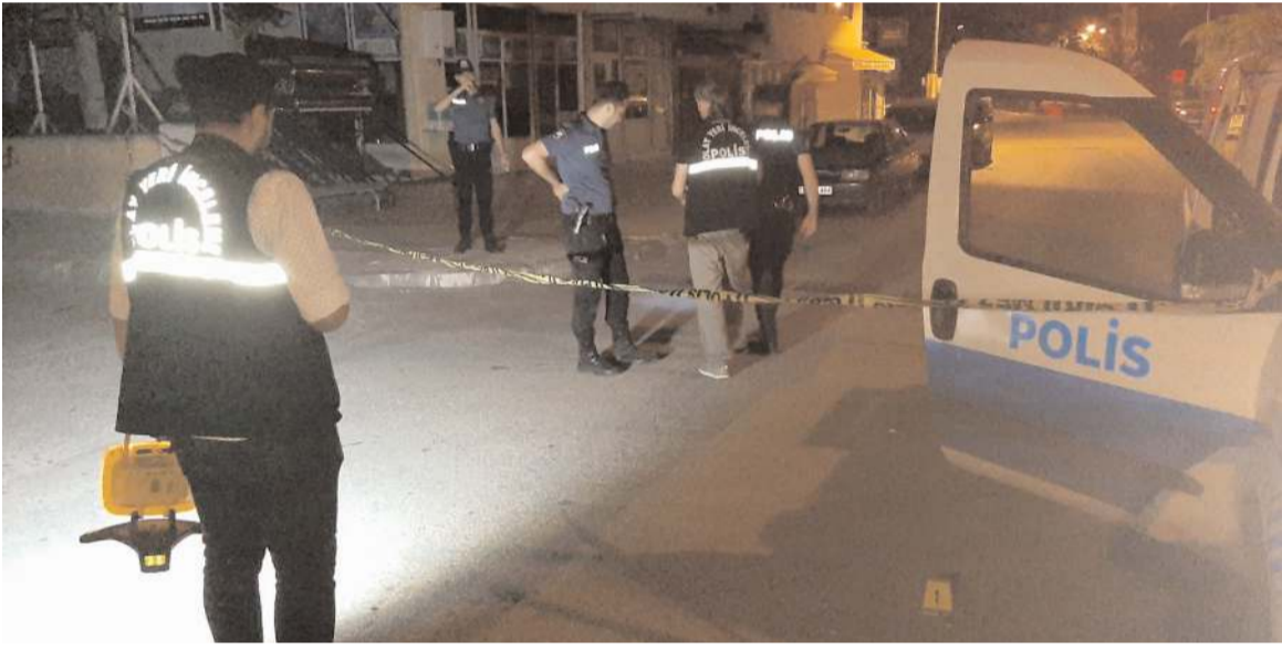
Çevrede araştırma yapan ekipleri caddede 3 boş mermi kovanı buldu.

Çorum'da gece saatlerinde bir caddede havaya ateş açan kişilerin yakalanması için çalışma başlatıldı.