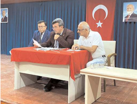
Kongrede ilk olarak divan heyeti belirlendi.