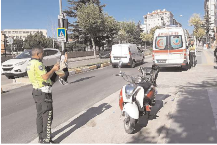
Polis ekipleri kaza yerinde inceleme yaptı.

Kazada yaralanan motosiklet sürücüsü sağlık ekiplerince yapılan müdahalenin ardından Hitit Üniversitesi Erol Olçok Eğitim ve Araştırma Hastanesi'ne kaldırıldı.(AA)