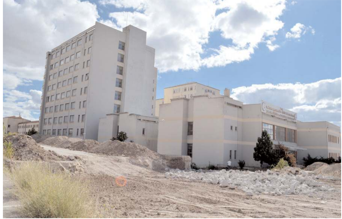
Hastane 4 yıldır ihale edilmeyi bekliyor.