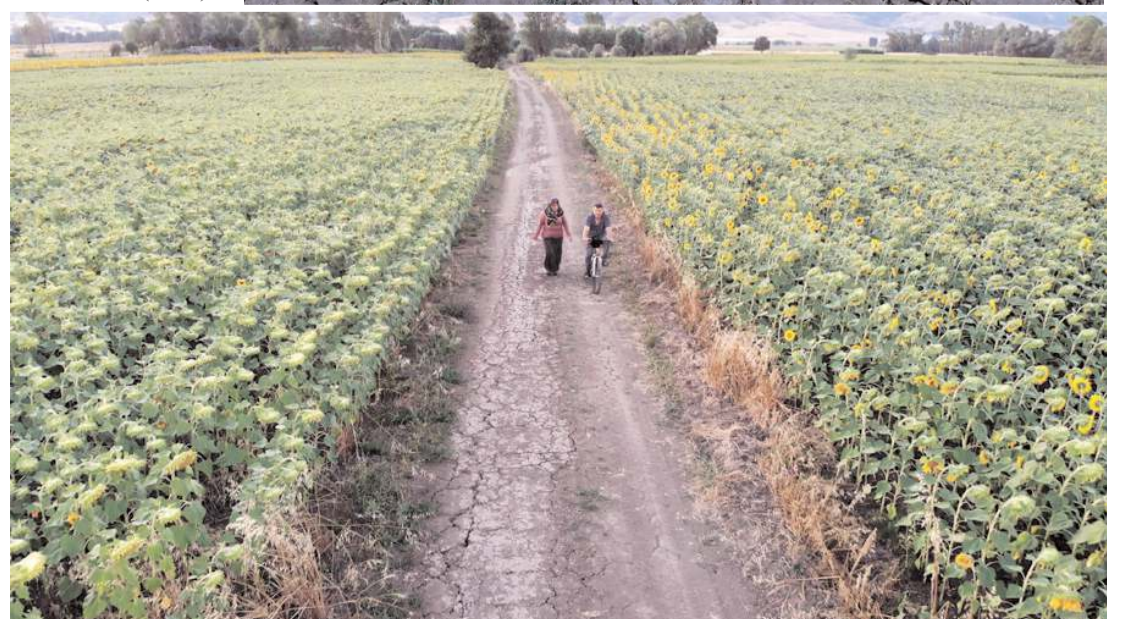
Ayçiçeği tarlalarını gören vatandaşlar fotoğraf çekinmeden gidemiyor