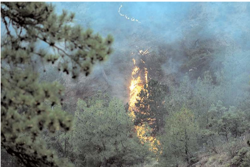
Dünyada yılda ortalama 450-750 milyon futbol sahası büyüklüğüne denk gelen 300 ila 500 milyon hektarlık bir alanın yangınlardan etkililiyor.

Türkiye'de 2021'de meydana gelen yangınlarda 139 bin 500 hektar ormanlık alanın yandığını ve bu alanın 186 bin futbol sahasına denk geldiğini hatırlatan Ataç, yangınların önlenmesi için çıkış nedenlerinin detaylı bir çalışmayla ortaya çıkarılması gerektiği tavsiyesinde bulundu.(AA)