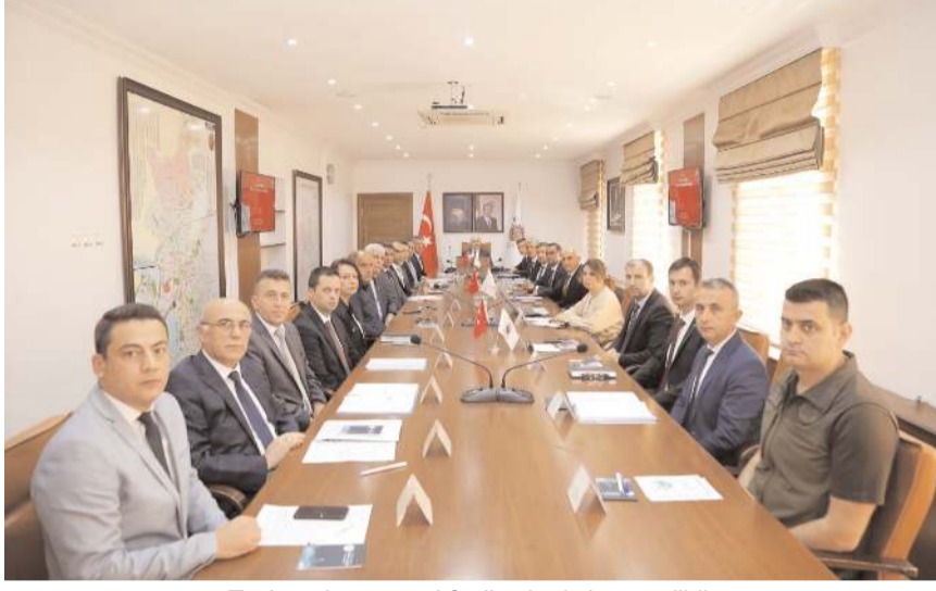
Toplantıda tarımsal faaliyetler istişare edildi.

lacak adımlar ve projelerle Çorum çiftçisine daha etkin ve verimli bir kamu hizmeti sunulacağını belirtti.