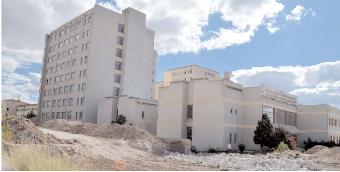
Hastanede 4 yıldır ihale edilmeyi bekliyor.