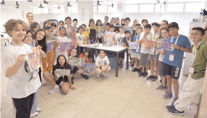
Çocuk Üniversitesi, 35 öğrencinin katılımıyla gerçekleştiriliyor.

bunların daha renkli görüntüleriyle, bilimsel olayları, fiziksel olayları öğrenmeyi sağlıyoruz. Hitit Üniversitesi Bilimsel Teknik Uygulama ve Araştırma Merkezimizde "Nano Dünyaya Yolculuk" olarak adlandırdığımız dersimizde gelişmiş teknolojik cihazlarımızda çok küçük materyalleri, organizmaları ve hücreleri görmemizi sağlayan çalışmalar yapılıyor. Nörogörüntüleme tekniklerini görüyor çocuklarımız. Mühendislik Fakültesi'nde robotlarla ilgili, üç boyutlu yazıcı ile daha teknolojik çalışmalar gösteriliyor. Tüm bu süreçte iş güvenliği konusunda da bilinçlenen çocuklarımızın Fen Bilimleri temasıyla sınırlanmış etkinliklerde farklı keyifler de alabilmeleri için sanatsal alanda ebru sanatı ve drama ile ilgili çok keyifli aktiviteler gerçekleştiriyorlar."