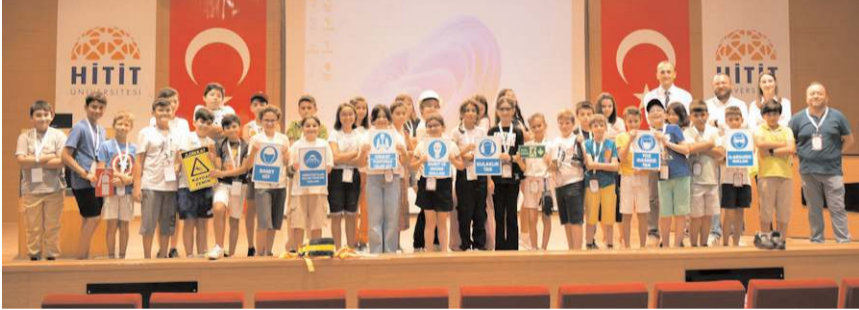
Meslek Yüksekokulları Kampüsü Ethem Erkoç Konferans Salonunda tanışma ve bilgilendirme toplantısı yapıldı.