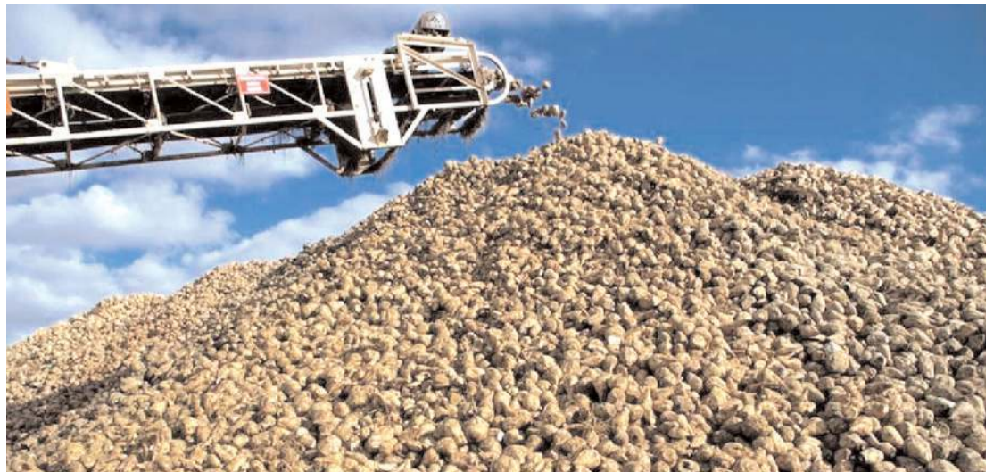
Geçen yıl şeker pancarı destekleme ile beraber bin 600 liradaml alınmış.

CHP Çorum Milletvekili Mehmet Tahtasız da, "2022 yılında şeker pancarının tonu bin 400 liraya alınıyordu. 200 lira destekleme primi ile bin 600 liraya geliyordu. Henüz resmi fiyat açıklanmadığını ancak Kayseri Şeker ve Amasya şekerin 1900-2000 TL civarında bir fiyattan alım yaptığını duyduk. Memlekette mazota ve diğer girdilere geçen seneye göre yüzde 100 zam yapılırken çiftçimiz tatmin edici bir şeker pancarı fiyatının açıklanmasını istiyor. Üretici para kazanacak ki tekrar üretebilsin. Şekere geçen yıldan bu tarafa 11 defa zam geldi. Çiftçi üretecek çiftçi kazanacak ki memleket rahat etsin" şeklinde belirtti. (Haber Merkezi)