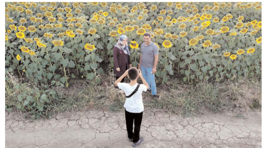
Vatandaşlar bol bol hatıra fotoğrafı çekiyorlar.