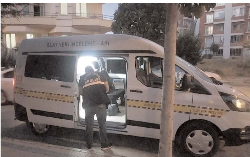
Ekipler hırsız ya da hırsızları bulmak için çalışma başlattı.

Polis ekipleri hırsızlık olayına karşın kişi yada kişilerin yakalanması için çalışma başlattı.