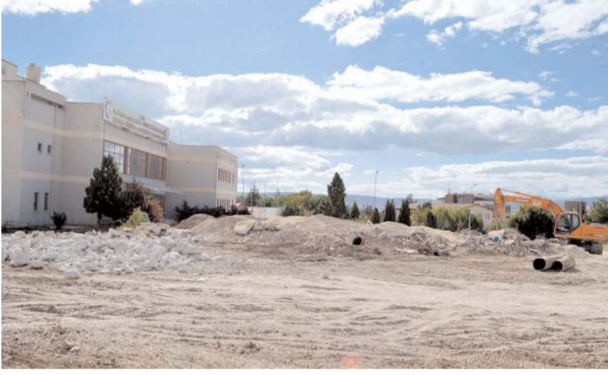
Devlet Hastanesinin eski binaları yıkılmıştı.

Bu arada en son Haziran ayında 726 milyona ihale edilmesi planlanan Devlet Hastanesi'nin şimdiki maliyetinin 1 milyar geçmesi bekleniyor.