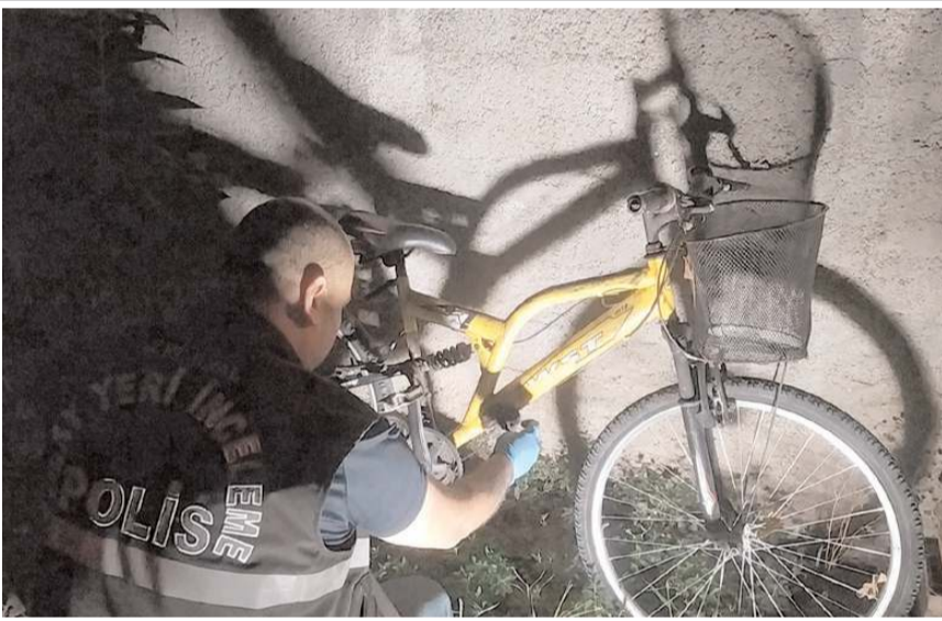
Polis ekipleri çalınan bisikleti 6 gün sonra buldu.

Çorum'da geçtiğimiz günlerde bir evin bahçesinden çalınan bisiklet polis ekiplerinin çalışması sonucu bulundu.