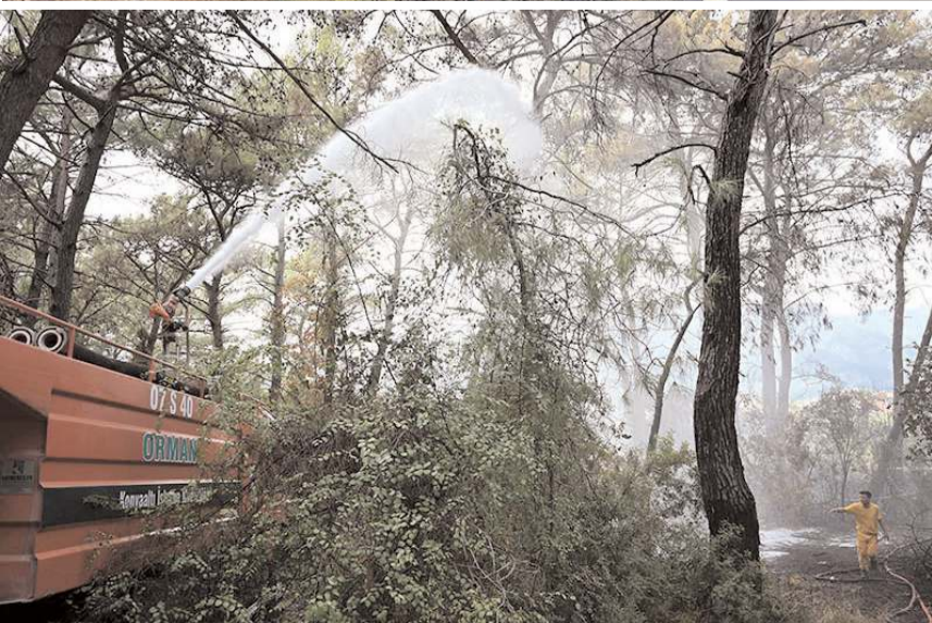
Türkiye'de orman yangınlarının yüzde 88'i insan kaynaklı olarak çıkıyor.