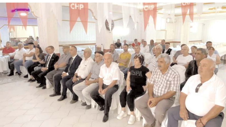
Kongrede tek liste yer aldı.