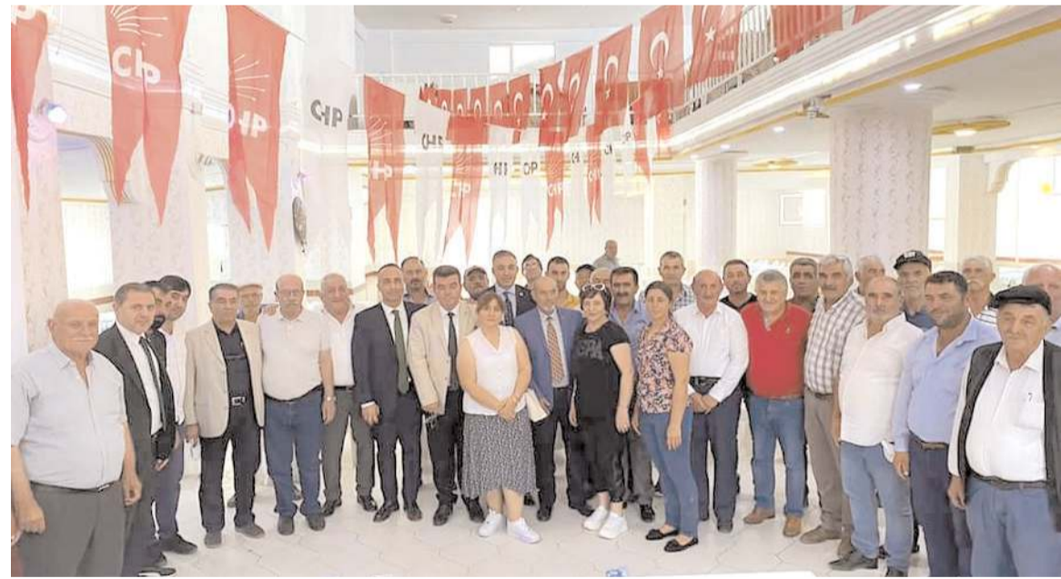
Kongrenin ardından toplu hatıra fotoğrafı çekildi.