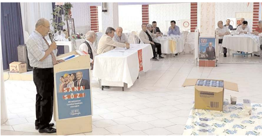
Kongrede ilk olarak divan heyeti belirlendi.