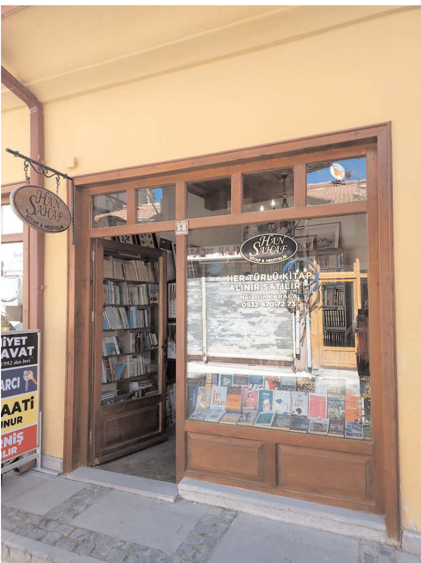
Han Safah, Velipaşa Hanı Sandıkçılar Sokak Numara 9'da bulunuyor.