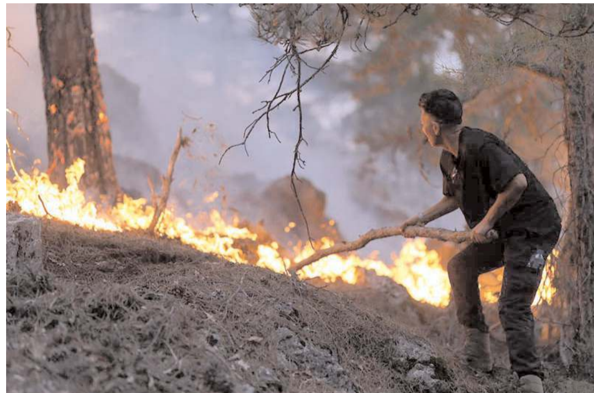
İklim değişikliği Türkiye'nin kuzeyinde bulunan ormanlarda yangın riskini artırdı.

"Her yıl ülkemizin yangına hassas olan bölgelerindeki yangın emniyet yol ve şeritlerinde yıllık bakımlarının yapılması gerekir. Bununla birlikte, yangın ekiplerinin varlığı ve daha önemlisi ekiplerin hazırlık seviyelerinin en üst düzeyde olması son derece önemlidir. Bunun için eğitim merkezlerinde yangınla ilgili her türlü eğitimin bu işçilere yeterince verilmiş olması gerekiyor. Bunun yanında teknolojiyi de çok yoğun ve etkin bir şekilde kullanmak durumundayız. İnsansız hava araçlarının yangınların gözetiminde kullanılması veya uçak ve helikopterlerin su, köpük ve kimyasal