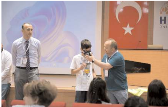
Çocuk Üniversitesinin beşincisini "Fen Bilimleri Etkinlikleri" temasıyla düzenliyor.