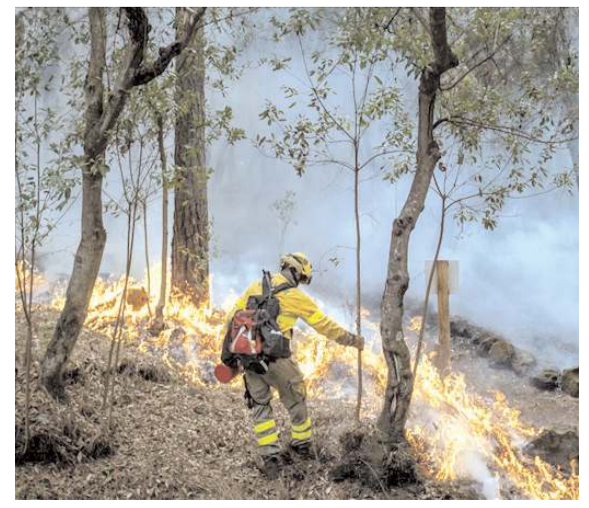
Türkiye'de çıkan yangınlar 15 ila 30 bin futbol sahası büyüklüğü ile ifade edilebilecek 10-20 bin hektarlık alanı kaplıyor.