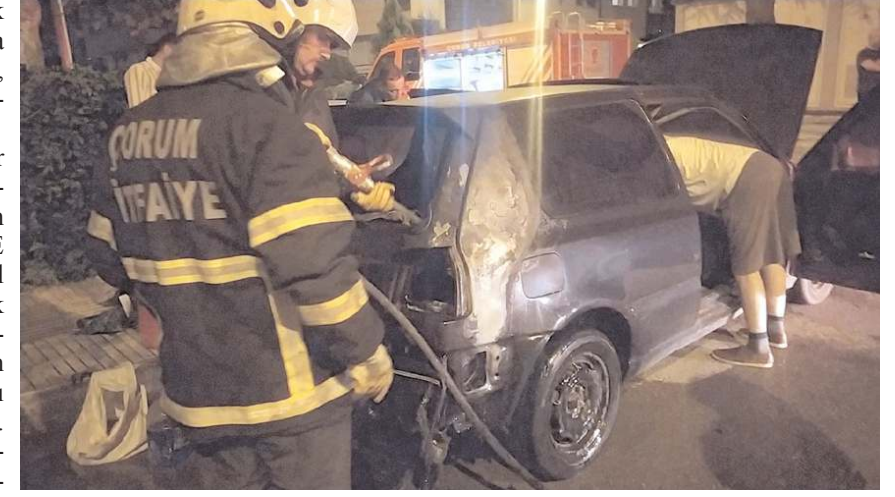
İtfaiye ekipleri yangını söndürdü.

Olay, Üçtutlar Mahallesi'nde meydana geldi. Edinilen bilgiye göre, 19 TE 340 plakalı otomobil Bayındır 1. Sokak üzerinde park halindeyken bilinmeyen bir nedenden dolayı yanmaya başladı. Aracının yandığı görülen otomobil sahibinin ihbarı üzerine belirtilen adrese Çorum Belediyesi itfaiye ekibi ve polisler sevk edildi. İtfaiye ekiplerinin kısa sürede müdahale ettiği yangın büyümeden kontrol altına alındı.