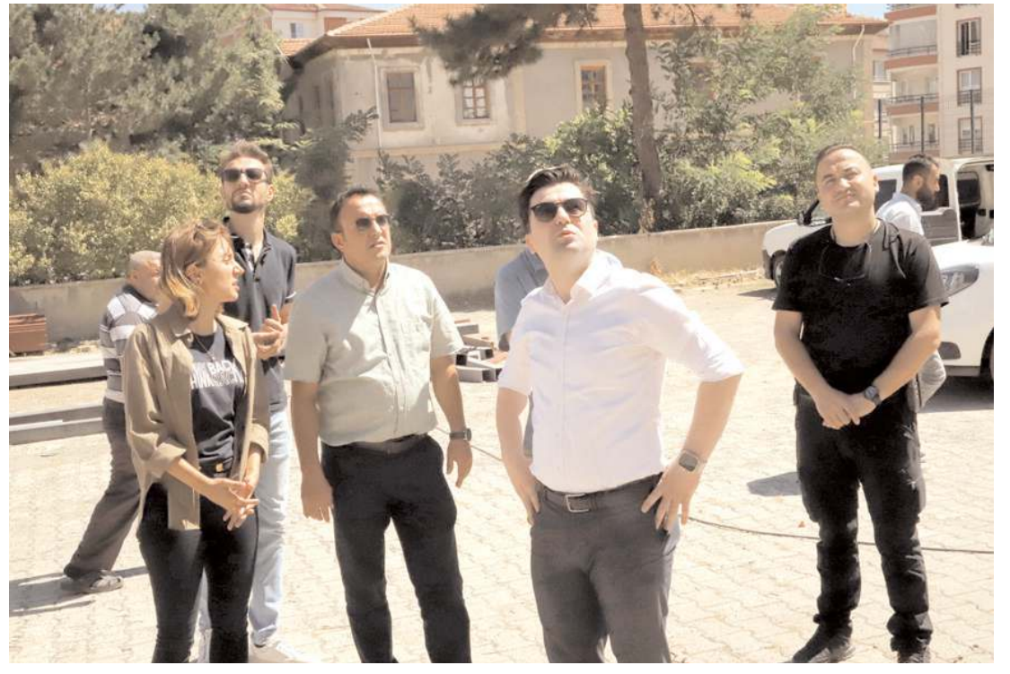
Kaymakam Yunus Emre Vural, Redif Kışlası'nda incelemelerde bulundu.

İskilip'te son yıllarda çilek üretiminin yaygınlaşmasına dikkati çeken Vural, "İskilip çileği son yıllarda yaygın şekilde üretiliyor. Özellikle Çorum ve çevresinde çok fazla tutulan meyve haline geldi. Bu tesiste çileğin yanı sıra çeşitli meyve ve sebzeleri kurutarak ülke ve dünya pazarına sunmayı düşünüyoruz." diye konuştu.(AA)