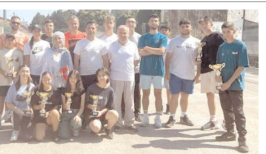
30 Ağustos Zafer Kupasında dereceye giren sporcular ve davetliler ödül töreni sonrasında toplu halde