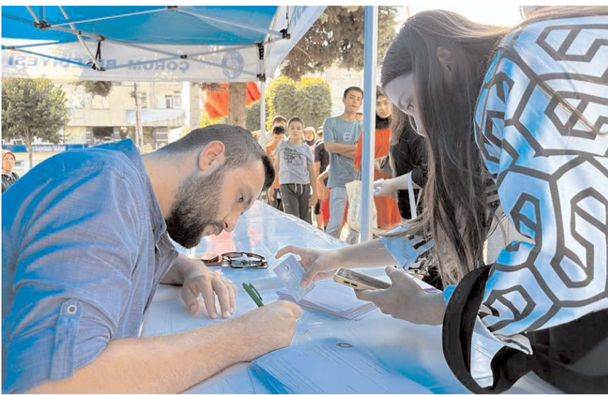
Geziye ilgi büyük oldu.