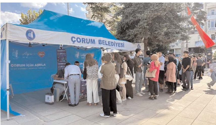
Kayıtların ilk gününde 500 kişilik kontenjan tamamen doldu.