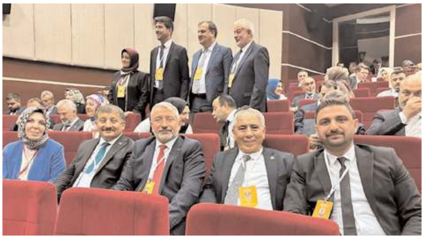
Toplantıya Çorum'dan da katılım oldu.