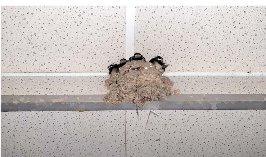
Kırlangıçlar cami tuvaletinin kapısının üst kısmına yuva yaptı.