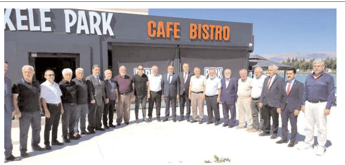
Milliyetçi Hareket Partisi(MHP), merkez mahalle muhtarları ile kahvaltıda buluştu.

Hakimiyet, merhumeye Allah'tan rahmet, kederli ailesi ve yakınlarına da başsağlığı diler.