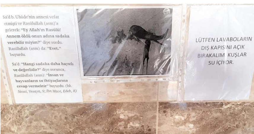
Cami imamı, tuvalet kapısına astığı yazı ile vatandaşları uyarıyor.

Dodurga'da bir caminin tuvaletinin girişine yuva yapan kuşlar için tuvalet ve şadırvana cemaatin dikkatli davranması için notlar asıldı.