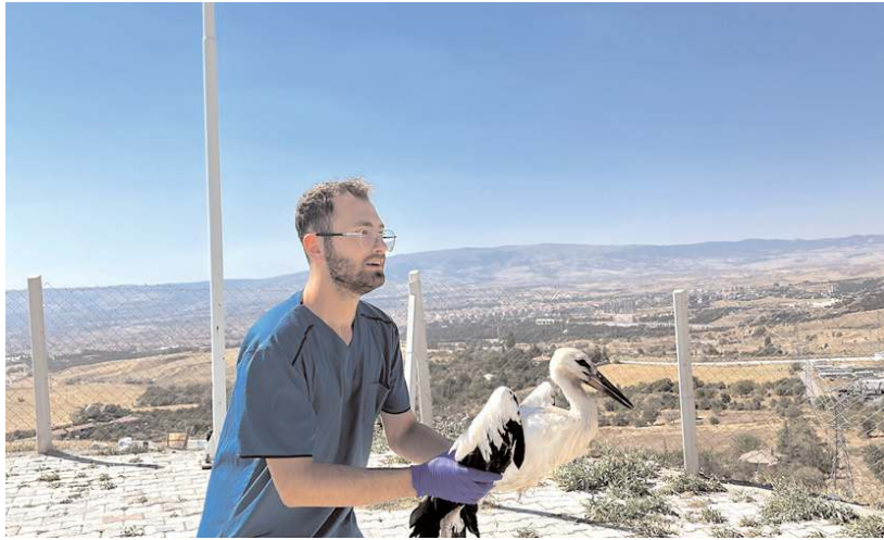
Tedavisi yapılan leylekler tekrar doğaya bırakılıyor.