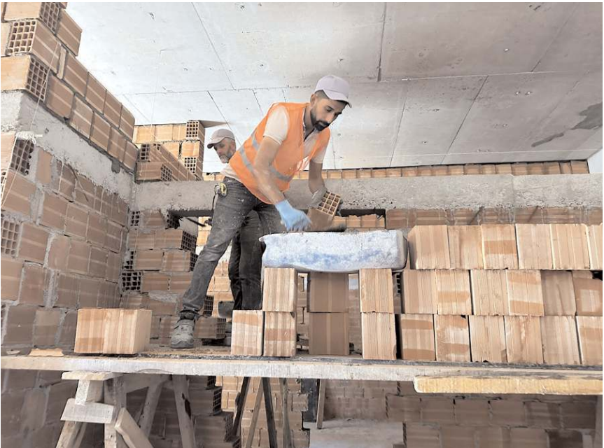
Geçici Hayvan Bakımevi inşaatı devam ediyor.