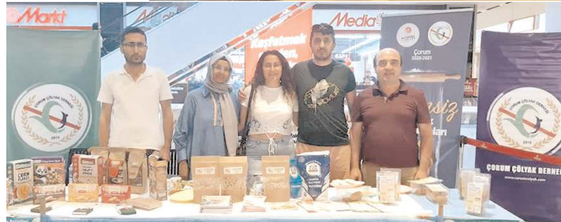
Vatandaşlar stantta hem çölyak hastalığı hakkında bilgi sahibi olurken hem de glutensiz ürünleri görme fırsatı buldular.