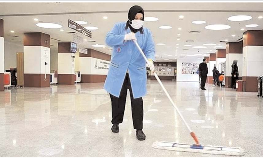
Program 9 ay sürecek.

TYP'lere program süresince Adrese Dayalı Nüfus Kayıt Sistemine göre (ADNKS) aynı adreste ikamet eden kişilerden yalnızca birisi katılabilir. Adrese Dayalı Nüfus Kayıt Sistemine (ADNKS) göre aynı adreste oturanların, programa başvuru yapılan tarihte dikkate alınarak ulaşılabilen en yakın döneme ait gelir getirici bir işte çalışmaları gerekmektedir.