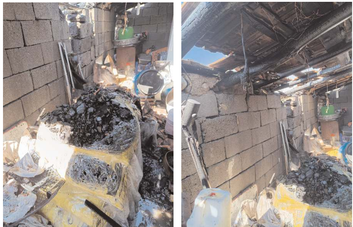
Olay Akçay Mahallesi'nde B.B'ye ait evde meydana geldi.