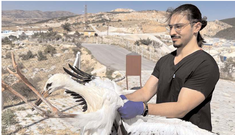
Göç sırasında yaralanan leylekler, Çorum Belediyesi Veteriner İşleri Müdürlüğü'nde tedavi ediliyor.

Doğa Koruma ve Milli Parklar Müdürlüğü tarafından bu yıl tedavi için 15 leylek Veteriner İşleri Müdürlüğü'ne teslim edildi. Veteriner hekimler tarafından gerekli müdahaleler yapılan leylekler tekrar sağlıklarına kavuşana kadar bakıldı. Tedavisi tamamlanan leylekler yeniden uçmaya başladıklarında doğal yaşam alanlarına salındı. Kanadı kırılan ve tedavisi mümkün olmayan leylekler ise yaşamalarının kalan kısımlarını Veteriner İşleri Müdürlüğü'nde geçirmek üzere misafir edilecek. (Haber Merkezi)