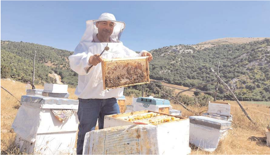
Ayçiçeği tarlaları yanına konulan kovanlardan bal hasadı yapılıyor.