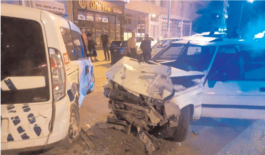
Kazada üç araçta maddi hasar meydana geldi.

Alaca'da otomobilin park halindeki polis aracına çarptığı kazada 1'i polis 3 kişi yaralandı.