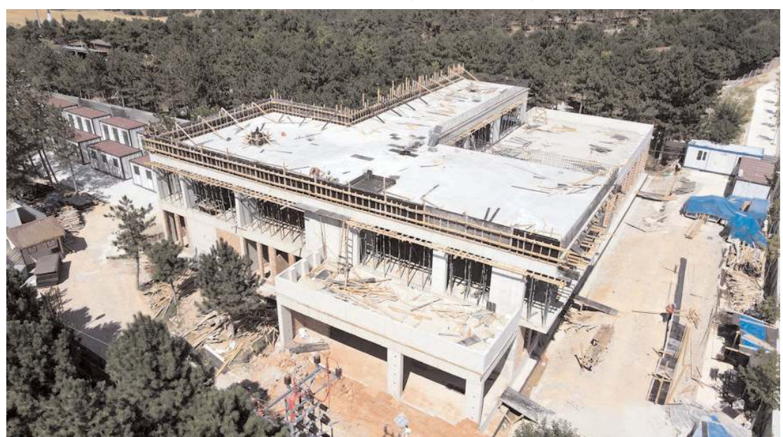
Hastanede ameliyathaneler, müşahede odaları, karantina odaları, muayene odaları yer alıyor.