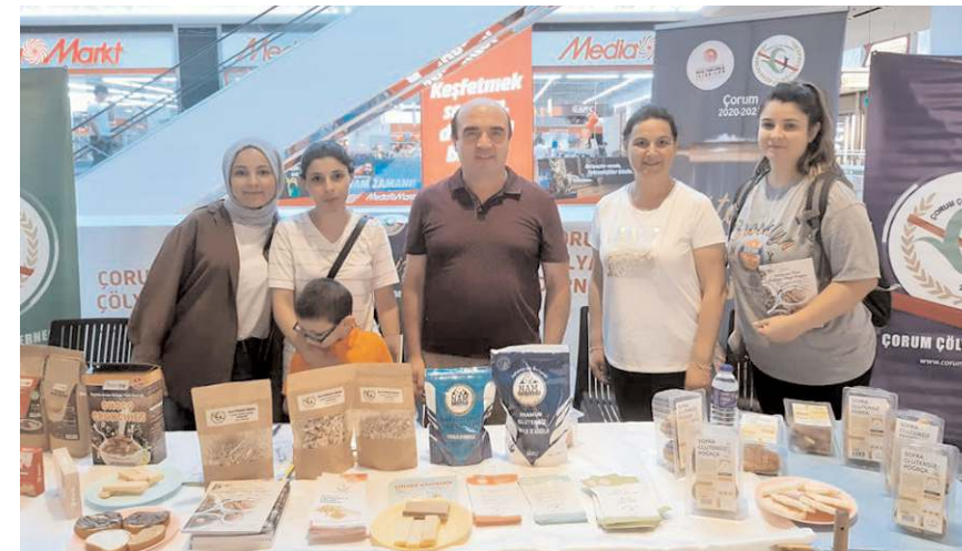
Stant 27 Ağustos Pazar günü saat 22.00'a kadar açık kalacak.