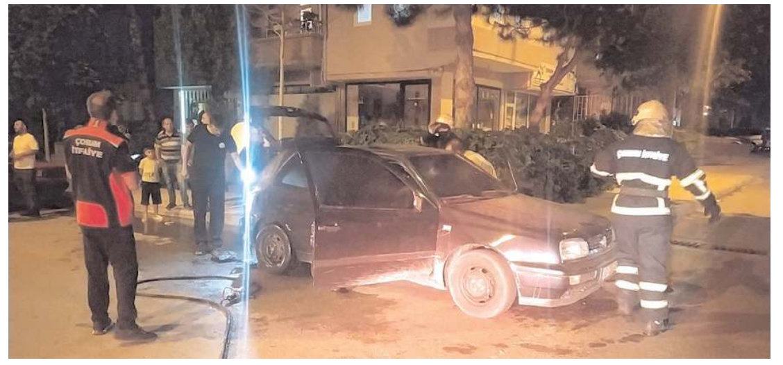
Olay, Üçtutlar Mahallesi'nde meydana geldi.

Öte yandan kaza anı çevredeki bir iş yerinin güvenlik kamerasına yansdı.(AA)