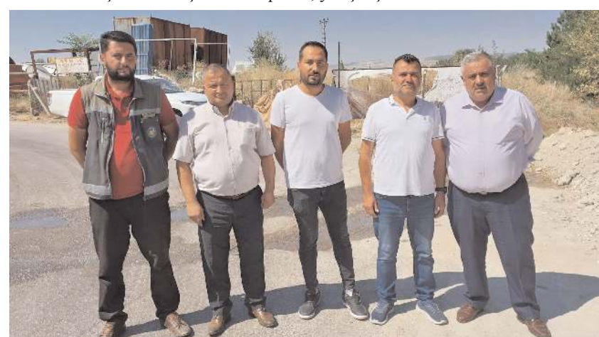
Esnafar yol çalışmalarından duydukları memnuniyeti dile getirdi.