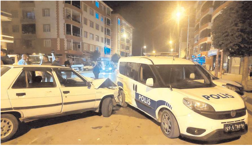
Kaza Zile Caddesi'nde meydana geldi.