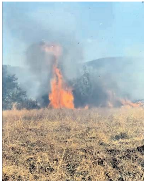
Yangın büyümeden itfaiye ekipleri tarafından kontrol altına alındı.