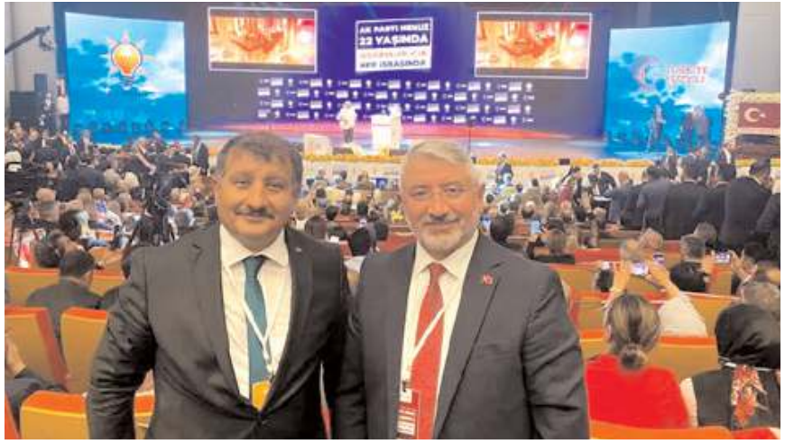
AK Parti'nin 162. Genişletilmiş İl Başkanları Toplantısı yapıldı.

AK Parti İl Başkanı Av. Murat Günay, yaptığı açıklamada, "162. Genişletilmiş İl Başkanları Toplantısı kapsamında Sayın Cumhurbaşkanımız Recep Tayyip Erdoğan'a Çorum'un ihtiyaç ve taleplerinin bir kısmını ilettik. Cumhurbaşkanımız, Genel Başkanımız Sayın Recep Tayyip Erdoğan'a taleplerimize gösterdiği hassasiyetten dolayı hemşehrilerimize adına teşekkür ederiz. Birlik ve beraberlikle daha nice yıllara ulaşmak temennisiyle Cumhurbaşkanımız liderimiz Sayın Recep Tayyip Erdoğan'ın önderliğinde ilk günkü aşkla durmak yok yola devam" dedi. (Haber Merkezi)