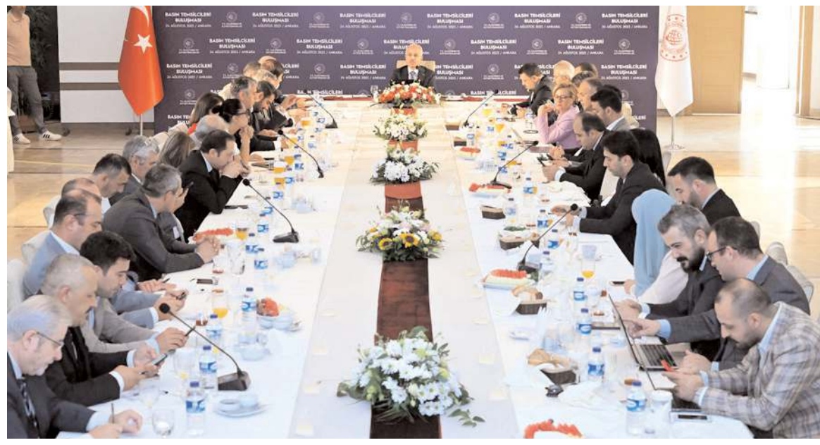
Ulaştırma ve Altyapı Bakanı Abdulkadir Uraloğlu, basın mensuplarıyla bir araya geldi.

findan yapılacak" dedi. Başkan Aşgın, Hayvan Hastanesi'nin sahipsiz sokak hayvanlarına hizmet vereceğini sözlerine ekledi. (Haber Merkezi)