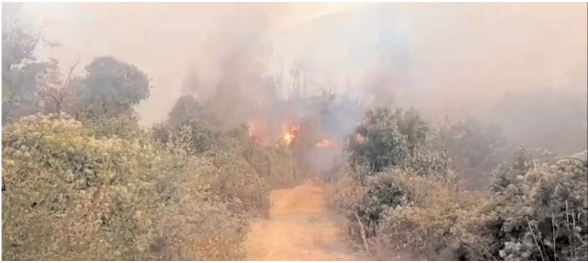
Yangın Laçın'ın Çamlıpınar Köyü'nde bulunan ormanlık alanda meydana geldi.