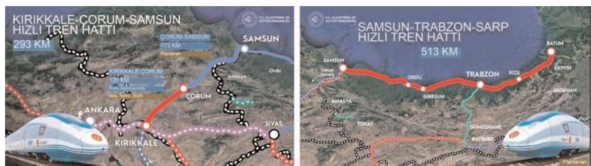
Demir yolu projesinin Karadeniz'de Sarp'a kadar devam etmesi planlanıyor.

Bursa Hızlı Tren Hattı'nı 2026'da bitireceklerini belirten Uraloğlu, "Mersin, Adana, Osmaniye, Gaziantep hattımızı 2027'de bitireceğiz. Biz Kapıkule'den girdiğimizde artık Gaziantep'ten hızlı trenle çıkmış olacağız. Ankara'nın İzmir'e bağlantısını sağlayacak yüksek hızlı treni 2028'de bitirmeyi hedefliyoruz. Yavuz Sultan Selim Köprüsü'nden de geçecek olan ve Uzakdoğu'yu Londra'ya ikinci defa bağlayacak olan demir yolu hattımızı yine planlıyoruz. Karadeniz'e ulaşacak demir yolu hattımızın ilk etapta Kırıkkale ile Çorum arasının 2028'e kadar bitirilmesini planlıyoruz. Ankara-İstanbul arasında süper hızlı tren projemizi bitirdik. Bunun fizibiliteğini yapıyoruz. Ankara ile İstanbul arasında iki durakla yaklaşık 80 dakikada kat etmiş olacağız. Bunu da 2028 için iddialı olabilir ama bunu da inşallah ihalesini yapıp bunun da yapım çalışmalarına başlayacağız." dedi. (Haber Merkezi)