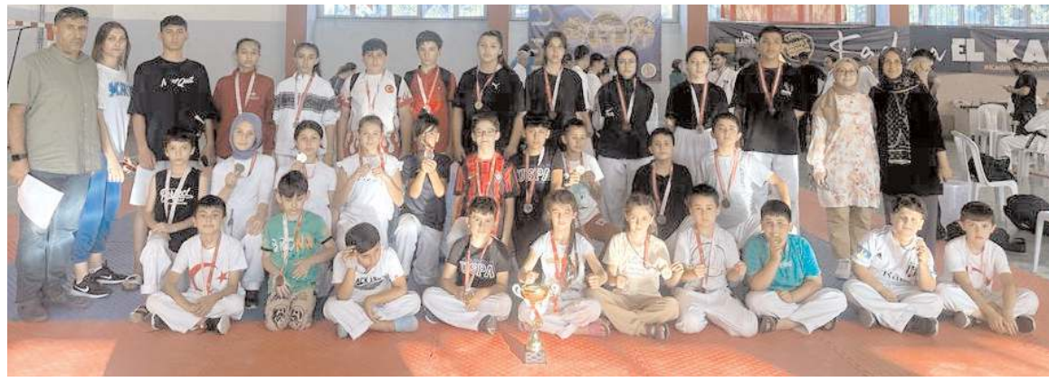
Bartın'da 30 sporcu ile katıldığı turnuvada tüm sporcuları kürsüye çıkan Çorum takımı ödül töreni sonrası toplu halde