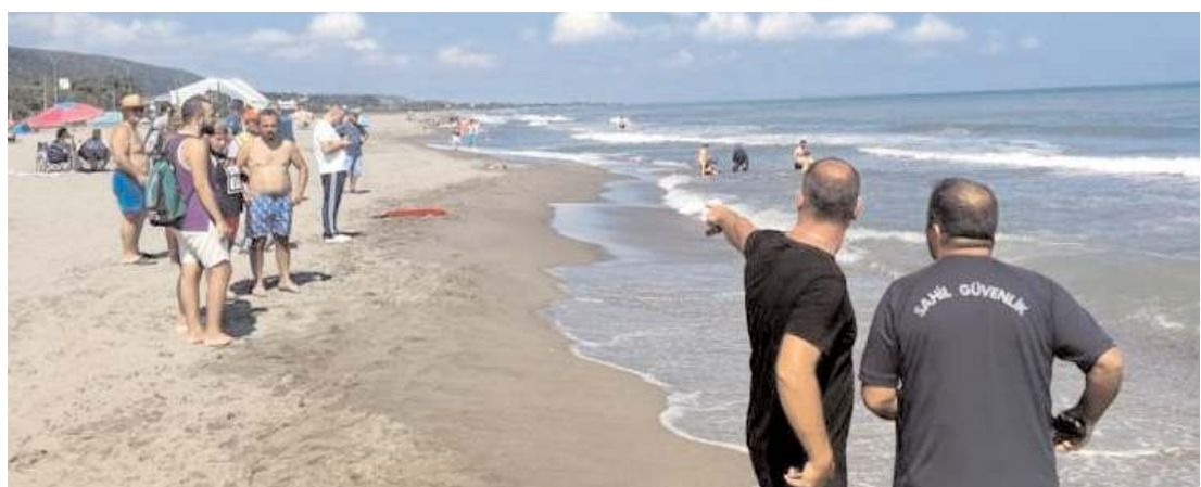
Olay Samsun İncesu Plajı'nda meydana geldi.

Hakimiyet, merhumeyle Allah'tan rahmet, ailesine ve yakınlarına başsağlığı diler.