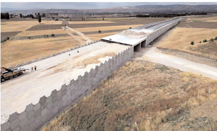
İskilip yolunu kavşağa bağlayacak olan bölümün Eylül ayı içinde tamamlanması hedefleniyor.