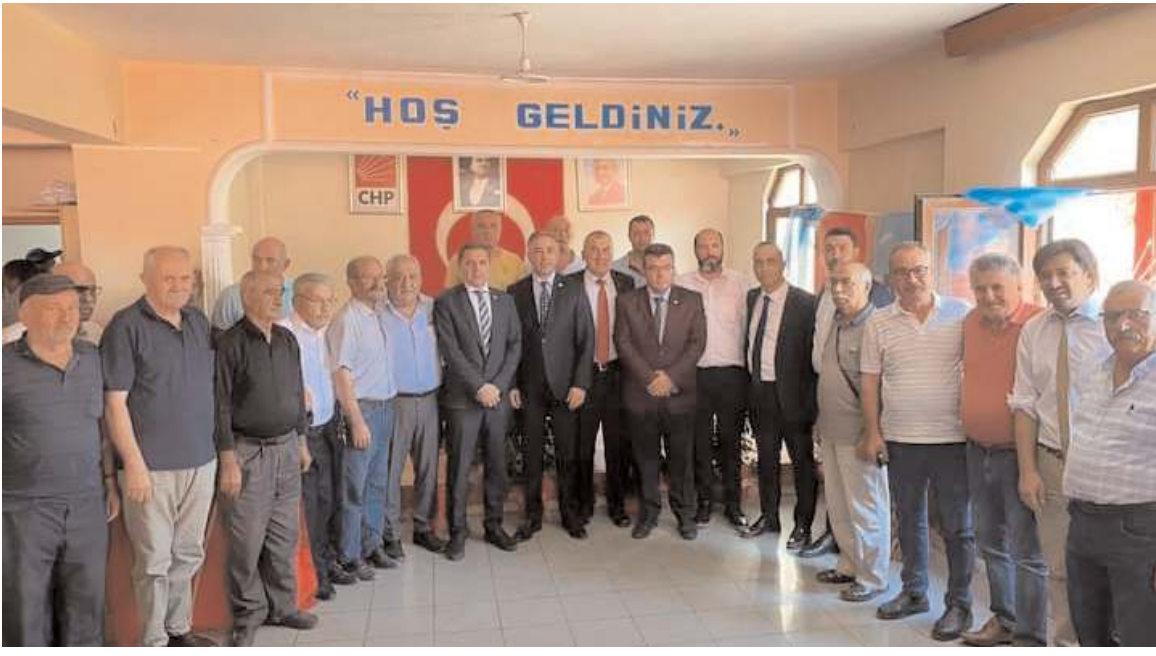
Cumhuriyet Halk Partisi (CHP) Osmancık İlçe Başkanlığında yapılan kongreye çok sayıda partili katıldı.