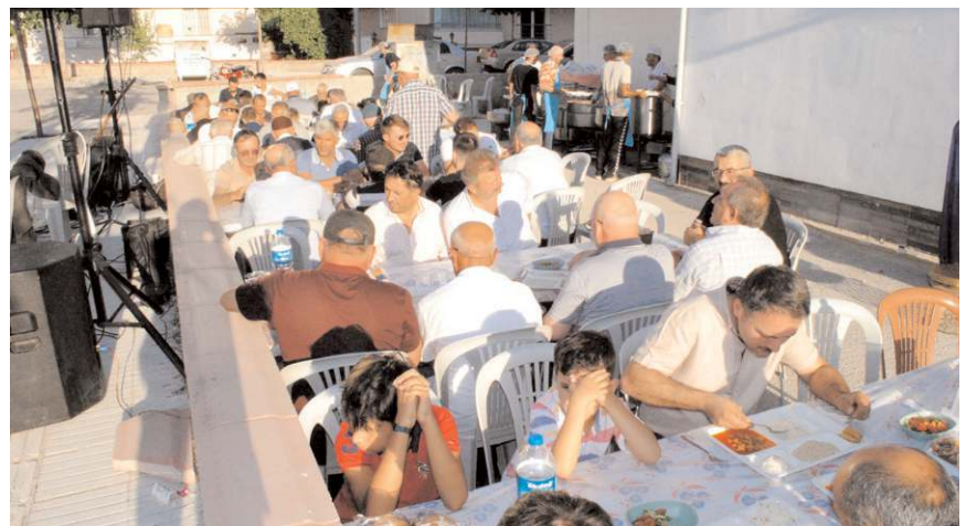
Sünnet düğününe çok sayıda davetli katıldı.

Sünnet düğünü boyunca davetliler ise canlı müzik eşliğinde renkli geçen düğünün tadını çıkarttılar. (Haber Merkezi)