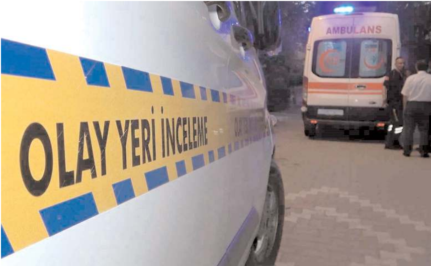
Polis ekipleri olay yerinde inceleme yaptı.