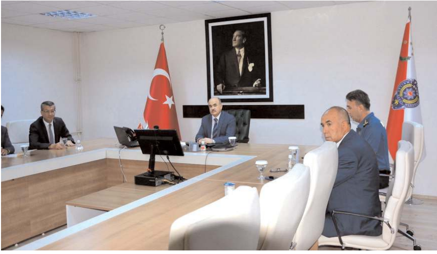
Toplantıda şehrin emniyet ve asayiş konuları masaya yatırıldı.

"Vatandaşlarımızın huzur ve güvenliğini sağlamak amacıyla mesai mefhumu gözetmeksizin gerçekleştirilen tüm çalışmalar için emniyet ve jandarma mensuplarımıza teşekkür ediyorum, bundan sonraki çalışmalarında üstün başarılar diliyorum. Çorum'da görev yapacağım süre boyunca çalışmaların aynı kararlılıkla ve koordineli bir şekilde sürdürülmesi için elimden gelen gayreti göstereceğimin bilmesini istiyorum. Bu değerlendirme toplantımızın asayiş suçlarının önlenmesine, olayların aydınlatılarak failerin yakalanmasına büyük katkı sağlayacağına inanıyorum. Tüm Çorum'lular hemşehrilerime sağlıklı, huzurlu ve mutlu günler diliyorum, selam ve muhabbetlerimi sunuyorum." (Haber Merkezi)