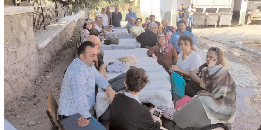
Programa Çorum'dan kalabalık bir heyet katıldı.