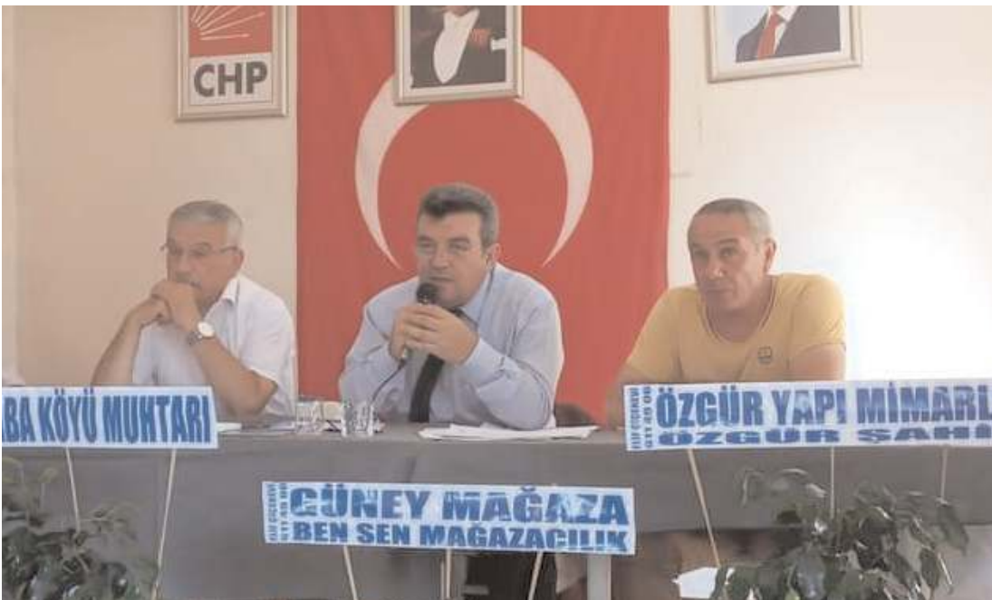
Kongrede ilk olarak divan heyeti seçildi.

CHP'de Osmancık ile birlikte 8 ilçenin kongresi tamamlanırken, 29 Ağustos'ta Dordurga, 2 Eylül'de Kargı, 6 Eylül'de Ortaköy, 12 Eylül'de Alaca ve 17 Eylül'de ise Merkez İlçe Kongresi gerçekleştirilecek. Laçın İlçe Kongre tarihinin ise önümüzdeki günlerde netleşmesi bekleniyor.(Haber Merkezi)