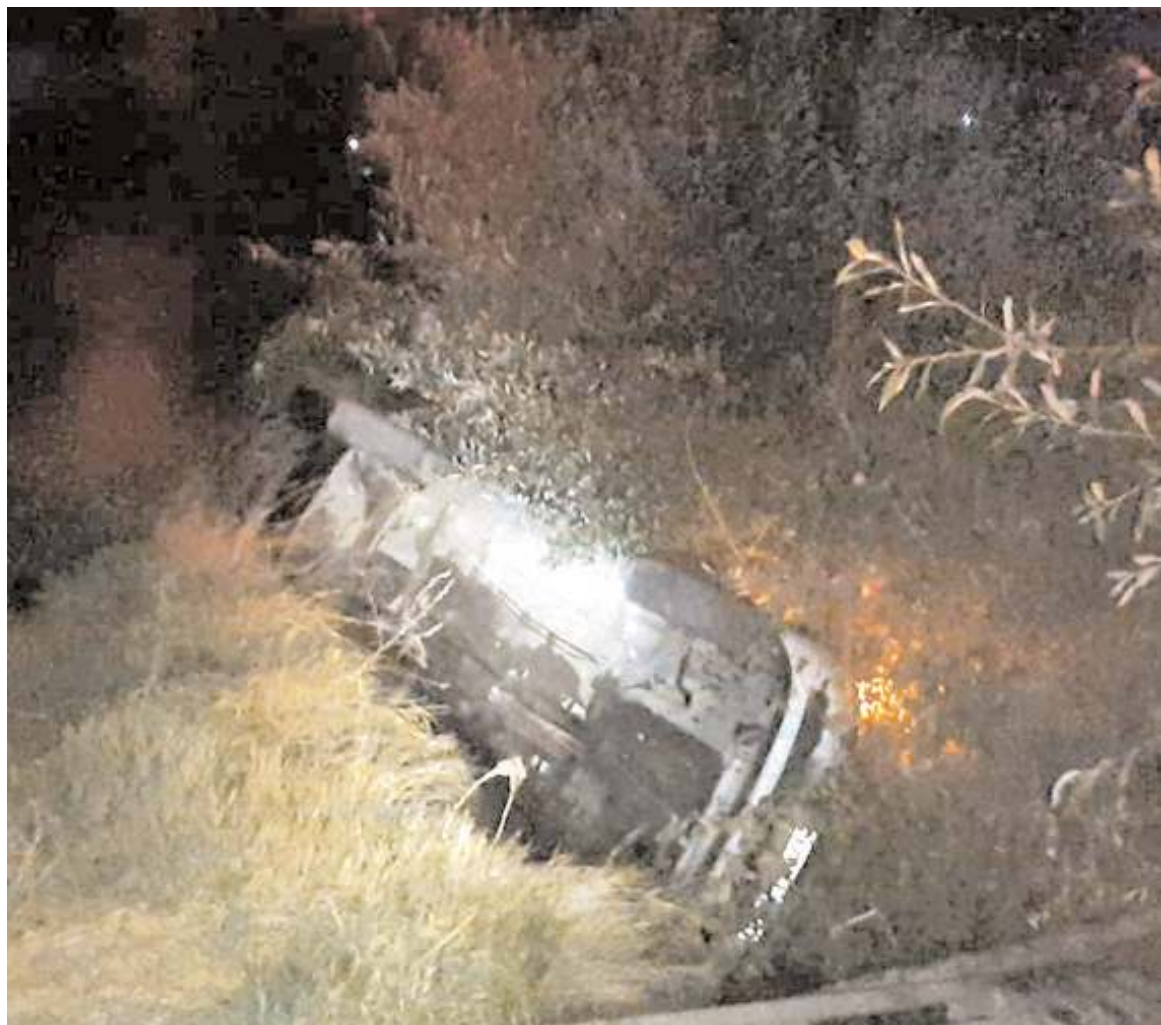
Kazada araçta maddi hasar meydana geldi.

Sülük, belediye olarak kısa sürede müdahale ederek yangının büyümesini önlediklerini kaydetti. (AA)