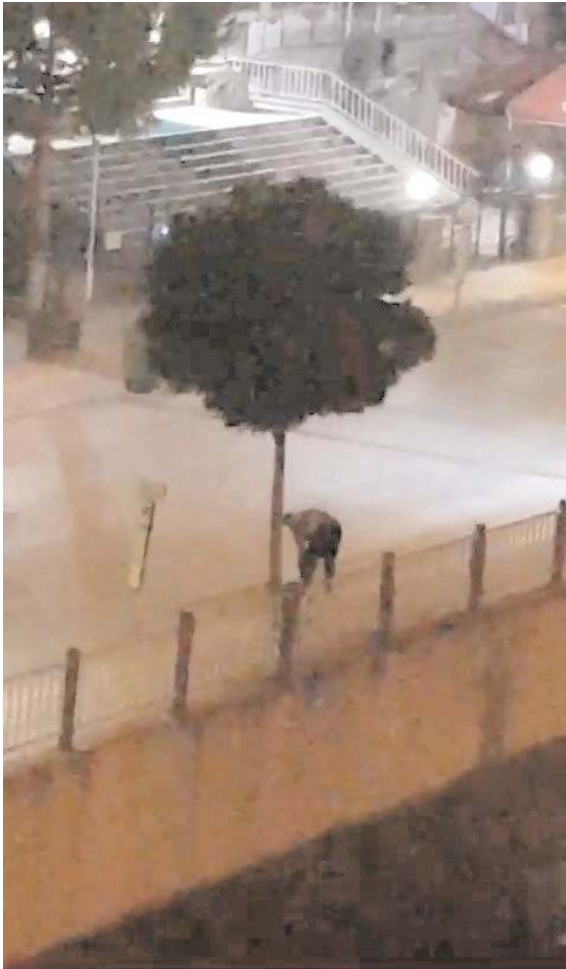
Irmaktan kovayla su alarak ağaçları sulayan vatandaşın bu davranışı takdir topladı.

Vatandaşın örnek davranışı çevre sakinlerinin takdirini toplarken cep telefonu kamerası ile o anlar da görüntülendi. Görüntülerde, bir adamın ilçe merkezinden geçen sulama kanalından kova ile çektiği suları kaldırımdaki ağaçların dibine döktüğü görülüyor. (İHA)