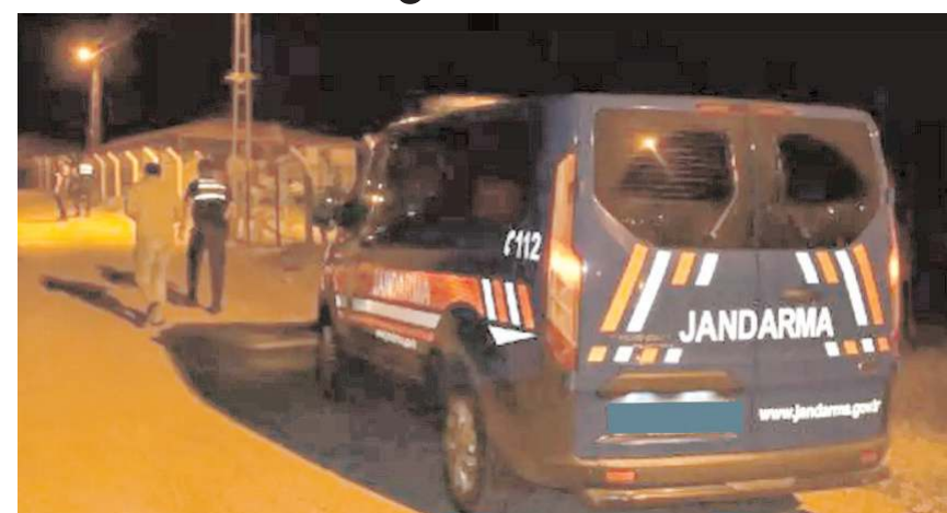
Olay Uğurludağ'ın Boztepe köyünde meydana geldi.

Olay sonrası köye gelen Jandarma ekipleri köyde inceleme başlattı.