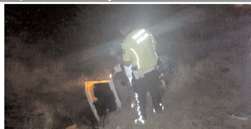
Olay Karacaköy yolunda meydana geldi.

Kazada yaralanan sürücü, sağlık ekiplerince yapılan müdahalenin ardından Hitit Üniversitesi Erol Olçok Eğitim ve Araştırma Hastanesi'ne kaldırıldı. (AA)