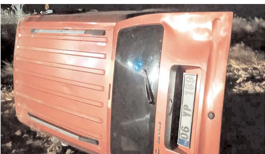
Kazada araçta maddi hasar meydana geldi.