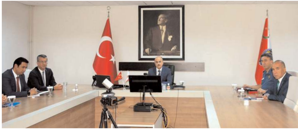
Toplantıda şehrin emniyet ve asayiş konuları masaya yatırıldı.