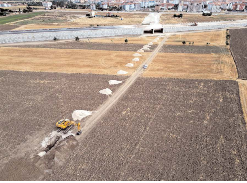
Belediye ekipleri bölgede alt yapı çalışması yapıyor.

Başkan Aşgın, Çiftlik Pınarı Caddesi'nin yanı sıra Söğütözü ve Çiftlik Çayırı Sokaklarda alt ve üstü yapı çalışmaları, Özgürevler'de ise derse işlahı çalışmalarının devam ettiğini açıkladı. (Haber Merkezi)