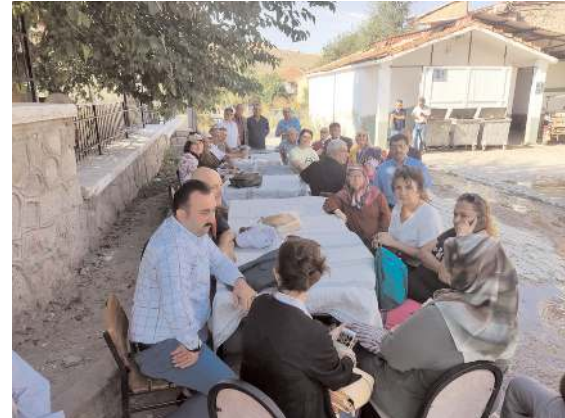
Programa Çorum'dan kalabalık bir heyet katıldı.