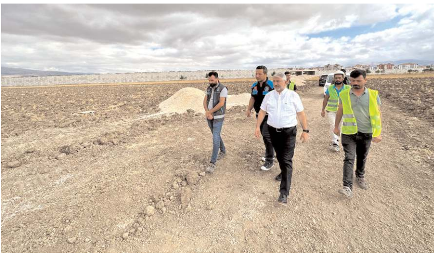
Başkan Aşgın, çalışmaları yerinde inceledi.