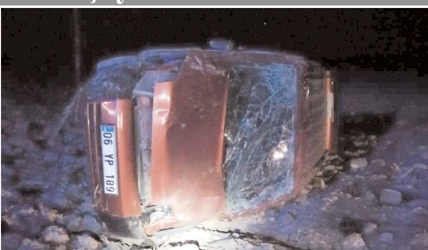
Kaza Çorum-Merzifon karayolunda meydana geldi.

Yaralılar olay yerinde yapılan ilk müdahalenin ardından 112 acil sağlık ekipleri tarafından Merzifon Devlet Hastanesine kaldırılarak tedavi altına alındı.