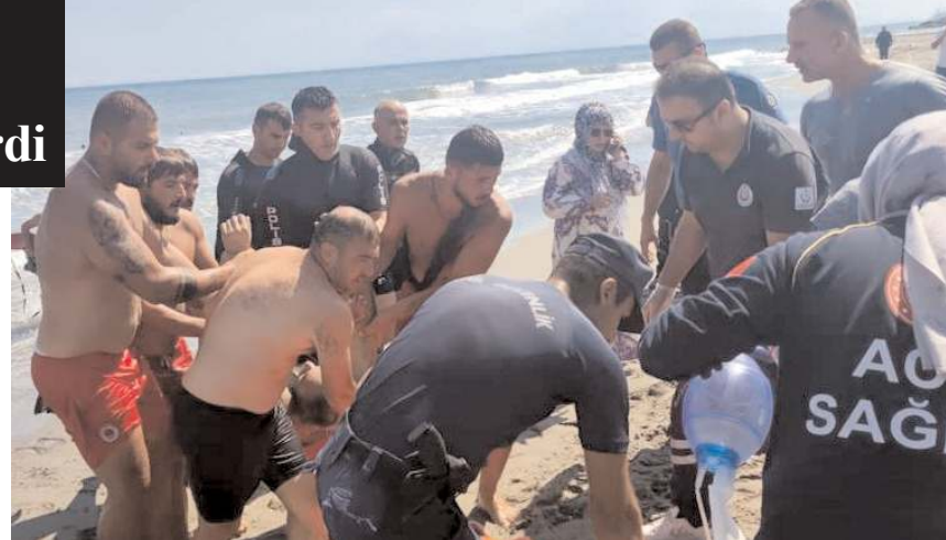
Ekiplerin müdahalesi sonucu bulunarak sudan çıkarılan M.K., özel bir hastaneye kaldırıldı.