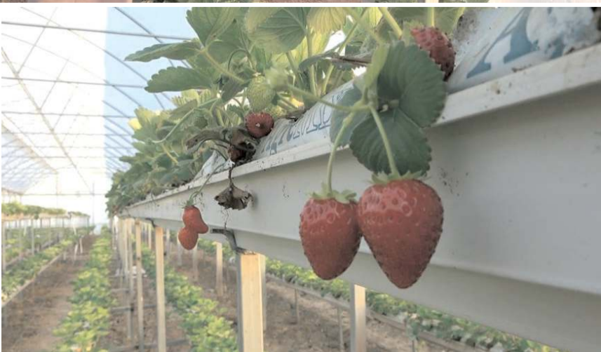
Yediveren çileği sadece Karadeniz Ereğli ve İskilip'te üretiliyor.