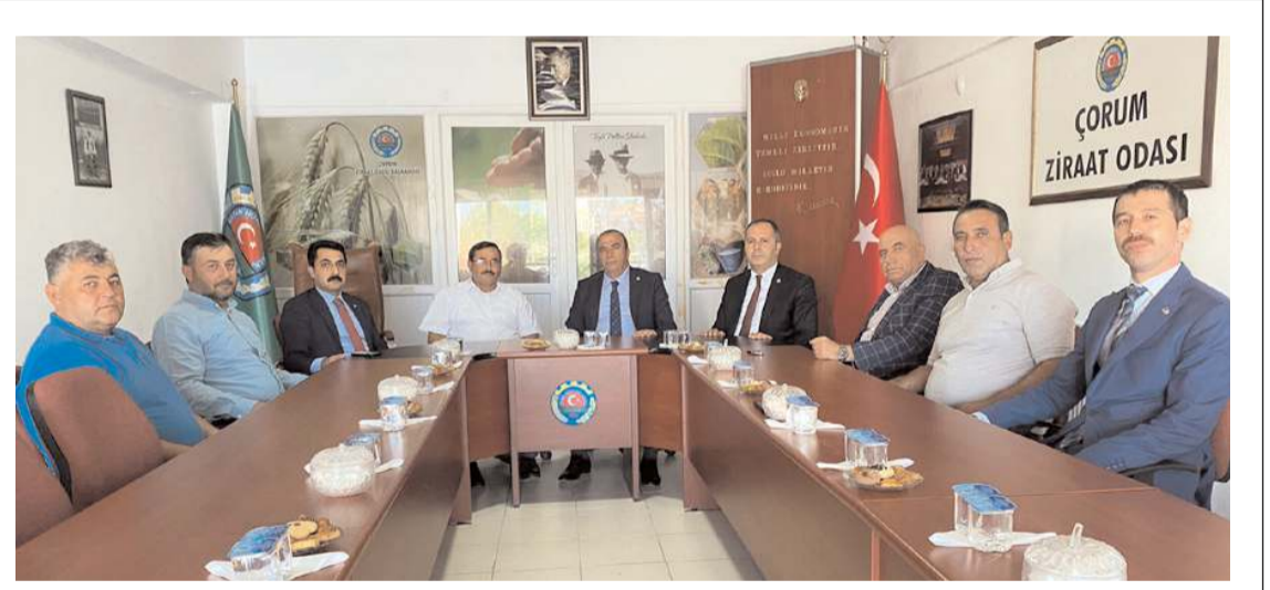
Ziyarette çiftçilerin sorun ve talepleri konuşuldu.