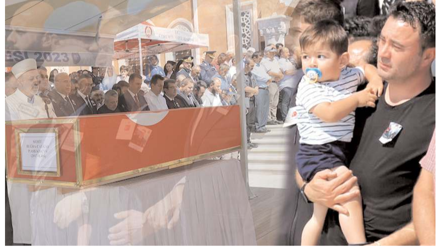
Helallik alma töreninde şehidin 2 yaşındaki çocuğunun babasına son bakışı görenlerin yüreklerini parçaladı.