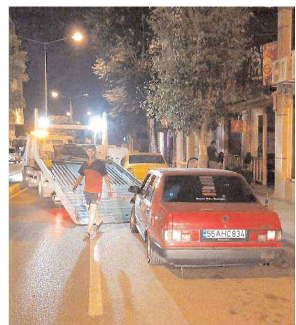
Otomobil trafikten men edilerek çekici ile otoparka alındı.