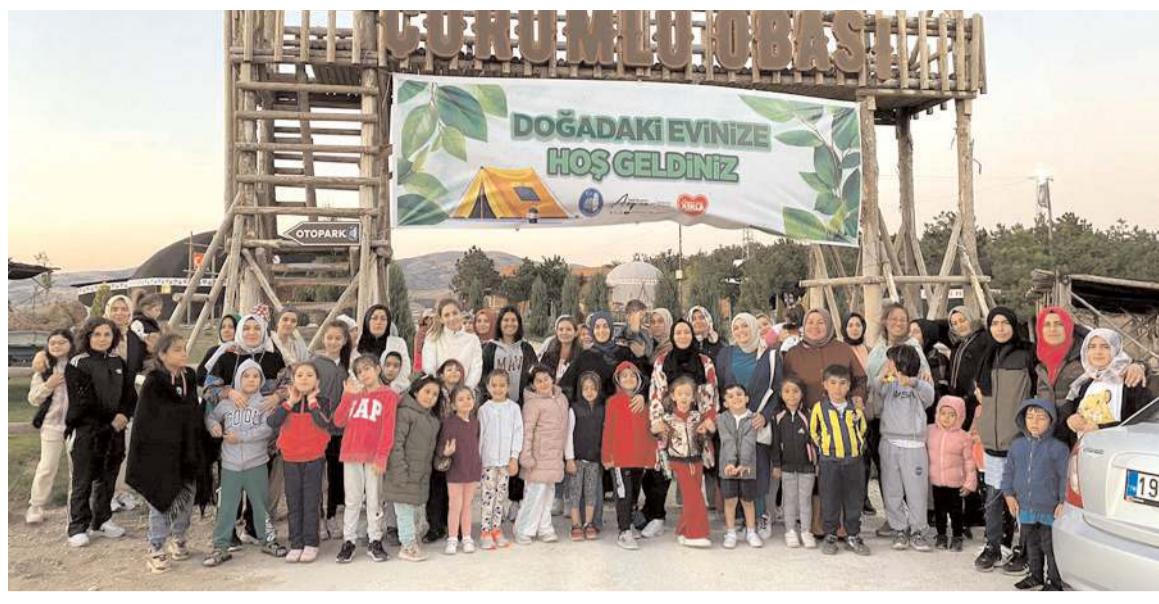
Kampa 38 anne ve 53 çocuk katıldı.