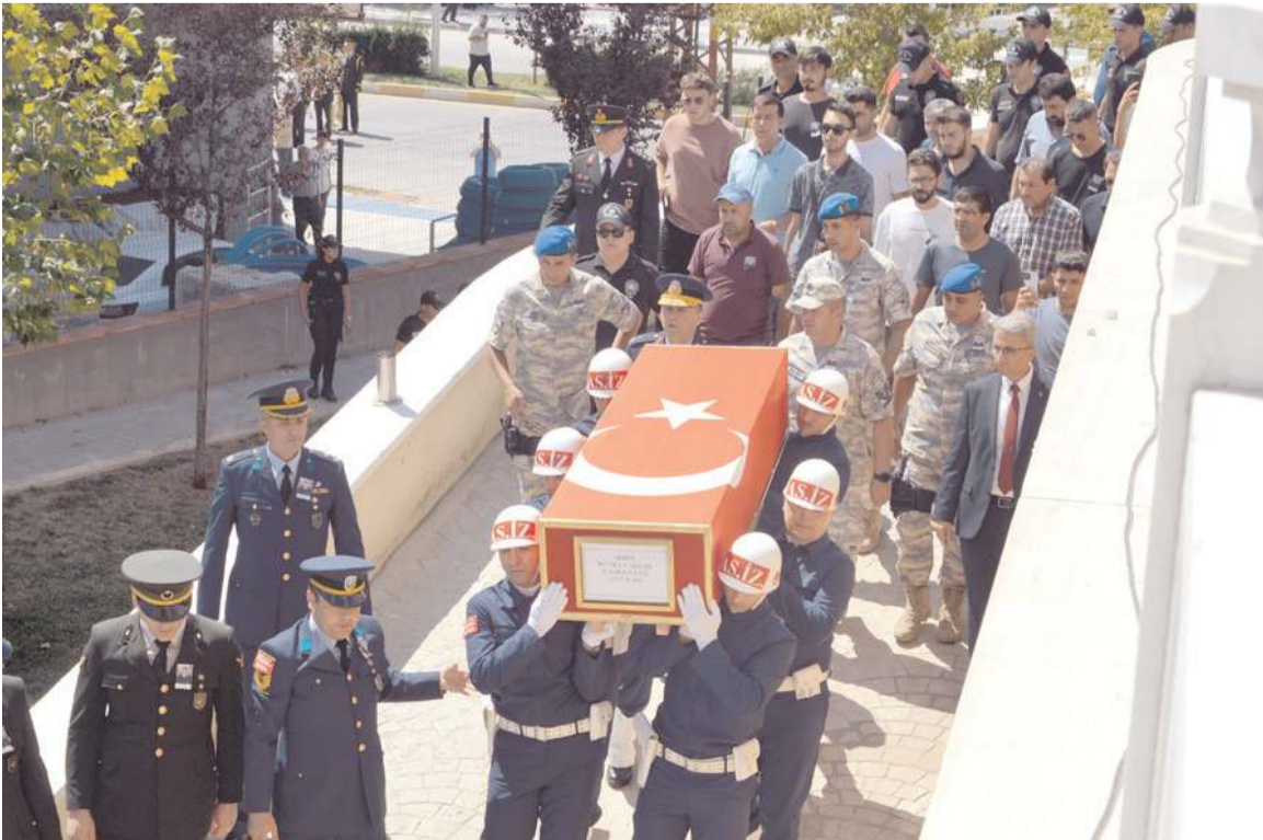
Şehidin cenazesi kılınan namazın ardından Çorum Şehitliği'nde toprağa verildi.