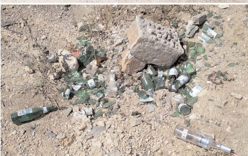
Etrafa atılan cam şişeler tehlike saçıyor