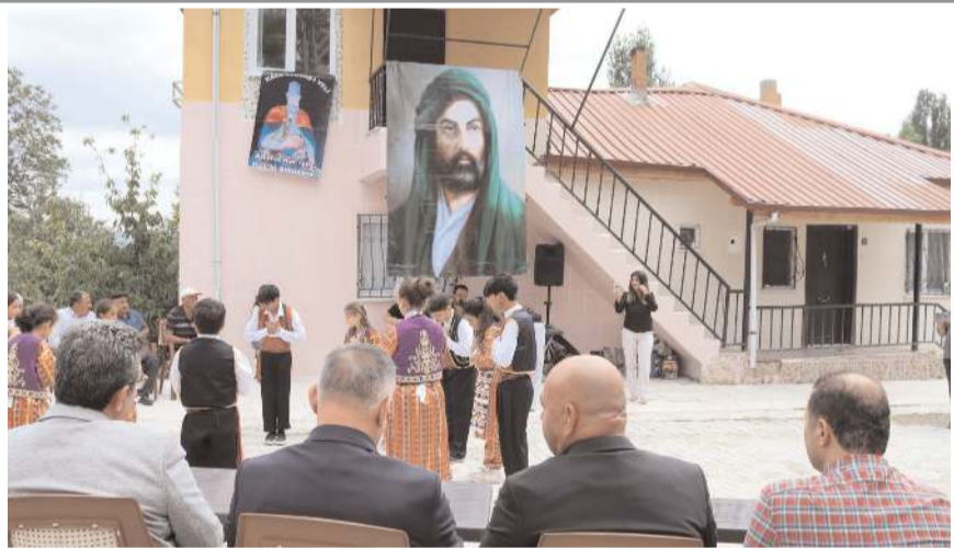
Cevizli Köyü Cemevi düzenlenen törenle açıldı.