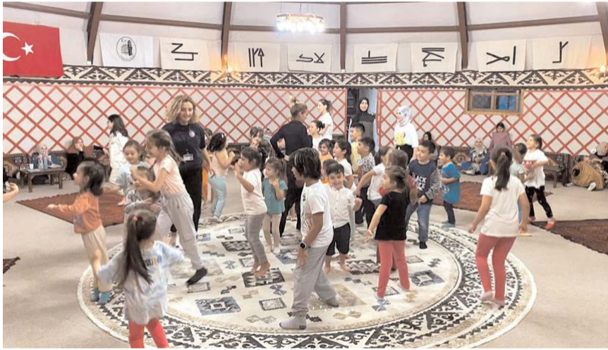
Çocuklar birbirinden güzel oyunlar oynadılar.