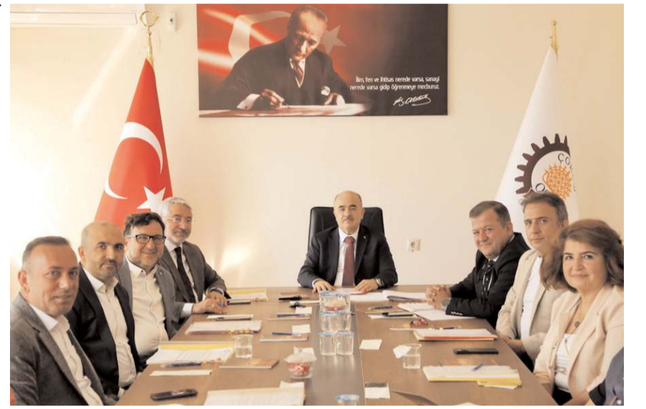
Toplantıda gündem maddeleri görüşüldü.