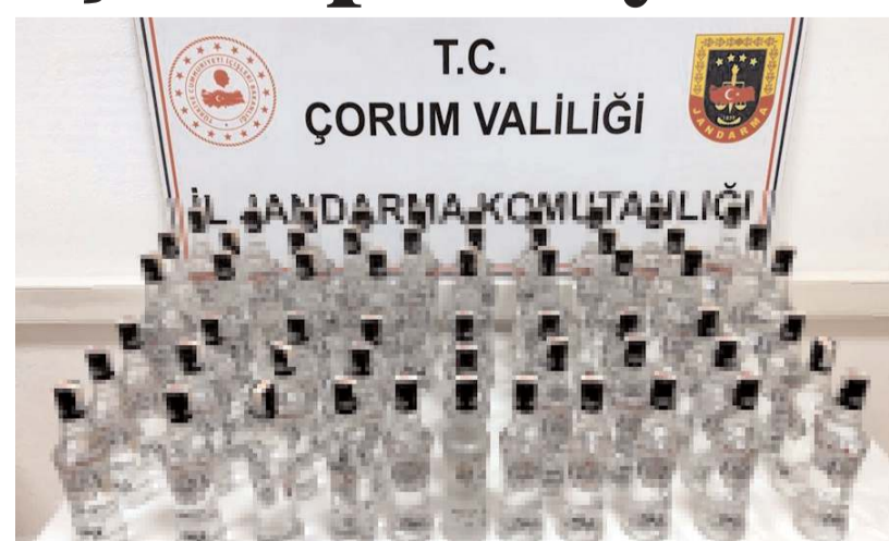
Operasyonda 58 şişe kaçak ve sahte içki ele geçirildi.

Kent merkezinde yapılan çalışmalarda bir şahsın ikametlerinde sahte bandrollü alkollü içki bulunduğu tespit edilmesi üzerine bahse konu şahsın ikamet adreslerinde yapılan adli aramada; 58 şişe kaçak ve sahte içki ele geçirildi. Kaçak alkollü içkilere el koyan jandarma ekiplerinin, şüpheli şahıs hakkında ise adli işlem başlatıldığı bildirildi. (İHA)