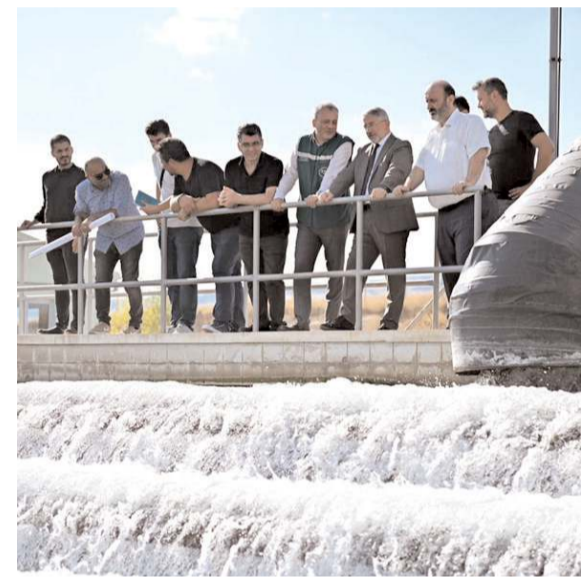
İçmesuyu Arıtma Tesisi'nin yer teslimi yapıldı.

2012 yılından bu yana Çorum'da faaliyet gösteren Argesim Makine, Türkiye'nin ilk yerli otomobili TOGG'u bünyesine kazandırdı. * HABERİ 5'DE