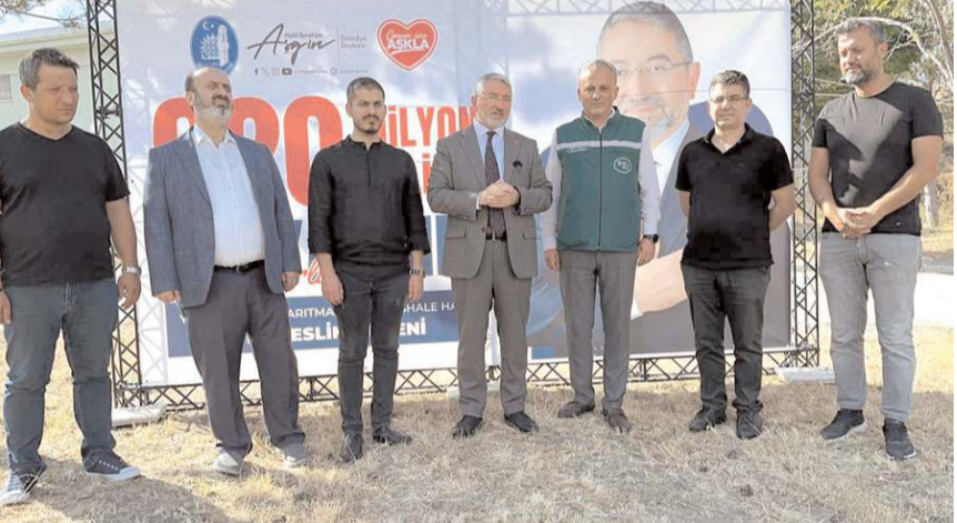
Başkan Aşgın, yeni yapılacak tesis hakkında açıklamalarda bulundu.

ardından yüklenici firmaya yer teslimi yapıldı. İşbaşı yapan firma, şartnameye göre çalışmayı 24 ay içerisinde tamamlayacak.