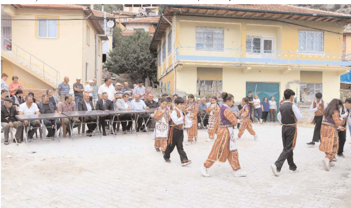
Açılışta semah ekibi gösteri yaptı.