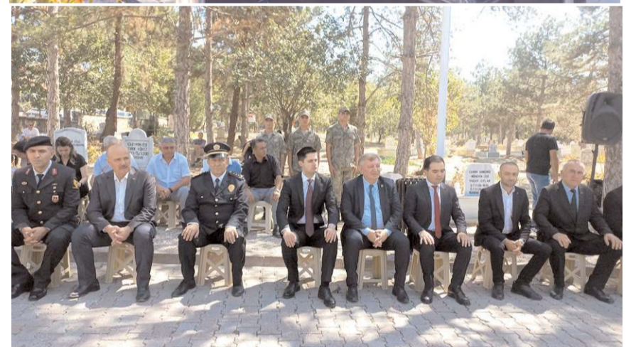
Şehitler için Kuranı Kerim okundu.