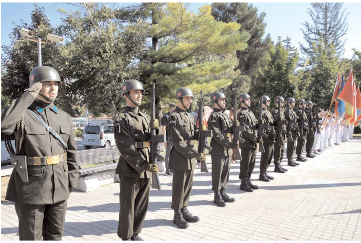
30 Ağustos Zafer Bayramı nedeniyle Atatürk Anıtı'nda tören yapıldı.