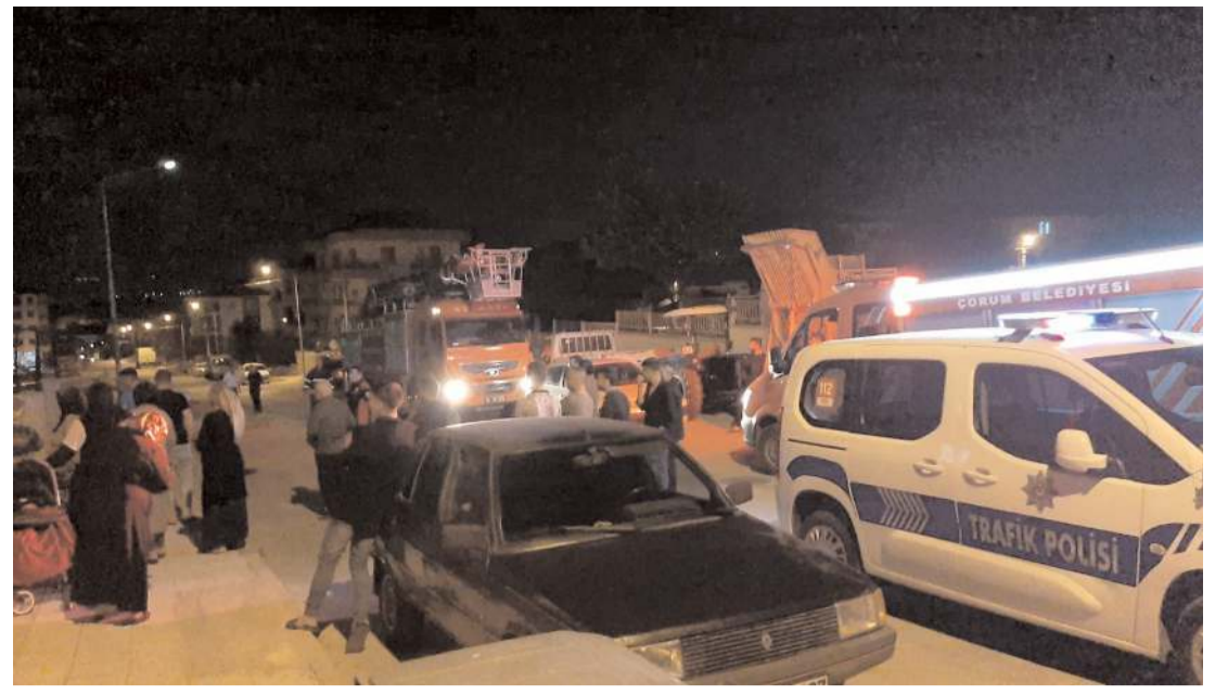
Olay Gülabibey Mahallesi Bağcılar 3. Caddede meydana geldi.

5'i kadın, 2'si erkek olmak üzere kayıp olduklarına dair müracaatta bulunulan şahıslardan, 5 kadın ve 1 erkek şahısta ekipler tarafından bulundu. 1 şahsın aranmasına ise devam ediliyor. (Haber Merkezi)