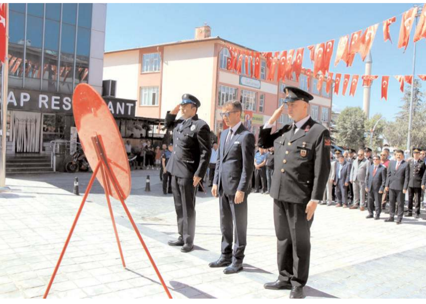
Tören Atatürk Meydanı'nda yapıldı.