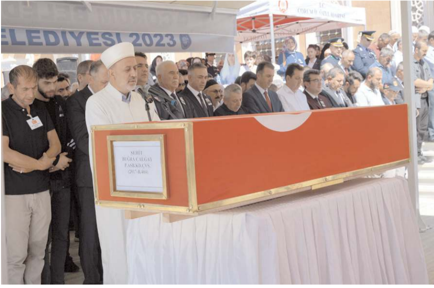
Şehidin cenaze namazını İl Müftüsü Muharrem Biçer kıldırdı.