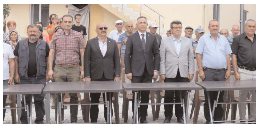
Törene protokol üyeleri katıldı.