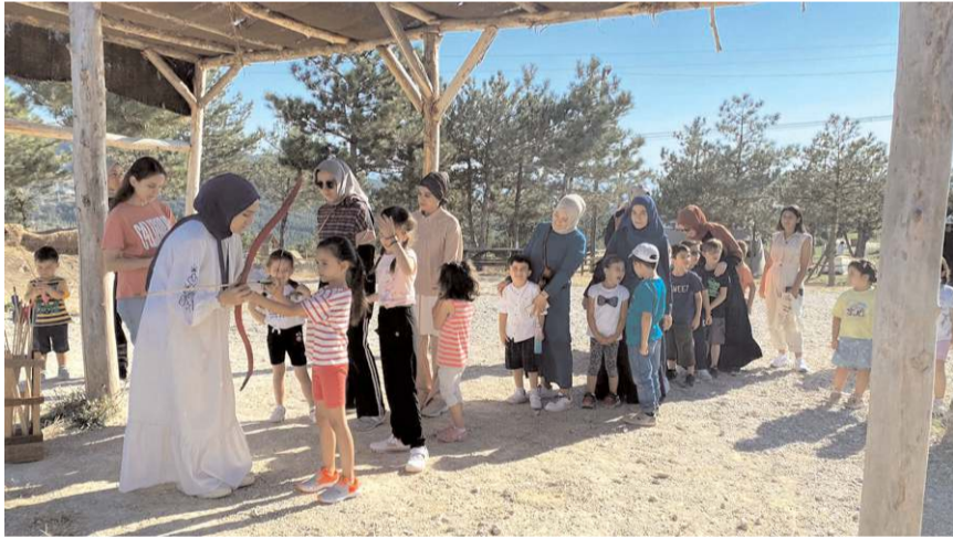
Çocuklar kampa ok attılar.