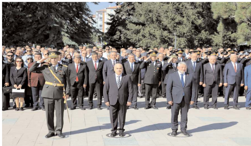
30 Ağustos Zafer Bayramı nedeniyle Atatürk Anıtı'nda tören yapıldı.

30 Ağustos 1922'de dünyanın en büyük kahramanlık destanlarından birisi yazıldı. 30 Ağustos Büyük Zaferi'nin 101.yılında Çorum'a Atatürk Anıtı'nda tören yapıldı. * HABERİ 4'TE