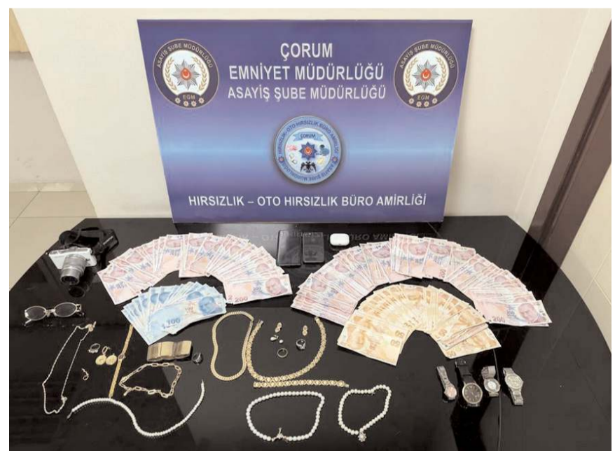
Zanlıın çaldığı malzemeler ele geçirildi.

Gözaltına alınan hırsızlık zanlısı, emniyetteki işlemlerinin tamamlanmasının ardından sevk edildiği adliyeye çıkarıldığı hakimlikçe tutuklandı.(AA)