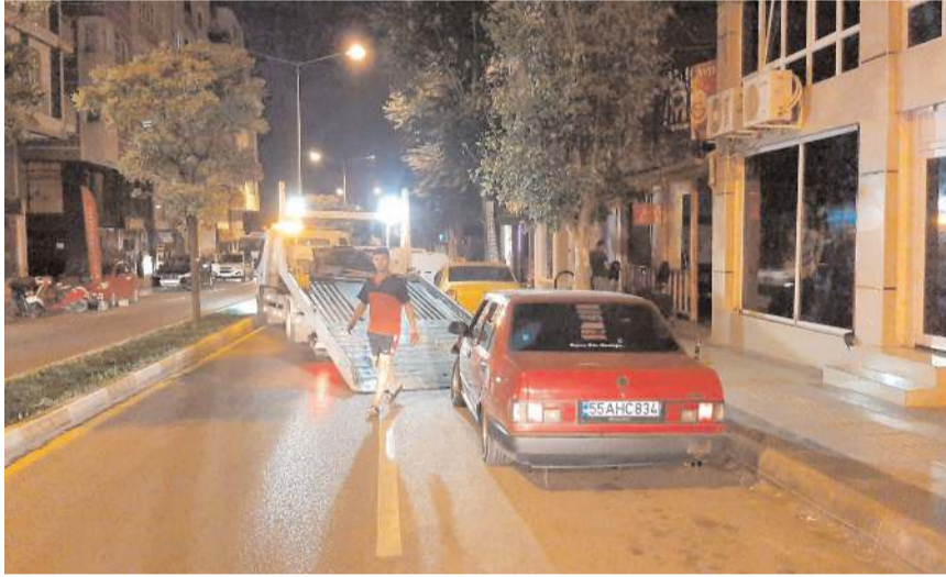
Otomobil trafikten men edilerek çekici ile otoparka alındı.

Sürücü polis otosuyla karakola götürülürken, otomobil ise trafikten men edilerek çekici ile otoparka alındı.(AA)