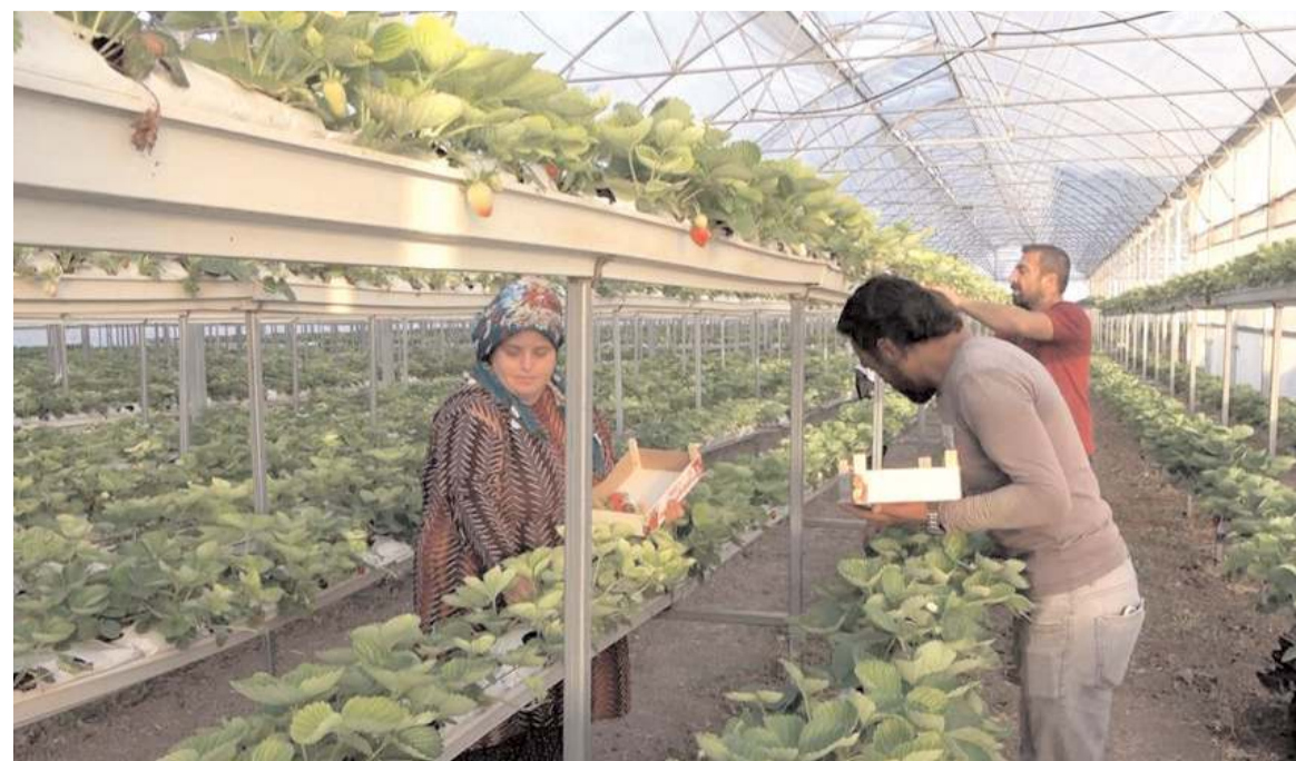
Tesis, 3 bin 200 metrekare büyüklüğünde.