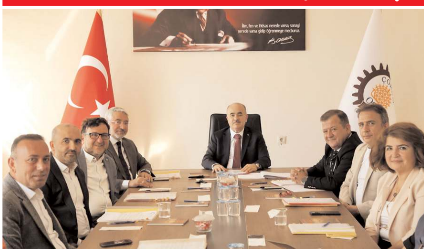
Toplantıda gündem maddeleri görüşüldü.

OSB Yönetim Kurulu ve Müteşebbis Heyeti ile ilk toplantı