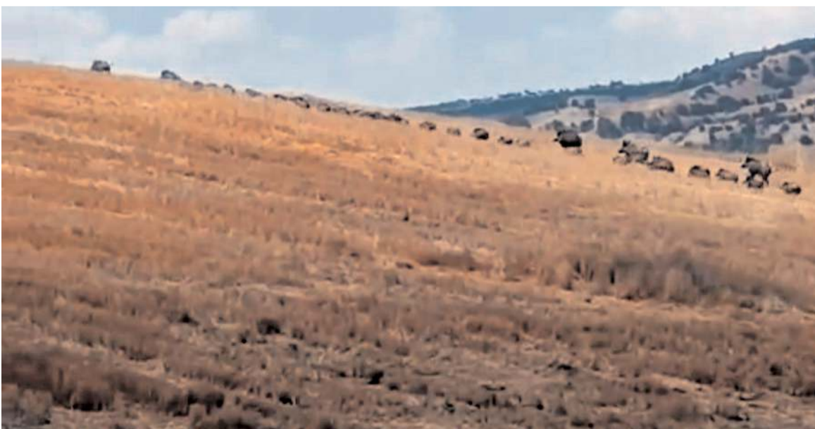
Domuz sürüsünü bölgede bulunan vatandaşlar görüntüledi.

Büyük bir şaşkınlık yaşayan vatandaş, domuz sürüsünü cep telefonu kamerası ile kayıt altına aldı. Görüntülerde 60'a yakın yaban domuzunun arazide ilerlediği görüldü. (İHA)