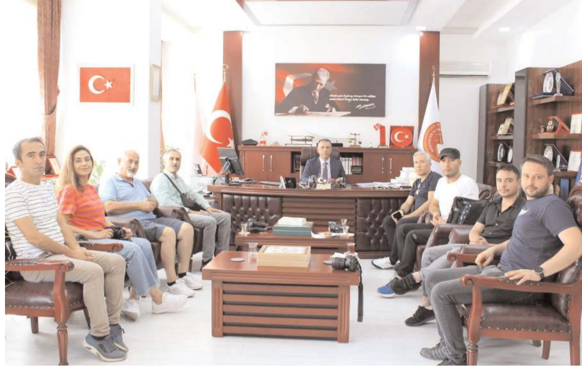
Çorum Cumhuriyet Başsavcısı Ahmet Bektaş, basın mensuplarıyla bir araya geldi.