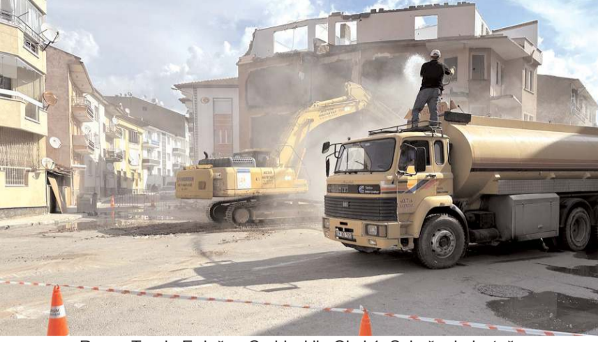
Recep Tayyip Erdoğan Caddesi ile Okul 1. Sokağın bulunduğu noktadaki üç yapının yıkım çalışmaları başladı.