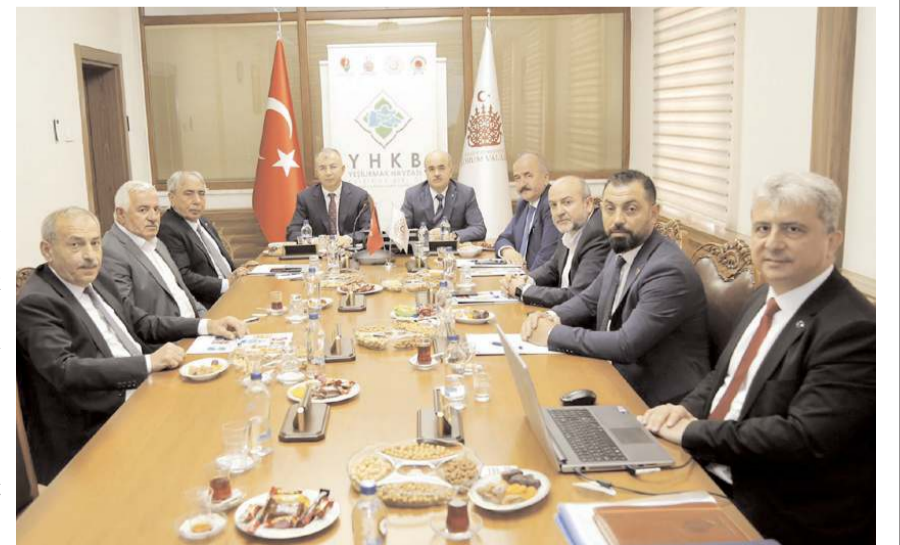
Toplantıya Birlik üyeleri katıldı.

Amasya Valisi Birlik Başkanı Yılmaz Doruk'un açılış konuşmasının ardından Encümen toplantısında Birliğin yürüttüğü çalışmaların yanı sıra