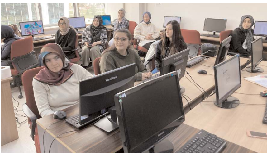
Kadın Kültür ve Sanat Merkezlerinde açılan kurslara ilgi yüksek oluyor.

Çorum Belediyesi, yolları genişleterek ulaşımı rahatlatmak için kamulaştırma çalışmalarına hızla devam ediyor. Recep Tayyip Erdoğan Caddesi ile Okul 1. Sokağın bulunduğu noktadaki üç yapının yıkım çalışmaları başladı.