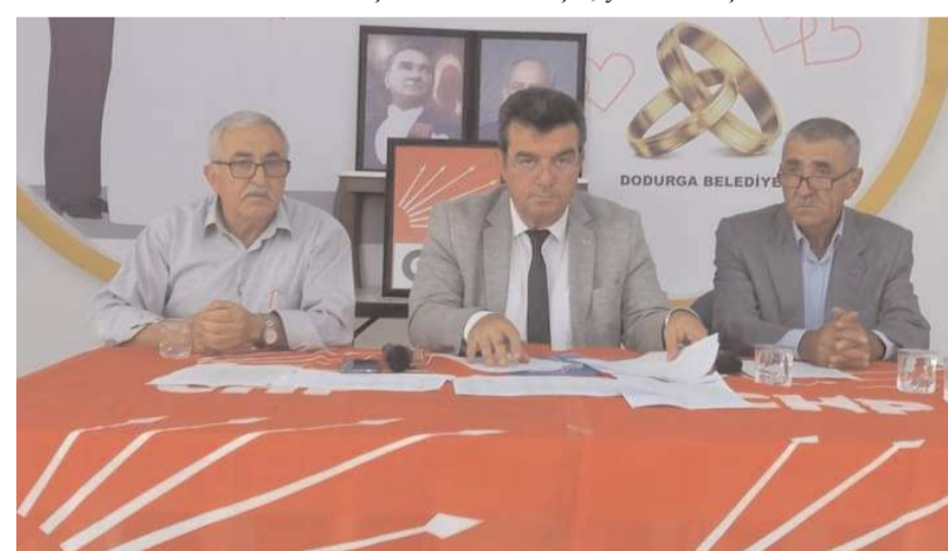
Kongrede ilk olarak divan heyeti belirlendi.