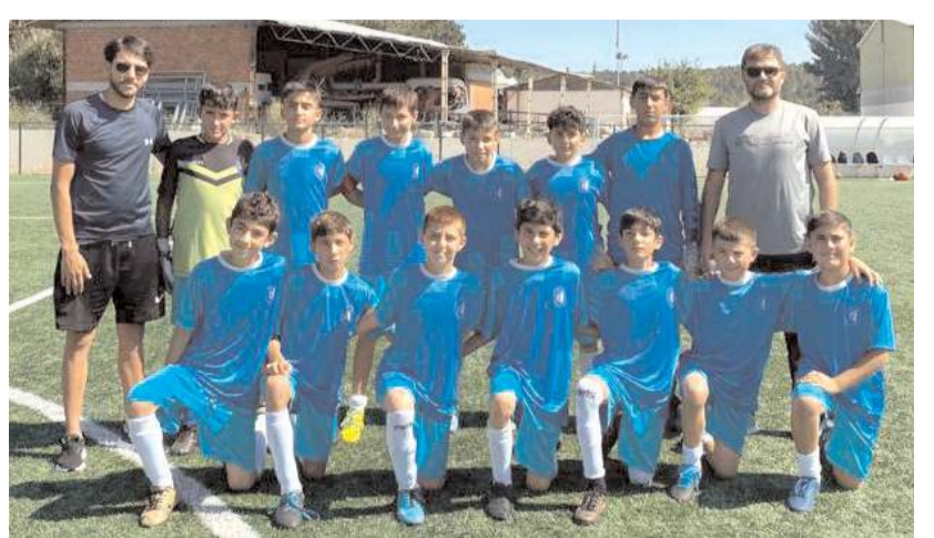
Mimar Sinan, Hattuşa Direksan'ı yenerek çeyrek finale yükseldi

Tek maçlı eleme sistemine göre oynanan maçlarda normal sürelerin berabere bitmesi halinde uzatma olmadan direkt penaltı atışları galip takımı belirleyecek.