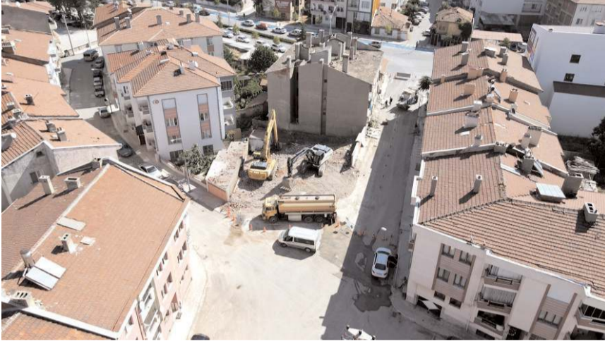
Bölgede yapılacak yol genişletme çalışmaları ile Recep Tayyip Erdoğan Caddesi'ne ulaşım rahatlayacak.