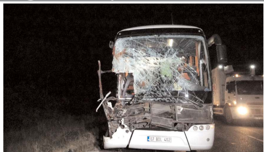
Kaza, Uşak'ın Banaz ilçesi Dumlupınar Kavşağı yakınlarında meydana geldi.