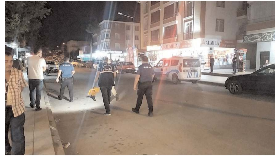
Olay, Gülabibey Mahallesi'nde meydana geldi.