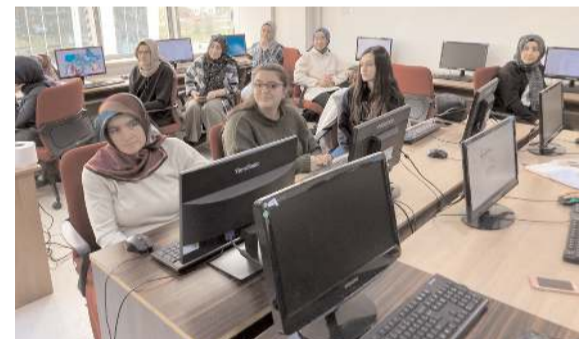
Kadın Kültür ve Sanat Merkezlerinde açılan kurslara ilgi yüksek oluyor.