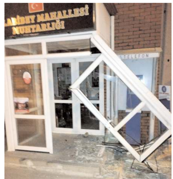
Aracın çarptığı muhtarlık binasında maddi hasar meydana geldi.