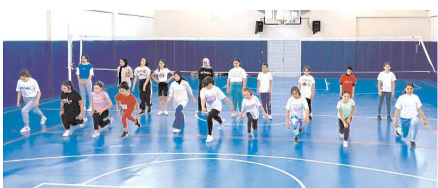
İlçe Spor Salonları ve okul salonlarında da bir çok branşta çalışma yapıldı

Birer antrenörün görev yaptığı Oryantiring branşında 49 Bocce'de 47, Dart'ta 44, Muay Thai'de 37, Bilek Güreşinde 35 ve Çim Hokeyinde ise 24 sporcu mücadele etti. Halter branşında iki antrenör 24 sporcu Bilardo'da ise bir antrenör ve 23 sporcu İl Spor Merkezleri çalışmalarına katıldı.