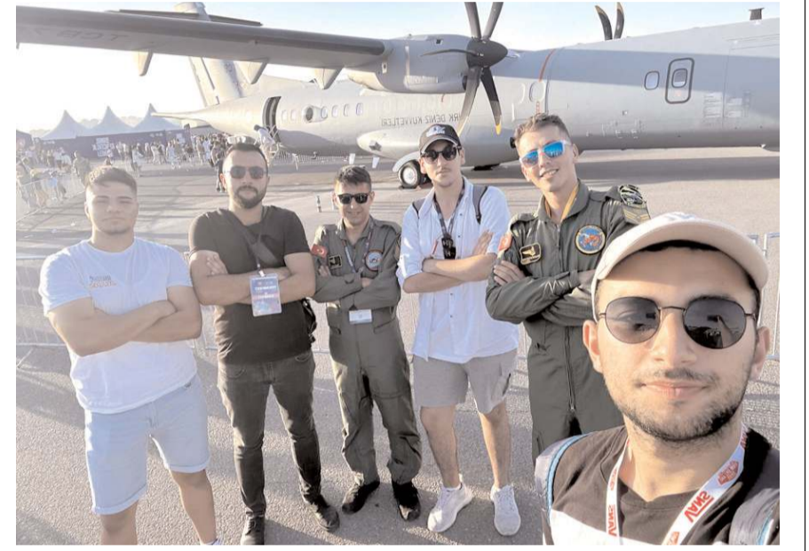
TEKNOFEST'e giden gençler teknolojiye gelinen son noktayı görme fırsatı buluyorlar.