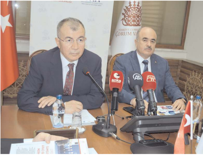
Toplantı Amasya Valisi Yılmaz Doruk başkanlığında gerçekleştirildi.

Encümen toplantısının ardından YHKB Meclis toplantısı gerçekleştirildi. Toplantıda 2024 yılı Birlik Çalışma Programı, 2024 yılı Birlik Bütçesi ve 2024 yılı Birlik Üye Katılım Payları görüşülerek karara bağlandı.