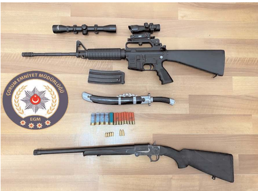
Aramalarda 2 adet ruhsatsız av tüfeği ele geçirildi.

Geçtiğimiz günlerde bir düğünde araçtan havaya ateş edilmesi ihbarını değerlendiren polis şüpheliyi yakaladı.