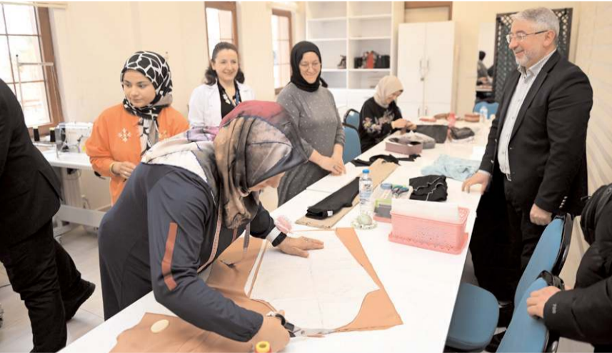
Çorum Belediyesi'nin 8 adet Kadın Kültür ve Sanat Merkezi bulunuyor.