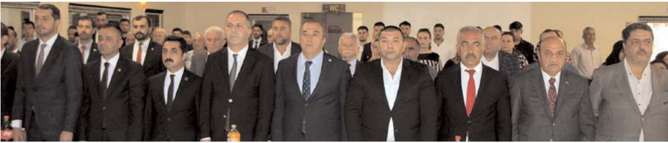
MHP'nin Sungurlu İlçe Kongresi'ne katılım yüksek oldu.