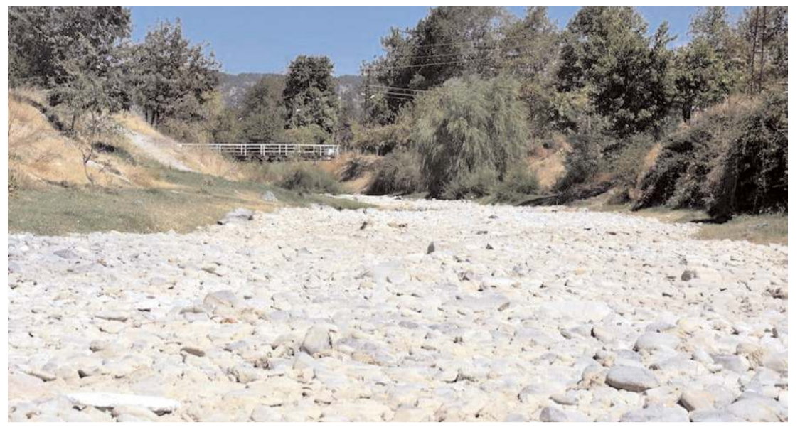
Kolaz Çayı, hava sıcaklıkları ve kuraklık sebebiyle kurudu.