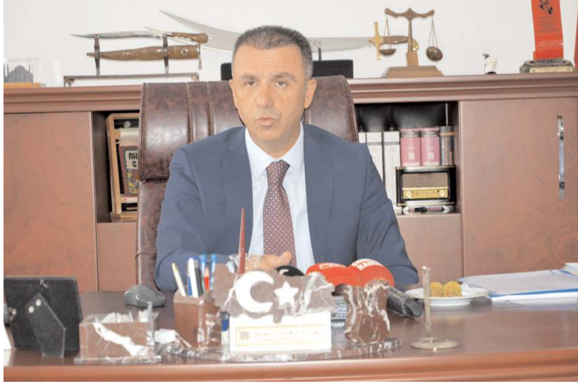
Çorum Cumhuriyet Başsavcısı Ahmet Bektaş