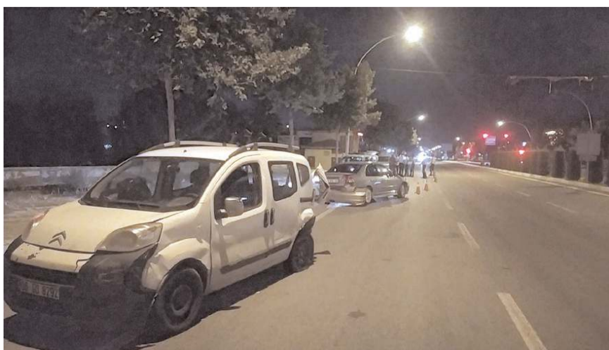
Kazada her iki araçta da maddi hasar meydana geldi.

Kaza ile ilgili başlatılan soruşturma sürüyor. (İHA)