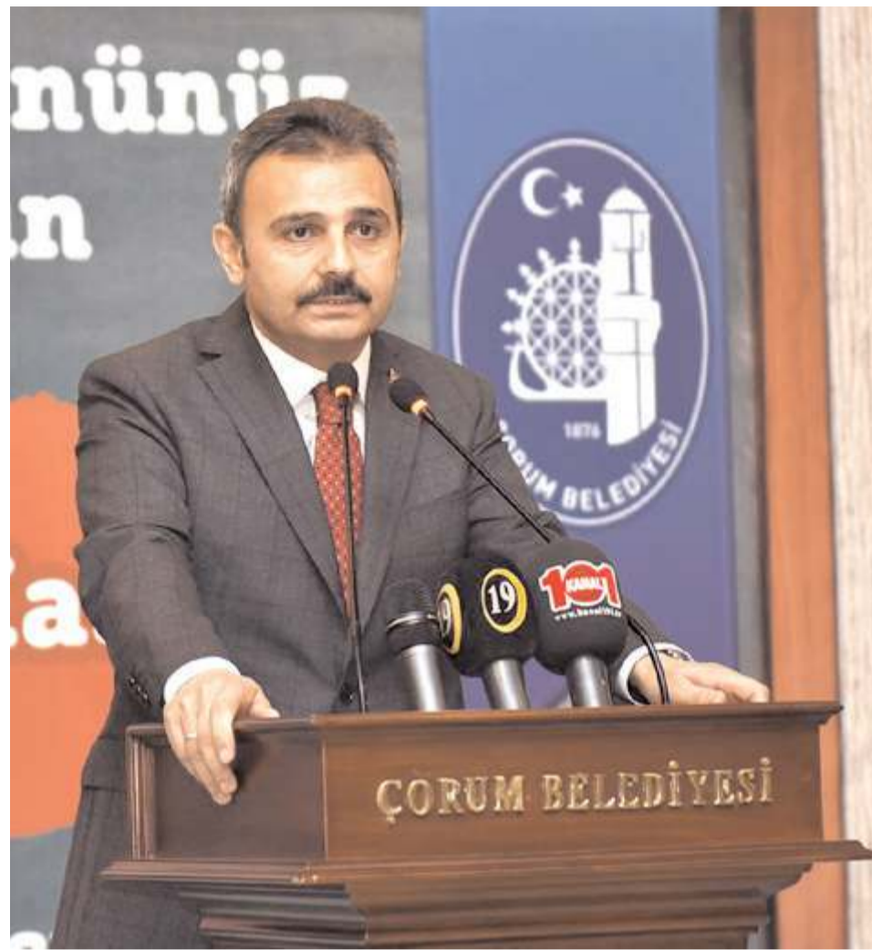
Önceki dönem Çorum Belediye Başkanı Avukat Muzaffer Külcü'nün, yaptığı paylaşım büyük ilgi gördü.

Takipçilerini heyecanlandıran Külcü'nün paylaşımına çok sayıda "yanındayız ve destekliyoruz" şeklinde mesaj geldi.