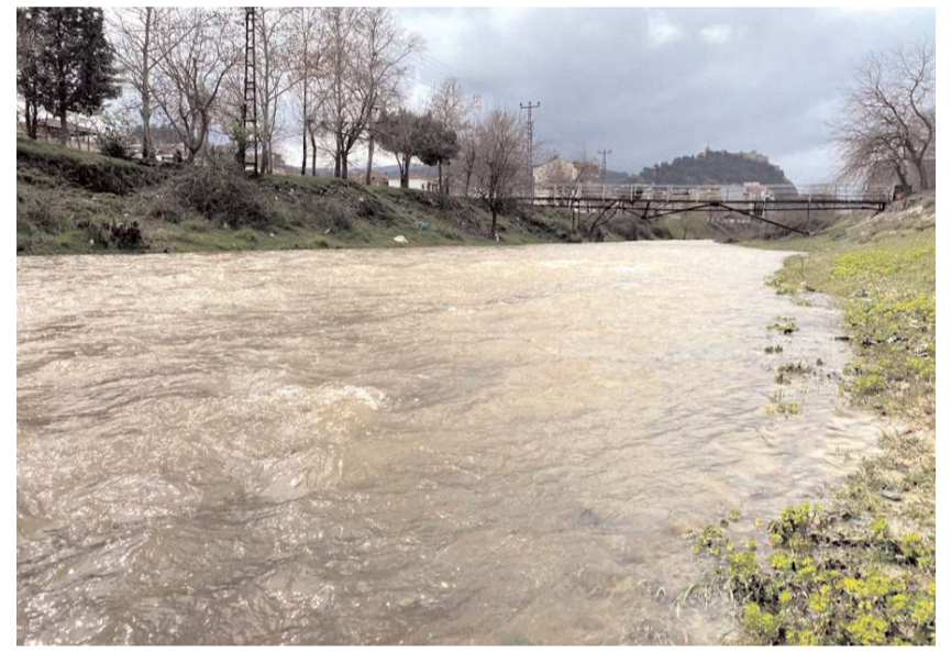
Kolaz Çayı, 4 ay önce debisi yüksek şekilde akıyordu.

Mayıs ayında su seviyesindeki artış sel uyarılarına sebep olan ve su seviyesi yükselen çayda 4 ayda hiç su kalmaması endişe oluşturdu.