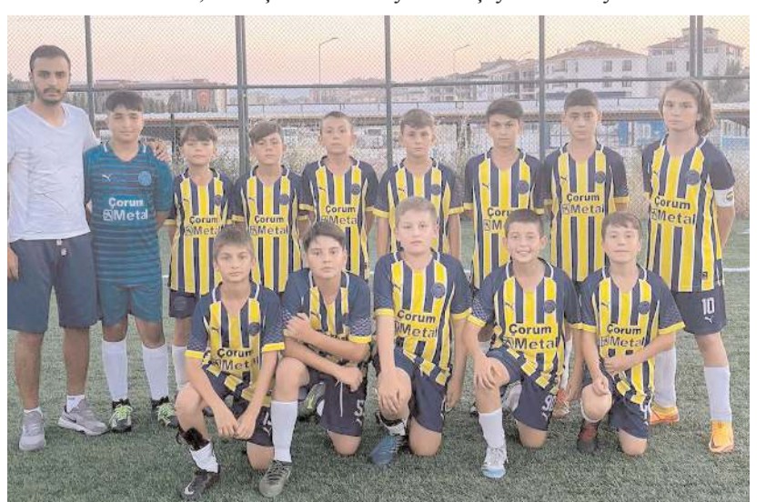
1907spor takımı ikinci tur maçını kazanarak ismini çeyrek finale yazdırmayı başardı