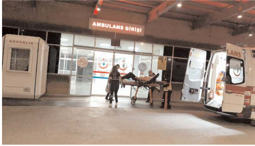
Yaralı şahıs hastanede tedavi altına alındı.