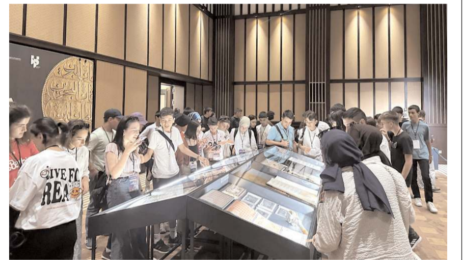
Geziler kapsamında gençler Ankara'da Millet Kütüphanesi ve 15 Temmuz müzesini de ziyaret ediyor.