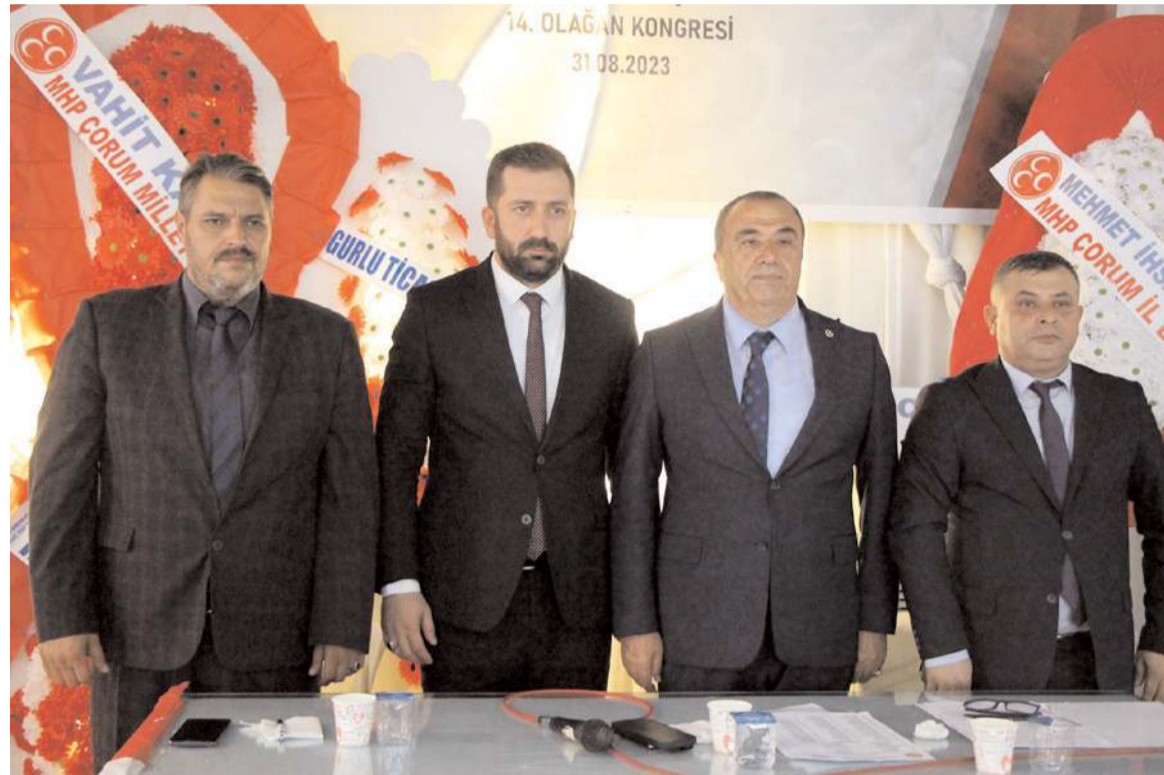
Kongrede ilk olarak divan heyeti seçildi.