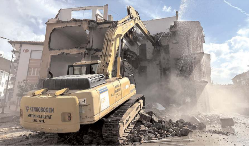
Binaların yıkım çalışmaları devam ediyor.