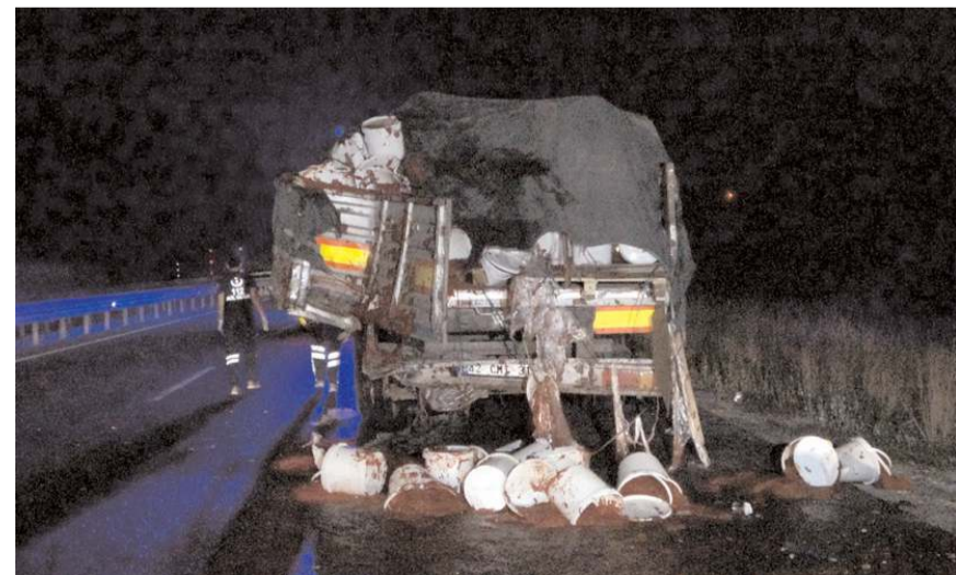
Kazada her iki araçta da maddi hasar meydana geldi.

Olaya jandarmamız, trafik polisimiz, kara yolları, 112 çok acil bir şekilde müdahale etti. Yaralı vatandaşlarımızı da Uşak Eğitim ve Araştırma Hastanesi'ne ve Banaz, Afyonkarahisar, Dumlupınar'daki hastanelere sevk ettik. Bizi şu anda sevindiren dediğimiz gibi herhangi bir can kaybının olmaması. İnşallah ağır yaralı olan arkadaşımız da bir an önce sağlığına kavuşur, şifasını bulur. Bunun dışında olayla ilgili adli soruşturma başlatıldı. Olayın sebebi ve sonuçları soruşturma sonucunda ortaya çıkar" dedi.