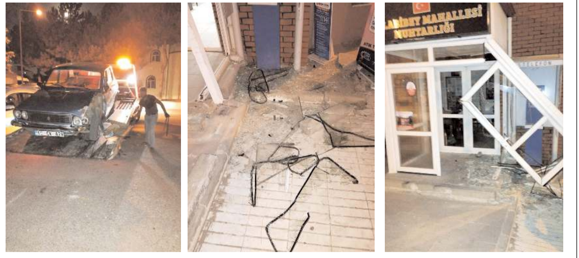
Aracın çarptığı muhtarlık binasında maddi hasar meydana geldi.

Polis ekipleri olaya karışan G.G.'nin yakalanması için çalışma başlattı. (İHA)