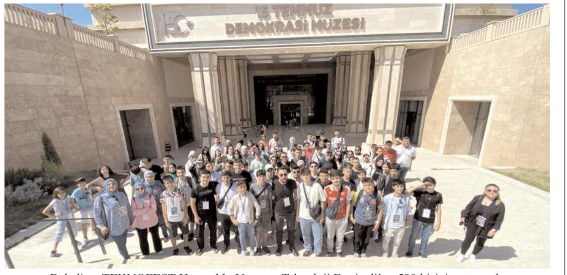
Belediye, TEKNOFEST Havacılık, Uzay ve Teknoloji Festivali'ne 500 kişiyi götürecektir.

Şehirde ulaşımı kolaylaştırmak, trafik sorununa çözüm bulmak için bir yandan yeni yollar açarken diğer yandan mevcut yolları genişletmeye devam ettiklerini söyleyen Başkan Aşgın "Şehir içi ulaşımını rahatlatılacak yeni yollar açıyor, şehrin nefes alacağı yeni alanlar oluşturmak için kamulaştırma çalışmalarımız devam ediyoruz. Bölgede başlattığımız yıkım çalışmalarının ardından yol genişletme çalışmalarımızı da en kısa sürede tamamlayacağız" ifadelerini kullandı. (Haber Merkezi)