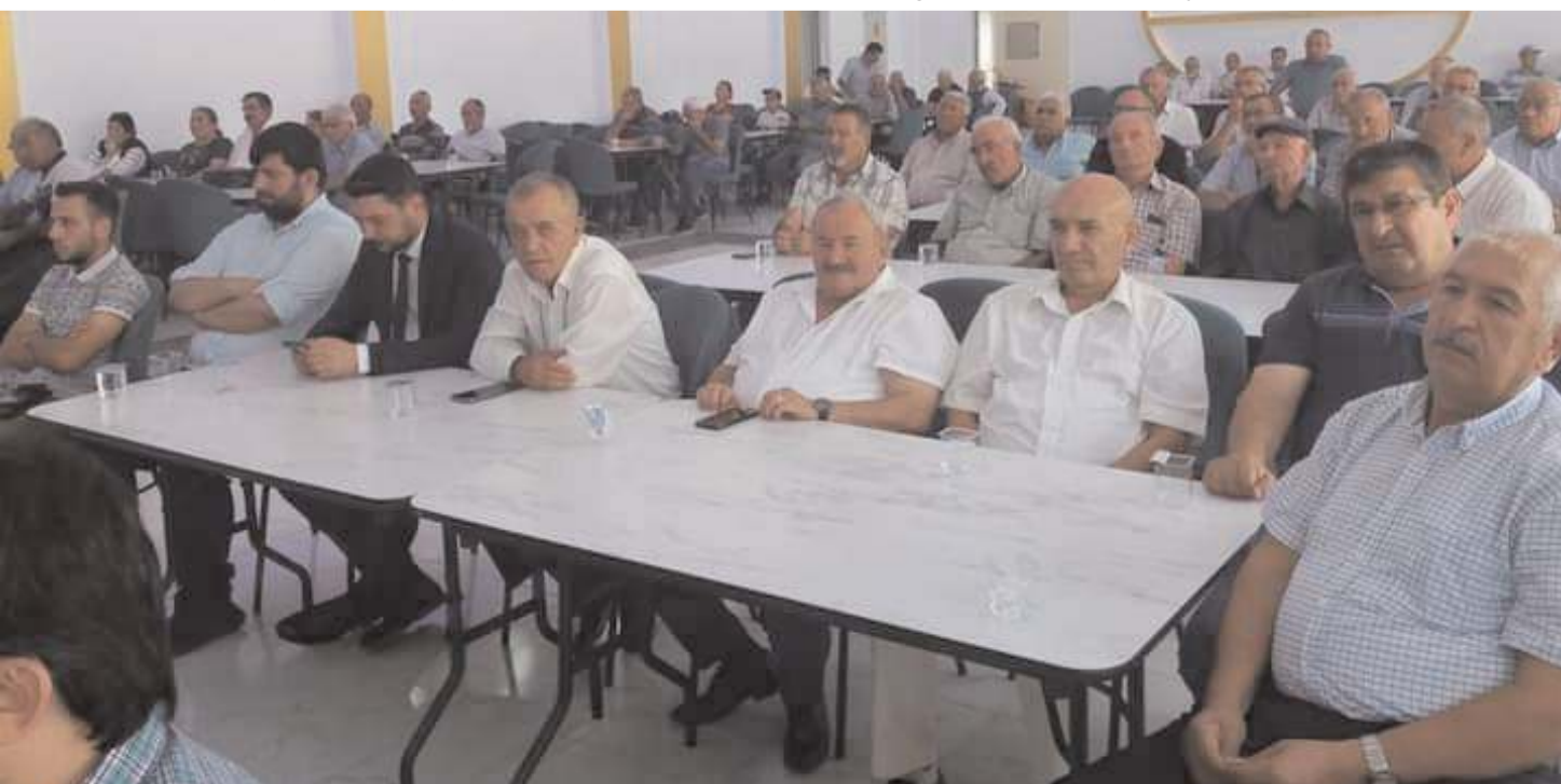
Kongreye katılım yüksek oldu.