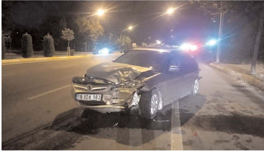
Kaza, İnönü Caddesi'nde meydana geldi.

Çorum'da bir otomobilin hafif ticari araca arkadan çarpması sonucu meydana gelen kazada 1 kişi yaralandı.