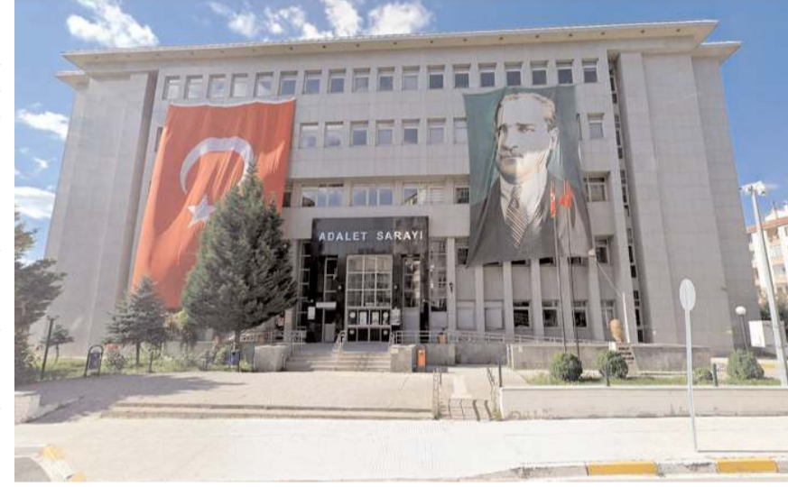
Ek bina Adliyenin yanına yapılacak.