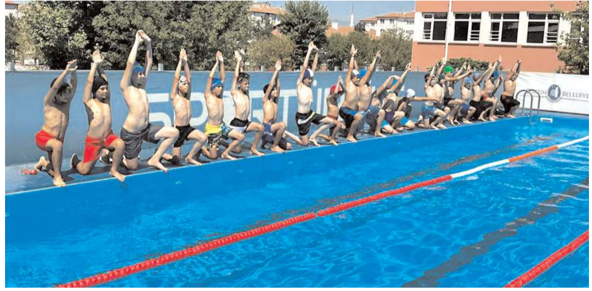
Yüzme branşında dört mahallede kurulan portatif havuzlarda çok sayıda çocuk yüzme eğitimi aldı