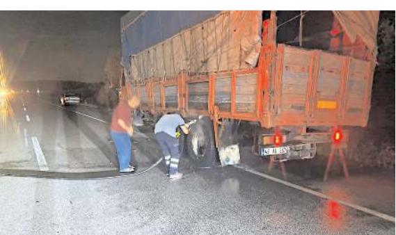
İtfaiye ekipleri yangını büyümeden söndürdü.

Alaca'da seyir haline olan kamyonun lastikleri alev aldı. Yangın itfaiye ekiplerinin müdahalesiyle büyümeden söndürüldü.