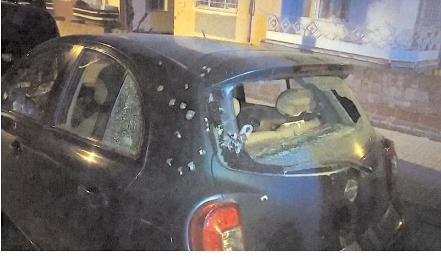
Olay, Gülabibey Mahallesi'nde meydana geldi.