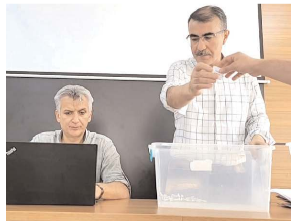
Kura noter huzurunda çekildi.