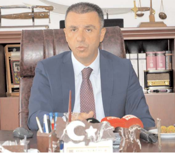
Çorum Cumhuriyet Başsavcısı Ahmet Bektaş

Yeni Adli Yıl açılışı dolayısıyla bir mesaj yayımlayan Çorum Cumhuriyet Başsavcısı Ahmet Bektaş, "Çorum Adliyesi olarak, tüm birimlerimiz vatandaşlarımızın adaleti sağlamak adına, tüm iş yoğunluğuna rağmen geç gelen adalet, adalet değildir şiarı ile mesai mefhumu gözetmeden çalışıyor, çalışmaya devam edeceğiz." dedi.