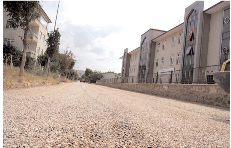
Belediye yıl sonuna kadar 250 ton asfalt sermeyi planlıyor.