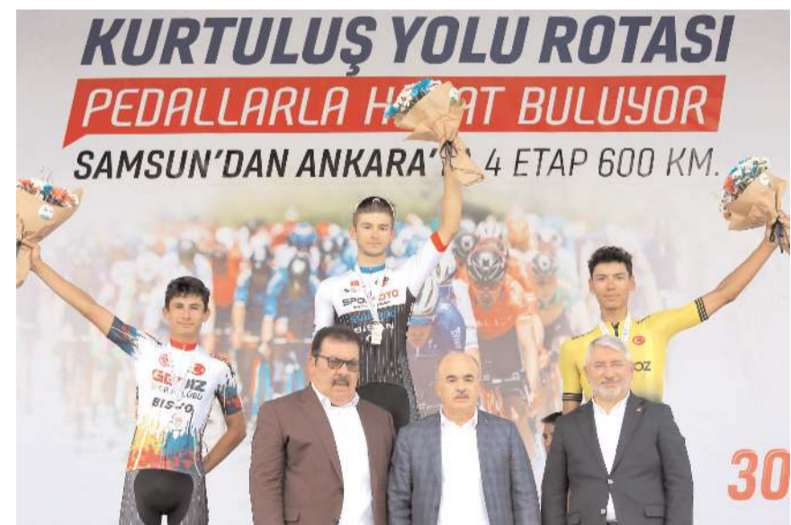
Amasya Çorum etabında ilk üç sırayı alan sporcular ödül töreninde kürsüde