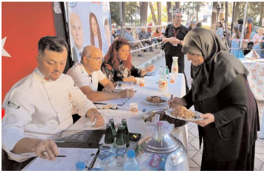
Yöresel yemek ve çilek yarışmasına vatandaşlar yoğun ilgi gösterdi.