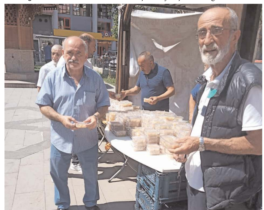
Mevlidin ardından vatandaşlara helva ikram edildi.