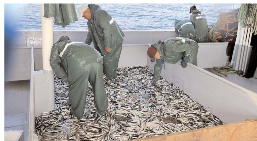
Akdeniz ise yasak 16 Eylül'de kalkıyor.