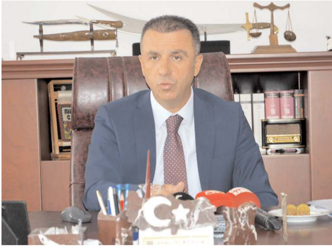
Çorum Cumhuriyet Başsavcısı Ahmet Bektaş

■ Yeni Adli Yıl açılışı dolayısıyla bir mesaj yayınlayan Çorum Cumhuriyet Başsavcısı Ahmet Bektaş, "Çorum Adliyesi olarak, tüm birimlerimiz vatandaşlarımız nezdinde adaleti sağlamak adına, tüm iş yoğunluğuna rağmen 'geç gelen adalet, adalet değildir' şiarı ile mesai mefhumu gözetmeden çalışıyor, çalışmaya devam edeceğiz" dedi.