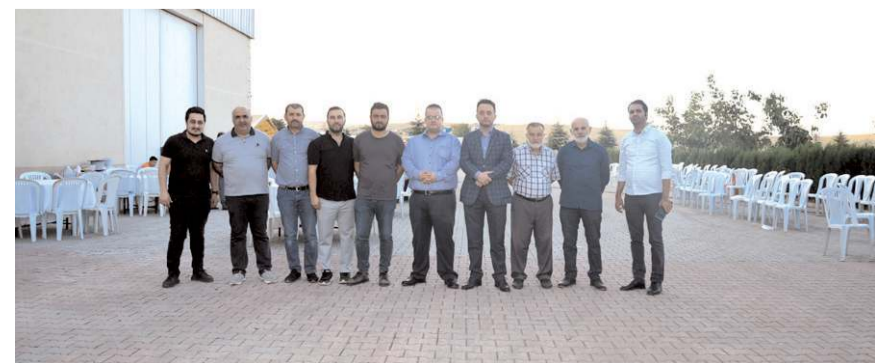
Mevlide çok sayıda davetli katıldı.