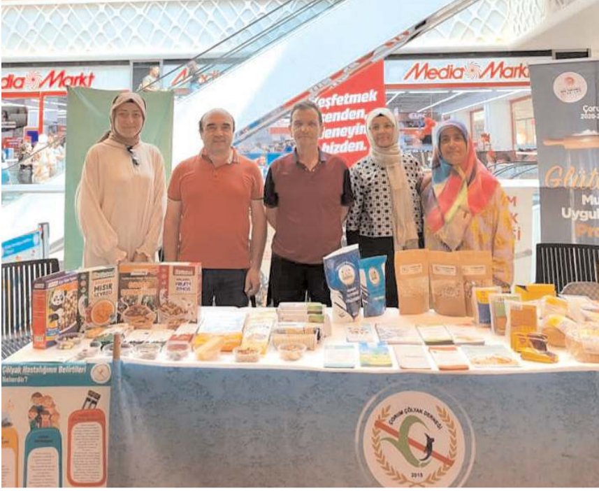
Stand AHL Park AVM'de açıldı.

Çorum Çölyak Derneği tarafından düzenlenen Çölyak Hastalığına Dikkat çekip farkındalık oluşturmak amacıyla AHL Park AVM'de açılan stand büyük ilgi gördü. Standta Çorum Çölyak Derneği üyeleri