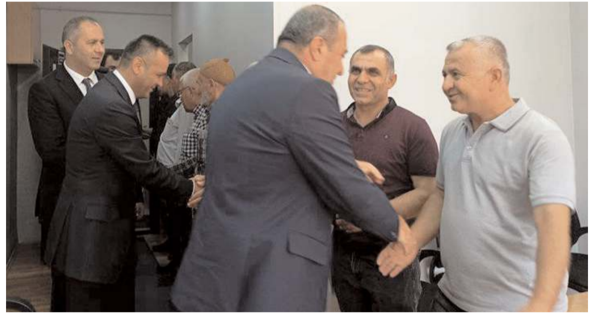
MHP heyeti şehit aileleri ile gazilerin talep ve sorunlarını dinledi.