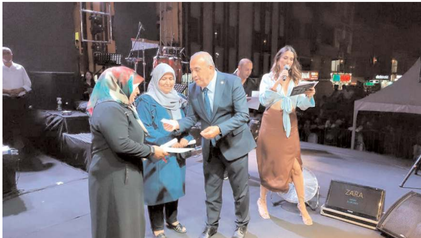
Dereceye girenlere ödülleri verildi.

İskilip'te düzenlenen 4. Dolma, Turşu ve Çilek Festivali çerçevesinde düzenlenen yöresel yemek ve çilek yarışmasına vatandaşlar yoğun ilgi gösterdi.