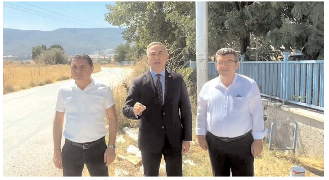
Milletvekili Mehmet Tahtasız, açıklama yaptı.

Bir de bir türlü tamamlanamayan Bedesten inşaatımız var. Kayıtlara göre 1500'lü yıllarda Çorum da bir bedesten varmış. Ama varlığını günümüze kadar sürdürmemiş. Kale, Ulu Camii, Saat kulesi, Sandıkçılar arastası sonundaki kilise olduğu söylenen taş bina, Taşhan bir şekilde varlığını sürdürmüş ve günümüze gelmiş. Lakin bedesten yok olmuş. Eksikimiz bedesten olunca, belediyemiz kolları sıvayıp, şehrin eksikliği olan bedesteni şehrimize kazandırmak için seferber olmuş. Ne yazık ki; tarihi yeniden ihya etmek için işe başlayan belediye bir türlü bedesteni tamamlamadı. Oysa komşu kent Kastamonu da Nasrullah Camii çevresinde var olan Osmanlı dönemi eseri Aşir Efendi Hanı ve diğer eski yapılar hala ayakta ve varlığını sürdürüyorlar. Beton yerine taştan yapılmışlar ve kültürel özelliklerini koruyarak halen vatandaşlar tarafından ticari mekân olarak kullanılıyor. Her ne kadar proje olarak gördüğümüz bedestenler ile benzerlikleri olmasa da, bedesten inşaatının bitirilmesini ve geciktirilmeden halkımızın kullanımına açılmasını seçim öncesi Çorum halkı sabırsızlıkla beklemektedir."