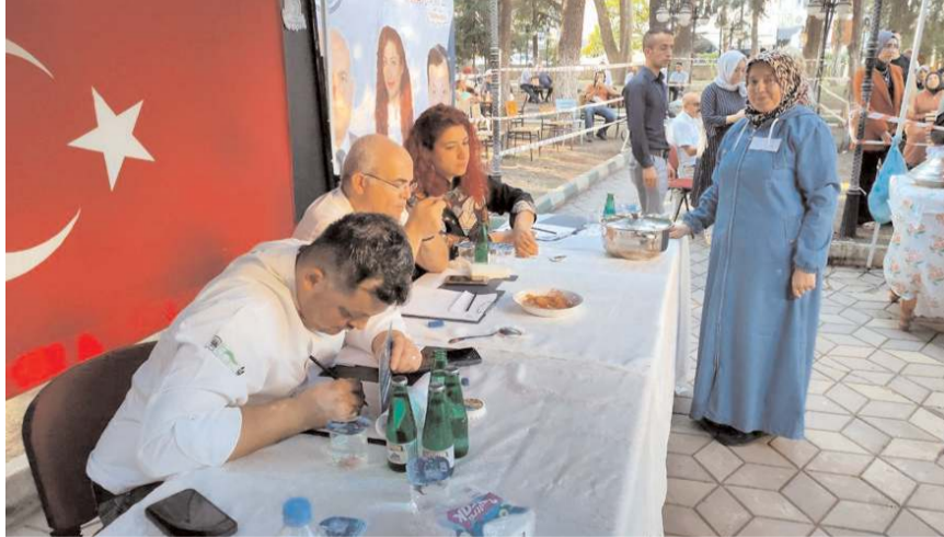
Jüri üyeleri yemekleri değerlendirdi.