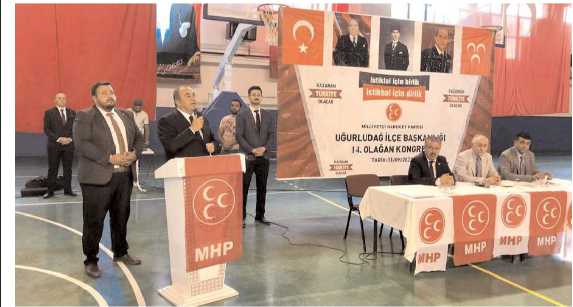
MHP Çorum Milletvekili Vahit Kayrıcı, kongrede bir konuşma yaptı.