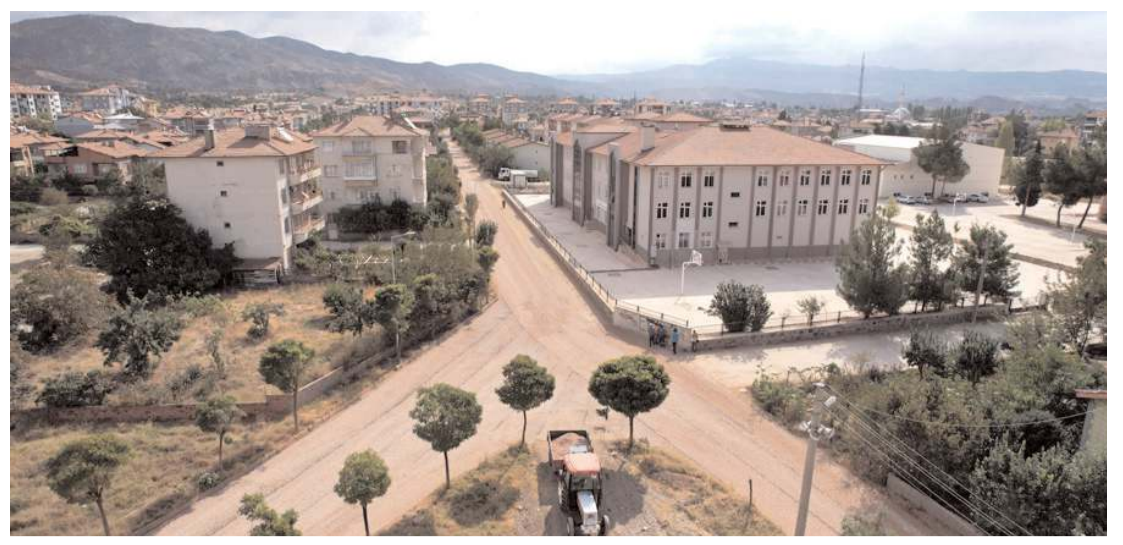
İlçede altyapı çalışmaları nedeniyle bozulan yollar tekrar asfaltlandı.