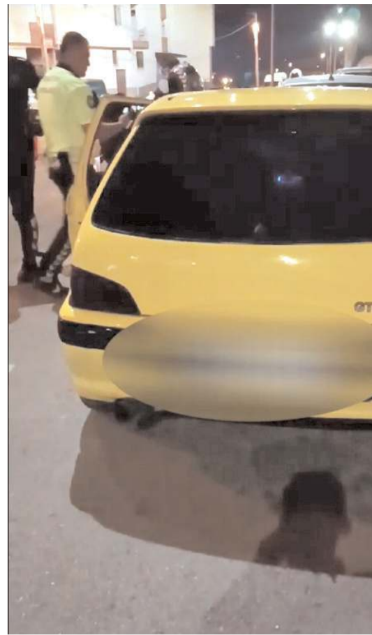
Emniyet modifiye edilmiş, muayenesi geçmiş, kural tanımayan araçlara yönelik denetimlerini sıklaştırdı.