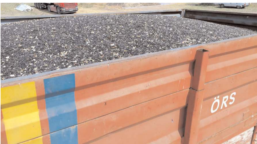
KARADENİZBİRLİK, İskilip'te 9 yılın ardından yeniden yağlık ayçiçeği alımına başladı.