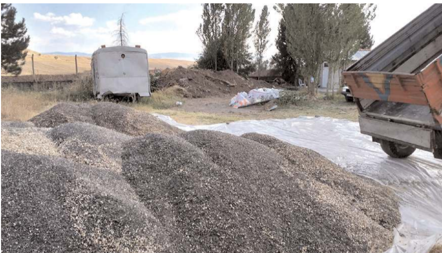
İskilip'te 13 bin dönüm alanda ayçiçeği ekimi yapıldı.