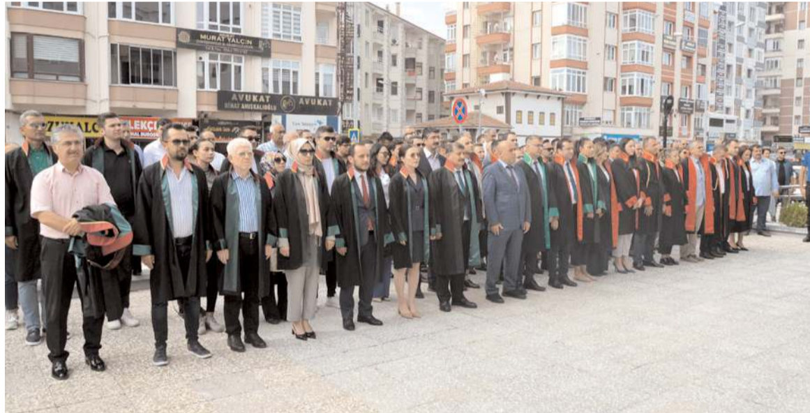
Törene avukatlar, hakim ve savcılar ile adliye personeli katıldı.