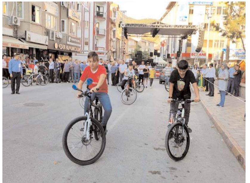
En yavaş bisiklet sürme yarış büyük ilgi gördü.