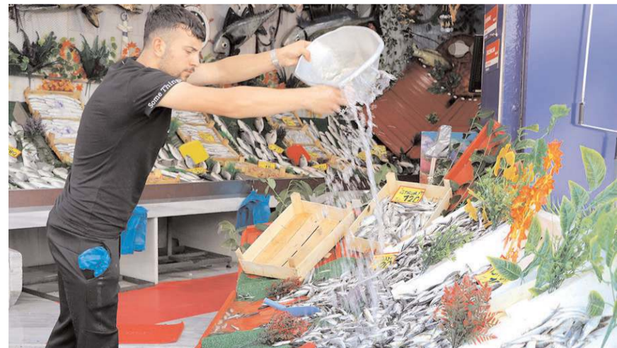
Denizlerde 15 Nisan'da başlayan av yasağı 1 Eylül itibarıyla sona erdi.

ğumasıyla diğer balıklarında çoğalacağını söyledi. Hamsinin kasası ise 2 bin 500 liradan alıcı buldu.