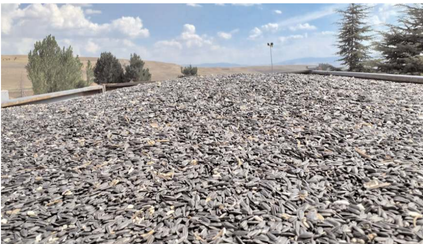
Mevsimin kurak geçmesi nedeniyle bu yıl verim kaybı bekleniyor.