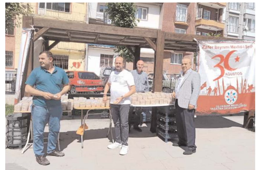
Programı Ulukavak Mahallesi Yardımlaşma Dayanışma Derneği düzenledi.

Kılıç, "Şehitlerimizi her daim yad ediyoruz. Tüm şehitlerimizin ruhları şad, mekanları cennet olsun. Ülkemizin bugünlere gelmesini sağlayan gazilerimizi de unutuyoruz. Vefat eden gazilerimize Allah'tan rahmet, hayatta olanlara ise uzun ömürler diliyoruz" dedi. (Haber Merkezi)