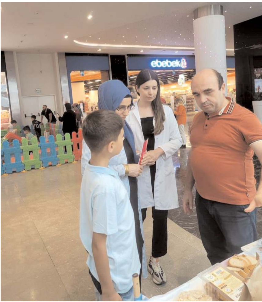
Standta vatandaşlara çölyak ve glutensiz ürünler hakkında bilgi verildi.

vatandaşlara afiş ve broşürler vererek çölyak hakkında bilgilendirdiler.