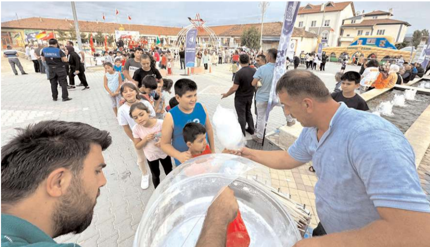
Şenlikte çeşitli ikramlarda bulunuldu.