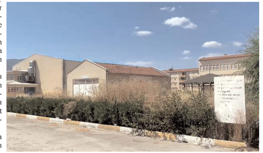
Acemi Birliği yapılacağı söylenen atıl durumdaki okul binası.

birliği sözü verdiğini hatırlatan CHP Çorum Milletvekili Tahtasız, "Ve Yozgat'a bunların hepsi yapıldı. Çorum neden anasının ak sütü gibi helal olan projeleri, devlet yatırımlarını alamıyor? Bu yoksa AK Parti milletvekillerinin, belediye başkanının AK Parti İl başkanının yani AK Parti'nin beceriksizliği mi? Çorum'da iktidar partisinin milletvekilleri ve belediye başkanlarına sesleniyorum. Eğer Çorum yatırım alamadıysa sizin yüzünüzden alamadı. Çorum'un dört milletvekili var. Meclis'te hepsini ziyaret ettim. Çorum için birlikte çalışalım dedim. Sizden rica ediyorum. Çorum'u üvey evlat olmaktan kurtaralım. Çorum'un hak ettiği yatırımları alması için birlikte çalışalım. Birlikten güç doğar. Güç zehirlenmezlene kapılmayın. Çorum'u yalan rüzgarlarımızla oyalamayın. Bundan sonra her hafta önceki yıllarda vermiş olduğunuz bütün sözleri sizlere tekrar tekrar hatırlatacağım" diye konuştu. (Haber Merkezi)