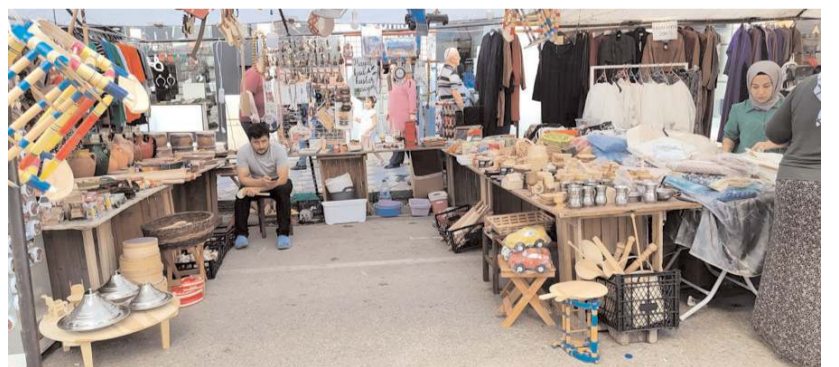
Festival kapsamında stantlar açıldı.