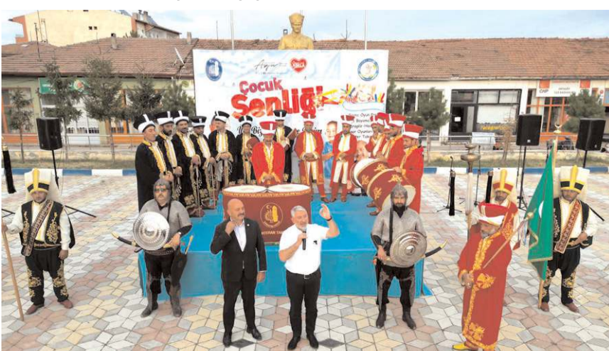
Şenlikte Belediye Mehteran Takımı konser verdi.

Çorum Belediyesi, Ortaköy Belediyesi'nin katkılarıyla ilçede çocuk şenliği düzenlendi.