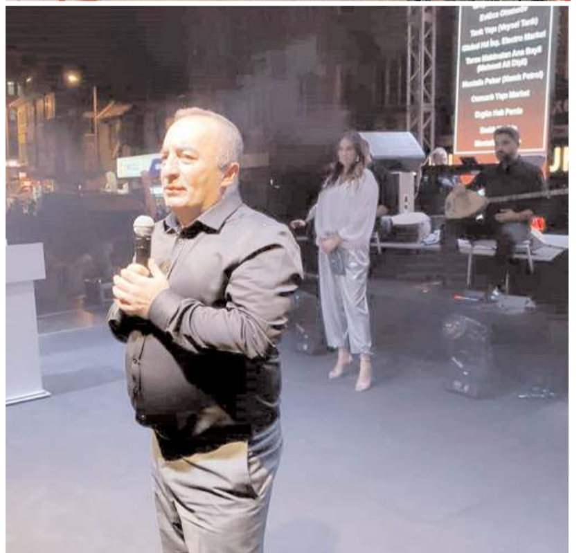
Belediye Başkanı Ali Sülük, konser öncesinde konuşma yaptı.