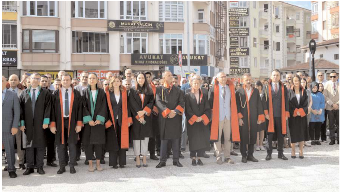
Yeni Adli Yıl'ın başlaması nedeniyle Adliye önünde tören yapıldı.