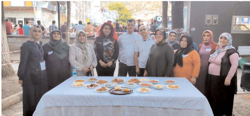
Yarışmada, İskilip dolması, yırtma aşısı, su kabağı, gül baklavası ve turşu gibi yöresel yemekler yarıştı.