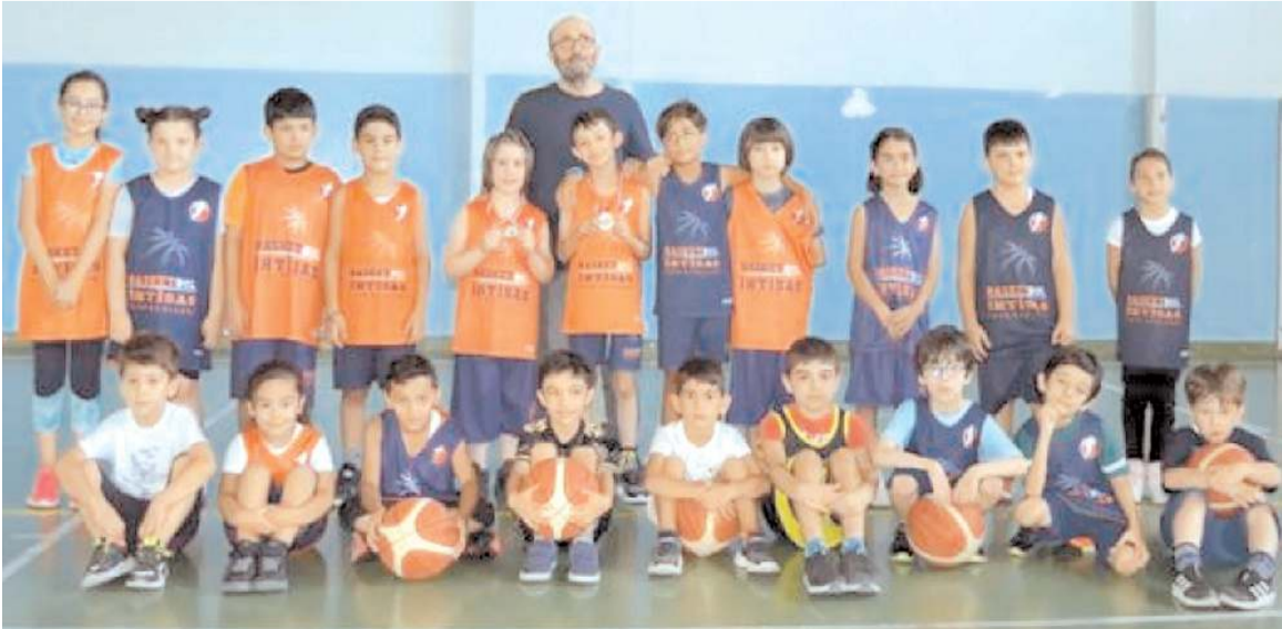
Basketbol Akademi takımı sporcuları spor çalışmasının yanı sıra sosyal aktivitelerde de yarışıyorlar