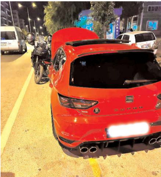
Emniyet modifiye edilmiş, muayenesi geçmiş, kural tanımayan araçlara yönelik denetimlerini sıklaştırdı.