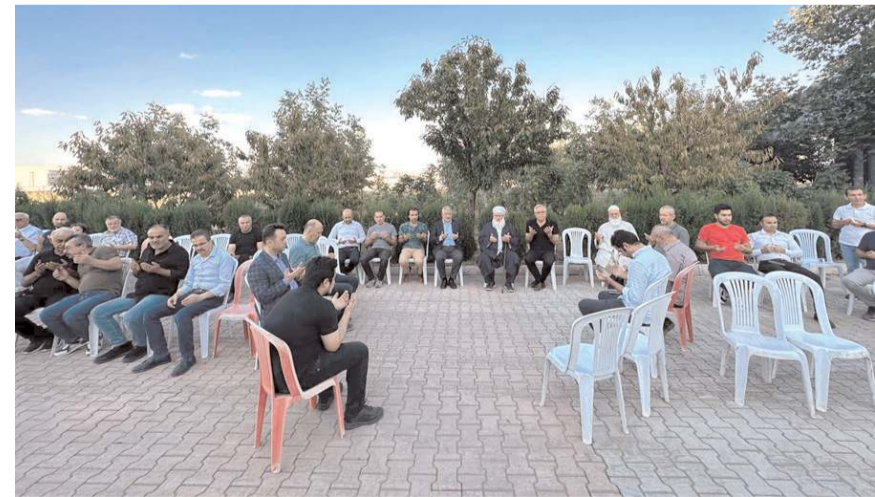
Mevlid programı Ser Döküm A.Ş. bahçesinde yapıldı.