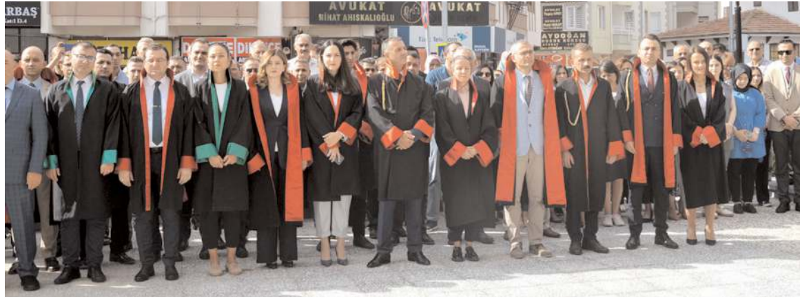
Yeni Adli Yıl'ın başlaması nedeniyle Adliye önünde tören yapıldı.

şen sorumluluğu canları pahasına yerine getirmiş, bundan sonra da yerine getirmeye devam edecektir. Çorum Adliyesi olarak, tüm birimlerimiz vatandaşlarımızın adaleti sağlamak adına, tüm iş yoğunluğuna rağmen geç gelen adalet, adalet değildir şiarı ile mesai mefhumu gözetmeden çalışıyor, çalışmaya devam edeceğiz. Mevcut Adalet sarayımızda, vatandaşlarımızın daha hızlı hizmet alması, çalışanlarımızın daha makbul koşullarda hizmet sunması için bir çok birimi elden geçirerek, daha fazla mahkeme kurulması, hakim, cumhuriyet savcısı ataması, personel istihdamı için fiziki koşullar oluşturulmuş ve oluşturulmaya devam edecektir. Birileri kendi karanlık dünyalarında gerçekleri at gözlükleri ile görmeye çalışsa da, Çorum Adalet Sarayı ve bağlı birimlerimizi devletimize, Çorumumuza ve Adalet camiasına yakışır hale getiriyor ve getirmeye devam edeceğiz. Bu vesile ile bu vatan uğruna canını veren aziz şehitlerimizi şükran ve minnetle anıyor, 2023-2024 Adli Yılımı ülkemize, milletimize, insanlığa ve dünyaya barış, sağlık, huzur getirmesini diliyorum." ifadelerini kullandı.