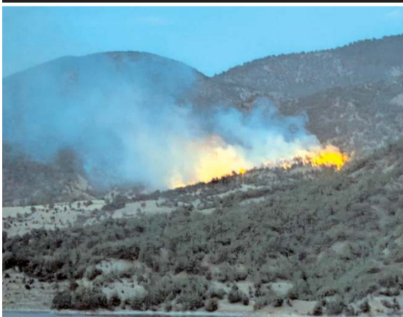
Sarp kayalıklardan oluşan bölgeye güçlükle ulaşan itfaiye ekipleri yangına müdahale etti.

Laçın'de ormanlık alanda çıkan yangın kontrol altına alındı.