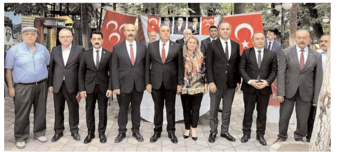
MHP İskilip İlçe Kongresi önceki gün Alparslan Türkeş Parkı'nda gerçekleştirildi.