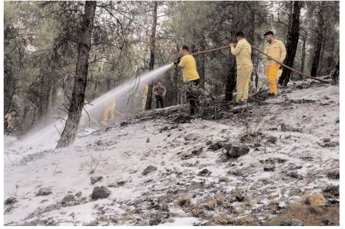
Kargı'da Karakise köyü yakınlarında ormanlık alanda örtü yangını çıktı.

Son 9 yıldır dünyanın un ihracat şampiyonu olan Türkiye, ihracattaki başarısıyla 1896 yılında ABD'de kurulan, ABD'de 10 bölgede, dünyada ise 4 kıtada direktörlüğü bulunan IAOM'un Avrasya Bölge Başkanlığı'nı 4 yıldır sürdürüyor. Toplam nüfusları 2 milyarı aşan ve toplam 7,1 trilyon dolar ekonomik büyüklüğü bulunan, 32 ülkeden oluşan dünya buğday üretiminin yüzde 30'unu ve dünya un ihracatının yüzde 59'unu temsil eden Avrasya Bölge Başkanlığı, dünyanın en büyük buğday üreticilerini ve un ihracatçıları temsil ediyor. IAOM Avrasya'da yer alan ülkelerden Rusya, 87 milyon tonluk buğday üretimiyle dünyanın ilk 5 buğday üreticisinden biri olarak tek başına dünya buğdayının yüzde 10'unu ve Avrasya bölgesinin buğday üretiminin yüzde 30'unu temsil ediyor. Bu 32 ülke arasında 25 milyon tonla Ukrayna, 16 milyon tonla Kazakistan ve 19 milyon ton buğday üretimiyle Türkiye de yer alıyor. (AA)