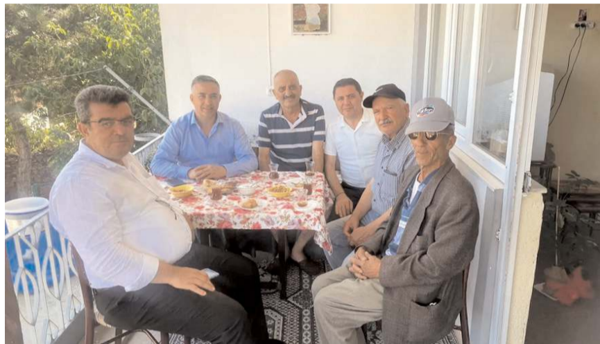
Halk buluşmalarının ilki, bugün saat 13.00-17.00 arasında yapılacak.