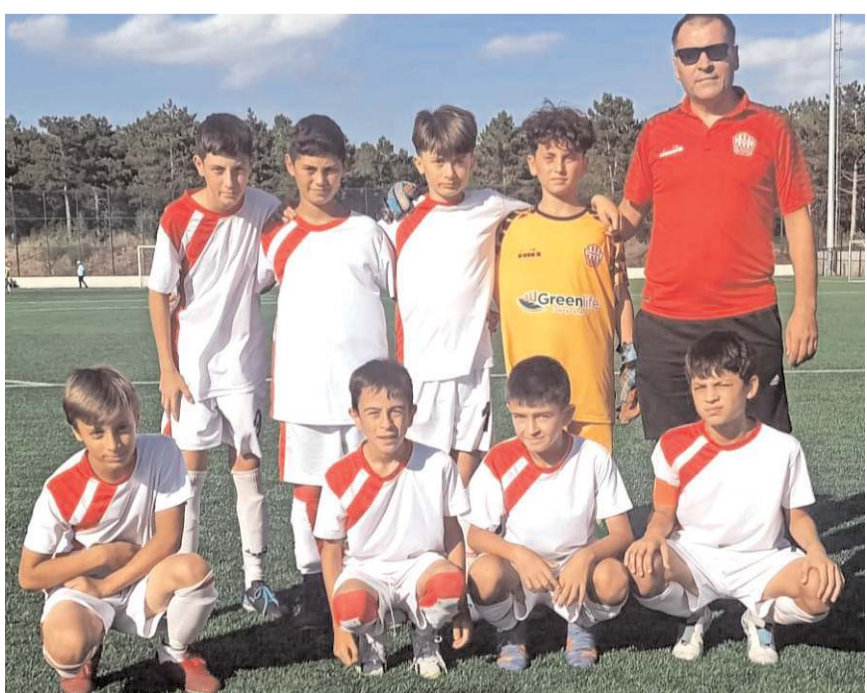
Osmaniye Belediyesi bugün Vefaspor önünde finale yükselmek için mücadele edecek

Bugün oynanacak maçları kazanan takımlar finale yükselirken kaybedenler ise üçüncülük dördüncülük maçında karşılaşacaklar. Turnuvanın final maçı 7 Eylül perşembe günü saat 16.30'da oynanacak.