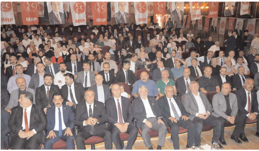
MHP Merkez İlçe Kongresi Devlet Tiyatro Salonu'nda gerçekleştirildi.