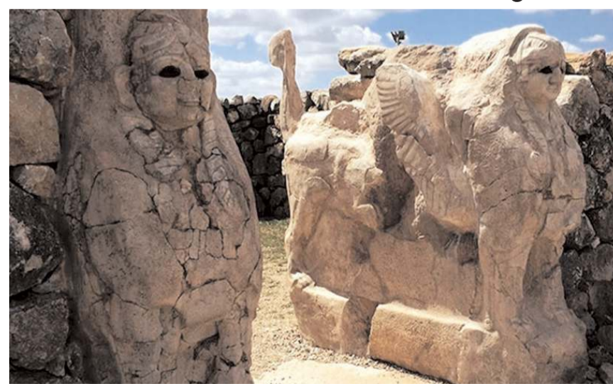
Hititoloji Kongresi'nin 12'ncisi İstanbul Üniversitesi'nin ev sahipliğinde düzenlenecek.