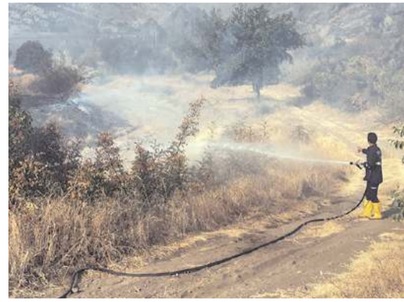
Osmancık Belediyesi itfaiye ekipleri, vatandaşların desteğiyle yangını söndürdü.