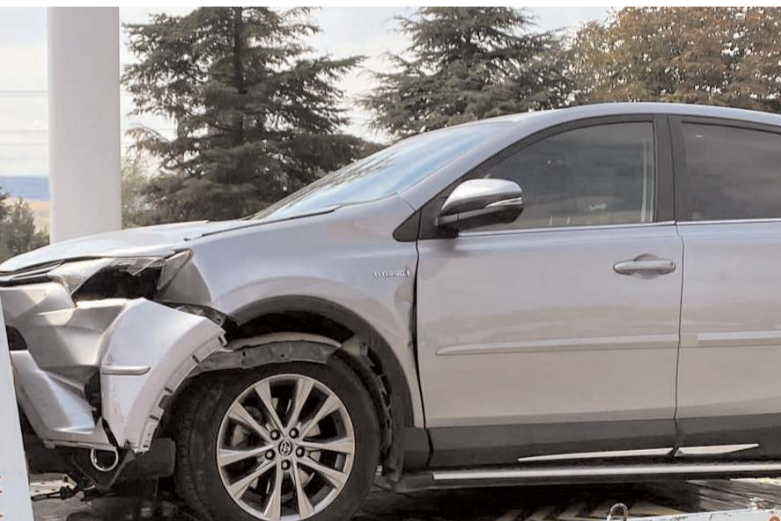
A.K. yönetimindeki otomobil Yaşar Efe Atalay yönetimindeki motosiklele çarpıştı.