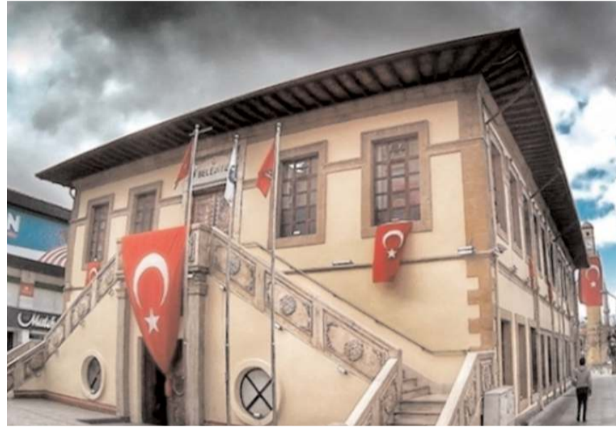
Tarihi taş bina, 7/24 açık kütüphaneye dönüşüyor.

Taş binanın müze olması için zemin kata mobilya alımı yapacak olan Çorum Belediyesi ihale ilanına çıktı. Taş bina zemin kat kütüphane mobilya alımı 4734 sayılı Kamu İhale Kanununun 19 uncu maddesine göre açık ihale usulü ile 15 Eylül Cuma günü saat 10:00'da yeni belediye binasında yapılacak.