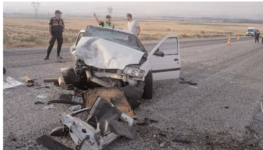
Kaza, Bayat-Ankara kara yolu Bayat Su Deposu mevkinde meydana geldi.