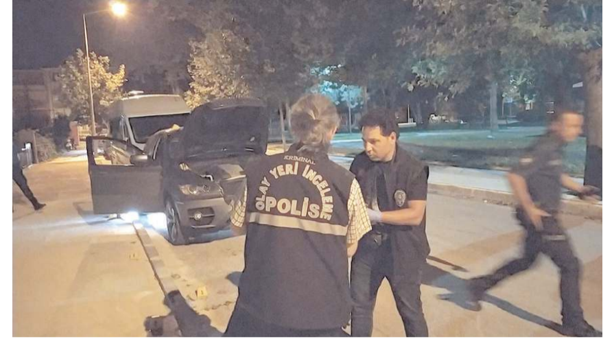
Polis ekipleri olay yerinde incelemelerde bulundu.