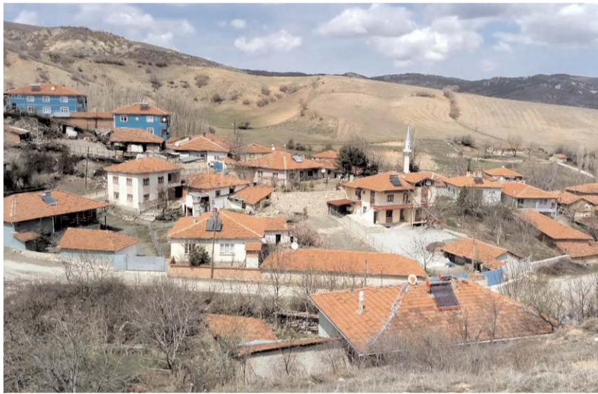
Muratolu köyü, doğal yapısı ve zengin tarım alanlarıyla öne çıkıyor.

rindeki arazinin satış ihalesi 2886 Sayılı Yasanın 45.maddesi uyarınca Açık Teklif Usulü ile 29 Eylül'de İskilip Kaymakamlığı İlçe Milli Emlak Şefliğinde satış ihalesi yapılacak.