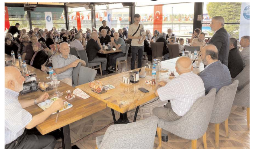
Kahvaltıda, Karakeçili, Üçtutlar ve Akkent Mahallesi sakinleri ağırlandı.