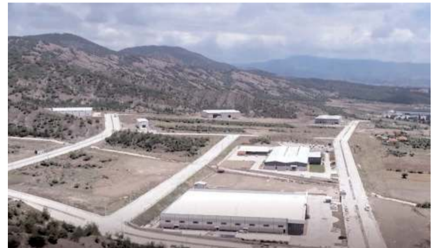
Osmancık OSB'de de 16 firmaya yapı ruhsatı verilirken, 10 fabrikanın inşaatı sürüyor.