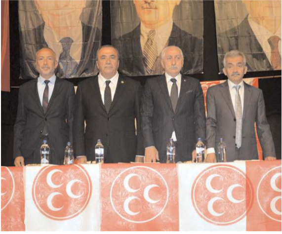
Kongrenin divan kurulu üyeleri...