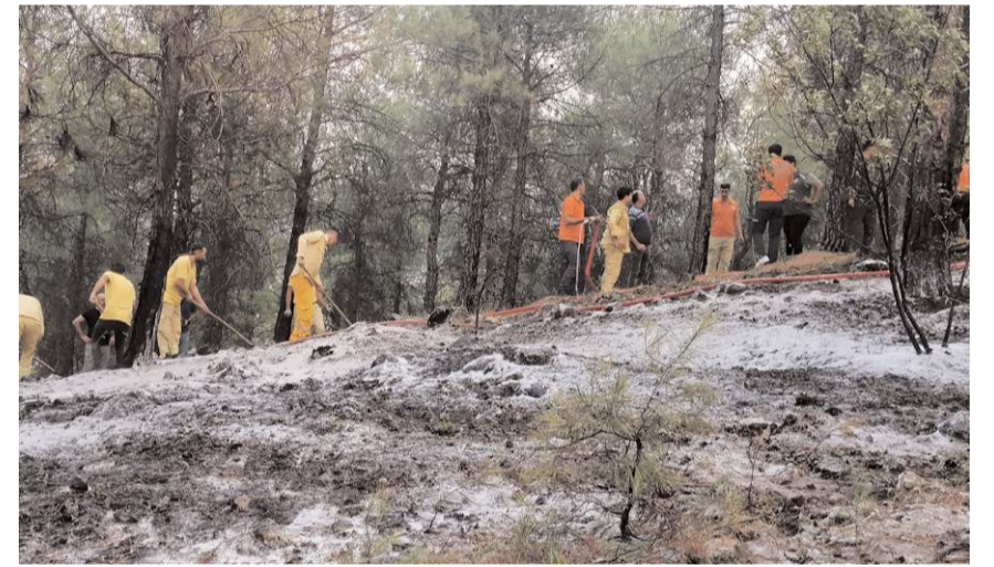
İtfaiye ekipleri, bölgede soğutma çalışması yaptı.