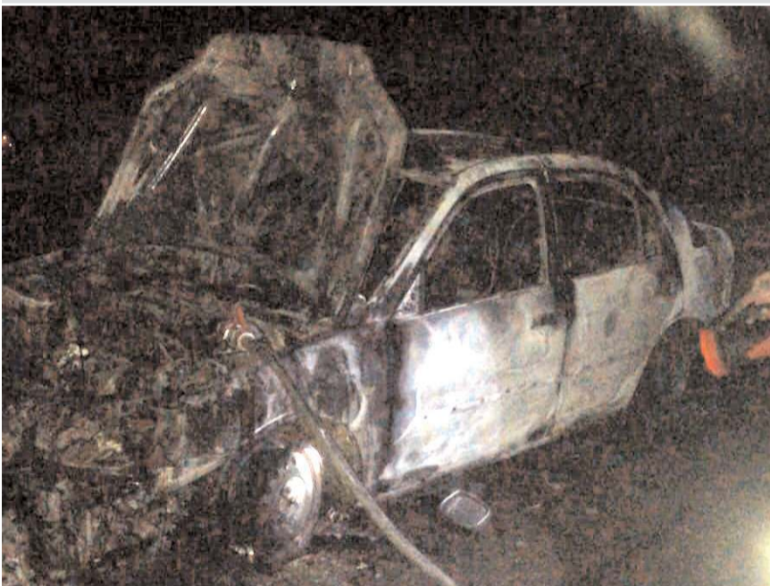
Yukarı Beşköy köy yolunda meydana gelen olayda otomobil alev alev yandı.

Sungurlu'da seyir halindeki otomobil alev alev yandı.