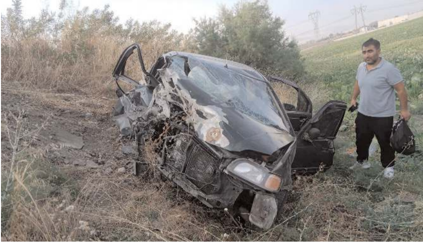
Kaza, Bayat-Ankara kara yolu Bayat Su Deposu mevkinde meydana geldi.