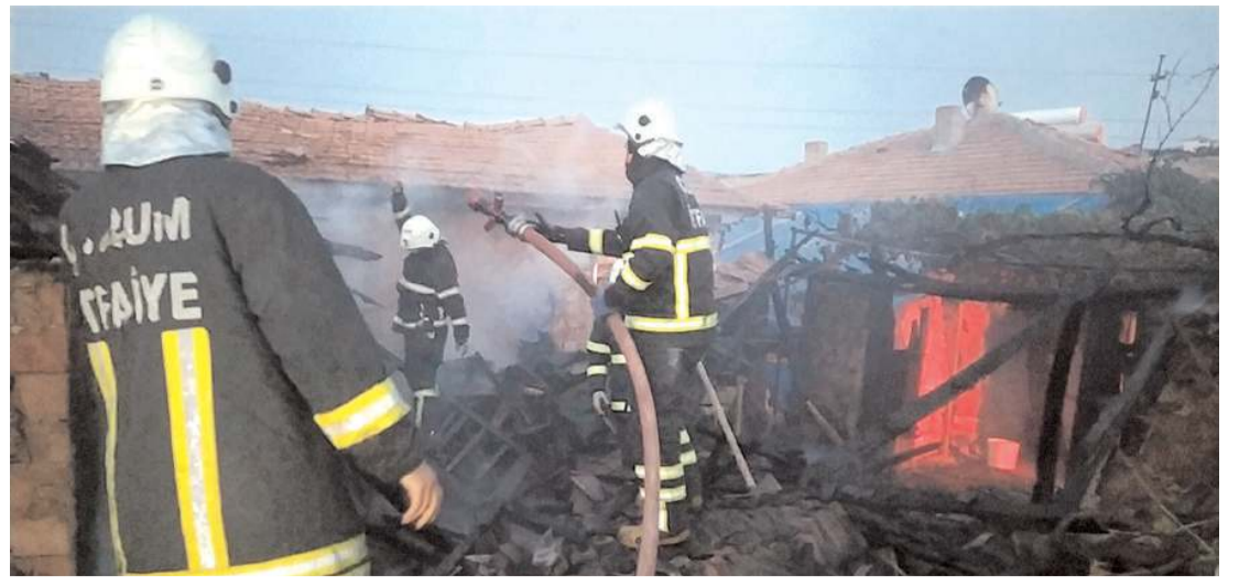
Müstakil bir evin tandır kısmında bilinmeyen bir nedenle yangın çıktı

Hayati tehlikesi bulunan S.B, Ankara'daki bir hastaneye sevk edildi.(AA)