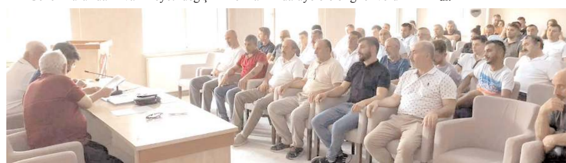
Amatör Spor Kulüpleri Federasyonunun 180 üyesinden 140'ının katılımı ile yapıldı