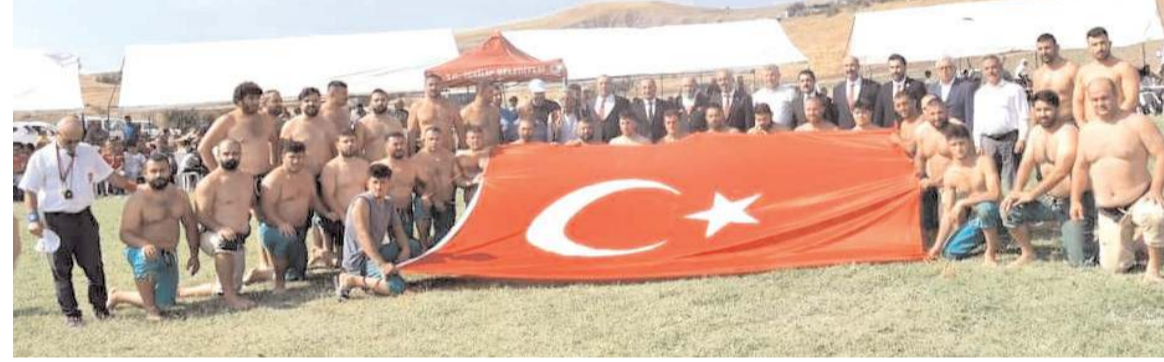
Baş güreşlerinde mücadele eden pehlivanlar müsabakalar öncesinde Türk bayrağı ile böyle poz verdiler