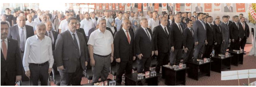
Kongreye çok sayıda partili katıldı.