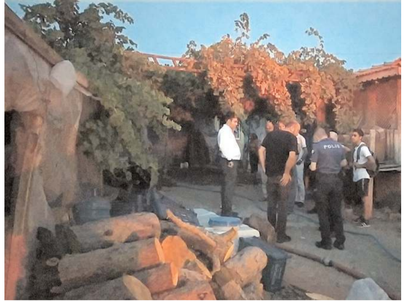
Yangın itfaiye ekiplerinin uzun uğraşları sonucu söndürüldü.

Yangının çıkış nedeni araştırılıyor. (İHA)