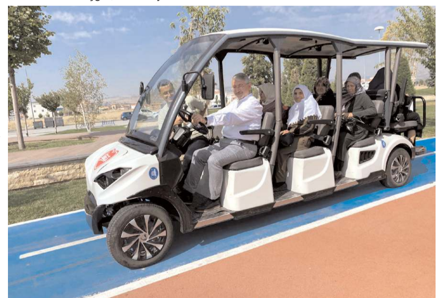
Güngörmüşler, kahvaltının ardından golf aracı ile Millet Bahçesi'ni gezdiler.

çok iyi biliyoruz. Araya siyasi bir ikbal koymadan, dünyevi bir çıkar menfaat koymadan, Rabbimizin rızası, milletimizin duası için çalışıyoruz." diye konuştu.