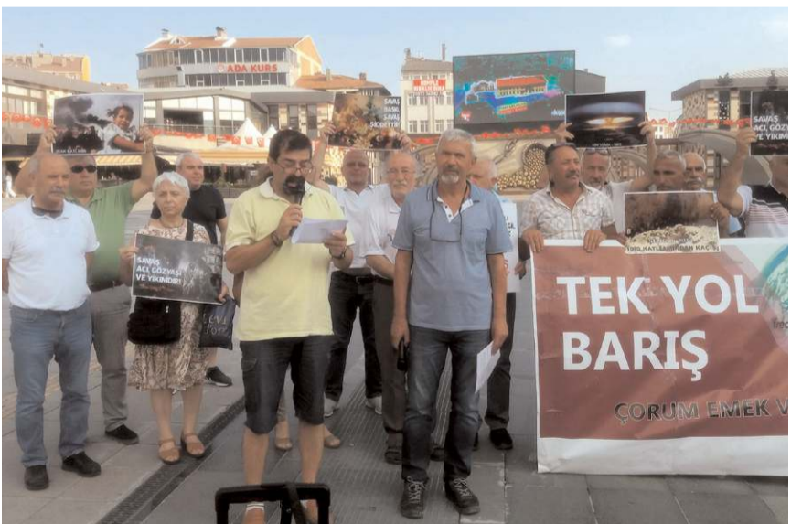
Emek ve Demokrasi Platformu, Dünya Barış Günü nedeniyle basın açıklaması yaptı.

emperyalistler arası paylaşım savaşları nedeniyle insanlık ve doğanın bir kez daha büyük bir kıvrımla karşı karşıya olduğunu söyledi.