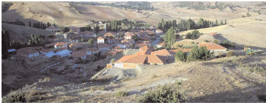
Köy, geleneksel Türk kültürünün hala yaşatıldığı özel bir yer.