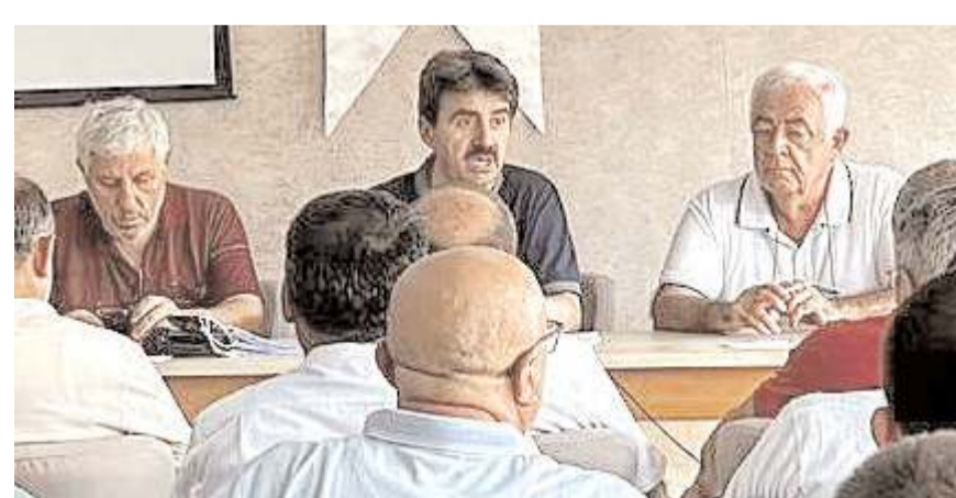
Genel Kurul'da Divan Heyeti değişiklikler hakkında üyelere bilgiler verdi