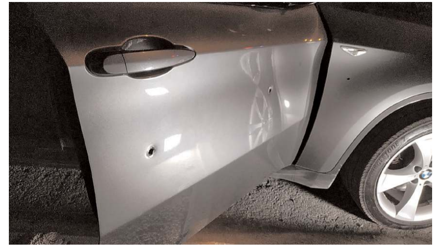
Park halindeki otomobil kimliği belirsiz kişiler tarafından kurşunlandı.

Polis, olayın gerçekleştiren kişi ya da kişilerin yakalanması için çalışma başlattı. (İHA)