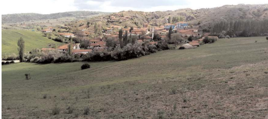
Ziyaretçiler, köyde aile sıcaklığında bir konaklama deneyimi yaşayabilirler.