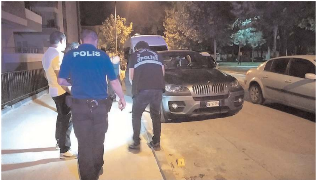
Kurşunlanma olayı, Ulukavak Mahallesi Tekceviz 7. Sokak'ta meydana geldi.