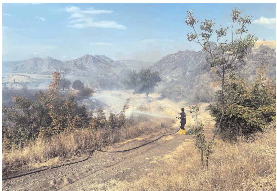
Osmancık Belediyesi itfaiye ekipleri, vatandaşların desteğiyle yangını söndürdü.

Çıkış sebebi henüz bilinmeyen yangın nedeniyle yaklaşık 20 dekar çalılık alanda zarar oluştu.(AA)