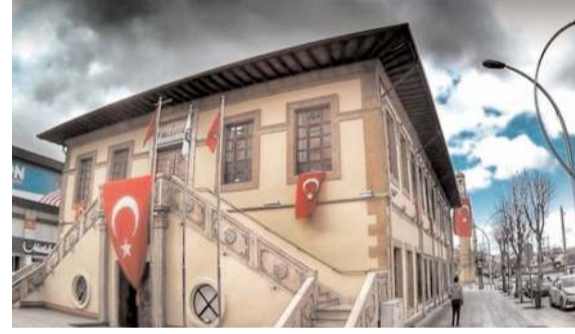
Tarihi taş bina, 7/24 açık kütüphaneye dönüşüyor.