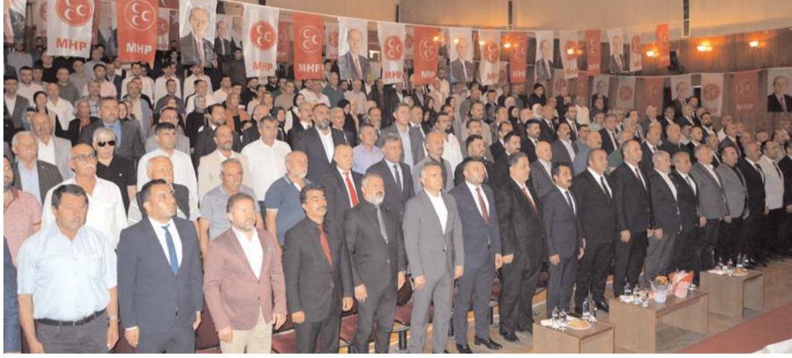
MHP Merkez İlçe Kongresi Devlet Tiyatro Salonu'nda gerçekleştirildi.