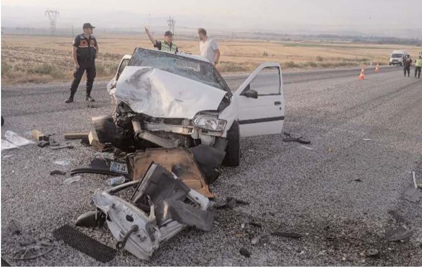
Kazada, sürücü E.Y. ile diğer araçta bulunan E.B. (63) yaşamını yitirdi.

Çorum'da iki otomobilin çarpışması sonucu 2 kişi hayatını kaybetti, 5 kişi yaralandı.