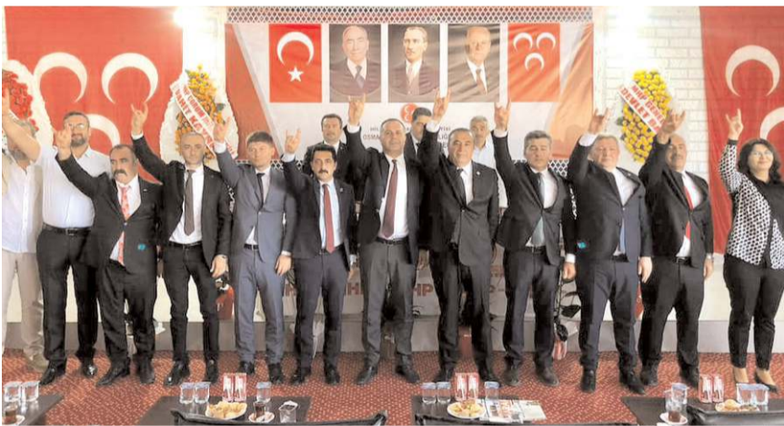
MHP Osmancık İlçe Kongresi önceki gün gerçekleştirildi.