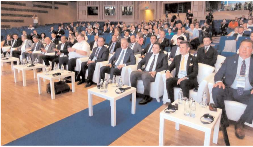
Uluslararası Un Sanayicileri ve Hububatçılar Birliği İstanbul'da konferans düzenledi.

Uluslararası Un Sanayicileri ve Hububatçılar Birliği (IAOM)'nin İstanbul'da düzenlediği konferansta konuşan IAOM ABD Başkanı Steve Matson, IAOM olarak tüm insanlık için iyi gıdalar üretmek hedefi ile çalışıyoruz. Bu nedenle tüm dünyada iyi tarım için eğitimler veriyoruz. Gelecek hafta bu eğitimlerin Türkiye'deki ilkini Çorum'da düzenleyeceğiz." dedi