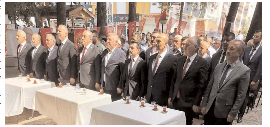
Kongreye çok sayıda partili katıldı.