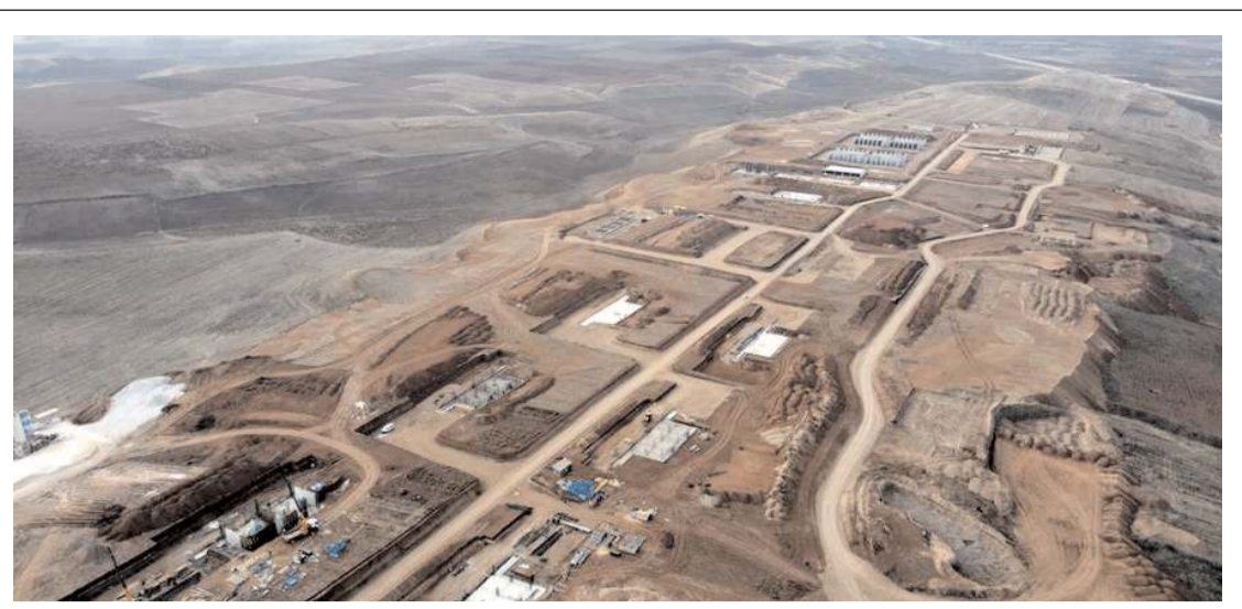
Sungurlu OSB'de doluluk oranı yüzde 100'e ulaştı.