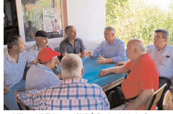
Milletvekili Tahtasız, CHP İl Başkanlığı'nda Çorum halkını dinleyeceğini açıkladı.