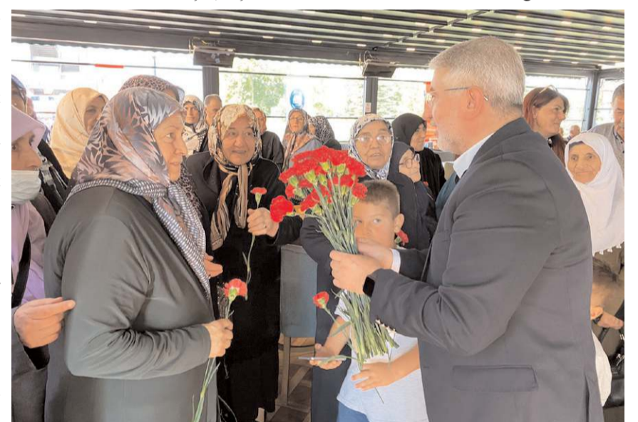
Aşgın, kahvaltıda katılan misafirlere karanfil takdim etti.