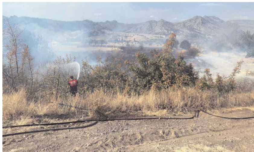
Osmancık'ta çıkan yangında 20 dekar çalılık alan zarar gördü.

Osmancık'ta çıkan örtü yangınında yaklaşık 20 dekar çalılık alan zarar gördü.