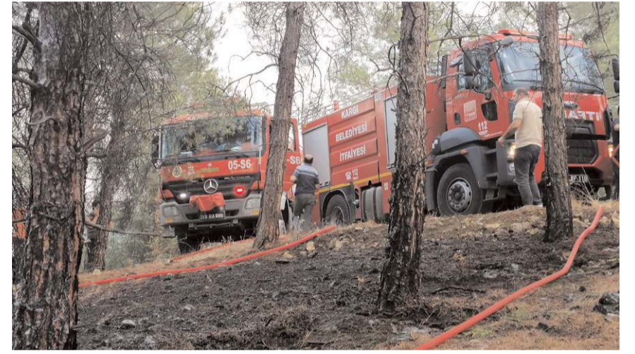
Köylülerin ihbarı üzerine bölgeye çok sayıda itfaiye ekipleri sevk edildi.

Çıkış sebebi henüz bilinmeyen yangın nedeniyle yaklaşık bir dekar ağaçlık alanın zarar gördüğü belirtildi.(AA)