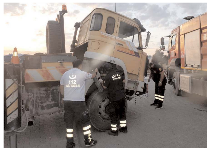
Kedi itfaiye ekipleri tarafından motordan çıkarıldı.