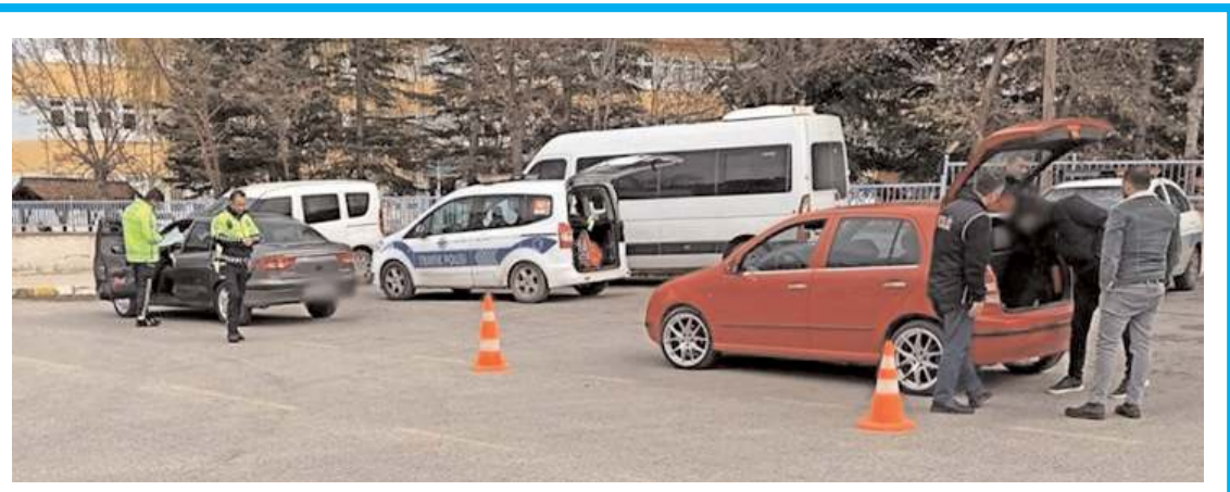
Yapılan denetimlerde 142 aracın trafikten men edildiği belirtildi.