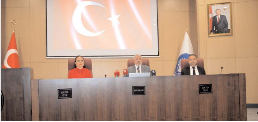
Belediye Meclisi Eylül ayı toplantısı dün gerçekleştirildi.