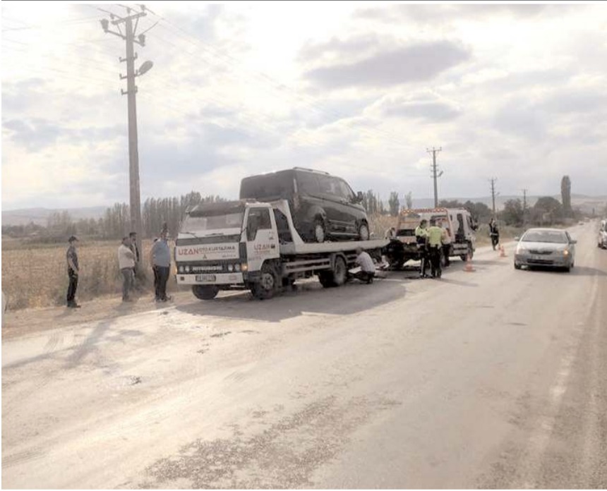
Kazada, otomobil ile karşı yönden gelen minibüs çarpıştı.