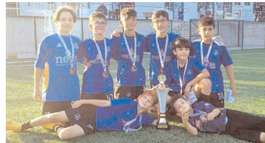
Vefaspor yarı final maçını farklı kazanarak finale yükselen ilk takım oldu