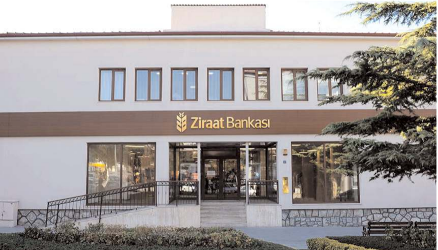
Aşgın, tarihi meydan projesini 2 etapta tamamlayacaklarını söyledi.