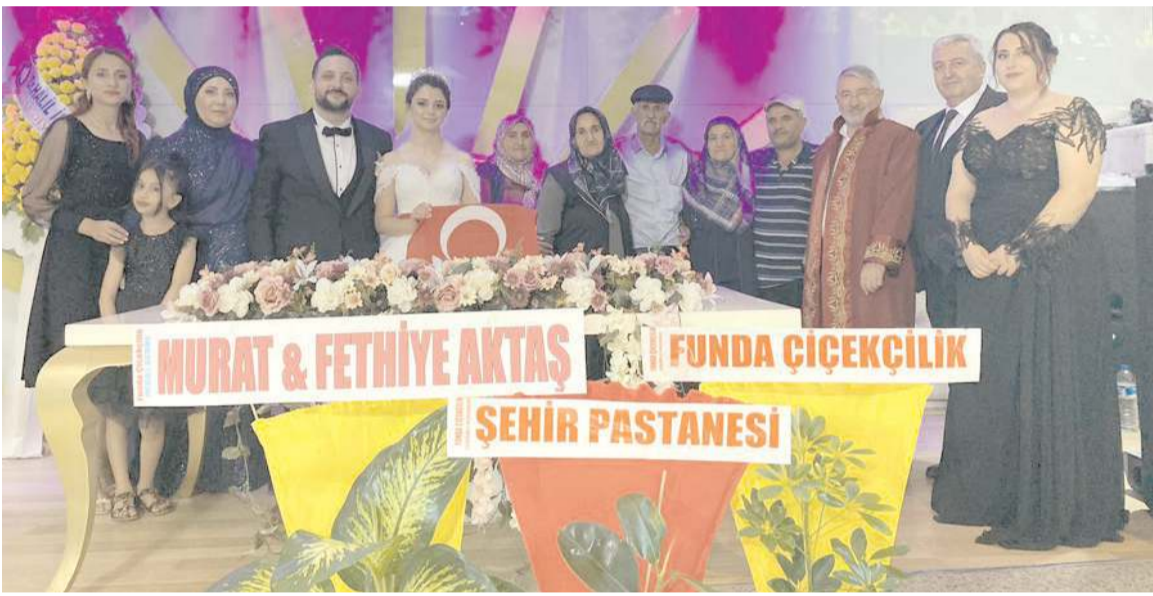
Genç çiftin düğünü Afra Düğün Salonu'nda gerçekleştirildi.

Bu ve benzeri taleplerimizin gerçekleştirilmesi için tek yol gerçek bir sendika ile birlikte örgütlü mücadele etmektir. Yaşadığımız her sorunu birlik ve mücadele ile çözeceğimize olan inançla tüm zabıta emekçilerinin haftasını bir kez daha kutluyoruz."