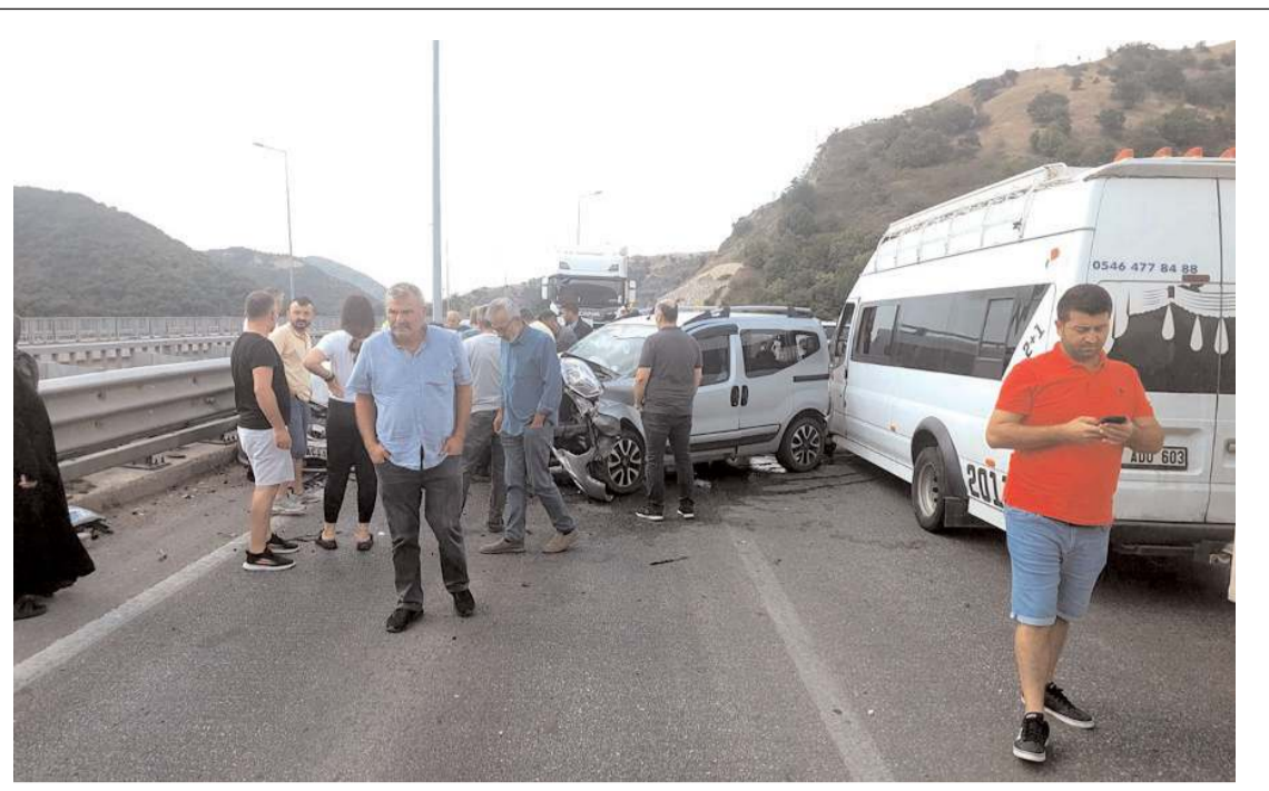
Havza Boğaziçi Viyadüğünde meydana gelen zincirleme trafik kazasında 5 kişi yaralandı.

Trafikten men edilen araç, çekici ile otoparka kaldırıldı.