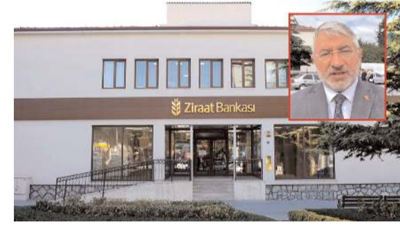
Belediye Başkanı Halil İbrahim Aşgın, meydana açıklamalarda bulundu.