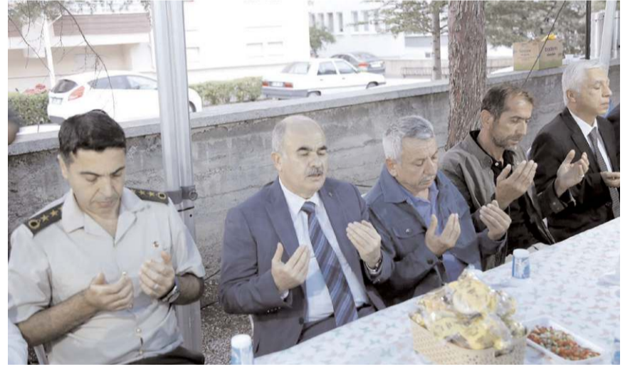
Mevlitte tüm şehitler için dua edildi.