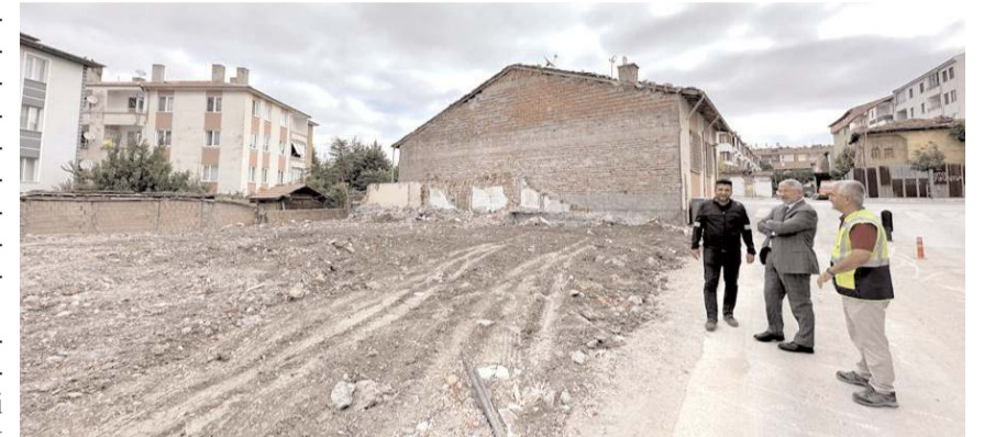
Trafiği rahatlatmak amacıyla Okul 1. Sokakta kamulaştırılan alan yıkıldı.

Yeni açtıkları yol güzergâhlarındaki yapıları kamulaştırdıktan sonra yıkımlarını gerçekleştirdiklerini belirten Aşgın, "Çorum'unuz için yılmadan, yorulmadan ilk günkü aşkla çalışmaya devam ediyoruz. Göreve geldiğimiz günden beri yaptığımız kamulaştırmalar şehrimizin 5 mahallesinin yüzölçümünden daha fazladır. Güçlü mali yapımızla ihtiyaç duyulan bölgelerde de yeni kamulaştırmalar yapmaya devam ediyoruz.