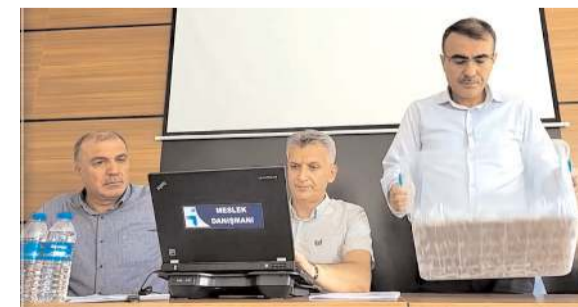
Kura çekimi İştirak İl Müdürlüğü Toplantı Salonunda Noter huzurunda gerçekleştirildi.