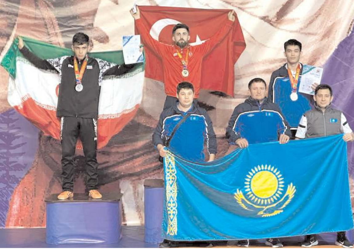
Eren Uzun Bişkek'te grekoromen stilde kazandığı Dünya Şampiyonluğu ödül töreninde kürsüde rakipleri ile birlikte

Yalçın'ın bu transferin yanı sıra orta saha için Süper Lig tecrübesi bulunan bir isimle büyük oranda anlaştığı iki transferin bu hafta içinde takıma katılması bekleniyor.