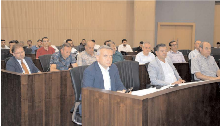
Toplantıda gündem maddeleri görüşülerek karara bağlandı.