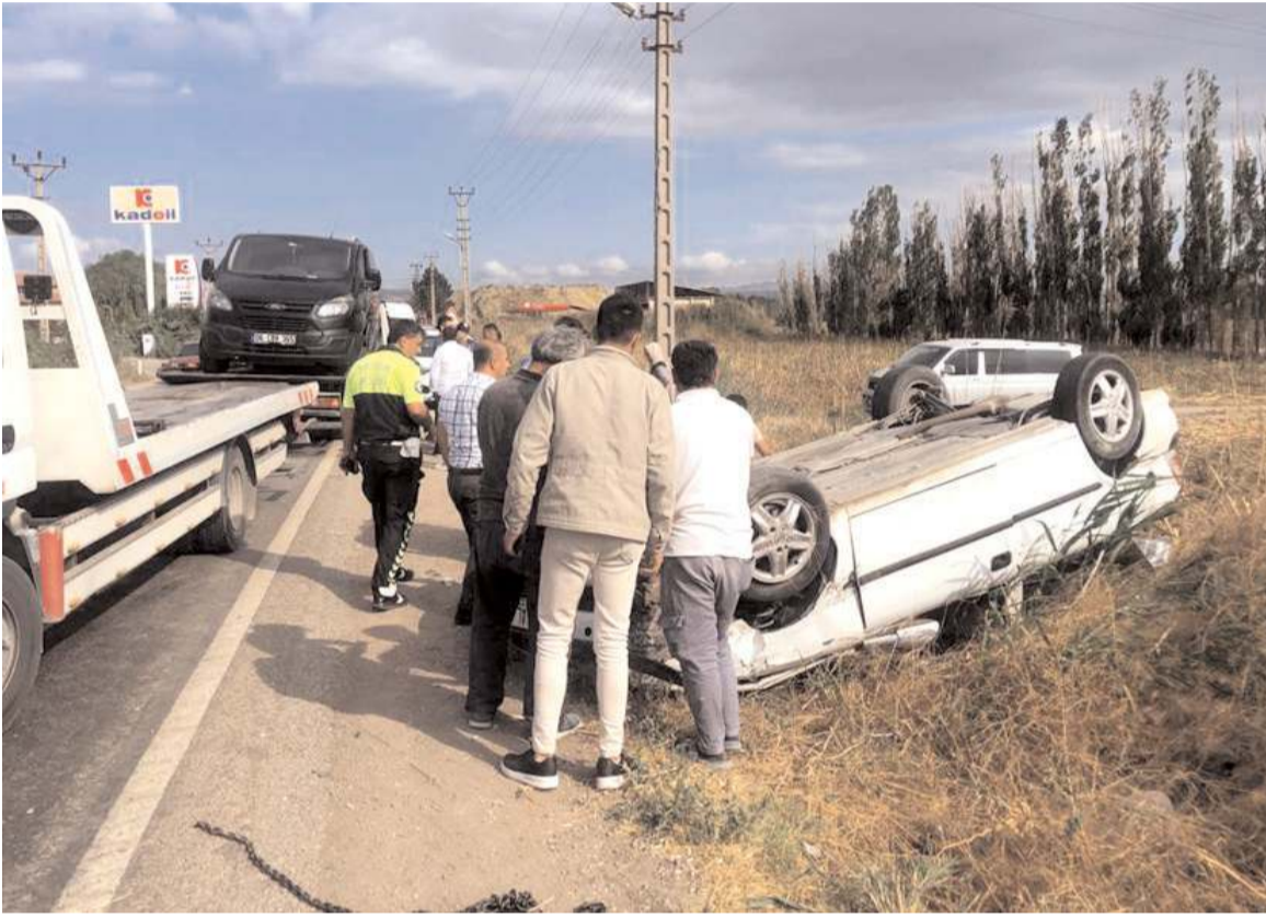
İskilip yolunda meydana gelen kazada 9 kişi yaralandı.