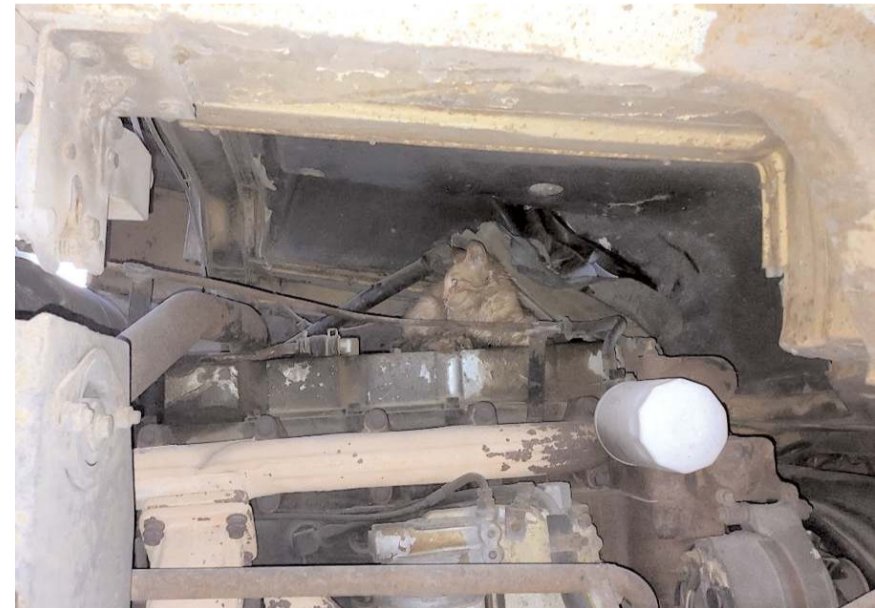
Alaca'da vincin motor bölümüne kedi sıkıştı.

Bir anda vinçten atlayan kedi, hızla uzaklaştı.