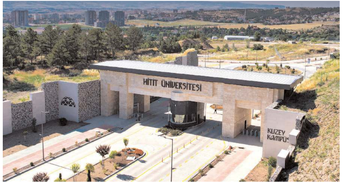
Hitit Üniversitesi Rektörlüğü tarafından "Öğretim üyesi" alınacağı duyuruldu.