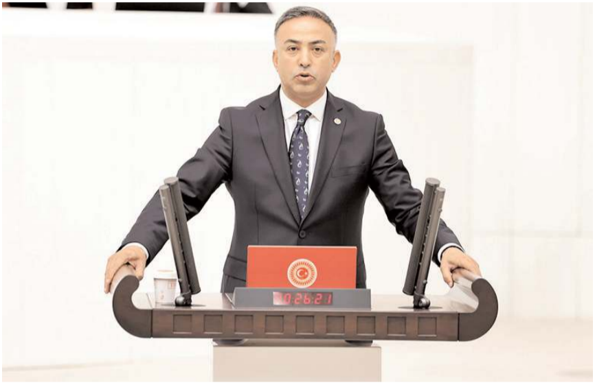
CHP Çorum Milletvekili Mehmet Tahtasız

Kayrıcı'nın hamaset yaptığını ileri süren Tahtasız, "Hamasetle siyaset yapmayı bırakın ve iktidar partisinin küçük ortağı olarak Çorum'un çözüm bekleyen sorunları için uğraş versin. İktidar tarafından verilen havaalanı, hız-