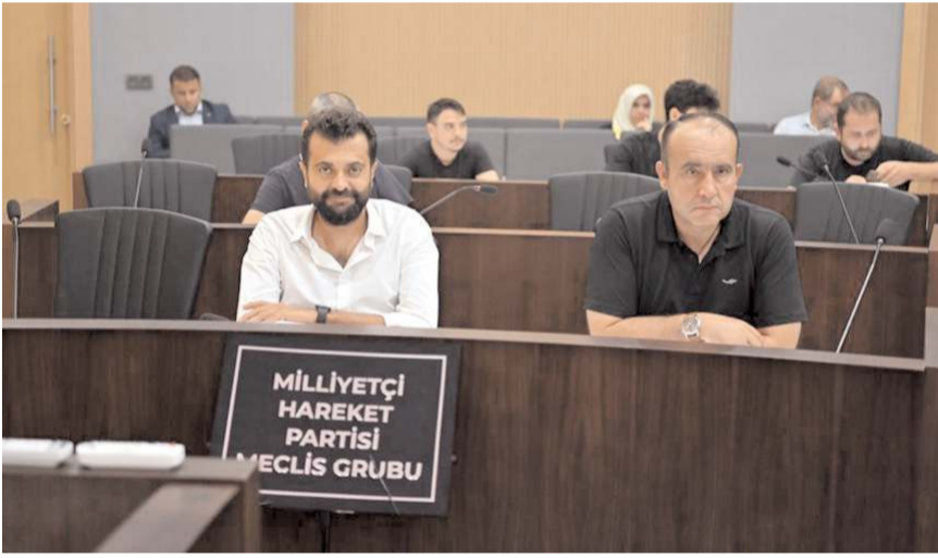
Meclis, 10-14 Eylül tarihleri arasında Kıbrıs'a gidecek.