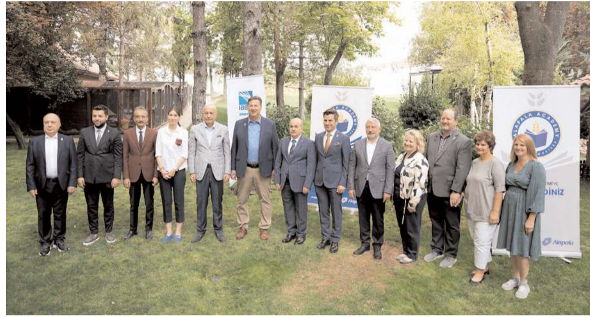
Türkiye'den ve dünyanın çeşitli ülkelerinden 31 öğrencinin katılımıyla eğitim programı başladı.

Sürdürülebilir bir gelecek için gıda teknolojilerinin öneminin giderek arttığı dünyada, liderliğin de getirdiği sorumlulukla, sektöre nitelikli çalışanlar kazandırma bilinciyle hareket ettiklerini belirten Alapala; "70 yıllık deneyimimiz ve yenilikçi gücümüzle, IAOM'un endüstrideki katma değeri artırma hedefini, sektördeki güçlü partnerlerimizin de iş birliği ile uluslararası eğitim programında buluşturduk" diye konuştu. (Haber Merkezi)