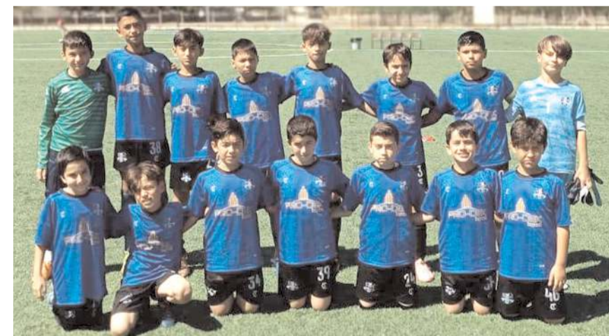
Mehmetcikspor yarı final maçında penaltılarda kazanarak finale yükseldi