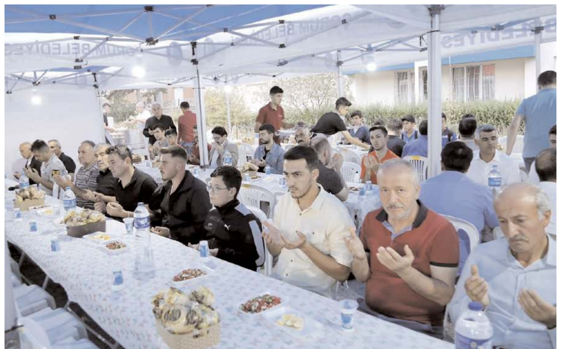
Programda şehit astsubayın yakınlarında katıldı.