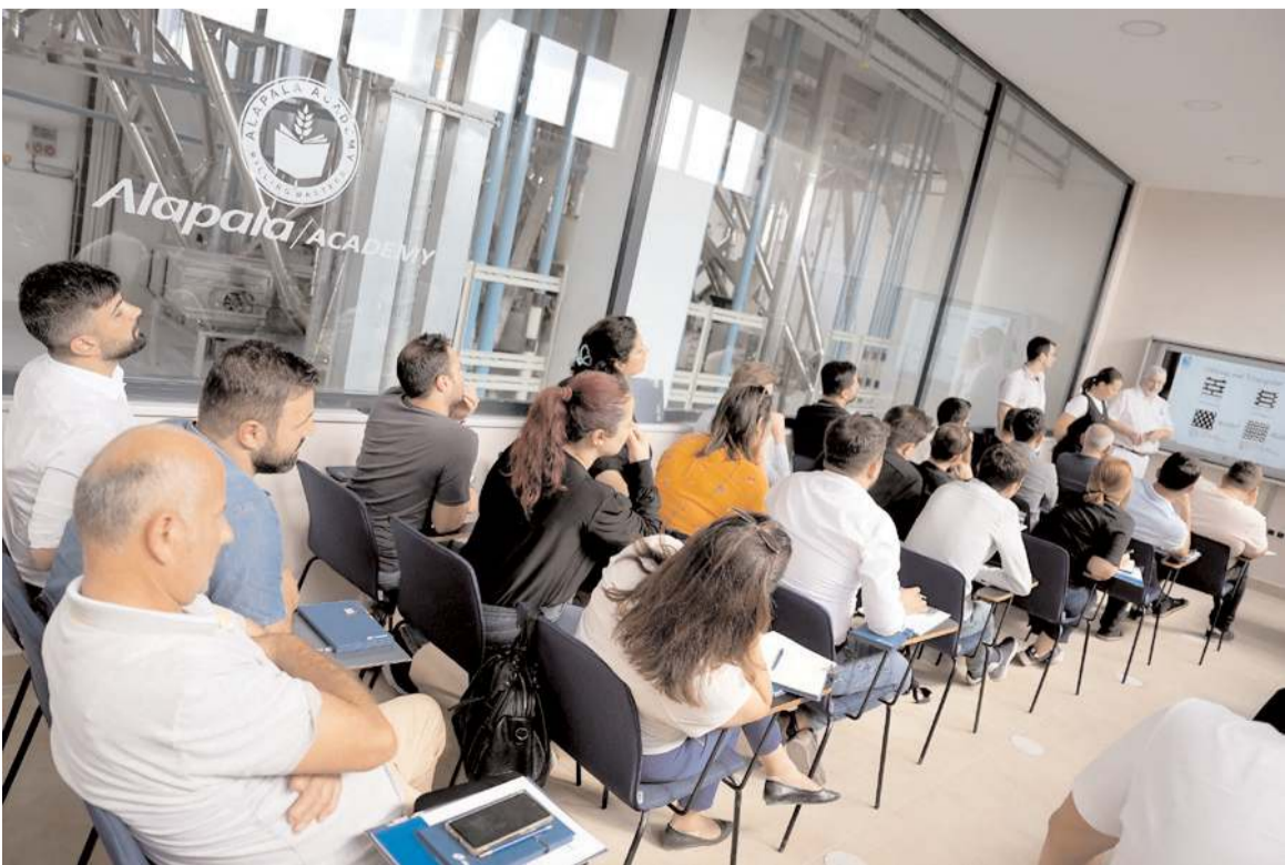
Alapala'da uluslararası değirmencilik eğitimi verilmeye başlandı.