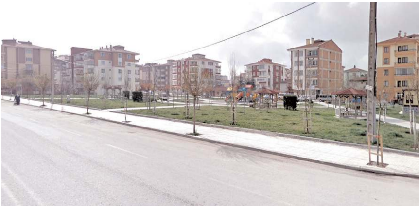
Meclis toplantısında iki parka şehitlerimizin isminin verilmesi kararı alındı.

Toplantı sonunda 2023 yılı ek ödenek bütçesinin bugün görüşülmesi oya sunulmuş ve oy birliğiyle kabul edildi.