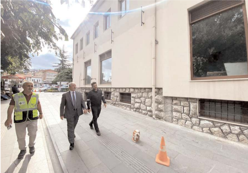
Önümüzdeki hafta firma ile sözleşmenin imzalanacağı belirtildi.