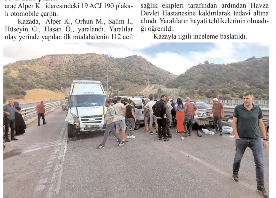
Yaralılar olay yerinde yapılan ilk müdahalenin ardından Havza Devlet Hastanesine kaldırıldı.