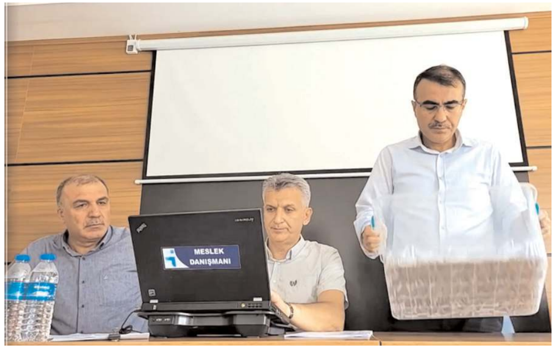
Kura çekimi İşkur İl Müdürlüğü Toplantı Salonunda Noter huzurunda gerçekleştirildi.