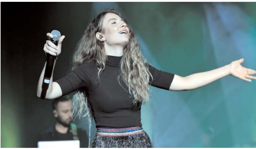
Şarkıcı Irmak Arıcı, 16 Eylül Cumartesi günü Çorum'da konser verecek.