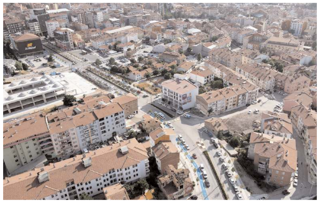
Çorum Belediyesi, ulaşımı rahatlatmak için kamulaştırma çalışmalarına devam ediyor.