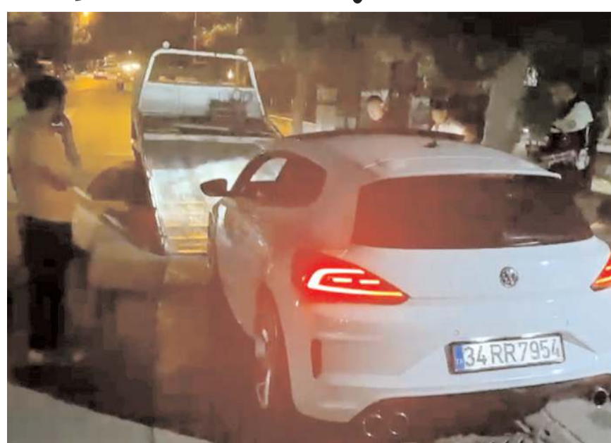
Polisten kaçan ve "daha çok beklersiniz" notunu paylaşan sürücü yakalandı.