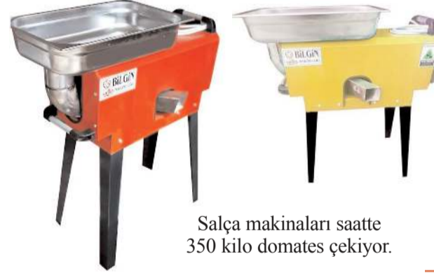
Salça makinaları saatte 350 kilo domates çekiyor.