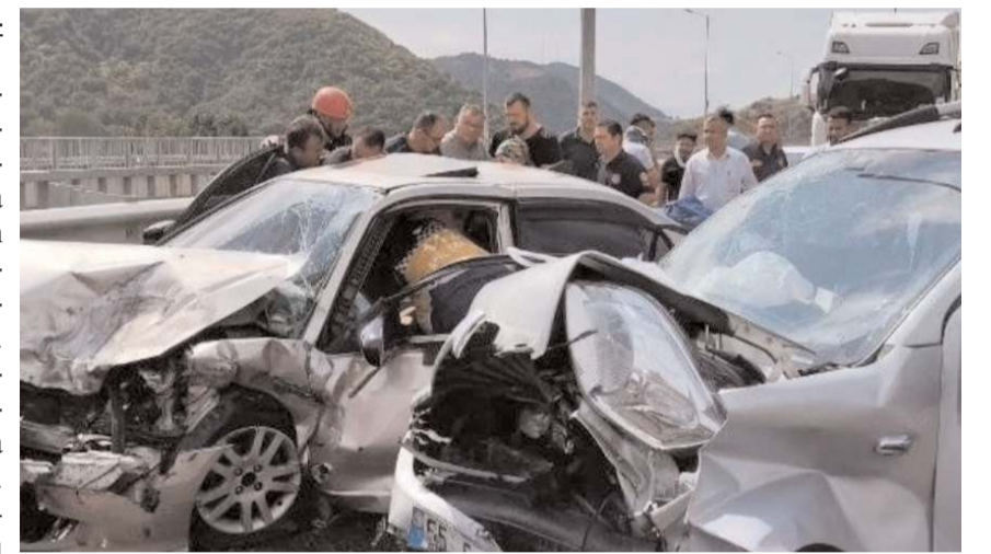
Kaza dün sabah saat 10.50 sıralarında meydana geldi.