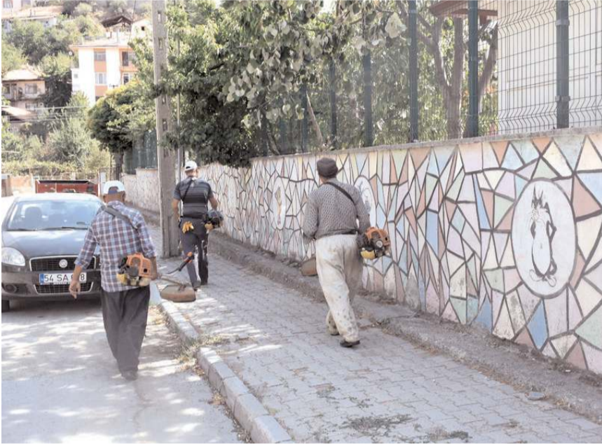
İskilip Belediyesi ilçedeki okulları yeni eğitim-öğretim yılına hazırlıyor.

Okul bahçelerini süpürüp yıkadıklarını, yabancı otları ayıkladıklarını belirten Sülük, yeni eğitim yılının ülkeye hayırlar getirmesini temenni etti.(AA)