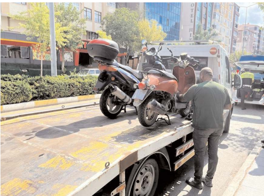
Denetimde 151 motosiklet, 46 traktör ile 25 servis aracı sorgulandı.

Çorum İl Emniyet Müdürlüğünden yapılan açıklamada, halkın huzur ve güvenliğine yönelik çalışmaların aralıksız olarak devam edeceği bildirildi. (İHA)