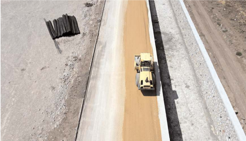
Belediye ve DSİ arasında imzalanan sözleşme doğrultusunda dere ıslah çalışmaları devam ediyor.