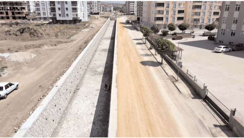
Çalışmalarda öncelikli olarak olası su taşkınlarına karşı önlem alınması amaçlanıyor.

Çorum Belediyesi ve Devlet Su İşleri (DSİ) arasında imzalanan sözleşme doğrultusunda, Çorum'un Bayat Gedigi, Garantievler, Özgürevler ve Ahçılar bölgelerini kapsayan dere ıslah çalışmaları devam ediyor.