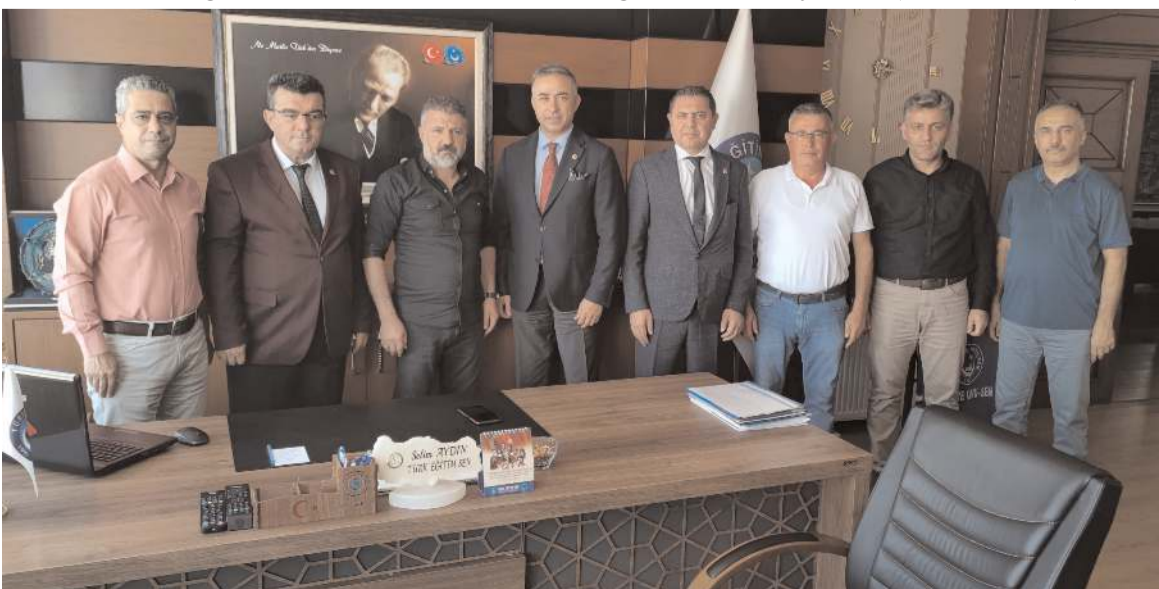
CHP Çorum Milletvekili Mehmet Tahtasız Türk Eğitim-Sen'i ziyaret etti.