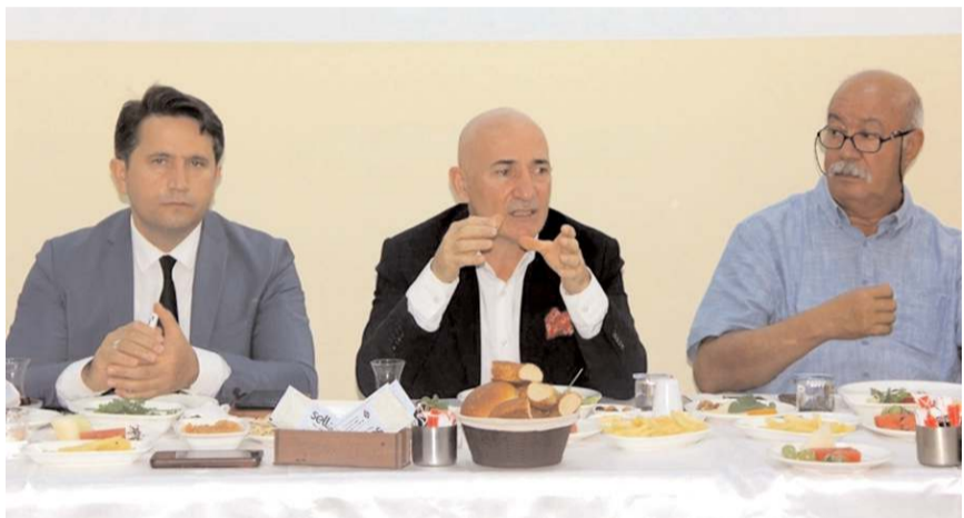
Eğitim ve sanayi sektörü arasındaki işbirliğini artırmak amacıyla toplantı düzenlendi.

Okul olarak ayrıca yemek ve servis konusunda sıkıntılarının olduğunu aktaran Ergül, sanayicilerden bu konuda destek beklediklerini belirterek; "Şu anda mevcut öğrenci sayımız 232 idari personelle beraber 26 öğretmenimiz mevcut 2 yardımcı hizmetli personelimizle eğitim öğretim yılına başlayacağız. Elzem olan bir sorunumuz var yemekhane ile ilgili yerimiz mevcut değil ve geçtiğimiz yıllarda sanayicilerimizin desteğiyle hazır emek firmaları tarafından yemek ikram ediliyordu. Bununla ilgili okul açıldığından beri gerekli girişimlerimiz var bizim buraya kalıcı bir çözüm uygulamamız lazım. Pandemi süreci başlayana kadar servis ücreti ve yemek ücreti alınmıyordu. Önce servis ücreti daha sonra yemek ücreti sonlandırıldı. Daha sonra sanayicilerimizin desteğiyle bu seneye kadar getirdik. Bu sene yemek olayıyla ilgili herhangi bir sonuç mevcut değil. Öğrenci profili karşılayabilecek şartlarda değil. Bununla ilgili acil yardıma ihtiyacımız var" şeklinde konuştu.