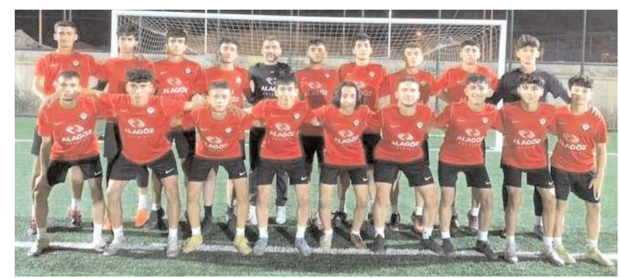
Çorum FK U 17 takımı Marmara ve İç Anadolu grubunda mücadele edecek

ca Gençlikspor, Düzcespor ve Çankaya FK takımları mücadele edecek. Gruplarda çift devreli oynanacak maçlar sonunda gruplarda ilk iki sırayı alan takımlar final grubunda mücadele edecekler.