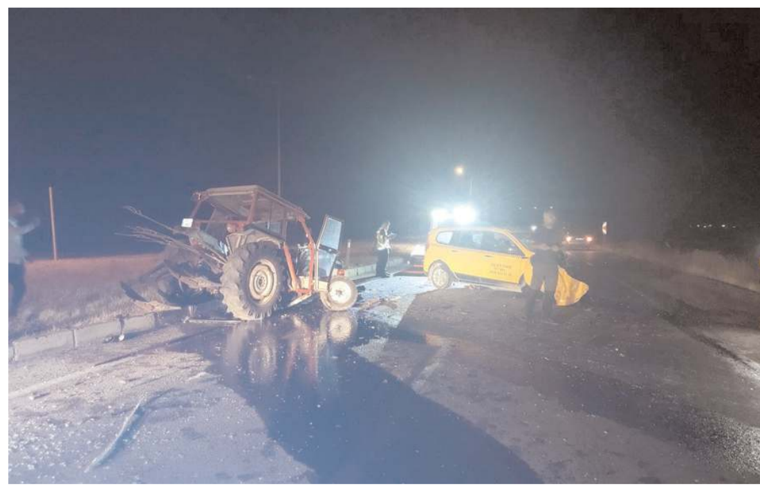
Alaca'da traktörle ticari taksinin çarpıştığı kazada 3 kişi yaralandı.