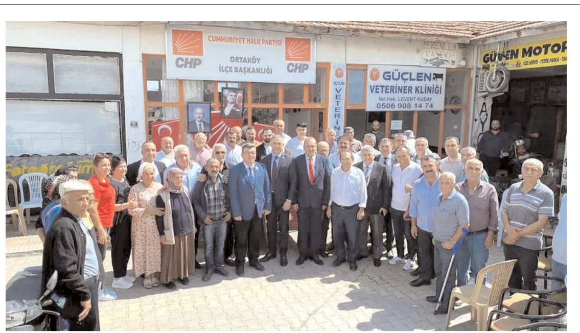
CHP Ortaköy İlçe Kongresi gerçekleştirildi.

Kargı'daki Öğretmenevi'nin depreme dayanıksız olduğu için yıkılacağını dile getiren Tahtasız, yıkılan Öğretmenevi'nin yeri-