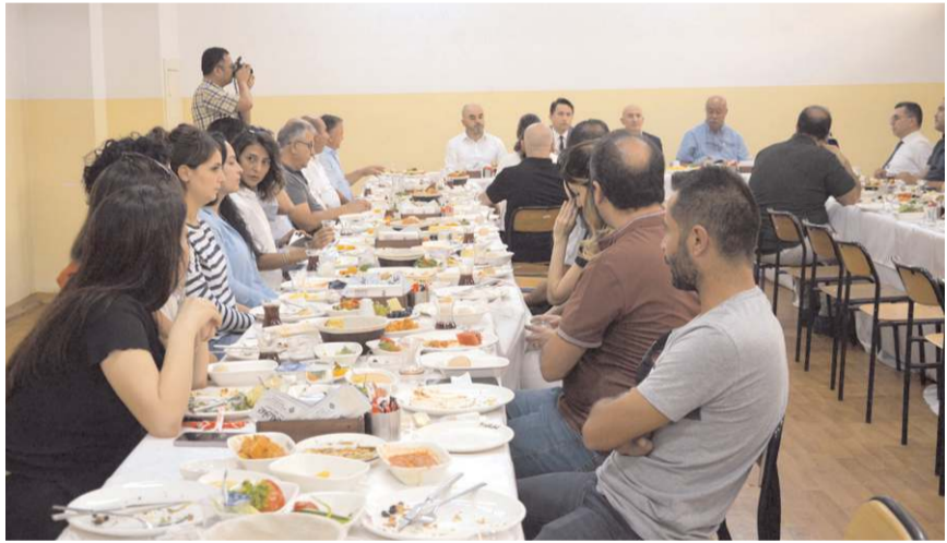
Toplantıda, nitelikli, yetişmiş insan gücü için meslek liselerinin önemine vurgu yapıldı.