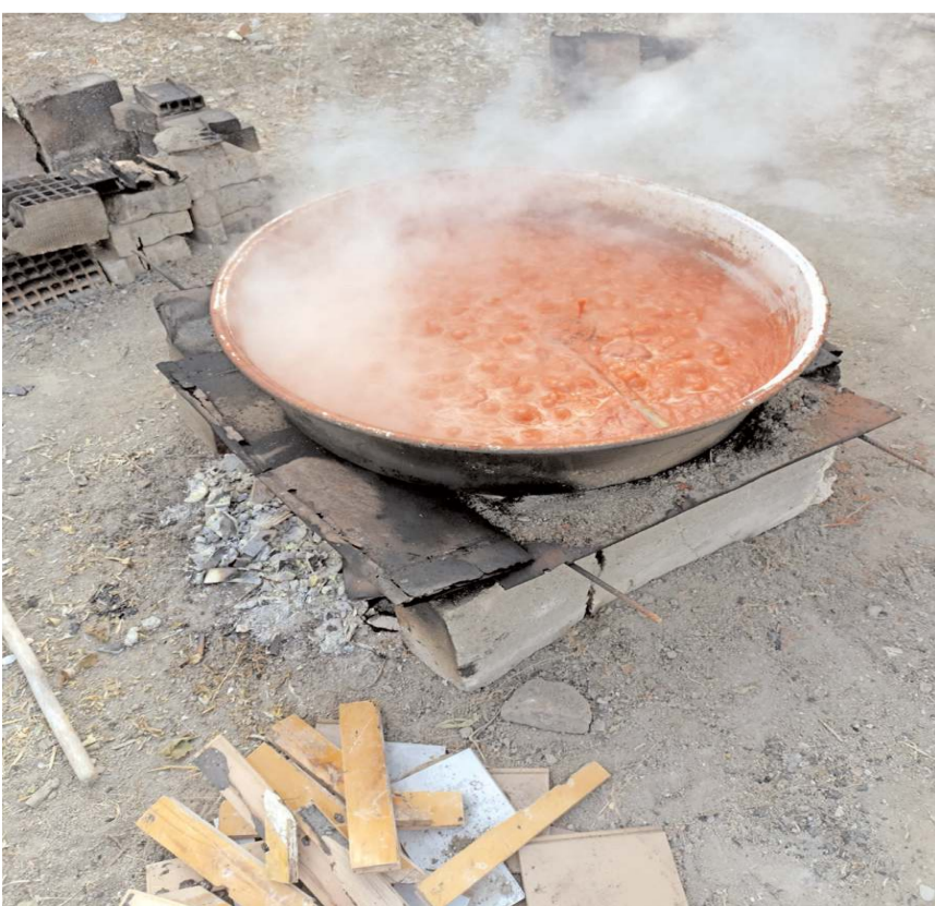
Domates ve biber karışımı salça yapımı zaman ve uzun uğraş gerektiriyor.

Yaz mevsiminin sonuna yaklaştığımız bugünlerde ülkemizin birçok bölgesinde salça telesi başladı.