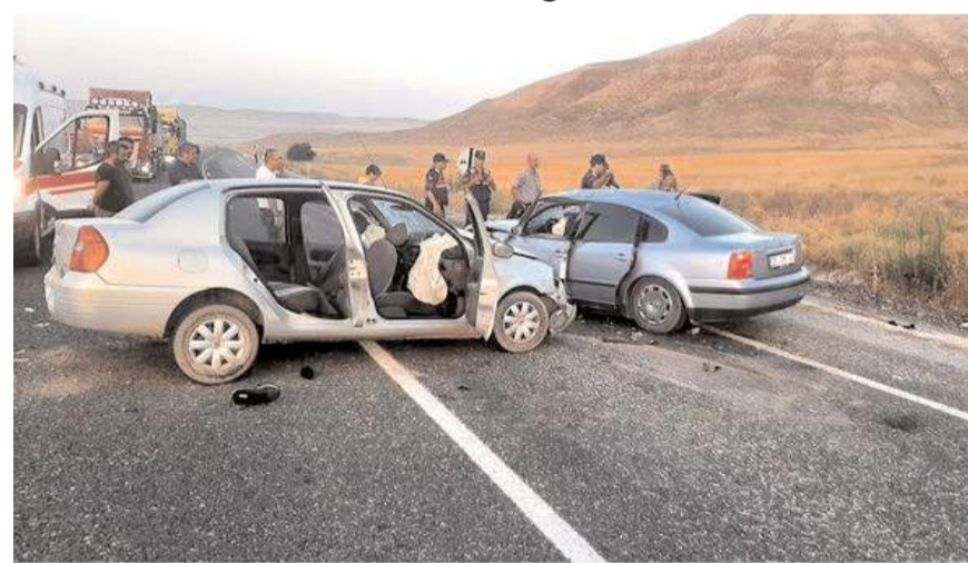
Kaza İskilip Aşağı Ovacık köyü yakınlarında meydana geldi.