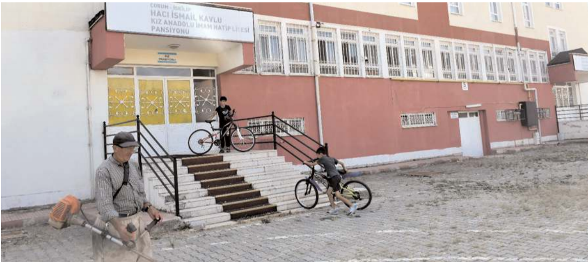
2023-2024 eğitim-öğretim yılının başlamasına kısa süre kala ilçedeki okullarda temizlik çalışması başlatıldı.