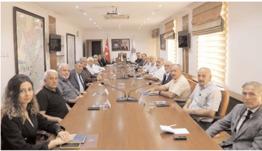
Toplantıda Çorum'un genel güvenlik ve asayişini etkileyen konular değerlendirildi.