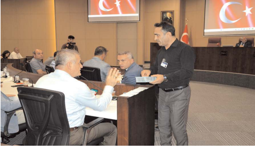
Toplantıda 2023 yılı ek ödenek bütçesi görüşüldü.