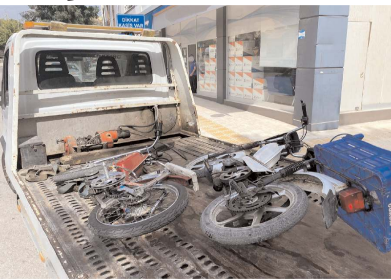
Denetimler, il merkezi ve 13 ilçede 28 noktada gerçekleştirildi.

46 traktör ile 25 servis aracının sorgulandığı uygulamada iki traktör trafikten men edilirken 302 araç ile 831 şahsın sorgulandığı denetimlerde, iki araç trafikten men edildi, araması olan bir şahıs yakalandı.