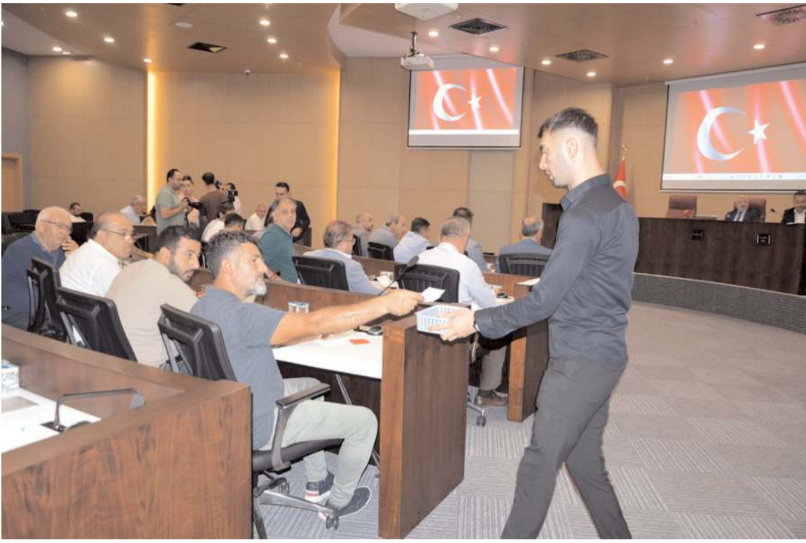
210 milyonluk ek bütçeye AK Parti, CHP ve MHP grubu da 'evet' dedi.