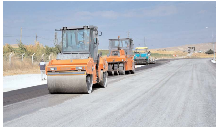
Alaca-Çorum yoluna 2 bin 500 metre sıcak asfalt serimi yapıldığı belirtildi.