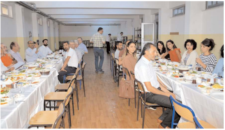
TOBB-OSB MTAL'de düzenlenen toplantıya değırmencilik bölümü öğretmenleri katıldı