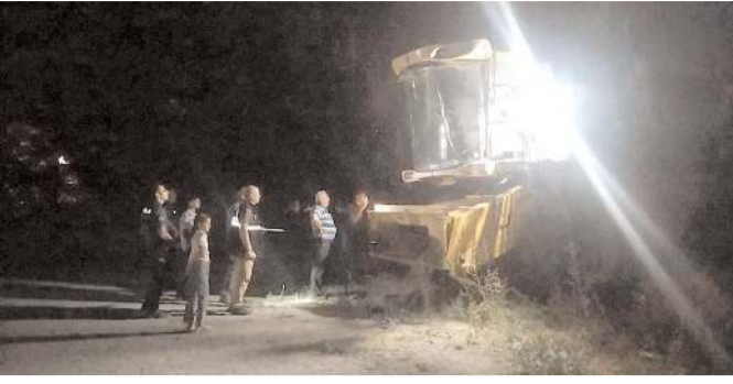
Çorum'da park halindeki biçerdöver kurşunlandı.