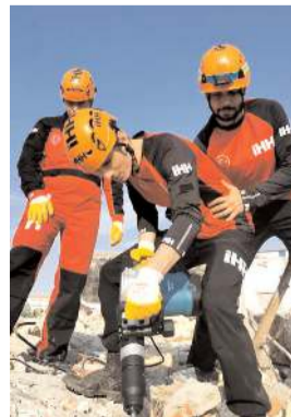
Eğitimde uzman kişilerle teorik eğitim verildi.

Yozgat İHH İnsani Yardım Derneği'nin evsahipliğinde, Amasya, Çorum, Sivas ve Tokat illerinden gelen İHH ekibi bölgesel eğitim programı gerçekleştirdi.