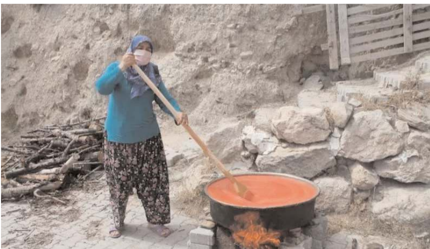
Çorum'da kadınlar yaz güneşinde kızaran domateslerden salça yapımına başladı.