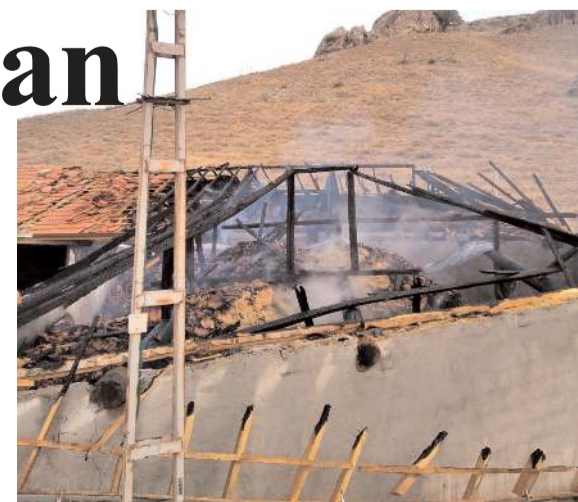
Alaca'da çıkan yangında 20 ton saman yandı.

Yangınla ilgili inceleme başlatıldı. (İHA)