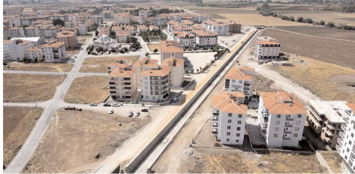
Başkan Aşgın, çalışmaların tamamlanmasıyla, su taşkınlarına karşı dirençli bir altyapı oluşturacaklarını söyledi.

Çorum Belediyesi ve DSİ'nin işbirliğiyle gerçekleştirilen dere ıslah çalışmalarının, Çorum için önemli bir adım olduğunu vurgulayan Başkan Aşgın, bu çalışmaların tamamlanmasıyla, su taşkınlarına karşı dirençli bir altyapı oluşturacaklarını ve sel baskınlarına karşı çalışmaların devam edeceğini belirtti. (Haber Merkezi)