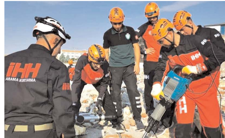
Yozgat İHH evsahipliğinde bölgesel eğitim programı gerçekleştirdi.

İstanbul, Bursa, Van ve Çorum'dan gelen arama kurtarma eğitimcileri