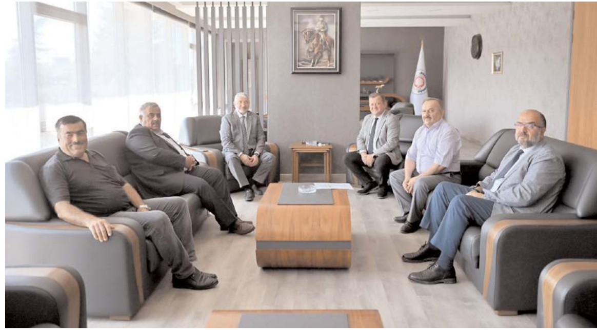
Başaranhıncal, şehrin ekonomisinin büyümesi için çaba gösteren her kurumun sonuna kadar destekçisi olduklarını söyledi.

210 milyonluk ek bütçeye AK Parti, CHP ve MHP grubu da 'evet' dedi.