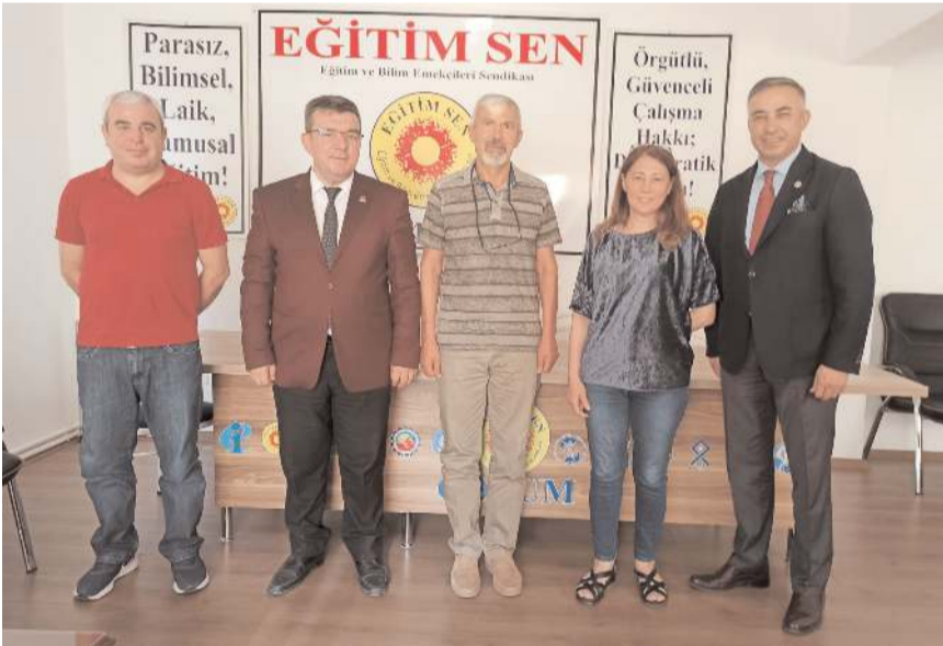
CHP Çorum Milletvekili Mehmet Tahtasız Eğitim-Sen'i ziyaret etti.

ma iletilen sorunları hem kamuoyunun gündemine hem de Meclis gündemine taşıyacağım. Buna göre, görevlendirmeler kalıcı hale gelmeli. İlçelerdeki okul idarecileri proje konusunda öğretmenleri zorunlu tutmaktan ve baskı uygulamaktan kaçınmalı. Valilik oluru ile yapılan Sportif Yetenek Taraması'nda beden eğitimi öğretmenlerinin bir yıl geçmesine rağmen yapılmayan ödemelerinin yapılması gerekiyor. Alaca ilçemiz başta olmak üzere diğer birçok ilçemizde tören alanlarında Atatürk büstü yok. Atatürk büstü olmayan okullarımıza derhal Atatürk büstü konulması gerekiyor. 2022 yılı idareci atamalarında mahkeme kararı olmayan okul idareci kadrolarının mahkeme kararı varmış gibi kişiye özel tahsisinden kaçınılmalı. Banka promosyonlarında promosyon ücretlerini tam almayan eğitim çalışanlarının sorunlarının çözülmesi. Eğitim sistemimizde çözülmeyi bekleyen yığınla sorun var ancak Çorum özelinde de sendikalarca dile getirilen bu sorun ve taleplerin İl Millî Eğitim Müdürlüğü tarafından dikkate alınarak, sonuçlandırılması gerekiyor." (Haber Merkezi)