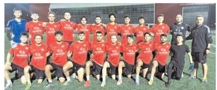
Gelişim Liginde Çorum FK U 19 takımı da Marmara ve İç Anadolu grubunda