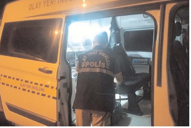
Ulukavak Mahallesi Adnan Özejder Caddesi'nde meydana gelen olayda döverbiçerin camları kurşunlandı.

Olay ile ilgili başlatılan çalışma sürüyor. (İHA)