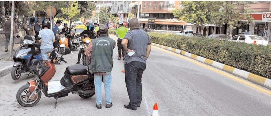
Emniyet Müdürlüğü tarafından motosiklet, traktör ve servis araçları denetlendi.

Resmi İlanlar: www.ilan.gov.tr'de (Basın: 1886248)