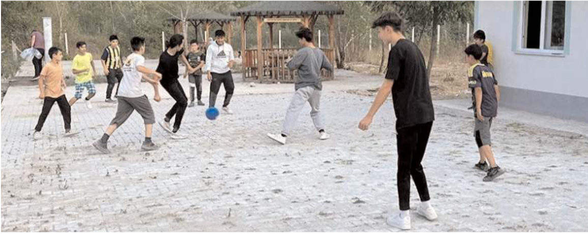
Piknikte hafızlar çeşitli sportif aktiviteler ve akabinde yapılan ikramlar ile unutulmaz bir gün yaşadılar.

Çorum il ve ilçe müftülüklerince Kur'an kurslarında öğrenim gören öğrencilere yönelik çeşitli etkinlikler düzenleniyor.