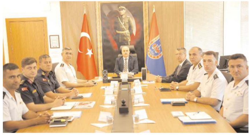
Toplantıda ilçelerin ve köylerin güvenlik tedbirleri ele alındı.

Dağlı, yapmış oldukları çalışmalardan dolayı jandarma mensuplarına teşekkür ederek, bundan sonraki çalışmalarında da üstün başarılar diledi. (Haber Merkezi)