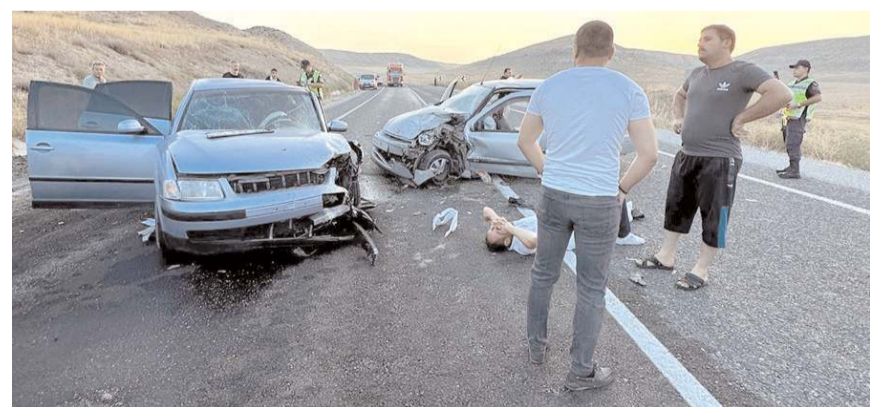
İki otomobilin kafa kafaya çarpıştığı kaza da 1 kişi hayatını kaybetti.