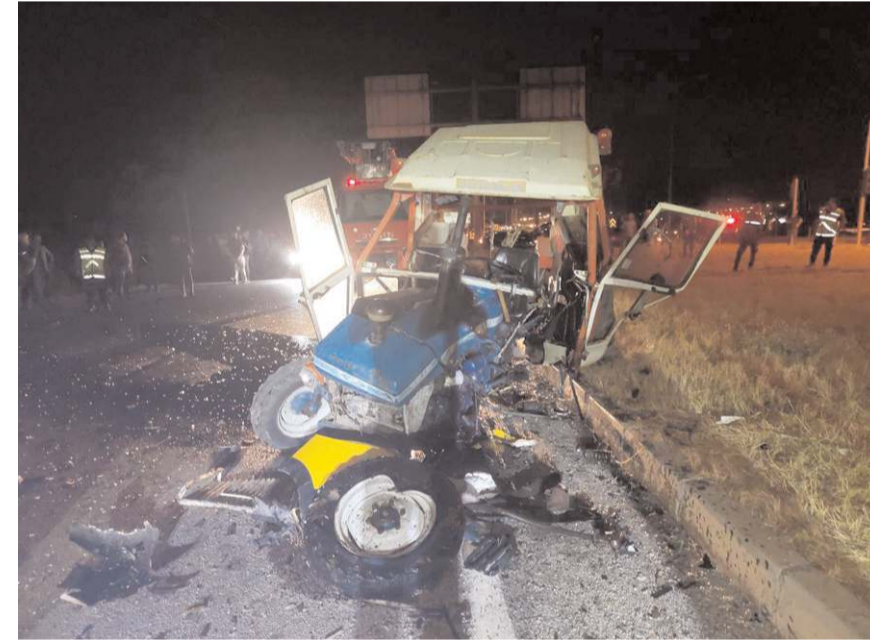
Kaza nedeniyle ulaşım kapanan yolda yaklaşık 2 kilometre araç kuyruğu oluştu.