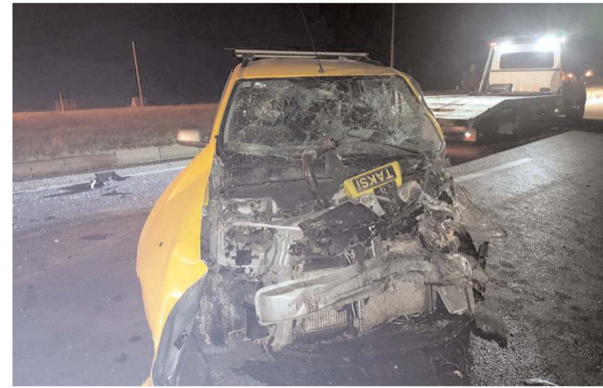
S.K. idaresindeki 19 LD 803 plakalı traktör taksi ile çarpıştı.

Kaza nedeniyle ulaşım kapanan yolda yaklaşık 2 kilometre araç kuyruğu oluştu. Kazaya karışan araçların kaldırılması ve traktörden sızan yağın Alaca Belediyesi ekiplerince temizlenmesinin ardından yol tekrar ulaşımına açıldı. (AA)