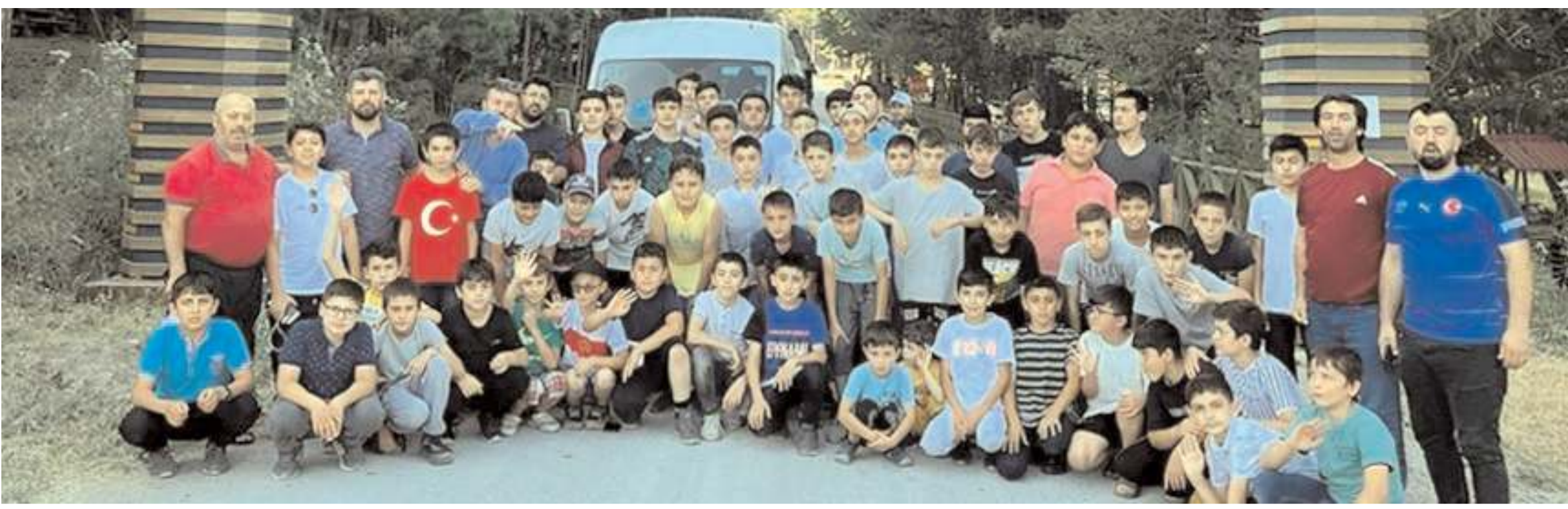
İskilip Müftülüğüne bağlı Ebussuud Efendi Kur'an Kursu hafızlık öğrencileri, piknikte buluştu.