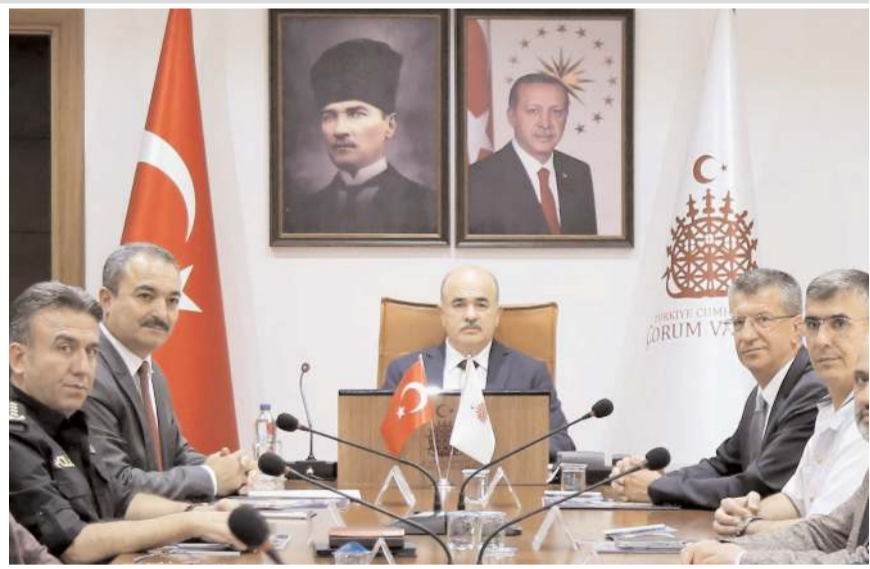
Valilikte "Üniversite Güvenlik Toplantısı" gerçekleştirildi.

Hitit Üniversitesi'nin yerleştirme oranının yüzde 100 olduğunu ve hiçbir öğrencinin açıkta kalmayacağını belirten Vali Dağlı, "Yurtlarımızda kalacak öğrencilerimize bir aile sıcaklığında barınma imkânı sağlamak için gereken tüm hazırlıkların tamamlandı. Gençlerimize barınma ve beslenme hizmetleriyle beraber ders dışı