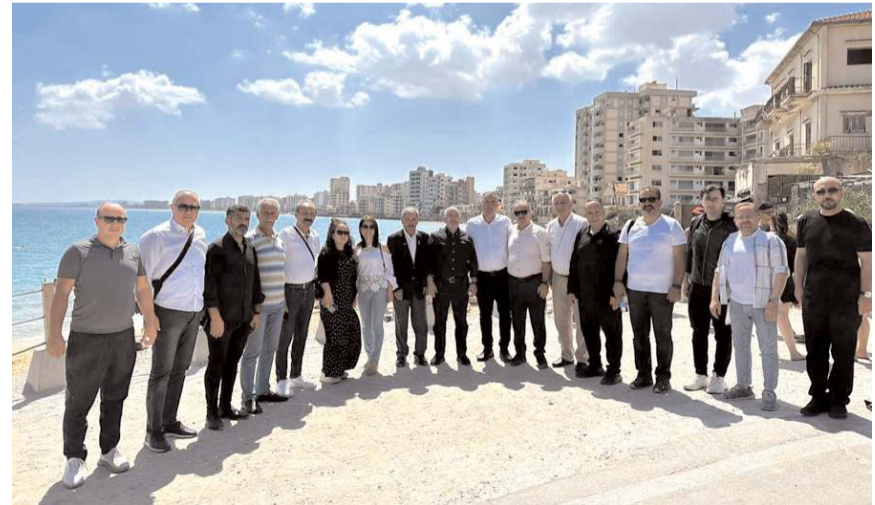
Heyet Kapalı Maraş bölgesini gezdi.