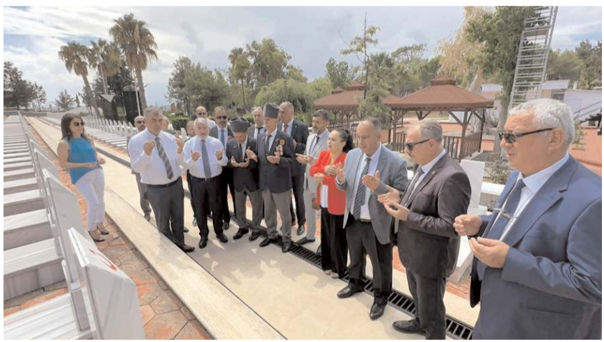
Çorum heyeti Boğaz Şehitliği'ni ziyaret etti.