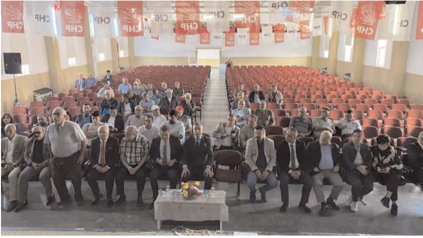
Kongrede yeni yönetim belirlendi.