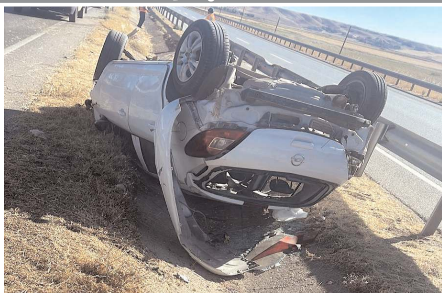
Kaza, Sungurlu-Kırıkkale karayolu İnegazili kavşağı yakınında meydana geldi.

Kazayla ilgili olarak başlatılan soruşturmanın devam ettiği bildirildi. (İHA)