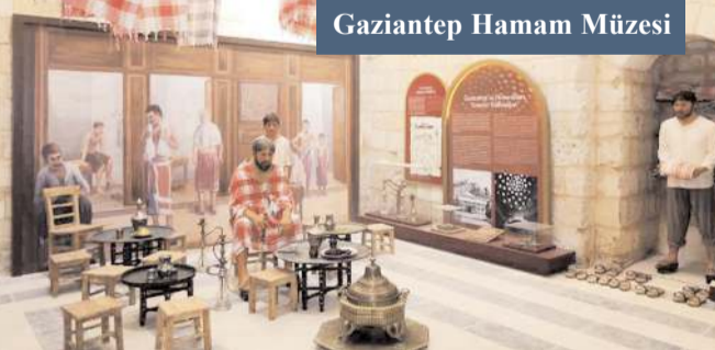
Gaziantep Hamam Müzesi

ça ile hamama giderlerdi. Bohça içinde; hamam taşı, tarak, sabun, lif, kese ve kil olurdu. Kil, saçın açılmasını kolaylaştırdığı için önceden islatılırdı. "Hamama gidecek kadın akşamdan kilini islatır" sözü bu geleneğin ürettiği atasözüdür. Kadınlar gün boyu hamamda kalırlar; pazar ekmeği, pervede, pekmez, mayalı, çörek götürmeyi de ihmal etmezlerdi. Hele bir de bütün turşu varsa hamam sefasına doyum olmazdı. Göbek taşına serilen örtü üzerinde do-