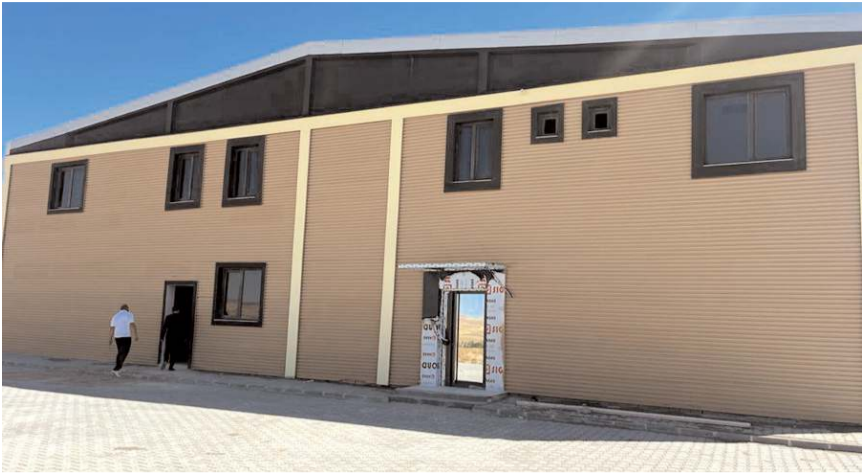
Gıda kurutma tesisinin inşaatı hızla devam ediyor.