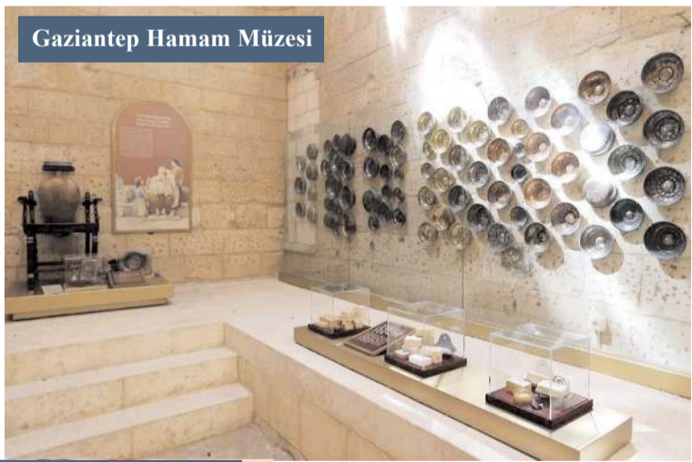
Gaziantep Hamam Müzesi

ça ile hamama giderlerdi. Bohça içinde; hamam taşı, tarak, sabun, lif, kese ve kil olurdu. Kil, saçın açılmasını kolaylaştırdığı için önceden islatılırdı. "Hamama gidecek kadın akşamdan kilini islatır" sözü bu geleneğin ürettiği atasözüdür. Kadınlar gün boyu hamamda kalırlar; pazar ekmeği, pervede, pekmez, mayalı, çörek götürmeyi de ihmal etmezlerdi. Hele bir de bütün turşu varsa hamam sefasına doyum olmazdı. Göbek taşına serilen örtü üzerinde do-