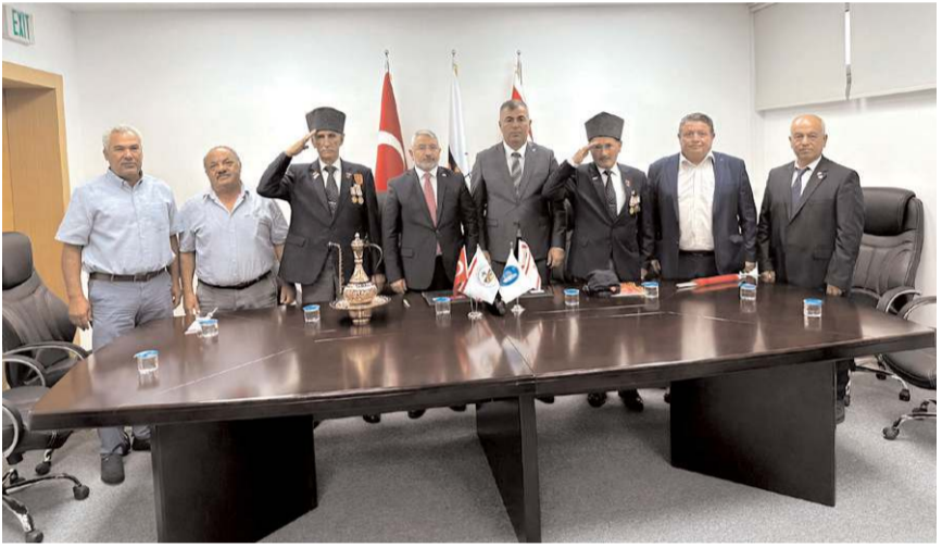
Çorum Belediyesi ile Beyarmudu Belediyesi'nin kardeşlik protokolü için imza töreni yapıldı.