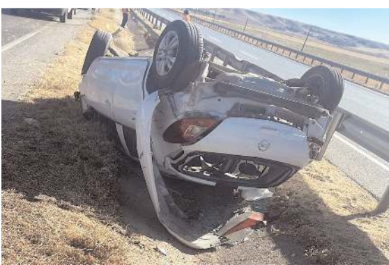
Kaza, Sungurlu-Kırıkkale karayolu İnegazili kavşağında meydana geldi.