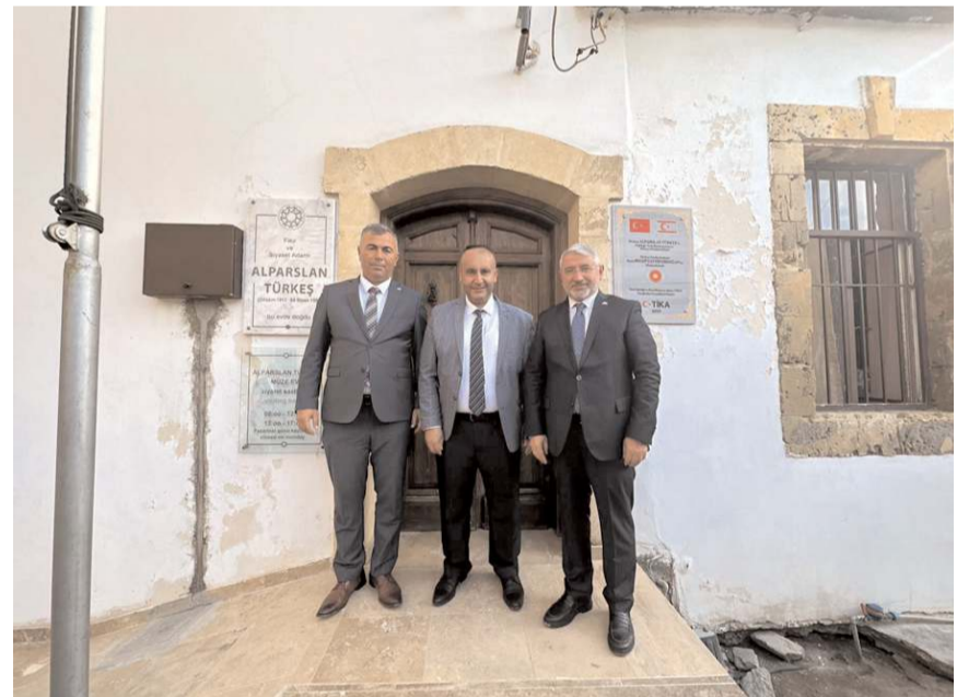
Çorum heyeti MHP'nin kurucu Genel Başkanı merhum Alparslan Türkeş'in doğduğu evi ziyaret etti.

Çorum heyeti ayrıca KKTC İçişleri Bakanı Dursun Oğuz'u, ülkemizin yetiştirdiği önemli fikir ve siyaset adamlarından, MHP'nin kurucu Genel Başkanı merhum Alparslan Türkeş'in doğduğu evi ve KKTC Kurucu Cumhurbaşkanı merhum Rauf Denktaş'ın anıt mezarını da ziyaret etti. (Haber Merkezi)