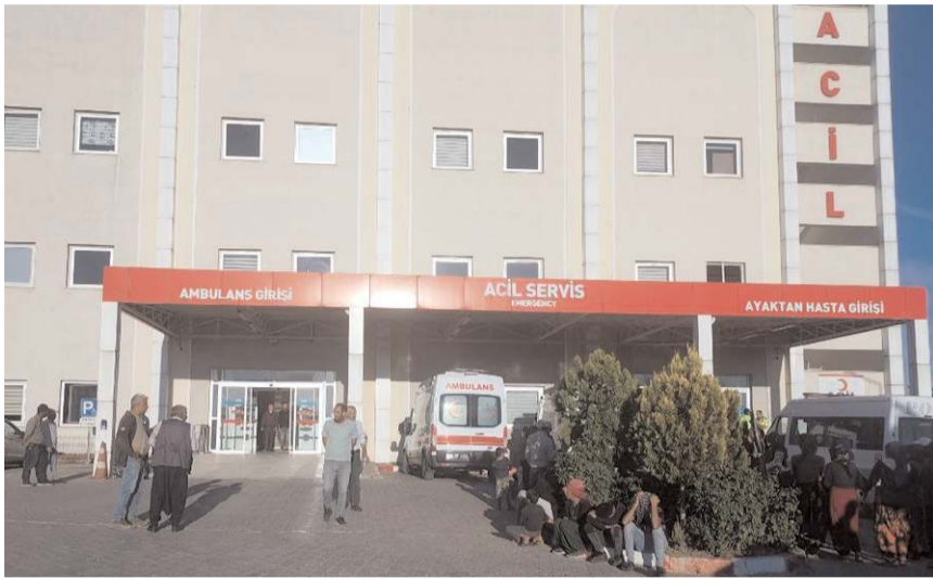
Çocuk hastanede hayatını kaybetti.

Alaca'da soğan patozunun tekerinin altında kalan 7 yaşındaki çocuk öldü.