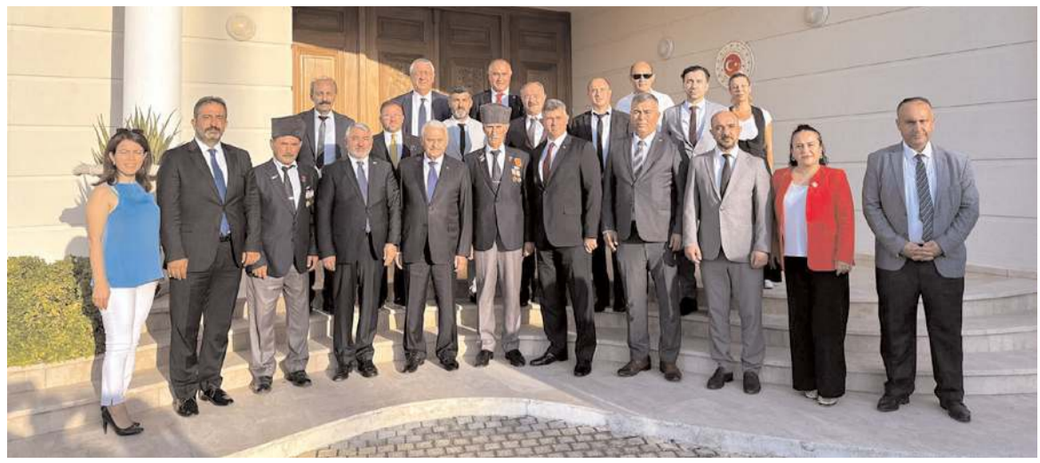
Çorum heyeti eski Başbakan ve AK Parti Genel Başkan Vekili Binali Yıldırım ile buluştu.

rumlu kahraman Gazilere bir kez daha teşekkür ederek, "Belediye olarak, Kıbrıs Gazilerimizin her zaman yanındayız. Vatanimize ve milletimize verdiğiniz fedakâr hizmetlerini için tekrar teşekkür ederim. Ülkeimizin birlik ve beraberliği için verdiğiniz bu önemli katkı asla unutmayacak" dedi.