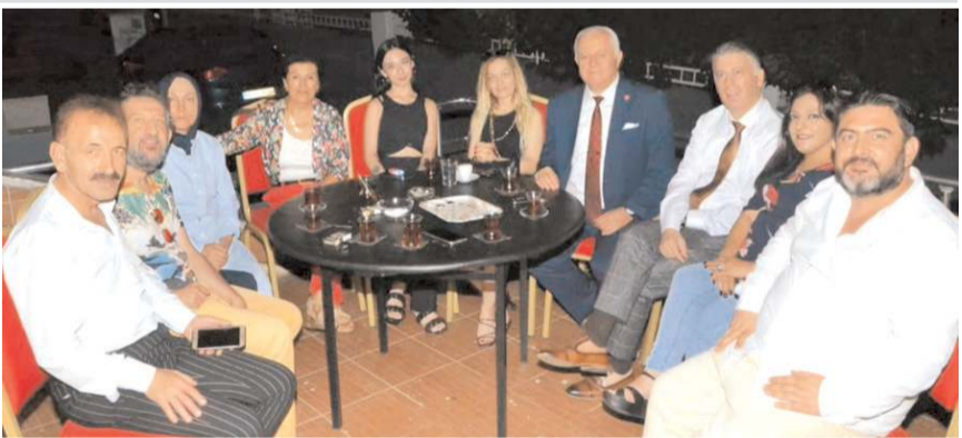
Dizinin çekimleri 1 Ekim'de İstanbul'da başlayacak.