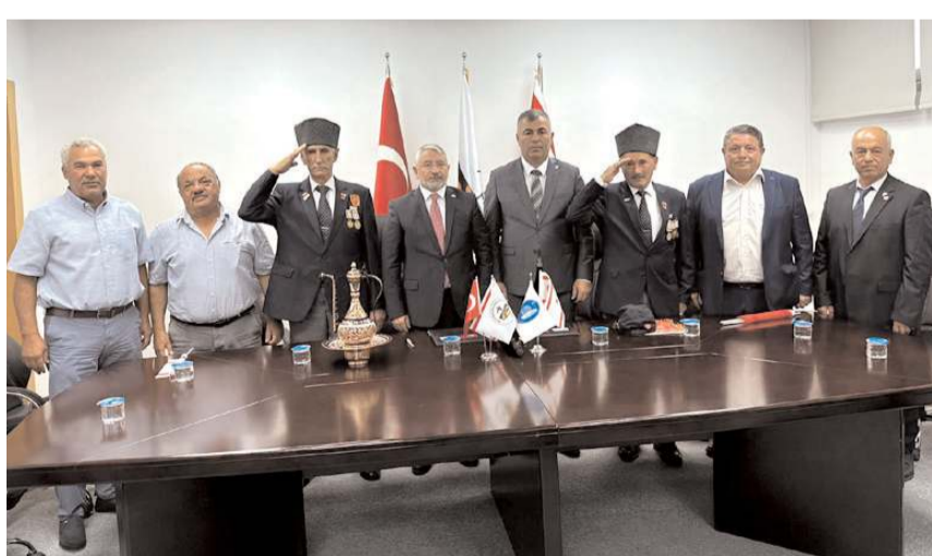
Çorum Belediyesi ile Beyarmudu Belediyesi'nin kardeşlik protokolü için imza töreni yapıldı.

Çorum Belediyesi ile Beyarmudu Belediyesi resmen kardeş oldu. İki belediye arasındaki kardeşlik protokolü düzenlenen törenle imzalandı.