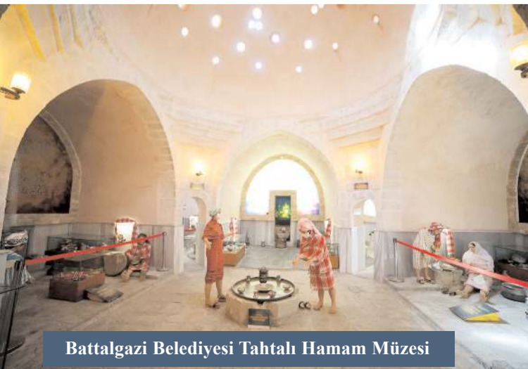
Battalgazi Belediyesi Tahtalı Hamam Müzesi