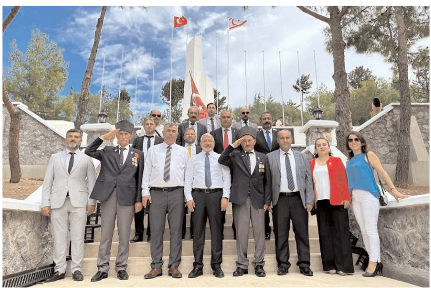
Ziyaretin ardından hatıra fotoğrafı çekildi.

rumlu kahraman Gazilere bir kez daha teşekkür ederek, "Belediye olarak, Kıbrıs Gazilerimizin her zaman yanındayız. Vatanimize ve milletimize verdiğiniz fedakâr hizmetlerini için tekrar teşekkür ederim. Ülkeimizin birlik ve beraberliği için verdiğiniz bu önemli katkı asla unutmayacak" dedi. (Haber Merkezi)