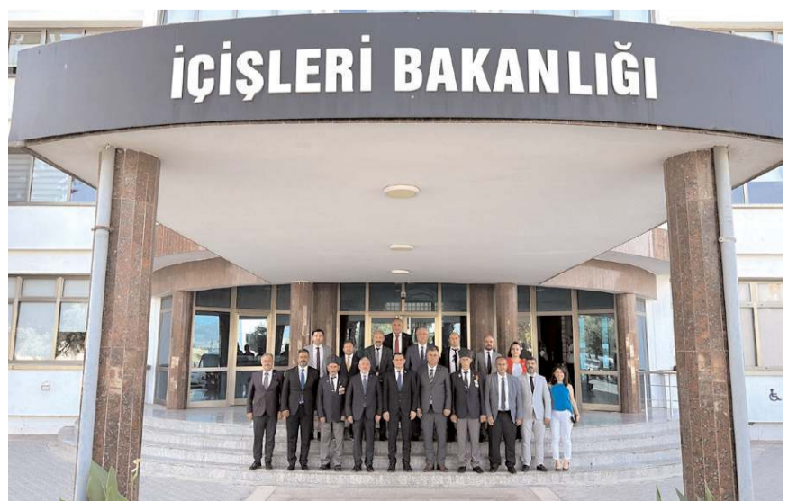
Çorum heyeti KKTC İçişleri Bakanı Dursun Oğuz'a ziyarette bulundu.