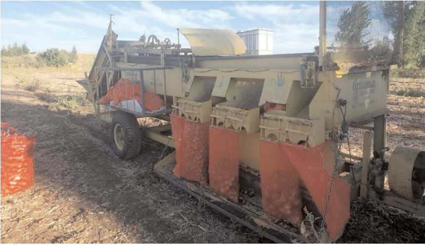
Olay Alaca Ali Rıza Demirhan Sokak'ta bir tarlada meydana geldi.