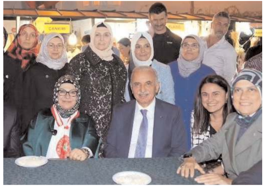
Festivali Ümraniye Belediyesi düzenledi.