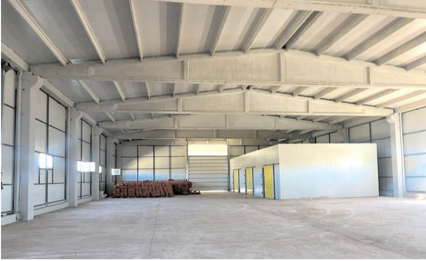
Fabrika OSB'de tahsis edilen 16 dönüm araziye kuruluyor.