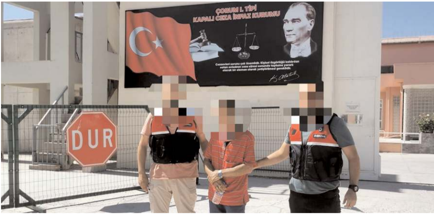
Aranan şahıslar yakalanarak adli makamlara teslim edildi.

Jandarma ekipleri çeşitli suçlardan aranan şahısların yakalanmasına yönelik çalışma başlatıldı.