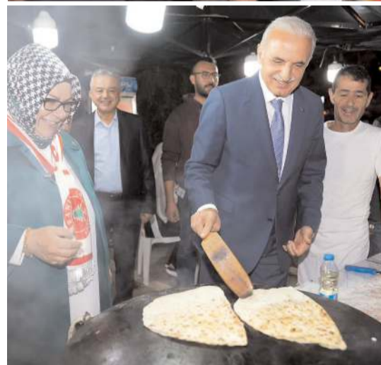
Festivalde yöresel yemekler tanıtıldı.