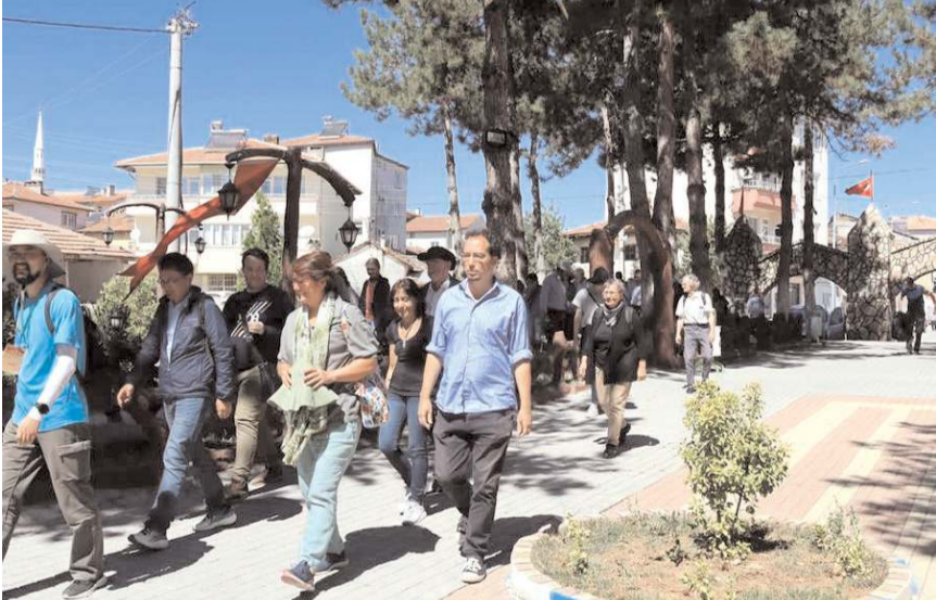
Uluslararası Ortaköy-Şapınuva Çalıştayı için Çorum'a gelen akademisyenler Ortaköy'ü gezdi.

Hitit Üniversitesi tarihleri düzenlenen Şapınuva Çalıştayı'na katılmak üzere Çorum'a gelen akademisyenler Ortaköy'ü gezdi.