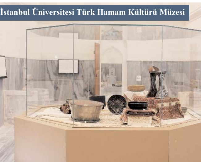
İstanbul Üniversitesi Türk Hamam Kültürü Müzesi

Hamamda gün boyu çay servisi olur; çaycı, hamam içinde köşe bucak koşuştururdu. Kimi, demli ve kesme şekerli çay, kimi de limonlu kant isterdi. Kırmızı beyaz desenli seramik tabak içinde ocaktaki buharıyla getirilen sıcak su bardağına yarım dilimlik limon, posası çıkıncaya ve bardağın yüzeyinde limon lifleri görünmeye kadar sıkılır, parmaklar arasında kalan limon suyu hararetili dudaklarla buluş-