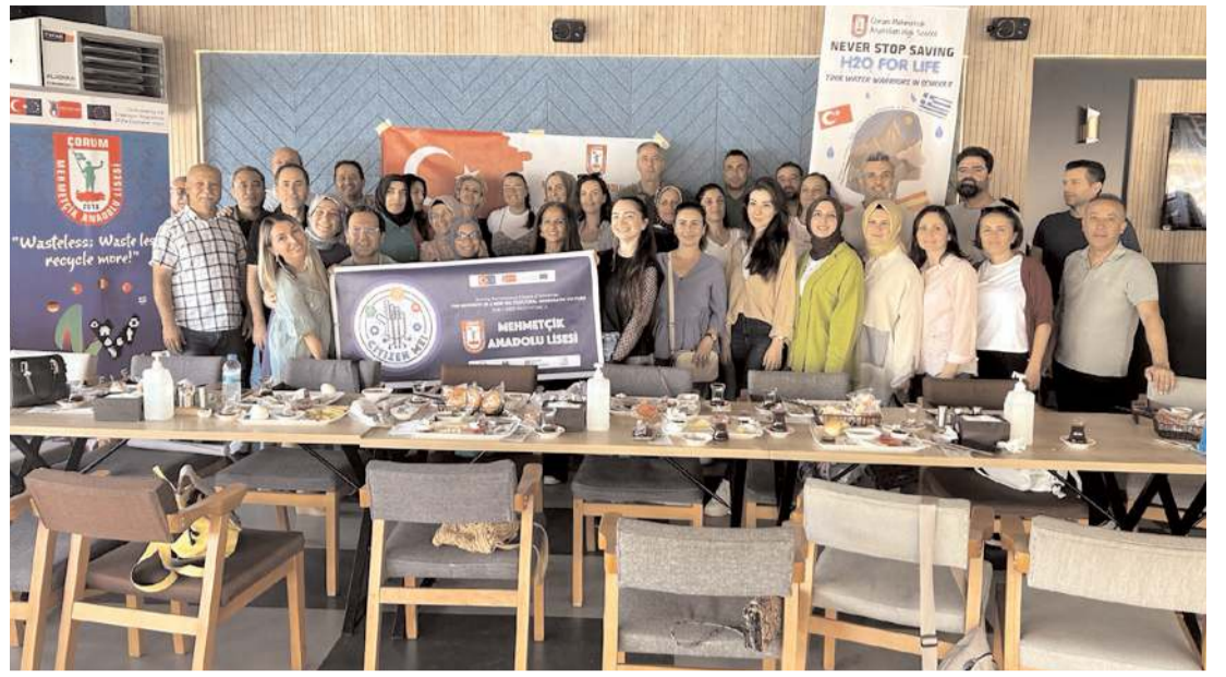
Yaptığı AB prokeleri ile dikkat çeken Mehmetçik Anadolu Lisesi yeni dönemi istişare etti.