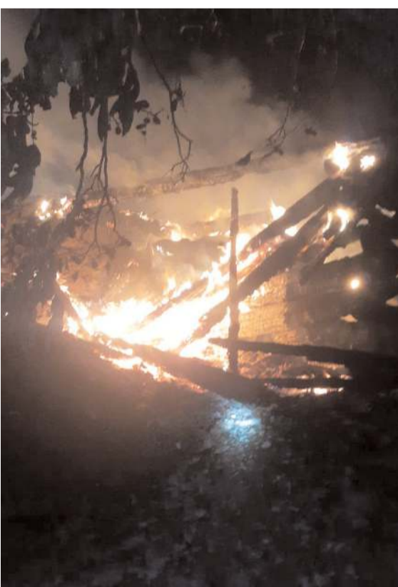
Olay Kunduzlu köyünde meydana geldi.