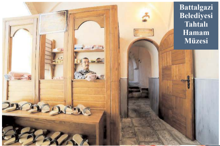
Battalgazi Belediyesi Tahtalı Hamam Müzesi

Türkiye'de çok güzel Hamam Müzeleri olduğunu ifade eden Tuluk, bunlara; Gaziantep Hamam Müzesi, Beypazarı Türk Hamam Kültürü Müzesi, İstanbul Üniversitesi Türk Hamam Kültürü Müzesi, Eskişehir Hamam Müzesi, Battalgazi Belediyesi Tahtalı Hamam Müzesi ile Eyüpsultan Türbe Hamamı Müzesini örnek gösterdi.