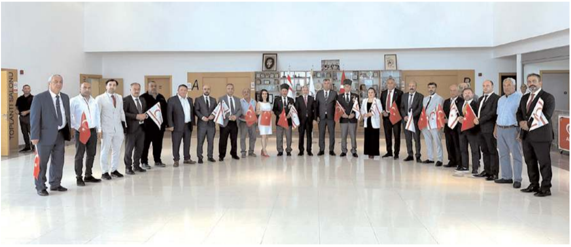
İmza töreninin ardından toplu hatıra fotoğrafı çekildi.