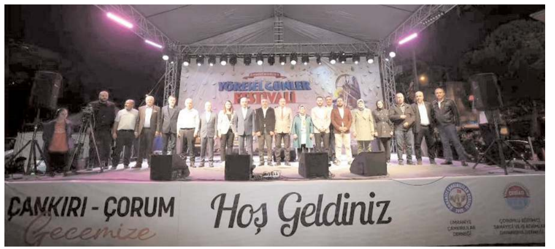
'Yöresel Günlere Festivali' kapsamında dün Çorum-Çankırı gecesi düzenlendi.