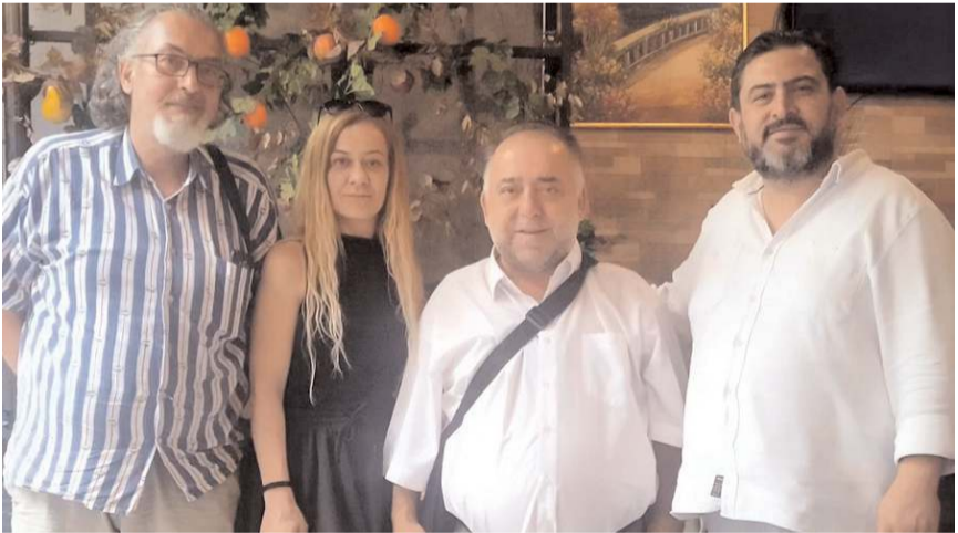
İstanbul'da başlayacak dizi çekimleri daha sonra Çorum'da devam edecek.