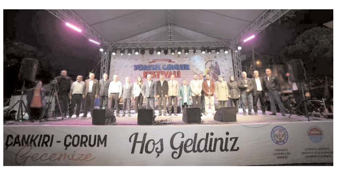
'Yöresel Günler Festivali' kapsamında dün Çorum-Çankırı gecesi düzenlendi.