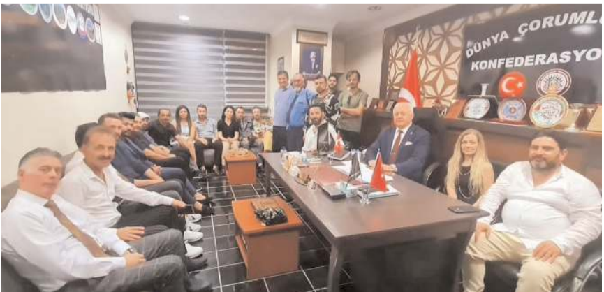
Dizi ekibi Dünya Çorumlular Konfederasyonu'nu ziyaret etti.