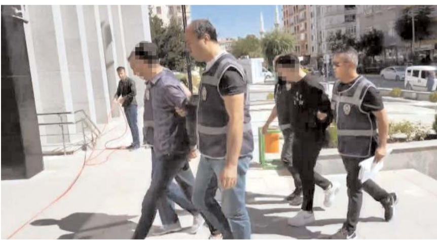
Şüpheliler Sivas'ın Yıldızeli ilçesinde yakalanarak Çorum'a getirildi.

Gözaltına alınan şahıslar, Çorum Emniyet Müdürlüğündeki işlemlerinin ardından adliyeye sevk edildi. (İHA)