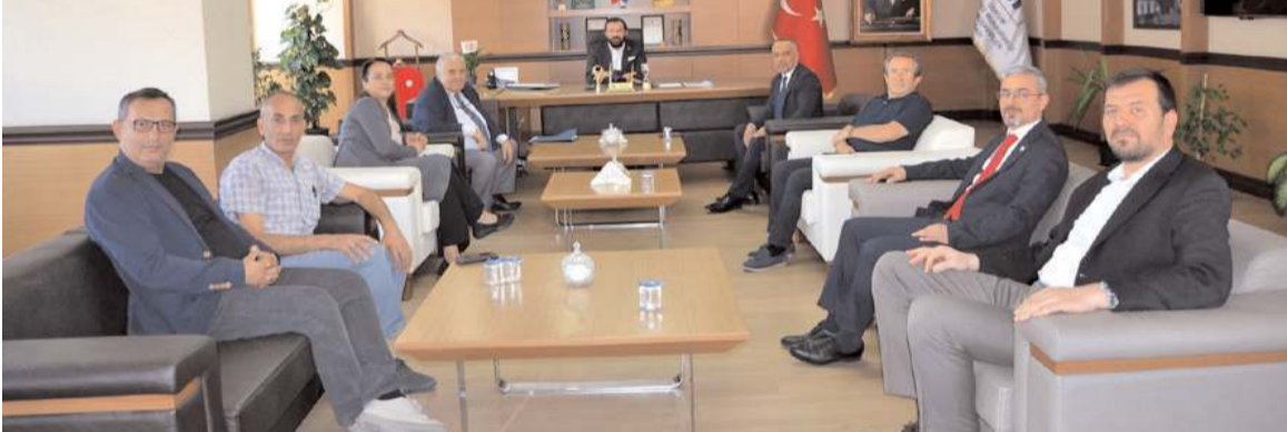
Ziyarette mesleki sorunlar konuşuldu.