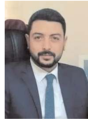
Av. Utku Ulaş Taşar