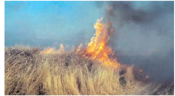
Yangın Sarsüleyman mevkiinde çıktı.

Kongrede 417 delegenin oy kullanacağı öğrenildi.