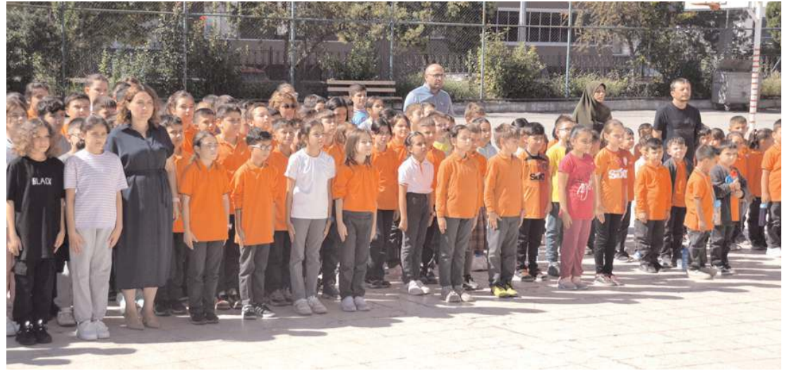
Kutlama programı Atatürk İlkokulu bahçesinde devam etti.