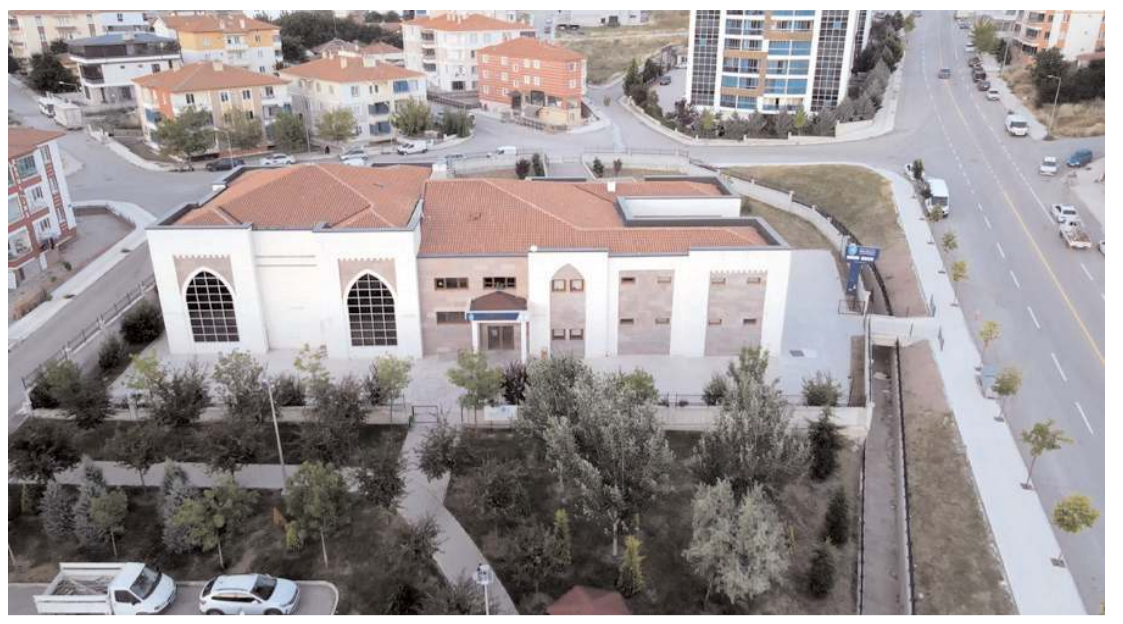
Atölye Melikgazi Kadın Kültür Merkezi'nde açılacak.

Türkiye genelinde diğer konut satışları Ağustos ayında bir önceki yılın aynı ayına göre %4,3 artarak 105 bin 716 oldu. Toplam konut satışları içinde diğer satışların payı %86,6 olarak gerçekleşti. Ocak-Ağustos döneminde gerçekleşen diğer konut satışları ise bir önceki yılın aynı dönemine göre %11,9 azalışla 644 bin 980 oldu. (Haber Merkezi)