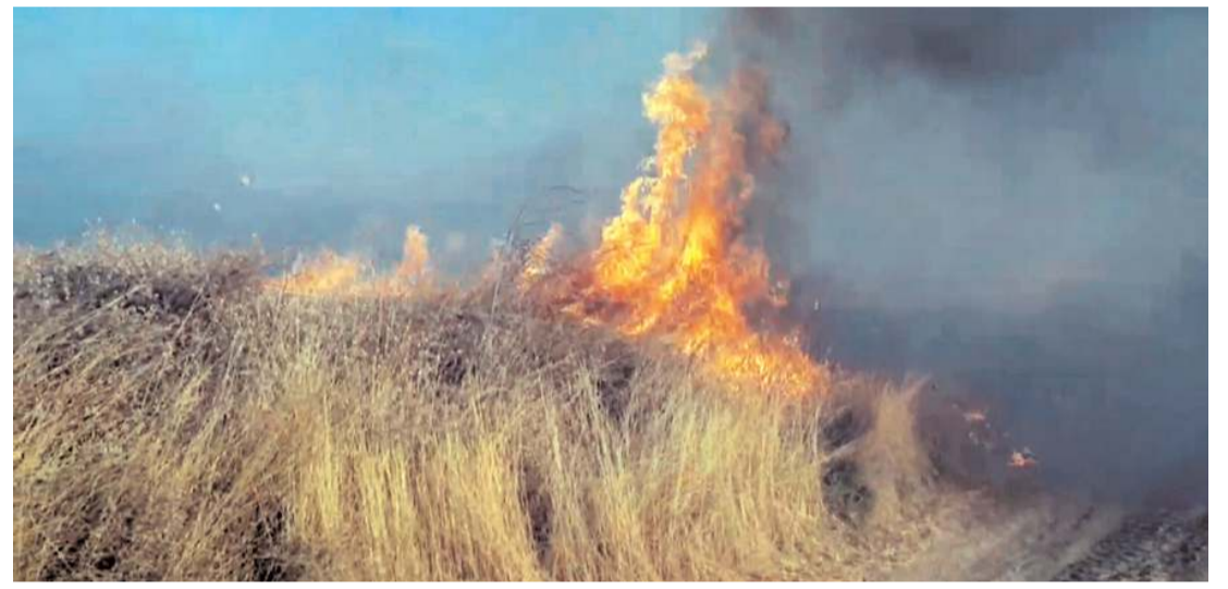
Yangın Sarısüleyman mevkiinde çıktı.

Hakimiyet, merhumeye Allah'tan rahmet, ailesine ve yakınlarına başsağlığı diler.