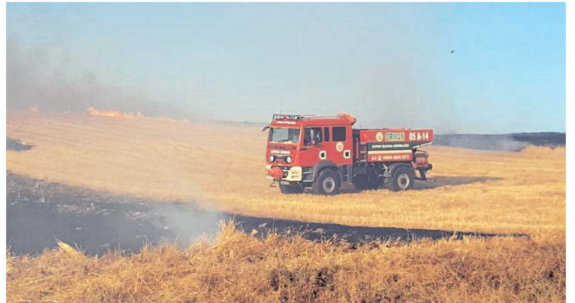
Yangın çok geniş bir alanda etkili oldu.