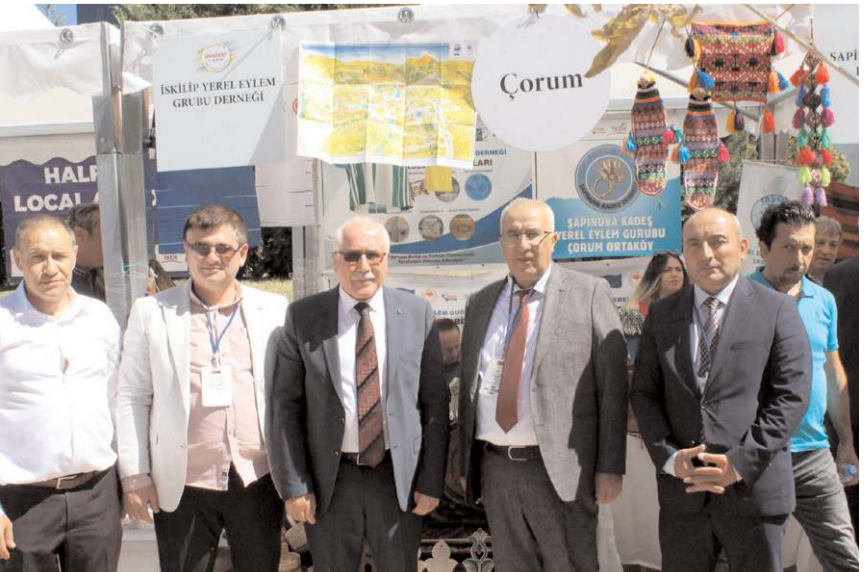
Fetivale İskilip Yerel Eylem Grubu Derneği katıldı.