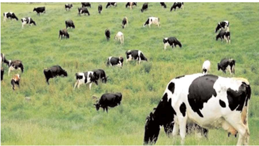
Proje kapsamında Çorum'da 5 adet hayvan gölgeği ve 5 adet kaşınma kazığı yapılacak.

Türkiye Dayanıklı Peyzaj Entegrasyonu Projesinde Çorum'da bulunuyor.