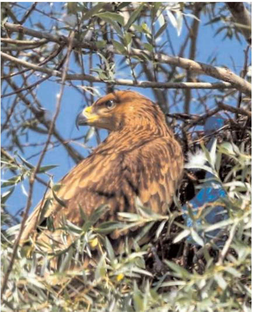
Nesli tehlike altında olduğu belirtilen şah kartalının Çorum'da 2 yuvada yavrulduğu bildirildi.

Açıklamada, şah kartalının IUCN tarafından nesli tehlike altında bulunması dolayısıyla kırmızı listede yer aldığı, Türkiye'nin türün korunmasında özel öneme sahip olduğu bildirildi.(AA)