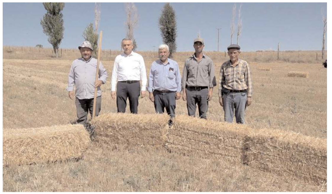
Çorum Belediyesinin buğday hasadından kalan samanlar hayvancılık yapan ihtiyaç sahibi ailelere verildi.