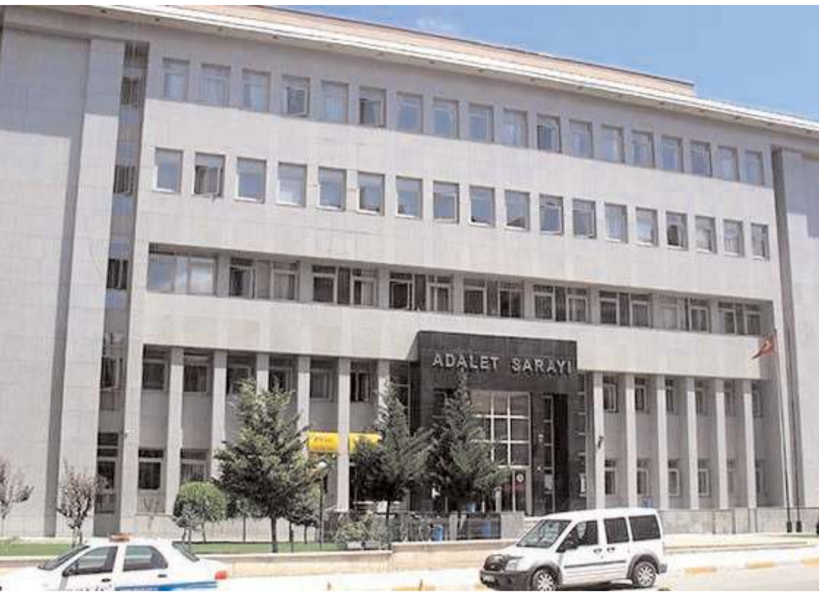
Şüpheli T.Ö., sevk edildiği Sulh Ceza Hakimliğince tutuklandı.