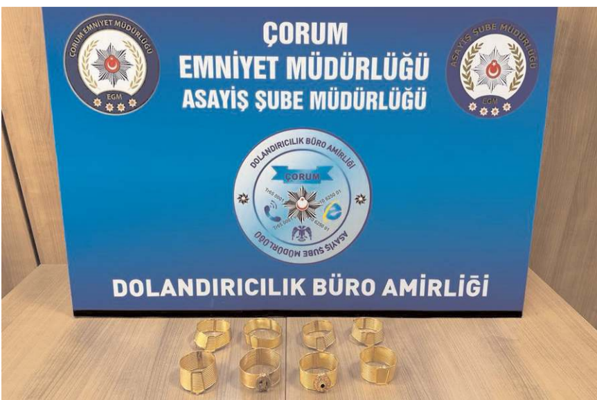
Şüphelilerin kullandığı sahte altın kelepçeler de ele geçirildi.