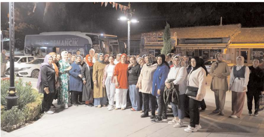
Kapadokya Kültür Gezileri'ne 1050 kişi katıldı.

Gelgör, farklı bölgelere kültür gezileri düzenlemeye devam edeceklerini kaydetti. (AA)