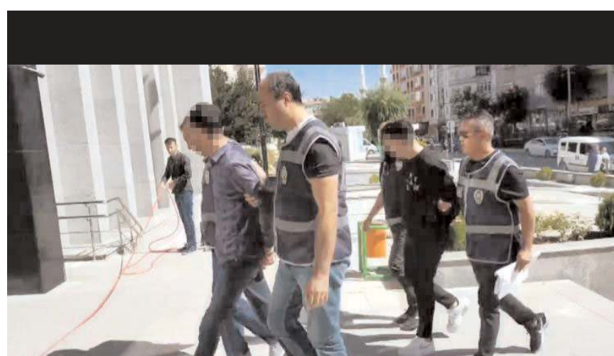
Şüpheliler Sivas'ın Yıldızeli ilçesinde yakalanarak Çorum'a getirildi.