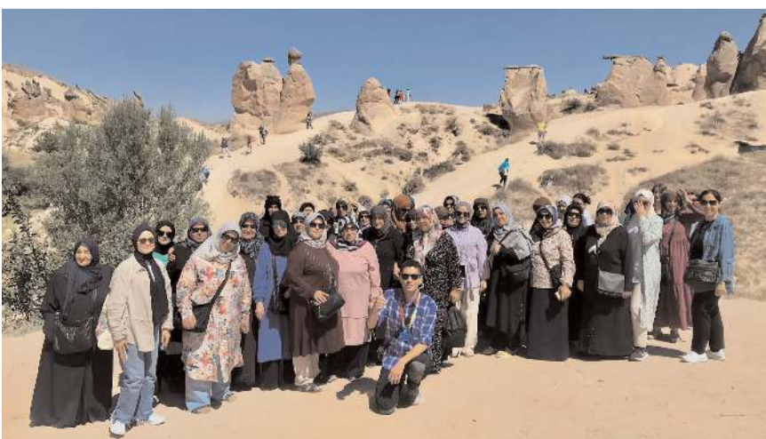
Kadınlar, Kapadokya'da peri bacalarını, Göreme Açık Hava Müzesi'ni, Ürgüp'ü, Avanos'u ve Uçhisar Kalesi'ni görme fırsatı buldular.