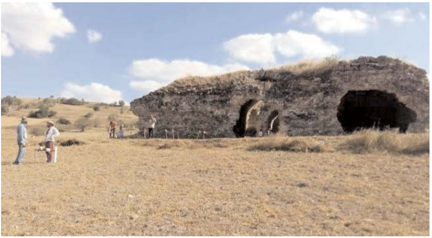
Kalehisar Ören Yeri kazı çalışmaları devam ediyor.

5510 sayılı kanunun 4. Maddesinin 1. Fıkrasının (b) bendinin 4 numara alt bendi kapsamında tarımsal faaliyette bulunanlar ile aynı kanunun ek 5. kapsamında tarım veya orman işlerinde hizmet akdi ile süreksiz olarak çalışan kişiler TYP den yararlanabilir. (Haber Merkezi)