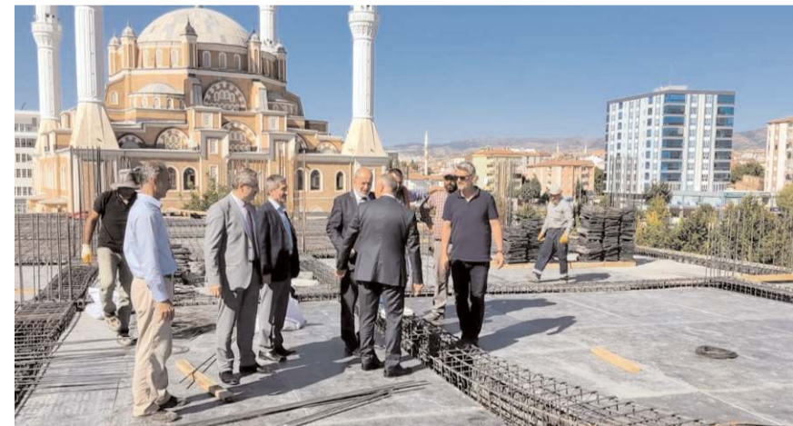
Kurs binası 1000 m2 kapalı alana sahip.

Yıl sonunda restorasyonu tamamlanarak yeniden ibadete açılması hedeflenen Ulucami'de restorasyon çalışmalarını yerinde inceledi.