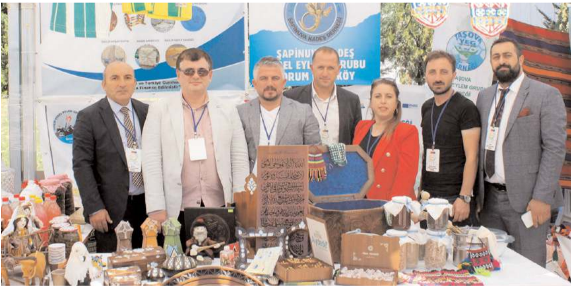
Festival Tarım ve Orman Bakanlığı tarafından düzenlendi.