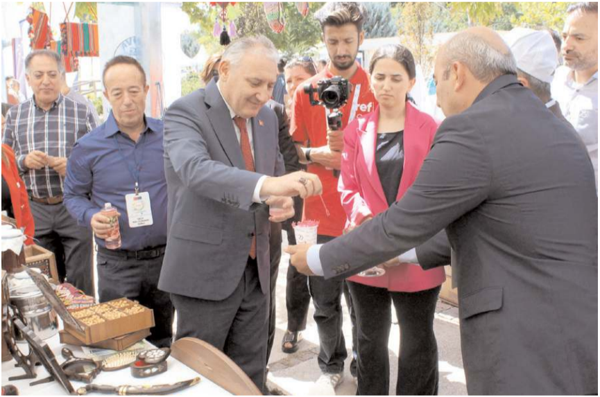
Festivalde İskilip'in yöresel yiyecekleri ve ürünleri tanıtıldı.