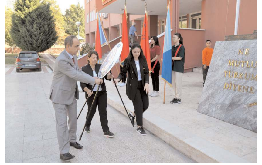
Hükümet binası önünde bulunan Atatürk Anıtı'na çelenk sunuldu.