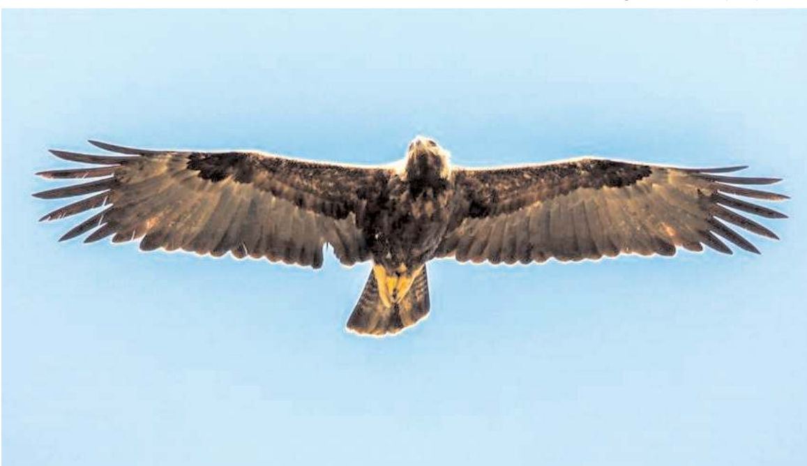
Şah kartalın Türkiye'deki popülasyonunun 50-80 çift olduğu tahmin ediliyor.