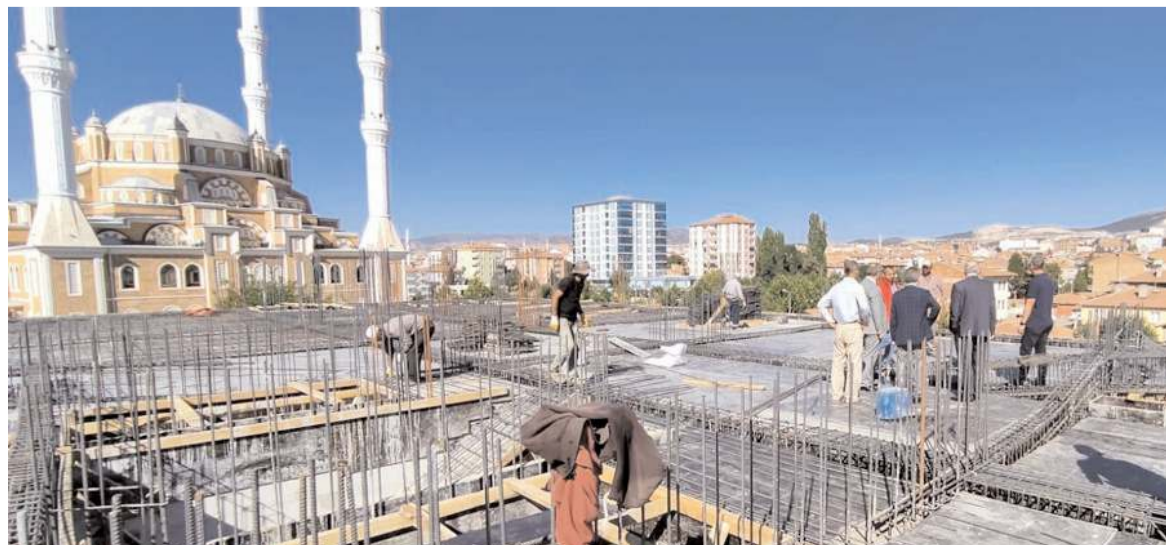
Kuran Kursu binası 5 kattan oluşuyor.

Yıl sonunda restorasyonu tamamlanarak yeniden ibadete açılması hedeflenen Ulucami'de restorasyon çalışmalarını yerinde inceledi.