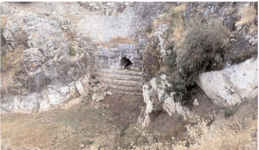
Örükaya Barajının 2 bin yıllık bir geçmişi bulunuyor.