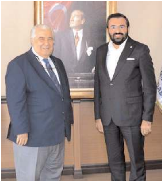
Ziyarete mesleki sorunlar konuşuldu.