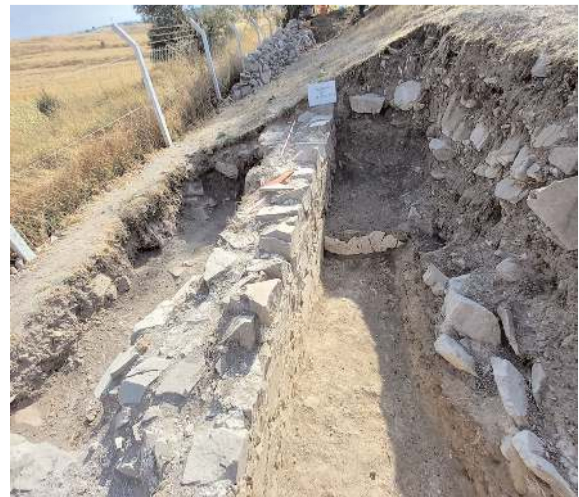
Kazı çalışmaları 3 yıldır devam ediyor.