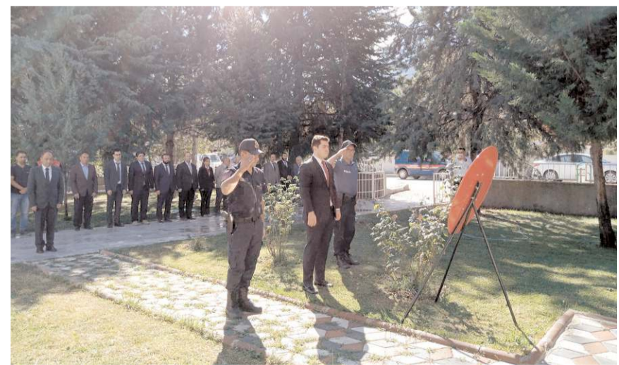
Hükümet Konağı önündeki Atatürk Anıtı'na çelenk sunuldu.

Kaymakam Çelebi, törenin ardından gazileri makamında ağırladı.(AA)