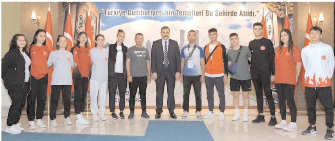
Çorum Taekwondo kafilesi Vali Mustafa Çiftçi'yi ziyaretinde toplu halde görüldü