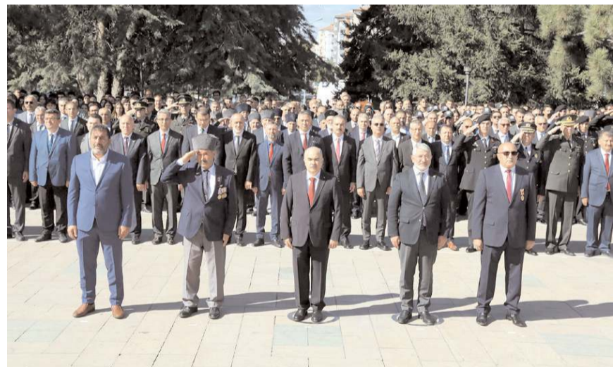
Programda saygı duruşunda bulunularak İstiklal Marşı okundu.