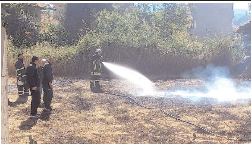
Yangın Güney Mahallesi Atatürk Caddesi üzerinde bulunan bir evin bahçesinde çıktı.

Edinilen bilgiye göre, öğle saatlerinde Güney Mahallesi Atatürk Caddesi üzerinde bulunan bir evin bahçesinde yangın çıktı. Henüz belirlenemeyen bir nedenle çıkan yangında evin bahçede bulunan kuru otlar yanmaya başladı. Hızla yayılan yangın nedeniyle mahalle biranda dumanlar içinde kalınca çevrede bulunan vatandaşlar korku dolu anlar yaşadı. Yükselen alevler hızla