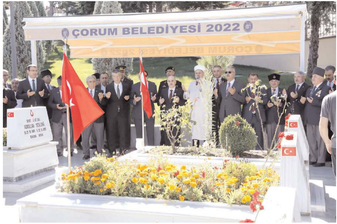
Programda şehitler ve vefat etmiş gaziler için dua edildi.

Tören Kur'an-ı Kerim tilavetini okuması ve ebediyete intikal etmiş tüm şehitler için dua edilmesi ile sona erdi.