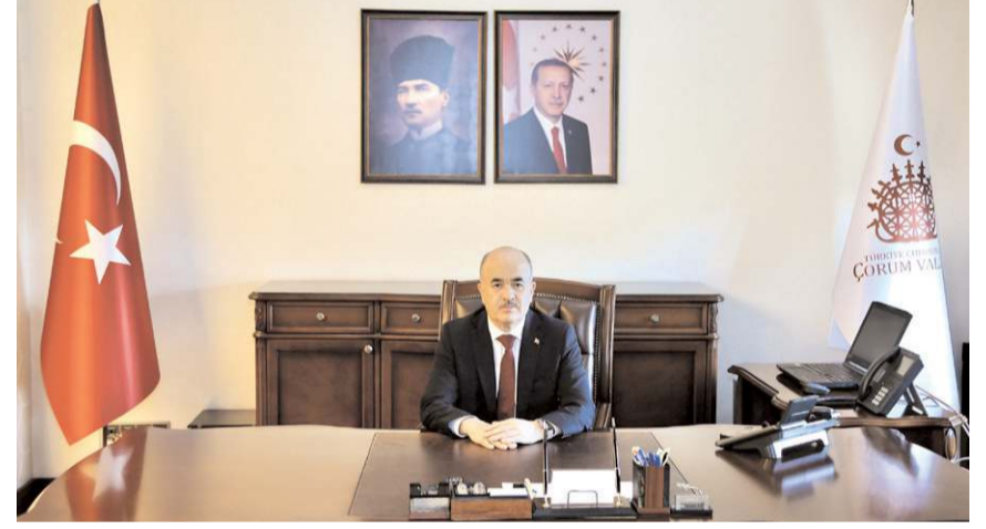
Vali Doç. Dr. Zülkif Dağlı

"Sayın Valimizin Düzce'de OSB ve sanayicilerle ilgili çalışmalarını ve desteğini biliyoruz, sanayi şehri ve Anadolu kaplamı olarak tanınan Çorum için yeni Valimiz Dağlı bir şanstır. Uyuyan dev Çorum'un tekrar şahlanışa geçebilecektir. Tarım Orman Bakanlığı'ndan onay bekleyen OSB arazisi kalkınma öncelikli 5. Bölgedir. İskilip'e 5 km, Çan-