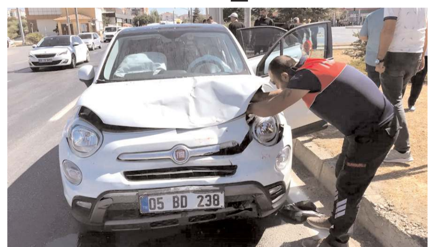
Kaza, Ocaklı Kavşağı'nda meydana geldi.

Kaza, Sungurlu-Kırıkkale Karayolu Ocaklı Kavşağı'nda meydana geldi. Edinilen bilgiye göre, Sungurlu'dan Çorum istikametine seyir halinde olan 05 BD 238 plakalı otomobil, kavşakta 06 MCT 86 plakalı otomobil ile çarpıştı. Meydana gelen kazada ölen ya da yaralanan olmazken, araçlarda maddi hasar meydana geldi. (İHA)