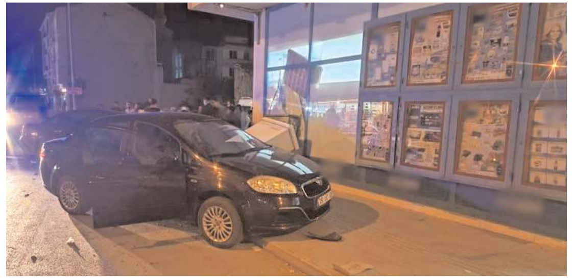
Kaza Zile Caddesi üzerinde meydana geldi.

Soğutma çalışmalarının sürdüğü yangının, anız temizliği için yakılan ateş sonucu çıkmış olabileceği değerlendiriliyor.(AA)