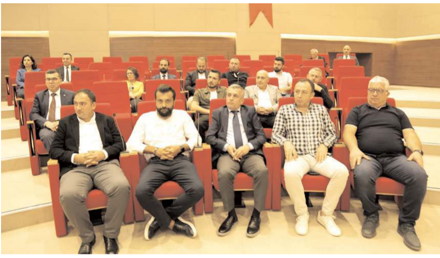
Toplantıya meclis üyeleri katıldı.