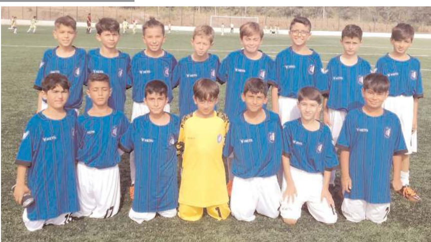
HE Kültürspor Alaca İtmat Sürüü Kursu önünde final için mücadele edecek