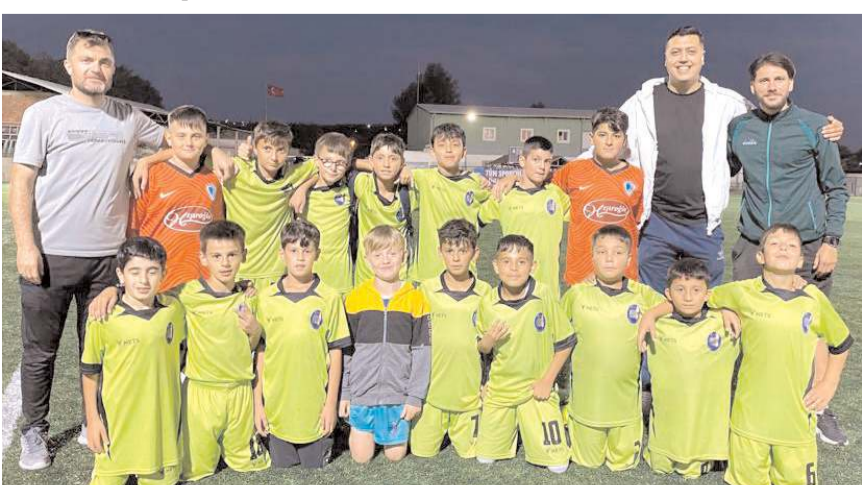
Mimar Sinan Gençlikspor bugün finale yükselmek için Vefaspor ile karşılaşacak