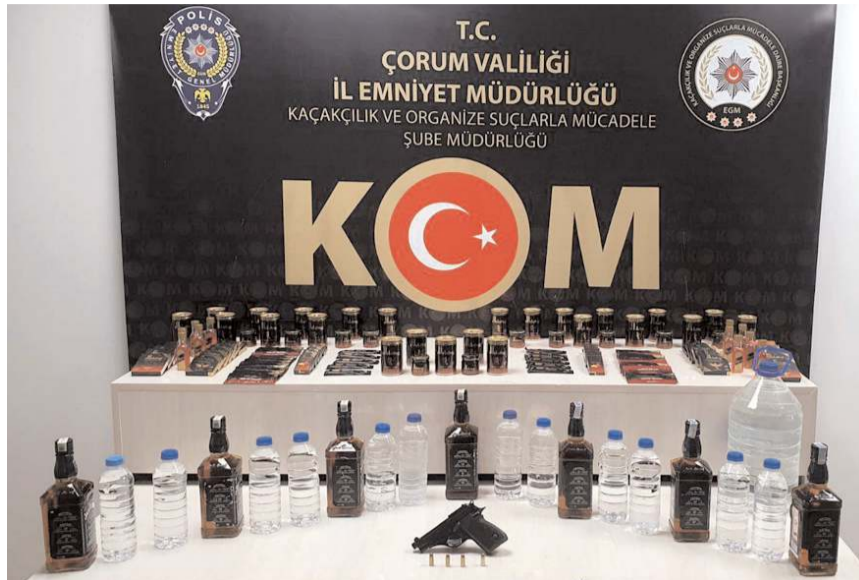
Polis ekipleri bir ayda düzenledikleri operasyonlarda 92 şişe kaçak alkol ve 21 litre kaçak alkol ele geçirdi.

lik suçu kapsamında 1 olay gerçekleşmiş, 1 şüpheli şahsa adli işlem yapılmıştır. Suç ve suçlunun her türlü süzümün ve takibine yönelik çalışmalarımız aralıksız olarak devam edecektir." (Haber Merkezi)