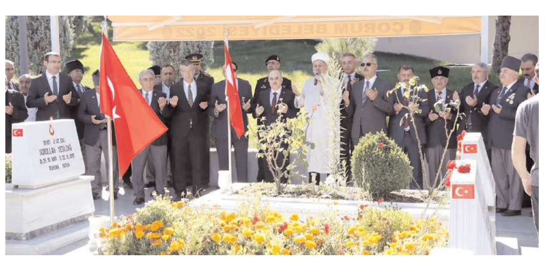
Programda şehitler ve vefat etmiş gaziler için dua edildi.