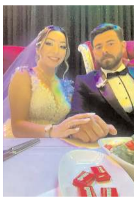
Sedar ile Seher dünya evine girdi.