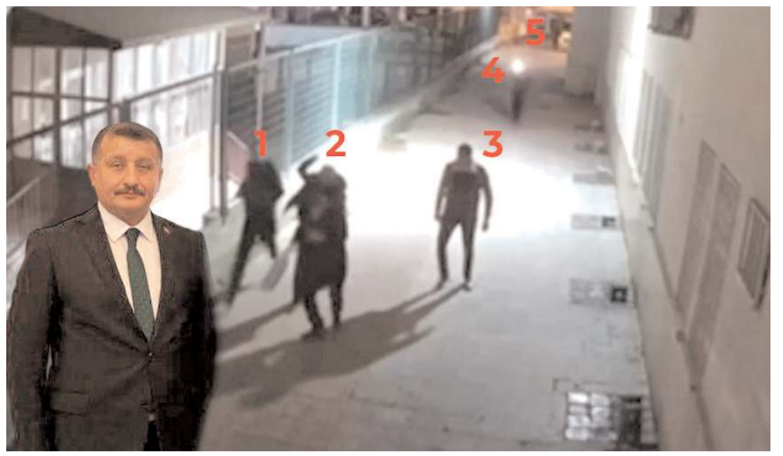
Samsun Bölge Adliyesi Mahkemesi, Çorum 2. Ağır Ceza Mahkemesinin verdiği kararı onadı.

layan milletimiz, her türlü zalim ve haine karşı her zaman dik durmuştur. Kahraman gazilerimiz ise milletimizin aydınlık meşalesi, övünç madalyasıdır. Milletimizin sarsılmaz inanç ve ilham kaynağıdır. Onlardan aldığımız güç ve ilhamla önümüze çıkan her türlü engeli birlik ve beraberlik içinde aşarak Türkiye Cumhuriyetimizi daha da aydınlık yarınlara hep birlikte taşımaya devam edeceğiz. Bu duygu ve düşüncelerle; 19 Eylül Gaziler Günü münasebetiyle başta Gazi Mustafa Kemal Atatürk'e ve ebediyete intikal etmiş tüm Gazilerimize Cenab-ı Allah'tan rahmet niyaz ediyoruz. Cesaretin, dirayetin, fedakârlığın ve kahramanlığın muazzam simgesi olan gazilerimize hürmetlerimi ve şükranlarımı sunuyoruz. Milletimizin 19 Eylül Gaziler Günü kutlu olsun." (Haber Merkezi)