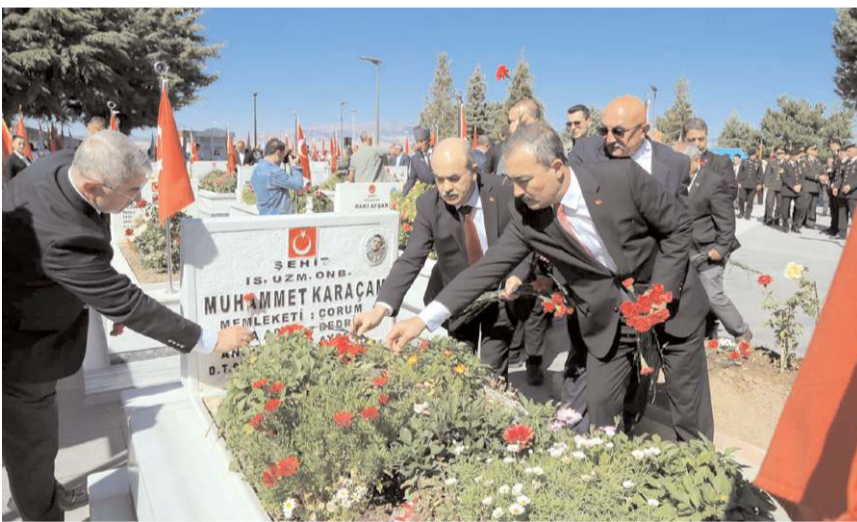
Protokol üyeleri şehit kabirlerine çiçek bıraktı.