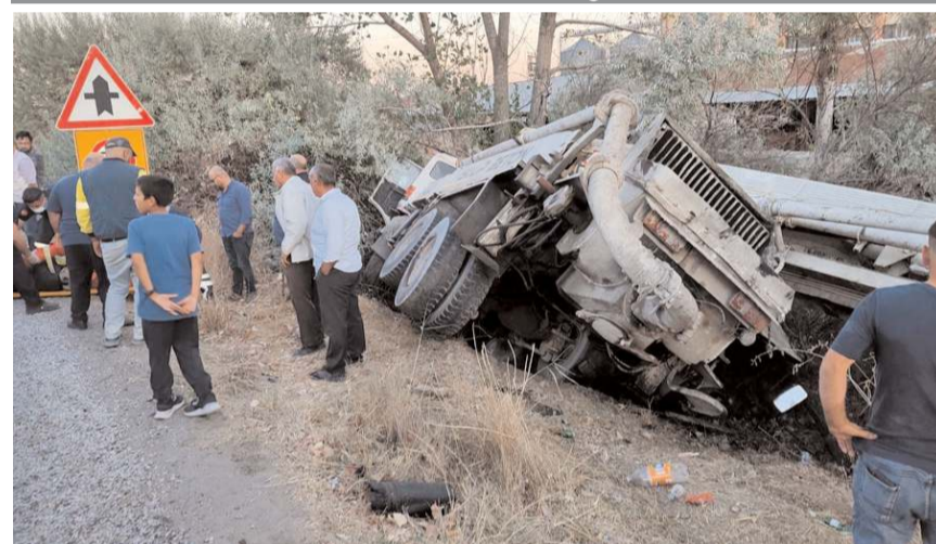
Kaza Bayat'ın Saray köyü yakınlarında meydana geldi.

Bayat'ta meydana gelen trafik kazasında 3 kişi yaralandı.