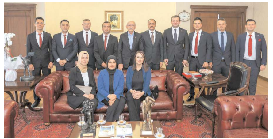
ATAUZDER Genel Başkanlığı Mustafa Gündeşli ve yönetim kurulu üyeleri CHP Genel Başkanı Kemal Kılıçdaroğlu'nu ziyaret etti.

Türk Silahlı Kuvvetleri'nde uzun yıllar hizmet vermiş olan biz eski uzman çavuşlar, atanma hakkımızı kullanmak ve kamu kurumlarına memur olarak