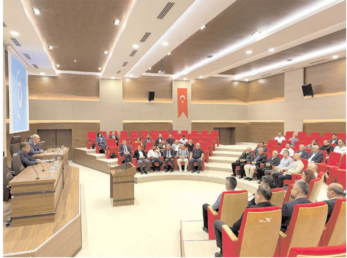
TSO Eylül ayı meclis toplantısında gündem maddeleri görüşülerek karara bağlandı.

Toplantının devamında gündemde yer alan konuların müzakere edilerek karara bağlandı.