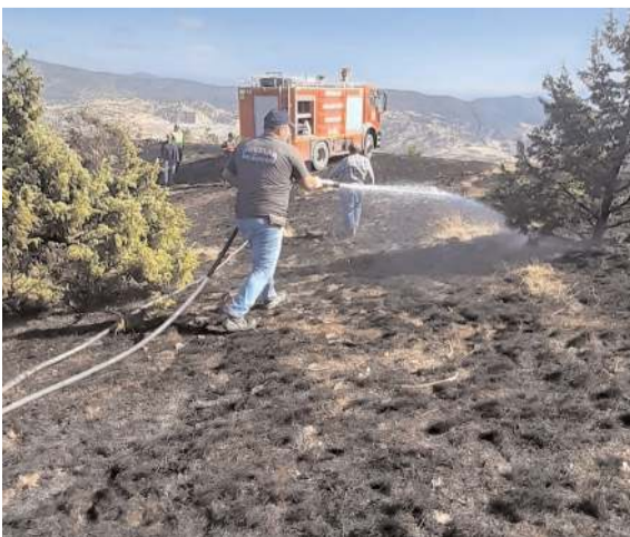
Yangın Kuyucak köyü Fındıkkırağı mevkinde çıktı.

Oğuzlar'da çıkan yangında, 10 dekar tarım arazisi ve bitişindeki ormanlık alan zarar gördü.