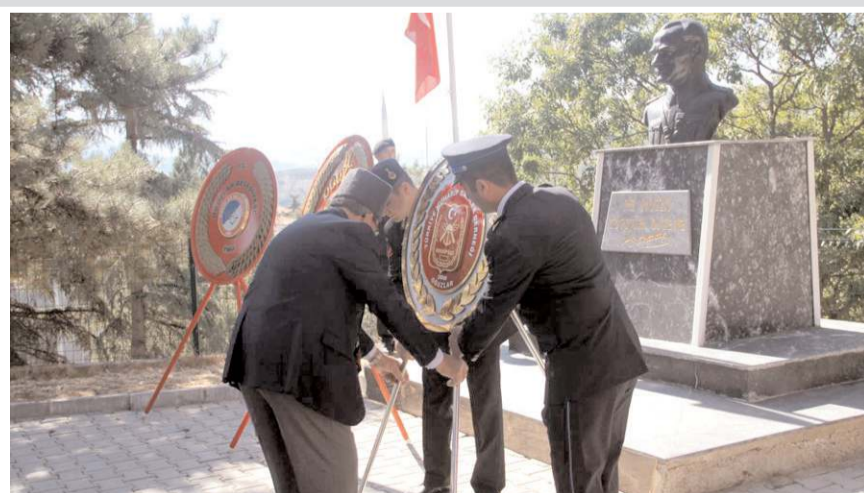
Gaziler 100. Yıl Atatürk Anıtı'na çelenk sundular.

Törene gaziler, kurum amirleri, siyasi parti temsilcileri ve vatandaşlar katıldı.(AA)