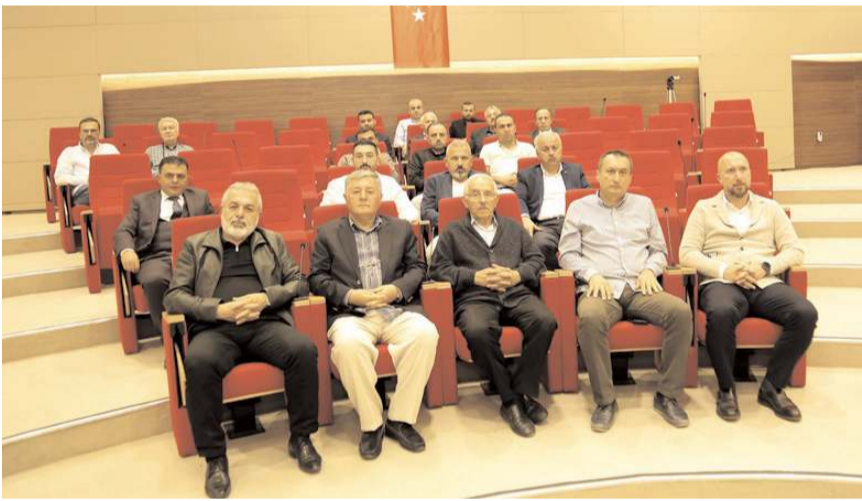
Toplantıda sektör sorunları ele alındı.