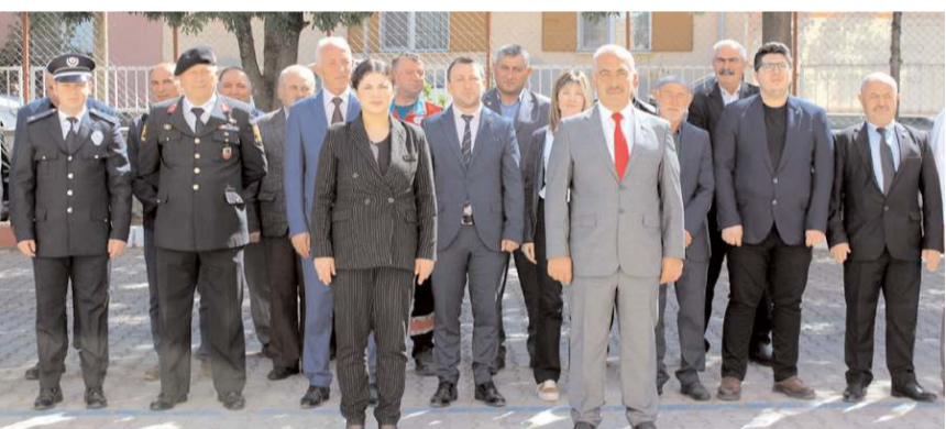
Program Şehit Mustafa Karasakal Çok Programlı Anadolu Lisesi bahçesinde yapıldı.