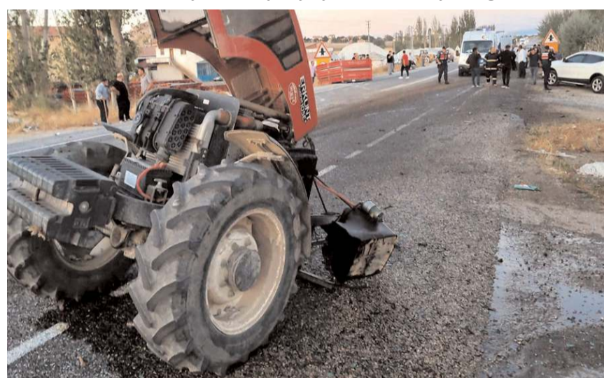
Kazada her iki araçta da maddi hasar meydana geldi.

Kaza ile ilgili olarak başlatılan soruşturmanın devam ettiği öğrenildi.(İHA)