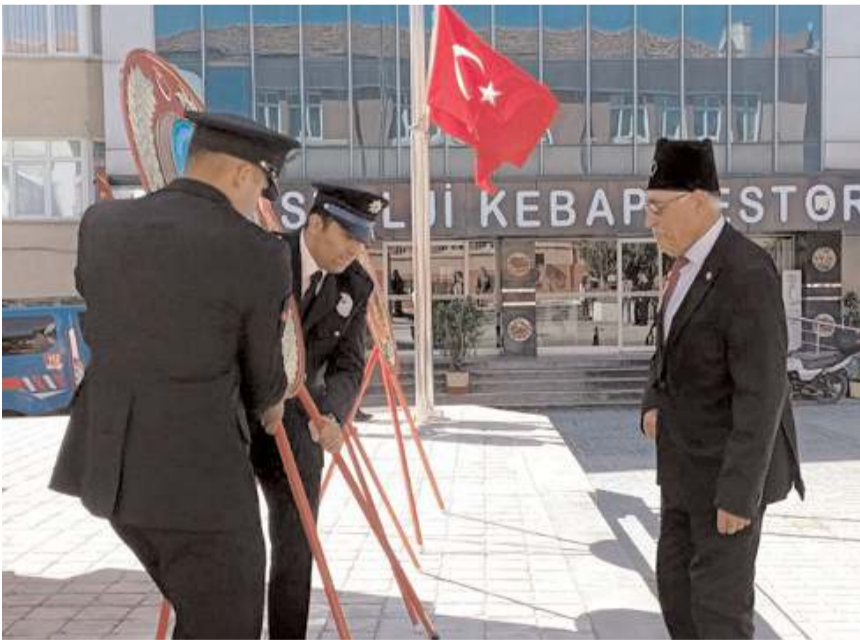
Gaziler Atatürk Anıtı'na çelenk sundular.