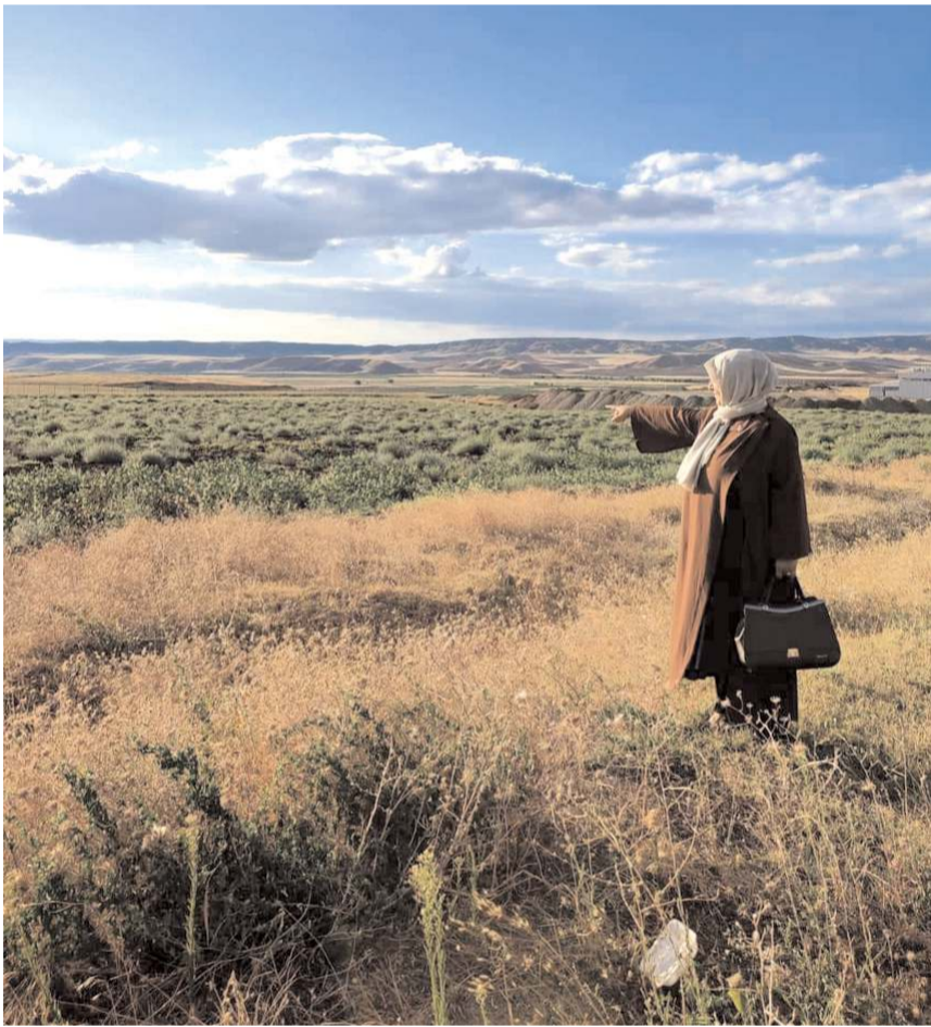
Tesis Sungurlu OSB'de tahsis edilen 6 dönüm araziye yapılacak.