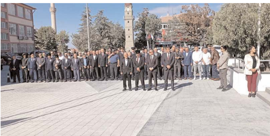
Tören Atatürk Anıtı'nda düzenlendi.