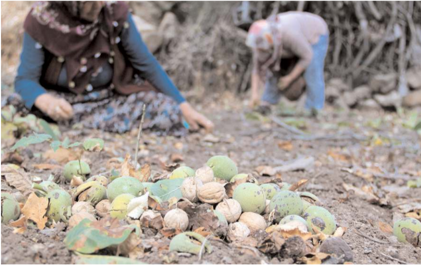
Oğuzlar cevizinde ciddi rekolte kaybı yaşandı.