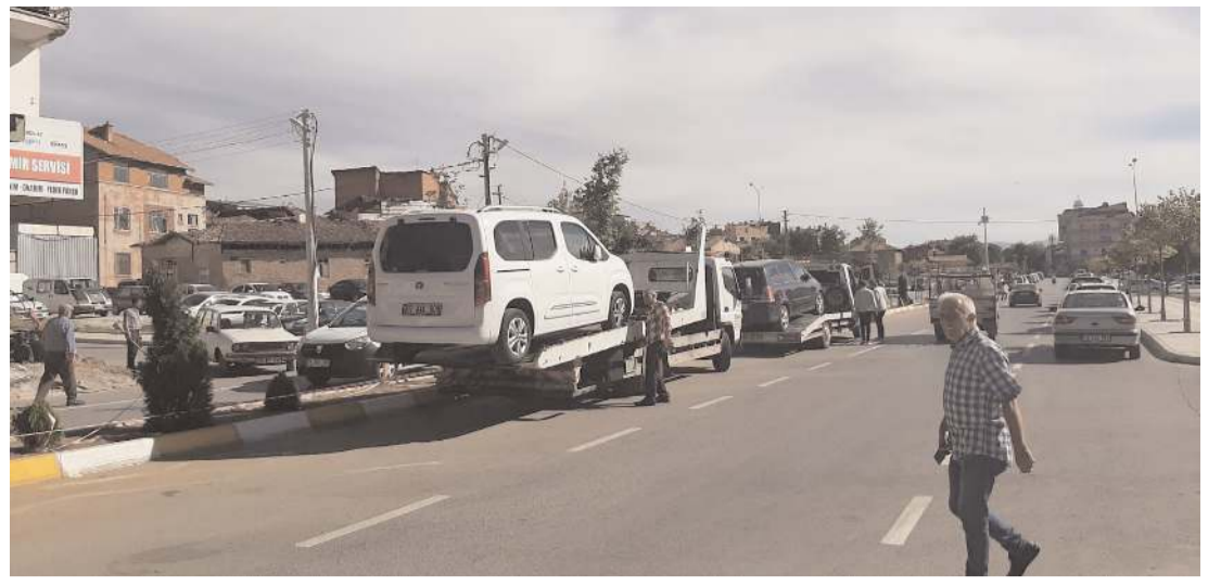
Ekipler park yasağı olan alanlara park eden araçlara yönelik çalışma yaptı.

Tümer K, sağlık ekiplerince yapılan müdahalenin ardından Hitit Üniversitesi Erol Olçok Eğitim ve Araştırma Hastanesi'ne kaldırıldı.(AA)