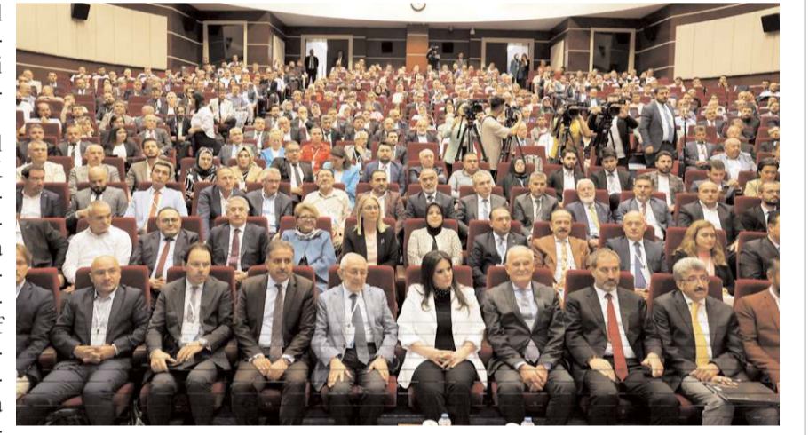
Çalıştaya Çorum Belediyesi'nde katıldı.

İstihdama yönelik çalışmaların Türkiye genelindeki belediyeler arasında "iyi uygulama örnekleri" arasında yer aldığı dile getiren Çöplü, "Belediyemiz tarafından özellikle istihdama yönelik çalışmalarımız AK Parti Genel Merkezimiz tarafından hazırlanacak çalıştay sonuç bildirisinde de yer alacak. Bu alandaki tecrübelerimiz yayımlanacak bildiri ile de sivil