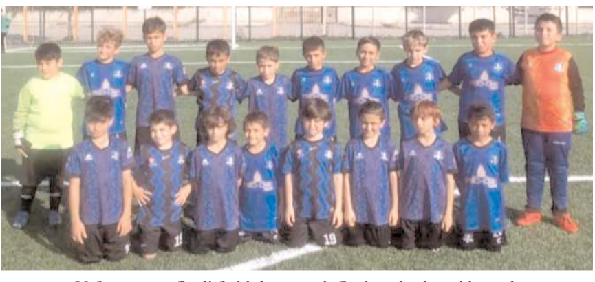
Vefaspor yarı finali farklı kazanarak finale yükselmeyi başardı

İtfaiye sahasında yarın saat 16.30'da bir sahada Mimar Sinan Gençlikspor ile Alaca İtmat Sürücü Kursu takımları üçüncülük dördüncülük maçında karşılaşacaklar. Aynı saatte diğer sahada ise Vefaspor ile HE Kültürspor takımları şampiyonluk maçına çıkacaklar.