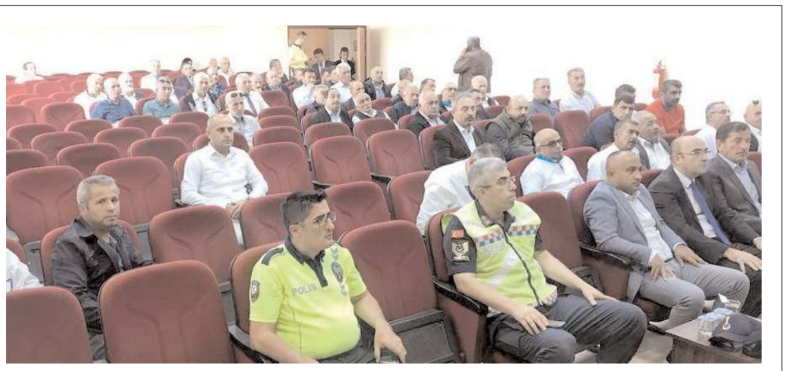
İlk olarak okul servisleri personeline eğitim verildi.

Uzun bir sopa yardımı veya traktörün arkasına yerleştirilen ceviz silkmeye makinesiyle dalından indirilen ceviz, elle yeşil kabuğundan ayrılarak kurutmaya bırakılıyor. Cevizler iyice kurutulduktan tüketiciye sunuluyor. (AA)