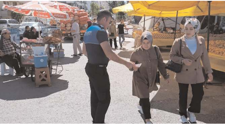
Zabıta ekipleri, vatandaşlara bilgilendirmek için broşür dağıttı.

Kurallara uymayanlara yasal işlem yapılacaktır