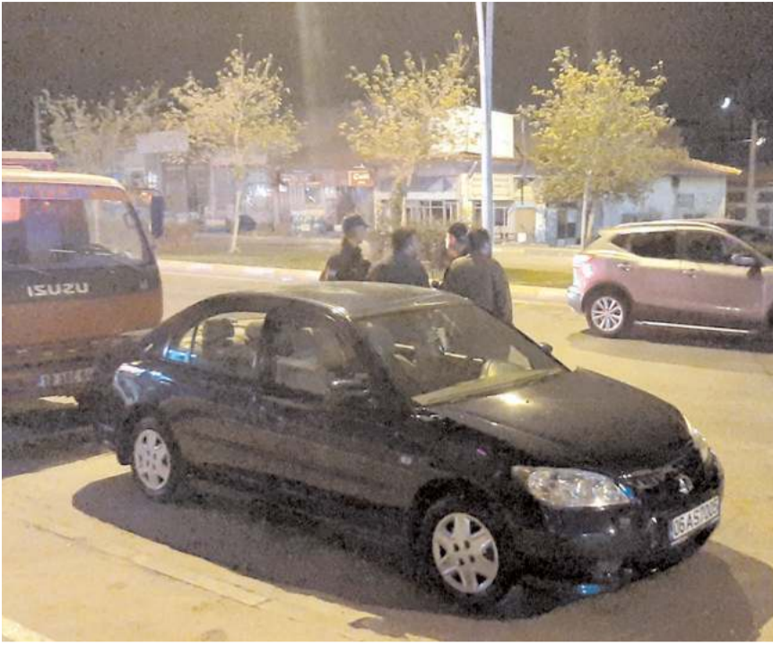
Kaza Akşemseddin Caddesi'nde meydana geldi.