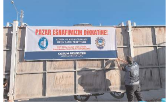
Pazarlara esnaf için afiş asıldı.