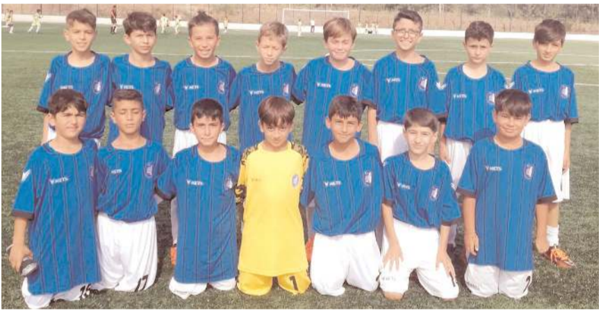
HE Kültürspor yarı final maçını kazanarak yarın finalde oynamaya hak kazandı