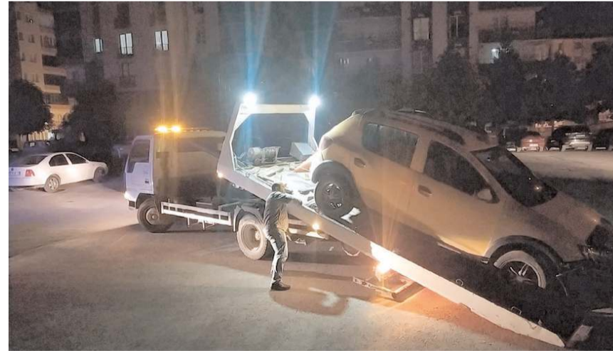
Taksi, çekici ile otoparka götürüldü.