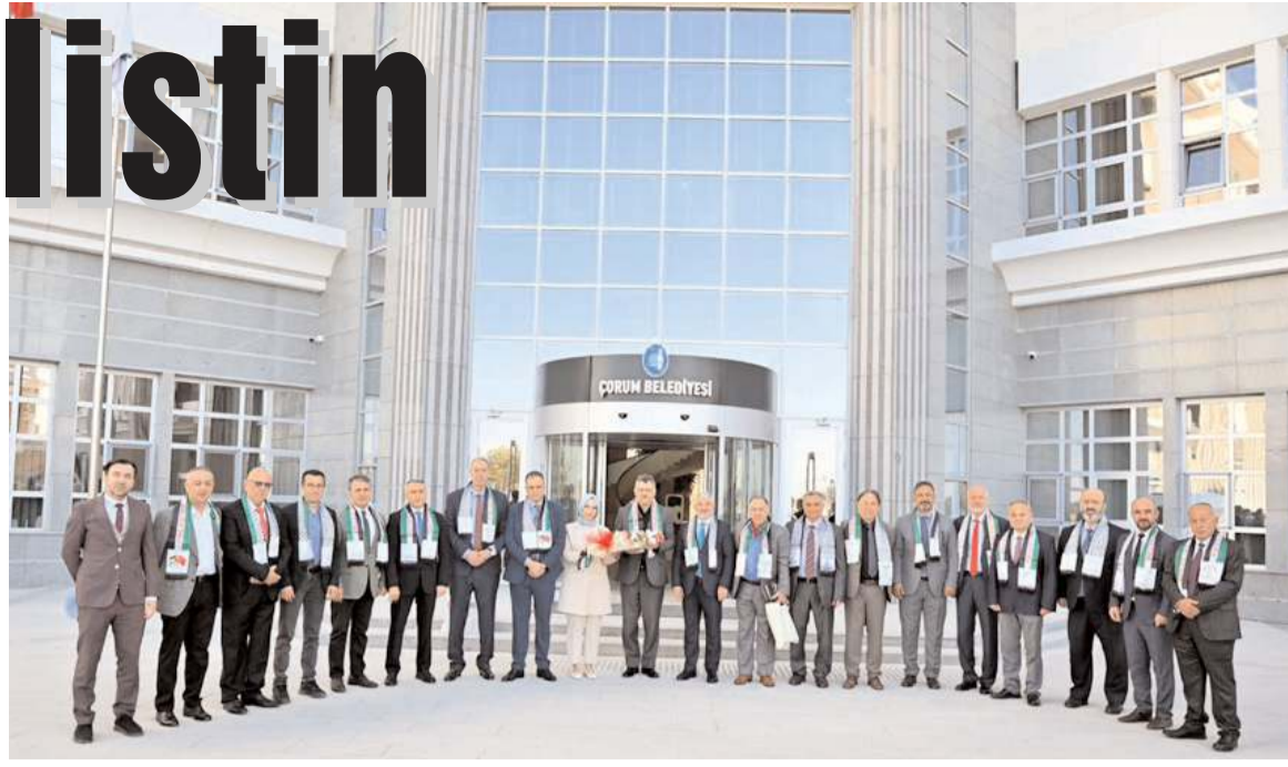
Çorum'un kardeş şehri Filistin'in Kalkilya Belediyesi'nden bir heyet Çorum'a geldi.

İsrail'in Filistin'de uyguladığı baskı ve zulümlerden de bahseden Kalkilya Belediye Başkanı Faysal Shraim, "Kalkilya, İsrail işgalcileri tarafından büyük bir hapishaneye dönüştürüldü. 70 bin kişi hapishaneye dönüştürülen bir bölgede yaşıyor. Nazi döneminde bile İsrail'in yaptığı zulmü yapmadı. İsrail'in amacı Kalkilya sakinlerinin şehri terk etmesidir. Kalkilya'da kalabilmemiz için Çorum'un vereceği destek bizim için çok önemli. Bizlerde kardeş şehir anlaşması ile başlayan ilişkilerimizi güçlendirmek için Çorum'a geldik. Bizleri konuk eden Belediye Başkanımıza ve Çorum halkına çok teşekkür ediyoruz" şeklinde belirtti. (Haber Merkezi)