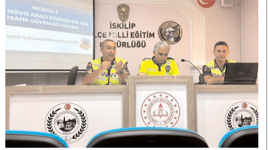
Eğitimler il merkezi ile ilçelerde yapıldı.

Eksiklikleri olan sürücü ve araç sahiplerine idari para cezası uygulanırken, taşıma hizmetine devam etmesi uygun olmayan araçlar ise trafikten men edilerek eksiklikleri ile ilgili düzenlenen "Okul Servis Aracı Denetim Formları" İl ve İlçe Millî Eğitim Müdürlüklerine gönderildi. (Haber Merkezi)