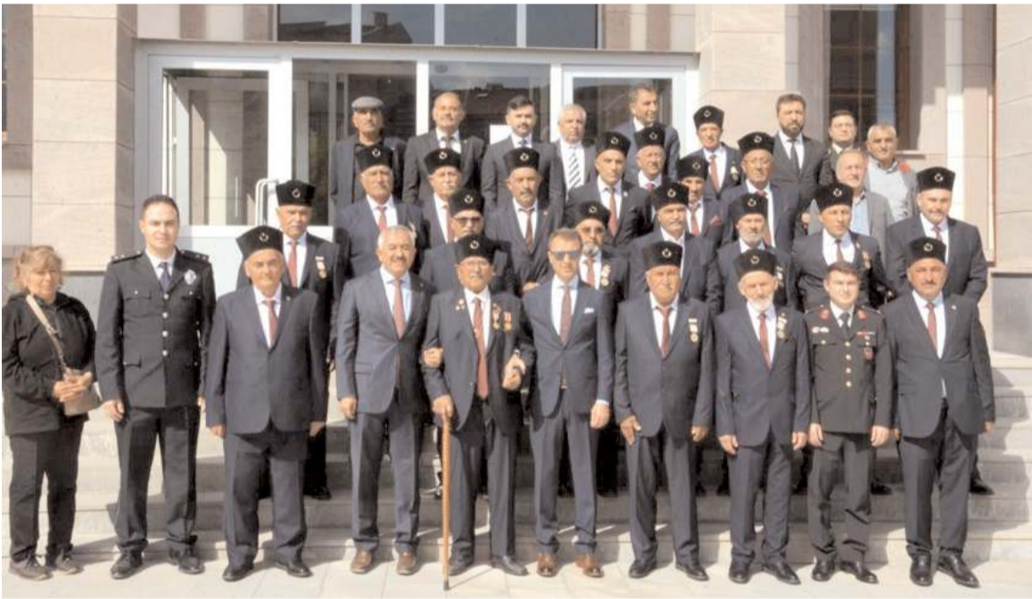
Günün anısına toplu fotoğraf çekildi.

toplum kuruluşları, diğer yerel yönetimlerin tecrübe, ihtiyaç, talep ve beklentilerinin gelecek dönemdeki çalışmalarına da ışık tutacağına inanıyoruz" dedi. (Haber Merkezi)