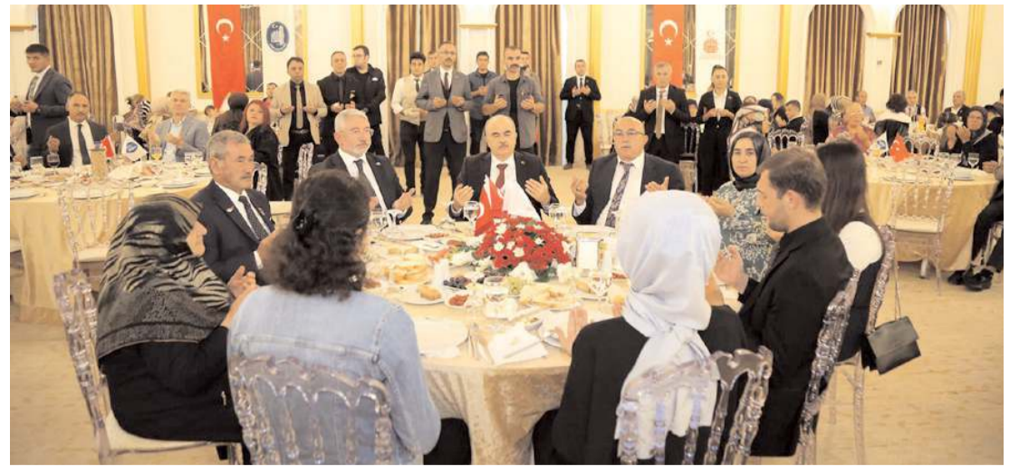
Programda şehitler ve vefat etmiş gaziler için dua edildi.