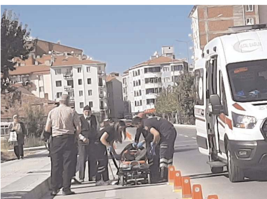
112 acil sağlık ekipleri yaşlı adamı hastaneye kaldırdı.

Çorum'da kaldırımından düşen 66 yaşındaki kişi yaralandı.