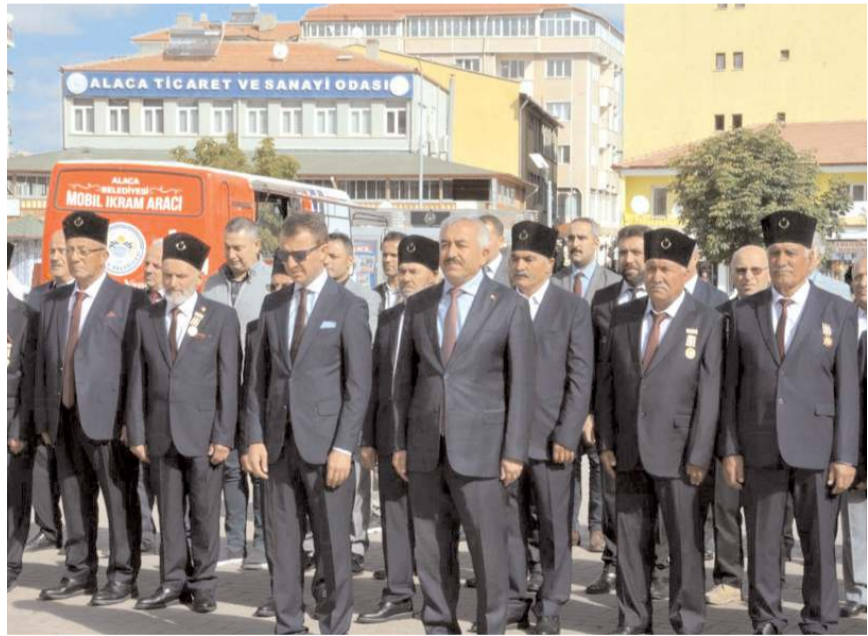
Tören Atatürk Anıtı'nda yapıldı.