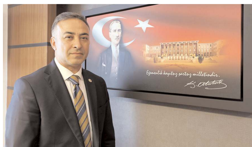
CHP Çorum Milletvekili Mehmet Tahtasız