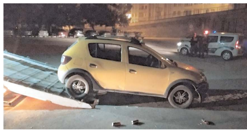
Taksi sürücüsü kaçıplara karıştı.

Öte yandan, park halinde bulunan ticari taksinin etrafında çok sayıda alkol şişesi bulundu. (İHA)