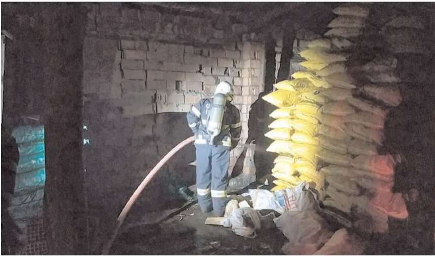
Olay Gülabibey Mahallesi Sanayi 4. Sokak'ta meydana geldi.

Yangınla ilgili inceleme başlatıldı. (İHA)