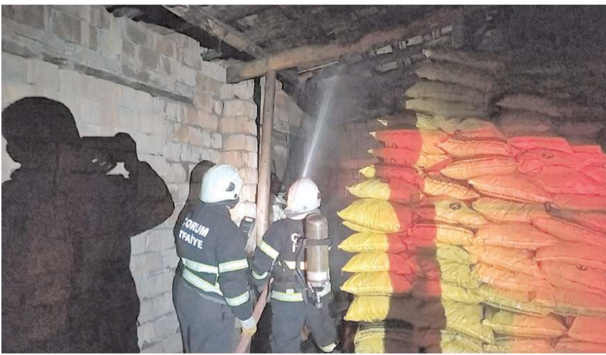
İtfaiye ekipleri yangını büyümeden söndürdü.