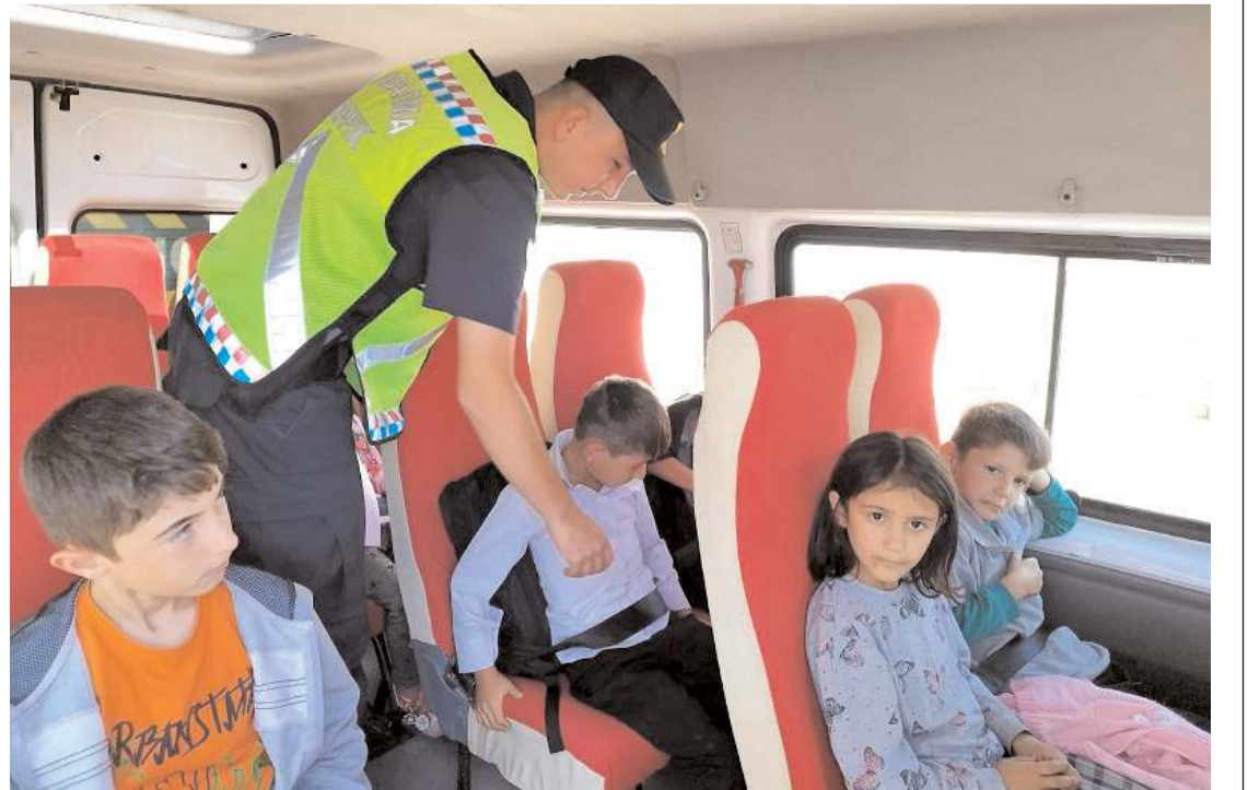
Ekipler servislerin eksikliği olup olmadığını kontrol etti.