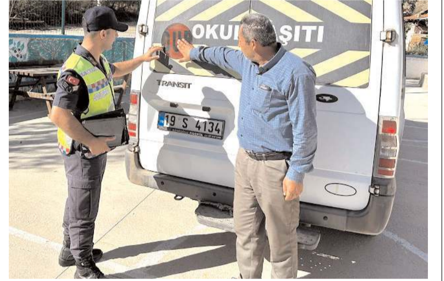
Jandarma ekipleri servisleri denetledi.