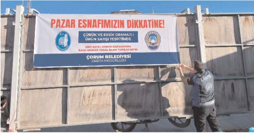
Pazarlara esnaf için afiş asıldı.