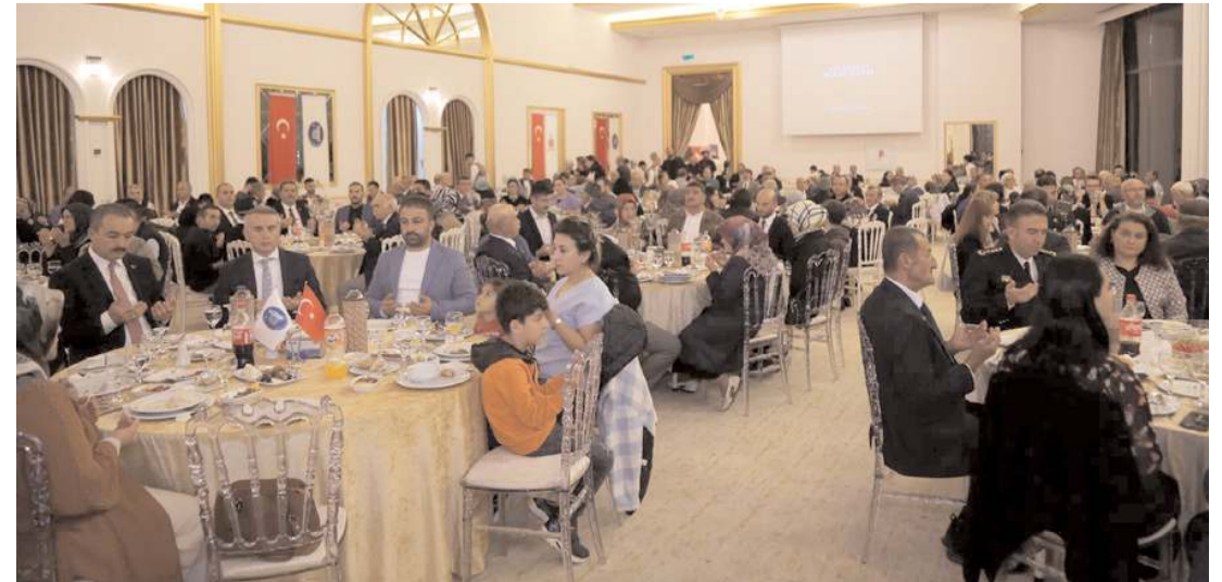
Program Altinkaya Arenada yapıldı.