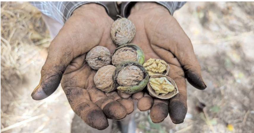
Verimde yüzde 99'a varan kayıp var.