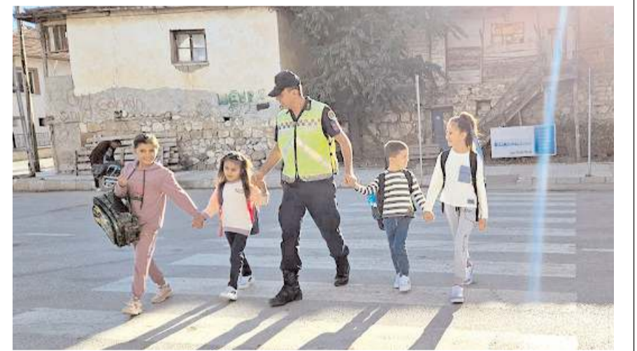
Jandarma ekipleri öğrencilere trafik kurallarını uygulamalı olarak gösterdi.