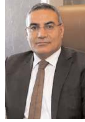
Av. Etem Çeker