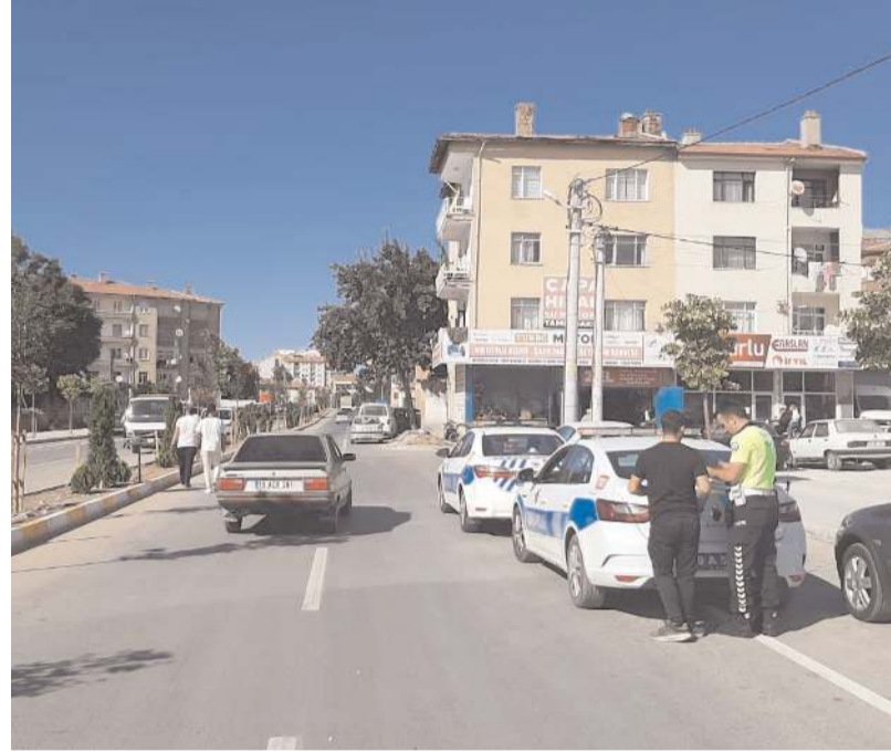
Ekipler, hatalı park eden 30 araca toplam 13 bin 80 lira trafik cezası kesti.

Çorum'da hatalı park eden 30 araca 13 bin 80 lira trafik cezası uygulandı.