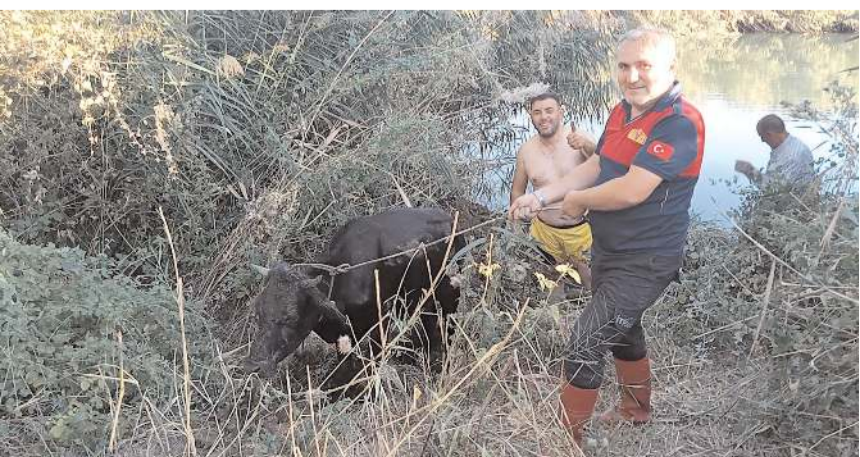
Osmancık Belediyesi itfaiye ekipleri uzun uğraşlar sonucu ineği ırmaktan çıkarttı.

Osmancık'ta nehre düşen inek it-faiye ekiplerince kurtarıldı.