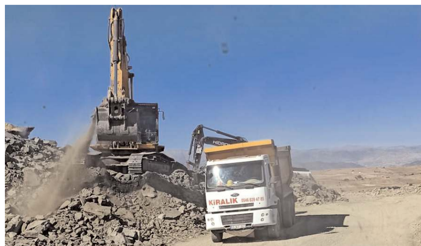
Proje kapsamında 35 km uzunluğunda beton kanal yapılacak.