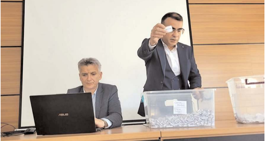
Kura çekimi Noter huzurunda yapıldı.