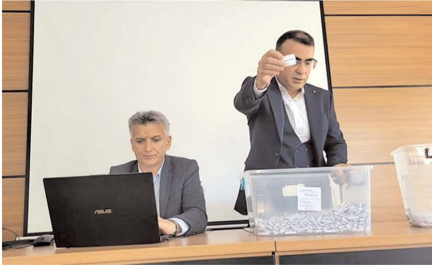
Kura çekimi Noter huzurunda yapıldı.

■ TYP kapsamında Kültür ve Turizm Müdürlüğü bünyesinde 18, Aile ve Sosyal Politikalar İl Müdürlüğü bünyesinde çalışacak 71 kişi dün Noter huzurunda çekilen kura ile belirlendi.