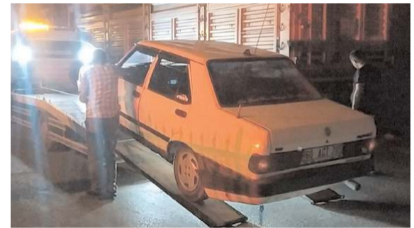
Kazaya karışan otomobil çekici ile otoparka kaldırıldı.

■ Çorum'da kuşburnu toplamak için Sıklık bölgesine giden ve tellere takılan yaşlı adam ölümden döndü. * HABERİ 4'TE