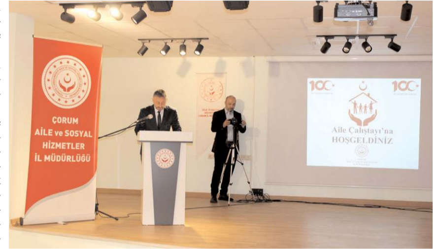
Çalıştay, Huzurevi Yaşlı Bakım ve Rehabilitasyon Merkezinde yapıldı.

Çalıştaya; Hitit Üniversitesi, Baro Başkanlığı,