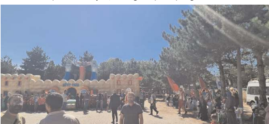
Çocuklar şenlikte gönüllüleriyle eğlendiler.

Çorum Belediyesi'nin de katkıları ile Dodurga ilçesinde çocuk şenliği düzenlendi.