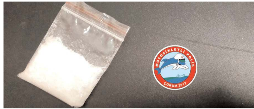
Operasyonlarda uyuşturucu madde ele geçirildi.

İl Emniyet Müdürlüğü'nün çok uygulamaları devam ediyor. Uygulamalarda çok sayıda ateşli silah ele geçirildi.