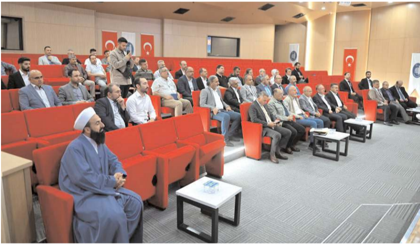
Filistin heyeti İnsani Değer Platformu üyesi sivil toplum örgütü temsilcileri ile bir araya geldi.