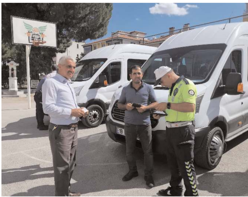
Tüm servis araçları kontrolden geçirildi.

Servis araçlarının, Milli Eğitim Bakanlığının servis araçlarıyla ilgili yönetmeliklerine uygunluğu kontrol edilirken, trafik polisleri de araçların evraklarını kontrol ederek, kurallara uyup uymadıklarını denetledi. (AA)