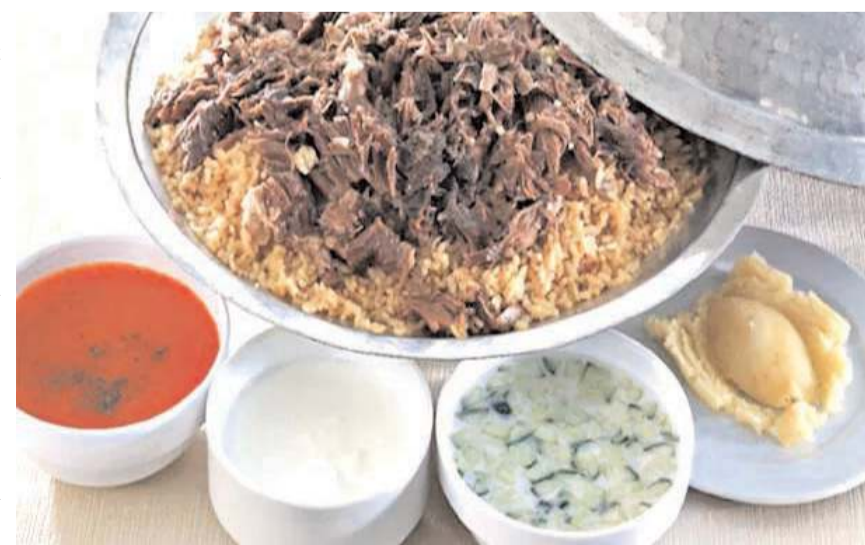
Sirke salatasına coğrafi işaret tescil belgesi verildi.

Yoğurt ve su bir kaptaki karıştırılarak sulu kıvamlı