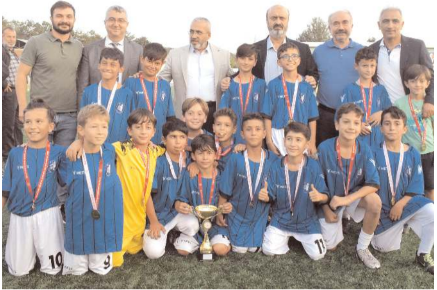
Mini miniklerin şampiyonu HE Kültürspor takımı ödül töreni sonunda toplu halde