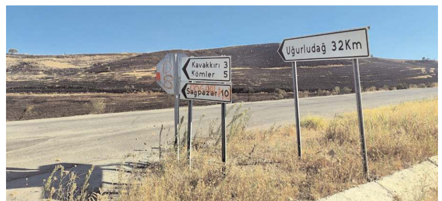
Anız yangını diğer tarlalara ulaşmadan söndürüldü.