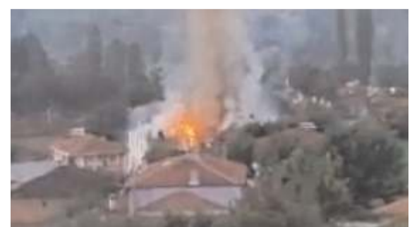
Yangın yaklaşık 4 saatte söndürüldü.