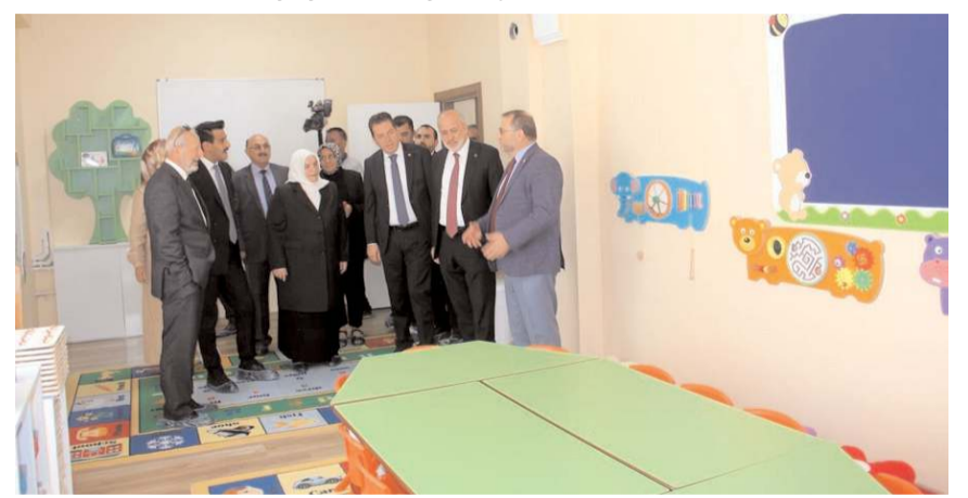
Açılışın ardından davetliler Kur'an kursunu gezdi.