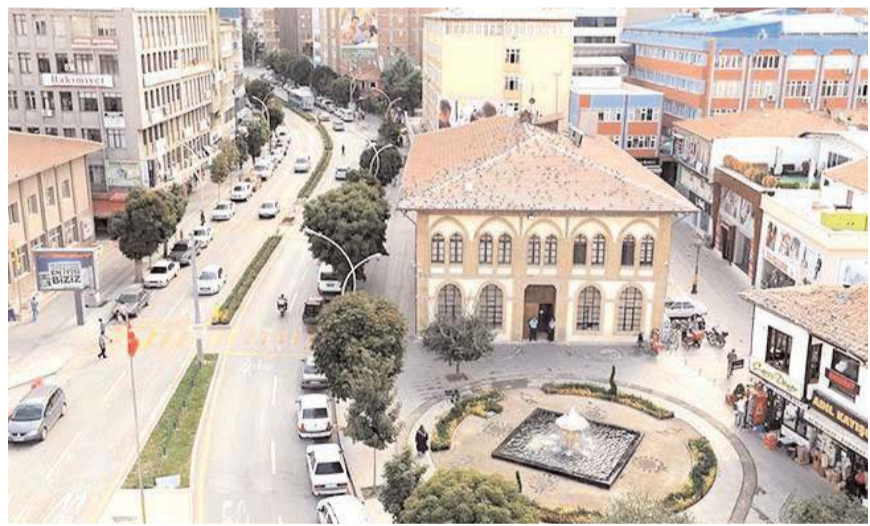
Türkiye İstatistik Kurumu (TÜİK) Ağustos ayı araç istatistiklerini açıkladı.

Bunların araçların türüne göre dağılımı ise şöyle oldu: "Otomobil 89 bin 685, minibüs 2 bin 472, otobüs 994, kamyonet 24 bin 054, kamyon 5 bin 967, motosiklet 24 bin 032, özel amaçlı 456, traktör 45 bin 770"