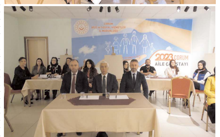
Çalıştaya çok sayıda kurumdan yetkili katıldı.

Çorum Emniyet Müdürlüğü, Adli Destek ve Mağdur Hizmetleri Müdürlüğü, Çorum İl Müftülüğü, Aile ve Sosyal Hizmetler İl Müdürlüğü, İl Milli Eğitim Müdürlüğü, Rehberlik ve Araştırma Müdürlüğü, İl Sağlık Müdürlüğü (Halk Sağlığı), Çevre, Şehircilik ve İklim Değişikliği İl Müdürlüğü, İl Afet ve Acil Durum Müdürlüğü, Sosyal Yardımlaşma ve Dayanışma Vakfı, Kadın ve Demokrasi Vakfı ve Çorum Yeşilay Şubesinden uzmanlar katıldı. (Haber Merkezi)