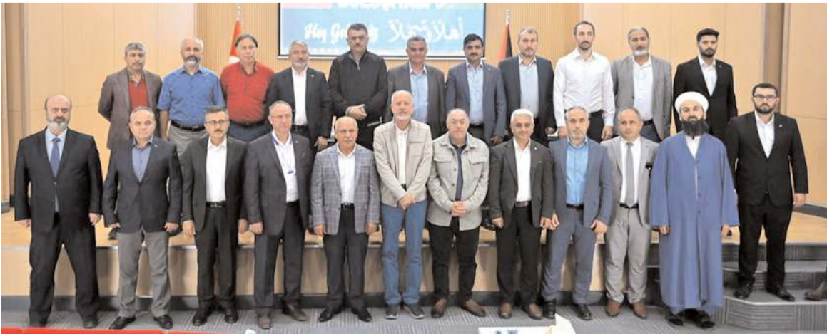
Programın sonunda toplu hatıra fotoğrafı çekildi.