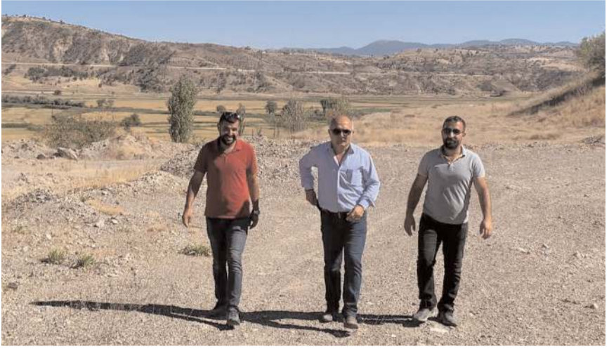
Dodurga Belediye Başkanı Mustafa Aydın, çalışmaları inceledi.