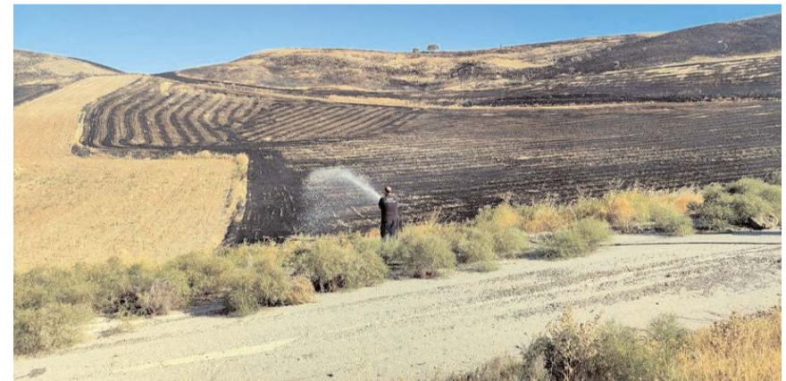
Olay, Bayat ilçesi Kavakkırı köyü mevkiinde meydana geldi.

Olay, Bayat ilçesi Kavakkırı köyü mevkiinde meydana geldi. Edinilen bilgiye göre, köy mevkiindeki arazide bilinmeyen sebeple çıkan anız yangını kısa süre büyüyecek çevrede bulunan tarlalara sıçradı. İhbar üzerine bölgeye çok sayıda itfaiye ile jandarma ekipleri sevk edildi. Büyük bir alana yayılan ve yüzlerce dönüm alanı etkileyen yangın itfaiye, jandarma ve köylülerin uzun uğraşları sonucunda kontrol altına alındı. Yangınla ilgili inceleme başlatıldı. (İHA)