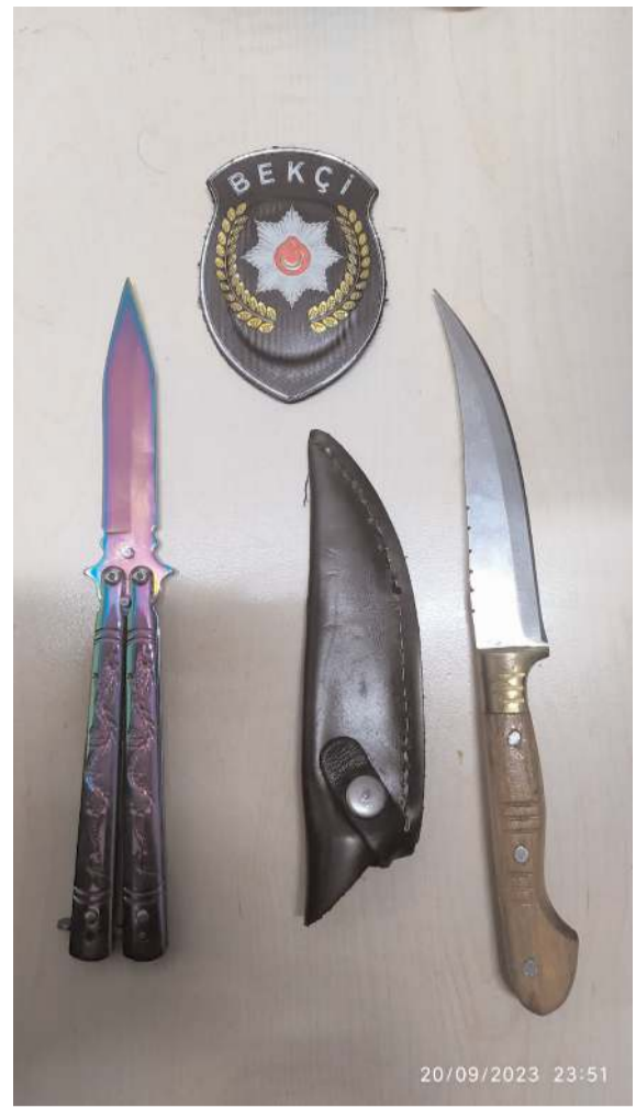
Operasyonlarda çok sayıda ateşli ve kesici silah ele geçirildi.