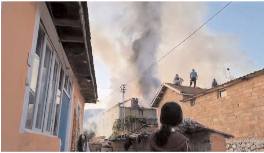
Yangın yaklaşık 4 saatte söndürüldü.