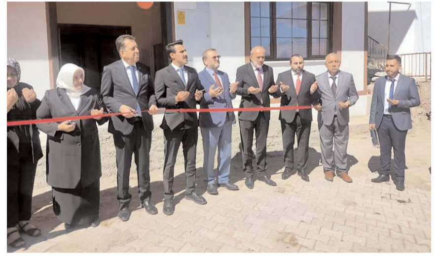
Yapılan duanın ardından açılış kurdelesi kesildi.

Program sonunda tüm katılımcılara yemek ikramında bulunuldu.