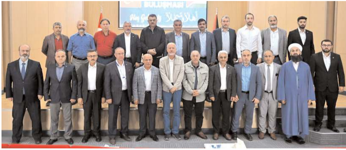
Programın sonunda toplu hatıra fotoğrafı çekildi.