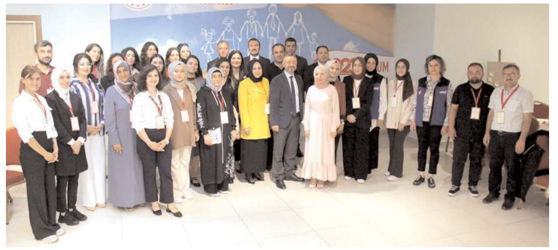
Aile ve Sosyal Hizmetler İl Müdürlüğü'nün 'Aile Çalıştayı' yapıldı.

Kampanyadan faydalanmak isteyen konut ve iş yeri alıcıları Gayrimenkul Satış Sözleşmesini imzalamış oldukları aracı bankalardan konut kredisi kullanabilecekler. (Haber Merkezi)