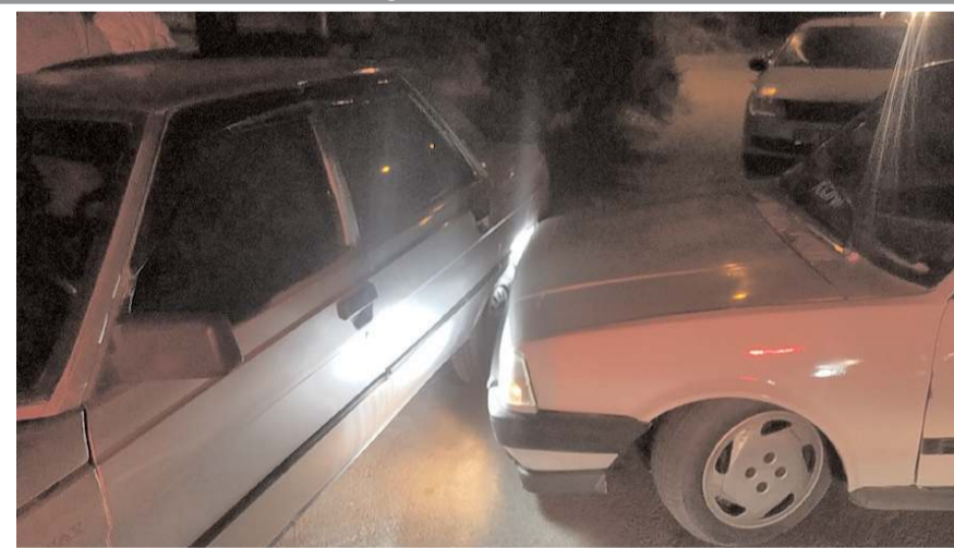
Kaçan otomobil Bağcı-lar 1. Sokakta park halindeki bir otomobile çarparak durabildi.

Edinilen bilgiye göre, 60 ACT 705 plakalı otomobil sürücüsü H.İ.Y. Kıbrıs Cad-desi üzerinde polis ekiplerinin "dur" ihtarına uymayarak kaç-maya başladı. Polis ekiplerinin uzun süre kovalamacası sonucu kaçan otomobil Bağcı-lar 1. Sokak üzerine geldiğinde park halindeki bir otomobile çarparak durabildi. Alkol-lü ve ehliyetsiz olduğu öğrenilen otomobil sü-rücüsü polis ekipleri tarafından gözaltına alınırken, otomobil çe-kici yardımı ile oto-parka çekildi. (İHA)