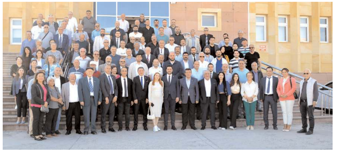
CHP'liler mazbata töreninde toplu hatıra fotoğrafı çekindiler.