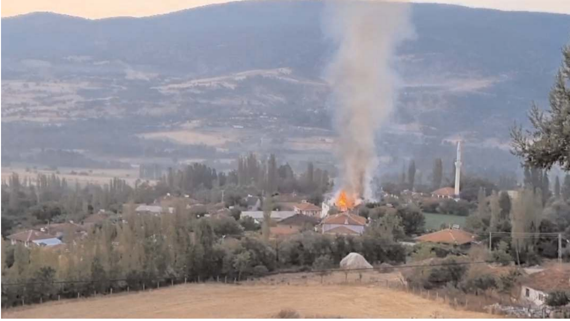
Olay Emirbağ köyünde meydana geldi.

HAKİMİYET, merhumeye Al-lah'tan rahmet ailesi ve sevenlerine başsağlığı diler.