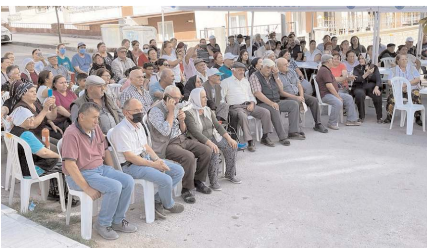
Program Vakfın Çorum Cemevi'nde yapılacaktır.