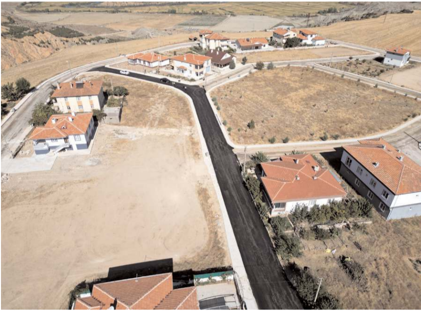
Çorum Belediyesi Dodurga'ya 500 ton asfalt desteği verdi.