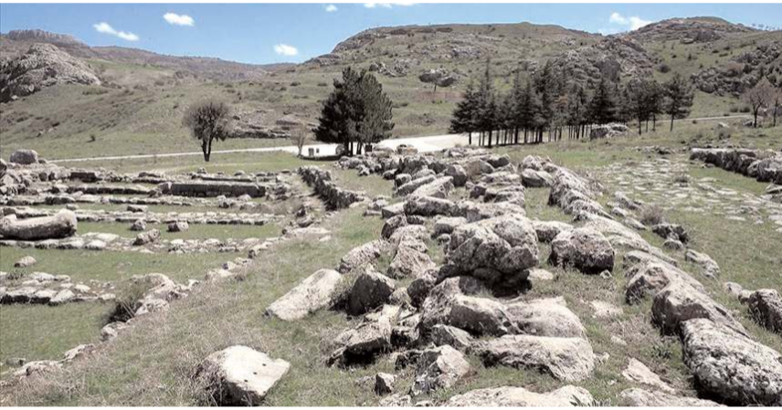
Boğazkale'deki kazılarda, yeni bir Hint-Avrupa dilinin keşfedildiği belirtildi.