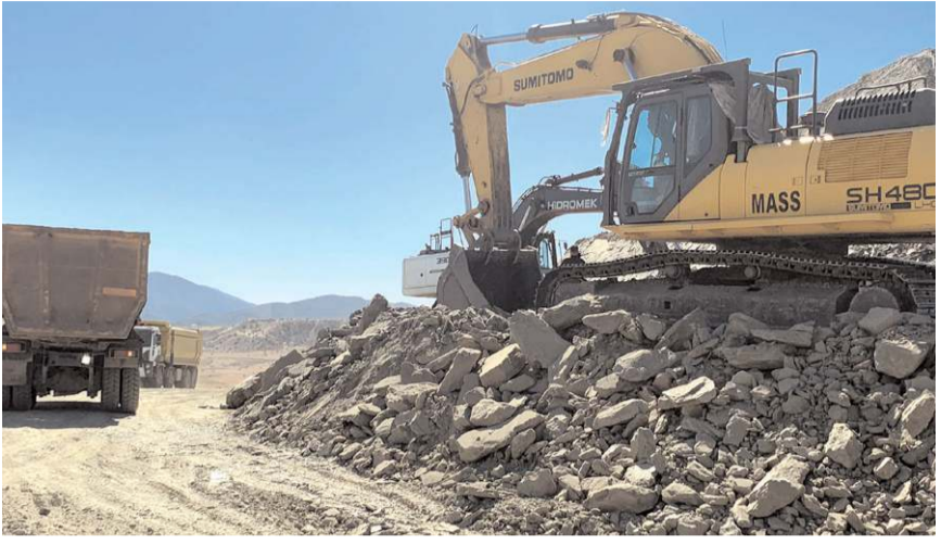
Yüklenici firma çalışmalara başladı.