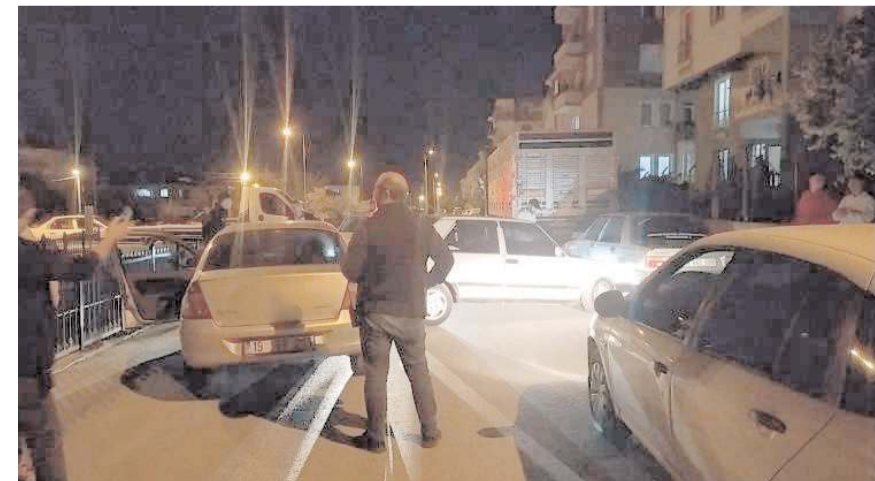
Sürücü polis ekipleri tarafından gözaltına alındı.