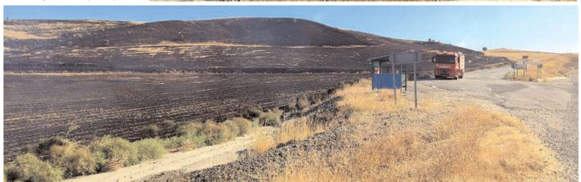
Anız yangını diğer tarlalara ulaşmadan söndürüldü.