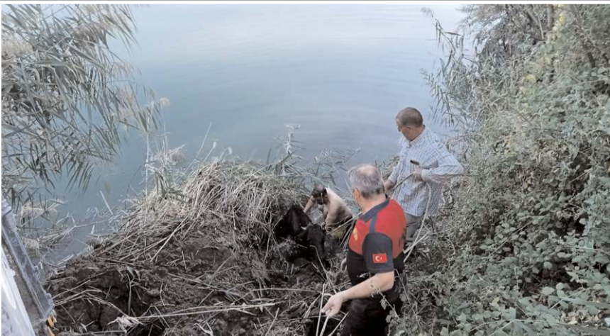
Kızılırmak'a düşen inek için kurtarma operasyonu yapıldı.