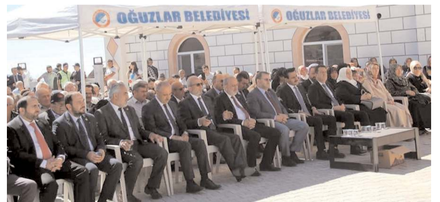
Açılış törenine çok sayıda davetli katıldı.