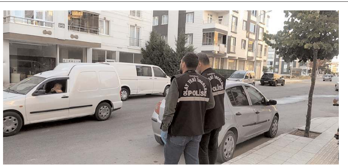
Olay, akşam saatlerinde Köprübaşı Caddesi'nde meydana geldi.

Taşkınel, itfa-iye ekiplerine te-şekkür etti.(AA)