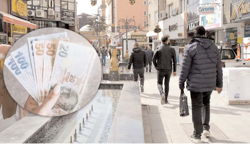
Eşiyle boşanma davası sonuçlanan bir kişi vatandaşa para dağıttı.

Elinde yaklaşık 50 bin lira olan poşetle vatandaşlara para dağıtmaya başlayan şahıs, bunu neden yaptığının sorulması üzerine eşinden boşanmasını ge-