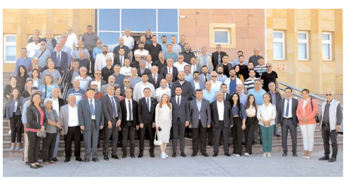
CHP'liler mazbata töreni ardından toplu hatıra fotoğrafı çekindiler.