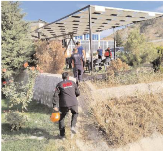
Tellere takılan yaşlı adamı bölgeden geçen bir vatandaş tesadüfen fark etmiş.

Yaşlı adamın durumunun iyi olduğu öğrenildi.