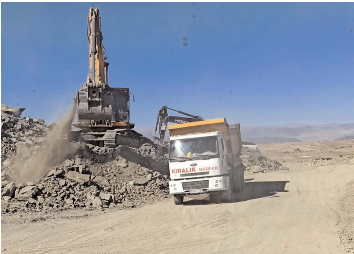
Proje kapsamında 35 km uzunluğunda beton kanal yapılacak.