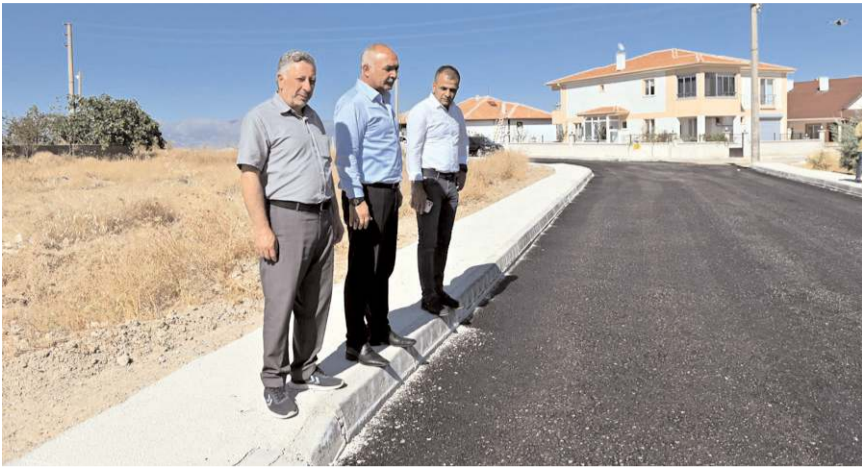
Dodurga Belediye Başkanı Mustafa Aydın, asfalt yapılan yolda incelemede bulundu.