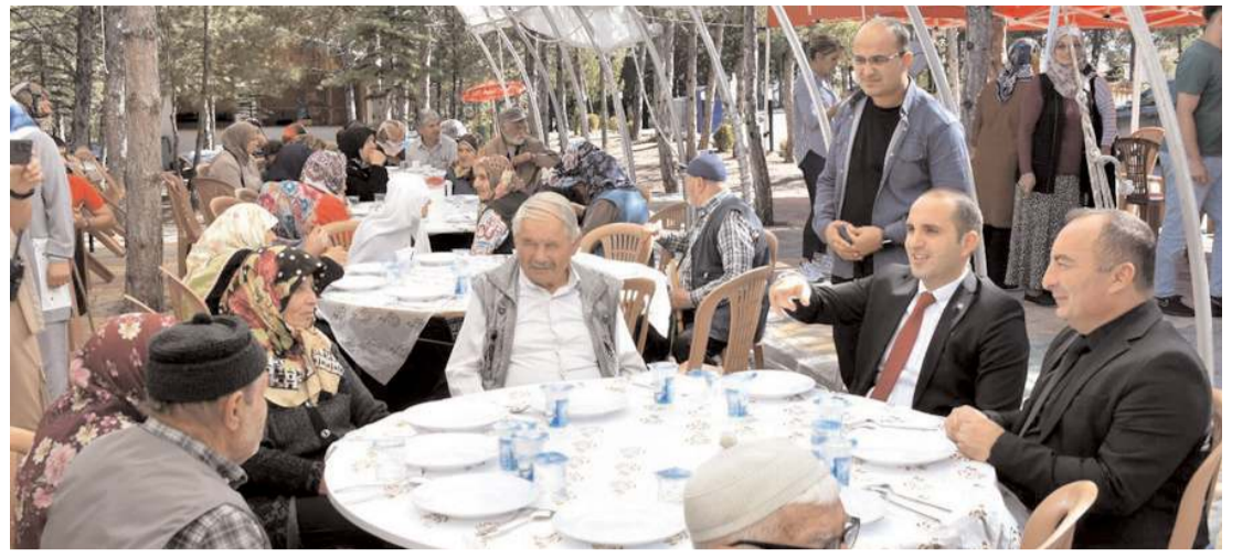
Programa ilçe protokolü de katıldı.

Böylece ilçeye has bir hediye ürüne tescil alındığına işaret eden İnci, şunları kaydetti: "Kursiyerlerimiz ve usta öğreticilerimizden çıkan, ilçemizin yöresel kıyafeti olan üç eteğin minyatürü ile unutulmaya yüz tutmuş bir değerimizi yeniden canlandırmak istedik. Tescilini aldığımız üç etek minyatür kaftanın Bayat'ın tanıtımına büyük katkı sağlayacağını düşünüyorum. Bayat'a hayırlı olsun." (AA)