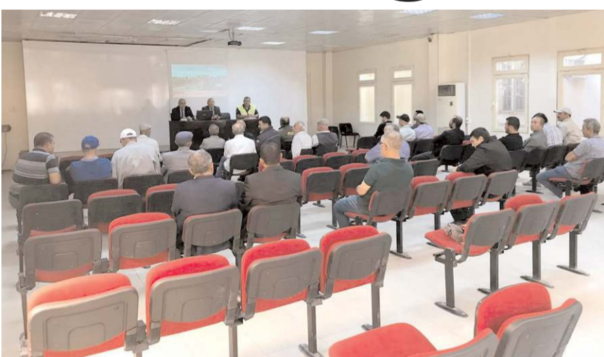
Seminerde öğrenci servisi görevlileri yönetmelikteki genel konular hakkında bilgilendirildi.