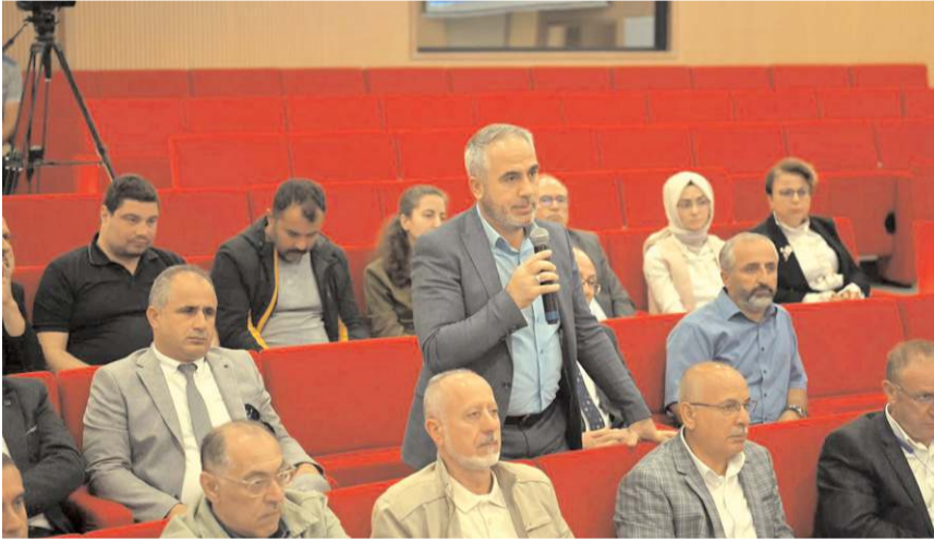
Kalkilya heyeti İnsani Değerler Platformu üyelerinin sorularına cevap verdi.