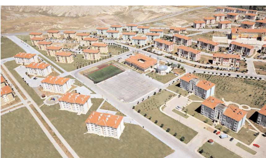
Başvurular 19 Ekim'de sona erecek.

Yüzde 25 indirim kampanyasından bütün borç bakiyesini kapatamayacak vatandaşlar da yararlanabilecek.