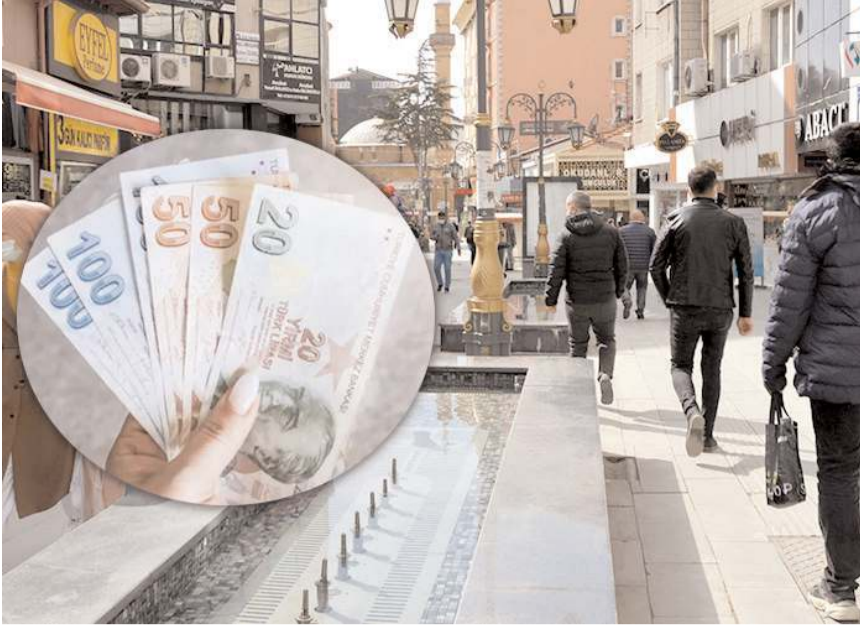
Eşiyle boşanma davası sonuçlanan bir kişi vatandaşa para dağıttı.

■ Eğridere Çarşısı'nda önceki gün para dağıtan bir kişi şaşkınlık yarattı. İddialara göre uzun süredir eşiyle boşanma aşamasında olan bir kişi, davanın sonuçlanması üzerine ilginç bir olaya imza attı.