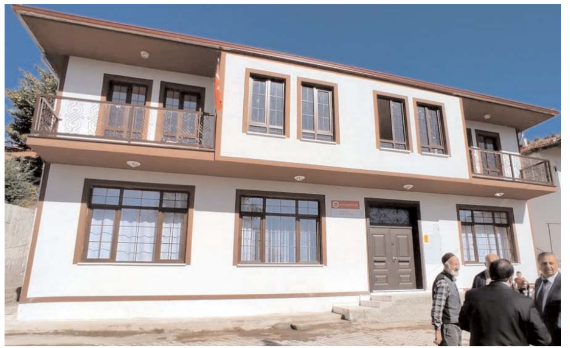
Kur'an kursu kamu desteği ve hayırseverlerin işbirliği tamamlandı.