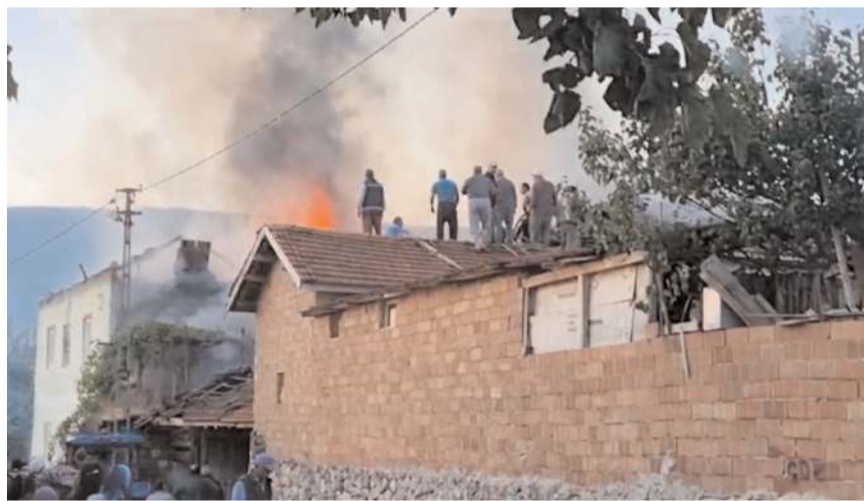
Ahırdaki hayvanlar jandarma tarafından duvarlar kırılarak kurtarıldı.

Yangın sonucu 2 ev, samanlık ve ahırda zarar oluştu.(AA)