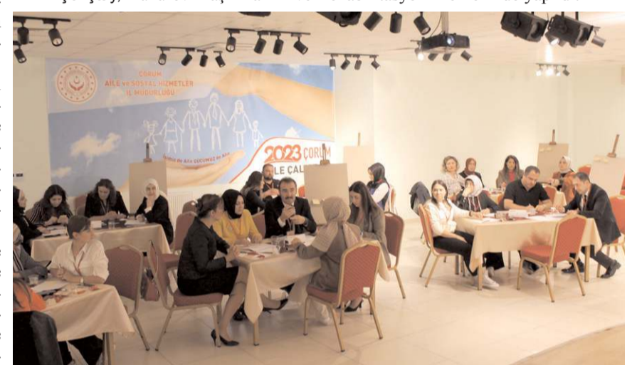
Çalıştayda yedi ana başlık üzerinde duruldu.