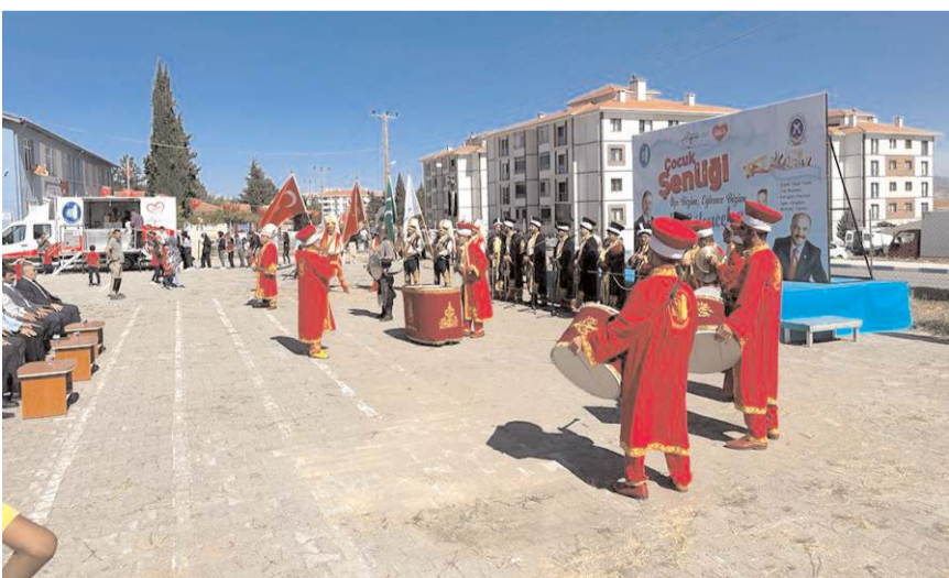
Çorum Belediyesi, Dodurga'da çocuk şenliği düzenlendi.