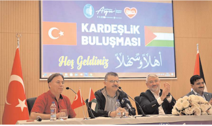
Filistin heyetinin Çorum programı devam ediyor.

Konuşmaların ardından, Kalkilya heyeti İnsani Değerler Platformu üyelerinin sorularına cevap verdi. (Haber Merkezi)