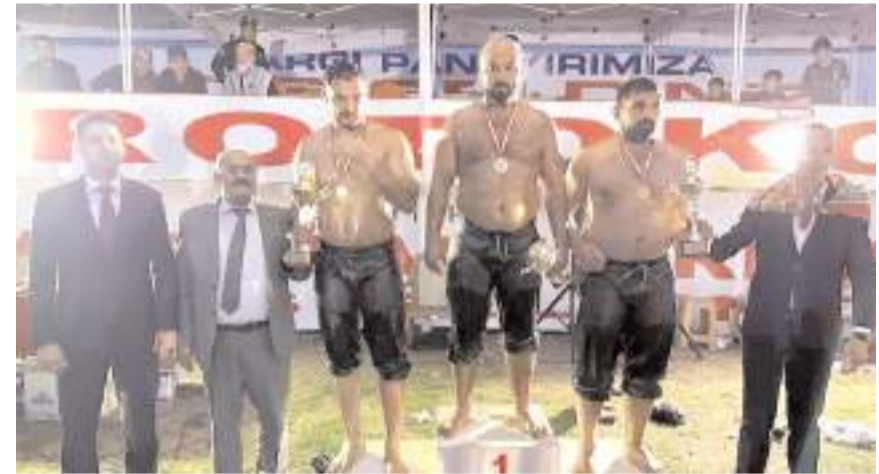
Baş kategorisinde dereceye giren pehlivanlar ödül töreninde kürsüde görülüyor