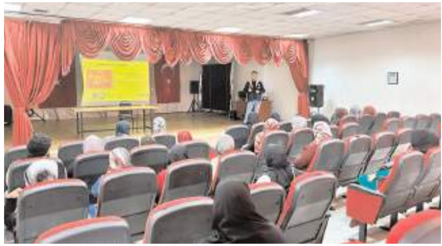
Eğitimler öğrencilere ailelerine verildi.

Çorum Emniyet Müdürlüğü'nden yapılan açıklamada, bugün teknolojinin aşırı kullanımının yaygın bir sorun olduğunun bilindiği belirtilerek, buna göre bireyin sosyal ve fiziksel hayatını sekteye uğratabilecek kadar teknolojiyi kullanması, saatlerini internette geçirmesi ve internetin olmadığı durumlarda sıkıntı ve yoksunluk hissi yaşamaması gibi durumların, teknoloji bağımlılığının göstergeleri olarak değerlendirilebileceği ifade