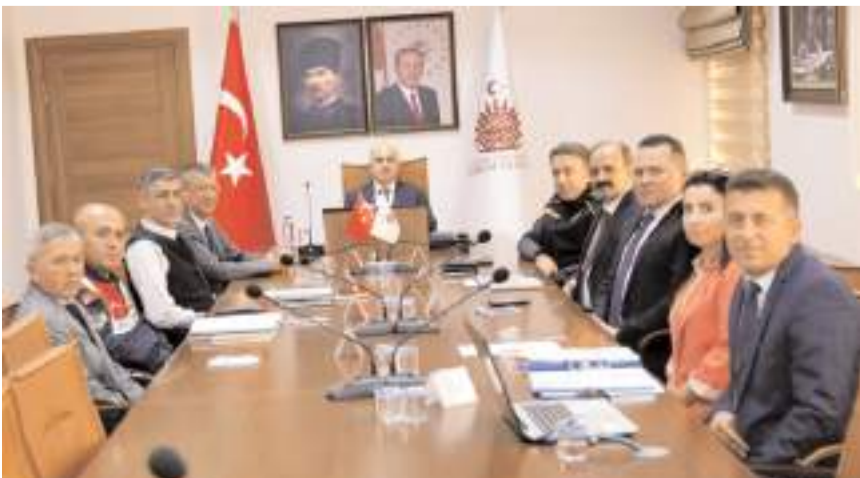
Toplantıda kaçak su ürünleri avcılığıyla mücadele için yapılacak çalışmalar istişare edildi.

Yapılan değerlendirmeler sonucunda, su ürünleri sektörünün geliştirilmesi noktasında, kaçak avlanmaya ve satışına kesinlikle izin verilmeyeceğini, kontrol ve denetimlerin etkin bir şekilde yapılacağını belirten Vali Zülkif Dağlı, su ürünleri kontrol ve denetimleri ile ilgili kuruluşlar arasında işbirliği ve koordinasyonun artırılarak, sorunların çözümü noktasında gerekli adımların atılacağını kaydetti. (Haber Merkezi)