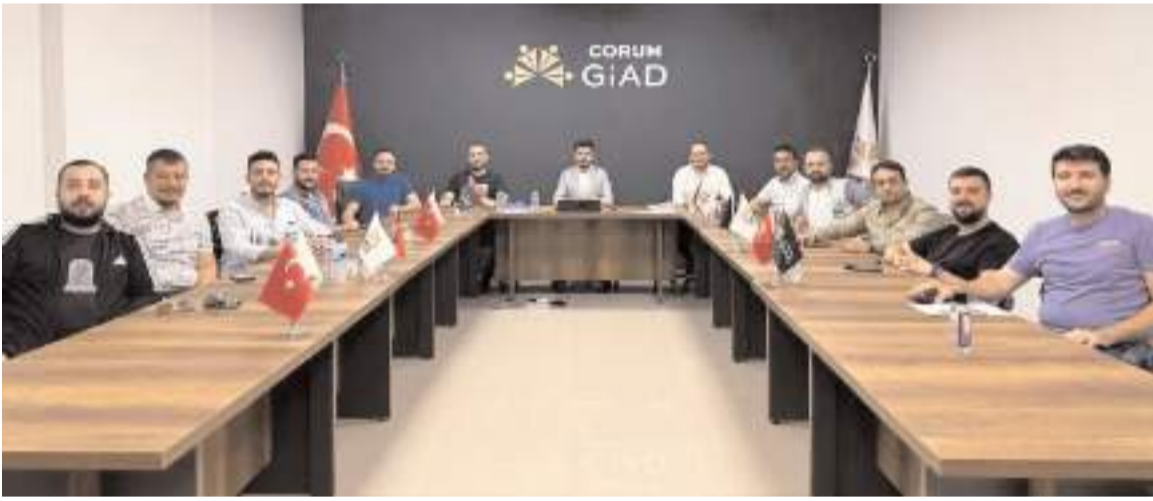
Personel alımını Çorum GIAD üyesi firmalar yapacak.

İş başvurusunda bulunacaklar https://www.corumgiad.org/web sitesini ziyaret edebilirler.