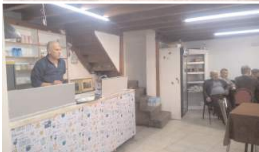
Murat Kırathanesi Halk Eğitim Merkezi karşısında ki yeni yerinde faaliyete başladı.