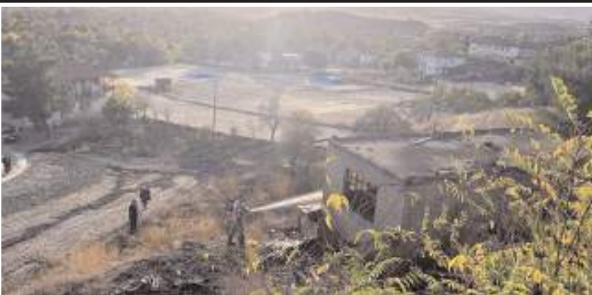
Olay Doğu Mahallesi'nde bir evde meydana geldi.

Dodurga Belediyesi'ne bağlı itfaiye ekiplerince söndürülen yangın nedeniyle metruk ev kullanılamaz hale geldi.(AA)