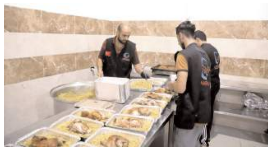
Dernek Gazzelilere yemek yardımında bulunuyor.