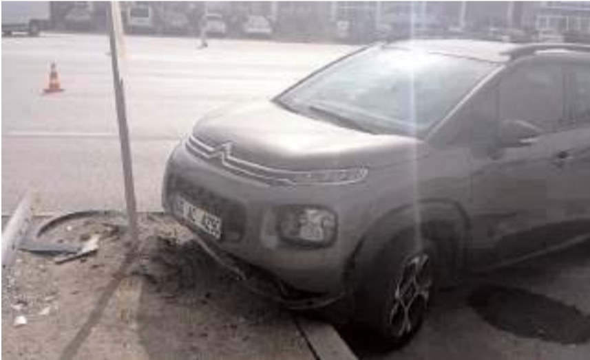
Sungurlu-Kırıkkale karayolu Ocaklı kavşağında meydana geldi.