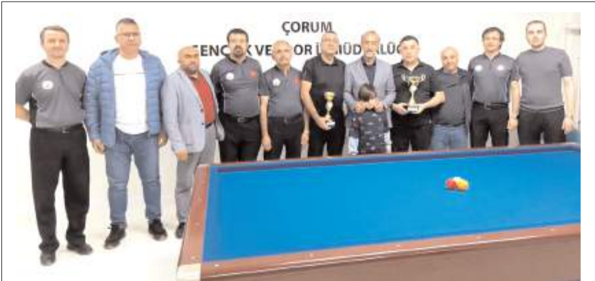
Cumhuriyet Kupası Bilardo Turnuvasında dereceye giren sporcular ve görev yapan hakemler tören sonunda