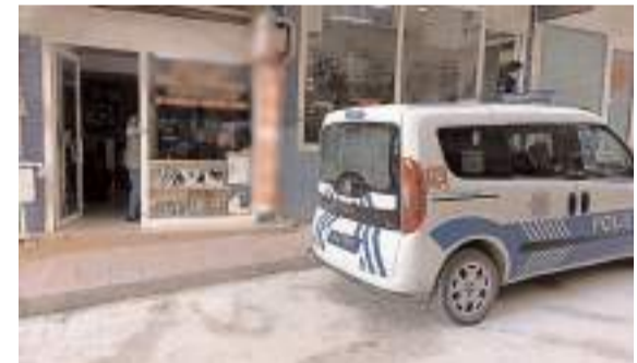
Olay Sungurlu'da meydana geldi.