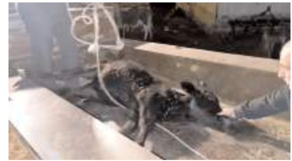
1 aydır kayıp olan boğa, ekipler tarafından bulunarak sahibine teslim edildi.