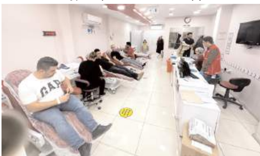
Gönüllüler 50 ünite kan bağıışında bulundu.

Nefes Yardımlaşma ve Dayanışma Derneği kan bağıışı kampanyası düzenledi.