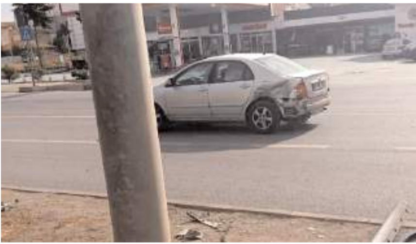
Kazada her iki araçta da maddi hasar meydana geldi.

Sungurlu'da meydana gelen trafik kazasında 4 kişi yaralandı.