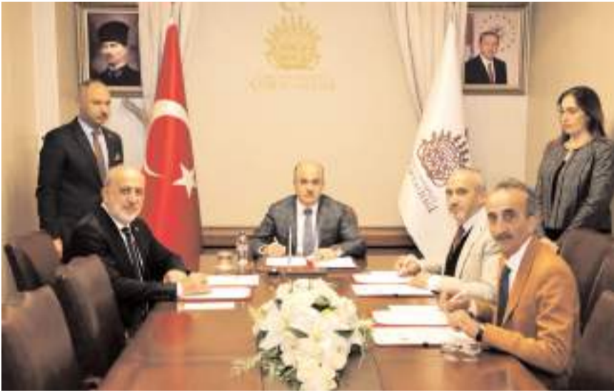
İşbirliği protokolü Valilikte imzalandı.