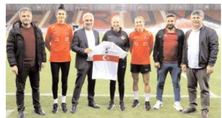
TÜFAD Çorum Şubesi milli takım teknik direktörüne özel milli takım forması hediye etti