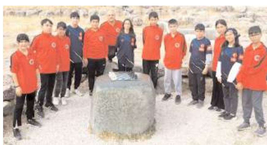
Hattuşa Satranç Kulübü Hattuşa ören yerinde satranç oynayarak 100. Yılı kutladı