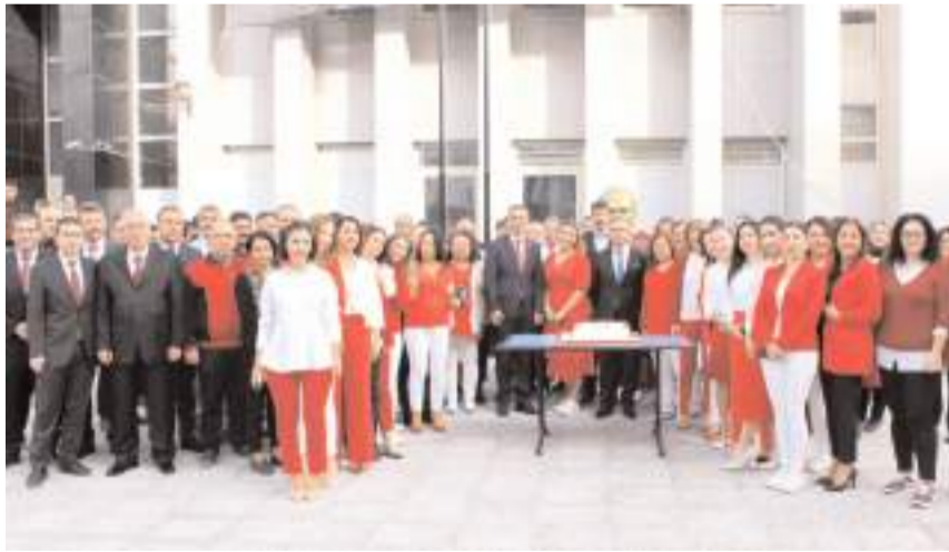
29 Ekim Cumhuriyet Bayramı ve Cumhuriyetin 100. yılı nedeniyle Adliye önünde kutlama programı yapıldı.

■ Çorum Adliyesi, 29 Ekim Cumhuriyet Bayramı ve Cumhuriyetin 100. yılını kutladı.