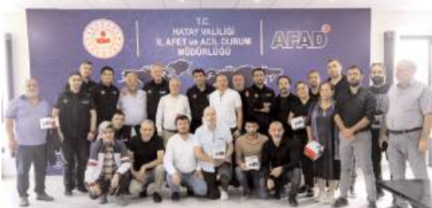
Basın kuruluşlarına verilmek üzere toplanan bağışlarla temin edilen teknik ekipmanlar basın kuruluşlarına teslim edildi.

Ülke genelinde 450 civarında basın kuruluşu kampanyaya destek vererek deprem bölgesinde görev yapan meslektaşlarını yalnız bırakmadı. Basın İlan Kurumu da hem çalışanlarının verdiği maddi destek, hem de mevzuatın uygulanması noktasında sağladığı kolaylıklarla elinden gelen bütün desteği verdi. Deprem bölgesindeki basın kuruluşlarımızın eski günlerine dönene kadar her türlü katkıyı vermeye devam edeceğiz. Basın kuruluşlarımızı, AFAD yetkililerine ve Kurum personelimize canı gönülden teşekkürü borç bilirim" dedi. (Haber Merkezi)