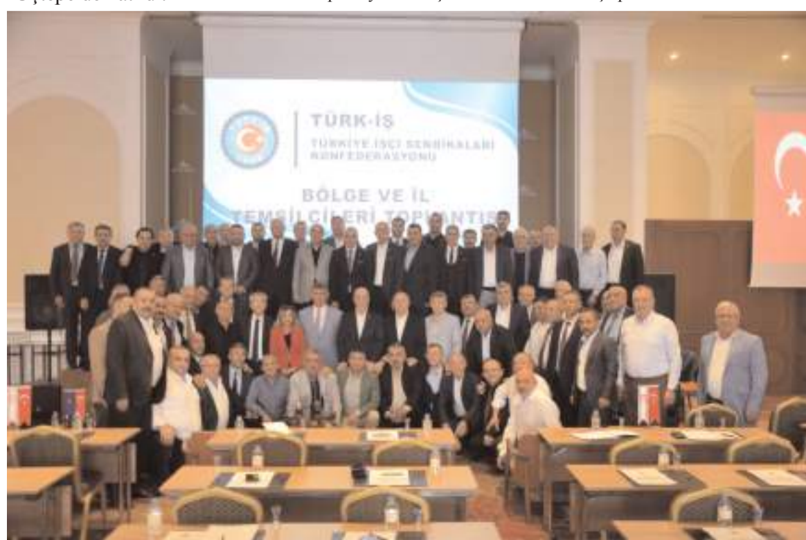
Toplantının ardından toplu hatıra fotoğrafı çekildi.