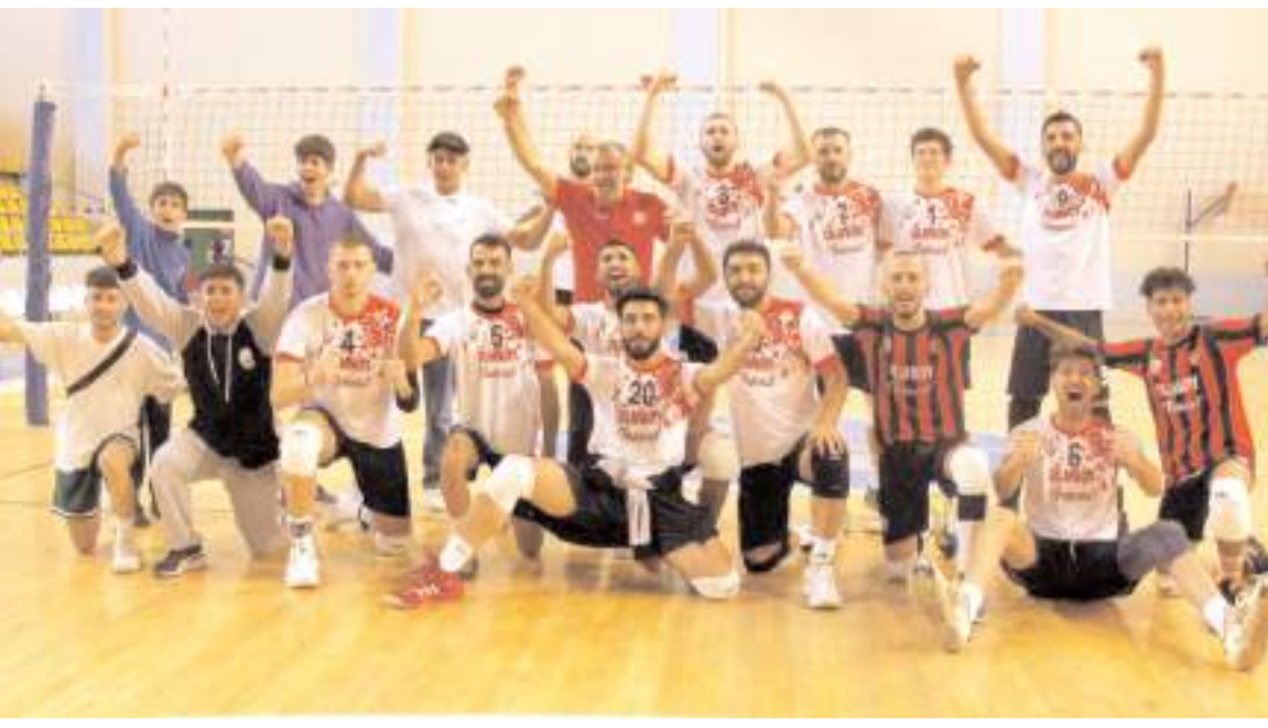
Sungurlu Belediyespor ligdeki ikinci maçında kazanarak yoluna namağlup devam ediyor ve ikinci sırada yer alıyor