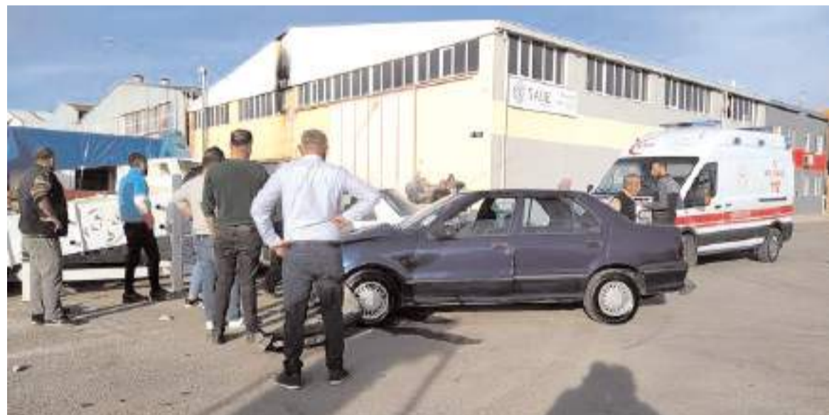
Kaza Küçük Sanayi Sitesinde meydana geldi.