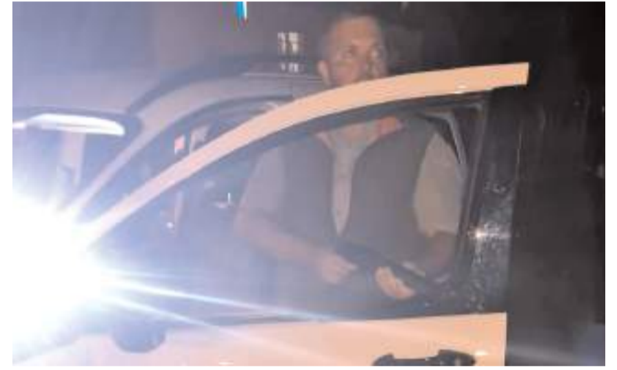
Olay Kargı'ya bağlı Maksutlu köyünde meydana geldi.

8 aylık kayıp boğa dün akşam saatlerinde okul bahçesinde sıkıştırılarak yakalandı ve ekipler tarafından sahibine teslim edildi.