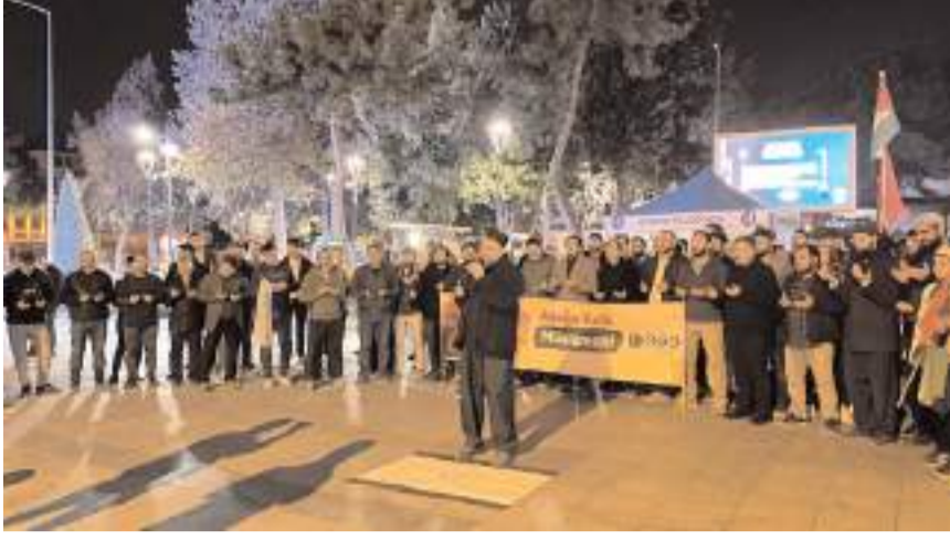
Eylemde şehitler için dua edildi.