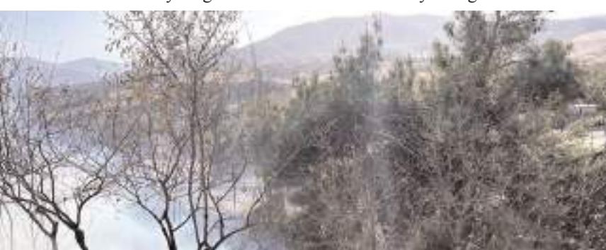
Yangında metruk ev kül oldu.