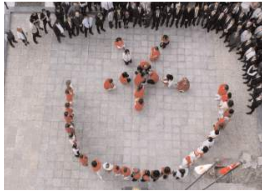
Adliye personeli Türk bayrağı motifi oluşturdu.

Çorum Adliyesi, 29 Ekim Cumhuriyet Bayramı ve Cumhuriyetin 100.yılıni kutladı.