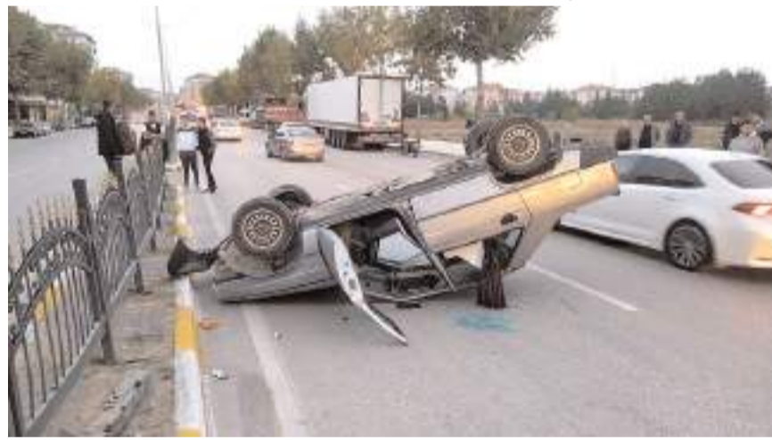
Kaza, Fevzi Çakmak Caddesi'nde meydana geldi.

Kazanın şiddeti ile otomobilde bulunan LPG tan-