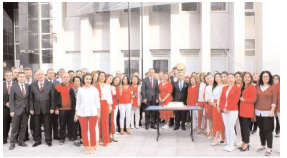
29 Ekim Cumhuriyet Bayramı ve Cumhuriyetin 100. yılı nedeniyle Adliye önünde kutlama programı yapıldı.