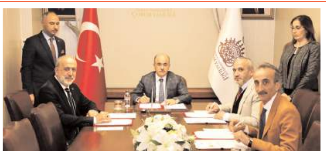
İşbirliği protokolü Valilikte imzalandı.