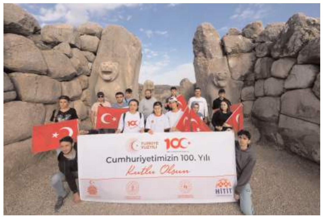
Öğrenciler Hattuşa Antik Kenti ile ilçenin doğal güzelliklerini görüntüledi.