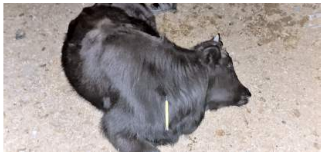
1 aydır kayıp olan boğa, ekipler tarafından bulunarak sahibine teslim edildi.