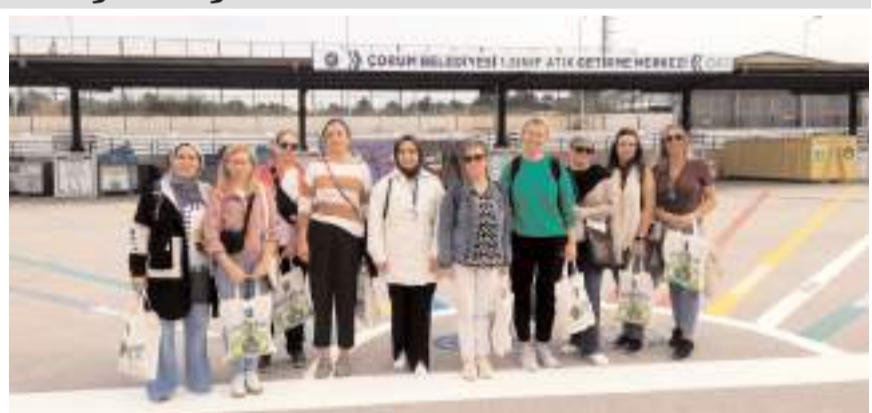
Ziyaretin ardından hatıra fotoğrafı çekildi.

Temizlik İşleri Müdürlüğü Çevreci Kadeş Çevreci Kartel, Mehmetçik Anadolu Lisesi tarafından koordine edilen, "Su, Enerji ve Gıda Yenilenebilir Enerji; Geleceği Hatırla ve Bugünü Kurtar Projesi" kapsamında proje ortağı Romanya, Polonya, Portekiz ve İtalya'dan öğretmenler Çorum'a gelerek sıfır atık noktasında yapılan çalışmalarını yerinde inceledi.