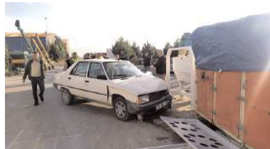
Kazada her iki araçta da maddi hasar meydana geldi.

Kaza ile ilgili soruşturma başlatıldı. (İHA)