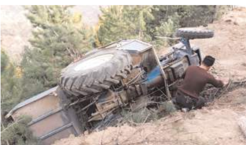
Kaza Oğuzlar'da İmran mevkinde meydana geldi.

Traktör ise Oğuzlar Belediyesi ekiplerince orman içine yeni bir yol açılarak bulunduğu yerden çıkarıldı.(AA)