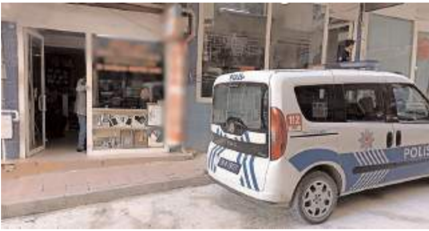
Olay Sungurlu'da meydana geldi.

İşyeri sahibinin lavaboya su almak için çıkması fırsat bilen kişi işyerine girerek çekmece bulunan 10 bin lirayı alarak kayıplara karıştı. Durumu fark eden