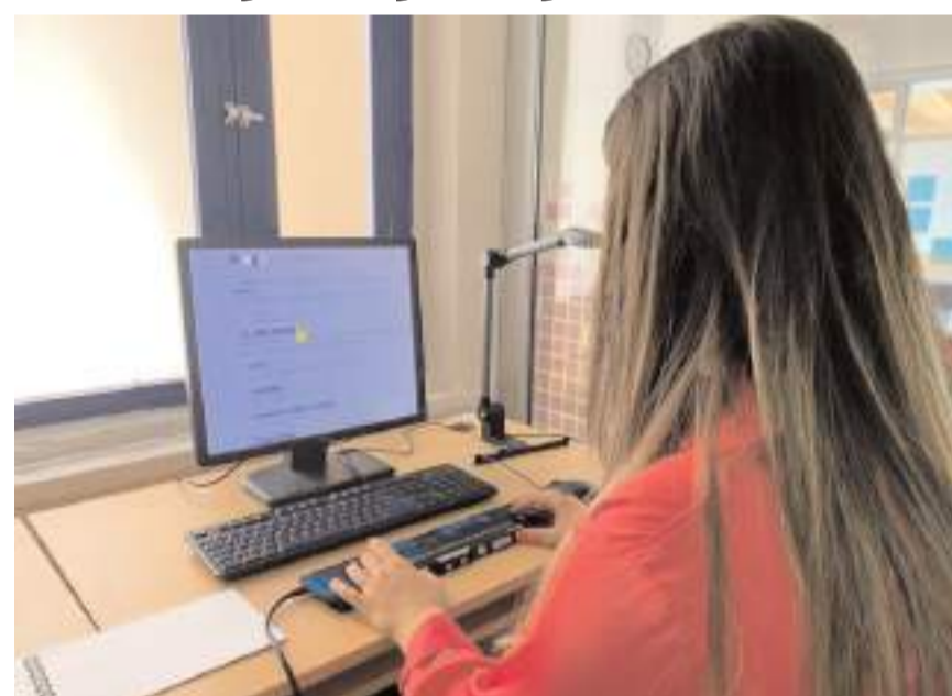
Görme engelli öğrenciler için "Braille" tam donanımlı çalışma istasyonu kuruldu.

Kurulan istasyon; görme engelli öğrencilerin hayatlarındaki okuma ve yazma engelini ortadan kaldırmaya yönelik yeni imkanları öğrencilerin hizmetine sunuyor. Kesintisiz okuma özelliği bulunan kabartma ekran, okunacak do-