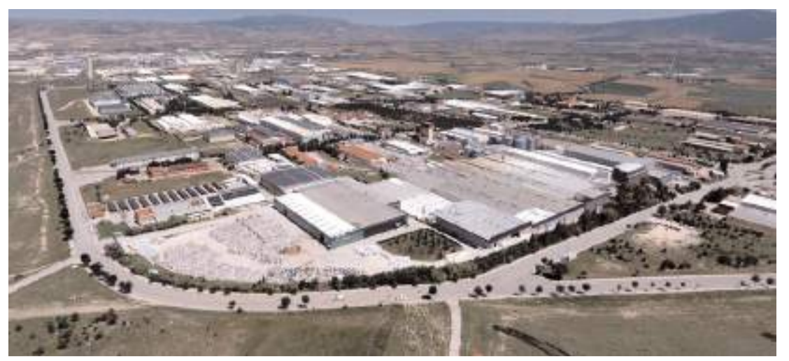
Çorum'dan 2023 yılının ilk 9 ayında 1 milyar 297 milyon dolarlık ihracat yapıldı.