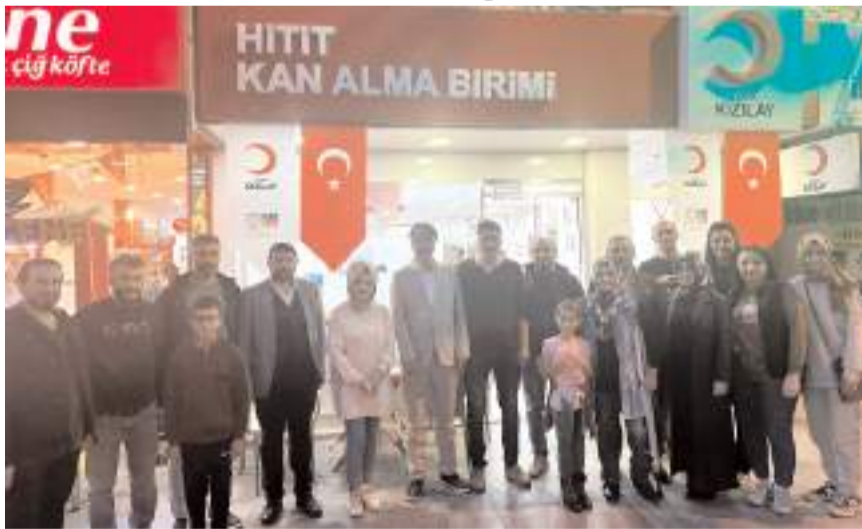
Kan bağıışı Kızılay Hitit Kan Alma Biriminde yapıldı.