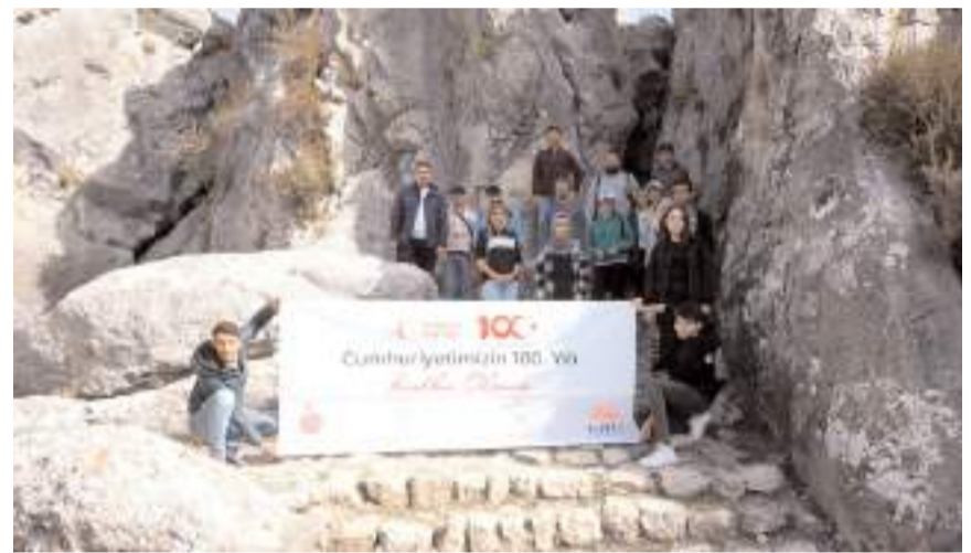
Öğrenciler günün anısına bol bol hatıra fotoğrafı çekindiler.

Öğrenciler, Hitit Yürüyüş Yolu güzergahını da görüntüledi.