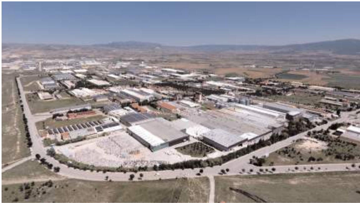
Çorum'dan 2023 yılının ilk 9 ayında 1 milyar 297 milyon dolarlık ihracat yapıldı.