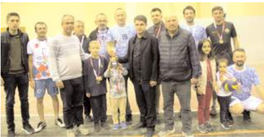
Oğuzlar Cumhuriyet turnuvasında şampiyon olan Esnafspor takımı kupa töreninde