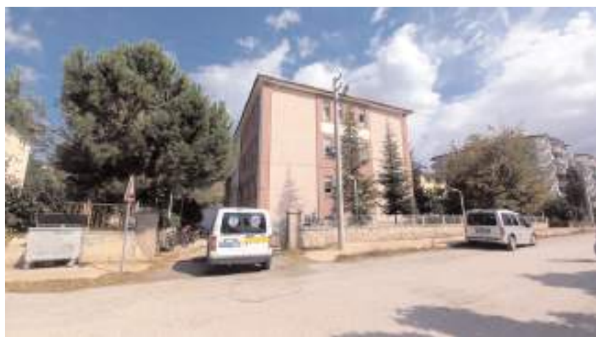
Olay, Ömer Derindere Fen Lisesi'nde meydana geldi.

Osmancık'ta, öğrenim gördüğü okulun 3. kat penceresinden düşen öğrenci yaralandı.