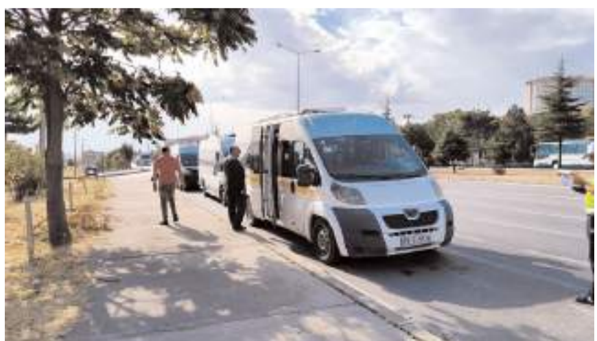
Denetimlerde okul servislerinin eksiklerinin olup olmadığına bakıldı.