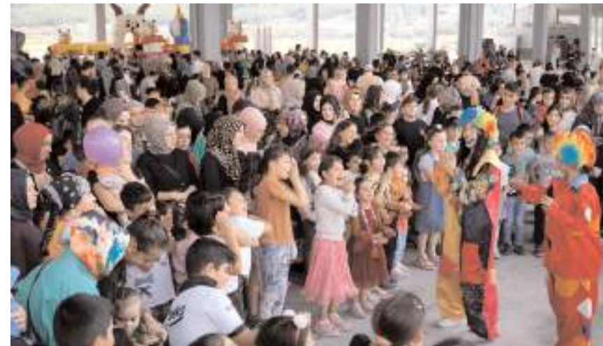
Çocuklar, geleneksel oyun ve gösterilerle eğlenceli vakit geçirdi.