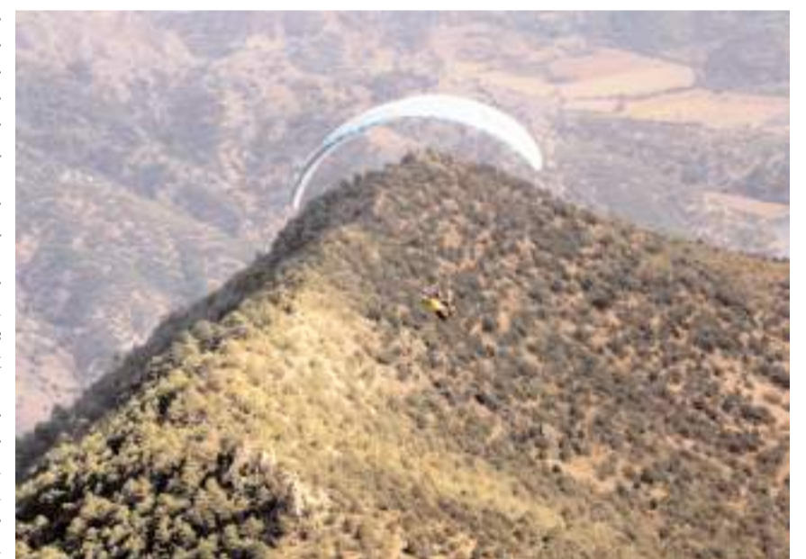
Oğuzlar'da yamaç paraşütü sporunun gelişmesi için çalışılıyor.

uçmayı seven herkesi Oğuzlar'a beklediklerini dile getirerek, "Manzara ve irtifa bakımından bölgemizde uçuşa en verimli yer burası. Oğuzlar uçuş yapabilecek nadir yerlerden biri." diye konuştu.(AA)