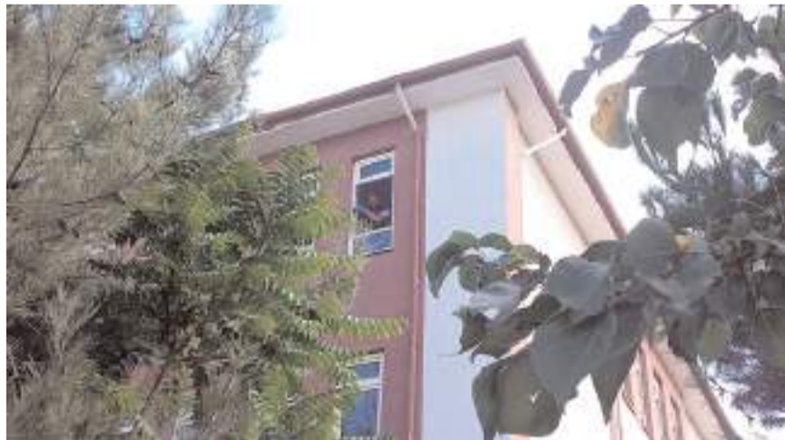
Polis ekipleri olay yerinde inceleme yaptı.