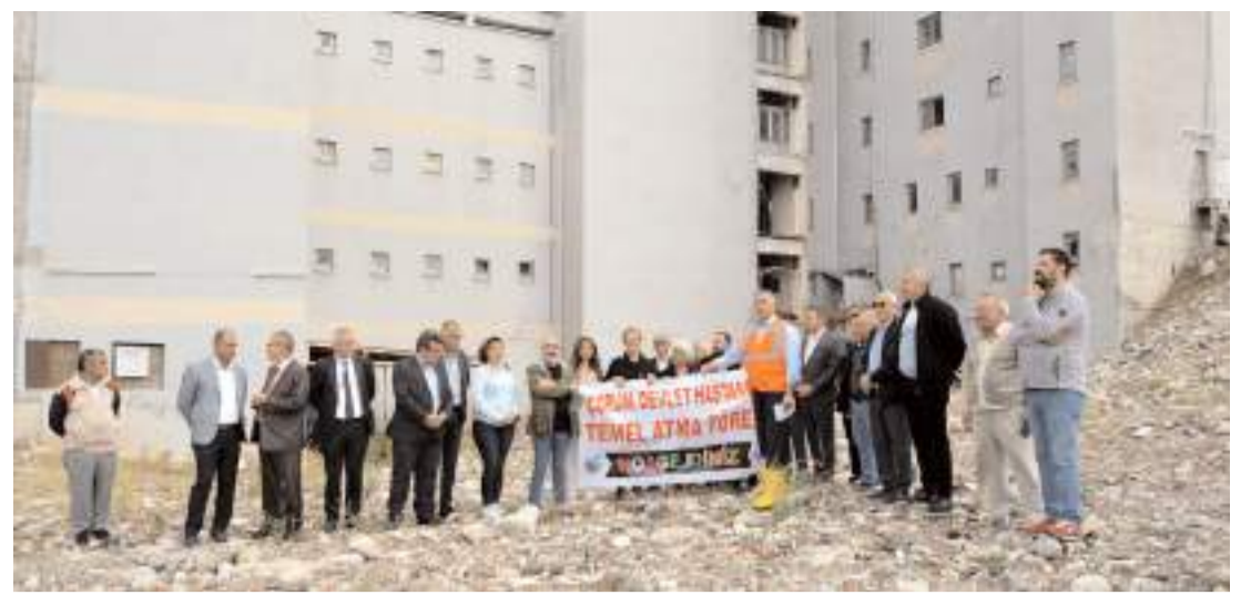
CHP'liler Devlet Hastanesinde temel atma töreni düzenledi.

Hitit Üniversitesi Erol Olçok Eğitim ve Araştırma Hastanesi'ne sevk edilen talihsiz kadın tedavi altına alındı.