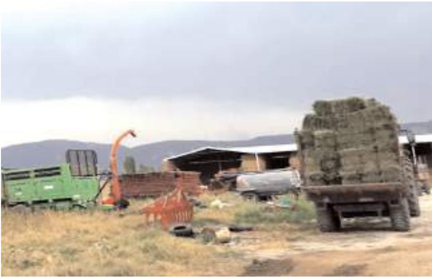
Olay Ahilyas köyü yakınlarında bir çiftlikte meydana geldi.