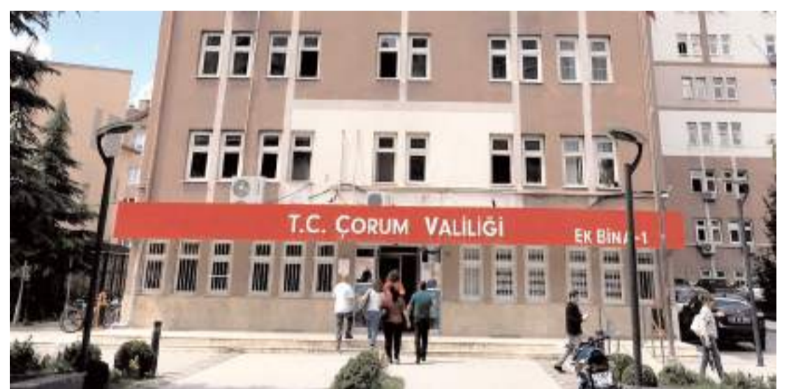
Hasanpaşa Vergi Dairesi Valilik Ek Binasında faaliyete başladı.