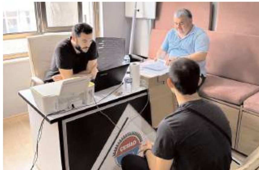
ÇESİAD'a burs için başvuran öğrenciler mülakata alındı.

Ankara ve İstanbul'da gerçekleştirilen mülakatlarda başvuruda bulunan herkese ellerinden geldiği kadarıyla yardımcı olacaklarını belirten ÇESİAD yetkilileri, Çorumlu iş adamlarından ve bürokratlardan daha fazla öğrenciyi destek olmak destek vermelerini beklediklerini ifade ettiler.