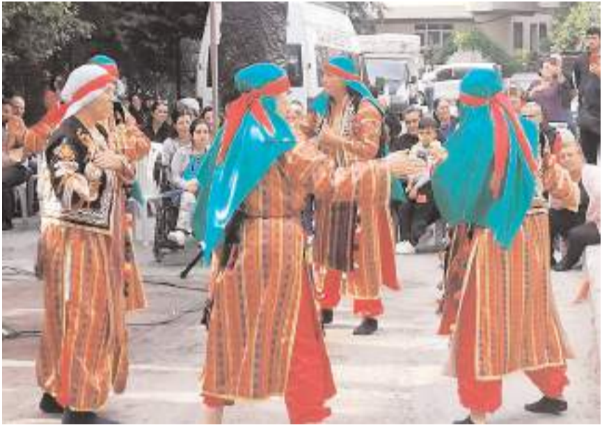
Programda semah gösterisi yapıldı.