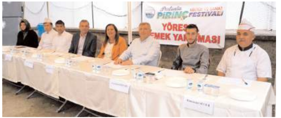
Jüri üyeleri yarışmaya katılan yemekleri değerlendirdi.