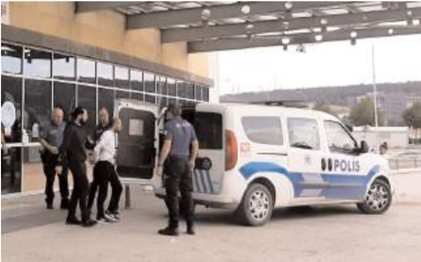
Yakalanan şüpheli çıkartıldığı mahkeme tarafından tutuklanarak cezaevine gönderildi.

Burada acil servis önünde polis otosundan indiği sırada koşarak kaçmaya çalışan zanlı, narkotik polisleri ile hastanede görevli polis ve jandarma ekiplerince hastaneye yaklaşık 500 metre mesafedeki Oto Galerisite'sinde yakalandı.