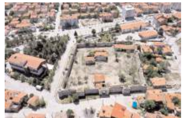
İhale kapsamında kalenin bedenlerinin restorasyonu, aydınlatma çalışması ve kale etrafının drenaj hattı yapılacak.

■ Çorum'da babasının kullandığı traktörün altında kalan bir yaşındaki bebek hayatını kaybetti. * HABERİ3'TE