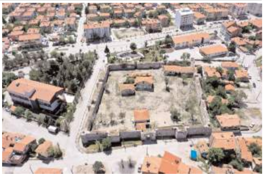
İhale kapsamında kalenin bedenlerinin restorasyonu, aydınlatma çalışması ve kale etrafının drenaj hattı yapılacak.

Şehrin kültürel varlıklarının korunması adına çok önemli bir adımı attıklarını belirten Başkan Aşgın, Selçuklu mirası olan 1100 yıllık Çorum Kalesi'nin şehrimizin en önemli tarihi eserlerinden birisi olduğunu vurgu yaptı. Tarihi kalenin Çorum'un kimliği ve geleceği açısından son derece önemli bir yapı olduğunu