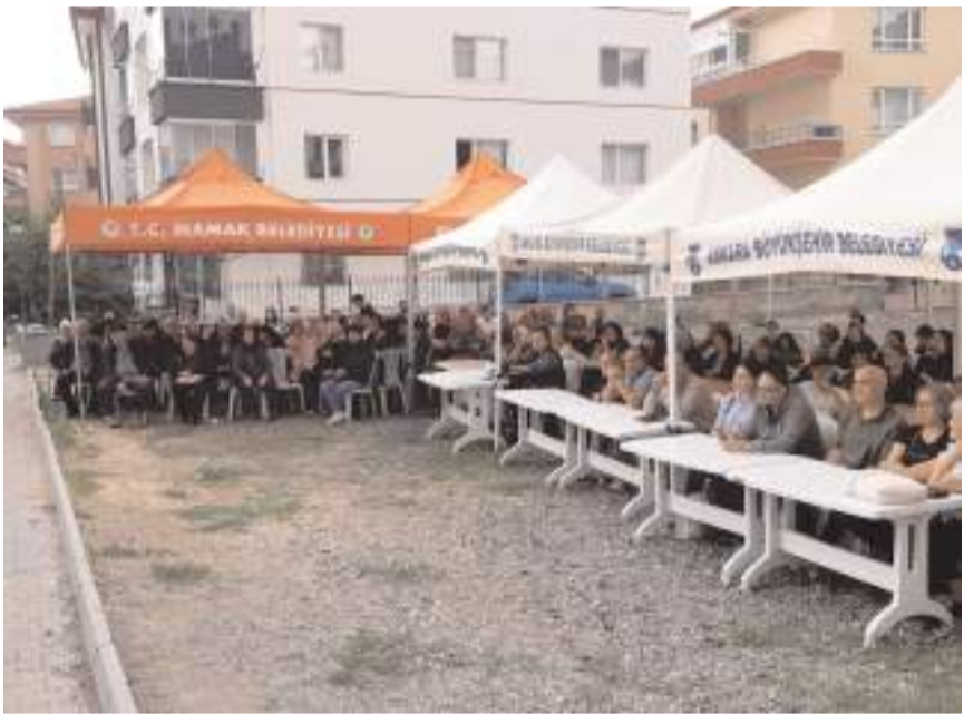
Program Ankara Mamak Şahintepe Mahallesi'nde bulunan Vakıf Cemevi önünde yapıldı.