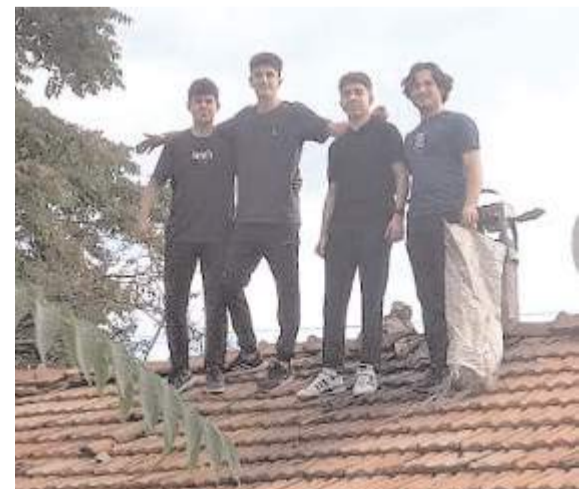
Gençler yaşlı kadının yardım talebi kabul ederek bacayı temizlediler.

■ Tarihi Çorum Kalesi'nin restorasyon ihalesi yapıldı. Çorum Belediyesi, Selçuklu mirası olan 1100 yıllık tarihi kaleyi turizm kazandıracak. * HABERİ11'DE