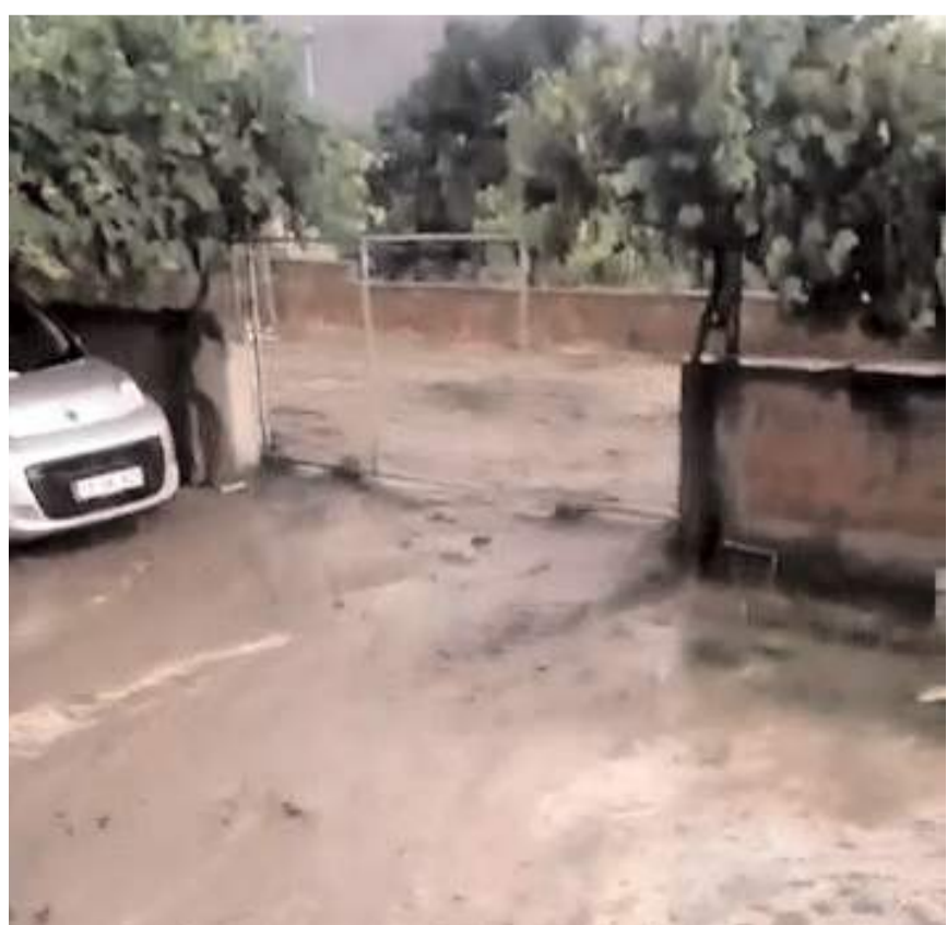
Sel, Gürleyik Mahallesi Uzunkavak yolunda meydana geldi.

Sağanak yağış sebebiyle Gürleyik Mahallesi Uzunkavak yolu adeta dereye döndü. Yoldan gelen sel bir vatandaşın cep telefonu kamerasına yansıdı. Görüntülerde Uzunkavak yolundan gelen sel sularının çevredeki evlerin bahçelerine dolduğu görülüyor. Görüntüleri kaydeden mahalle sakini, her sağanak yağıştan sonra aynı manzaraya şahit olduklarını ifade ederek, önlem alınmasını istedi. (İHA)