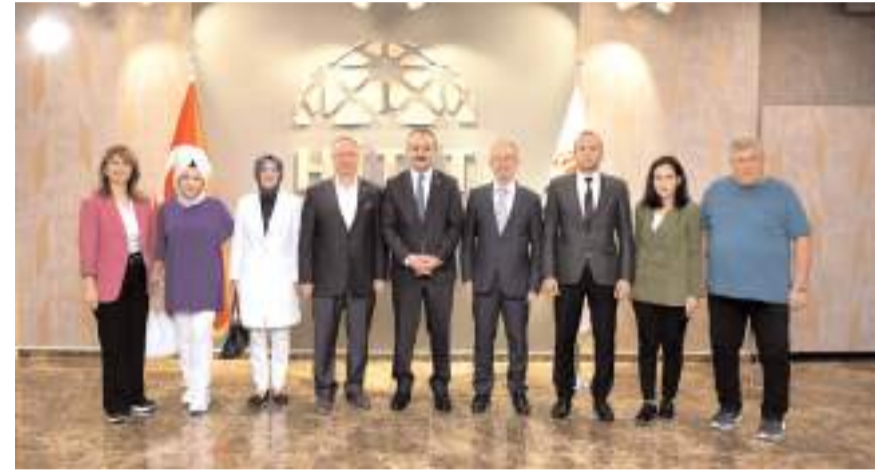
Ziyaretin sonunda toplu hatıra fotoğrafı çekildi.

Ziyaretten duyduğu memnuniyeti dile getiren