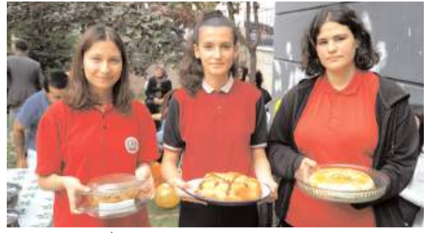
Osmancık Bursa İstanbul Mesleki ve Teknik Anadolu Lisesi Aşçılık Bölümü öğrencileri 'en güzel ırgat böreği' yarışmasında derece elde ettiler.