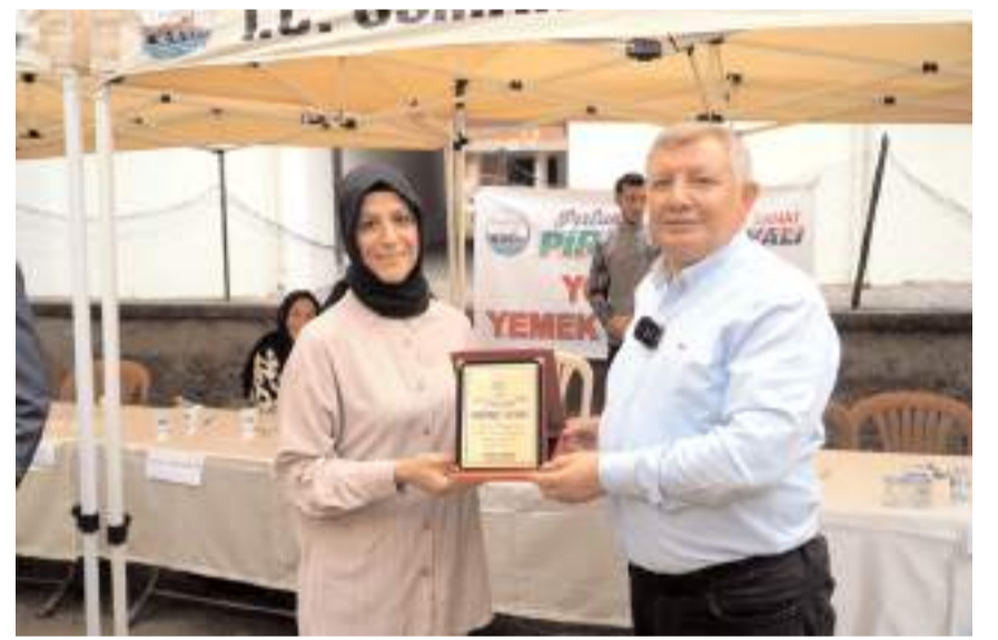
Yarışmada derece elde edenlere plaket ve ödül verildi.