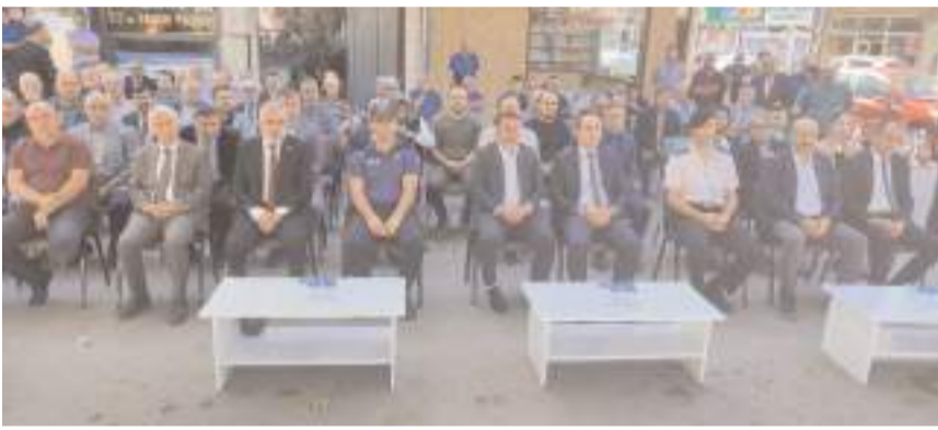
Ahilik Haftası nedeniyle tören yapıldı.