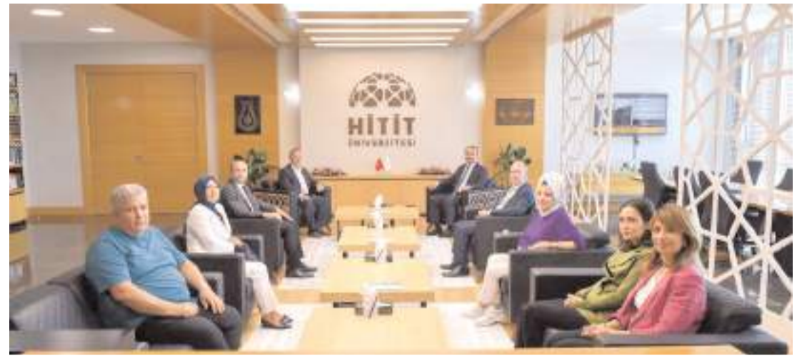
Ziyarete birlikte yapılabilecek projeler istişare edildi.

Örgütü'nün önerdiği ve yürütülen programa göre bebeklerin doğumdan hemen sonra emzirmeye başlatılması, ilk 6 ay sadece anne sütü verilmesi ve 6. aydan sonra uygun besinlerle beraber emzirmenin 2 yaşına kadar sürdürülmesi temel mesajdır." (Haber Merkezi)