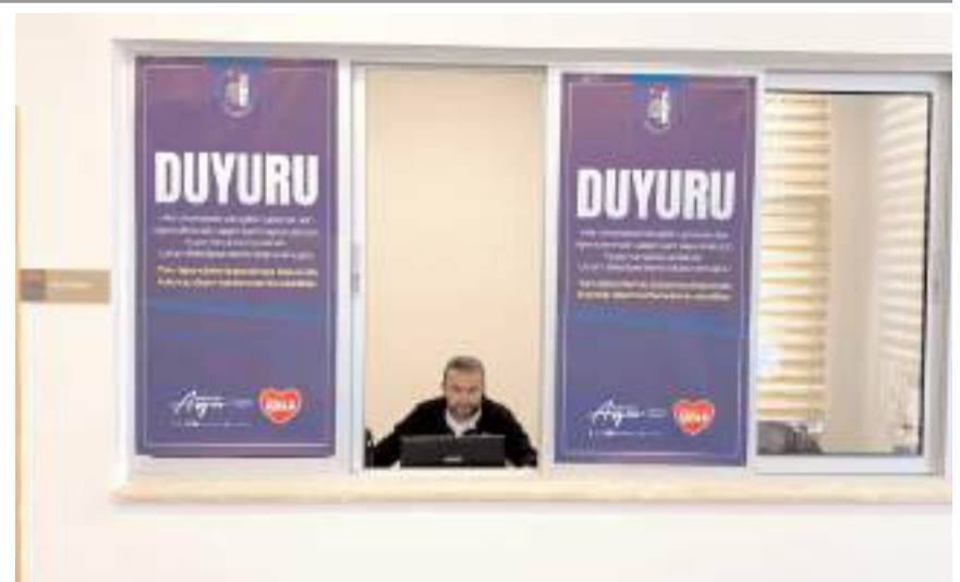
Belediye Hitit Üniversitesi Kuzey Kampus içerisinde, ulaşım kartı başvuru standı açtı.

Öte yandan Çorum Belediyesi abonman kartı uygulamasıyla tüm öğrencilere indirimli toplu taşıma hizmeti sunmaya devam edecek. Tüm öğrenciler, isterlerse aylık 275 TL'ye 90 binış, isterlerse 350 TL'ye sınırsız binış abonman kartları alabilecekler.