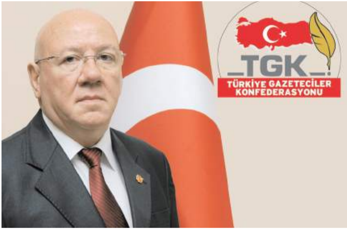
Türkiye Gazeteciler Konfederasyonu Genel Başkanı Nuri Kolaylı

Gazete sayısı 2019'da 1.075, 2020'de 1.051, 2021'de 996, 2022'de 964 iken 2023'te beklemedeki 10 gazete ile birlikte 872'ye düşmüştür. Söz konusu gazetelerde istihdam edilen fikir işçisi sayısı 2019'da 7 bin 593 iken 2022'de bu sayı 6 bin 687'ye inmiştir.