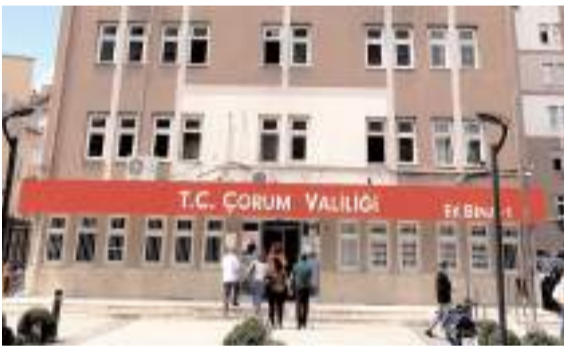
Hasanpaşa Vergi Dairesi Valilik Ek Binasında faaliyete başladı.