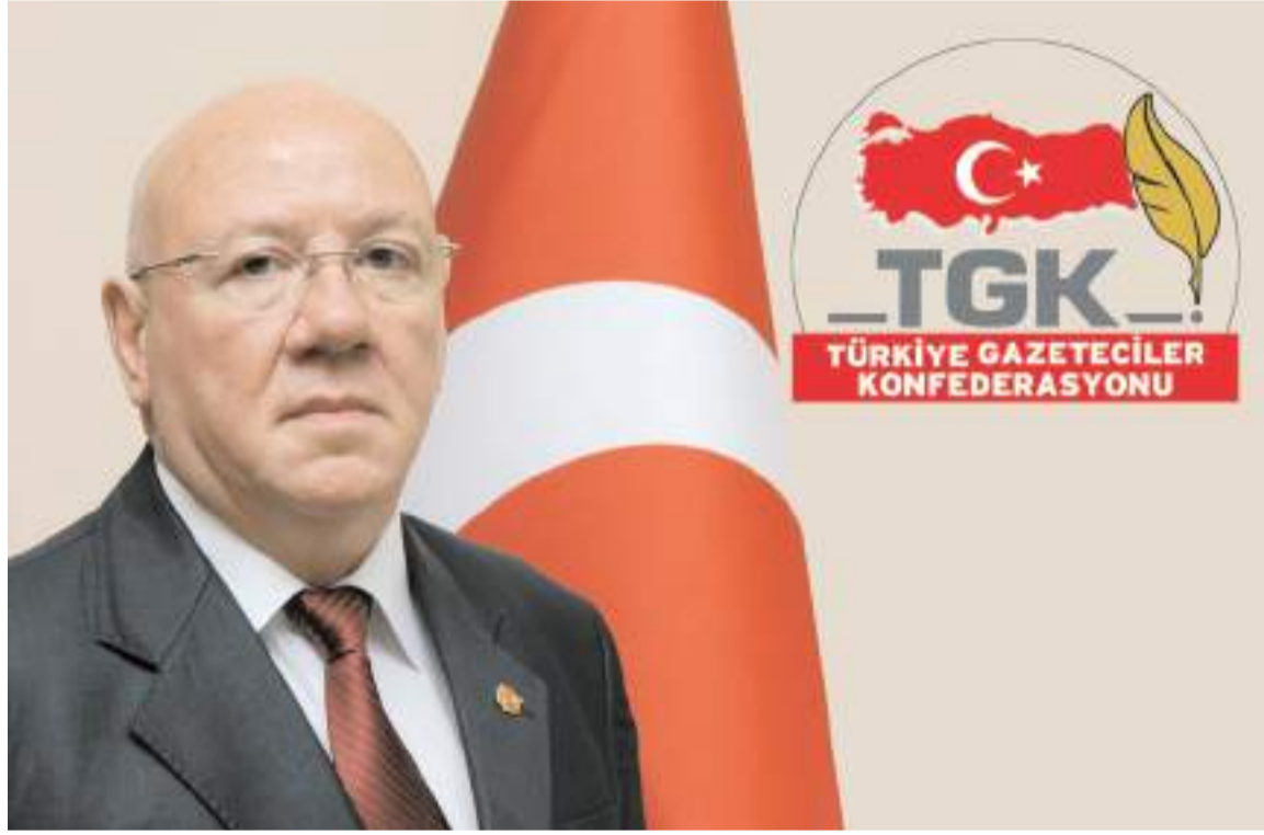
Türkiye Gazeteciler Konfederasyonu Genel Başkanı Nuri Kolaylı

Türkiye Gazeteciler Konfederasyonu Genel Başkanı Nuri Kolaylı, yaptığı açıklamayla basın sektöründe yaşanan ağır ekonomik sorunlara dikkat ederek, "Gelişmiş demokratik sistemin vazgeçilmez unsuru olan basın sektörü, tarihinin en zor ekonomik krizlerinden birini yaşıyor" dedi. * HABERİ8'DE