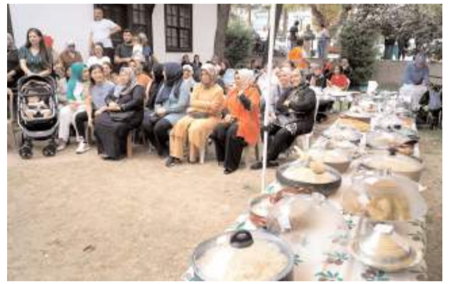
Yarışmaya katılım yüksek oldu.