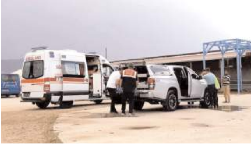
Jandarma ekipleri olay yerinde inceleme yaptı.

Çorum'da babasının kullandığı traktörün altında kalan bir yaşındaki bebek hayatını kaybetti.