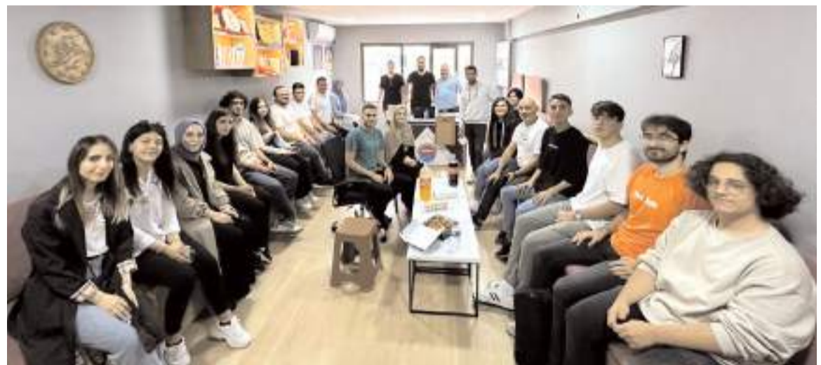
ÇESİAD'ın öğrenci burslarına ilgi yüksek oldu.

tek kullanımlık bardaklarda sunuyoruz. Uygulama 2 Ekim 2023 tarihinden başlayacak ve 31 Mart 2024 tarihine kadar sürecek. Hüdaverdi Arıcılık, ürün çeşitliliği ve kalitesinde gösterdiği farklılığı müşteri ilişkilerinde de göstermektedir. Veli nimet olarak gördüğü müşterilerini, saygın bir misafir olarak karşılama Hüdaverdi Arıcılık, Çakır Camii karşıları Taşhan Caddesi 77 /A adresinde faaliyetini sürdürmektedir" dedi. (Haber Merkezi)