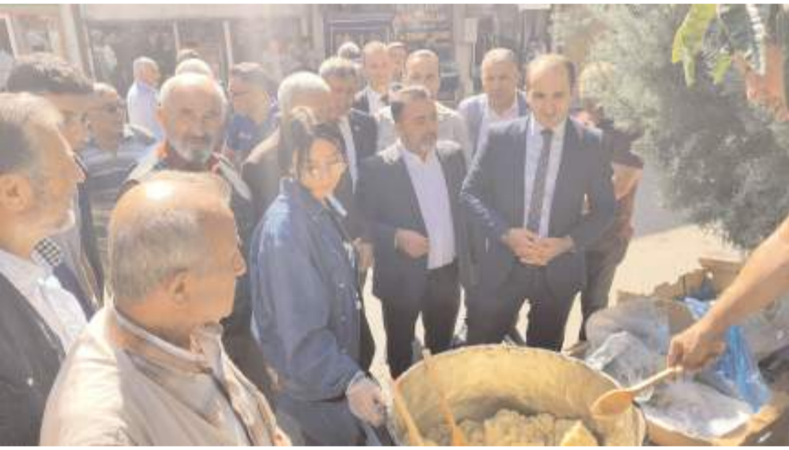
Etkinlikte katılımcılara helva ve ekmeğe ikram edildi.