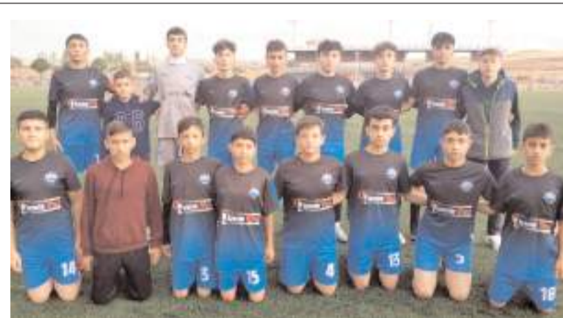
İskilipgücü U 15 takımının ikinci maçında Alaca deplasmanından üç puanla dönmeyi başardı