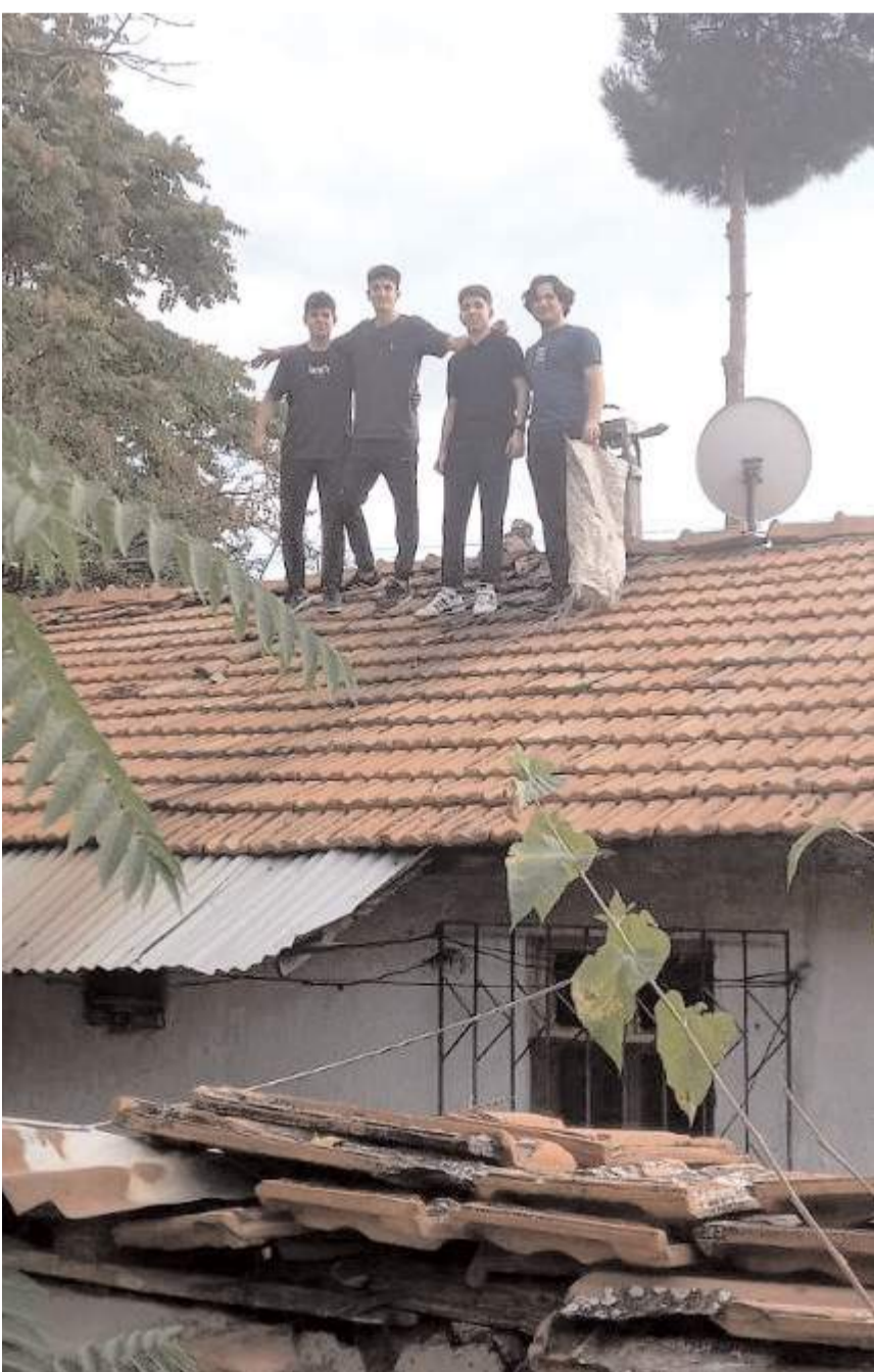
Gençler yaşlı kadının yardım talebi kabul ederek bacayı temizlediler.

Baca açıldıktan sonra yaşlı kadın öğrencilere çay ikramında bulunurken, öğrencilerin örnek davranışı vatandaşların da takdirini topladı. (İHA)