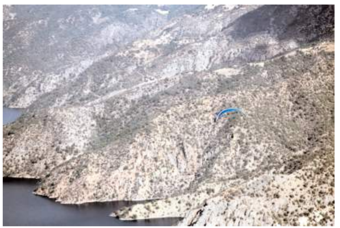
Yamaç paraşütü uçuşu 1450 metre yükseklikteki Tekke Yaylası'ndan yapılıyor.

Denetimlerde eksiklikleri olduğu tespit edilen araçlara uyarı yapılarak, eksikliklerini gidermelerini istendi.(AA)