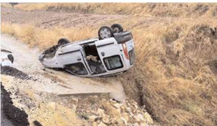
Kaza Çorum-Laçın kara yolunun 17. kilometresinde meydana geldi.

Yaralıları, sağlık ekiplerince yapılan müdahalenin ardından Hitit Üniversitesi Erol Olçok Eğitim ve Araştırma Hastanesi ile kentteki özel bir hastaneye kaldırıldı.(AA)