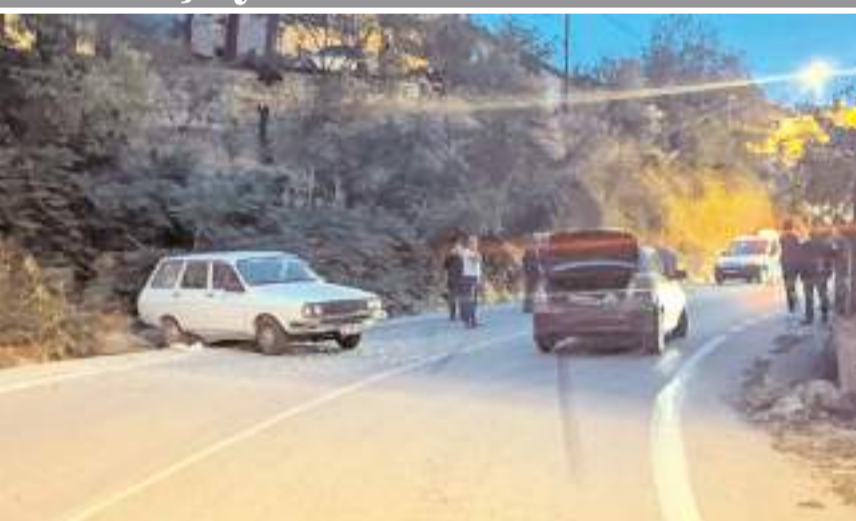
Kaza Maden Caddesi'nde meydana geldi.

Sağlık ekiplerince Dodurga Devlet Hastanesi'ne kaldırılan yaralılar, buradaki ilk müdahalenin ardından Hitit Üniversitesi Erol Olçok