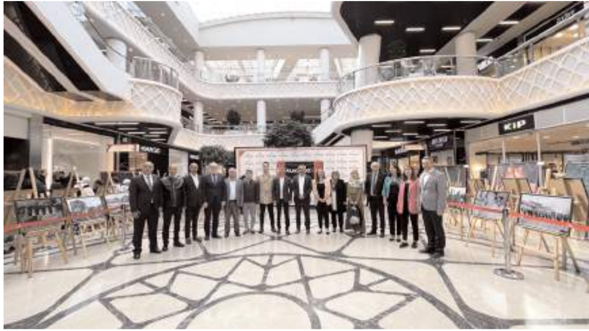
"Cumhuriyetin 100'üncü yılına 100 Etkinlik Projesi" kapsamında AHL Park'ta fotoğraf sergisi açıldı.

Projede özellikle gençleri hedef aldıkları