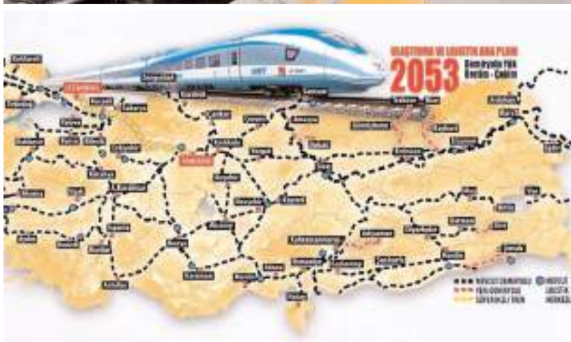
Çorum'dan geçecek demir yolu projesi Samsun'dan bütün Karadeniz sahilinden de geçerek sınıra kadar gidecek.