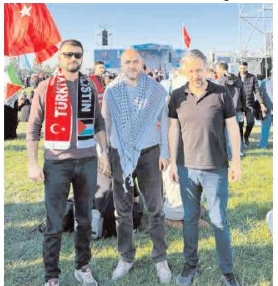
Mitinge Çorum'dan da katılım oldu.

san ayağa kalkmış durumda. 75 yıldır Filistin halkına çoluk çocuk demeden, ırz namus demeden köpekçe saldıran Siyonist İsrail'in artık sonu geldi biz inanıyoruz ki Filistin halkının bu onurlu mücadelesi yüce Rabbimizin de yardımıyla zaferle neticelecektir" dedi. (Haber Merkezi)