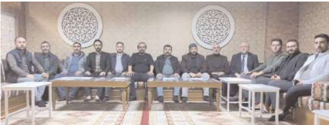
Gerçekleştirilen basın toplantısı ile Medeni Gençlik Platformu tanıtıldı.

Biz, Medeni Gençlik Platformu olarak, Devletimiz'in ve Milletimiz'in bekası için, İslam'ın nuru altında bir nesil olma gayretindeyiz, geleceği inşa ediyor ve çağa nizam veriyoruz."