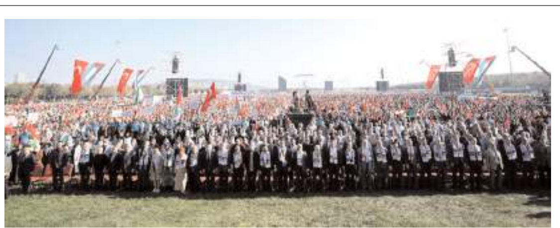
İstanbul'da Maltepe meydanında yapılan mitinge katılım yüksek oldu.