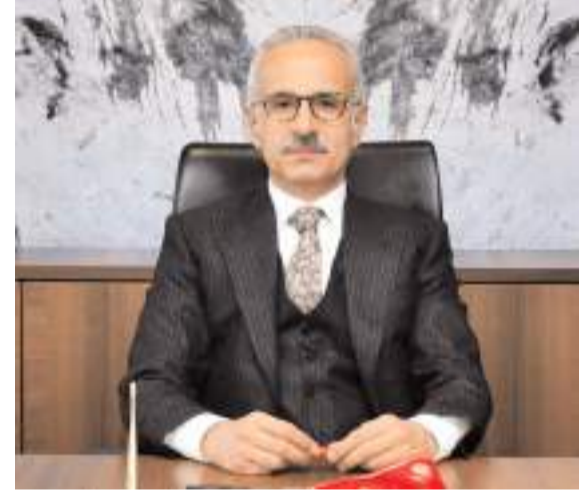
Ulaştırma ve Altyapı Bakanı Abdülkadir Uraloğlu