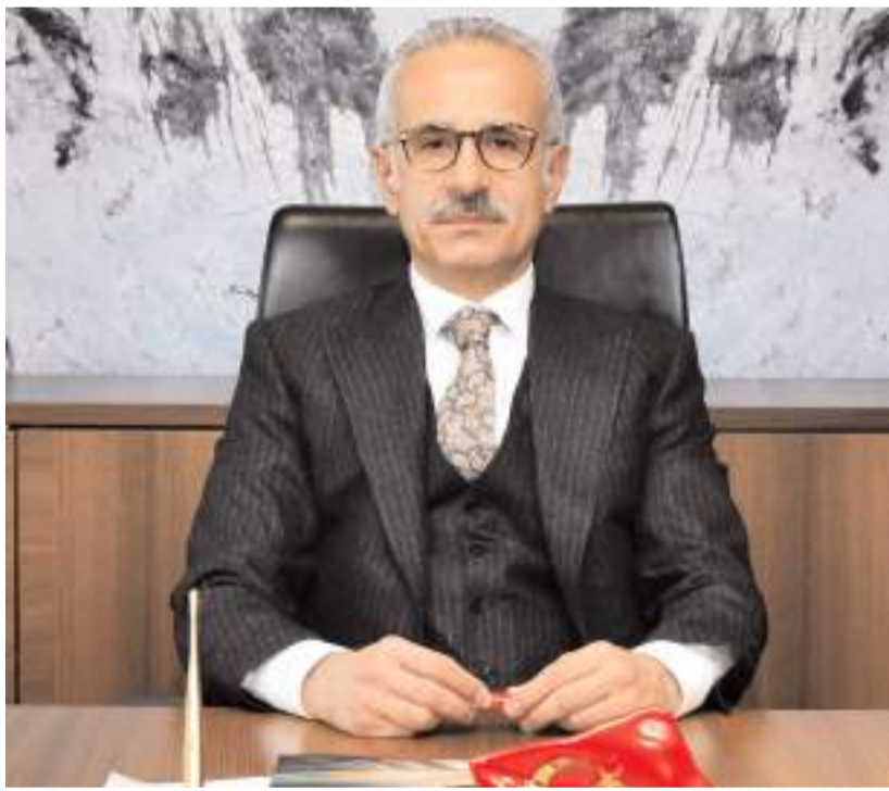
Ulaştırma ve Altyapı Bakanı Abdülkadir Uraloğlu