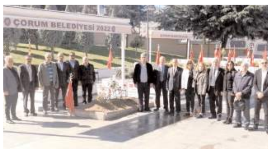
TEMAD Çorum Şubesi ve Türkiye Harp Malulü Gaziler, Şehit, Dul ve Yetimler Derneği Çorum Şubesi yöneticileri Şehitliği ziyaret etti.