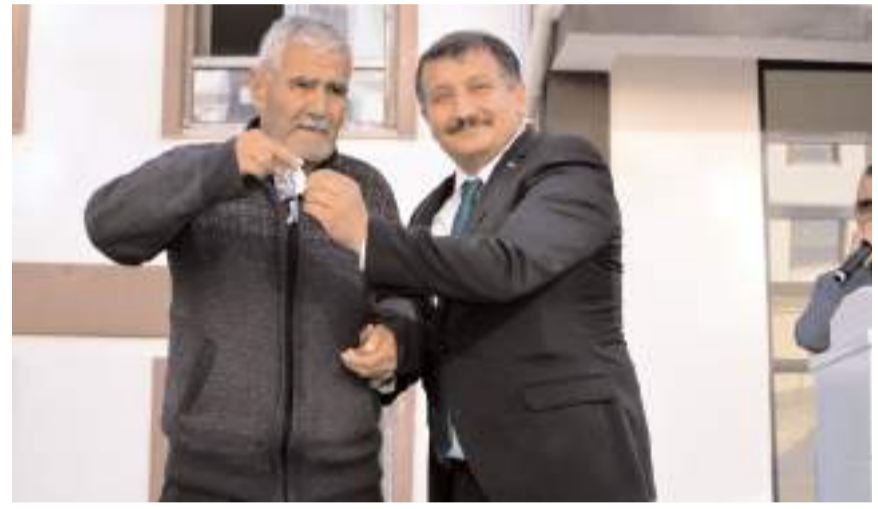
İlk etapta 45 hak sahibine konutları teslim edildi.

Gergin anların yaşandığı tören ilk etapta belirlenen 45 kişiye anahtarlarının teslim edilmesiyle sona erdi.