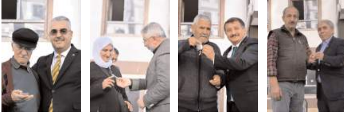
Dün yapılan törende ilk etapta 45 hak sahibine konutları teslim edildi.

■ Toplu Konut İdaresi Başkanlığı (TOKİ) tarafından Silmkent'te inşa edilen 752 konutun 45 tanesi düzenlenen törenle teslim edildi. Konutlar TOKİ tarafından belirlenen takvime göre hafta içinde teslim edilmeye devam edecek. * HABERİ 2'DE