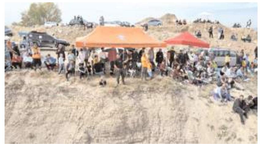
Yarışlara vatandaşların ilgisi yüksek oldu.