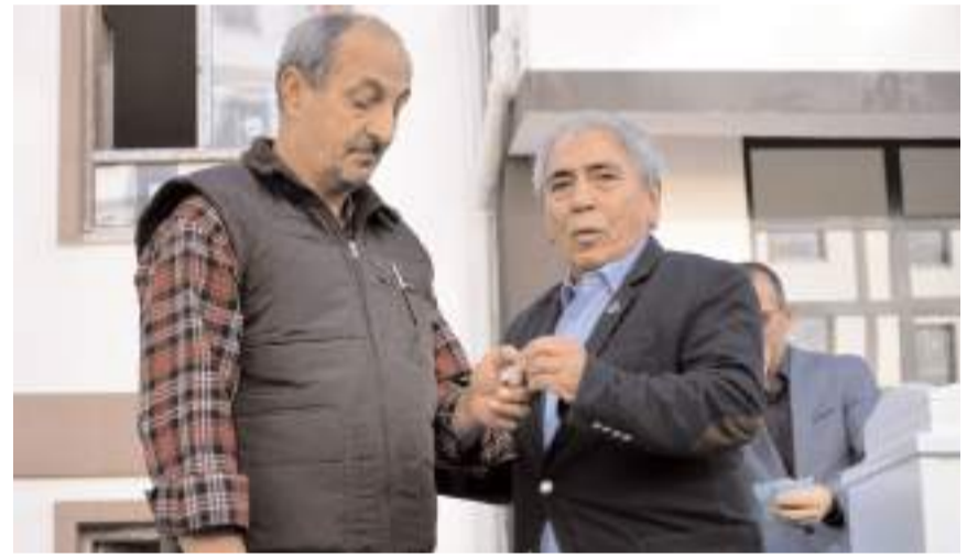
Konutların teslimi nedeniyle tören yapıldı.