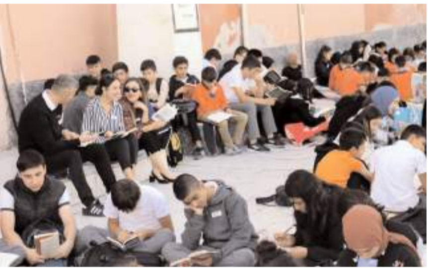
Öğrenciler, Cumhuriyet temalı kitaplar okudu.