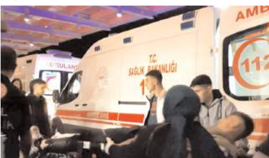
Yaralı şahıs hastanede tedavi altına alındı.

2 zanlının yakalanması için çalışma başlatıldı. (AA)