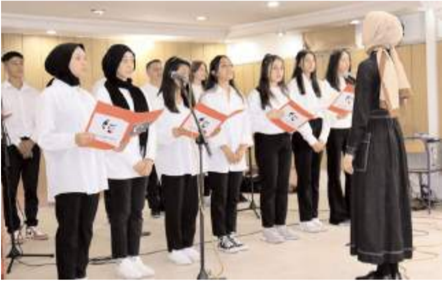
Proje kapsamında çeşitli etkinlikler yapılıyor.