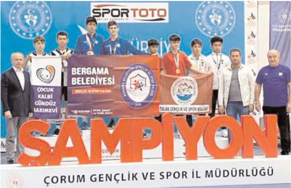
Çorum Gençlik ve Spor İl Müdürlüğü

Sporcuların aldığı derecelere göre yapılan puanlama sonrasında; kulüp sıralamasında birinci Ankara Genç Yıldızlar Spor Kulübü olurken, ikinci İzmir Bergama Belediyesi Spor Kulübü, üçüncü ise Eskişehir DSİ Bentspor Kulübü oldu.