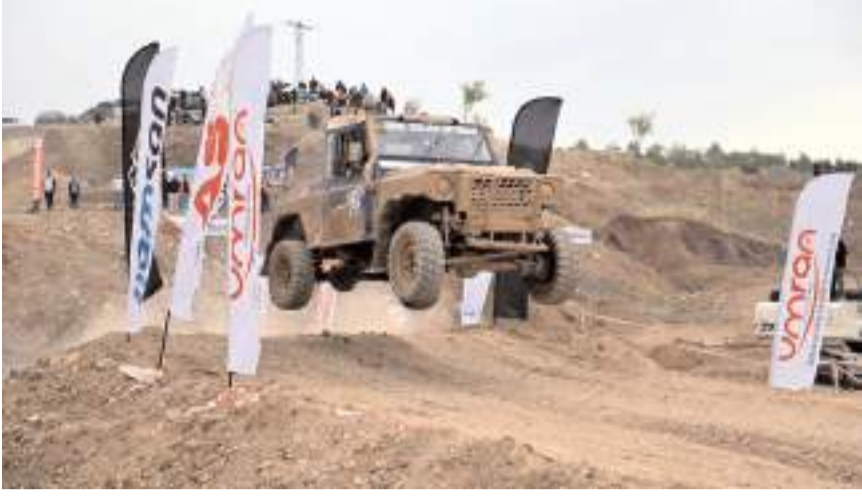
Çorum Off-Road Festivali hafta sonu yapıldı.

■ Çorum Belediyesi ve Çoroff Team Offroad Arama ve Kurtarma Derneği işbirliğinde yapılan Off-Road Festivali nefes kesen yarışlara sahne oldu. * HABERİ 6'DA