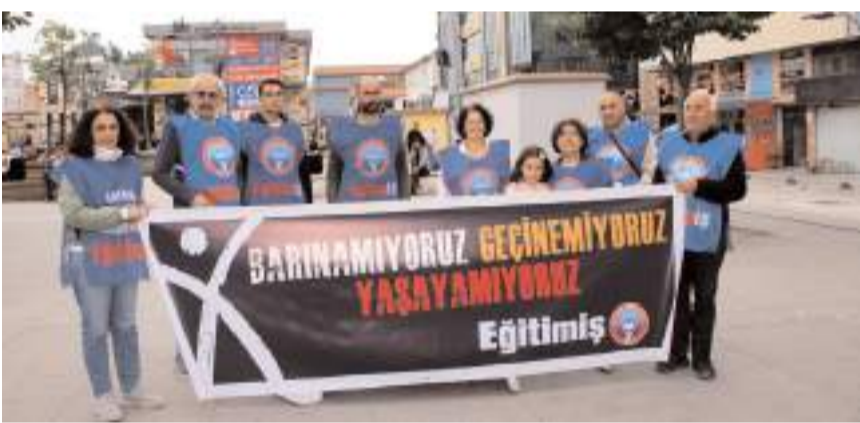
Basın açıklaması Kadeş Meydanında gerçekleştirildi.