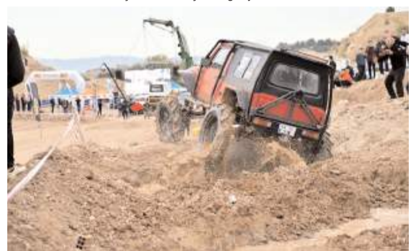
Festival zorlu parkurda nefes kesen yarışlara sahne oldu.