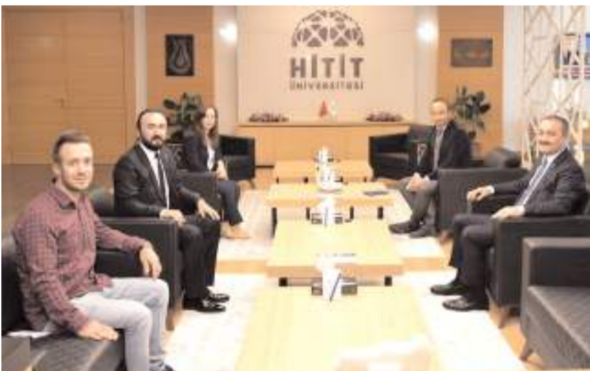
Ziyarette öğrencilere yönelik yapılabilecek faaliyetler ile ilgili istişarede bulunuldu.