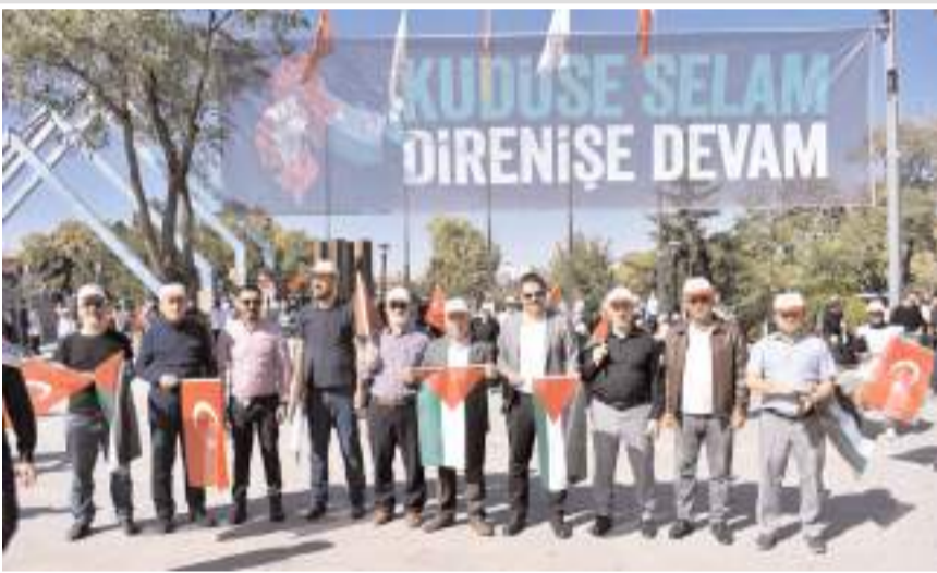
Mitinge Çorum'dan da katılım oldu.

Köroğlu, Filistin'in şanlı direnişini desteklediklerini de ifade etti.