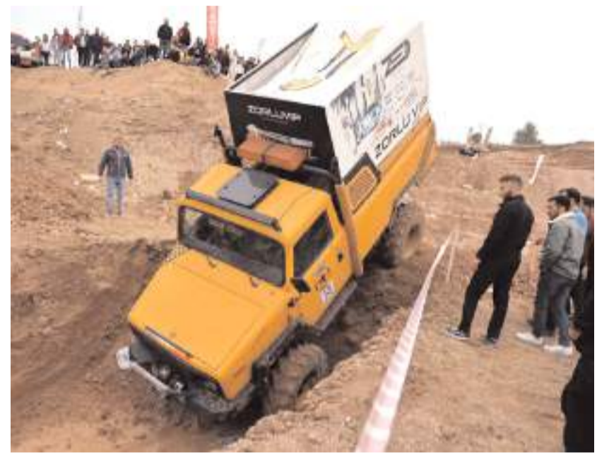
Yarışlar 6 kategoride yapıldı.