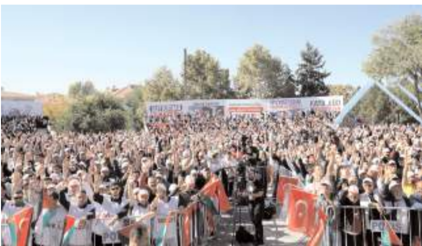
Miting Anıtpark'ta yapıldı.