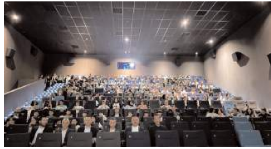
Öğrenciler "Yıldız Tozu" adlı filmi izledi.

"Gençlerimizde cumhuriyet bilinci ve şuuru oluşturmak istiyoruz. Müzik yarışmaları, resim sergileri, gösteriler gibi etkinliklerimizin tamamında 100. yıla ilgili başlıklar var. Bu projenin çıkış noktası şu. Türk milleti çok büyük devletler kurdu ancak bunlardan bildiğim kadarıyla 4 veya 5 tanesi 100 yıldan fazla yaşadı. Bunlardan biri de Türkiye Cumhuriyeti. Bu bilinci çocuklarımıza aşılamamız gerekiyor. Bugün buralara geldiysek, bu mekanlar