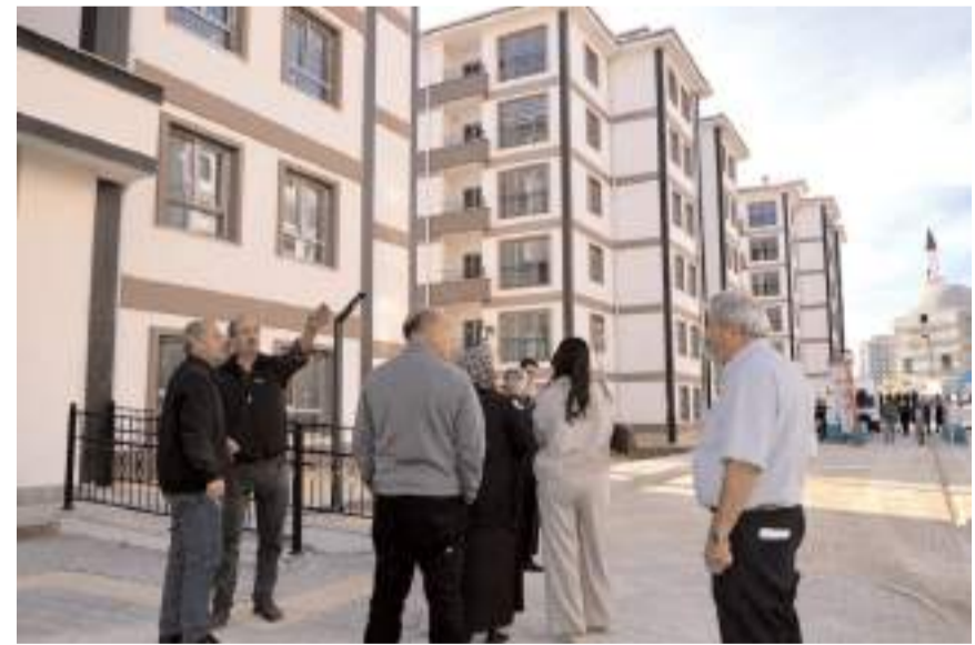
Konutlar hafta içinde etaplar halinde teslim edilmeye devam edecek.