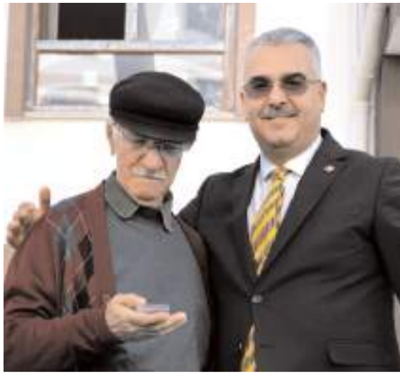
Silmkent TOKİ'de inşaatı tamamlanan konutlar teslim edilmeye başladı.