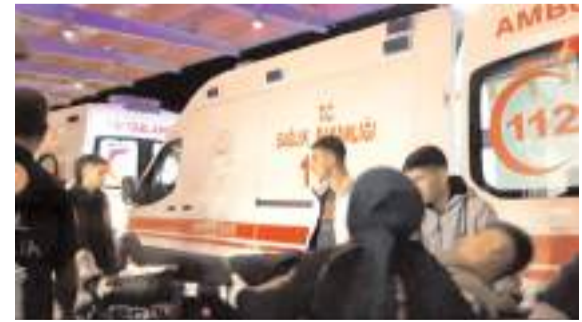
Yaralı şahıs hastanede tedavi altına alındı.