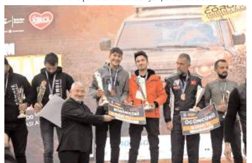
Yarışlarda derece elde edenlere ödülleri verildi.