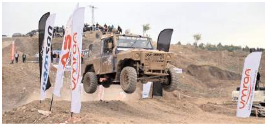
Çorum Off-Road Festivali hafta sonu yapıldı.