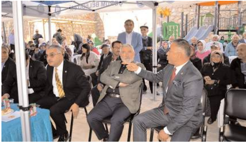
CHP Çorum Milletvekili Mehmet Tahtasız, konutların zamanında teslim edilmemesine tepki gösterdi.

■ Törende CHP Çorum Milletvekili Mehmet Tahtasız ile Belediye Başkanı Halil İbrahim Aşgın arasında yaşanan gerilim damga vurdu. * HABERİ 2'DE