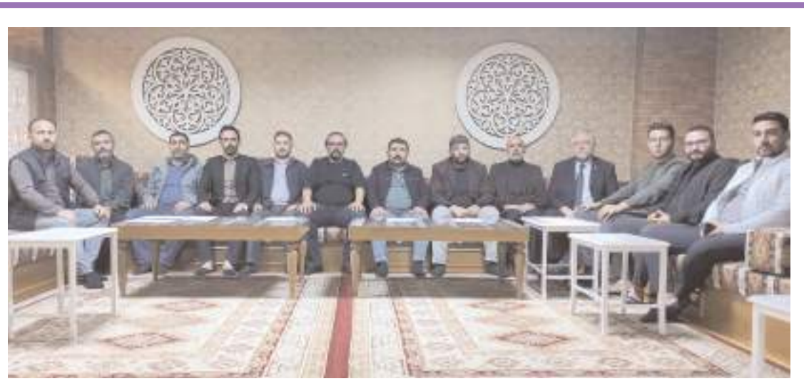
Gerçekleştirilen basın toplantısı ile Medeni Gençlik Platformu tanıtıldı.

■ Çorum Belediyesi ve Çoroff Team Offroad Arama ve Kurtarma Derneği işbirliğinde yapılan Off-Road Festivali nefes kesen yarışlara sahne oldu. * HABERİ 6'DA