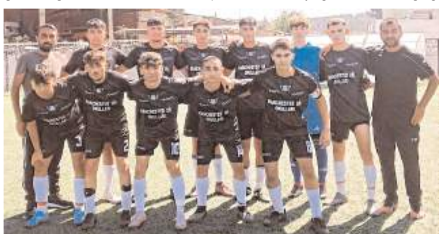
B grubunda dört maçında kazanan Hattuşa Gençlikspor gruptan çıkmayı garantiledi

B grubunda ise kayıpsız iki takımdan Hattuşa Gençlikspor, Çorumspor önünde 3-0 galip gelirken diğer kayıpsız takım Mimar Sinan Gençlikspor ise Gençlerbirliği karşısında 2-0 galip gelerek yollarına kayıpsız devam ettiler. Bu iki takım ligdeki son maçlar öncesinde final grubuna yükselmeyi başardılar. Bu hafta sonu iki takım arasındaki maç gruptan birinci ve ikinci çıkacak takımları belirleyecek.