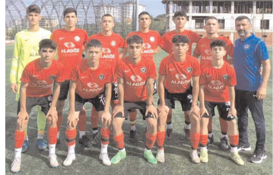
Çorum FK U 17 takımı bugün evinde Kırşehir önünde üç puanla ayrılmak istiyor