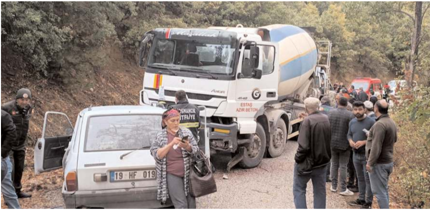
Kazada otomobilde maddi hasar meydana geldi.