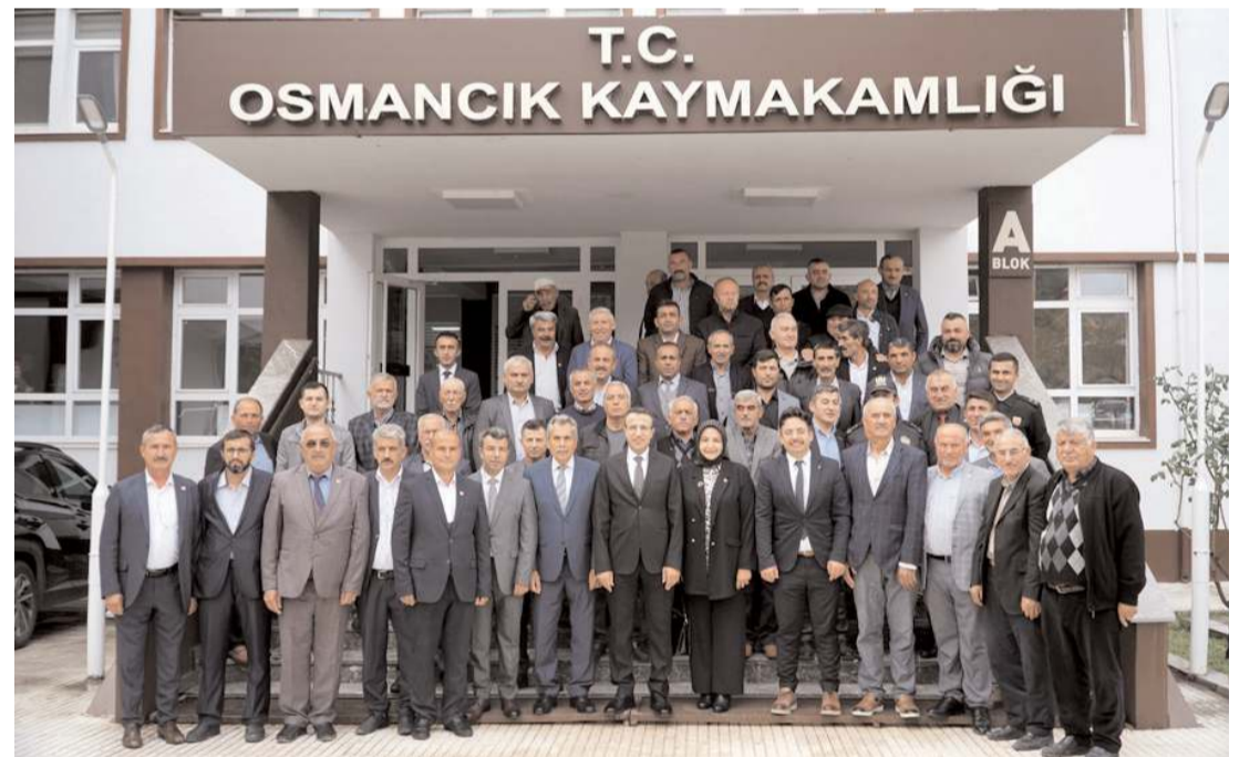
Osmancık'taki tören Hükümet Konağı bahçesindeki Atatürk Anıtı'nda yapıldı.

lıdır. Bu dönemlerde iyodun mutlaka çok iyi alınması, bebeğin fiziksel ve zihinsel gelişimi için çok önemlidir. Artık ülkemizde de sadece iyot içeren preparatlar bulunmaktadır. Buna karşılık mevcut tiroid hastalığı varsa, iyotlu tuz yemekten kaçınmak gerekir, iyot kullanımını hastalığı daha da şiddetlendirebilir. İyotsuz tuzlar marketlerde bulunabilmektedir, bu tuzların üzerinde "İyotsuz Tuz" diye yazmaktadır. İyotsuz tuzların en fazla 250 gramlık ambalajlarda üretimine izin bulunmaktadır. İyotsuz tuz bulunamıyorsa, kaya tuzu kullanılabilir. Ailede bir kişinin iyotsuz yemesi gerekiyorsa, yemekler tuzsuz pişirilmeli, sonrasında herkes kendi tuzunu kullanmalıdır. İyotsuz tuz kullanması gereken kişiler, yoğun iyot içerikleri nedeniyle iyot içeren öksürük şuruplarını, kalpte ciddi ritim bozukluğu tedavisinde kullanılan "Amiodaron" etken maddeli ilaçları, yoğun iyot içeren multivitamin preparatlarını da kullanmamaya özen göstermelidirler. Ayrıca, koroner anjiyografi, tomografi ve bazı böbrek filmi çekimleri sırasında damardan verilen kontrast maddelerin yoğun iyot içerdiği unutulmamalıdır ve bu gibi durumlarda gereken önlem alınmalıdır." (Haber Merkezi)