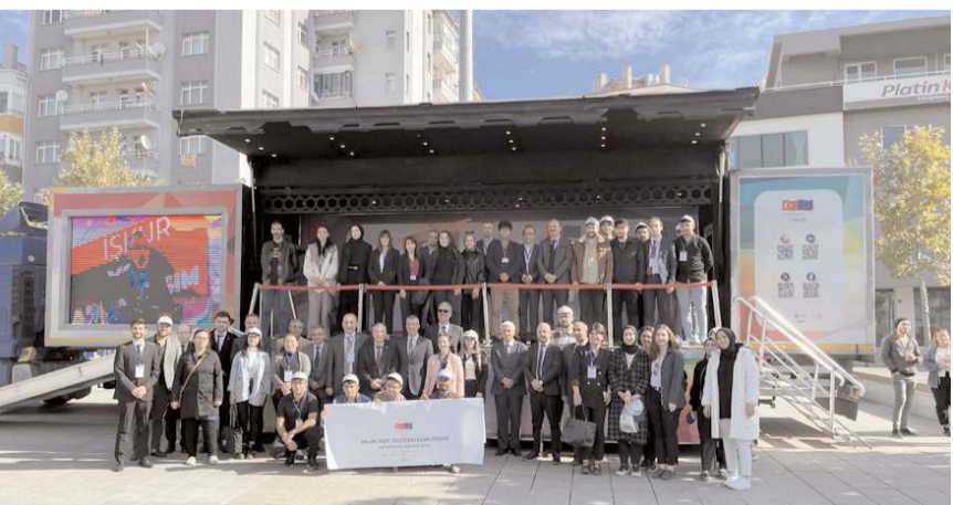
Tırda İŞKUR hizmetleri hakkında bilgi verildi.

Tır, 2 gün boyunca ziyaret edilebilecek.