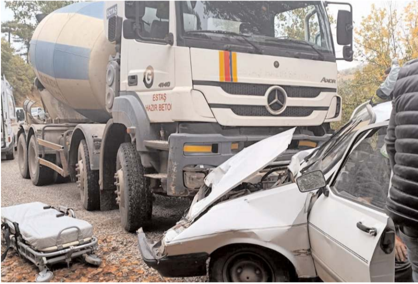
Kaza Fındık köyü yolunda meydana geldi.

Yaralıları, sağlık ekiplerince olay yerinde yapılan müdahalenin ardından Hitit Üniversitesi Erol Olçok Eğitim ve Araştırma Hastanesi'ne kaldırıldı.(AA)