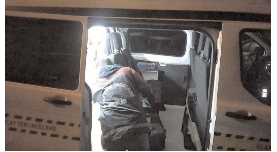
Olayla ilgili soruşturma başlatıldı.