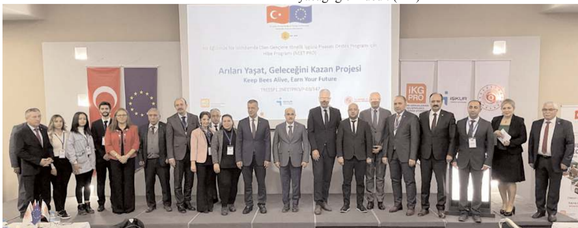
Toplantının sonunda hatıra fotoğrafı çekildi.