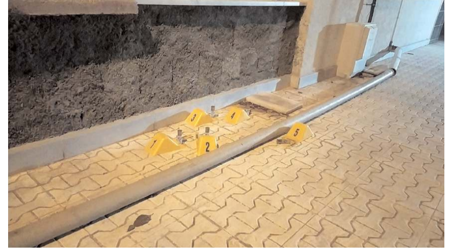
Olay gece saatlerinde Gülabibey Mahallesi'nde meydana geldi.

Olayla ilgili başlatılan soruşturma sürüyor. (İHA)