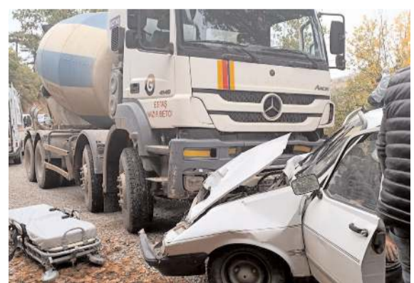
Kaza Fındık köyü yolunda meydana geldi.