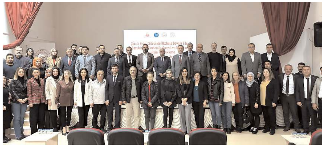
Projenin açılış toplantısının ardından toplu hatıra fotoğrafı çekildi.