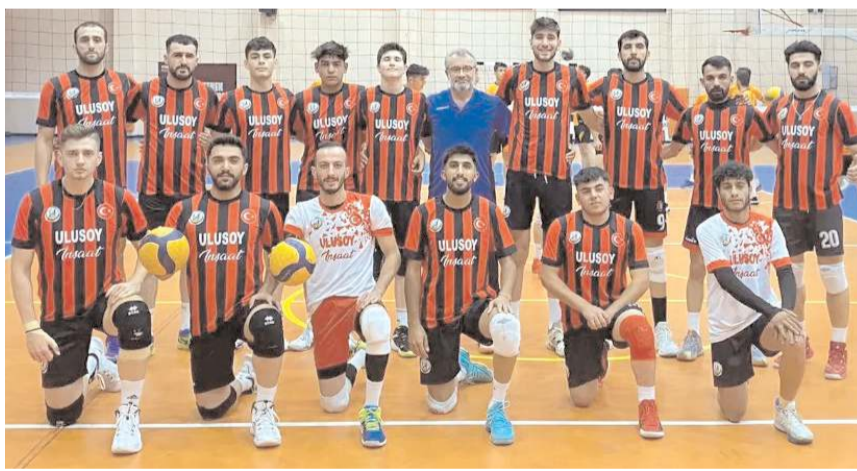
Sungurlu Belediyespor sezonun ilk maçında bugün Ankara Yedidağspor ile karşılaşacak