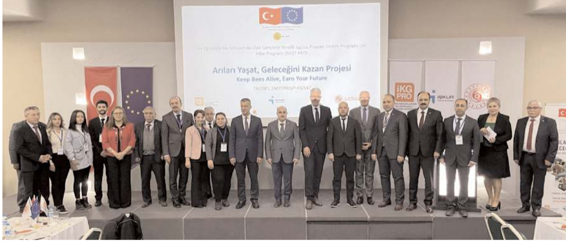
Toplantının sonunda hatıra fotoğrafı çekildi.

Avrupa Birliği ve Mali Yardımlar Daire Başkanlığınca yürütülen "Ne Eğitimde Ne İstihdamda Olan Gençlere Yönelik İşgücü Piyasası Destek Programı" kapsamında Çorum Köylere Hizmet Götürme Birliğince hayata geçirilen "Arıları Yaşat, Geleceğini Kazan Projesi" tanıtıldı. Proje kapsamında gençlere arıcılık eğitimi verilecek. * HABERİ 5'TE