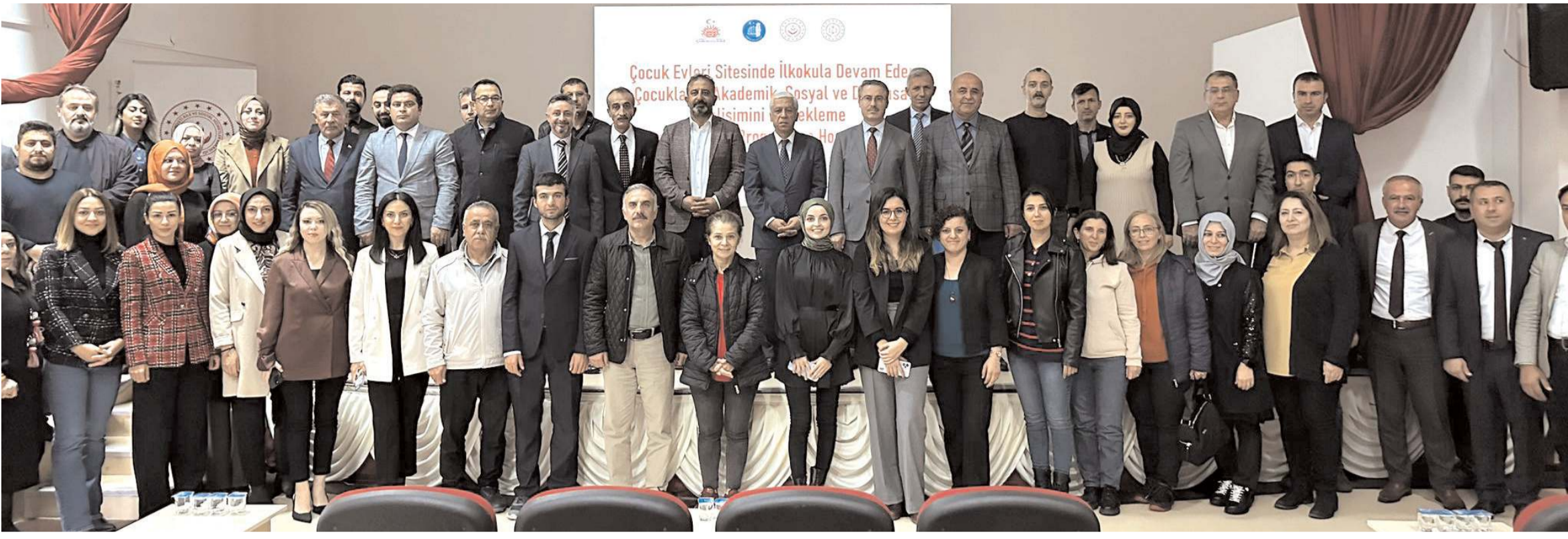
Projenin açılış toplantısının ardından toplu hatıra fotoğrafı çekildi.