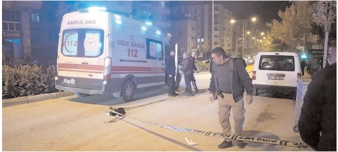
Olay, Bahçelievler Mahallesi'nde meydana geldi.

Çorum'da telefonla konuştuktan sonra sinir krizi geçiren genç, pompalı tüfek ile kendini vurarak ağır yaralandı.