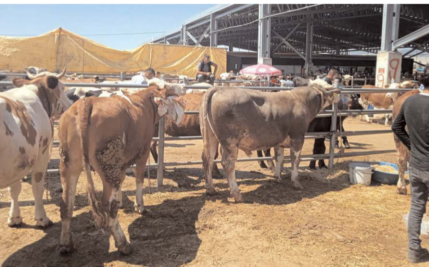
Hayvan pazarları 23 Ekim tarihinde tekrar açılacak.

Hayvan nakillerinde, hayvanların küpeli olması, il içinde nakledilen büyükbaş hayvanların pasaportlarının bulunması, küçükbaş hayvanların nakil belgelerinin olması gerektiğini altını çizen Göktekin, iller arasında nakledilen küçükbaş ve büyükbaş hayvanların ise bu belgelerle birlikte veteriner sağlık raporunun olmadan hayvanlarını nakletmemeleri gerektiğini kaydetti. (Haber Merkezi)