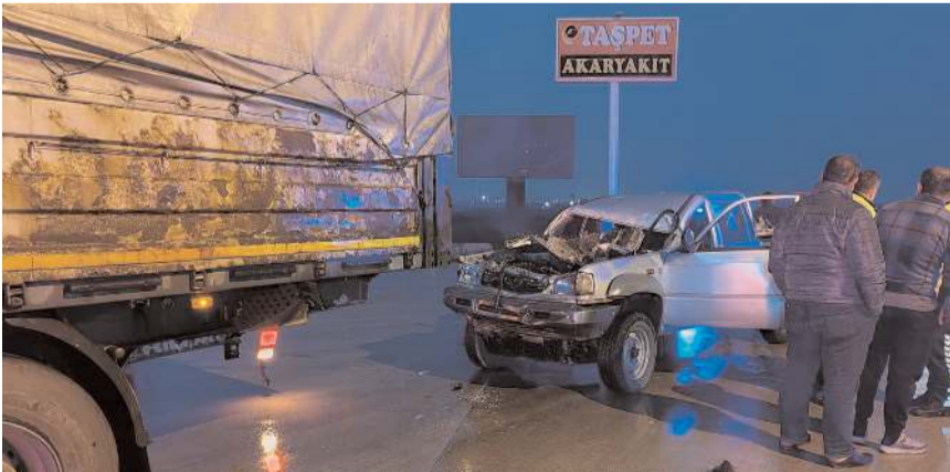
Kaza Merzifon-Çorum kara yolunda meydana geldi.