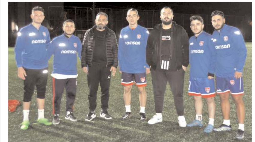
Gülabibeyspor'un beş yeni transferi genel kaptan ve As Başkan ile birlikte görülüyor