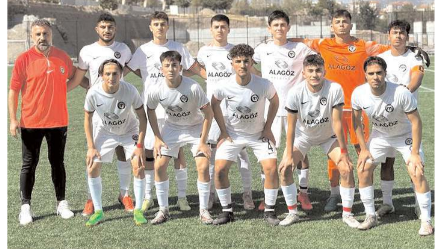
U 19 takımı bugün Tarsus deplasmanında sezonun ilk galibiyetini almak istiyor