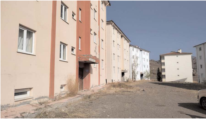
İskilip'te bulunan afet konutlarının sorunu 16 senedir çözüm bekliyor.

Halkın gözleri önünde yıllardır çürümeye terk edilen devlet malı konutlar maalesef tarafların ihmali sebebiyle 17 yıl önce yapılması gereken işlemlerin gecikmesiyle konutlar kaderine terk edilmiş. binalar kullanılamaz hale gelmiştir. İl Genel Meclisine seçtiğim 2019 yılından itibaren soru-