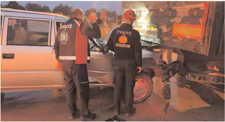
İtfaiye ekipleri aracı çarptığı yerden kurtardı.

A masya'nın Merzifon ilçesinde tıra çarpan pikap sürücüsü yaralandı.