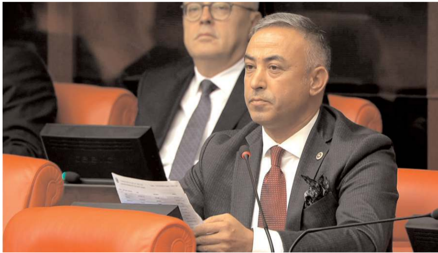
Cumhuriyet Halk Partisi CHP Çorum Milletvekili Mehmet Tahtasız

Cumhuriyet Halk Partisi (CHP) Çorum Milletvekili Mehmet Tahtasız, TBMM'de şirket işçisi zabıtalara sorun ve taleplerini gündeme getirdi. * HABERİ 4'TE