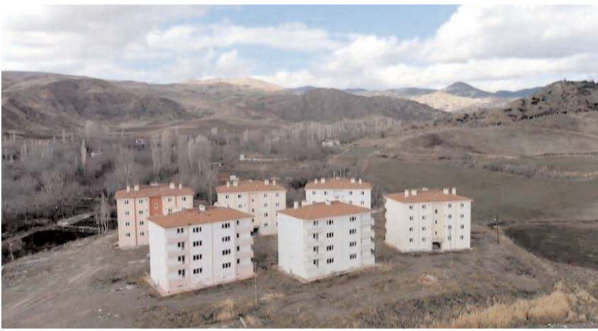
Yılbaşına kadar borçlarını ödeyen hak sahiplerine tapuları verilerek konutlar sahiplendirilecektir.