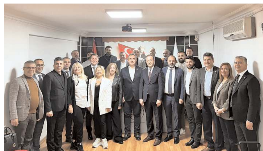
Ziyaretin anısına toplu hatıra fotoğrafı çekildi.