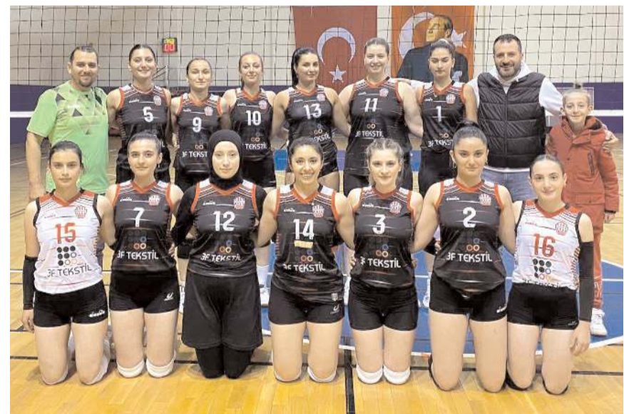
Osmancık Belediyespor sezona evinde galibiyet ile başladı hedef deplasmanda da kazanmak