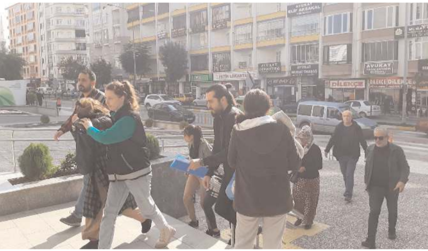
Gözaltına alınan 3 zanlı çıkarıldıkları mahkemeye tutuklandı.

Zanlıların ikametinden çaldıkları altın ve parayı kaçarırken Buharaevler 6. Sokak'taki bir binanın bahçesine attıkları tespit edildi. Söz konusu altın ve para ekiplerce bulundu.