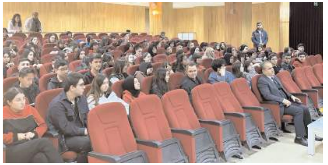
Program Güzel Sanatlar Lisesi'nde gerçekleştirildi.