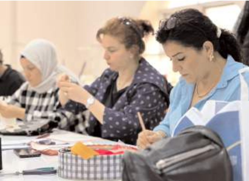
Moda Tasarım ve El Sanatları İhtisas Atölyelerinde kadınlar meslek sahibi oluyor.

Başka Aşgın, üretim atölyesinde ihtisas eğitimini başarıyla tamamlayan kursiyerlerin kendi işletmelerini açabileceğini ve usta öğreticilik belgesi sahibi olacaklarını söyledi. Çorum Belediyesi olarak kadınlara sadece eğitim vermekle kalmayıp, üretilen ürünlerin satışı konusunda da kadınlara destek olacaklarını açıklayan Başkan Aşgın, "Çorum Belediyesi olarak üretim atölyesi kurarak, burada üretilen ürünlerin alıcılarla buluşması konusunda çalışmalarımız olacak" ifadelerini kullandı. (Haber Merkezi)