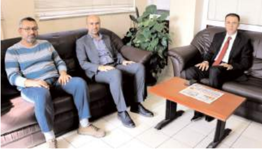
Çorum Cumhuriyet Başsavcısı Ahmet Bektaş, gazetemizi ziyaret etti.

■ Çorum Cumhuriyet Başsavcısı Ahmet Bektaş, gazetemize iade-i ziyarette bulundu.