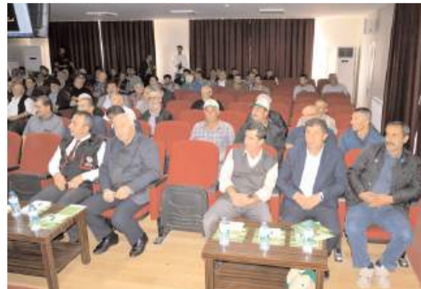
Çorum Ziraat Odası ile Tarım İl Müdürlüğü işbirliğinde çiftçilere yönelik bilgilendirme toplantısı yapıldı.