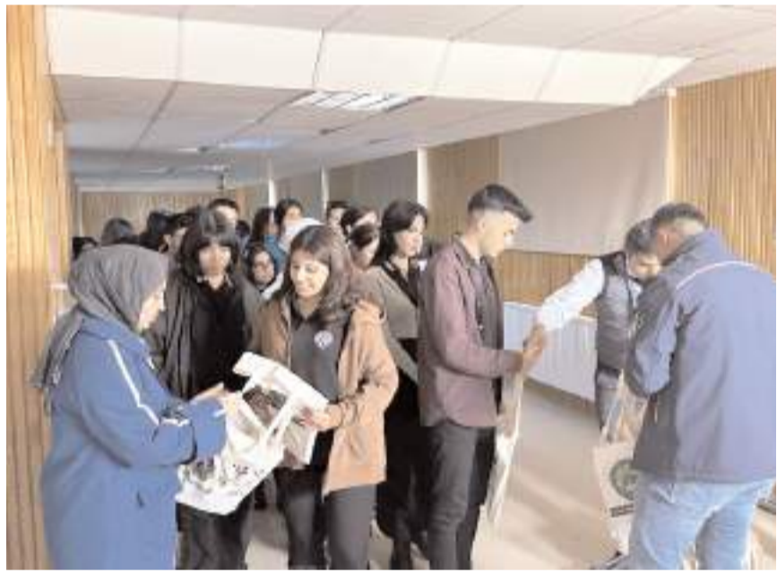
Seminerin ardından öğrencilere hediyeler verildi.

Güzel Sanatlar Lisesi'nde gerçekleştirilen seminerde öğrencilere, geri dönüşebilir atıkların toplanması, sürdürülebilir kalkınma ilkesine uygun olarak çevrenin korunması, atık oluşumunun önlenmesi, azaltılması, türlerine göre kaynağında ayrıştırılması, yeniden kullanılması ve geri kazanımı konularında bilgiler verildi. (Haber Merkezi)