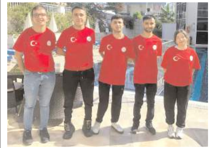
Para Dart Türkiye Şampiyonasında mücadele eden Çorum takımı toplu halde