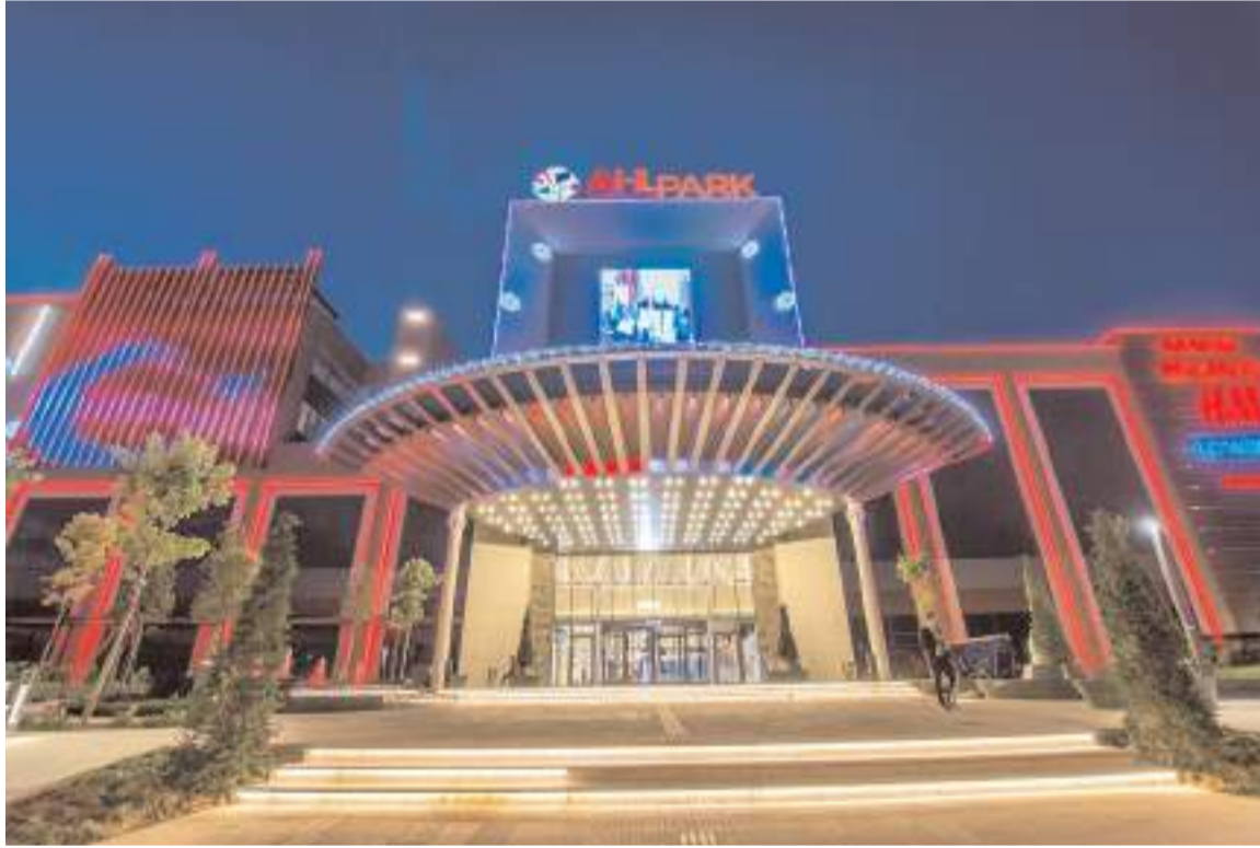
2024'ün başında inşaatla başlamayı düşündüklerini belirten Ahlatcı, "Projeyi 2,5-3 sene içinde bitirmeyi öngörüyoruz" dedi.