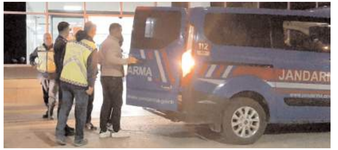
Olay İskilip-Ankara kara yolu Çukur köyü yol ayrımında meydana gelmişti.