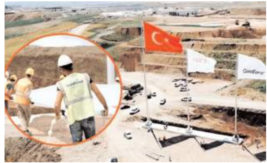
Barut fabrikası Sungurlu OSB'de yapılıyor.

Şu anda tesisin inşaat halindeyken bile Avrupa'nın bazı ülkelerinden 2 yıllık kontrat imzalamak isteyenlerin olduğuna dikkat çeken Ahlatcı, "Daha hizmete açılmadan talepler geliyor. Tabii ki şu anda olumlu dönmüyoruz. Stratejik bir ürün olduğu için TSK, Savunma Sanayi Başkanlığından izin almamız gerek-