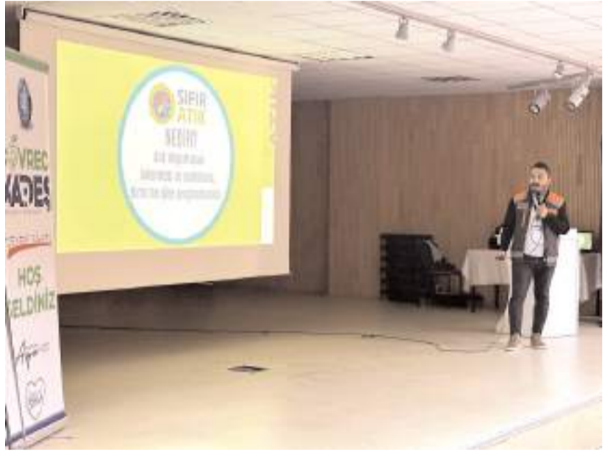
Semineri Çorum Belediyesi düzenledi.

Sıfır atık hedefi doğrultusunda okullarda eğitim çalışmalarını sürdüren Çorum Belediyesi, Güzel Sanatlar Lisesi'nde çevre saati etkinliği gerçekleştirdi.