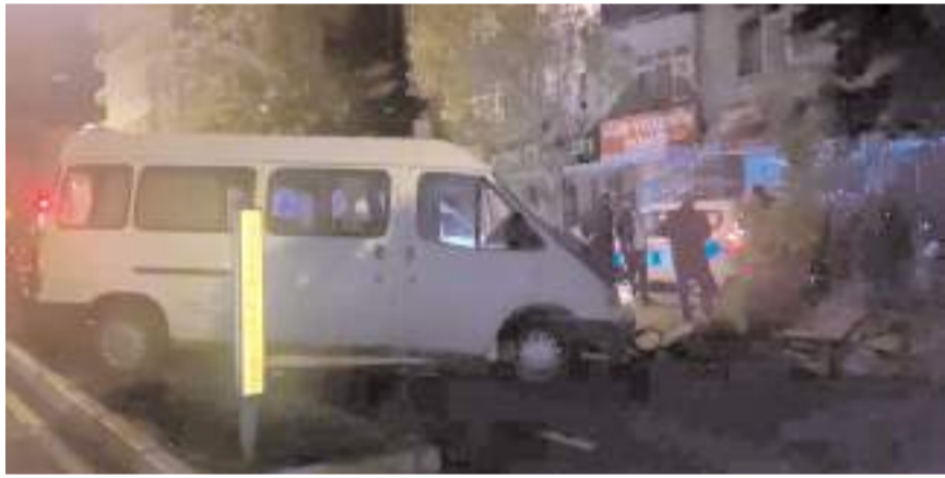
Kaza, Uğur Mumcu Caddesi'nde meydana geldi.

Kaza ile ilgili başlatılan soruşturma sürüyor. (İHA)