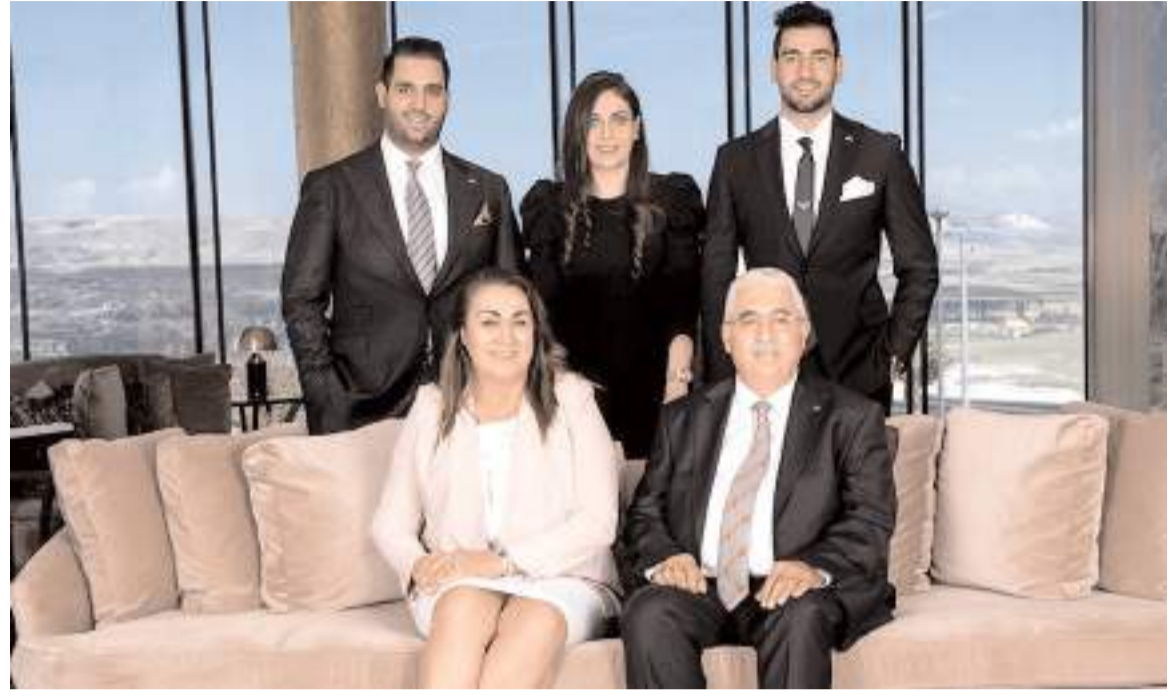
Ahlatcı Holding, Konya'ya ve Elazığ'a AVM, ticaret ve konuttan oluşan bir projeyi hayata geçirecek.

Şu an ki lisansı konvansiyonel banka olan Adabank için ise katılım bankacılığı alanında faaliyet göstermek için başvurusunu yapacaklarını ifade eden Ahlatcı, "5 sene içerisinde ise şubeleşip 1000 kişilik ilave bir istihdam sağlamayı planlıyoruz" diye konuştu (Haber Merkezi)