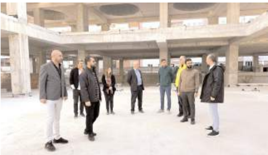
Yüzde 70 seviyesine gelen projenin 280 günde tamamlanması hedefleniyor.

Başkan Aşgın, "Önüde geniş bir meydan, avlunun ortasında fitness alanları, tarihi revaklar, 75 m2 büyüklüğünde 25 tane de iş yerimiz olacak. Alttaki da 211 araçlık 2 katlı otoparkımız var. Bedesten Çorum Park'la beraber adeta Gazi Caddesi'yle birleşmiş güzel bir meydan olacak" dedi. (Haber Merkezi)