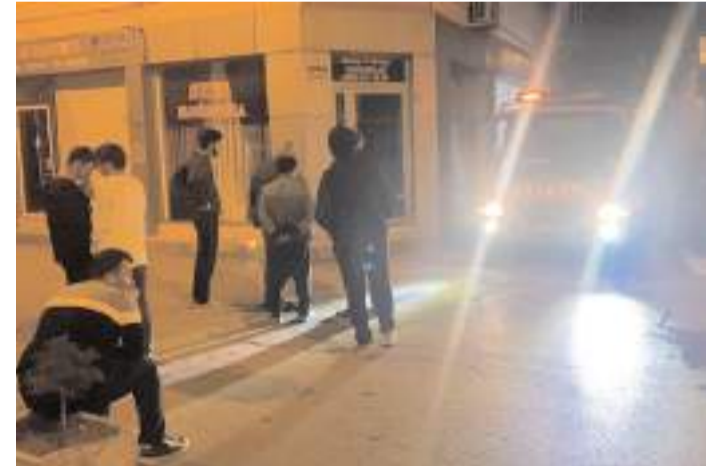
Olay Çepni Mahallesi Merih Sokak'ta meydana geldi.

Öte yandan, yangın olduğunu zanneden mahalle sakinleri derin bir nefes alarak evlerine döndü. (İHA)