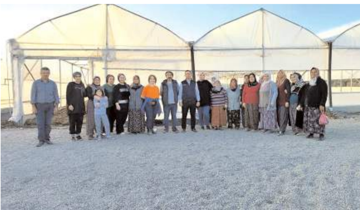
İlçede 7 adet sera kuruldu.

Proje ile hem ilçe halkına ek gelir sağlanması hem de seracılığın yaygınlaşması hedefleniyor.