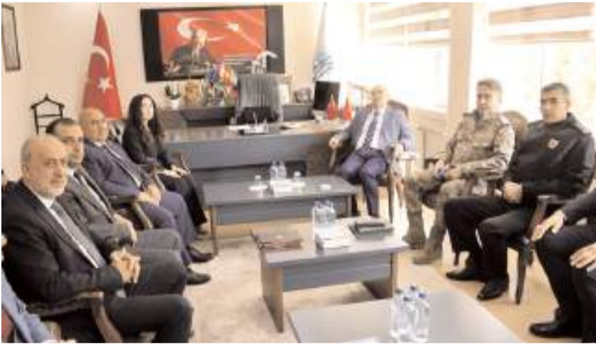
Kaymakam Seher Söyler'i ziyaret etti.