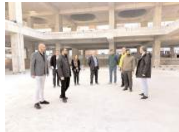
Yüzde 70 seviyesine gelen projenin 280 günde tamamlanması hedefleniyor.

■ Daha önce 'Çorumlu'nun Yaptığını Herkes Yapamaz' sloganı ile 'Marka Şehir' projesi kapsamında iki kısa film ile adından söz ettiren Çorum, şimdi de 26 Ekim Perşembe günü saat 19.19'da sosyal medyada gösterime girecek 'Çorumlu'nun Yaptığını Herkes Yapamaz' kısa film üçlemesinin sonuncusu ile final yapmaya hazırlanıyor. * HABERİ 5'TE