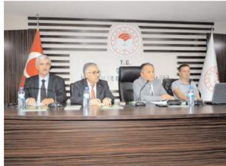
Toplantıda TİGEM'in tarım işletmeleri hakkında bilgi verildi.