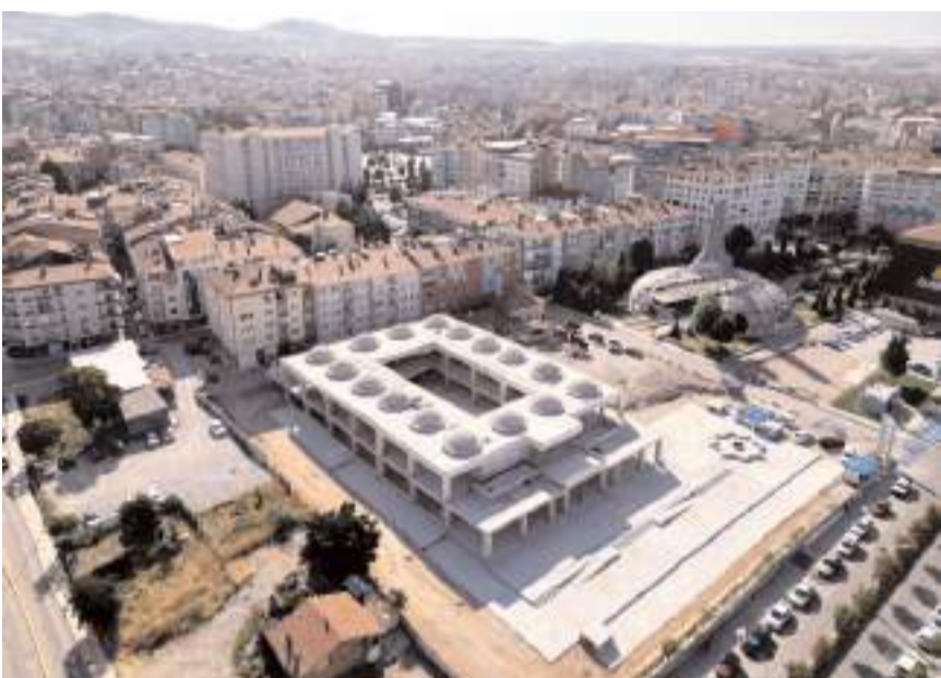
Projede 75 m2 büyüklüğünde 25 tane işyeri ile 211 araçlık 2 katlı yer altı otoparkı bulunuyor.