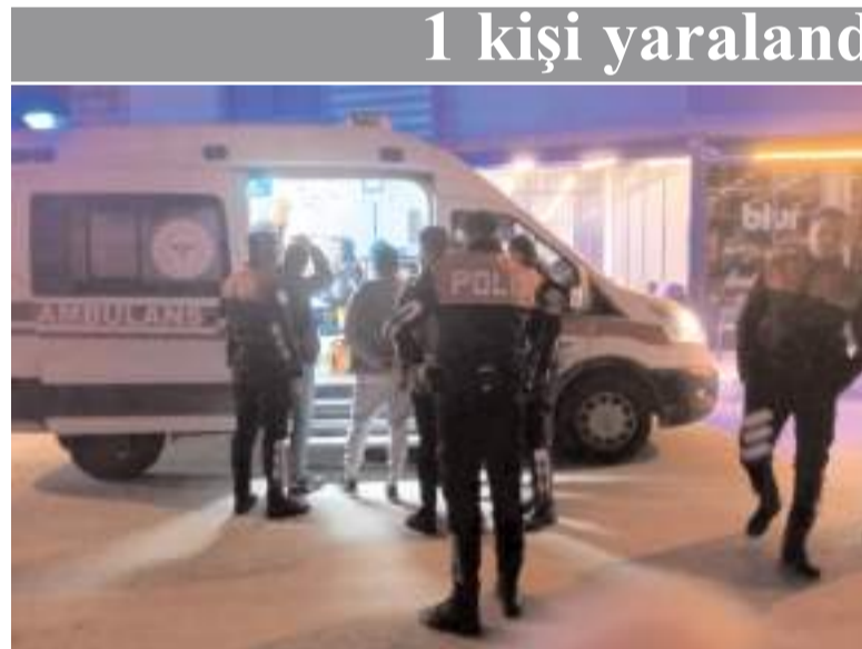
Polis ekipleri olay yerinde inceleme yaptı.

Çorum'da husumetli iki kişi arasında çıkan kavgada 1 kişi bıçakla yaralandı.