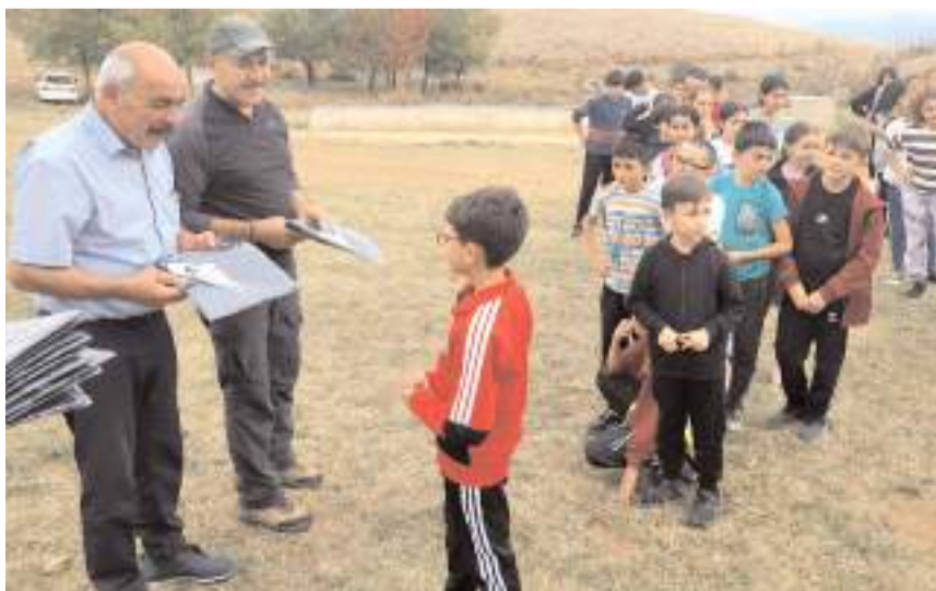
Kulüp yöneticileri tüm katılımcılara hediyeler verdi

Yaklaşık 4 yıldır farklı branşlarda sporcu yetiştirmeye çalıştıklarını belirten Yüksel, "Bugün sporcularımızı şehrin yoğun stresi ve teknoloji bağımlılığından kurtarmak, doğa, tabiat ve çevre bilincini aşmak için Kırklar Dağı'nın eşsiz manzarası eşliğinde program düzenledi. Sporcularımızın buradaki antrenman ve sportif oyunlarla motive olmasını sağlayarak yeni sezona sıkı bir şekilde hazırlanmaktayız. Bu tür etkinliklerimizi imkanlarımız dahilinde çoğaltmayı amaçlıyoruz." dedi. (AA)