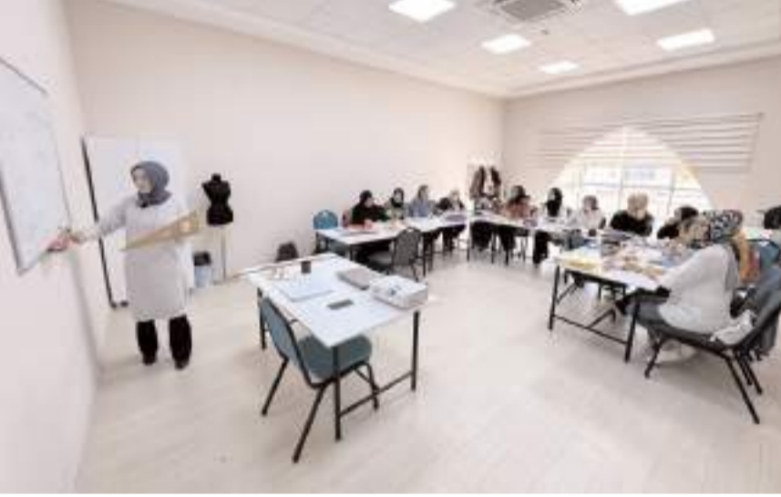
Moda Tasarım ve El Sanatları kursuları büyük ilgi görüyor.