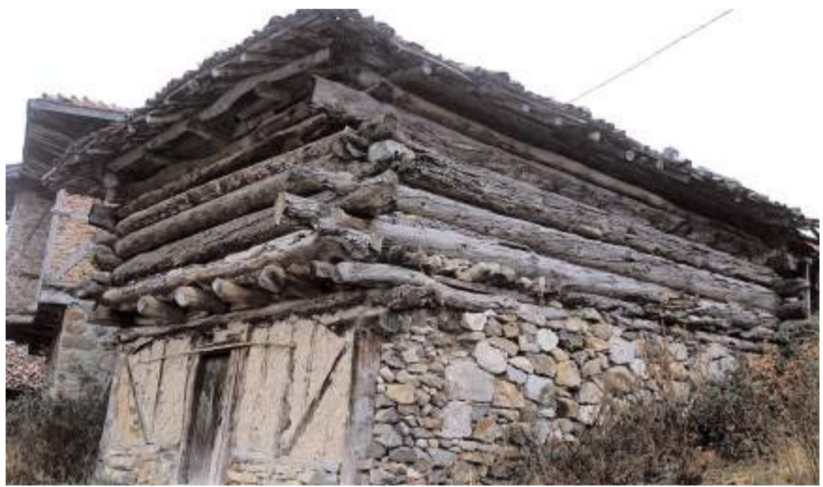
Oğuzlar'da ve köylerinde çivi kullanılmadan yapılan ev ve ambarlar ilgi çekiyor.