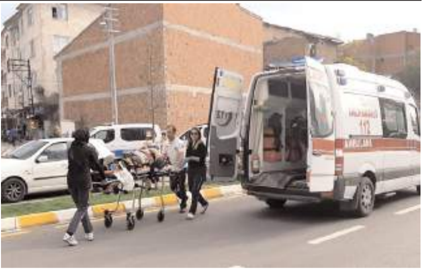
Kaza Prof. Dr. Arif Ersoy Caddesi'nde meydana geldi.

Yaralı yaya ile motosiklet sürücüsü sağlık ekiplerince yapılan müdahalenin ardından Hitit Üniversitesi Erol Olçok Eğitim ve Araştırma Hastanesi'ne kaldırıldı.(AA)