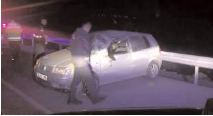
Kaza Elvançelesi köyü mevkinde meydana geldi.

Yaralanan sürücü sağlık ekiplerince yapılan müdahalenin ardından Hitit Üniversitesi Erol Olçok Eğitim ve Araştırma Hastanesi'ne kaldırıldı.(AA)