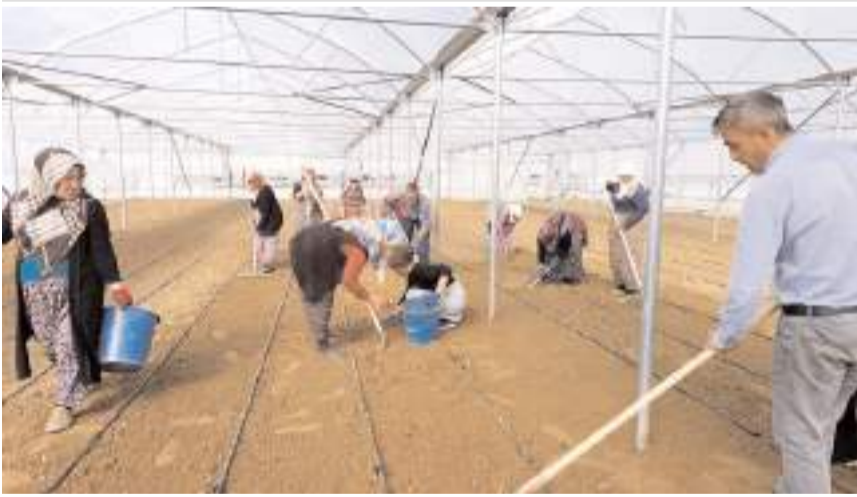
7 adet serada toplam 1080 metrekare alanda 48 bin kök marul fidesi dikildi.