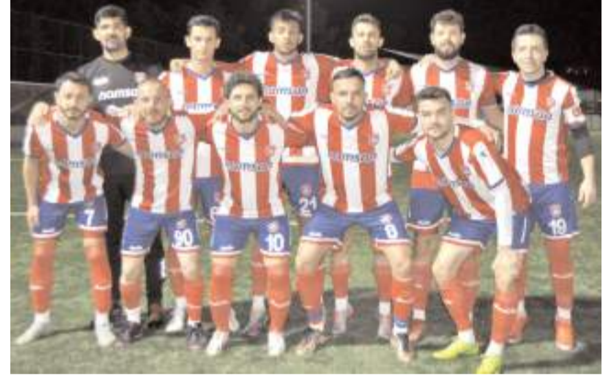
Gülabibeyspor ikinci maçında farklı kazanarak finale yükseldi

Gülabibeyspor arasındaki final maçın yarın akşam saat 18'de İtfaiye sahasında oynanacak.