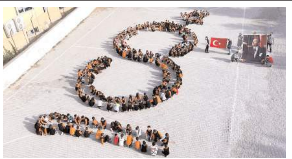
Öğrenciler ve öğretmenler Cumhuriyetin 100. yılına ithafen bahçede 100 yazını oluşturup bayrak ve Atatürk posteri açtı.

tim Kurulu Başkanı Fatih Doğan, bütçenin yüzde 85'ini Ankara Kalkınma Ajansı'nın karşıladığını dile getirdi. (Haber Merkezi)