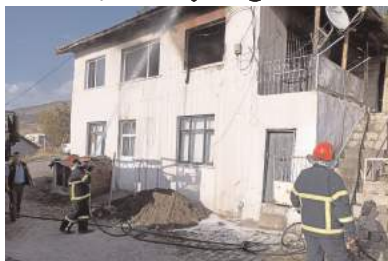
Yangın Yatukcu Mahallesi Semerciler Sokak'ta bulunan bir evde çıktı.

Bayat'ta bir evde çıkan yangında yaralanan kişi, hastaneye kaldırıldı.