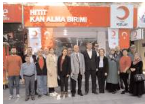
İYİ Partililer Kızılay Hitit Kan Alma Biriminde kan verdiler.