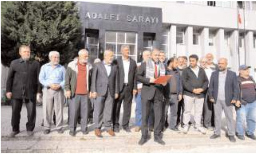
SP'liler Adliye önünde basın açıklaması yaptı.