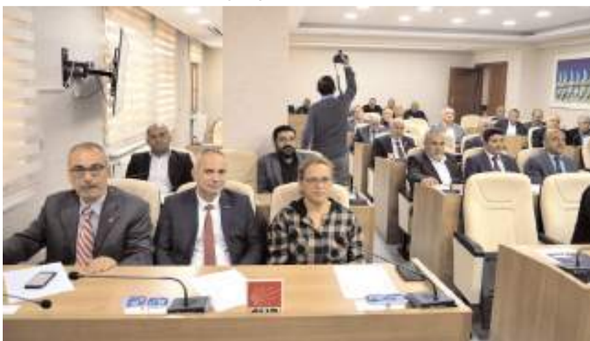
İl Genel Meclisi bütçe görüşmelerine devam edecek.