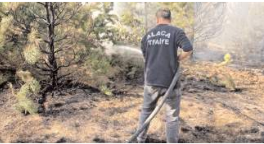
Yangın İmat köyünde çıktı.

Ekiplerin müdahalesi ile yangın büyümeden kontrol altına alınarak söndürüldü. (İHA)