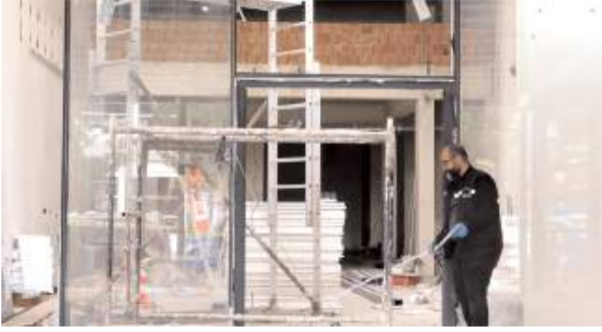
Olay Kastamonu Kuzeykent Mahallesi Kamil Demircioğlu Caddesinde meydana geldi.