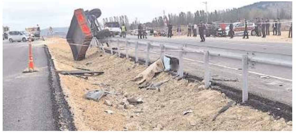
Kaza Çorum-Mecitözü karayolu Sarıyer mevkiinde meydana geldi.