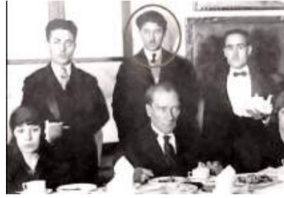
Gazi Mustafa Kemal Atatürk, Bekir Çavuş'u yanından hiç ayırmamış.

■ Çorum'da bir otomobil sürücüsün direksiyon hakimiyetini kaybederek park halindeki tır ve otomobillere çarpması sonucu meydana gelen trafik kazasında sürücü yaralandı. * HABERÝ 2'DE