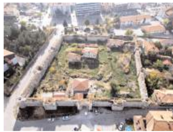
Çalışma kapsamında Kale'nin bedenleri restore edilecek.