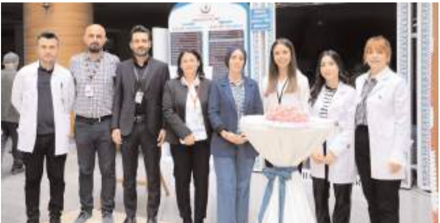
Hastanede Hasta Hakları Günü nedeniyle program yapıldı.