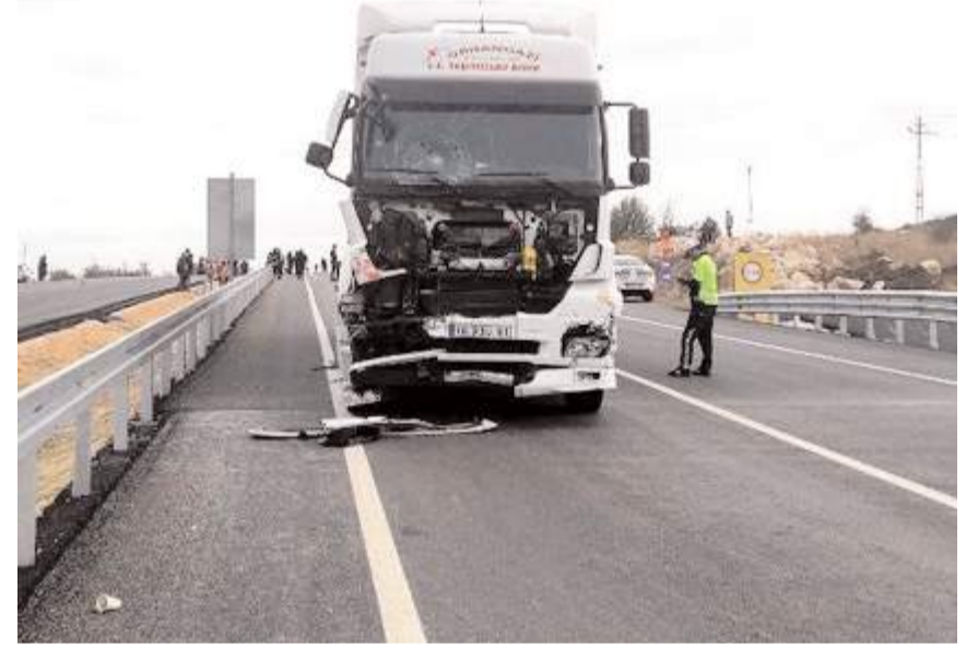
Kaza nedeni ile Çorum-Amasya karayolu bir süre olarak trafiğe kapandı.