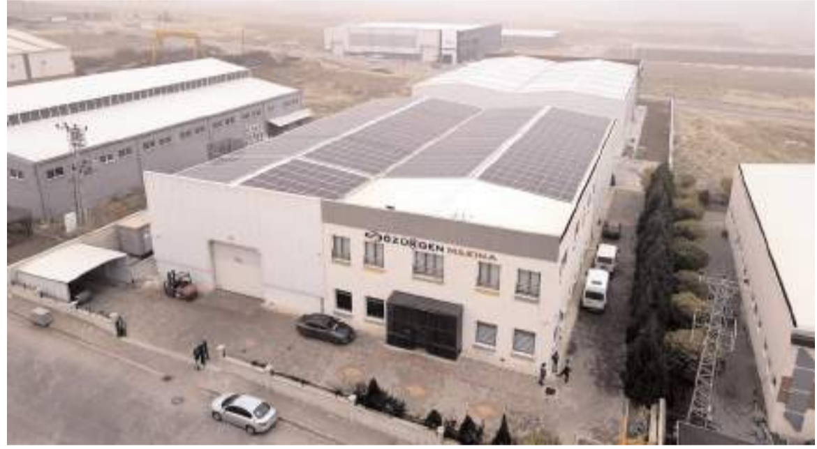
Özürgen Makina Rulman tesisinin çatısına 161 kW'lık güneş enerjisi santrali kuruldu.