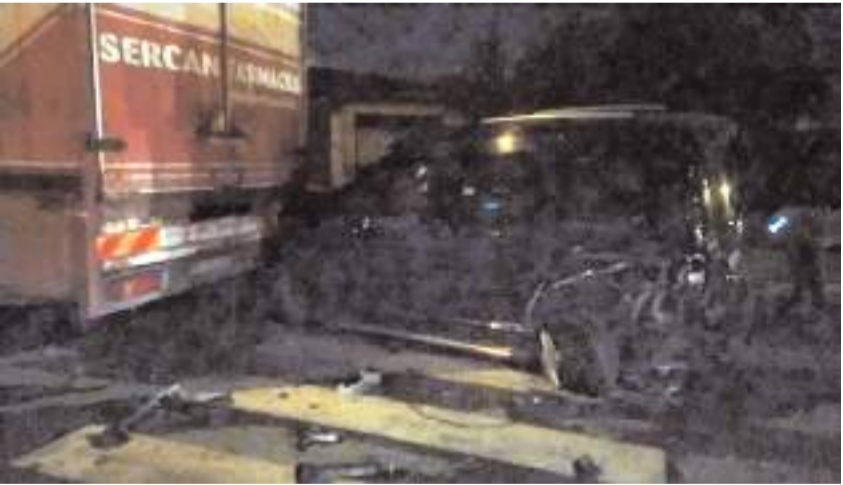
Kontrolden çıkan otomobil park halinde bulunan bir ticari araç, tır ve otomobile çarparak durabildi.

Çorum'da bir otomobil sürücüsünün direksiyon hakimiyetini kaybederek park halindeki tır ve otomobillere çarpması sonucu meydana gelen trafik kazasında sürücü yaralandı.