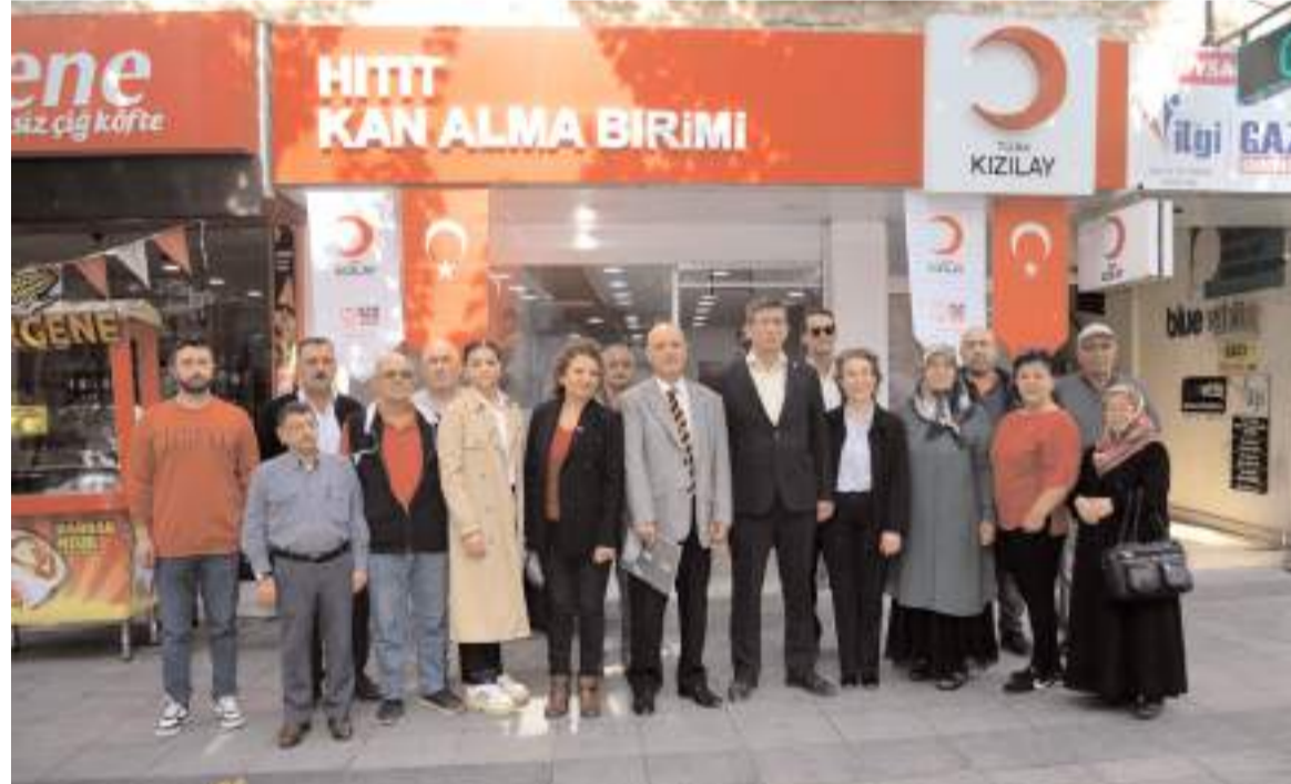
İYİ Partililer Kızılay Hitit Kan Alma Biriminde kan verdiler.