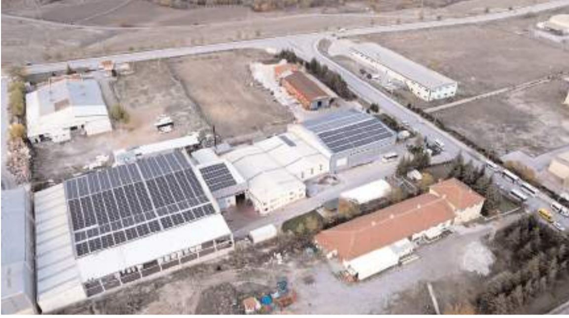
Gazel Değirmen Makineleri tesisinin çatısına 504 kW'lık güneş enerjisi santrali kuruldu.

Değirmen Makineleri yetkilisi Cemil Gazel de tesisinin çatısına 504 kW'lık yenilenebilir enerji tesisi kurdu. Yatırım ile yılda 750 bin kWh üzerinde elektrik enerjisi üretimi planlanıyor.