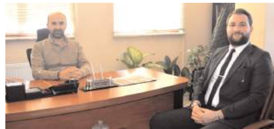
Ziyaratta arabuluculuk faaliyetleri hakkında değerlendirmede bulunuldu.