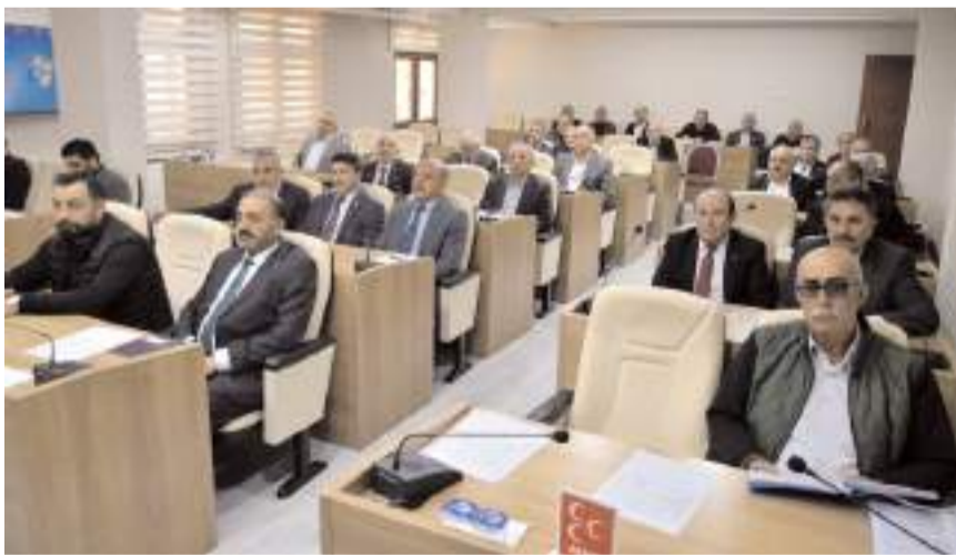
Gündem maddelerinin görüşülmesinin ardından toplantı sona erdi.