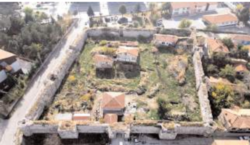
Çalışma kapsamında Kale'nin bedenleri restore edilecek.