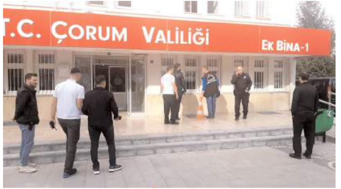
Olay Gazi Caddesi'nde Valilik ek hizmet binası önünde meydana geldi.