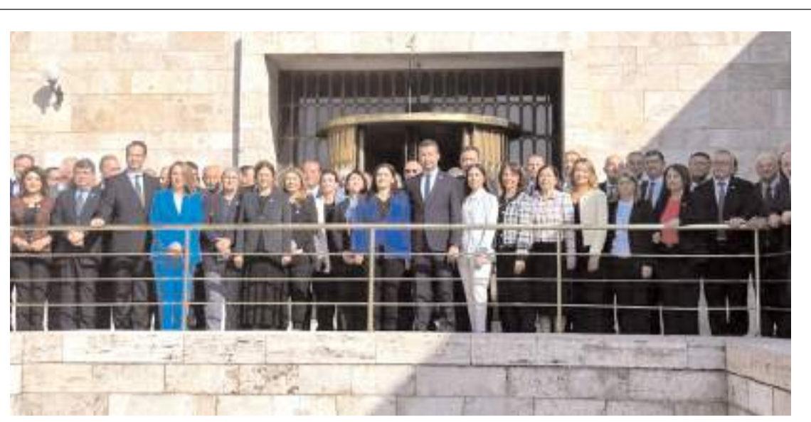
CHP'de 130 milletvekilinden 95'i, Kemal Kılıçdaroğlu'na destek vereceklerini açıkladı.

değerlendirilmek üzere Plan ve Bütçe Komisyonu'na havale edildi.