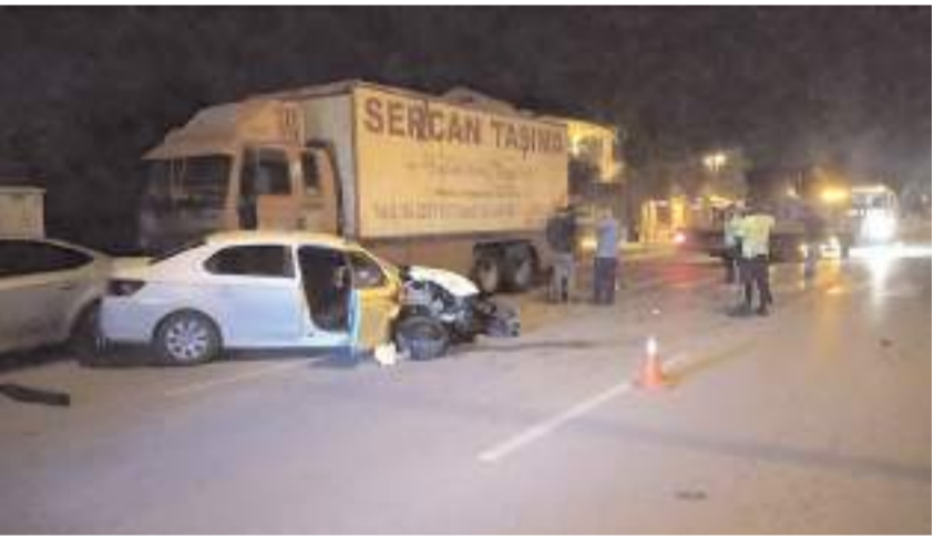
Kaza nedeniyle trafik kontrollü olarak verildi.