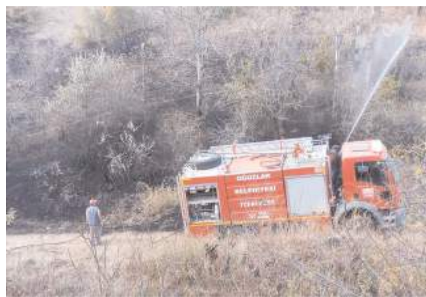
Yangın Gölbaşı Mahallesi Ülkür mevkinde çıktı.