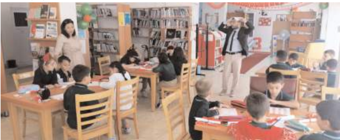
Çocuklar için çeşitli etkinlikler yapıldı.