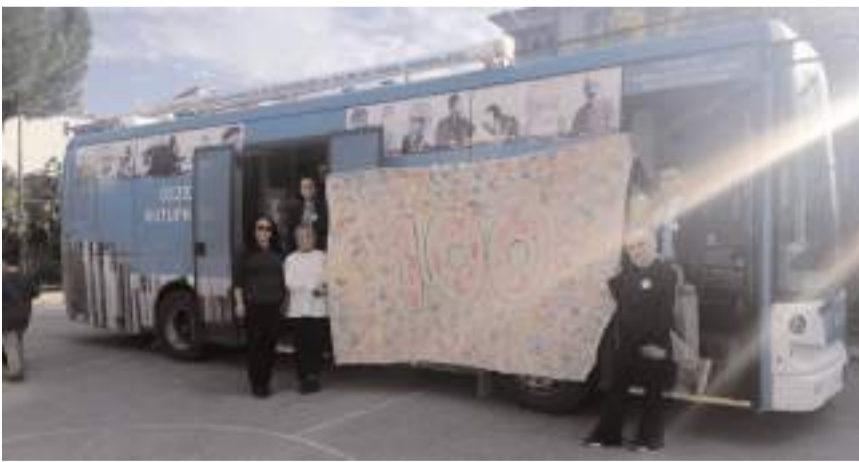
Gezici kütüphanede öğrenciler el baskısı tekniği ile Cumhuriyet'in 100. yılına özel baskı yaptı.