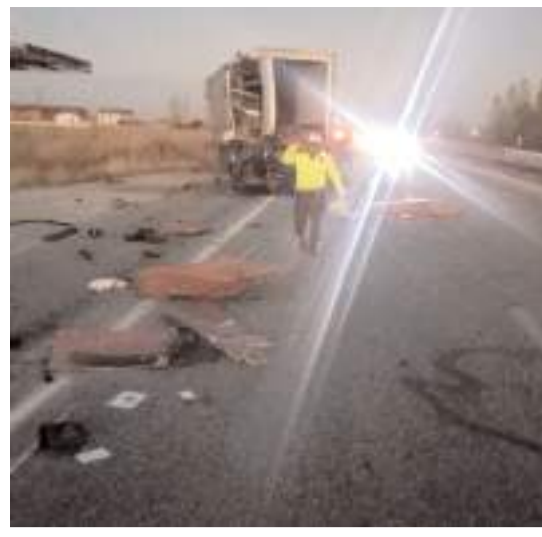
Kaza Çorum-Ankara Karayolu 26. kilometre Hamdiköy yakınlarında meydana geldi.

Alınan karar ile Çorumda bütün okul kantinlerinde İsrail menşeli ürünler ve İsrail'e destek verdiği bilinen ürünlerin alımı, satımı ve kullanımının yapılmayacak.