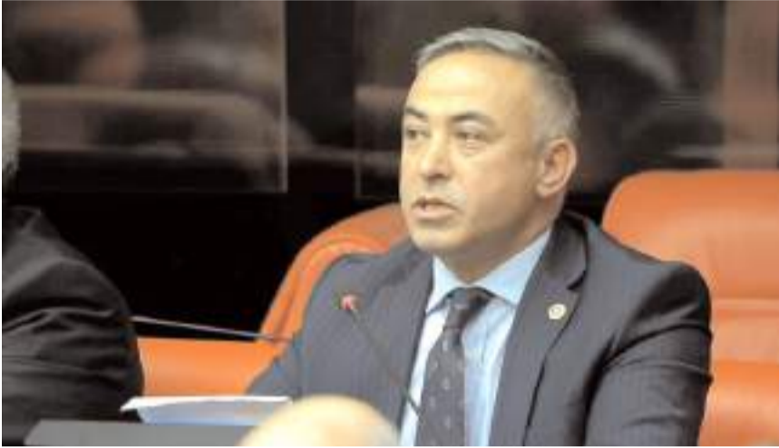
CHP Çorum Milletvekili Mehmet Tahtasız

"Düşük pancar fiyatı çiftçimizi mağdur etti, teslimatlar da sorun yaşıyorlar. Yanlış politikaların çiftçimizi üretimden soğuttu, ülkemizde 25 milyon dekar arazi ekilemiyor. Soğan üreticimiz de ihracatı kapattığınız için zorda, maliyeti 5 TL olan soğanı 4,5 TL'ye satmak zorunda kalıyorlar. Çorum bölgesinde üretilen mor soğan için de ihracatı açmalısınız, ihracatı bir an önce açmalısınız ki üretici soğanını tarlaya ve derelere dökmesin." (Haber Merkezi)