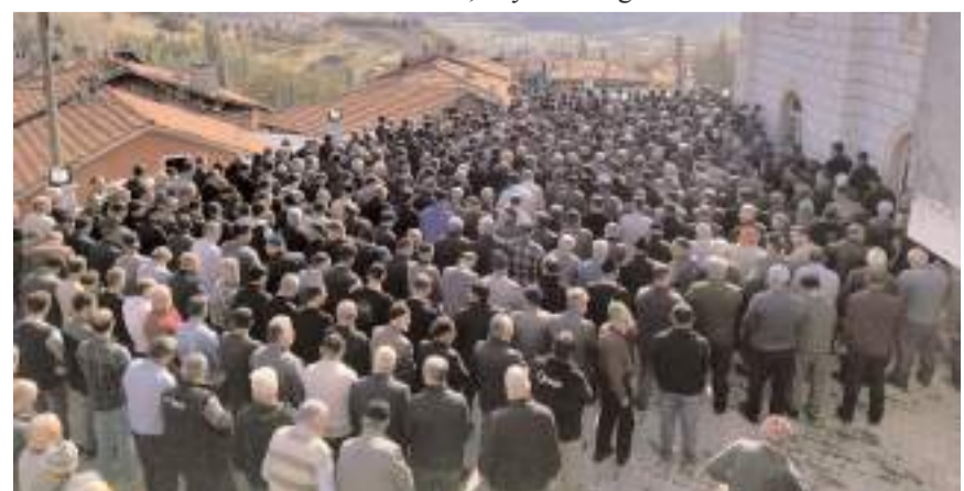
Cenaze namazına katılım yüksek oldu.