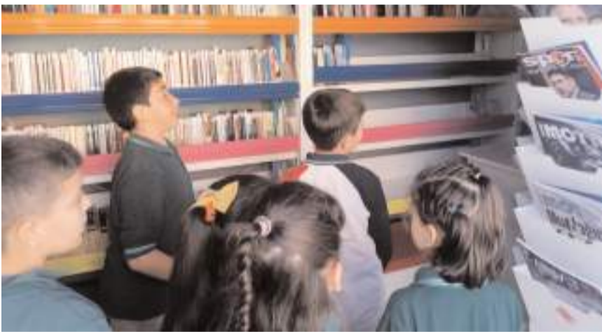
Öğrenciler kütüphanede bulunan kitapları incelediler.

Seyyar kütüphanedeki etkinliklerin hafta boyunca devam edeceği bildirildi.(AA)