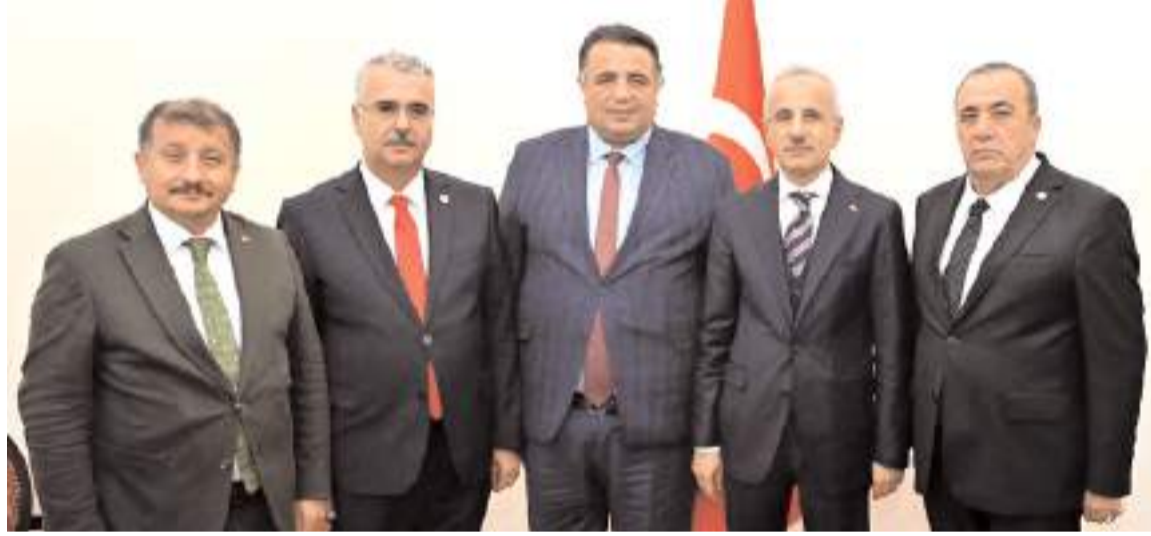
Ziyarete Çorum'un ulaşım yatırımları görüşüldü.