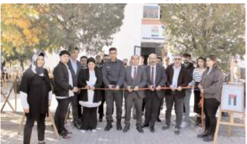
Serginin açılış kurdelesini protokol üyeleri kesti.