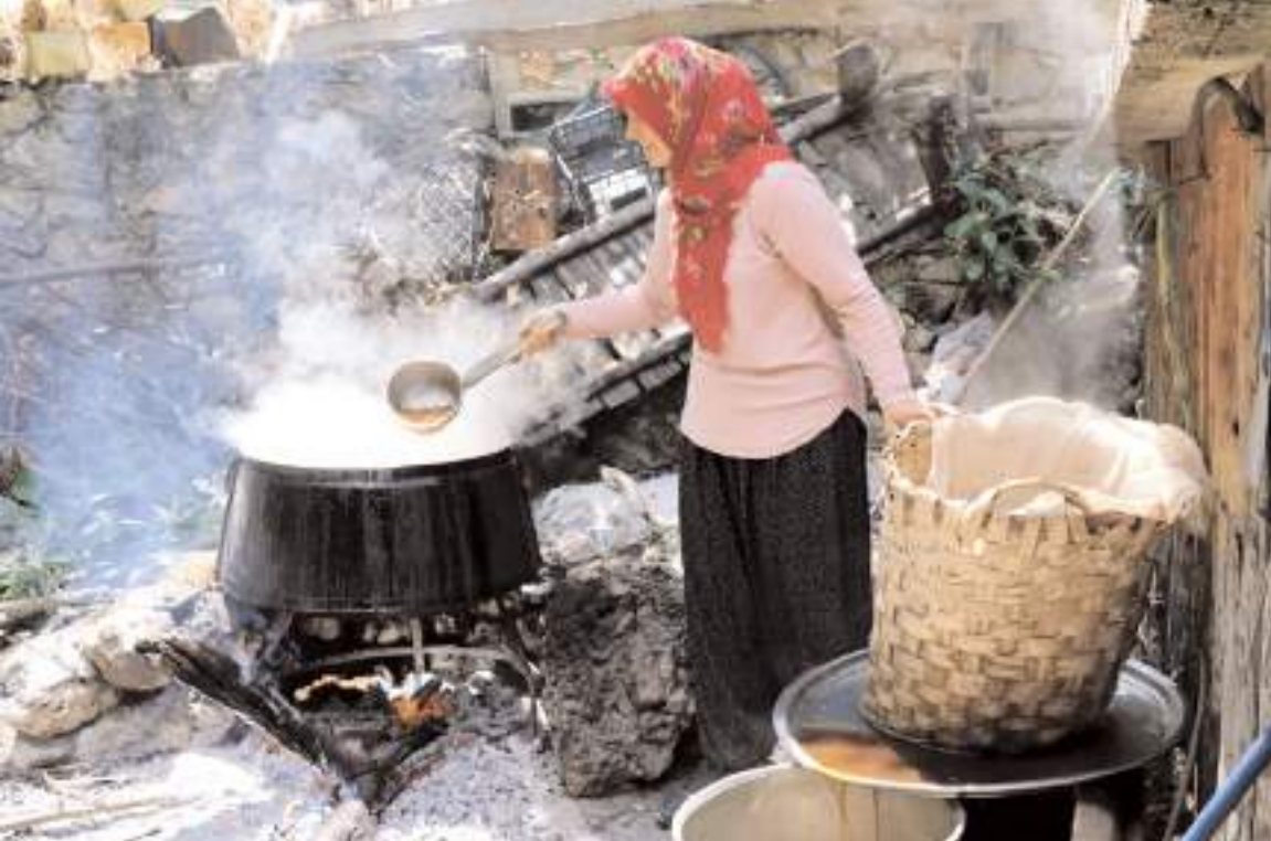
Hazırlanan pekmezler kış aylarında tüketilmek üzere kaplara konularak ışık görmeyen bir yerde muhafaza ediliyor.

Çorum'da sonbahar döneminde üzümlerin olgunlaşması ve bağbozumu ardından pekmez üretim çalışmaları devam ediyor.