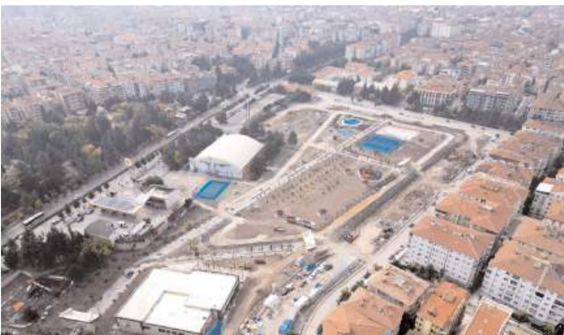
100.Yıl Millet Bahçesinde çalışmalar devam ediyor.

Eski stadyum ve futbol sahalarının yer aldığı alan yaptırılan Millet Bahçesine '100. Yıl Millet Bahçesi' isminin verilmesi teklifi oy birliği ile kabul edildi.