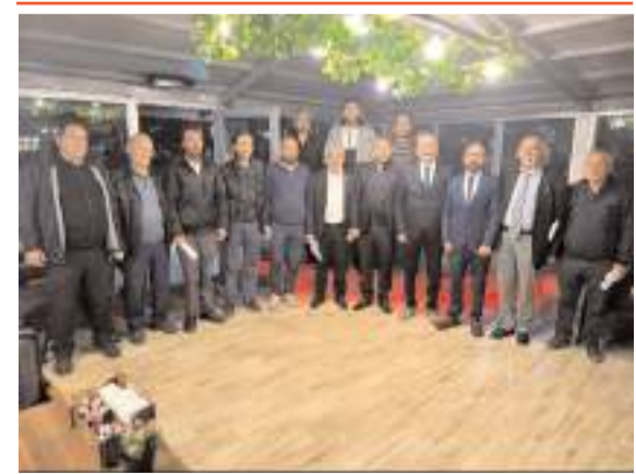
Türkiye İttifakı Partisi Çorum Teşkilatı istişare yaptı.