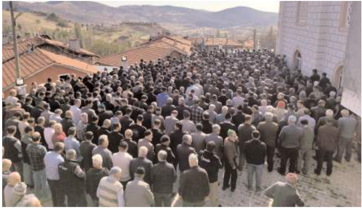
Cenaze namazına katılım yüksek oldu.