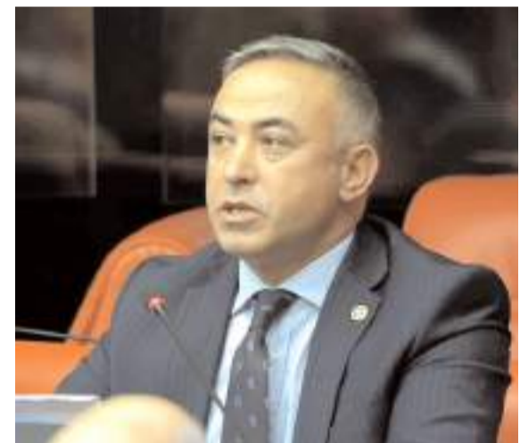
CHP Çorum Milletvekili Mehmet Tahtasız

■ AK Parti'nin 31 Mart 2024'teki yerel seçim için aday başvurularını almaya bugün başlayacağı belirtildi. * HABERİ 8'DE