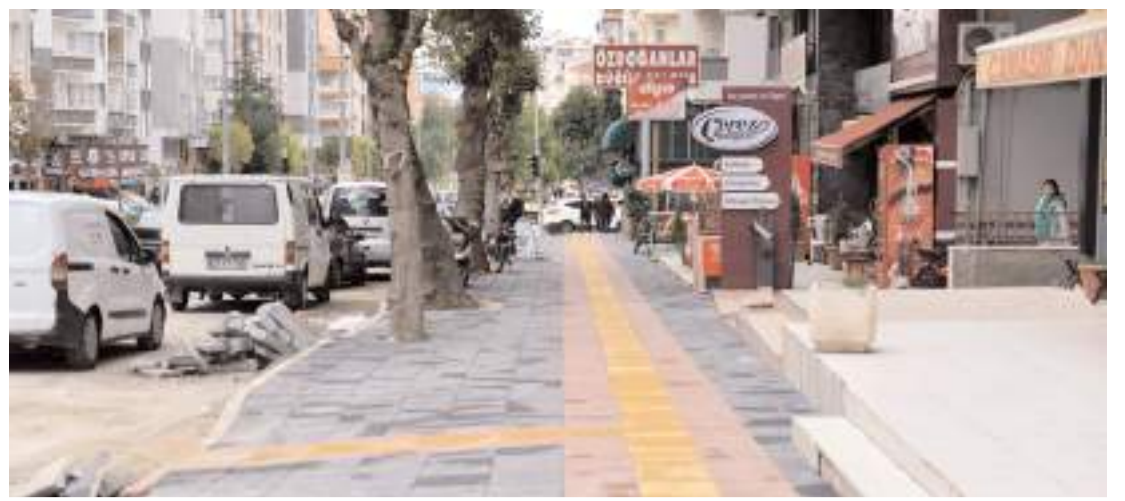
"Yaya Yolları ve Kaldırımların Tasarım Kuralları Hakkında Yönetmelik", Resmi Gazete'de yayımlandı.