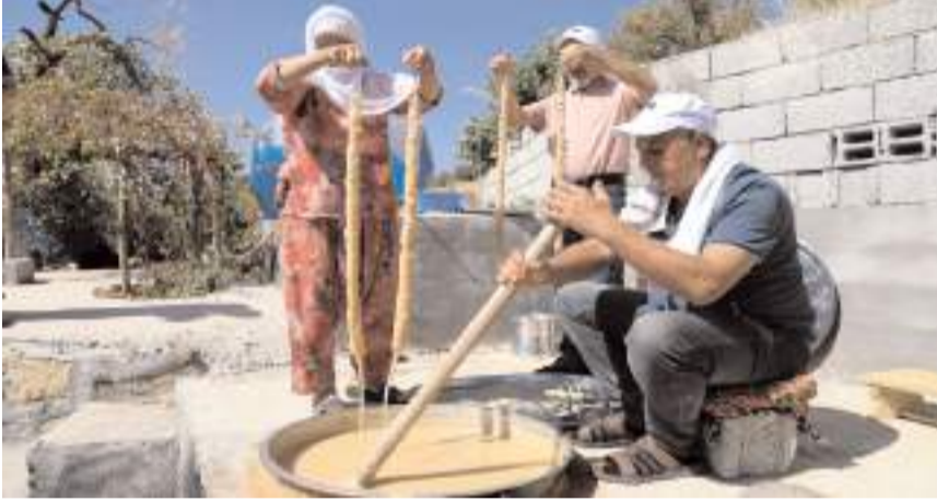
Pekmez için çıkarılan üzüm suyundan pestil yapılıyor.