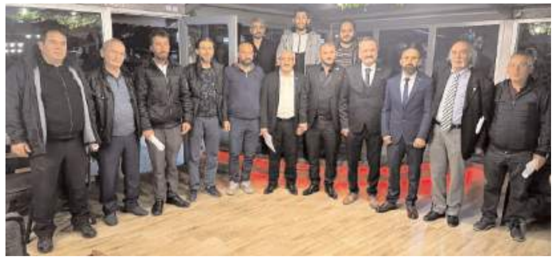
Türkiye İttifakı Partisi Çorum Teşkilatı istişare yaptı.