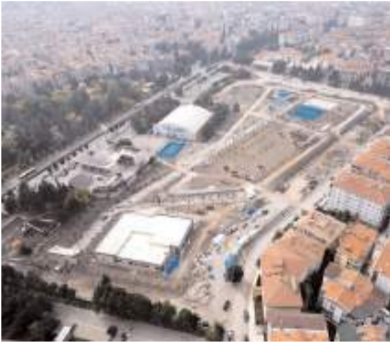
100.Yıl Millet Bahçesinde çalışmalar devam ediyor.