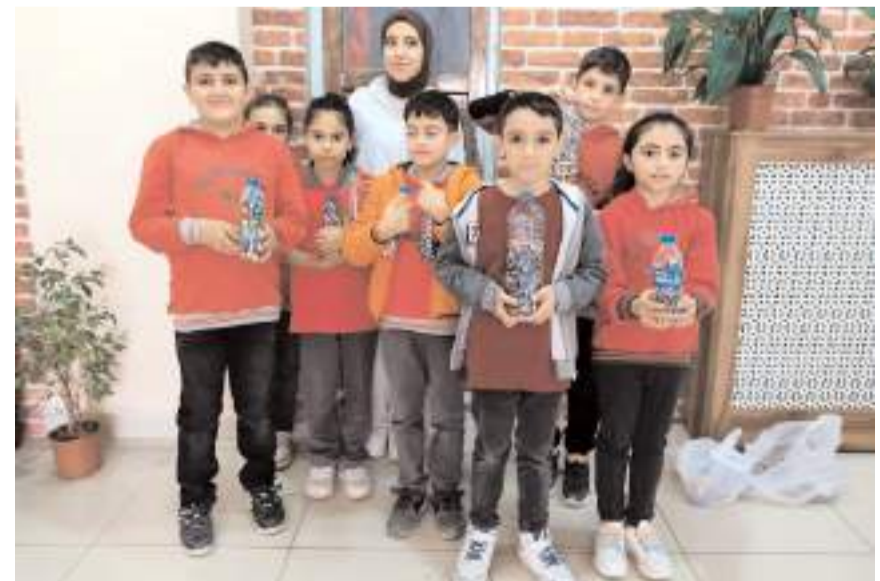
Öğrenciler evlerinde kullanmadıkları pilleri getirdiler.