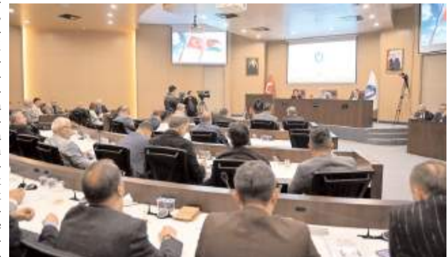
Toplantıda gündem maddeleri görüşülerek karara bağlandı.