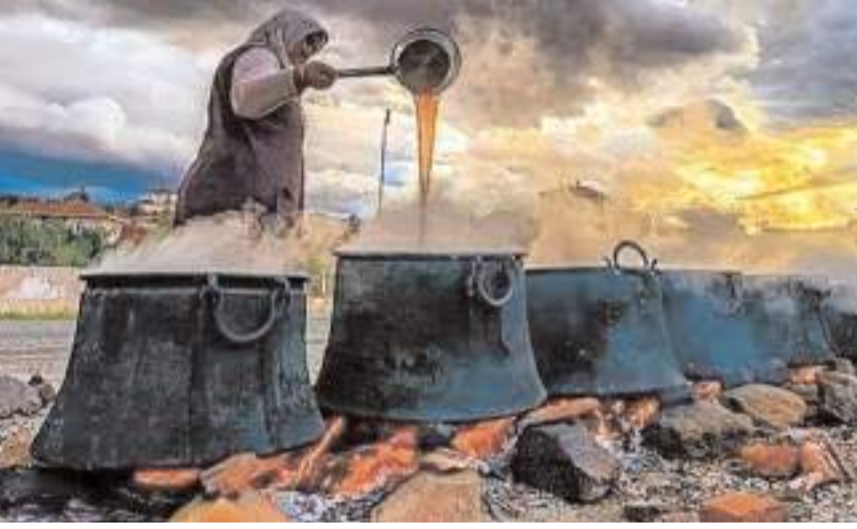
Kurulan kazanlarda meşe odununun ateşiyle üzüm suyu uzun bir süre kaynatılıyor.