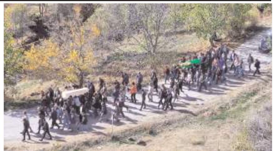
Anne ile oğlu için Oğuzlar'ın Kayı Köyü'nde cenaze töreni yapıldı.

Dua ve gözyaşlarıyla uğurlanan anne ve oğlu, köy mezarlığında da birbirinden ayrılmayıp, yanyana toprağa verildi.