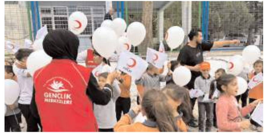
Öğrencilere çeşitli hediyeler verildi.

Çorum Gençlik Merkezi, Oğuzlar Gençlik Merkezi ve Hitit Üniversitesi Genç Kızılay Kulübü'nün Kayı İlkokulu'nda düzenlenen etkinlikte öğrenciler sokak oyunları oynadı.