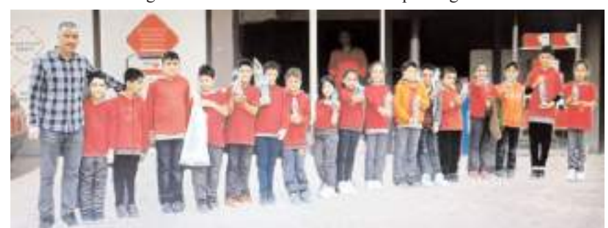
Toplanan 35 kilogram pil kargo ile geri dönüşüme gönderildi.