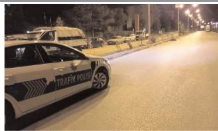
Kaza İskilip'te Dr. Devlet Bahçeli Caddesi'nde meydana geldi.

Kazada yaralanan motosiklet sürücüsü ile arkasında bulunan İ.Y, sağlık ekiplerince İskilipli Atf Hoca Devlet Hastanesine kaldırıldı.(AA)