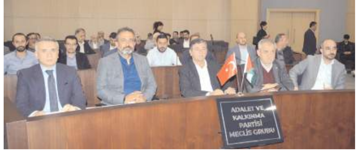
İsrail'e tepki bildirisine AK Parti, CHP ve MHP grupları imza attı.

"Filistin Platformu tarafından düzenlenen Büyük Filistin Yürüyüşüne 12.000'den fazla hemşehrimiz katılmış, zulme ve soykırıma karşı sesini yükseltmiştir. 5 Kasım'da ise Anneler ve Çocukları Kadeş Meydanı'nda bir araya gelerek Gazze'deki annelere, çocuklara masum halka destek vermiş, dünyayı duyarlı olmaya davet etmişlerdir. Halkımızın tepkisinin en güçlü yansıdığı alan İsrail mallarına karşı boykot hareketidir. Sosyal Tesislerde İsrail sermayesi mallara boykot uygulayan Çorum Belediyesi basta olmak üzere, bu duyarlılığı gösteren tüm kişi ve kurumlara teşekkür ediyoruz. Çorum Belediye Meclisi olarak başta Müslüman toplumlar olmak üzere tüm insanlığı, terör devleti İsrail'e karşı kararlı bir duruş sergilemeye ve harekete geçmeye davet ediyoruz. Zulüm ile âbad olanın âhiri berbâd olacağına inanıyor, Filistin'de ve tüm dünyada çocukların, kadınların, mazlumların huzur içinde yaşayacağı günlerin bir an önce gelmesini diliyoruz."