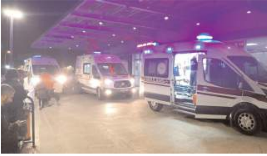
Yaralılar hastanede tedavi altına alındı.

■ Çorum'da Danaderesi mevkinde iki otomobilin çarpışması sonucu meydana gelen trafik kazasında 2 kişi öldü, biri ağır 3 kişi yaralandı.