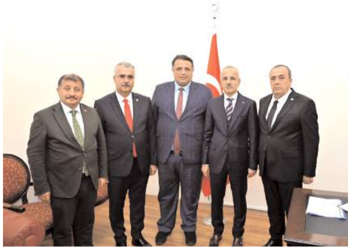
Ziyarete Çorum'un ulaşım yatırımları görüldü.

Ahlatcı, yapılan görüşme sonucunda Uraloğlu'nun 17 Kasım Cuma günü Çorum'a geleceğini aktardı. (Haber Merkezi)