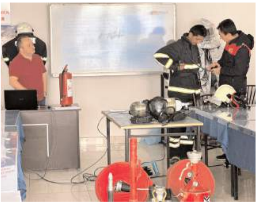
24 itfaiye personeli için mesleki eğitim programı düzenlendi.

Osmancık Belediyesi İtfaiye Müdürlüğü bünyesinde görevli 24 itfaiye personeline mesleki eğitim programı düzenlendi.