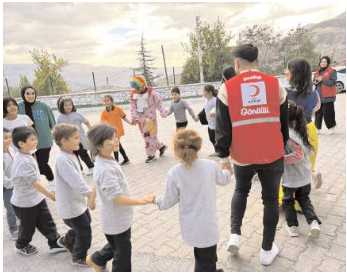
Kayı İlkokulu'nda düzenlenen etkinlikte öğrenciler sokak oyunları oynadı.

Çorum'da evlerde pekmez için çıkarılan üzüm suyundan pestil (üzüm köftesi) yapımına da devam ediliyor. Üzüm suyunun içerisine irmik katılarak hazırlanan kışlık yiyecek daha sonra tepsilere katılarak kendi halinde kuruması için bekletiliyor. Kıvama gelen pestiller baklava dilimleri gibi kesilerek temiz bezlerinin üzerine konularak gölge bir yerde kurutulduktan sonra kışın tüketilmek üzere kaplara konuluyor. (Haber Merkezi)