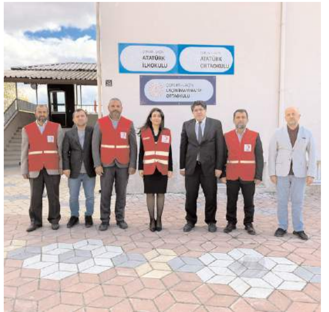
Programın ardından günün anısına hatıra fotoğrafı çekildi.