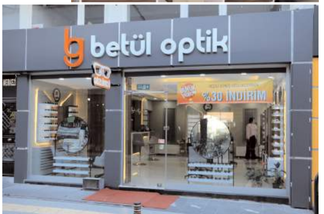
Betül Optik Yeniyo Mahallesi Azap Ahmet Sokak Numara 8/A adresinde açıldı.