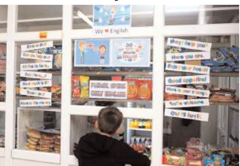
İl Millî Eğitim Müdürlüğü Filistin'e yönelik saldırıları protesto etmek amacıyla İsrail menşeli ürünleri boykot kararı aldı.