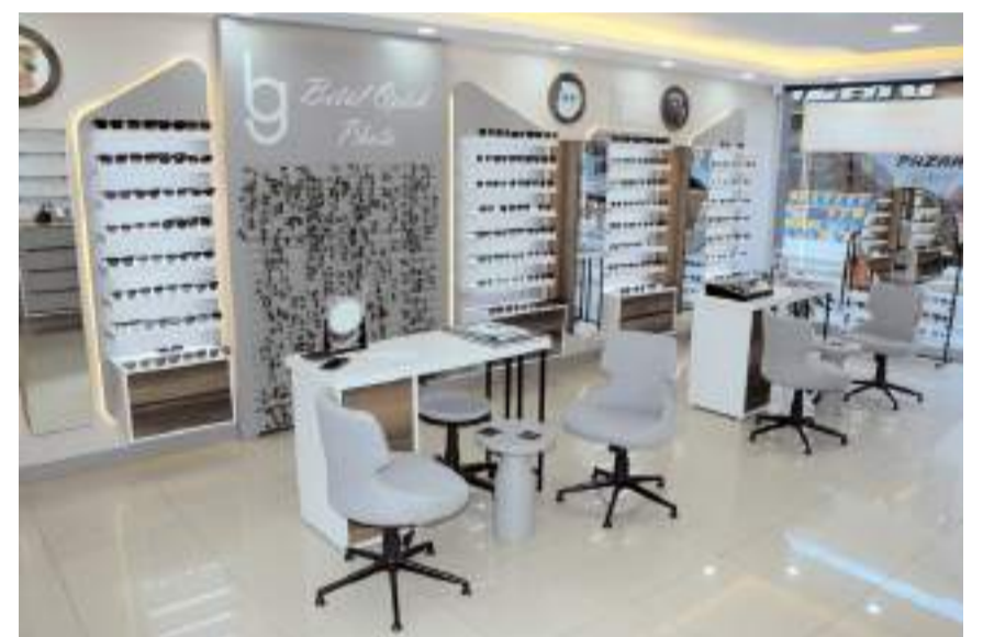
Açılış özel seçili güneş optik gözlüklerinde yüzde 30 indirim var.