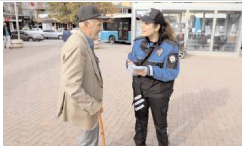
Vatandaşlara, içeriğinde sosyal medya dolandırıcılığına karşı alınması gereken tedbirlerin yazılı olduğu broşür dağıttı.

"Bunun yanı sıra dolandırıcı şahıslar kullandıkları çeşitli bilgisayar programları sayesinde vatandaşlarımızın telefon ekranında 'polis tarafından aranıyor' gibi gözükecek şekilde arama yaparak güvenlerini kazanmaktadırlar. Daha sonraki aşamalarda ise verdikleri hesap numaralarına para havale edilmesi, 'para ve altınların çöp kutuları, park yeri sokaklara bırakılması istenmektedir. Polis, jandarma, cumhuriyet savcısı veya herhangi bir kamu personeli hiçbir şekilde vatandaşlarımızdan elden ziynet eşyası, para teslimi veya havale, EFT yapılmasını katipen talep etmez. Sizi telefonla arayarak kendisini polis, savcı, asker olarak tanıtır, bankaya para yatırmanızı veya bir yere para, altın bırakmanızı isteyenlere asla inanmayın. Böyle durumlarla karşılaşmanız halinde 112 acil çağrı hattını arayın veya en yakın emniyet birimine müracaat edin."(AA)