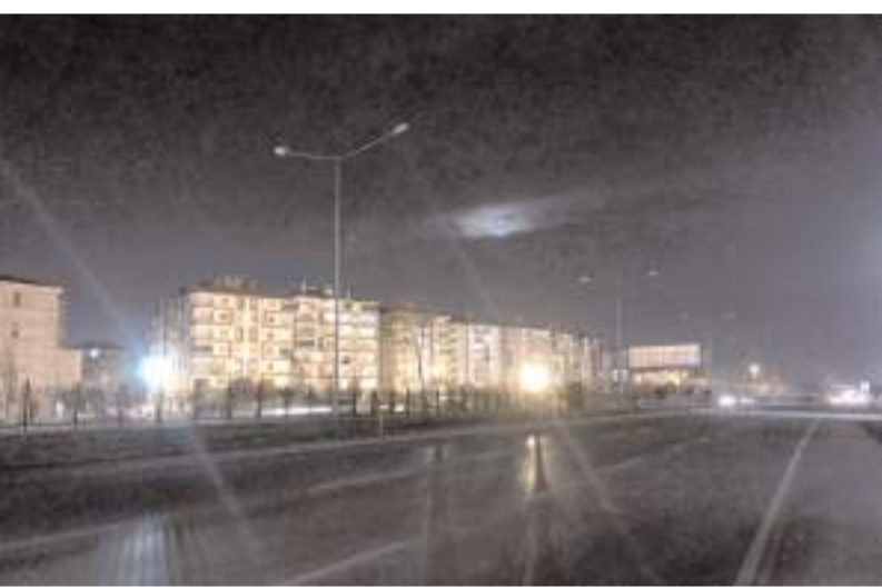
Bölge sakinleri yolun aydınlatma sorununun giderilmesini istiyor.