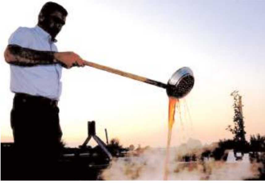
Ayağıbüyük Köyünde kazanlar pekmez yapımı için kaynıyor.