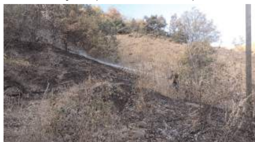
Yangın diğer bahçelere sıçramadan söndürüldü.