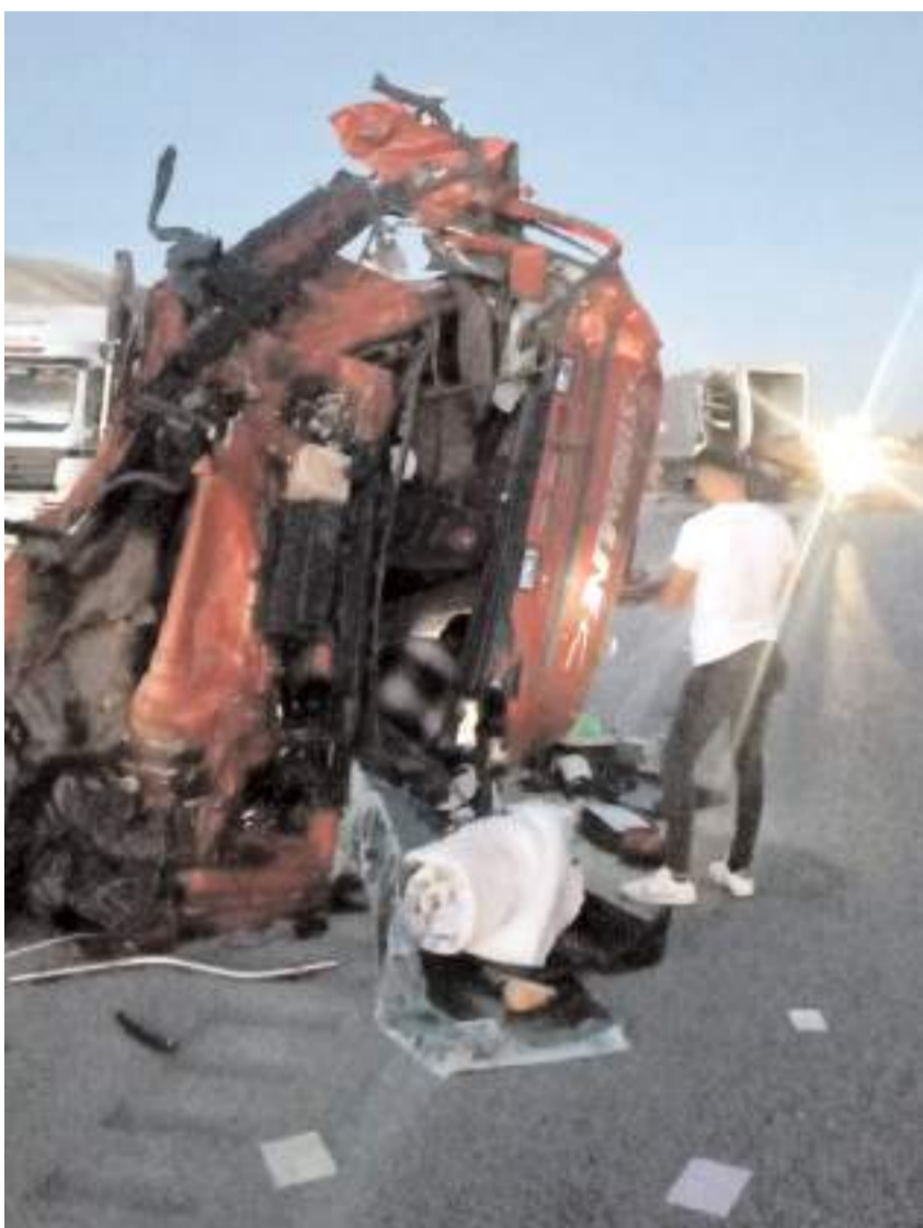
Kazada tır hurdaya döndü.