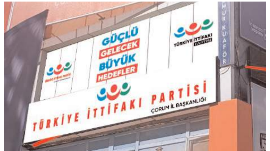
Türkiye İttifakı Partisi Çorum merkezde teşkilatlanarak tabelasını astı.

48 ilde teşkilatlanma çalışmalarını tamam-