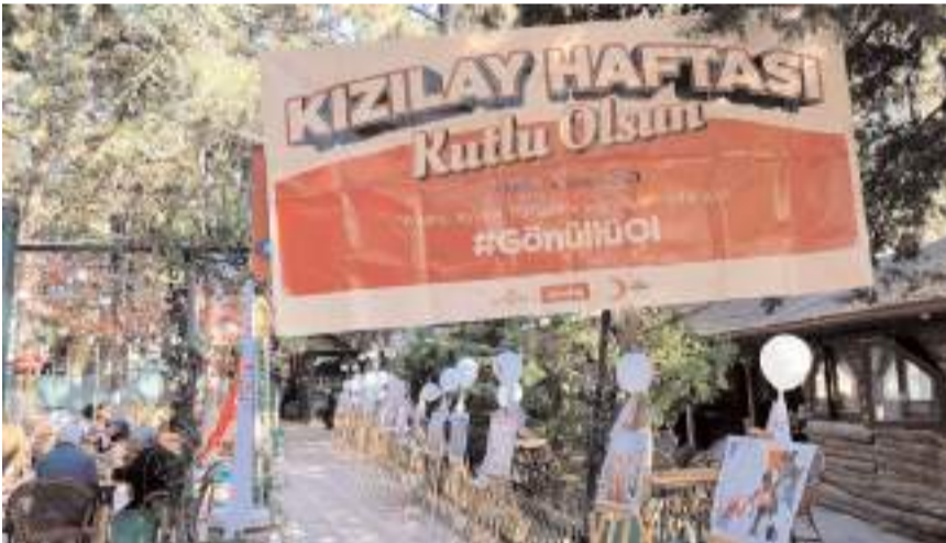
Türk Kızılayı İskilip Şubesi, kan bağıışı kampanyası düzenledi.

Kampanya kapsamında iki günde 80 ünite kan bağıışı alındığı bildirildi.(AA)