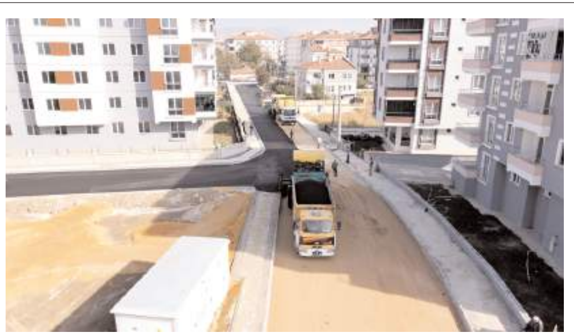
Söğütlüevler 3. Cadde, 44. Sokak, 62. Sokak ve 68. sokakların asfaltı tamamlandı.

Etcı, leylekle ilgili Doğa Koruma ve Milli Parklar Şube Müdürlüğüne bilgi vereceklerini sözlerine ekledi.(AA)