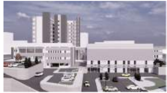
Hastane 200 yatak kapasiteli olacak.