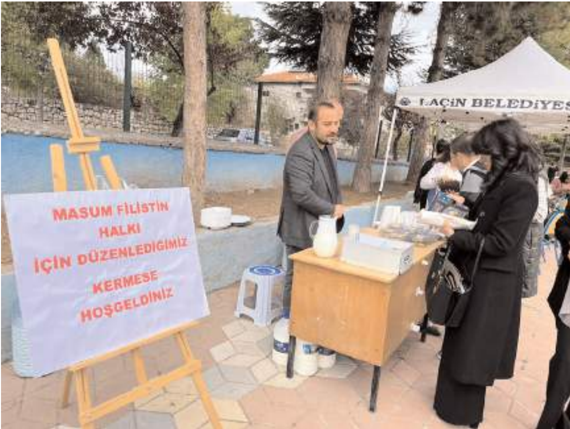
Kermesi Laçın İmam Hatip Ortaokulu ve Laçın Atatürk Ortaokulu düzenledi.