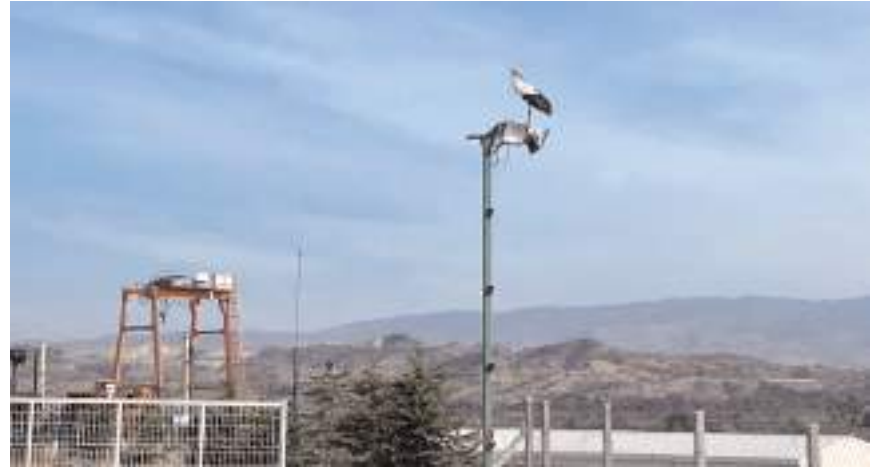
Leylek bir hidroelektrik santralinin aydınlatma direğinde yuva yapmış.