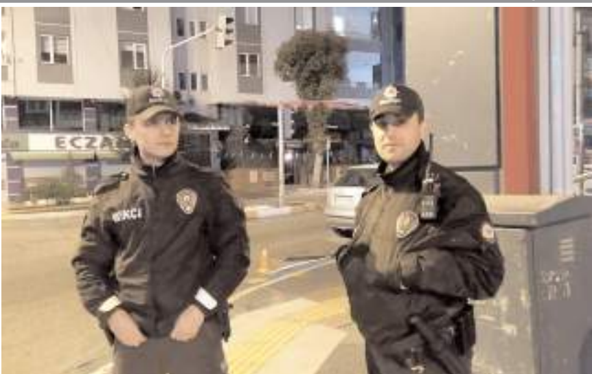
Bekçiler parayı Özdoğanlar Kavşağı yakınlarında buldular.

Çorum'da çarşı mahalle bekçileri devriye atıkları sırada buldukları paranın sahibini arıyor.