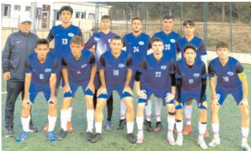
Gençlerbirliği final grubu ikinci maçından farklı galip ayrılarak iddiasını ortaya koydu