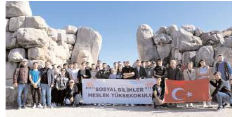
Etkinliğe Turizm ve Otel İşletmeciliği Bölümü öğrencileri katıldı.

Hattuşa, Yazılıkaya ve Alacahöyük Ören yerlerinin Çorum'un önemli turizm mekanlarından olduğunu vurgulayan Yılmaz, "Bölgede doğa turizminin önemli bir parçasını oluşturan trekking rotalarını da öğrencilerimize tanıtmış olduk. Özellikle turizm sektörünün içinde bulunan kişilerin doğa dostu ve çevreye saygılı bireyler olması gerekmektedir. 'Doğada sadece ayak izimiz kalsın' sloganıyla düzenlediğimiz etkinliği vesile ederek tüm doğaseverlere seslenmek istiyoruz ki doğayı temizlemek değil, kirletmemek daha önemlidir. Öğrencilerimize de bu alışkanlığı kazandırmak amacıyla benzer etkinliklerimizi sık sık düzenlemeyi planlıyoruz." dedi. (AA)