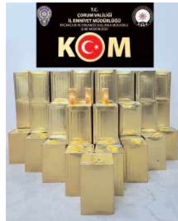
Düzenlenen 3 ayrı operasyonda ele geçirilen kaçak malzemelere el konuldu.