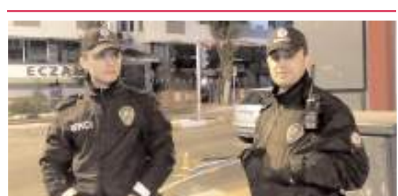
Bekçiler parayı Özdoğan Kavşağı yakınlarında buldular.

■ AK Parti'de yerel seçimler için aday adaylığı sürecinde başvuru tarihi 22 Kasım Çarşamba gününe kadar uzatıldı. * HABERİ6'DA