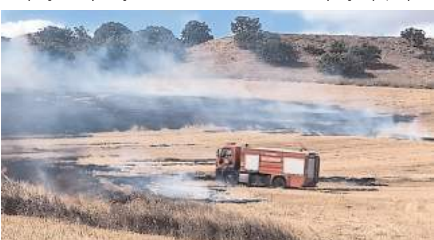
Anız yangınları itfaiyenin müdahalesi ile büyümeden söndürüldü.

Alaca'da son 2 ayda meydana gelen yaklaşık 400 anız yangını itfaiye ekipleri tarafından söndürüldü.