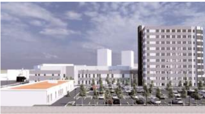
İhale 13 Kasım 2023 tarihinde yapıldı.