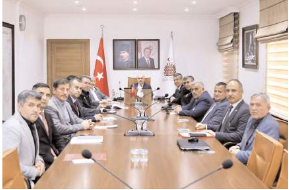
Toplantıda son üç ayda yapılan çalışmalar değerlendirildi.

Emniyet ve asayiş konusunda bugüne kadar yapılan sıkı çalışmaların güzel sonuçlar verdiğini dile getiren