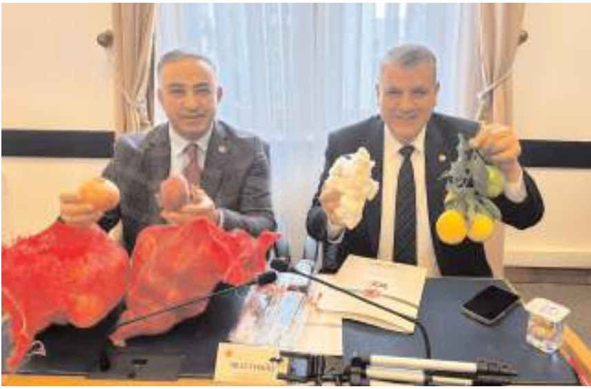
Milletvekili Tahtasız, TBMM Plan Bütçe Komisyonu'nda yaptığı konuşmada çiftçinin sorunlarını dile getirdi.

lün yazı'nın, gelecek nesillere aktarılması için bir an önce harekete geçilmesi gerekiyor ve burada tedbir alınması gerekiyor. İlimizden de geçen 355 kilometre uzunluğundaki Kızılırmak'ta su seviyesinde düşüş var, bu konuda gerekli önlemleri almanız lazım. Kızılırmak üzerinde, 1996 yılında başlayıp 2009 yılında su tutulmaya başlayan Obruk Barajı esas geyesi sulama, içme suyu ve elektrik üretimi olduğu hâlde, baraj on dört yıldan fazladır hizmette olmamasına rağmen, sadece elektrik üretimi amaçlı kullanılmaktadır. Bu barajın sulama amaçlı kullanılması gerekiyor. Merkezdeki Derinçay 1990 yılına kadar balık tutulabilen, köylerimizin bahçesini, tarlasını sulayabilen, zengin bir su kaynağıydı. Bugün eski hâlden eser yok, sanayi artıkları o bölgeyi kirletti. Önemli tarım arazilerinin olduğu bölgede tarımsal sulama kanalları da yapılmamış. Baraj çevresinde Çorum merkeze bağlı Salur, Tozluburun, Hacıbey, Babaoğlu ve Dut köylerinde acilen sulama kanallarının yapılması gerekiyor. Devlet planlama teşkilatını kurmalısınız. Mazot, gübre desteği vereceğinize çiftçimize ürün bazlı destek vermeliyiz. Çiftçimiz önceden gereken erken taban fiyatını bilmeli ve üretimini ona göre yapmalıdır. Üreticimiz 1 kilo soğanın maliyetini 4,5 liraya mal etmesine rağmen, şu anda ihracatı yasakladığımız için Çorum'daki mor soğan ve normal soğan üretimimiz zor ve bu sorunu, bir an önce ihracatı açarak gidermelisiniz." (Haber Merkezi)