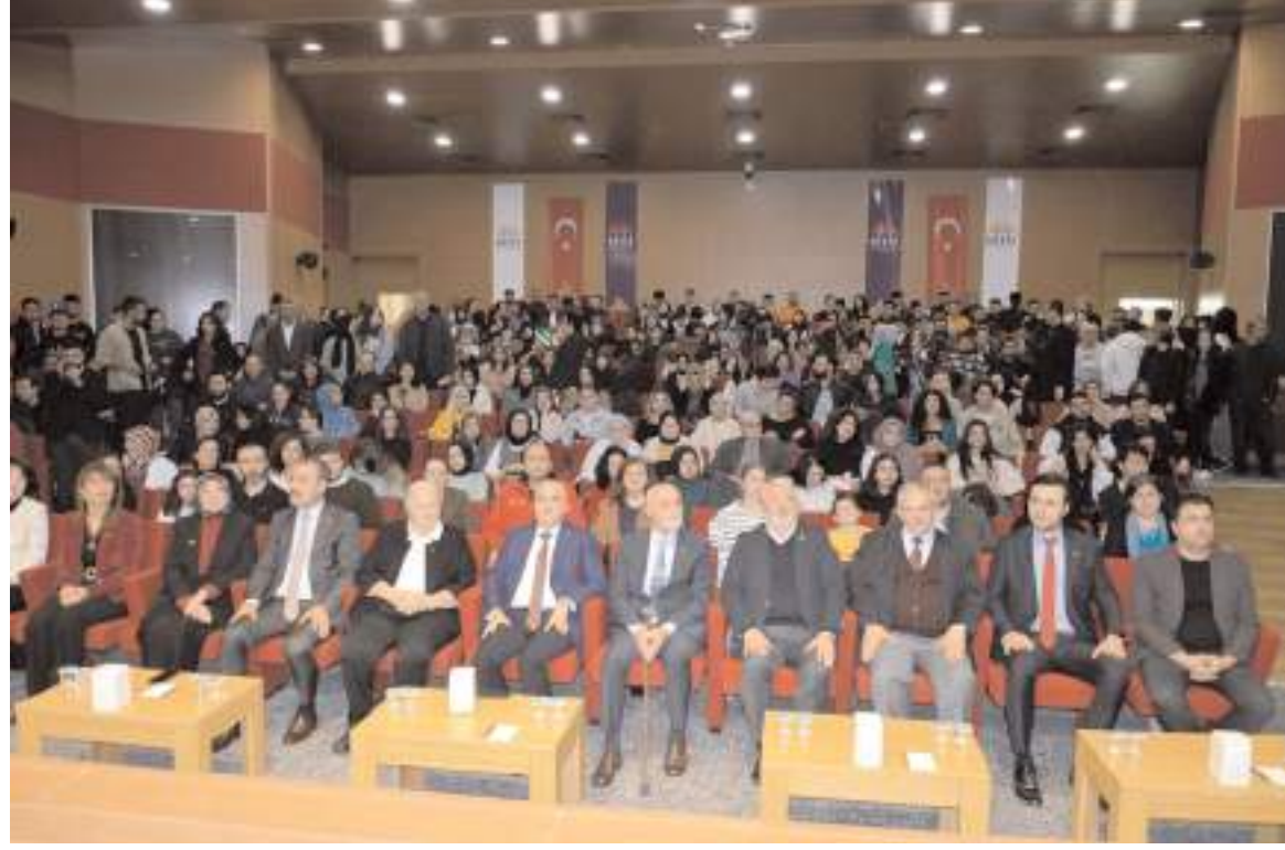
Meslek Yüksekokulu Ethem Erkoç Konferans Salonu'nda yapılan programa ilgi yüksek oldu.