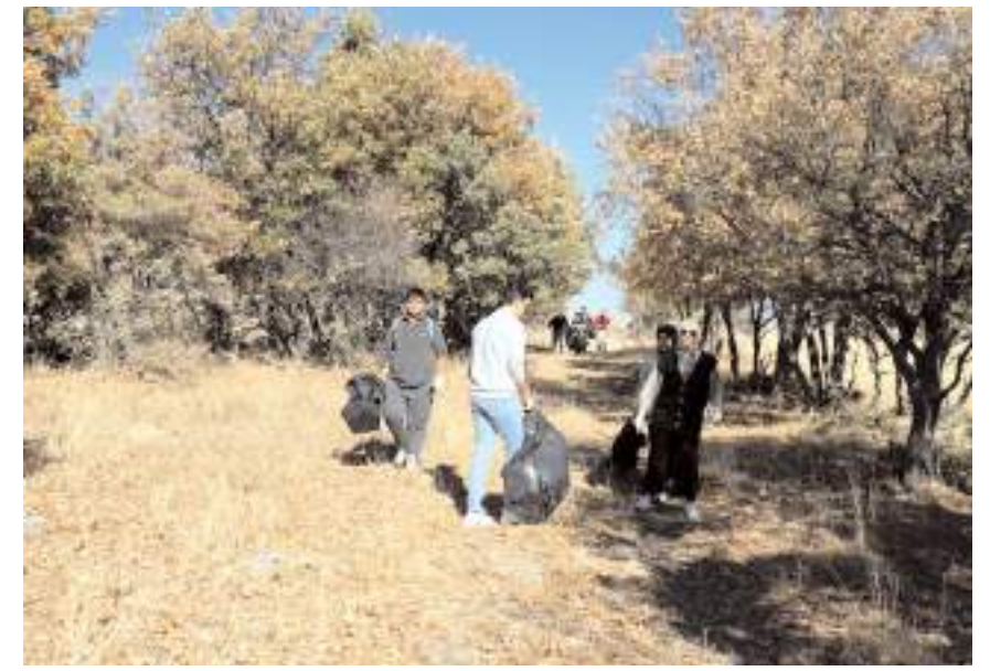
Öğrenciler yürüdükleri güzergahtaki doğal olmayan atıkları topladılar.