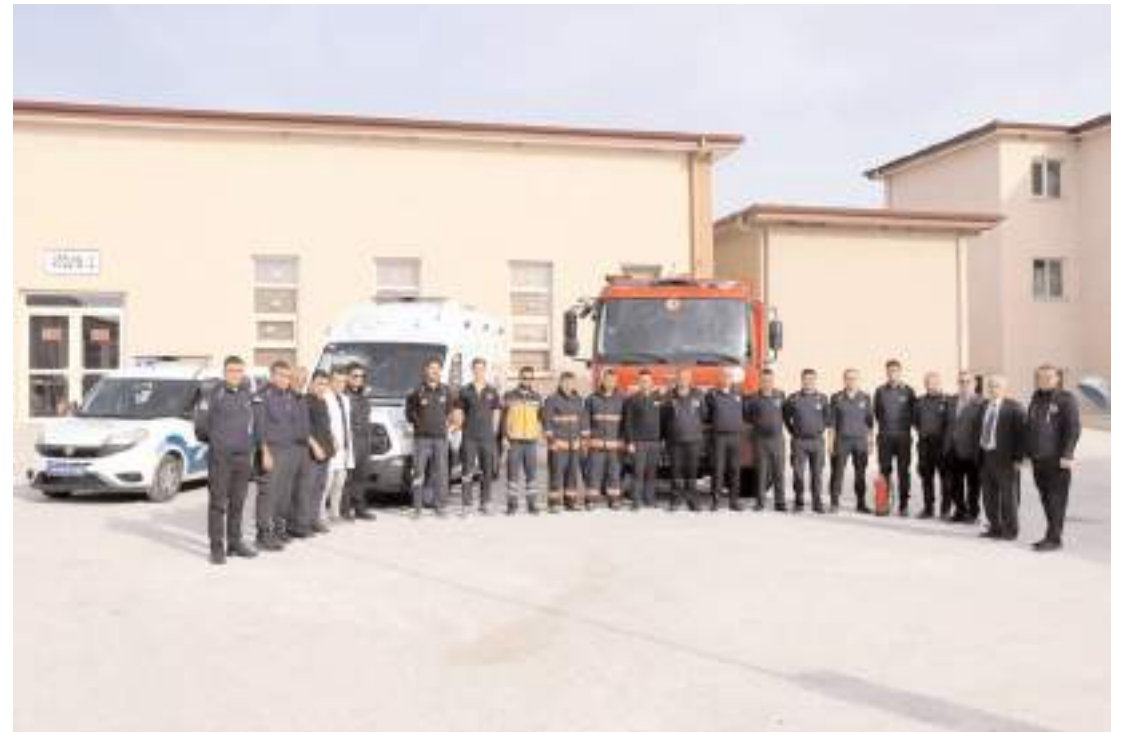
Tatbikatın ardından toplu hatıra fotoğrafı çekildi.