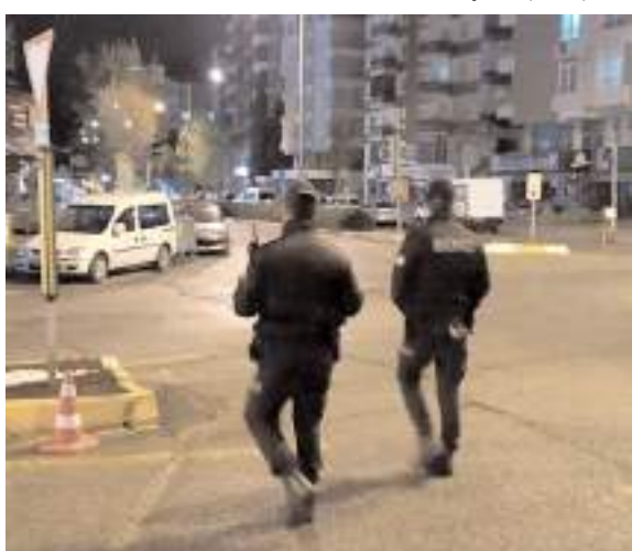
Bekçiler devriye atıkları sırada buldukları paranın sahibini arıyor.