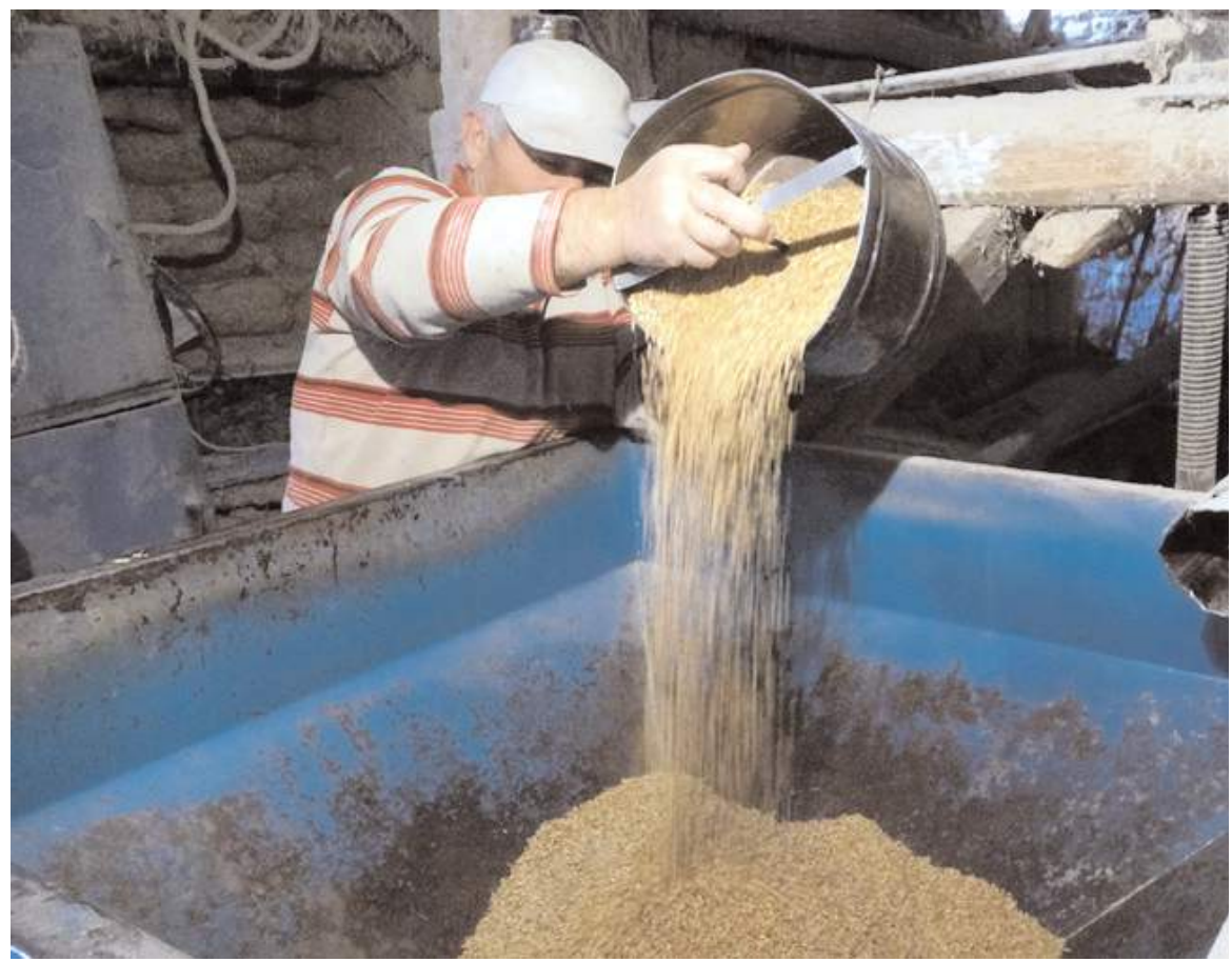
Değirmen 49 yıldır hizmet veriyor.