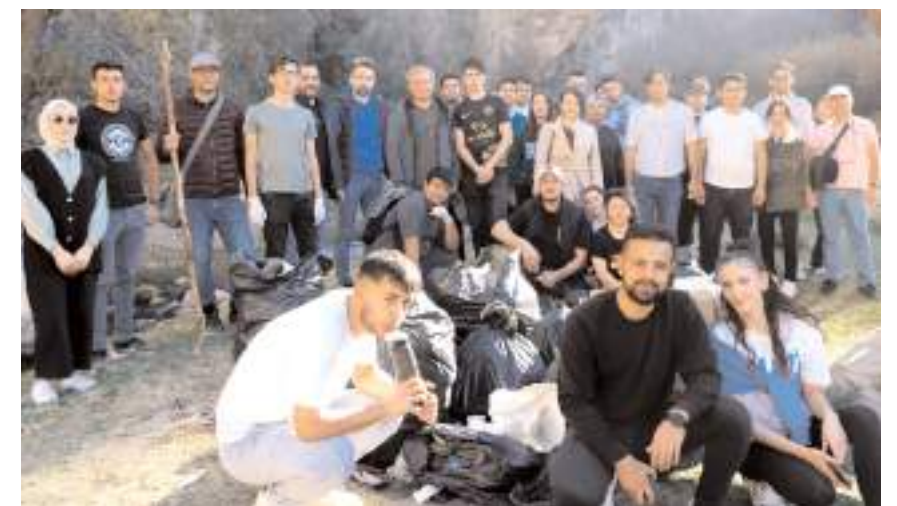
Gezinin sonunda toplu hatıra fotoğrafı çekinildi.