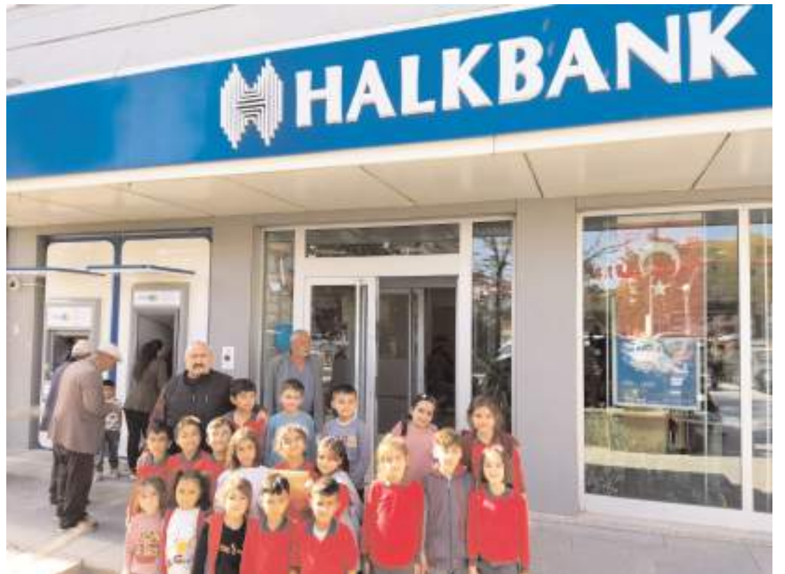
Kermesten edilen gelirin tamamı öğrenciler tarafından Filistin'deki ihtiyaç sahiplerine ulaştırılmak üzere banka hesabına yatırıldı.