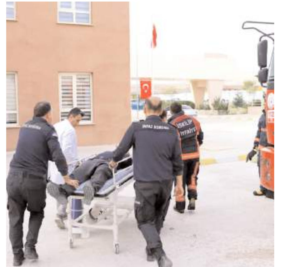
Olası yangın durumunda personel ve hükümlülerin yapması gerekenler uygulamalı olarak gösterildi.

Ardından yangına ilk müdahale, yangın söndürücülerin kullanımı gibi konularda uygulamalı eğitim verildi.(AA)