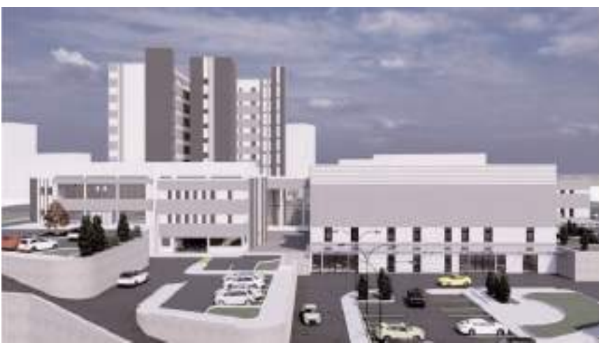
Hastane 200 yatak kapasiteli olacak.

İhale süreci kesinleştiğinde detaylı bilgiler kamuoyu ile paylaşılacak olup Devlet Hastanesi için desteklerinden dolayı başta Cumhurbaşkanımız Sayın Recep Tayyip Erdoğan olmak üzere Sağlık Bakanımız Sayın Fahrettin Koca, AK Parti Milletvekillerimiz Sayın Yusuf Ahlatcı ve Sayın Oğuzhan Kaya'ya teşekkür ederiz."