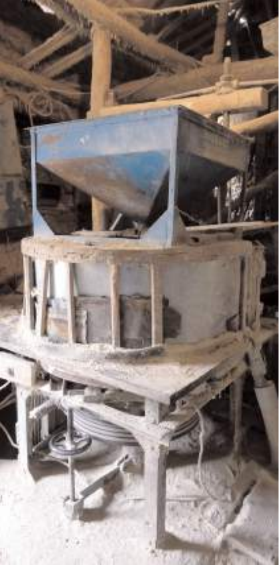
Değirmen 1974 yılında yapılmış.

Filiz Otomotiv'de çalıştırılmak üzere; Ön Muhasebe'den anlayan BAY eleman alınacaktır. Müracaat Tel: 0 532 607 27 47 Adres: Sanayi Sitesi 15. Cad. No:3