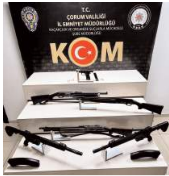
Operasyonlarda 5 adet ruhsatsız tüfek ele geçirildi.

KOM ekiplerince gümrük kaçağı alkollü içki-sigara, emtia kaçakçılığı ve silah mühimmatı ticaretini önlemeye yönelik gerçekleştirilen 3 ayrı operasyon el yapımı alkollü içki, kaçak sigara ile içeriğinde kullanımı yasaklı Sildenafil ve Tadalafil etken maddeleri bulunan cinsel içerikli ürünleri sattıkları tespit edilen şahısların ikamet ve iş yerinde yapılan adli aramada; 4 bin 334 adet çeşitli markalarda cinsel içerikli hap/krem, 136 paket gümrük kaçağı sigara, 15 adet elektronik sigara ile 11 adet elektronik sigara likiti, bin 400 adet doldurulmuş makaron sigara ile