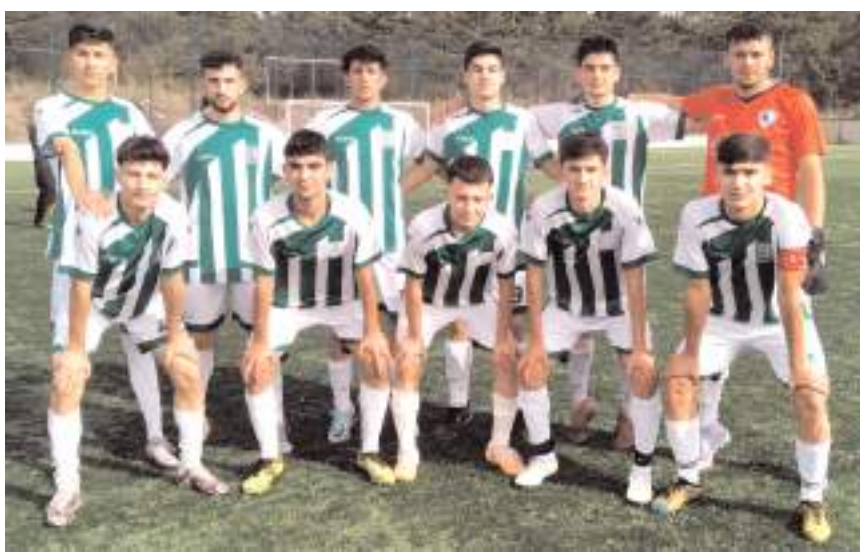
Mimar Sinan Gençlikspor şampiyonluk yolunda önemli bir adım daha attı