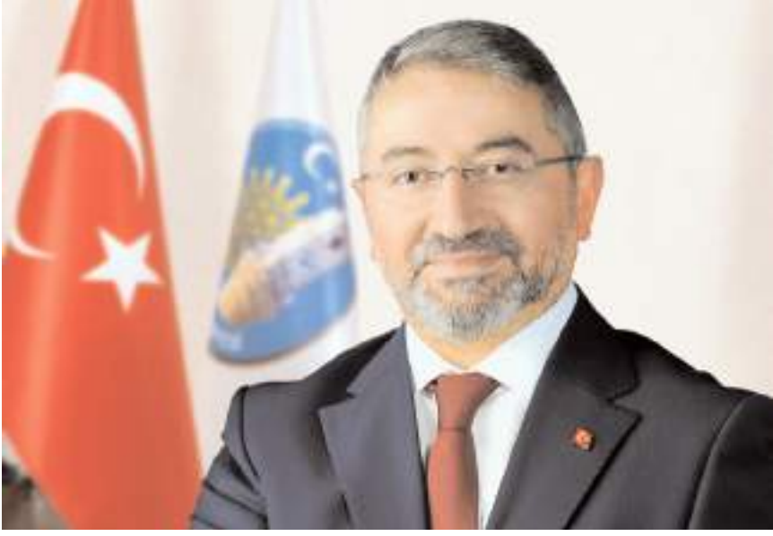
Çorum Belediye Başkanı Halil İbrahim Aşgın

"Yeni dönemin en önemli işi kentsel dönüşümde belediyenin rolünü artırmak olacak. Kentsel dönüşüm, müteahhitlerle anlaşarak yapılmazsa biz Çorum Belediyesi olarak bizzat bu işin içerisine gireceğiz. Özel sektör tarafından yapılmazsa vaadimiz olsun, yeni dönemde görev bize nasip olursa buradaki binaların çoğunu Çorum Belediyesi olarak bizzat biz yapacağız."(AA)