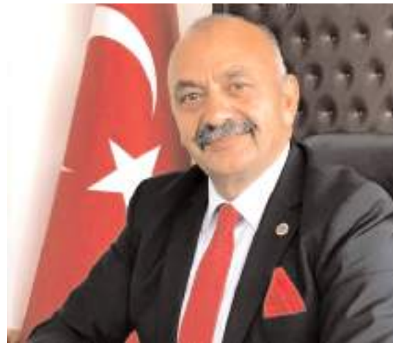
Ortaköy Belediye Başkanı Taner İsbir