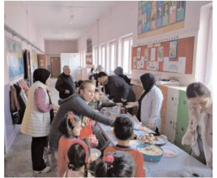
Kermeste, el emeği göz nuru ürünlerin yanı sıra, geleneksel lezzetlerin satışı yapıldı.

Kermese katılan vatandaşlar bu güzel ve anlamlı yardım faaliyetlerini sonuna kadar desteklediklerini ve Filistinli Müslüman kardeşlerinin yanında olduklarını belirttiler. Filistin'e yapılan bu tür yardımların, insani değerlere örnek teşkil ettiğini vurgulayan vatandaşlar, duyarlılıkları ile örnek olan Sunguroğlu İlkokulu öğretmenlerine, öğrencilerine ve velilerine teşekkür ettiler. (Haber Merkezi)