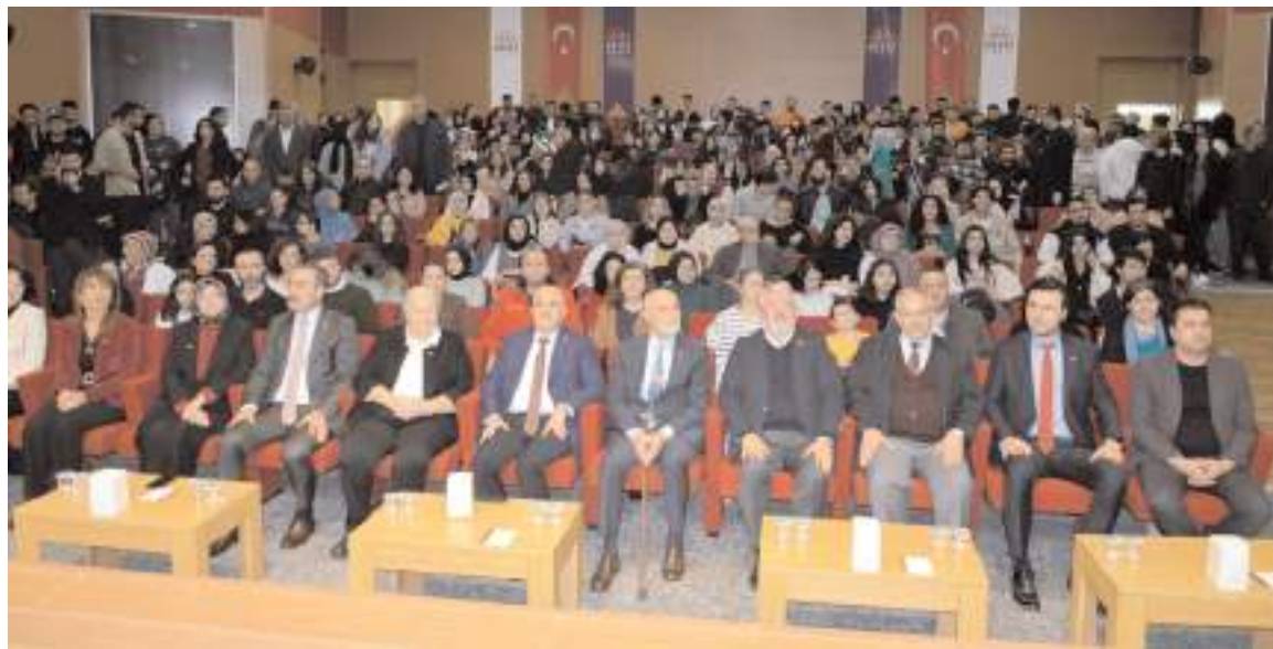
Meslek Yüksekokulu Ethem Erkoç Konferans Salonu'nda yapılan programa ilgi yüksek oldu.