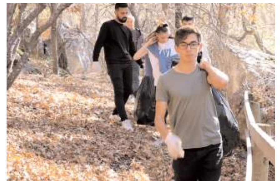
50 kişilik grup, Hitit Yolu'nda doğa yürüyüşü yaptı.