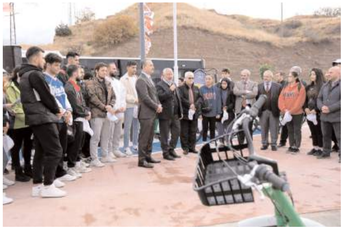
Kuzey Kampus ÇORBİS İstasyonu düzenlenen törenle açıldı.

ma kararı bulunan 22 şahıs yakalandı. Ayrıca Çorum'da haklarında kayıp olduklarına dair müracaatta bulunulan 4 kadın ve 3 erkek şahıstan, 3 kadın ve 3 erkek şahıs ekipler tarafından bulunurken kayıp olan 1 kadın şahsın aranmasına ise devam edildiği belirtildi. (Haber Merkezi)