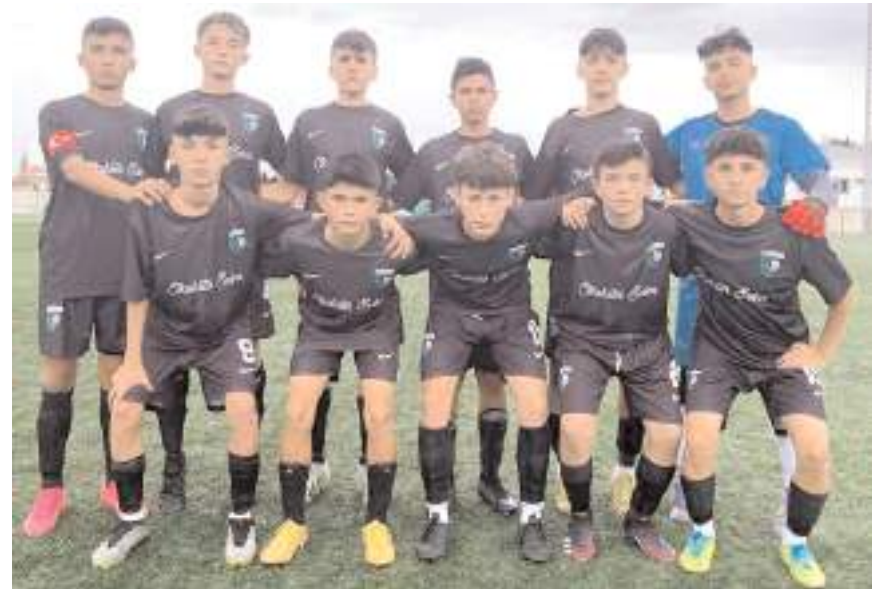
Çorum Anadolu FK bugün kazanarak ligi şampiyon olarak tamamlamak istiyor

Çorum Anadolu FK. - Mavi Ay Gençlikspor. Hattuşa Gençlikspor- Mimar Sinan Gençlikspor.