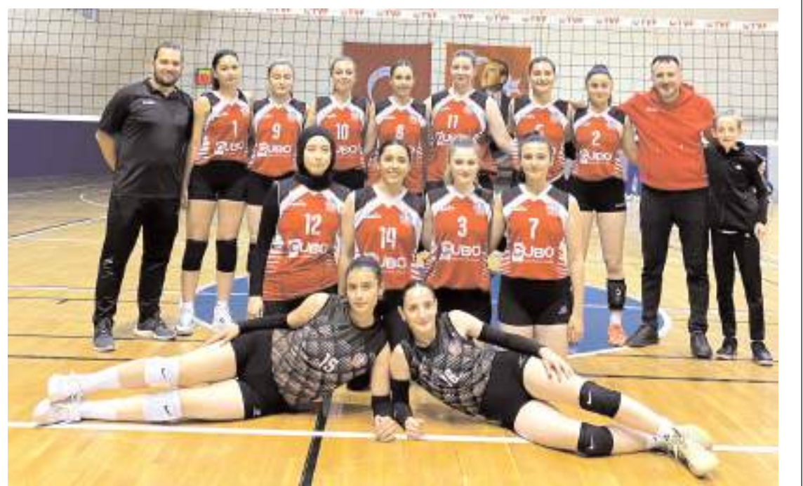
Osmancık Belediyespor beşinci maçında üçüncü galibiyetini alarak üst sıralara tutundu