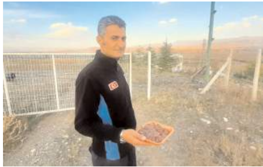
Leyleği belediye ekipleri besliyor.

mak'tan beslenmeye çalıştığını vurgulayan Etcı, "Havaların soğuması nedeniyle yiyecek bulmaktan sıkıntı çekebileceğini düşünerek leyleğe haftada bir iki kez yiyecek takviyesinde bulunuyoruz." diye konuştu.