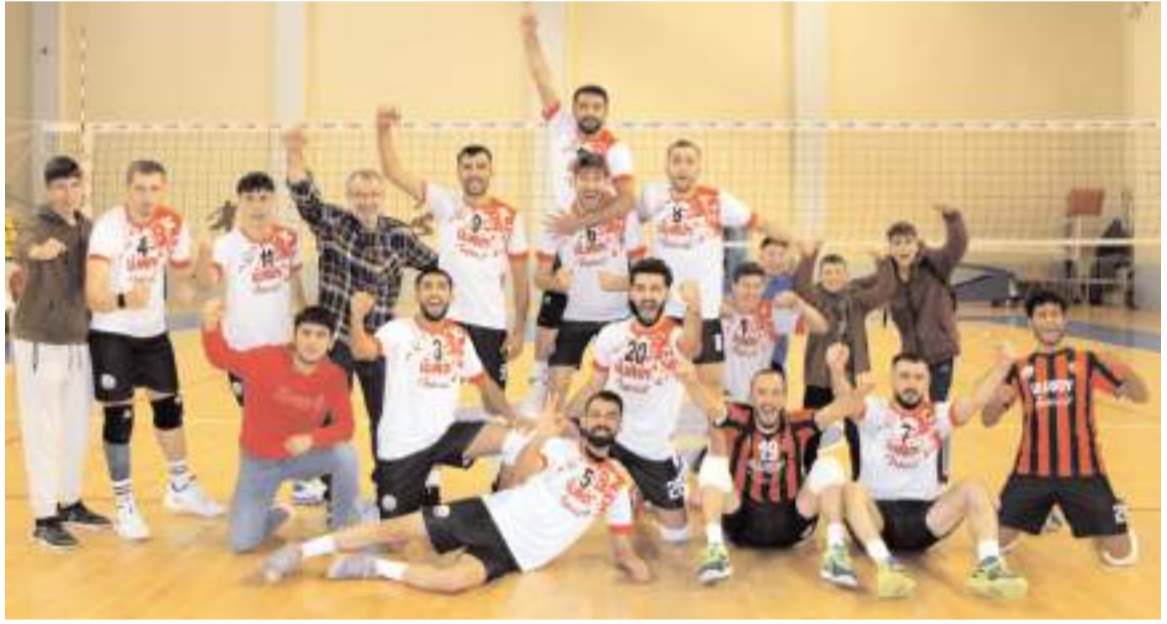
Sungurlu Belediyespor evinde kazandığı Başkent Beşiktaşlılar maçının ardından galibiyet sevincini böyle yaşadı

mızın bilinmesini istiyorum " diye konuştu. Ardahanlı ayrıca, kendilerini destekleyen taraftarlara da teşekkür etti.