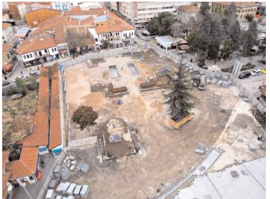
Meydan projesinde çalışmalar devam ediyor.