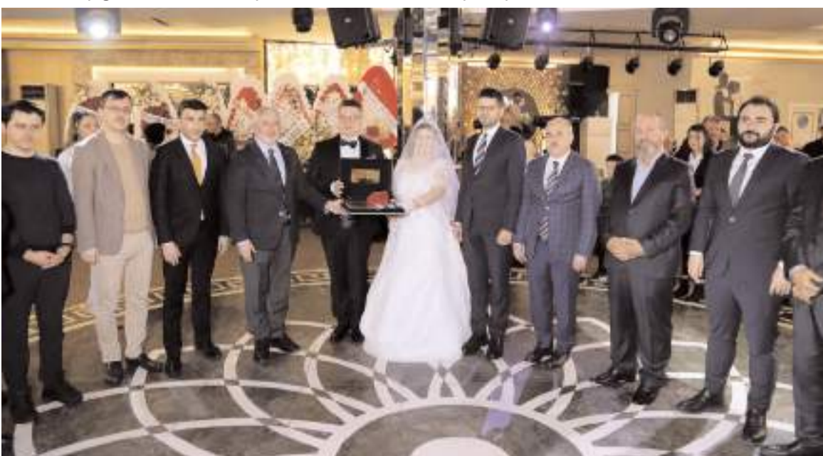
Genç çiftin düğün törenine çok sayıda davetli katıldı.

Genç çift, tüm davetlilere yakın ilgi göstererek, bu mutlu günlerinde kendilerini yalnız bırakmadıkları için teşekkür etti.