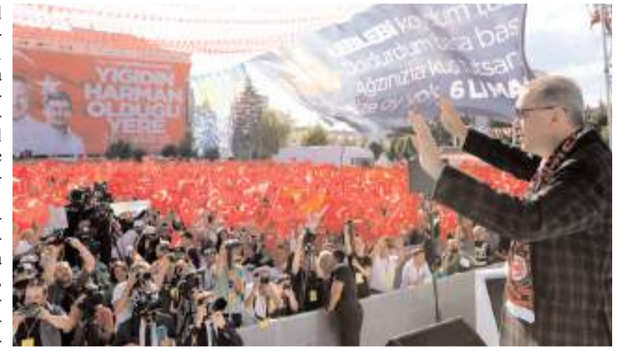
26 Kasım'da elektronik ortamda teşkilat temayül yoklaması yapılacak.

Yerel yönetimler başkanlığı geçtiğimiz aylarda teşkilat büyüklerinin tecrübeli siyasetçilerden olu-