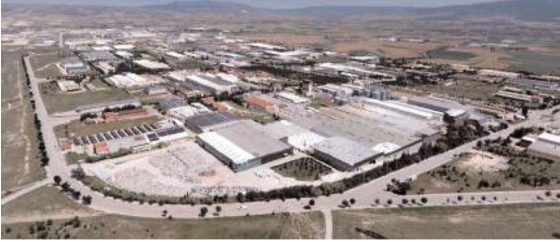
Çorum'da çok sayıda firma ihracat yapıyor.