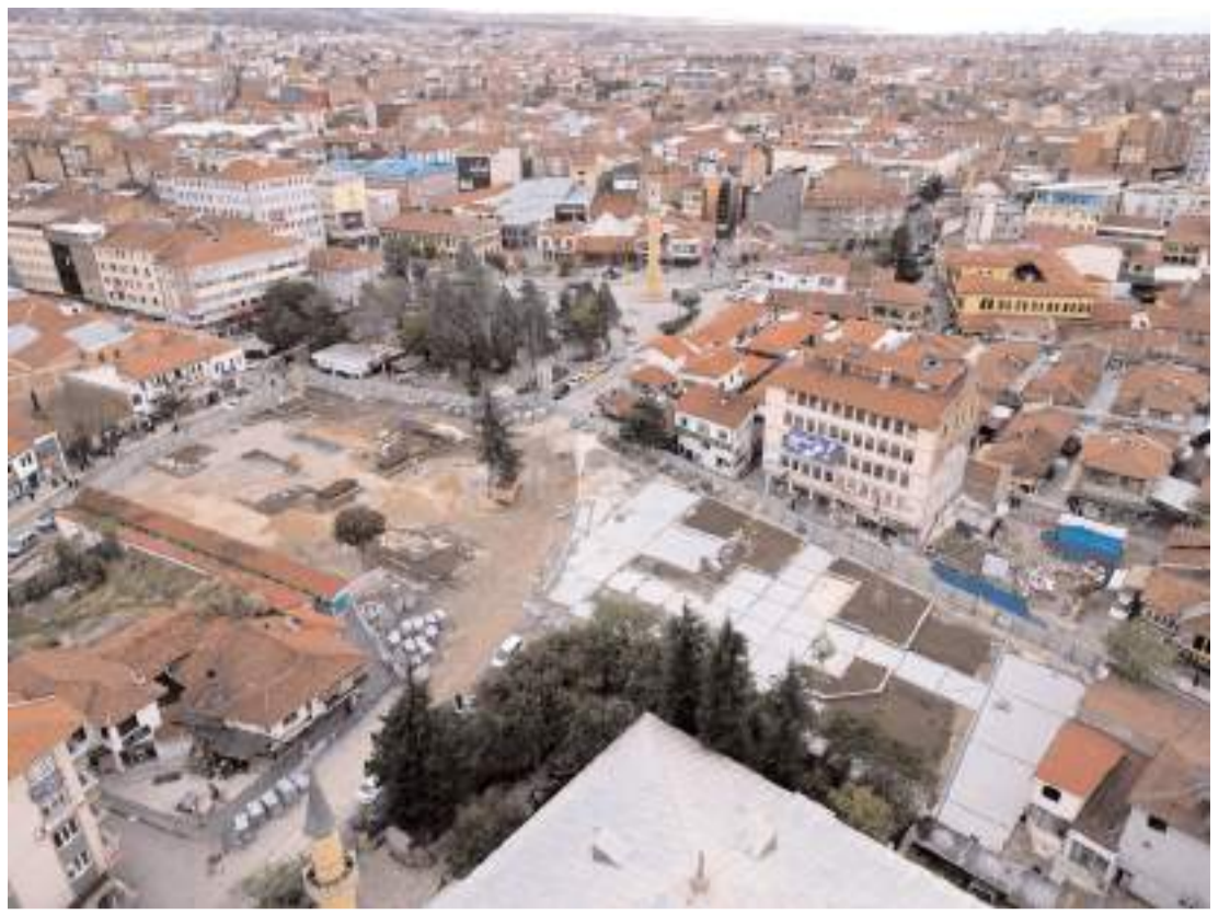
Tarihi Çorum Meydanı projesinin 6,5 dönümü kapsayan kısmında çalışma yapılıyor.