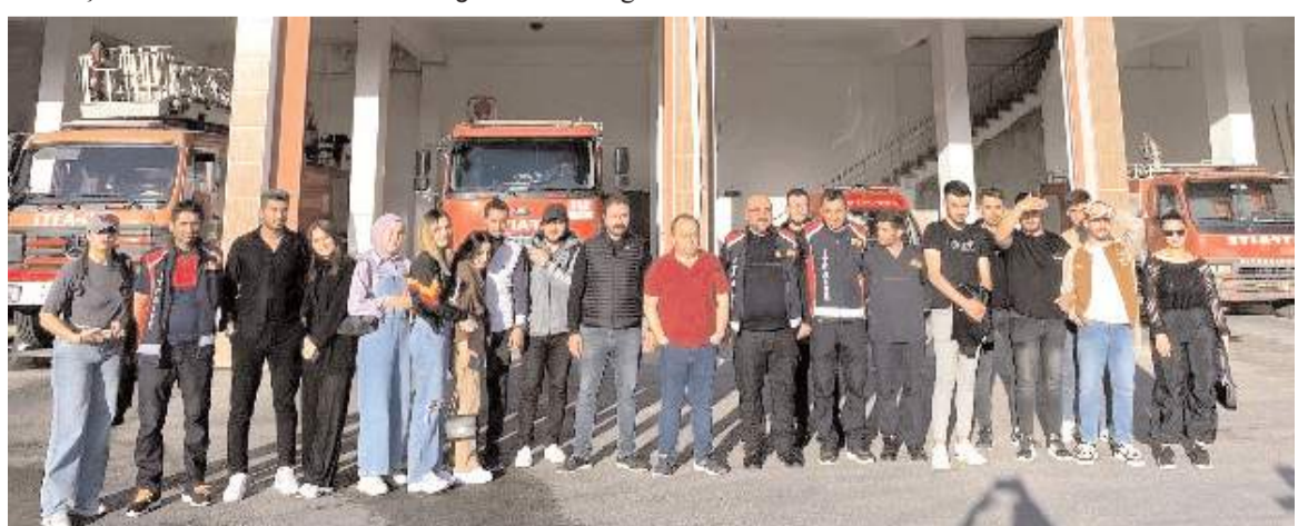
Programın sonunda toplu hatıra fotoğrafı çekildi.