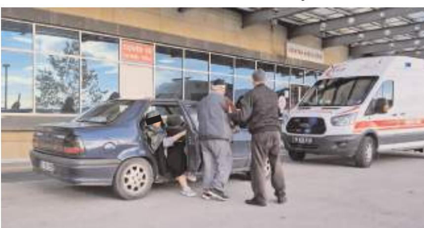
Yaşlı çifti, komşuları hastaneye getirdi.

Çorum'da apartmanın merdivenlerinden düşen yaşlı çift yaralandı.