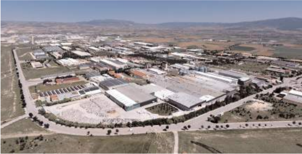
Çorum'da çok sayıda firma ihracat yapıyor.