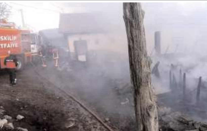
İskilip Belediyesi İtfaiye ekipleri yangını çevre evlere ulaşmadan söndürdü.

Yangınla ilgili başlatılan soruşturma sürüyor. (İHA)