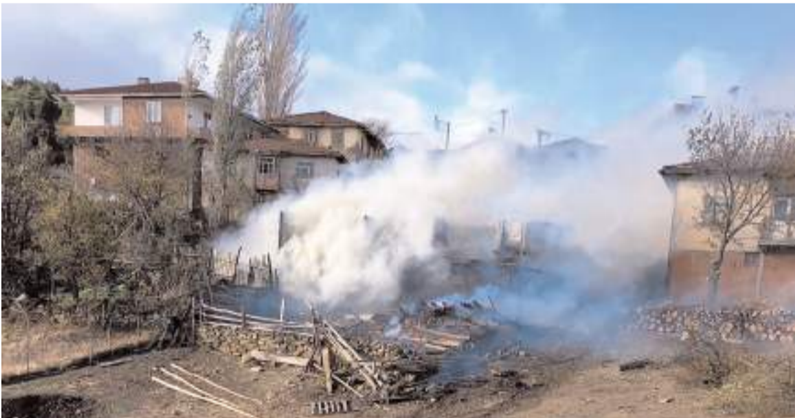
Yangında ev ile samanlıkta büyük çaplı maddi hasar meydana geldi.