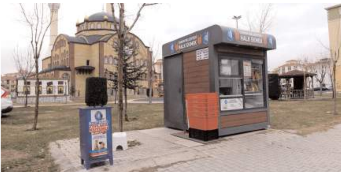
Belediye, Halk Ekmek büfelerinin yanına Bayat Ekmek Toplama Kutuları yerleştirdi.

ve sevgiyle kutluyor, sağlıklı ve mutlu bir gelecek diliyorum. Ulu Önder Gazi Mustafa Kemal Atatürk'ün dediği gibi "Küçük hanımlar, küçük beyler! Sizler hepimiz geleceğin bir gülü, yıldızı ve ikbal ışığıdır. Memleketi asıl ışığa boğacak olan sizsiniz. Kendinizin ne kadar önemli, değerli olduğunuzu düşünerek ona göre çalışınız. Sizlerden çok şey bekliyoruz." (Haber Merkezi)