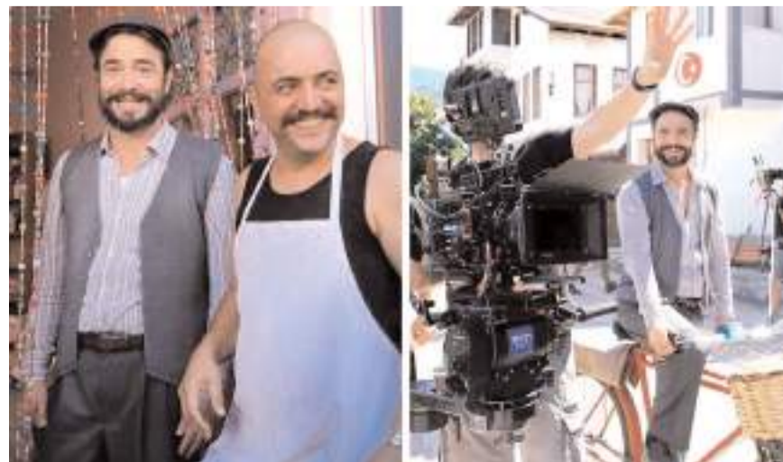
Filmin çekimleri Çorum'da yapılmıştı.

lerinden tarifi almaya hak kazanmak için mücadele eden ikiz kardeşler Sadık ve Özgür'e hayat veriyor. (Habertürk)