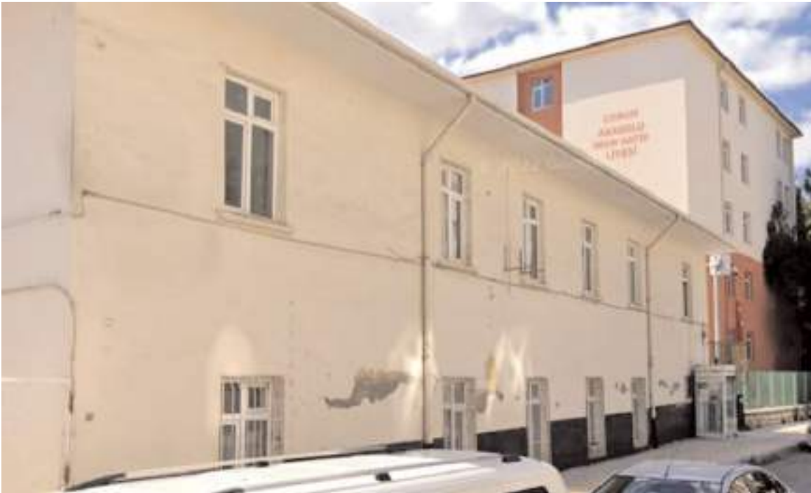
Bina uzun süredir atıl vaziyette duruyordu.