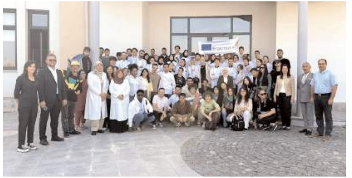
Etkinliğin ardından toplu hatıra fotoğrafı çekildi.

olduğu “Kültürler Hattuşa’da Buluşuyor” projesine Türkiye, İspanya, İtalya, Macaristan, Kuzey Makedonya ve Yunanistan’dan katılan 45 genç, Alaca Avni Çelik Meslek Yüksekokulunda Aşçılık Programı öğrencileri ile birlikte ‘Hingal’ yaptılar.