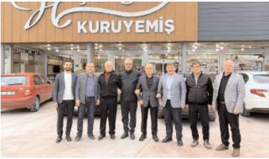
AK Parti Çorum Milletvekili Yusuf Ahlatcı, esnafları ziyaret etti.