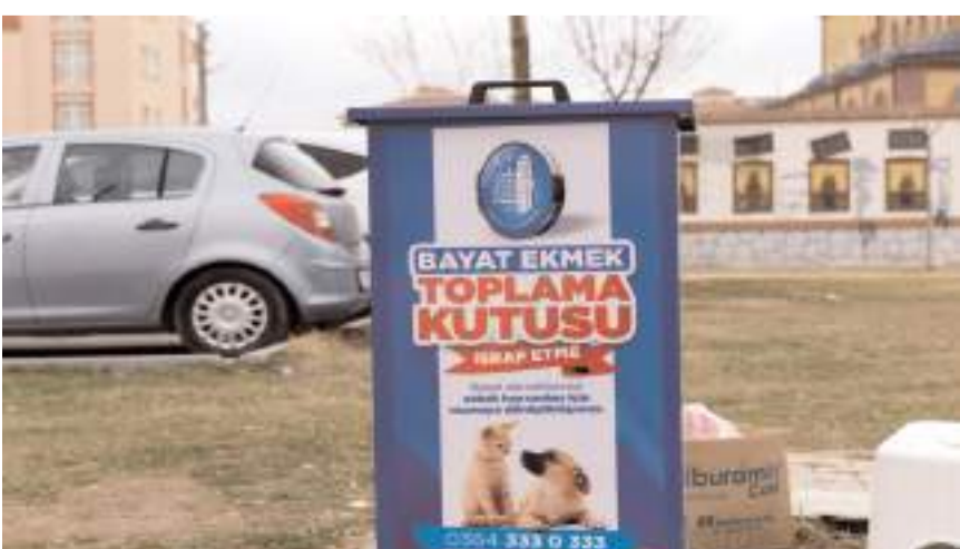
Bayat Ekmek Toplama Kutuları 35 noktada bulunuyor.

Çöplü, "Buralarda biriken bayat ekmekleri sokak hayvanlarına vermek isteyenler de olabilir. Kalan ekmekleri biz de Çorum Belediyesi olarak değerlendireceğiz. Bu sayede ekmek israfının önüne geçmiş olacağız" ifadelerini kullandı. (Haber Merkezi)