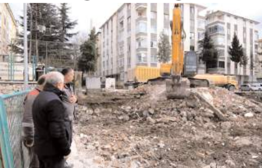
Başkan Aşgın, yıkım çalışmaları hakkında bilgi aldı.