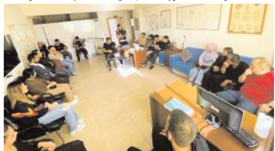
Öğrencilere Yangın ve Acil Durumlar dersindeki konular anlatıldı.