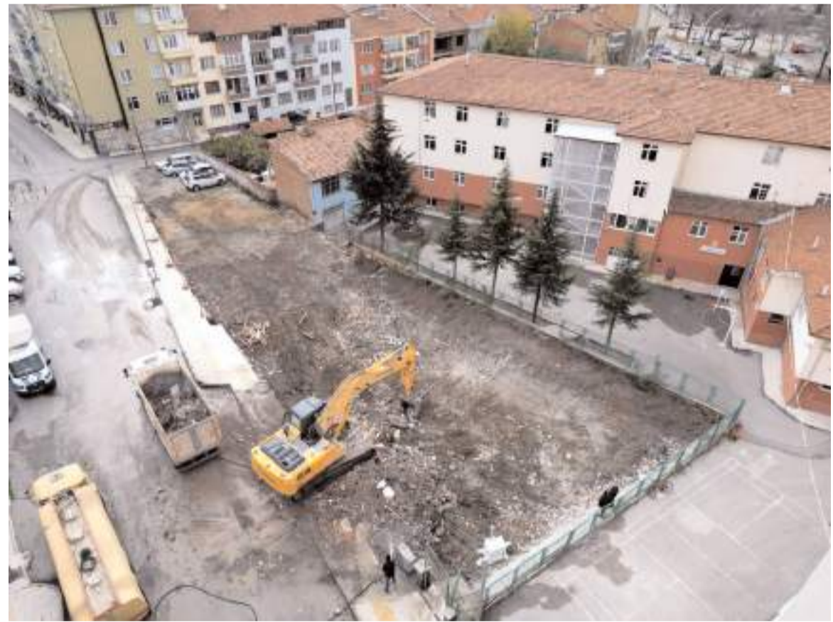
Çorum Belediyesi Erol Olçok İmam Hatip Lisesi bitişiğindeki atıl binayı yıktı.