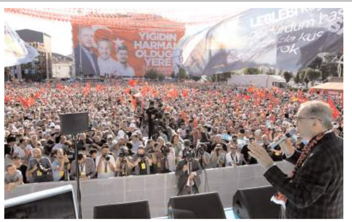
AK Parti, 81 ilde vatandaşları telefonla arayarak, 'Belediye başkanı adayı olarak kimi görmek istiyorsunuz?' diye soracak.

lerinden tarifi almaya hak kazanmak için mücadele eden ikiz kardeşler Sadık ve Özgür'e hayat veriyor.