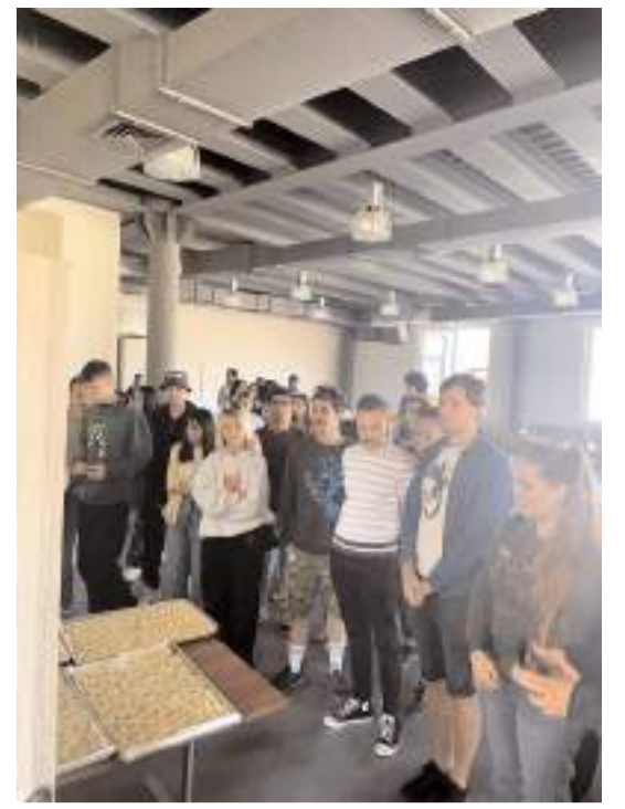
“Kültürler Hattuşa’da Buluşuyor” projesi kapsamında Çorum’a gelen öğrenciler Hingal yaptılar.