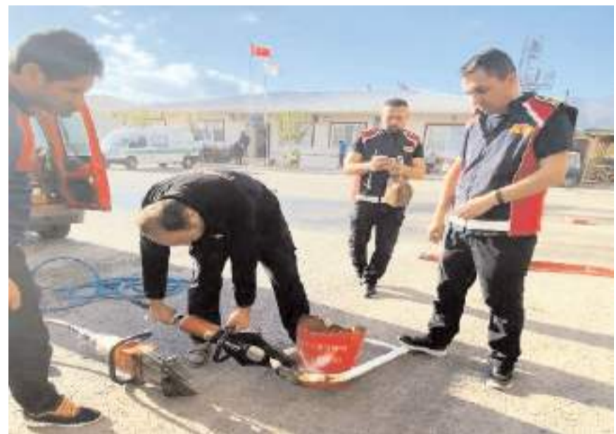
Öğrencilere itfaiyenin kullandığı ekipmanlar uygulamalı olarak gösterildi.