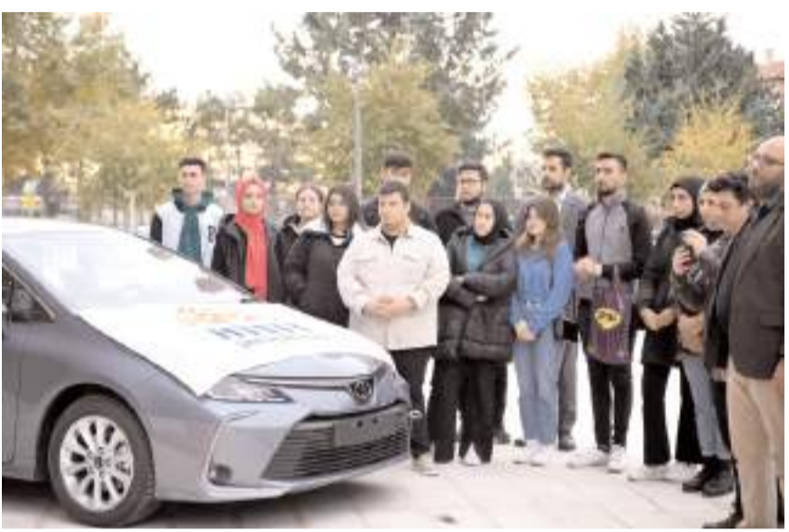
Otomobili, Toyota Lojistik Servisleri Türkiye hediye etti.