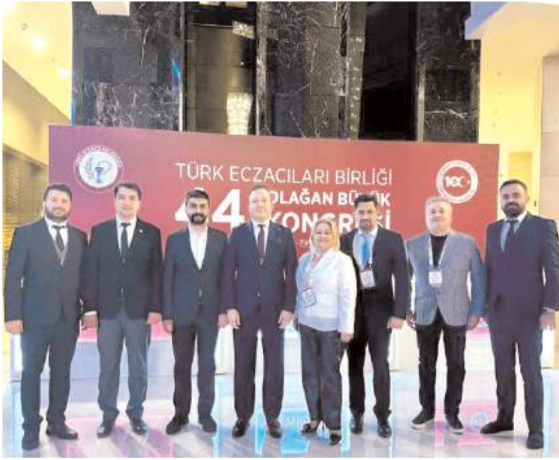
Türk Eczacıları Birliğinin 44.Olağan Büyük Kongresine katılan Çorum Eczacı Odası heyeti...