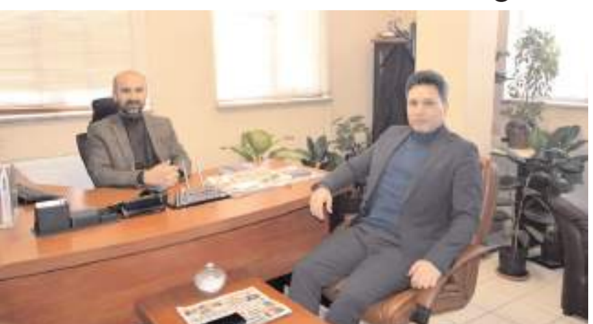
Ziyarette yerel gündem üzerine sohbet edildi.