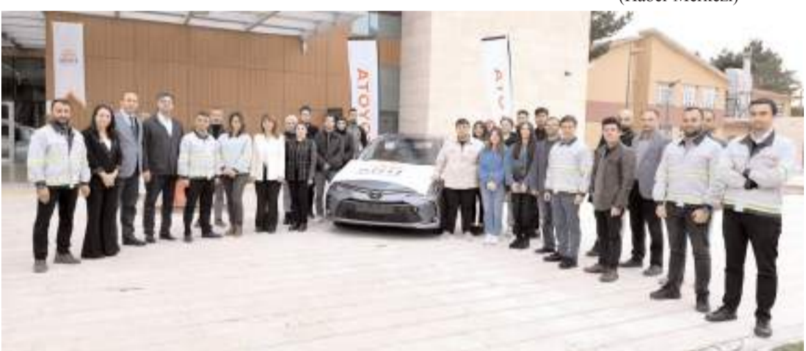
Otomobil MYO bahçesinde yapılan törenle teslim edildi.