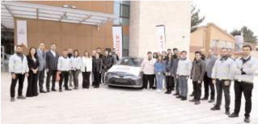
Otomobil MYO bahçesinde yapılan törenle teslim edildi.