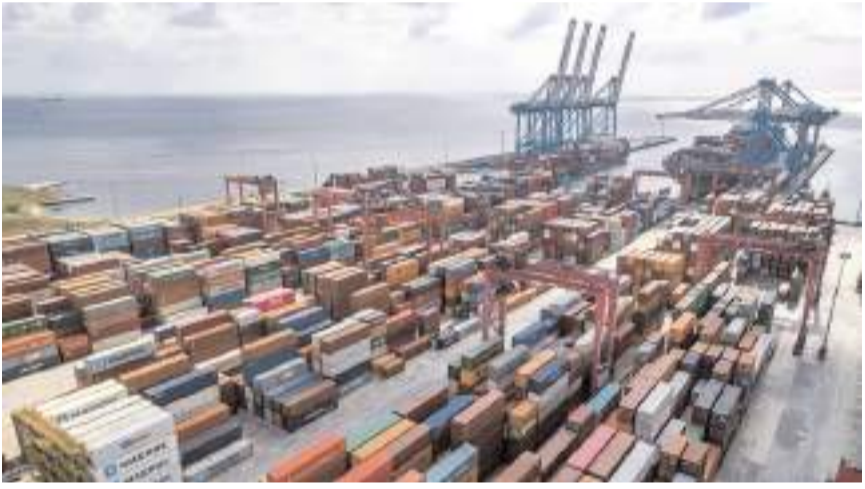
Yeni düzenleme ile illerin ihracat verilerinde ciddi değişiklikler olması bekleniyor.

Üretim yerlerine göre ihracat istatistiklerinde, üretim hacmi yüksek sanayileşmiş illerin ihracatının öne çıktığı gözlemlenmektedir. Bu kapsamda elde edilen istatistikler; il, ürün, ülke vb. alt kırılımlarda detaylı analize imkân vererek, ilere göre ihracatın teknolojik seviyesi gibi önemli göstergeler içermektedir. Böylece, bu çalışmanın il bazlı/bölgesel politikaların veriyeye dayalı olarak belirlenmesine önemli katkılar sağlaması beklenmektedir."