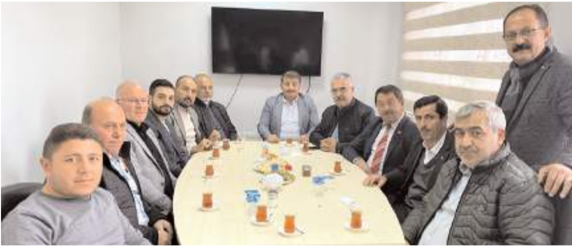
Milletvekili Yusuf Ahlatcı, esnaflarla sohbet etti.

AK Parti Çorum Milletvekili Yusuf Ahlatcı, esnaf turuna devam ediyor.