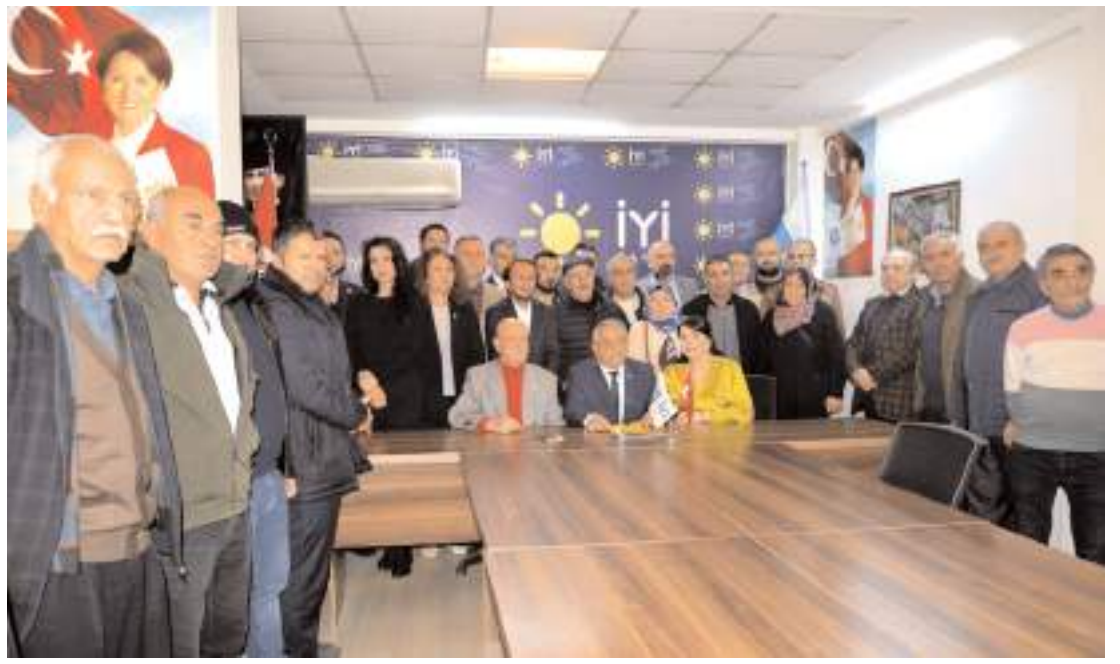
Hüseyin Koca, Çorum Belediye Başkanlığı için aday adaylığını açıkladı.