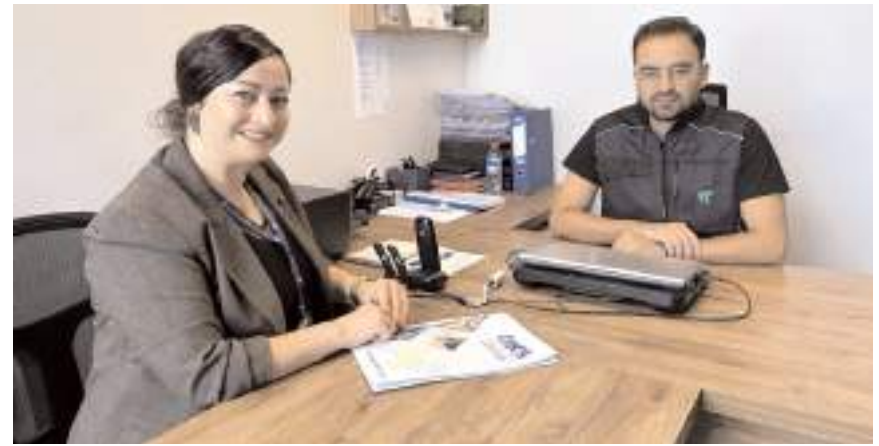
ÇOKİŞ, iş arayanların mesleki niteliklerinin geliştirilmesi ve iş gücü piyasasına kazandırılmasını amaçlıyor.

Ekonomide ve ihracatta Çorum'un Türkiye'nin parlayan yıldızı olduğunu ifade eden Belediye Başkanı Dr. Halil İbrahim Aşgın, "Bizim şehrimiz sanayisi güçlü bir şehir. Bölgede en iyi organize sanayisine sahip ve ihracat rakamları en yüksek olan iliz. Bu açıdan Çorum Belediyesi Kariyer ve İş Merkezi olarak yürüttüğümüz çalışmalar ilimizin ekonomik kalkınması açısından önemsiyoruz" dedi.