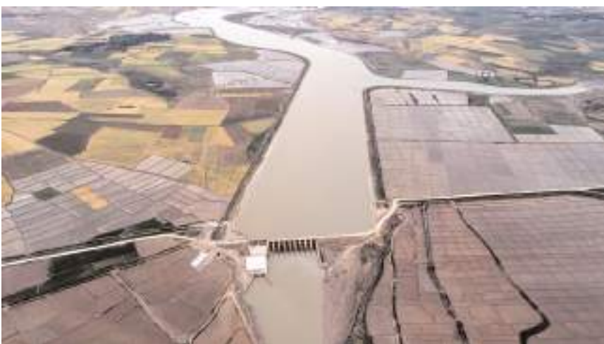
Projenin Çorum bölümünde 63 bin 700 dekar alanda çalışmalar tamamlandı.

Çankırı ve Çorum'a can suyu olacak Timarlı Sulaması 2. Kısım Projesi'nin inşaatının tamamlandığı bildirildi.