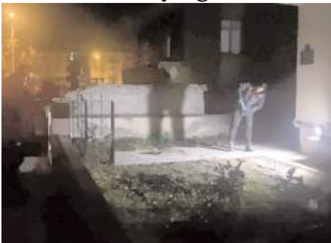
Olay Ulukavak Mahallesi Sakarya 13. Sokak'ta meydana geldi.

Olay Ulukavak Mahallesi Sakarya 13. Sokak'ta meydana geldi. Edinilen bilgiye göre, sokağa gelen kimliği belirsiz 5 kişi, husumetli oldukları C.Ş.'yi bacaklarından bıçakladı. Daha sonra otomobile bindirilen C.Ş. kendisini bıçaklayan şahıslar tarafından Hitit Üniversitesi Erol Olçok Eğitim ve Araştırma Hastanesi'ne götürüldü. İhbar üzerine olay yerine ve Hastane civarına çok sayıda polis ekibi sevk edildi. Yaralı C.Ş. tedavi altına alınırken, bıçaklama olayını gerçekleştiren şahıslar polis ekipleri tarafından hastane önünde yakalanarak gözaltına alındı. Olayla ilgili başlatılan tahkikat sürüyor. (İHA)