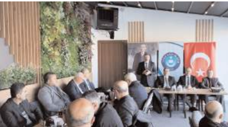
Program İskele Park'ta gerçekleştirildi.