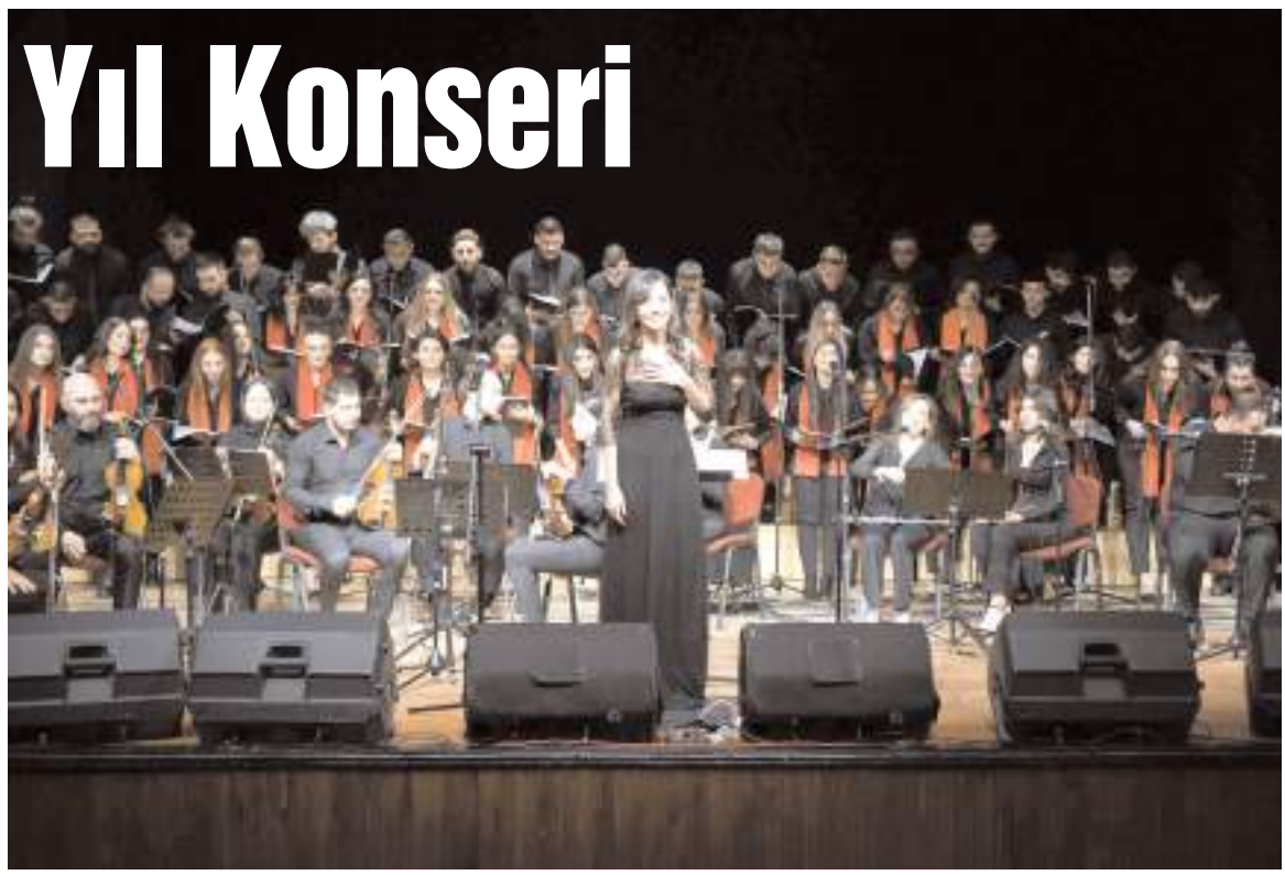
Konsere Güzel Sanatlar, Tasarım ve Mimarlık Fakültesi Müzik Bölümü korusu verdi.