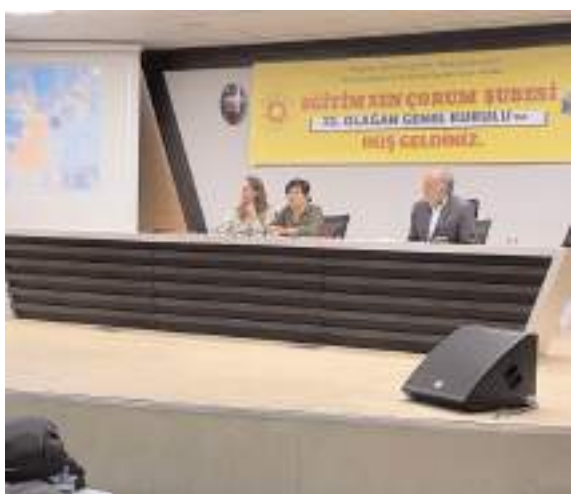
Genel kurulda ilk olarak divan heyeti belirlendi.

de İlçe Seçim Kurulundan mazbatalarını alarak görev dağılımı yapacaklar. (Haber Merkezi)