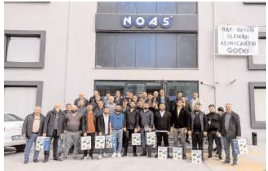
Çorum ekibi Noas Elektrik Fabrikasını gezdi.