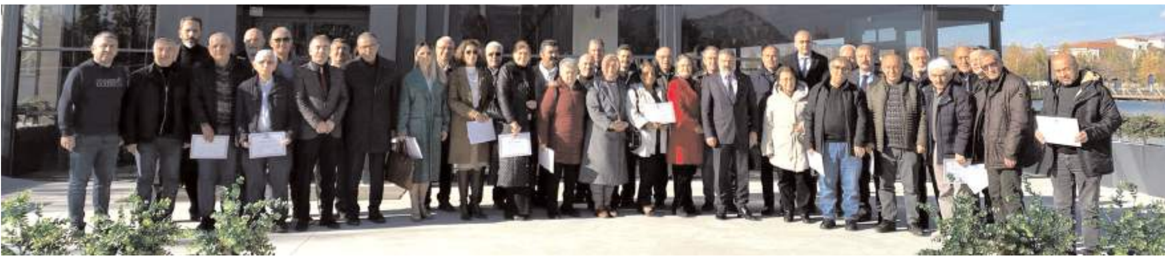
Türk Eğitim-Sen Çorum Şubesi, 24 Kasım Öğretmenler Gününde emekli olan öğretmenleri unutmadı.