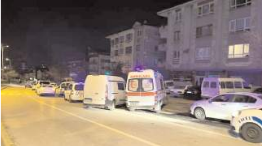
Olay Ankara'da meydana geldi.

Çorumlu bekçi dün ikindi namazına müteakip kılınan cenaze namazının ardından Ankara Ortaköy Mezarlığı'nda toprağa verildi.