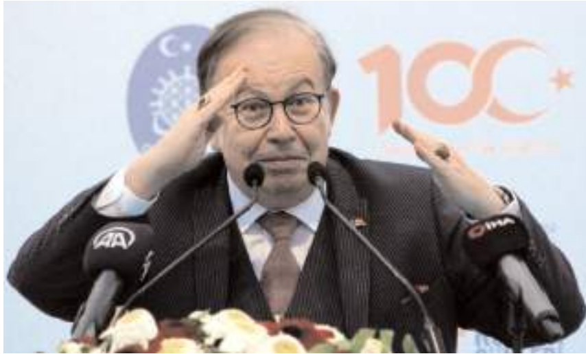
Müstafi Amiral Cihat Yayıcı, Çorum'da söyleşiye katıldı.

Libya ile yapılan anlaşmanın benzerinin Filistin'le de yapılabileceğini vurgulayan Yayıcı, "İkisi de aynı noktadan çıkıyor. Libya ile yaptığımız anlaşmaya Yunanlılar, Avrupalılar, Rumlar 'Türk kalkanı' dediler. Oyunu bozdu. Doğuda oyunu bozacak anlaşma da Filistin'le yapılacak olan anlaşmadır. Bunu yaptığımızda Filistin, kara ülkesinin yaklaşık 10 katı deniz ülkesi kazanacaktır. Elinde hukuki belge olacak 'Burası benimdir' diye. 'Buradaki petrol ve doğalgazı çıkartamazsınız' diyecek. Filistin Türkiye'nin deniz komşusu olacak ve Türkiye'de karadaki komşusuna nasıl duyarsız kalamıyorsa denizdeki komşusuna da duyarsız kalamayacak. Hukuki bir zemin oluşacak. Yunanlıların ve Rumların oyunu doğuda da bozulacak. Bunu zamanında Filistin yönetimine ve Türkiye'deki yetkililere verdim. Onlar da tekrar Filistin yönetimine verdiler. Ama Filistin yönetimi bunu kabul etmedi. Yapılacak şey; tekrar söylemek gerekirse petrol, doğalgaz ambargosunu zorlamak. Ticaret anlaşmalarının asrıyla alınmasını istemek. İthalatı durdurmak, özellikle zengin Arap devletleri. Filistin-Türkiye anlaşmasını yapmak ve aynı zamanda Suriye hava sahasının kapatılmasını istemektir" şeklinde konuştu.