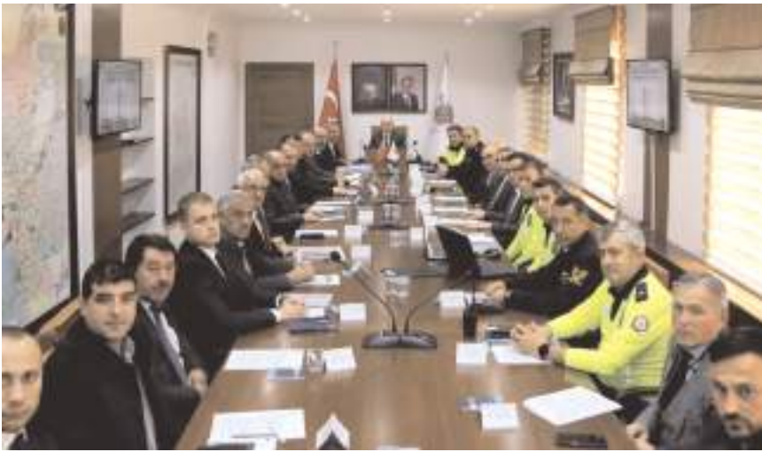
Toplantıda kış mevsiminde alınacak olan trafik tedbirleri değerlendirildi.