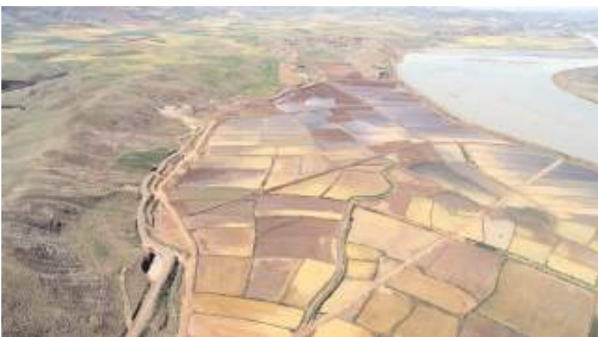
Proje ile Çankırı ve Çorum illerinde toplam 77 bin 50 dekarlık zirai arazi modern sulama sistemine kavuşacak.