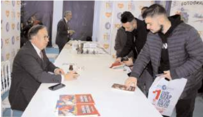
Müstafi Amiral Cihat Yayıcı, fuarda kitaplarını imzaladı.

Filistin'in işgal nedeniyle Gazze ve Batı Şeria'dan oluştuğunu hatırlatan Yayıcı, "Gazze ile Batı Şeria arasında İsrail toprakları var. Bunu haritaya bakmadan yorumlamak ve görüş bildirmek anlamsız olur. Zannediliyor ki Filistin bir bütün ve rahatlıkla seyahat edilebilir, gidilip gelinebilir ama öyle değil. Batı Şeria'daki bir Filistinli, Gazze'deki akrabasını görmek için İsrail topraklarından geçmek zorunda. Buradan geçemez, bu kadar acı bir durum söz konusu. Filistin mekanize tam bir açık hava hapishanesi. Özellikle tam bir açık hava hapishanesi Gazze'dir. Gazze deniz kıyısı olan tek yerdir. Filistin'in deniz kıyısı olan tek yeri burasıdır. Gazze deniz yoluyla dışarıya bağlantısı olan da tek yerdir. Gazze'nin bu kıyı şeridinde sahip olması Filistin bakımından hem stratejik hem ekonomik açıdan çok önemli. Bu kıyı şeridinin hemen önünde çok zengin