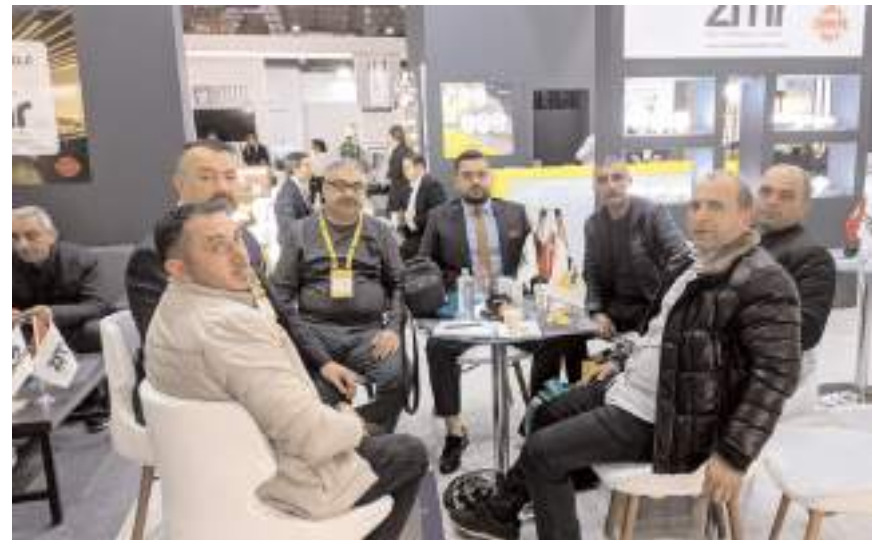
Çorumlu elektrikçi esnafı fuarda piyasaya çıkan yeni ürünleri yakından görme ve tanıma fırsatı buldu.