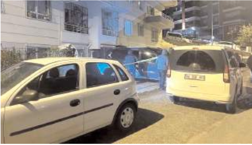
Olay, Ankara'nın Mamak ilçesinde meydana geldi.