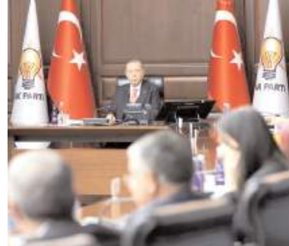
Toplantı AK Parti Genel Başkanı Recep Tayyip Erdoğan'ın başkanlığında yapıldı.

AK Parti MYK, Erdoğan başkanlığında toplandı