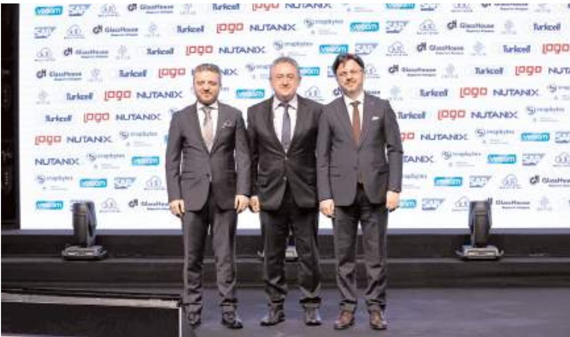
Bilişim Zirvesi’nin 23’üncüsü yapıldı.

yor, büyük veri merkezlerini ülkemize çekmek için çalışmalarımız devam ediyoruz. Yasal düzenlemeleri hızlandırarak sınır ötesi veri paylaşımını teşvik ediyoruz. Bakanlık olarak ve kamu olarak ciddi bir teşvik mekanizması yürütüyoruz. Yapay zeka çalışmalarında ivme kazanmayı hedefliyoruz ve bilişim sektöründeki iş birliklerimizi artırmayı planlıyoruz. Sektör kampüs programı ile üniversite öğrencilerini sektöre hazırlıyoruz. İŞKUR ile iş birliği yaparak bilişim sektörüne hitap edecek bir yapı kuruyoruz. Yapacak çok işimiz var ve bu potansiyeli birlikte iş birliği ile değerlendirebiliriz.” (Haber Merkezi)