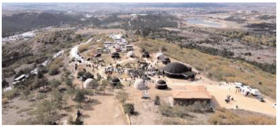
Çorumlu Oba'sı Gençlik Kamp Merkezi, Sıklık bölgesinde bulunuyor.