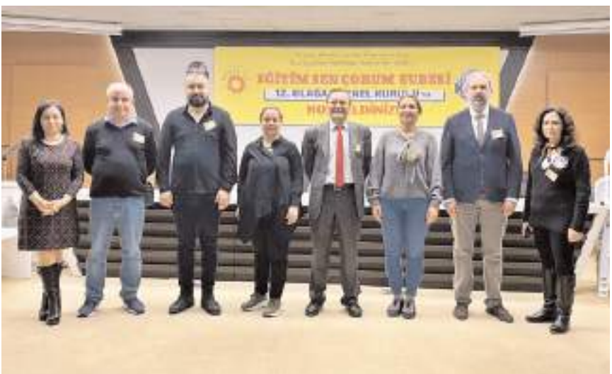
Genel kurulda Eğitim Sen Çorum Şubesi Yürütme Kurulu seçildi.

Yürütme kurulu üyeleri önümüzdeki günler-