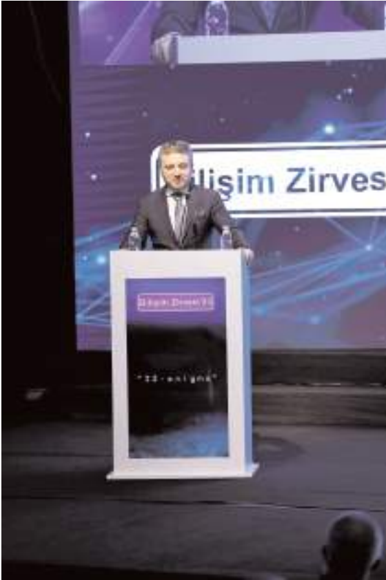
Sanayi ve Teknoloji Bakanlığı Bakan Yardımcısı hemşehrimiz Zekeriya Çoştur

Sanayi ve Teknoloji Bakanlığı Bakan Yardımcısı Zekeriya Çoştur programda, “Yerli Milli Teknoloji- de Önemli Adımlar” başlıklı sunumunu gerçekleştirdi.