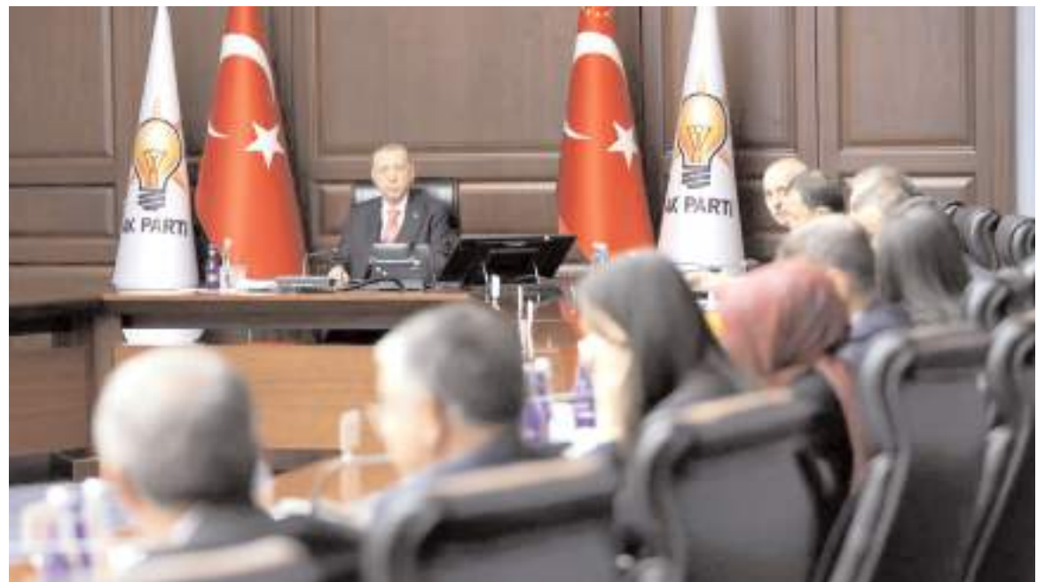
Toplantı AK Parti Genel Başkanı Recep Tayyip Erdoğan’ın başkanlığında yapıldı.