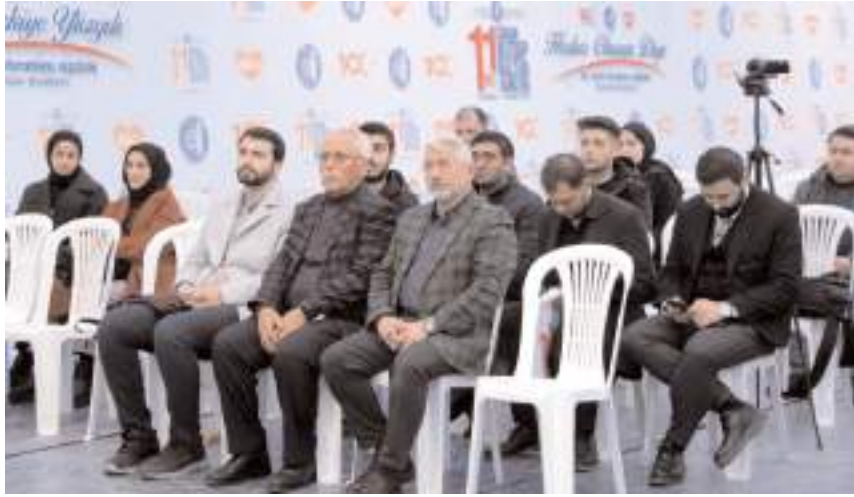
Söyleşi Çorum Belediyesi'nin düzenlediği Kitap Fuarı'nda yapıldı.