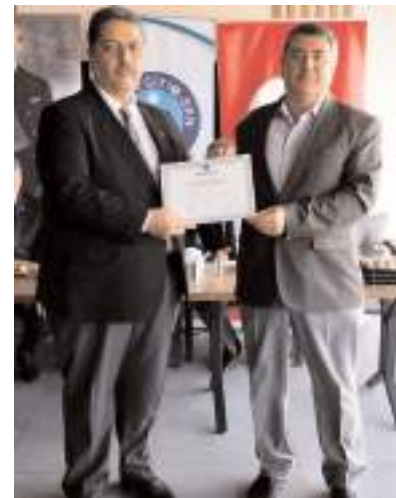
Emekli olan öğretmenlere teşekkür belgesi verildi.