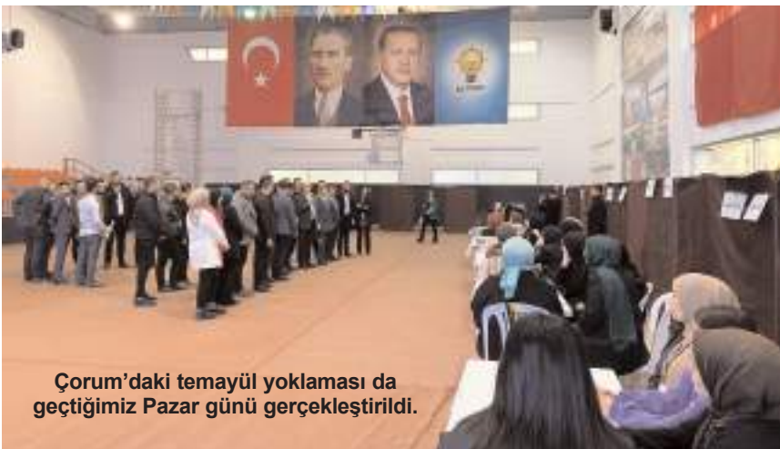
Çorum’daki temayül yoklaması da geçtiğimiz Pazar günü gerçekleştirildi.

cakları ve bu adayların da tercih sıralarının da dikkate alınacağı ifade ediliyor. (Sabah)