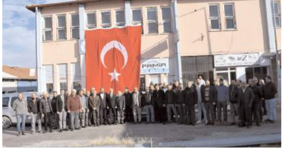
Ziyarete toplu hatıra fotoğrafı çekildi.