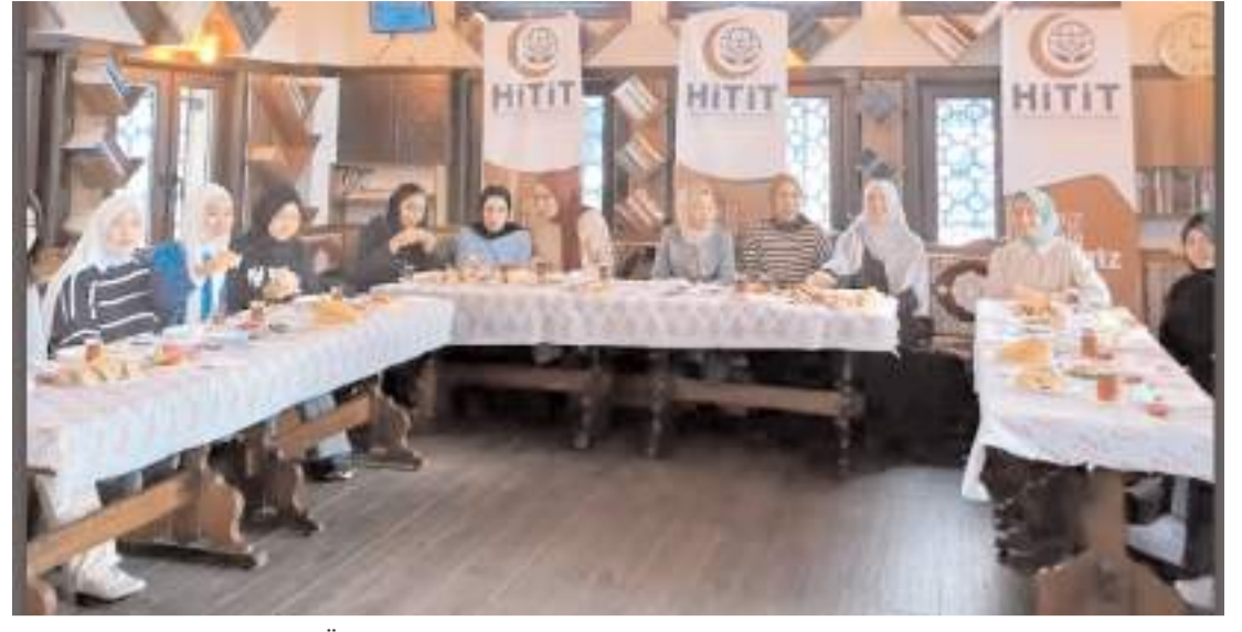
Hitit Uluslararası Öğrenci Derneği Hanımlar Komisyonu kahvaltısı düzenlendi.