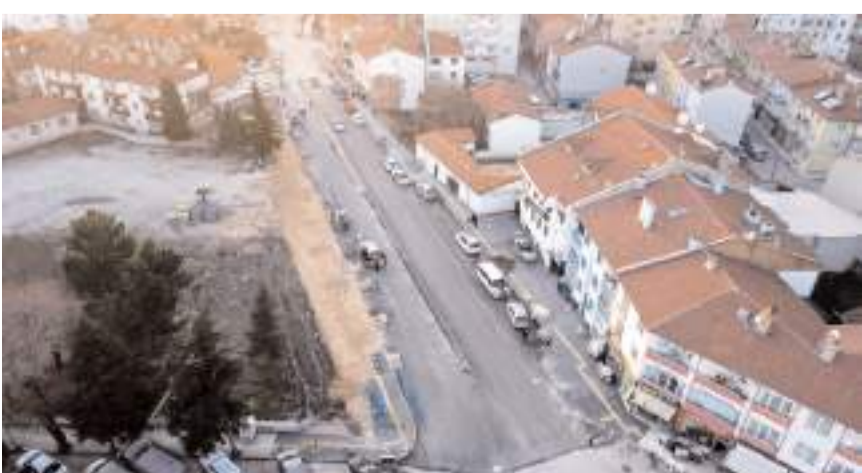
Tanyeri İlkokulu binasının yıkımının ardından yol genişletme çalışmaları başlatıldı.

Yeni açılan yolda Çorum Belediyesi'nin kendi tesislerinde ürettiği parke ve bordür taşlarının kullanıldığını da belirten Başkan Aşgın, "Artık kullandığımız tüm kilit parke taşı ve bordürleri Çorum Belediyesi olarak biz üretiyoruz. Her türlü bordür, kilit taşı ve parke taşı kendi tesisimizde yapabiliyoruz. Çorum Belediyesi olarak 2023 yılında 100 bin m2'nin üzerinde kilit taşı, bordür ve parke taşı döşeyerek rekora imza attık. İnşallah bu çalışmalarımız önümüzdeki yıllarda artarak devam edeceğiz" ifadelerini kullandı. (Haber Merkezi)