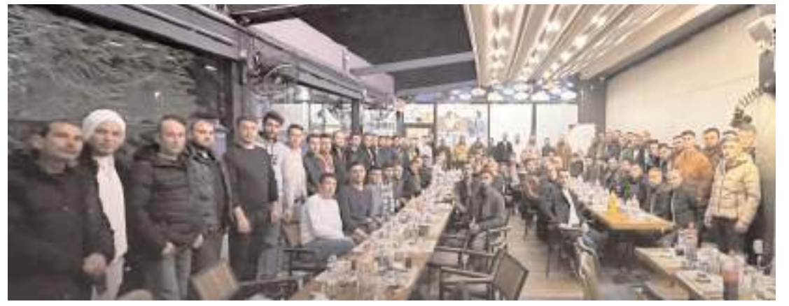
Programda toplu hatıra fotoğrafı çekildi.

Toprak parası adı altında taşıyıcılar kooperatifi para alıyor. Böyle bir hakları da yok. Fabrika zaten çekmekle yükümlü. Boğazkale’den alamadıklarını bizden alıyorlar. Bunu kaldırılmasını talep ediyoruz. Ayrıca cezalarında iptalini istiyoruz.”