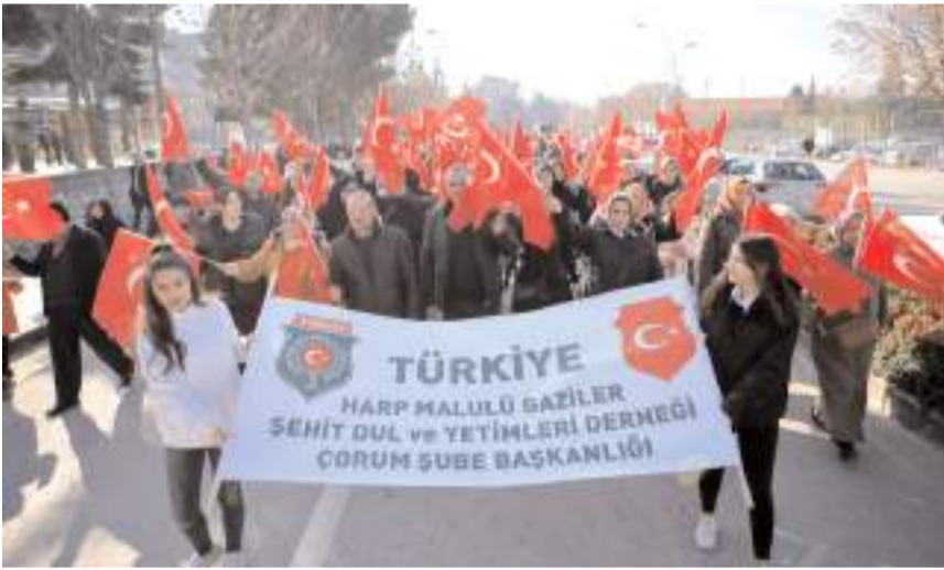
Atatürk Anıtı'nda toplanan vatandaşlar, Gazi Caddesi'nden Şehitlik'e yürüdü.