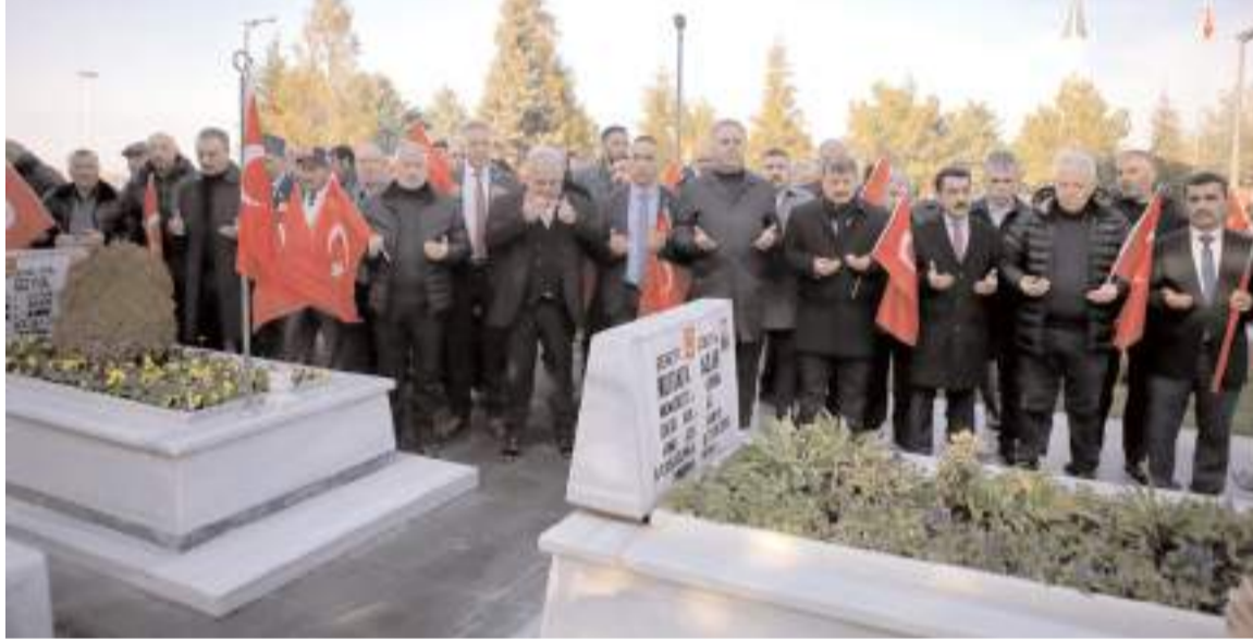
Şehitlikte yapılan programda tüm şehitler için dua edildi.