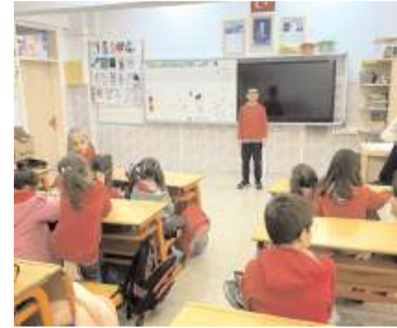
Okulda 'Anahtar Kelimelerle Hikaye Anlatma Yarışması' yapıldı.