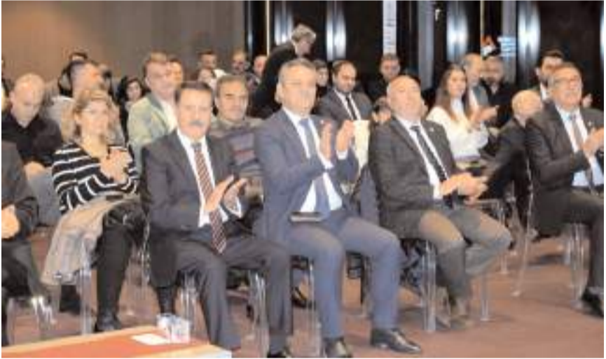
Makina Mühendisleri Odası(MMO) Samsun Şubesi'nin '69. Onur Gecesi' yapıldı.

"Rusya-Ukrayna savaşı ve İsrail'in Gazze'yi işgali sona ermeli" Gürkan, "Devam etmekte olan Rusya Ukrayna Savaşı, İsrail'in