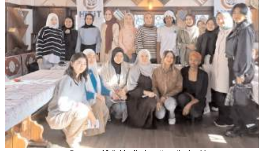
Programa 12 farklı ülkeden öğrenciler katıldı.