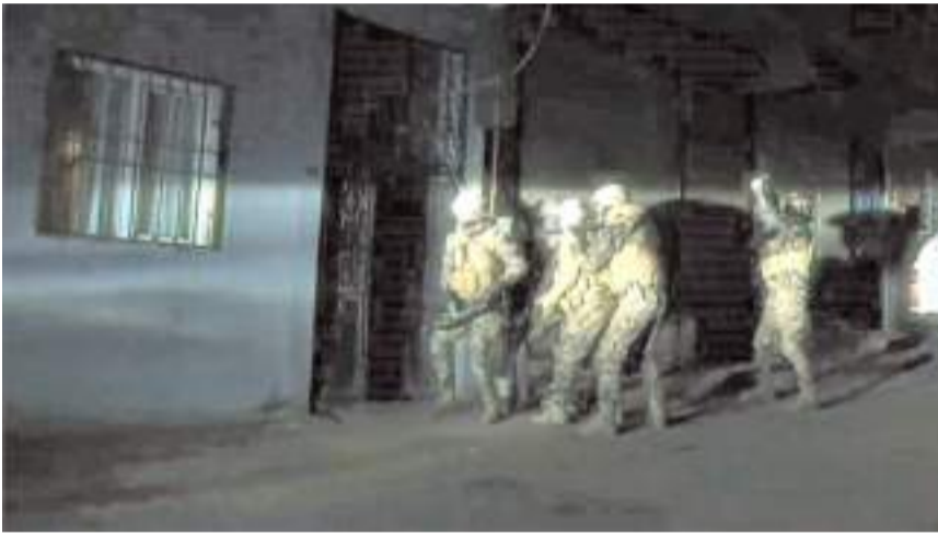
DEAŞ Terör Örgütüne aralarında Çorum'unda olduğu 37 İlde operasyon yapıldı.

Operasyonları gerçekleştiren Kahra- man Polislerimizi teb- rik ediyorum. Allah ayaklarına taş değdir- mesin. Yılın 365 günü, 4 mevsim, 12 ay, gece gündüz demeden ope- rasyonlar düzenliyo- ruz. Terörle mücade- lemiz son terörist etkisiz hale getirilince kadar kararlılıkla devam e- decek." (İHA)