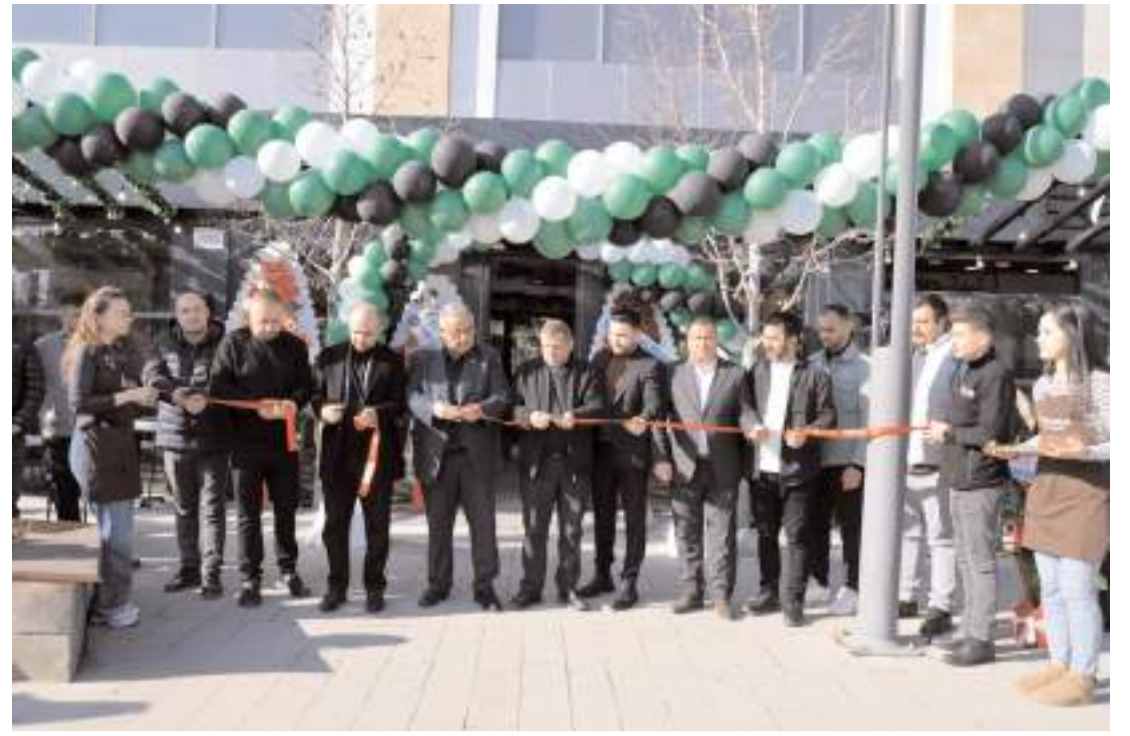
Lavinia Waffle'in açılış kurdelesini protokol üyeleri kesti.

Mesajın devamında ise "Ve o gün gelecek ki örgütlenmiş işçi sınıfı ve emekçiler, bu bozuk düzenin köhnemiş çarkını kırmayı başaracak; savaşı, sömürsüz, sınıfsız gerçek eşitliğin, dayanışmanın olduğu insanlık dünyasını kuracaktır. Partimiz, sömürsüz bir dünya için 2024'ü birlik, mücadele ve dayanışma ruhuyla karşılamaktadır." (Haber Merkezi)