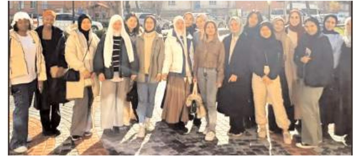
Programın sonunda hatıra fotoğrafı çekildi.