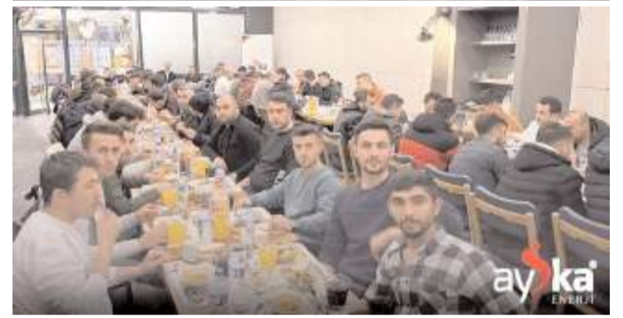
Yemeğe Ay-Ka Enerji saha personeli katıldı.