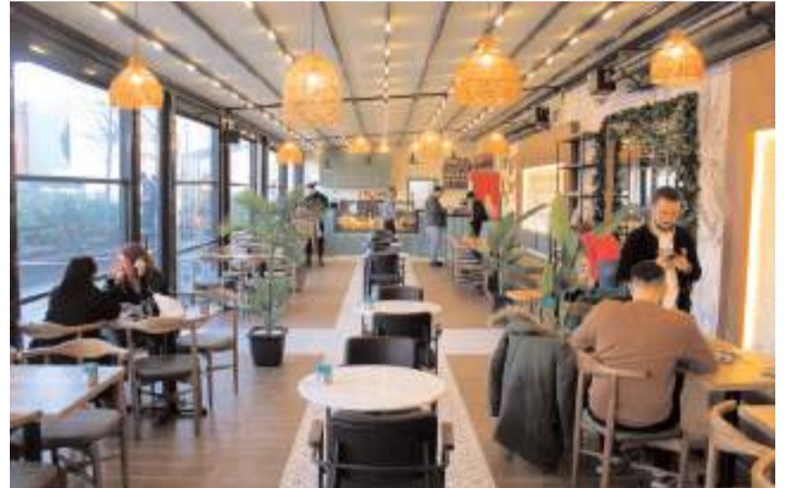
Şiir, kahve ve çikolatanın buluştuğu Lavinia Kafe, kahve ve çikolata severlerin yeni lezzet durağı.