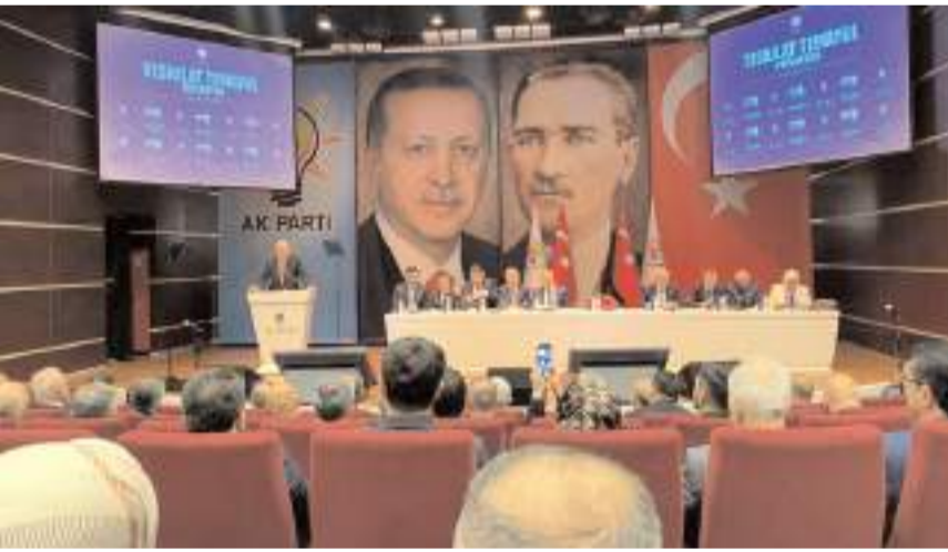
Toplantı AK Parti Genel Merkezi'nde Cumhurbaşkanı Recep Tayyip Erdoğan'ın başkanlığında yapıldı.