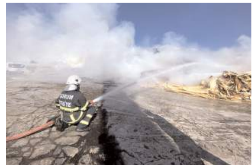
Ekipler 82 personel ve 16 itfaiye aracı ile 886 yangına müdahale etti.

Vatandaşın can ve mal güvenliğini korumak için mesai saati gözetmeksizin görev yapan Çorum Belediyesi İtfaiye Müdürlüğü yoğun bir yıl daha geride bıraktı. Ekipler, 2023 yılında 2943 olaya anında müdahale ederek, büyük bir başarıya imza attı. 7 gün 24 saat esasına göre görev yapan itfaiye ekipleri, yıl içerisinde 82 personele ve 16 itfaiye aracı ile 886 yangın, 118 trafik kazası, 35 intihar girişimine müdahale, 327 hayvan kurtarma, 35 asansörde kalma olayına müdahale olmak üzere toplamda 2943 olaya müdahale etti. Öte yandan hizmet içi eğitimler kapsamında 3384 kamu personeli ve vatandaşın yanından 6 Şubat 2023 tarihinde meydana gelen ve 11 ilde büyük yıkıma neden olan deprem afetinin ardından Kahramanmaraş Afşin