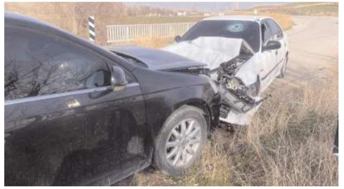
Kazalarda araçlarda maddi hasar meydana geldi.

tamonu'da DEAŞ terör örgütü içerisinde faali- yet yürüten 2 şahıs ya- kalandı. Kayseri'de DEAŞ terör örgütü içeri- sinde faaliyet yürüten 4 şahıs yakalandı. Kı- rıkkale'de DEAŞ terör örgütü içerisinde faali- yet yürüten 1 şahıs ya- kalandı. Kırşehir'de DEAŞ terör örgütü içeri- sinde faaliyet yürüten 2 şahıs yakalandı. Ko- caeli'de DEAŞ terör örgütü içerisinde faali- yet yürüten 10 şahıs yakalandı. Konya'da