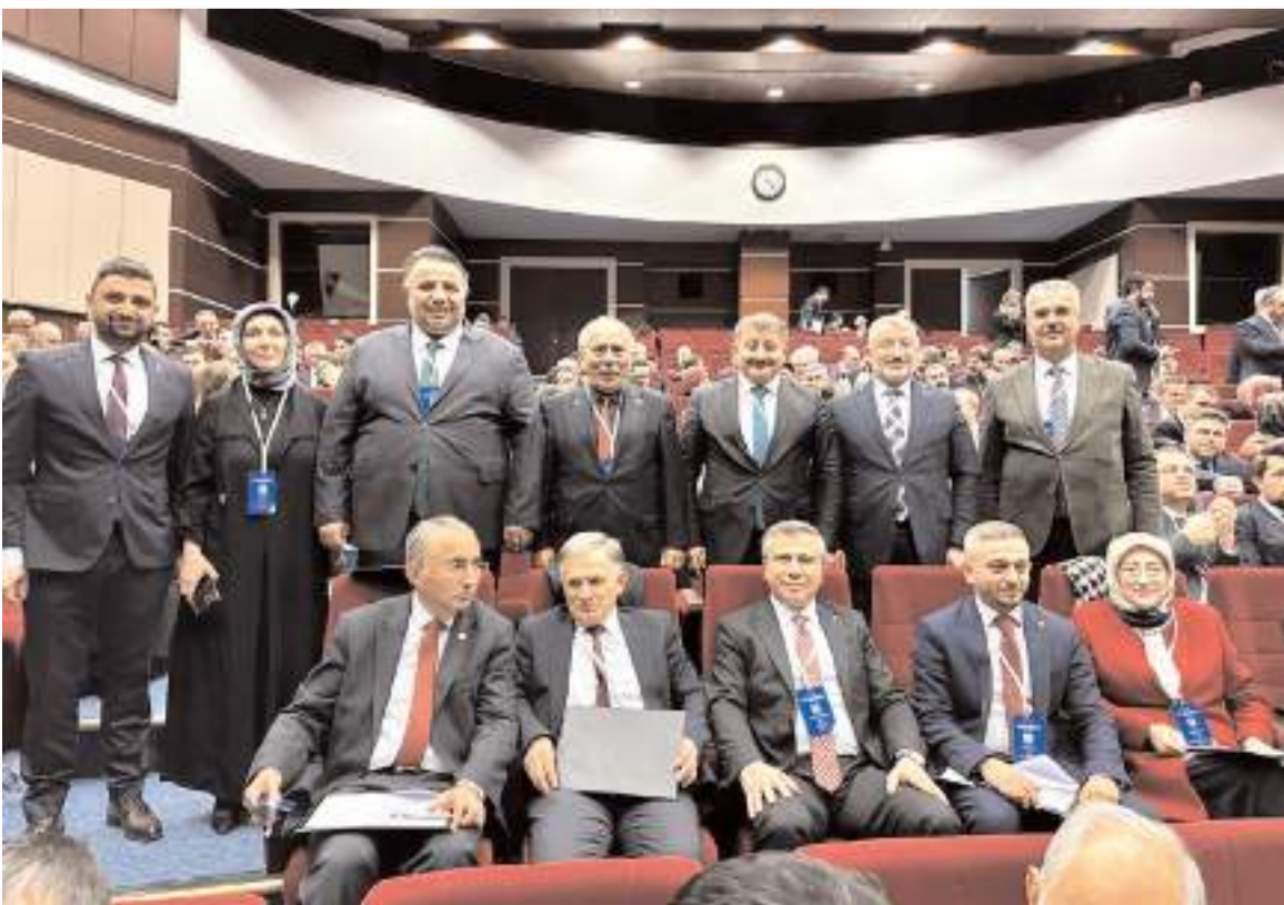
Toplantıya katılanlara çeşitli sorular soruldu.