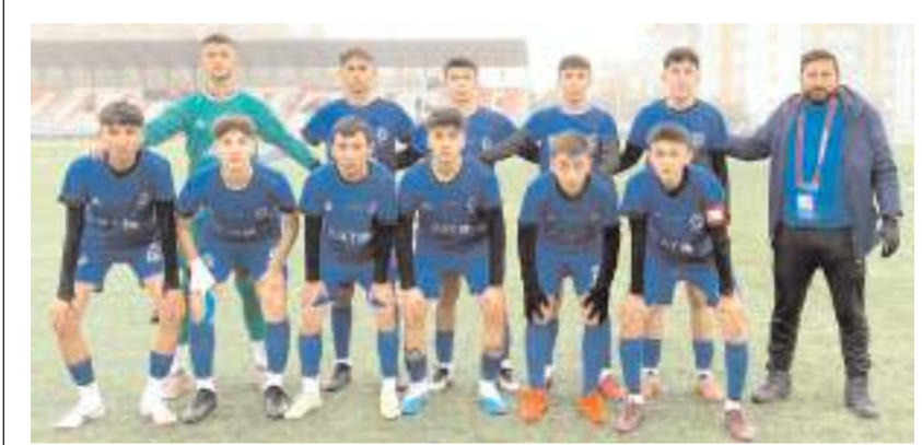
HE Kültürspor Sungurlu deplasmanında farklı kazanarak üç puanın sahibi oldu

Geçtiğimiz yıl Spor Lisesi erkek takımı Türkiye ikincisi olarak kazandığı başarının ardından ilimizden iki takımın birden Türkiye finallerinde mücadele etme hakkı kazanması bu branşta Çorum adına son derece umut verici.