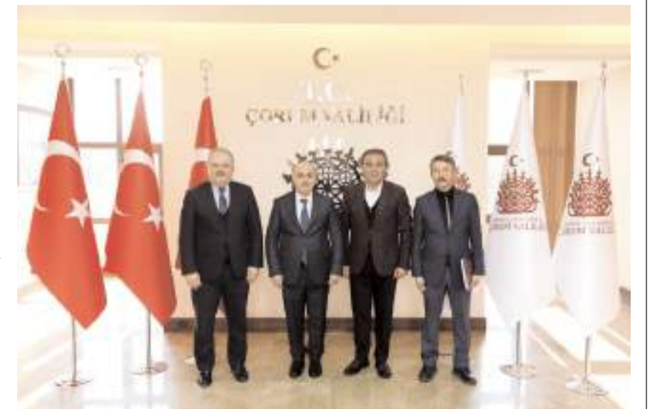
İmzaların atılmasının ardından hatıra fotoğrafı çekildi.