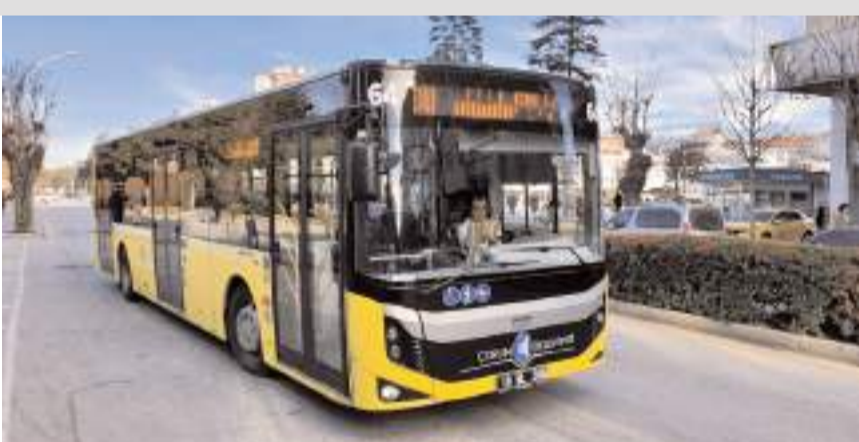
Akkent Mahallesi'nde yeni yapılan TOKİ konutları bölgesine günlük 3 olan sefer sayısı 6'ya çıkarıldı.

Ulaşım Hizmetleri Müdürlüğü'nden yapılan açıklamada, "Akkent Mahallesi'nde yeni yapılar hak sahiplerine teslim edilemeye başlanan TOKİ konutlarına taşınma işlemleri devam etmektedir. Bölgedeki ihtiyaç ve talep üzerine günlük 3 olan sefer sayısını 6'ya çıkartılmıştır. Yeni TOKİ bölgesi için sefer saatlerimiz; 08.00, 10.00,