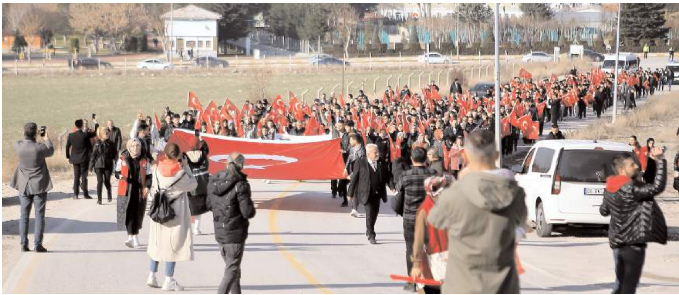
Irak'ın kuzeyindeki Pençe-Kilit Harekati bölgesinde çıkan çatışmada şehit olan askerler için "Şehitlerimize Saygı Yürüyüşü" gerçekleştirildi.