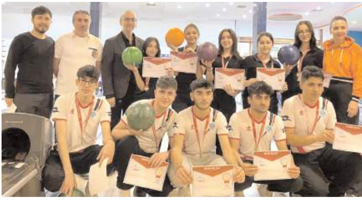
Kocaelinde ikinci olan Spor Lisesi ve üçüncü olan Şehit Erol Olçok Anadolu İmam Hatip Lisesi takımları toplu halde