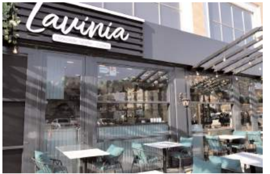
Lavinia Waffle AHL Park AVM'de faaliyete başladı.

ölümsüzleştirebilirsiniz. Değişmeyen lezzetimiz, müşterilerimizin vazgeçilmezi olmuştur. Tüm ürünlerimiz, özenle seçilmiş malzemelerle hazırlanır ve hijyen koşullarına uygun bir şekilde servis edilir. Taze ve lezzetli ürünlerimiz, sizlere eşsiz bir tatlı deneyimi yaşatır. Başarılarımızın sırrı, müşteri memnuniyeti ve değişmeyen lezzetimizdir. Bu başarıyı diğer şehirlere bayilikler vererek taçlandırdık. Bayiliklerimiz de aynı kalite ve lezzet anlayışımızla hizmet vermektedir. Birbirinden lezzetli ve kaliteli ürünlerimizi tatmak isteyen herkesi AHL Park AVM'deki kafemize bekliyoruz." dedi.