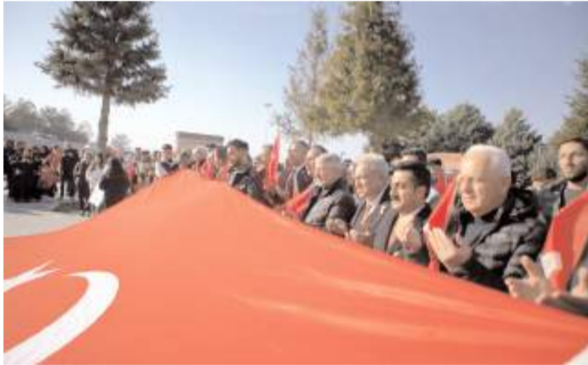
Yürüyüşe protokol üyeleri ile çok sayıda vatandaş katıldı.