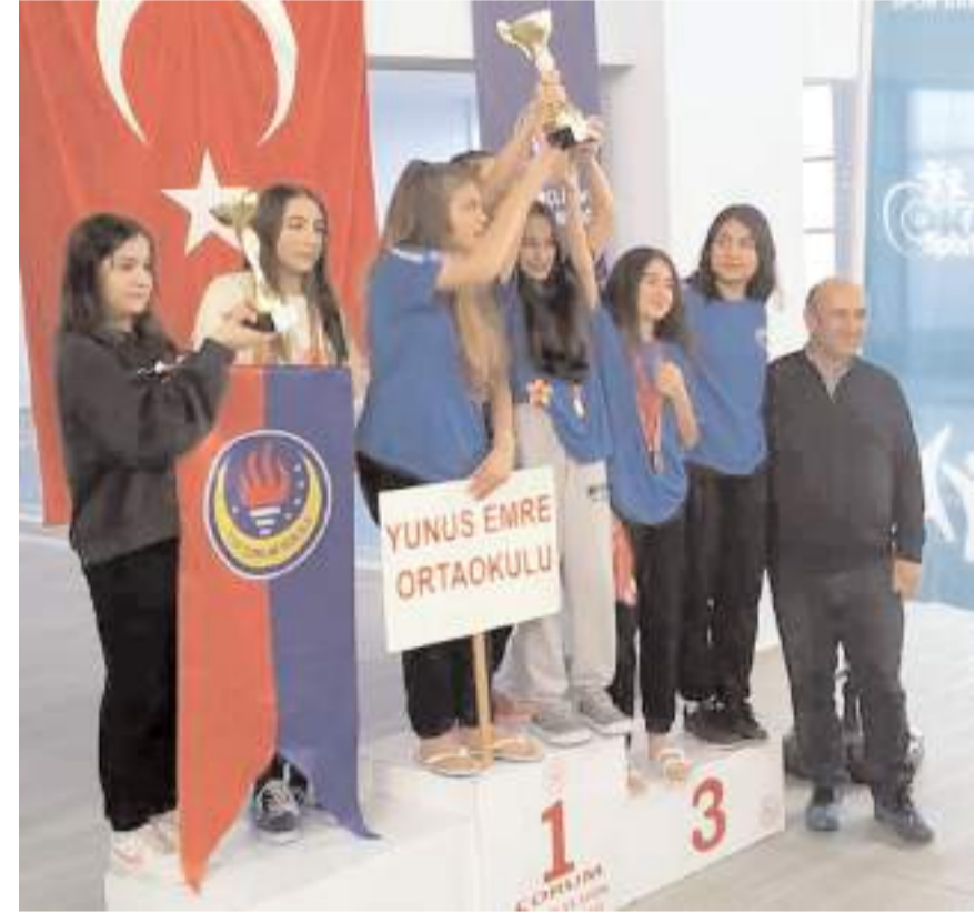
Kızlarda takım sıralamasında ilk iki sırayı alan kulüpler ödül töreninde kürsüde

Yarışlar sonunda düzenlenen törenle dereceye giren okullara kupa, sporculara ise madalyaları verildi.