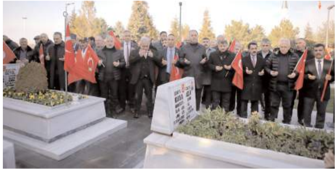
Şehitlikte yapılan programda tüm şehitler için dua edildi.