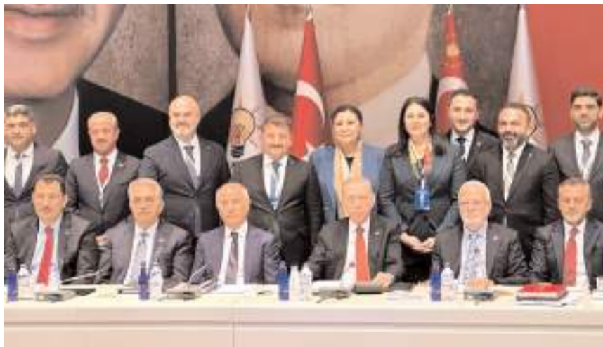
Toplantı AK Parti Genel Merkezi'nde Cumhurbaşkanı Recep Tayyip Erdoğan'ın başkanlığında yapıldı.