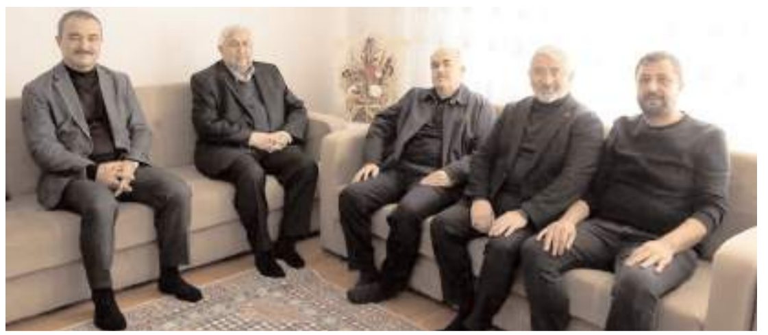
Ziyarette eğitimin sorunları üzerine sohbet edildi.

Hakimiyet, merhumeye Allah'tan rahmet, ailesine ve yakınlarına başsağlığı diler.