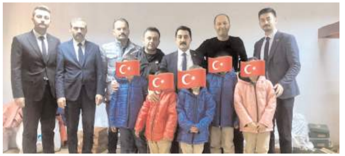
Çorum Ülkü Ocağı, geleneksel 'Bir Bot-Bir Mont' kampanyasını düzenledi.

na olanak tanımıştır. Bugün, Dünya Kadın Hakları Günü, sadece Türkiye'de değil, tüm dünyada kadın haklarına duyulan saygının ve eşitlik mücadelesinin bir ifadesidir. Kadınların güçlenmesi, sadece onların bireysel haklarına değil, toplumun genel refahına da olumlu katkılarda bulunmaktadır. Bu anlamlı gün vesilesiyle, tüm kadınların eşitlik, adalet ve özgürlük mücadelesine katkı sağlamak için bir araya gelmeye devam etmeliyiz. Kadın hakları, insan haklarının ayrılmaz bir parçasıdır ve bu hakların korunması ve güçlendirilmesi, toplumlarımızın daha adil ve sürdürülebilir olmasına katkı sağlayacaktır. Bu duygu ve düşüncelerle, Dünya Kadın Hakları Günü'nü kutluyor, kadınlarmıza daha aydınlık, eşit ve özgür bir gelecek diliyorum" ifadelerini kullandı. (Haber Merkezi)