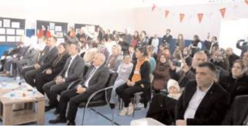
Programı Özel Eğitim Uygulama Okulu ve İş Eğitim Merkezi düzenledi.