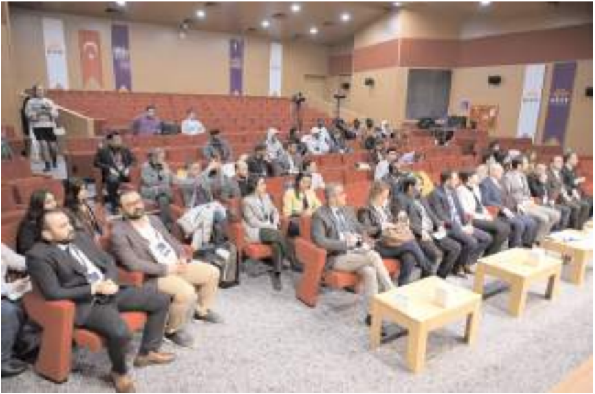
Kongrede 30 oturum yapıldı.