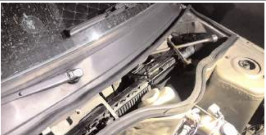
3 şüphelinin bulunduğu aracın motor bölümüne saklanmış uzun namlulu silah ele geçirildi.

Yakalanan şüphelilerin aracında silah ve uyuşturucu ele geçirildi