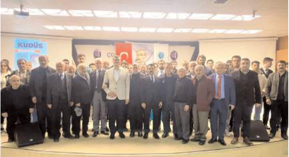
Konferansın sonunda toplu hatıra fotoğrafı çekildi.