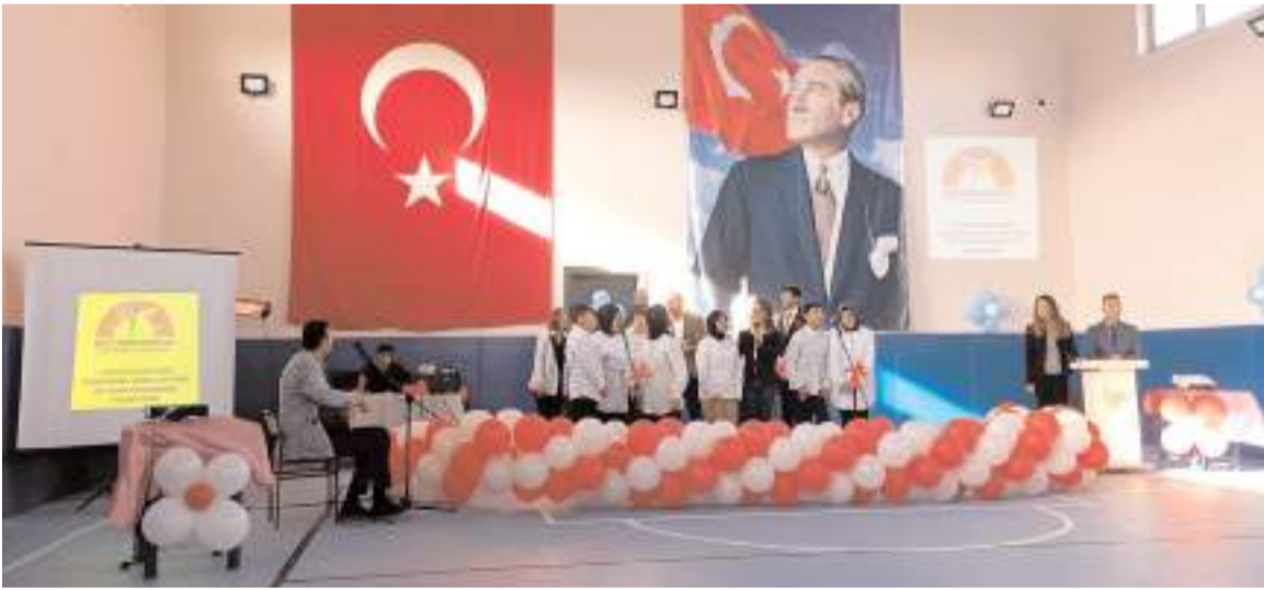
Programda öğrenciler birbirinden güzel gösteriler yaptılar.