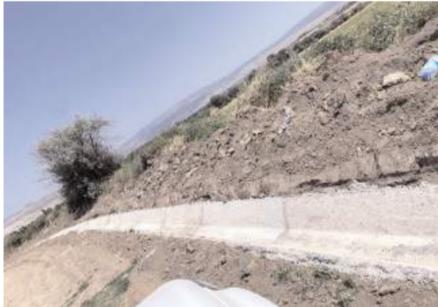
Proje kapsamında toplam 2307 beton kanal yapıldı.

Çorum İl Özel İdaresi 2023 yılı programında bulunan Merkez bağlı Dereköy Köyü ve Bayat'ın Tahtalı Mevkii'nin yerüstü sulama tesisi projesini tamamladı.