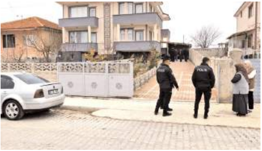
Olay Özhan Mahallesi Tuğcu Sokak'taki bir evde meydana geldi.

Polis olayla ilgili soruşturmasını sürdürüyor.