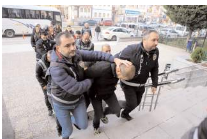
9 hırsızlık zanlısından 5'i tutuklandı, 3'ü adli kontrol şartıyla, 1'i de savcılığa serbest bırakıldı.

Öte yandan polis ekiplerinin zanlılara ait adreslere düzenlediği operasyon polis kamerasınca kaydedildi.