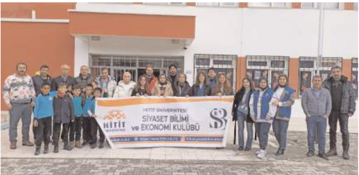
Proje Hitit Üniversitesi Siyaset Bilimi ve Ekonomi Kulübü öğrencileri gerçekleştirdi.