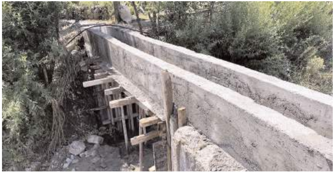
Sulama projeleri Dereköy Köyü ve Bayat'ın Tahtalı Mevkii'nde hayata geçirildi.