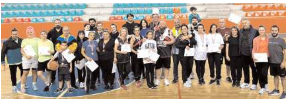
Veteranlar 3x3 Basketbol Turnuvasında dereceye giren sporcular ödül töreni sonrasında toplu halde