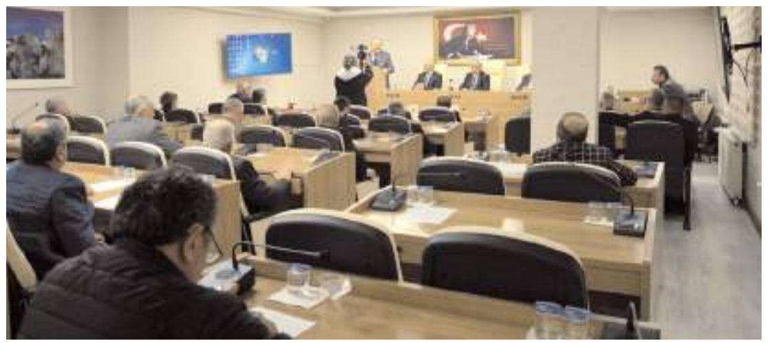
Gündem maddelerinin görüşülmesinin ardından toplantı sona erdi.

nı ifade ederek, "Caddemizin aydınlatma lambaları 20 gündür fazla bir süredir yanmıyor. İlgili şirketin telefonunu her akşam arayıp arıza kaydı bırakmamıza rağmen hala tamir edilmedi. Yetkililerden sorunu çözmelerini talep ediyoruz" diyerek sorunlarını dile getirdiler.