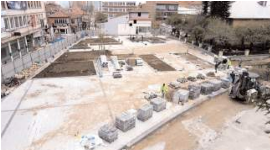
Meydan projesinin 6,5 dönümünü kapsayan bölümde çalışmalar tamamlanmak üzere.

Çorum'u daha güzel ve daha yaşanabilir bir kent haline getirmek için önemli çalışmalar yap-