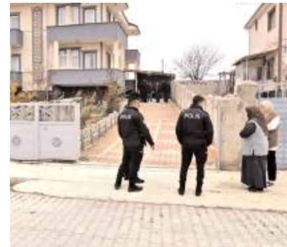
Olay Özhan Mahallesi Tuğcu Sokak'taki bir evde meydana geldi.