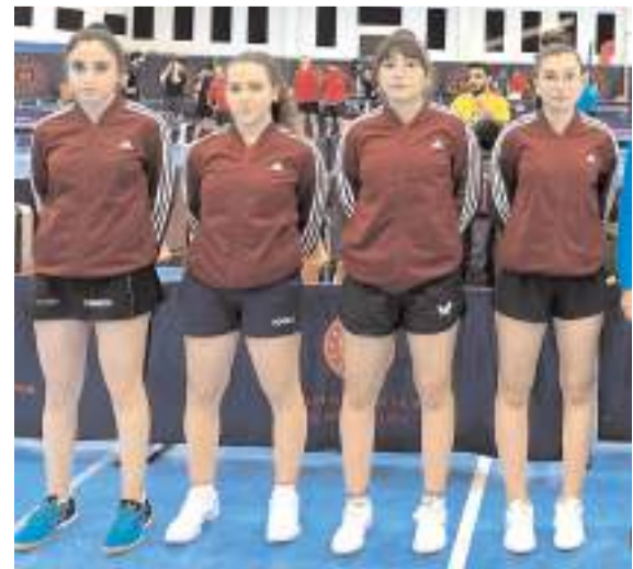
Spor İhtisas kadın masa tenisi takımı Süper Lig'de play-off mücadelesini sürdürüyor