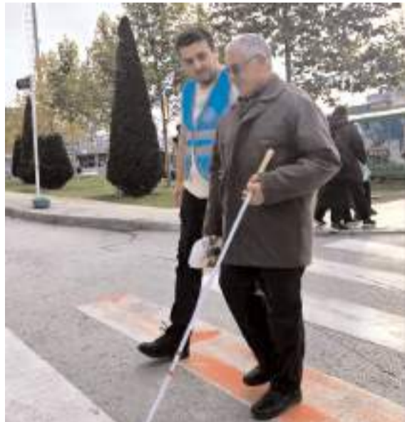
Kadeş Meydanı'nda yapılan etkinlikte engellilerin yaşamlarının zorlukları anlatılmaya çalışıldı.

Her sağlıklı bireyin bir engelli adayı olduğunun vurgulandığı etkinlikte engellilere karşı duyarlılığın artması temennisinde de bulunuldu. (Haber Merkezi)