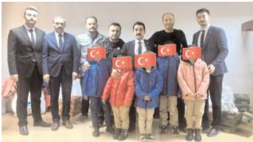
Çorum Ülkü Ocağı, geleneksel 'Bir Bot-Bir Mont' kampanyasını düzenledi.

■ Çorum Ülkü Ocağı, çocuklar üşümesin diye her yıl geleneksel hale getirdiği 'Bir Bot-Bir Mont' kampanyasıyla yine gönüllere dokundu ve minik yürekleri ısıttı. * HABERİ'4'DE