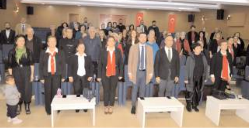
Program Turgut Özal Konferans Salonunda yapıldı.