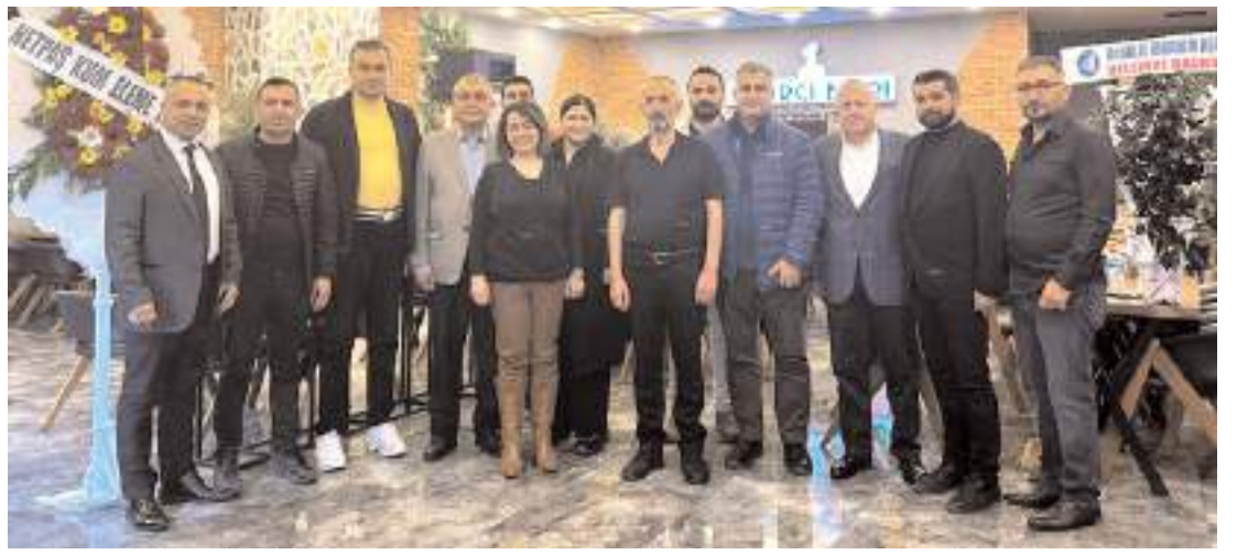
Programda günün anısına hatıra fotoğrafı çekildi.