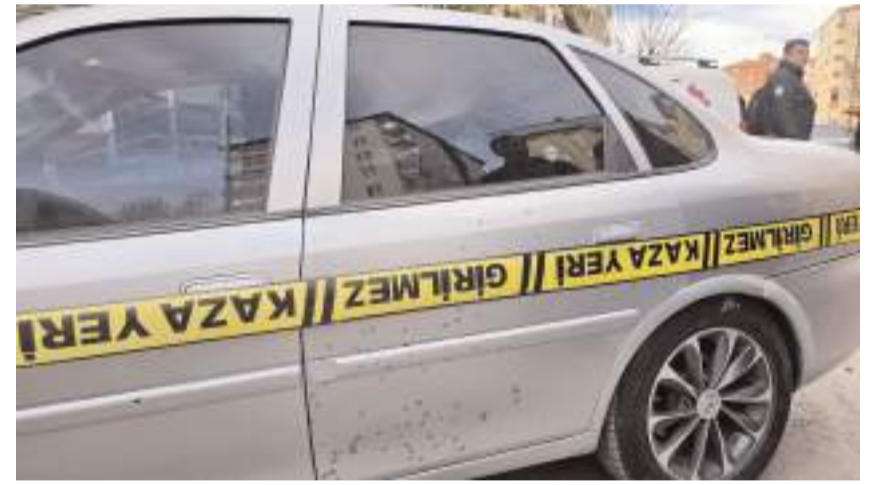
Saldırıda yol kenarında park halindeki bir otomobil de zarar gördü.

Saldırının ardından otomobille olay yerinden uzaklaşan zanlının yakalanması için çalışma başlatıldı.(AA)