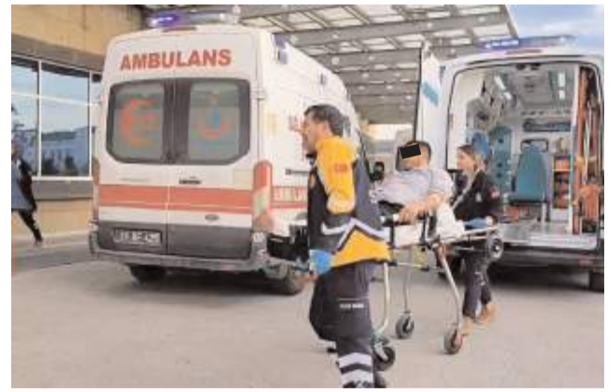
Yaralı O.D hastanede tedavi altına alındı.