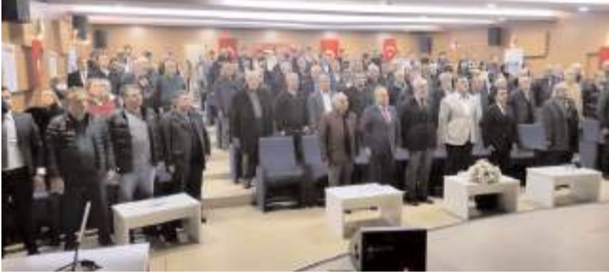
Konferansa katılım yüksek oldu.