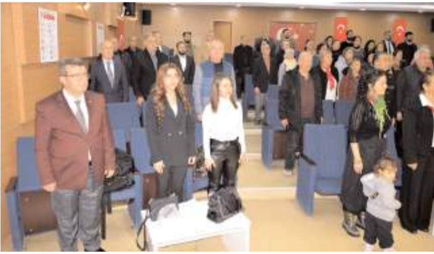
Etkinliğe çok sayıda davetli katıldı.