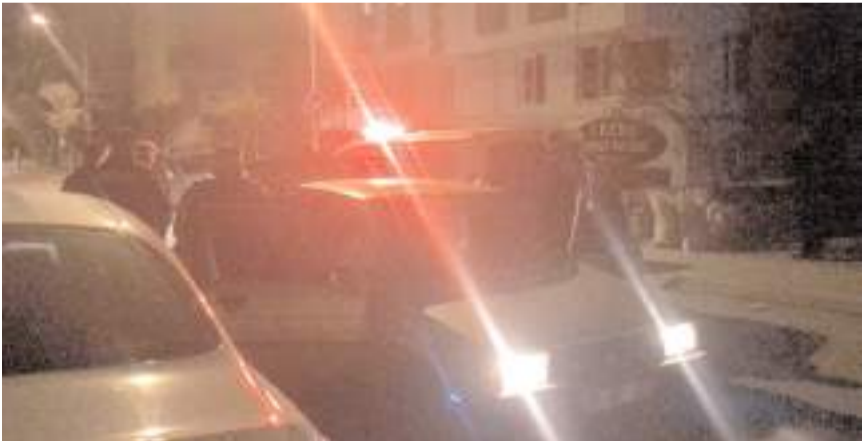
Kaçan araç Bahçelievler Mahallesi Bahçelievler 1. Caddede durduruldu.

Çorum'da polis ekiplerinin "dur" ihtarına uymayarak kaçarken yakalanan 3 şüphelinin bulunduğu araçta uyuşturucu ve uzun namlulu silah ele geçirildi.