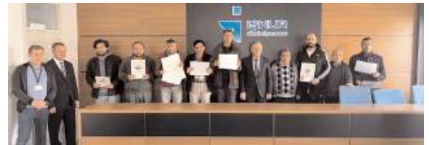
İş Kulübü projesi kapsamında İŞKUR'da eğitim yapıldı.