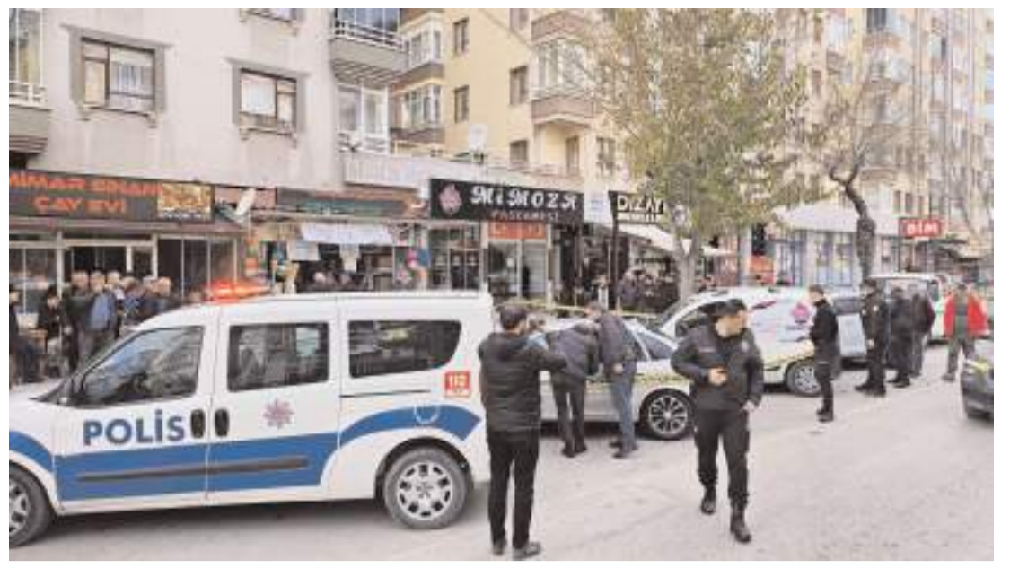
Olay Cemilbey Caddesi'nde meydana geldi.