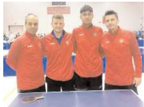
Çorum Belediyespor erkek takımı Süper Ligde play-off da mücadele etmek istiyor