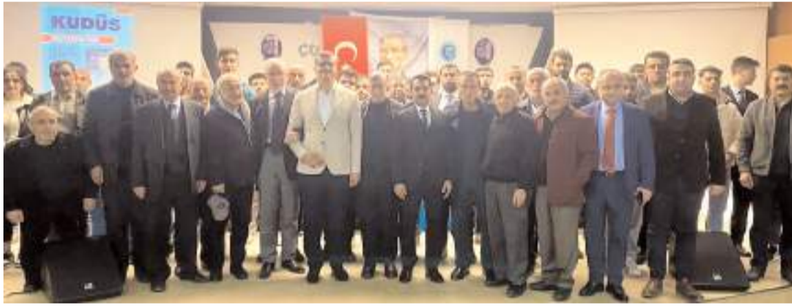
Konferansın sonunda toplu hatıra fotoğrafı çekildi.