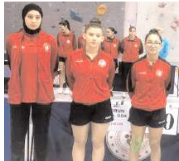
Çorum Belediyespor kadın masa tenisi takımı Süper Lig'de üst sıralarda yer bulma çabasında

Süper Ligde dördüncü etap maçları yeri ve tarihi önümüzdeki günlerde açıklanacak ilde yapılacak. Bu etap sonunda ilk dokuz sırada yer alanlar play-off mücadelesi verecek son dokuz sırada yer alanlar ise play-out oynayacak ve son altı sırada yer alan takımlar 1. lige düşecek.