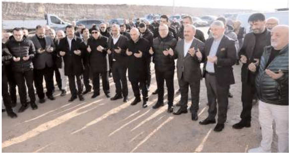
Yapılan duanın ardından dükkanların anahtarları teslim edildi.

Zanaatkarlar Küçük Sanayi Sitesi Yapı Kooperatifi'nin bugün inşaat seviyesinin yüzde 50'in üzerinde olduğuna