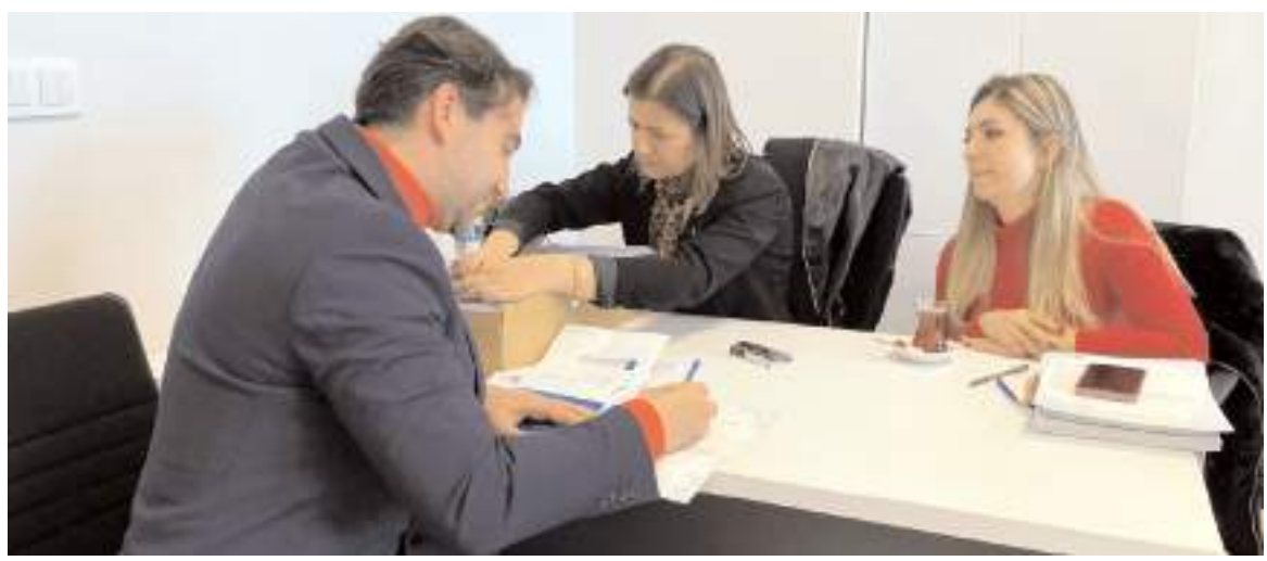
Personele yerli ve milli ödeme sistemi olan 'Troy' özellikli banka kartları teslim edilmeye başlandı.

Son maçın ardından düzenlenen törenle dereceye giren takımlara kupa ve sporculara madalyaları verildi. Şampiyon olan Çorum Basketbol Yıldızları takımı ilimizi gruplarda temsil etmeye hak kazandı.