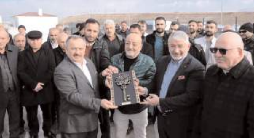
Zanaatkarlar Küçük Sanayi Sitesi Yapı Kooperatifi içinde inşaatı tamamlanan Hurdacılar Sitesi'nin anahtarları törenle teslim edildi.