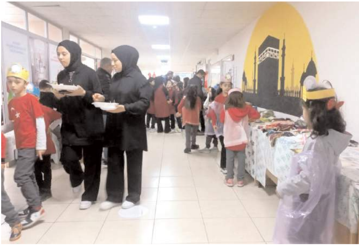
Pazarda tezgah başına geçen öğrenciler kendi başlarına alış-veriş yapma imkanı buldular.

Yerli malı etkinliğimizde bizleri yalnız bırakmayan kıymetli velilerimizle, yoğun bir çalışma içerisinde hazırlık yapan öğretmenlerimize eğlenerek öğrenen öğrencilerimize ve katılım sağlayan herkese teşekkür ediyoruz" dedi. (İHA)