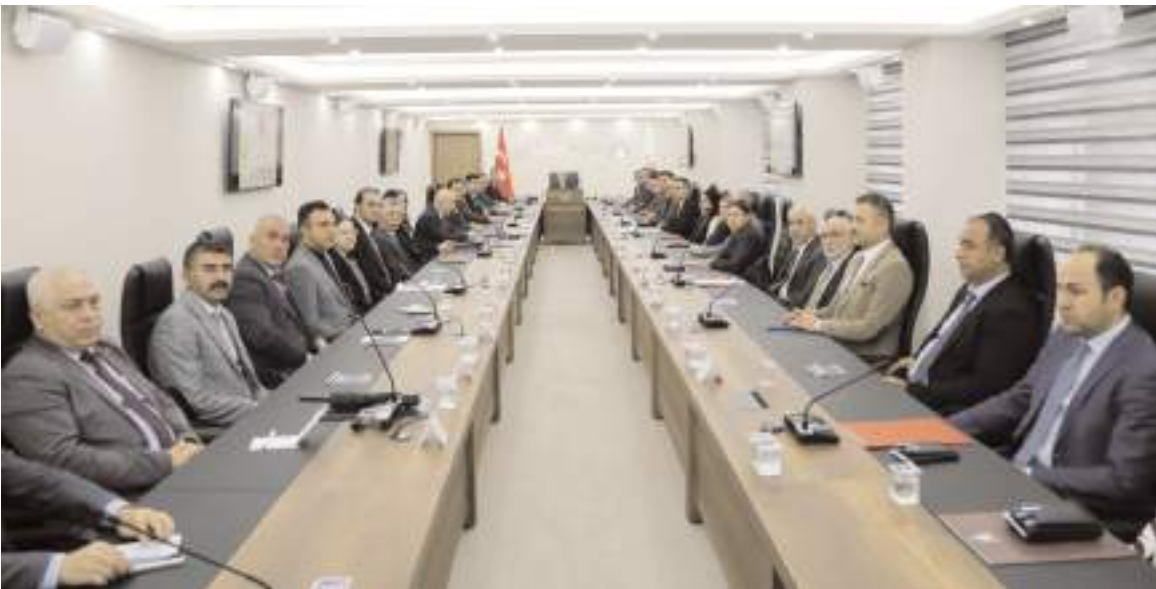
Eğitim seminerleri 11 gün sürecek ve her grubun eğitimi 1 gün olacak.