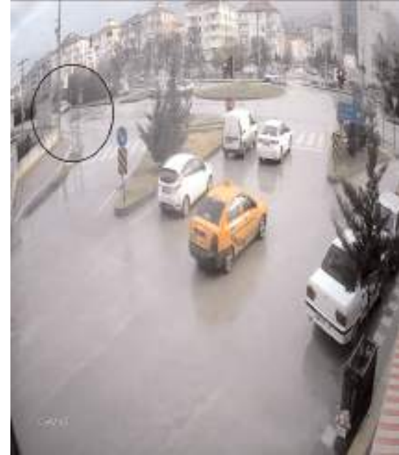
Kaza Budaközü Kavşağı'nda meydana geldi.