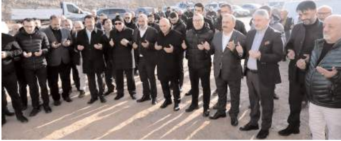
Yapılan duanın ardından dükkanların anahtarları teslim edildi.

■ İl Tarım ve Orman Müdürlüğü "İyi Tarım Uygulamalarının Yaygınlaştırılması ve Kontrolü Projesi" kapsamında kuru soğan ve patates üretimi yapıldı. Üretimi yapan çiftçilere ise sertifika verildi. * HABERİ'6'DA