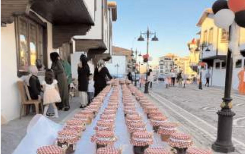
Kursiyerler tarafından hazırlanan gıda ve hediyelik eşyalar satış standında sergilenecek.