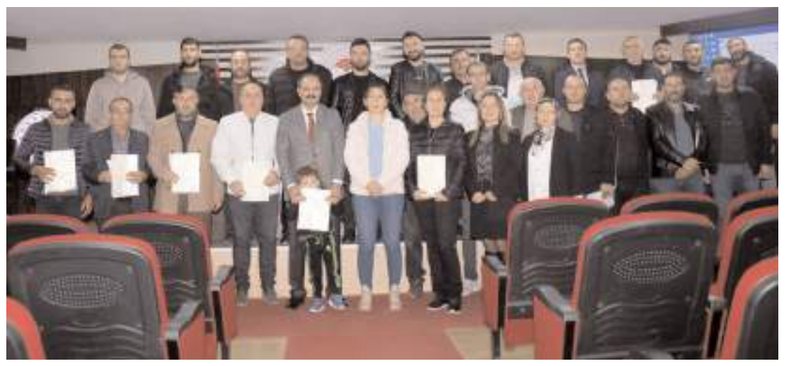
"İyi Tarım Uygulamalarının Yaygınlaştırılması ve Kontrolü Projesi" kapsamında toplamda 1053 dekar alanda, 6 bin 723 ton kuru soğan ve patates üretimi yapıldı.