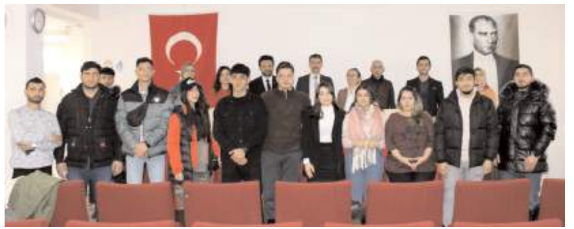
Eğitim Hitit Üniversitesi Kariyer ve Mezunlar Ofisi ve OKA Çorum Yatırım Destek Ofisi işbirliğinde yapıldı.

Bu sebeple, otopark yönetmeliğinin ilgili hükümlerinin yumuşatılması hususunda bakanlığımız nezdinde girişimlerde bulunulacaktır. Netice alınmaz ise, yerelde meclis ve plan notu kararları ile ilgili hükümler yumuşatılarak uygulanabilir ve kabul edilebilir seviyeye çekilecektir. Hangi merdiven tipi olursa olsun, merdivenin tamamı sirkülasyon alanı kabul edilerek, emsalden düşülecektir. Katlar alanına dahil edilmeyen kullanımlarda maksimum tolerans kullanılacaktır. Yönetmelikte bulunan ve "Bütün cepheleri top-rağın altında kalan..." ifadesinde maksimum tolerans kullanılacaktır. Kapalı ve açık sundurma uçlarına kolon dikilmesi hususu Bakanlık ile görüşülecek, yönetmelik açısından değişiklik talep edilecektir. İmar çapı ücreti 1/2 - 1/3 veya 1/4 e düşürülecek, kalan ücret yapı ruhsatı aşamasında tahsil edilecektir. Yapı ruhsat harçlarına kartsız ödemede de taksit yapılacaktır. İmar yönetmeliklerinde aşılmanın hususlar Meclis Kararı ile, bu şekilde de aşılmanın hususlar ise İmar Plan Notları ise çözüme kavuşturulacaktır. Bu konulara daha yapılacak ilaveler var ve ilave de edeceğiz. Burada mesele temel yaklaşımı ortaya koymaktır."