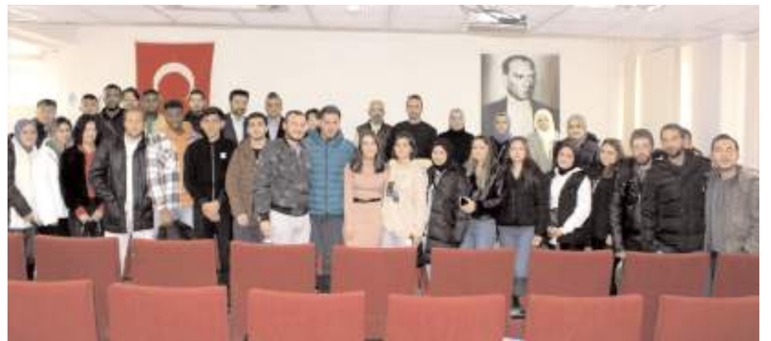
Programın sonunda toplu hatıra fotoğrafı çekildi.