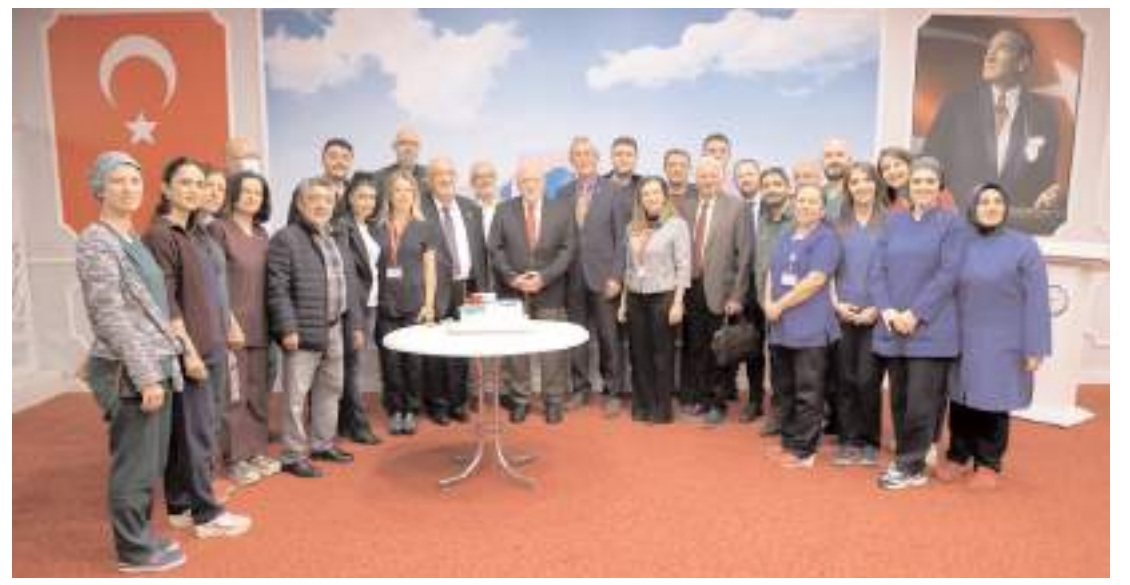
Yıl başından bu yana 400. açık kalp ameliyatının gerçekleştirilmesi dolayısıyla kutlama programı düzenlendi.

Bu sertifikalar ile kursiyerlerin iş gücüne katılması planlandı. Kurs kapsamında yapılan çalışmalar ile; çikolata üretimi, paketlenmesi ve magnet yapımı ile ilçenin bu yönden de tanıtılması amaçlanırken, ürünler ilk kez Çorum Milletvekili Oğuzhan Kaya'nın da katılımı ile Ağustos 2023 tarihinde Mustafa Kemal Atatürk Parkı'nda sergilendi. (İHA)