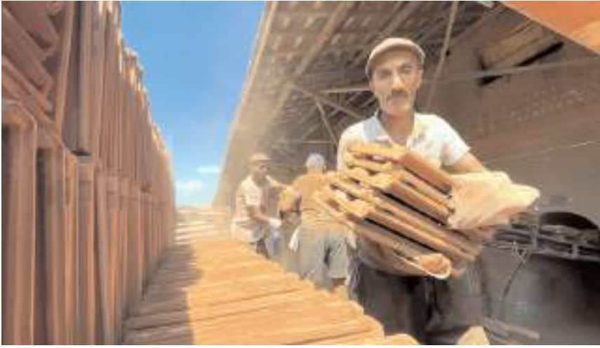
Sektörde iş gücüne ulaşma konusunda büyük aksaklıklar yaşanıyor.