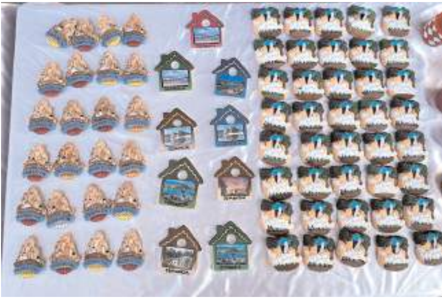
Kursiyer kadınlar ilçenin tarihi mekanlarından Koyunbaba Köprüsü, Koyunbaba Türbesi, İmaret Camii, Kandiber Kalesi ve ilçenin manevi değerlerinden Koyunbaba Hazretlerinin silüetini magnetlere işledi.