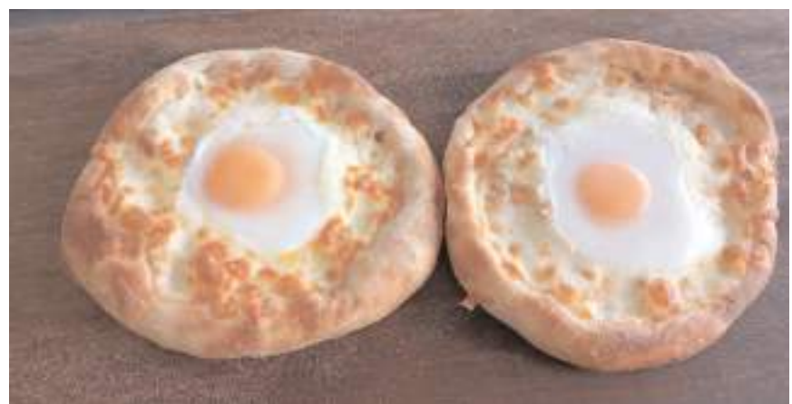
Fırında 30'a yakın pide çeşidi üretiliyor.