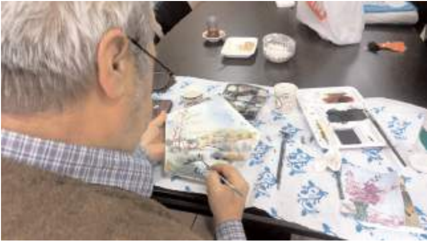
Osmancık Aile Destek Merkezi ikinci satış standını il merkezinde açacak.