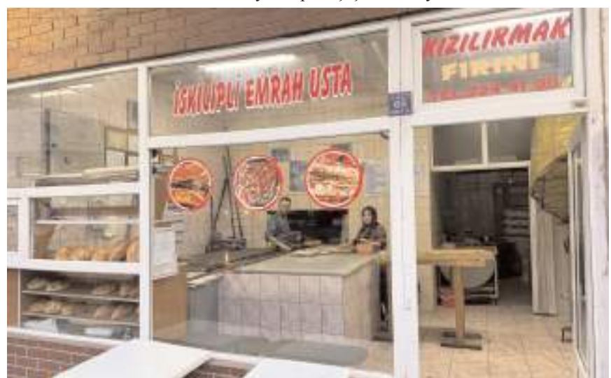
Kızılırmak Pide Fırını, Çepni Mahallesi Ulu Mezarlık yanında hizmet veriyor.