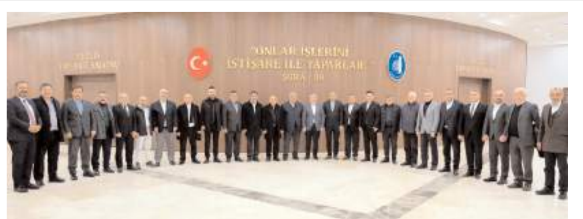
Ziyaretin sonunda toplu hatıra fotoğrafı çekildi.