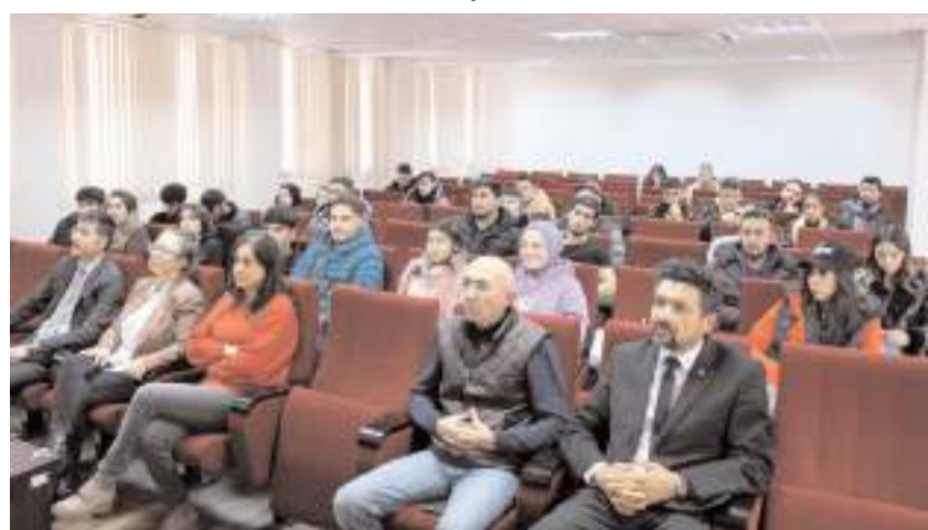
Seminerde öğrencilere uluslararası pazarlarda müşteri bulmak için kullanılan veri tabanları anlatıldı.