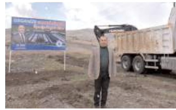
İskilip Belediye Başkanı Ali Sülük, açıklamalarda bulundu.