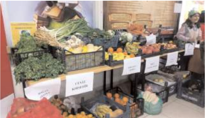
Yerli Malı Pazarında çok sayıda tezgah kuruldu.