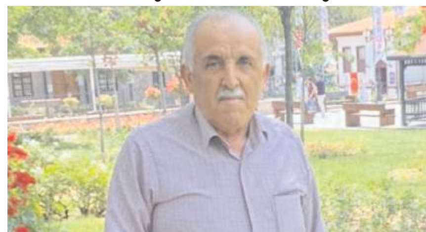
Durak Eker Dağkarapınar Köyü'nde toprağa verildi.

Hakimiyet, merhuma Allah'tan rahmet, ailesine ve yakınlarına başsağlığı diler.