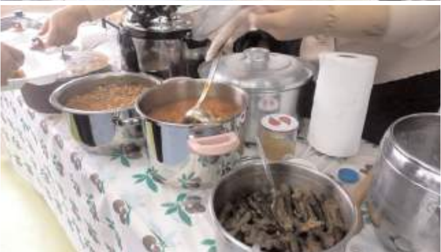
Yerli malı pazarında sıcak yemekler de satıldı.