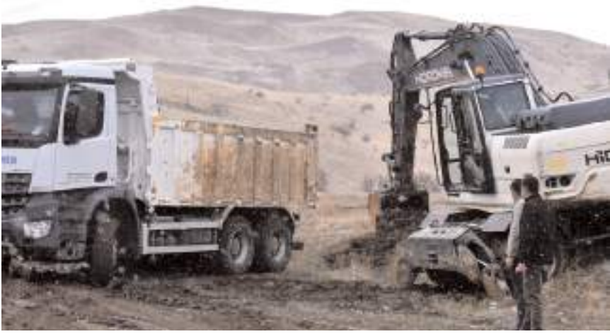
İskilip Belediyesi OSB alanında zemin düzeltme çalışmalarına başladı.