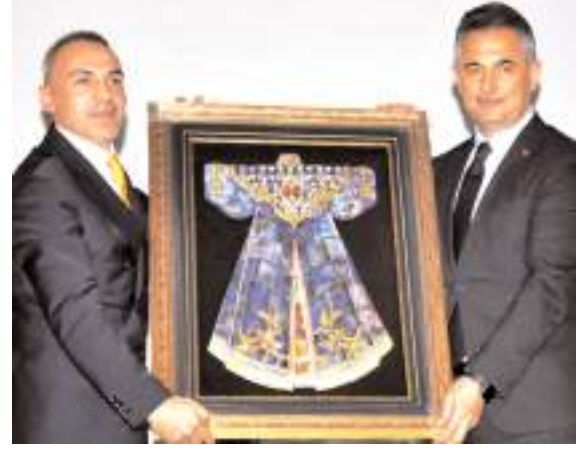
Pakro Kimya'nın aldığı tabloyu Mamak Belediye Başkanı Murat Köse verdi