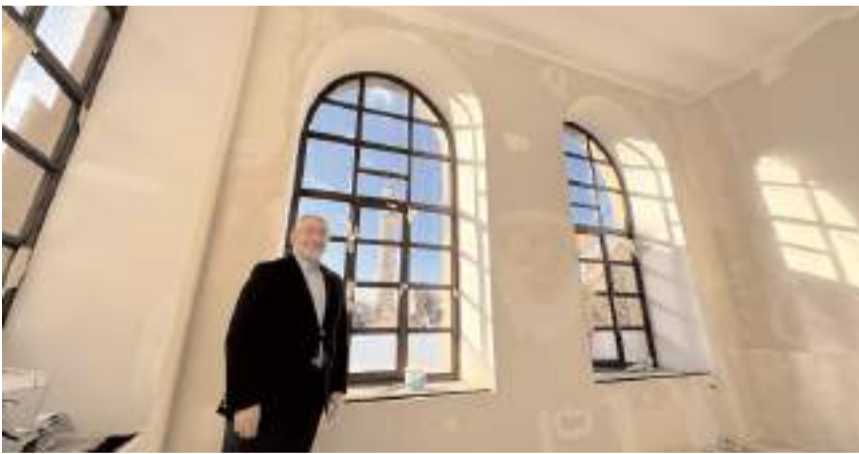
Başkan Aşgın, çalışmalarını yerinde inceledi.

lığı makamı olarak muhafaza edeceğiz. Alt katla ilgili kütüphane tasarrufumuz oldu." bilgisini verdi.