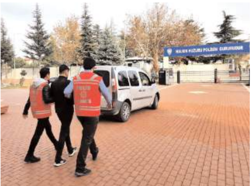
Gözetim altına alınan şüpheli H.Ö., emniyetteki işlemlerinin ardından adli makamlara sevk edildi.

Araç alım-satım sitesi üzerinden vatandaşları dolandıran şahıs, Isparta'da bankadan parayı çekmeye geldiği esnada yakalandı.