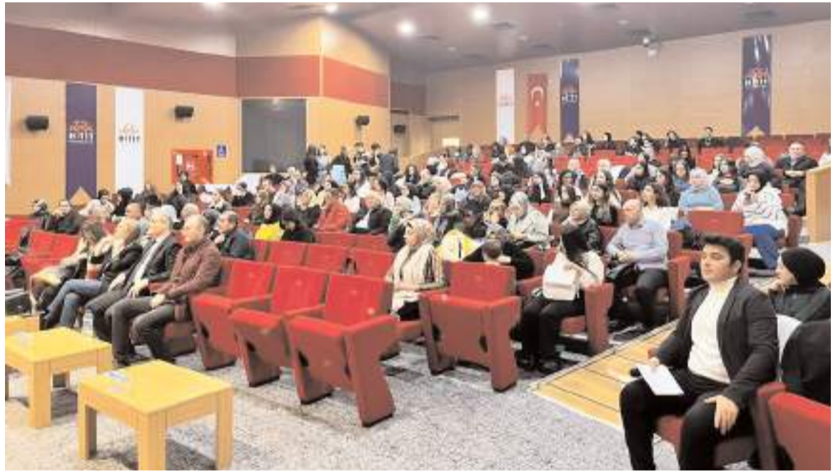
Meslek Yüksek Okulu Ethem Erkoç Konferans Salonu'nda yapılan programa öğrenciler ile aileleri katıldı.