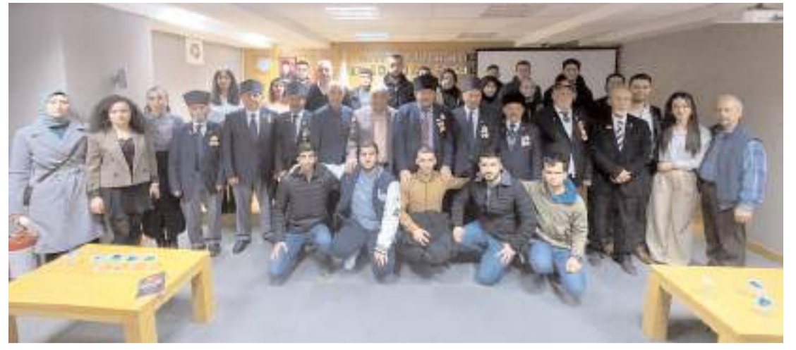
Panelin sonunda hatıra fotoğrafı çekildi.