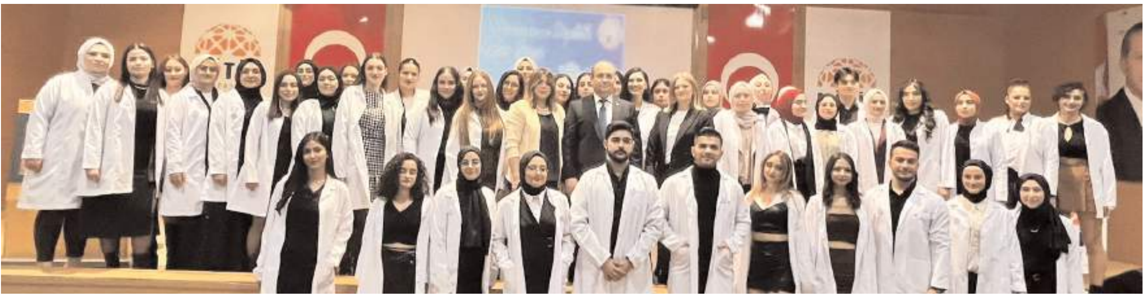
Beslenme ve Diyetetik Bölümü ikinci sınıf öğrencileri de beyaz önlük giydi.