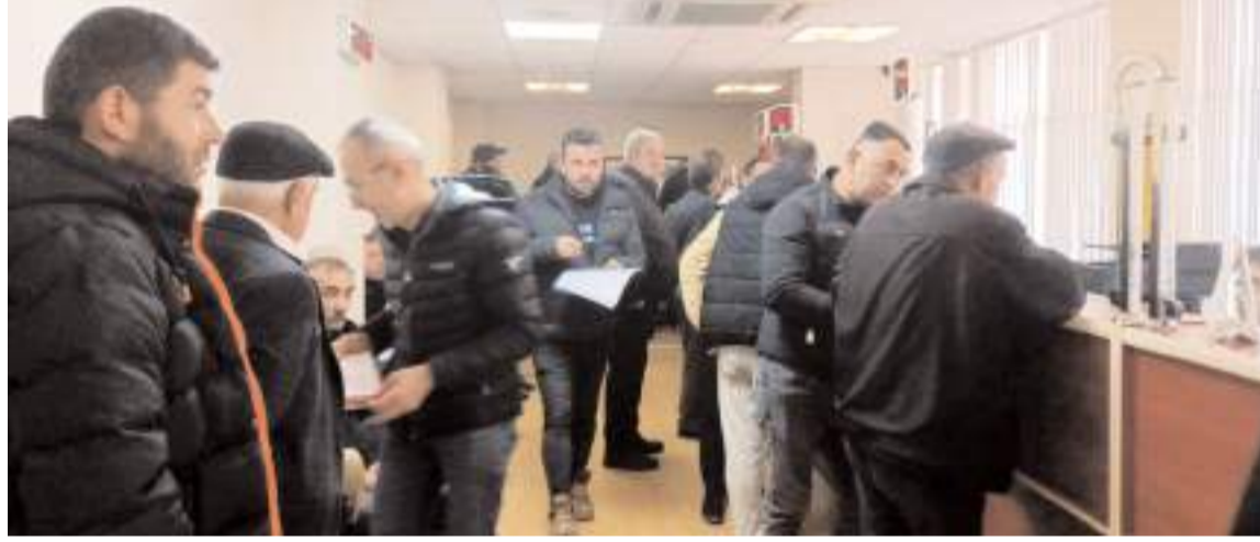
2024 ÇKS başvuruları Eylül ayında başladı.