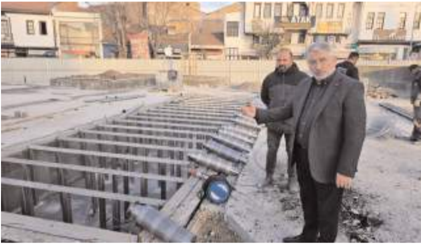
Başkan Aşgın, çalışmalar hakkında açıklamalarda bulundu.