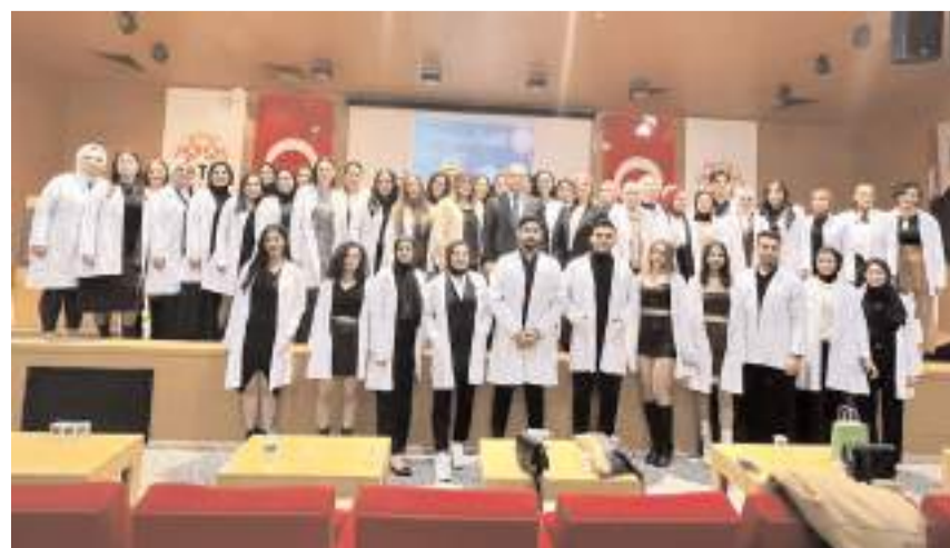
Beslenme ve Diyetetik Bölümü ikinci sınıf öğrencileri de beyaz önlük giydi.