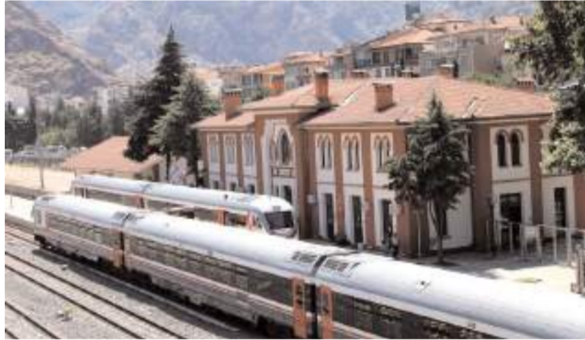
Kırıkkale-Çorum-Samsun hattında yılda 12 milyon yolcu ve 14 milyon ton yük taşınması planlanıyor.

Ulaştırma ve Altyapı Bakanlığı, ilk etap ihalesi 2024 yılında yapılacak olan Kırıkkale-Çorum-Samsun hızlı tren hattında 7 istasyonun inşaa edileceğini açıkladı.