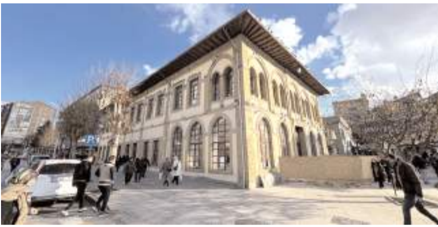
Tarihi taş binanın giriş katı kütüphane olacak.

Binanın Cumhuriyet ile yaşıt olduğuna işaret eden Aşgın, "Cumhuriyet'imizin kurulduğu, savaştan çıktığımız yıl ecdadımızın neyi hedeflediğini göstermesi bakımından son derece önemli bir bina. Biz burayı ilk kurucu iradenin düşüncesine uygun şekilde yeniden dizayn etmek istedik. Üst katı Belediye Başkan-