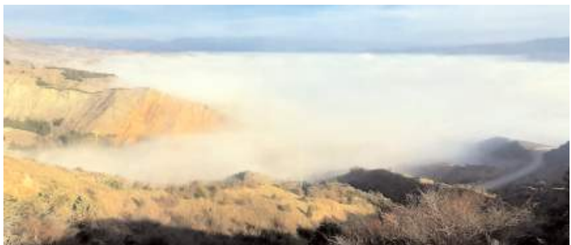
İlçede etkili olan sis kartpostalık görüntüler ortaya çıkarttı.

Olayla ilgili başlatılan soruşturma sürüyor.