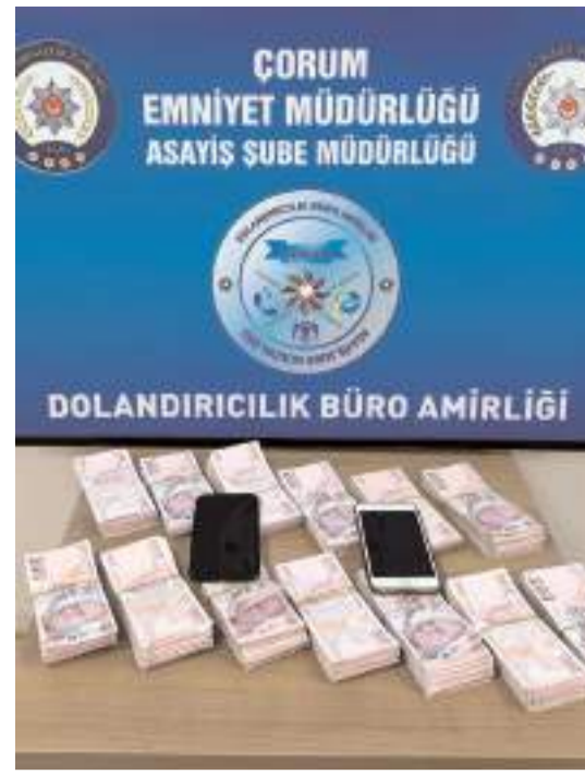
Dolandırıcıların evinde yapılan aramada para ele geçirildi.