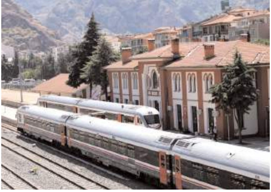
Demiryolu projesinin Delice-Çorum arası kısmının ihalesi 2024 yılında yapılacak.

2002'de yaklaşık 11 bin kilometre olan demir yolu ağına, bu yıl itibarıyla 2 bin 250 kilometresi yüksek hızlı (YHT) ve hızlı tren (HT) olmak üzere, yaklaşık 3 bin kilometrelik hat eklendi. Türkiye'nin demir yolu ağı 13 bin 919 kilometreye ulaştı. A.A