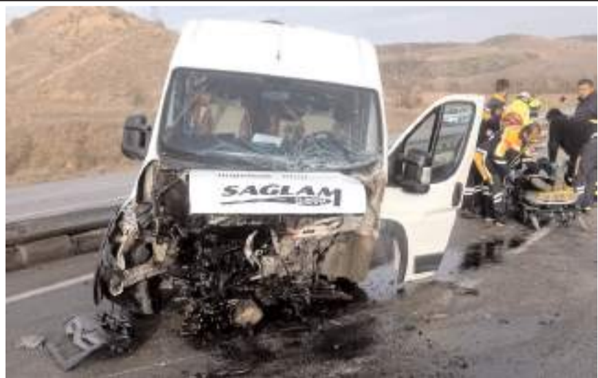
Kazada her iki araçta da maddi hasar meydana geldi.

Kaza esnasında Merzifon'dan Çorum istikametine seyir halinde olan 19 DT 143 plakalı otomobilede kaza yapan araçların parçalarına çarptı. Araçta maddi hasar meydana geldi.