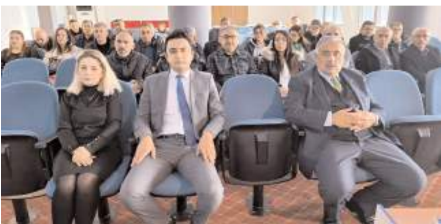
Eğitimde il ve ilçe esnaf odaları genel sekreterlerine güncel değişiklikler anlatıldı.