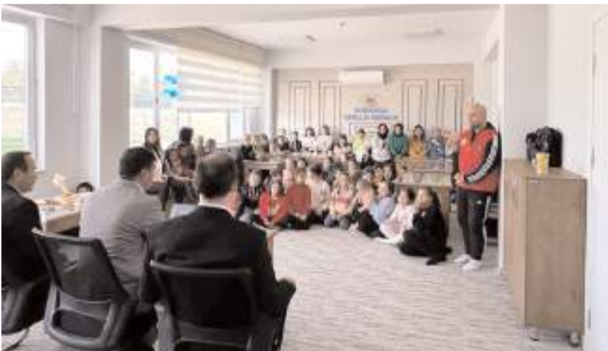
Öğrenciler konuşmacıyı büyük bir dikkatle dinlediler.