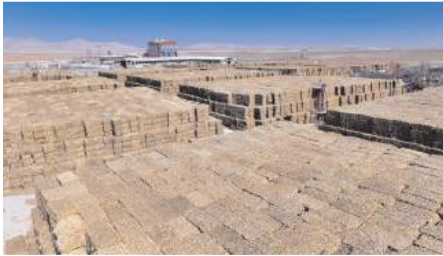
Firmanın Mecitözü'nde de santrali bulunuyor.