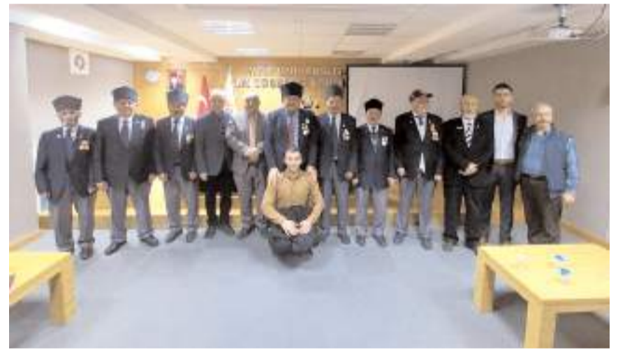
Panel sonunda öğrenciler gaziler ile süre sohbet edip hatıra fotoğrafı çektiler.