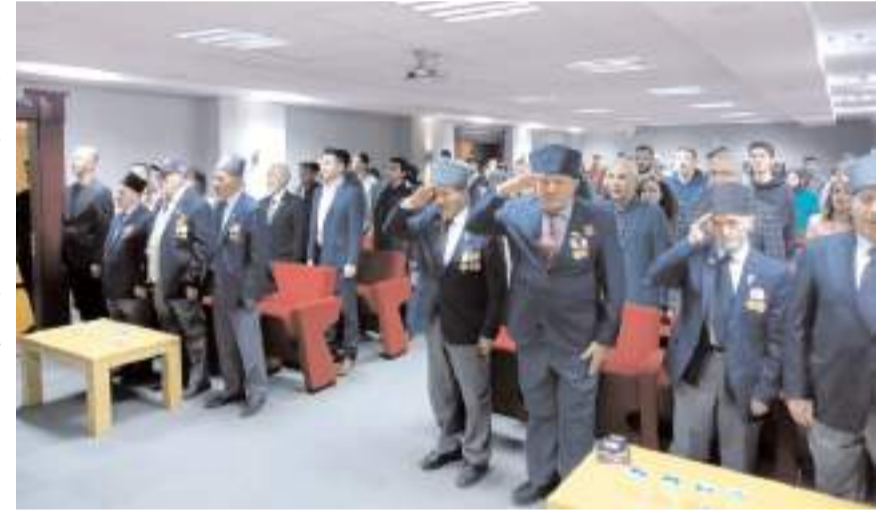
Panel saygı duruşunda bulunulması ve İstiklal Marşının okunmasıyla başladı.