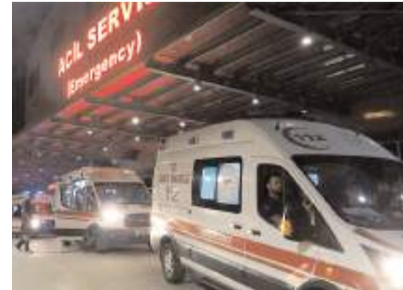
Olay Gülabibey Mahallesinde meydana geldi.