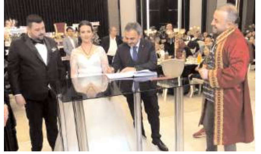
Genç çiftin nikah şahitliğini