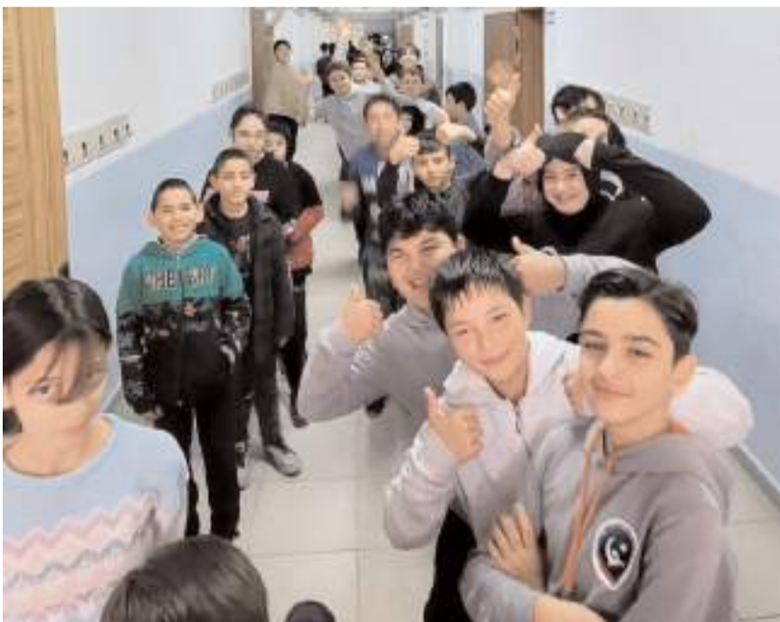
Öğrenciler öğretmenlerine teşekkür ettiler.