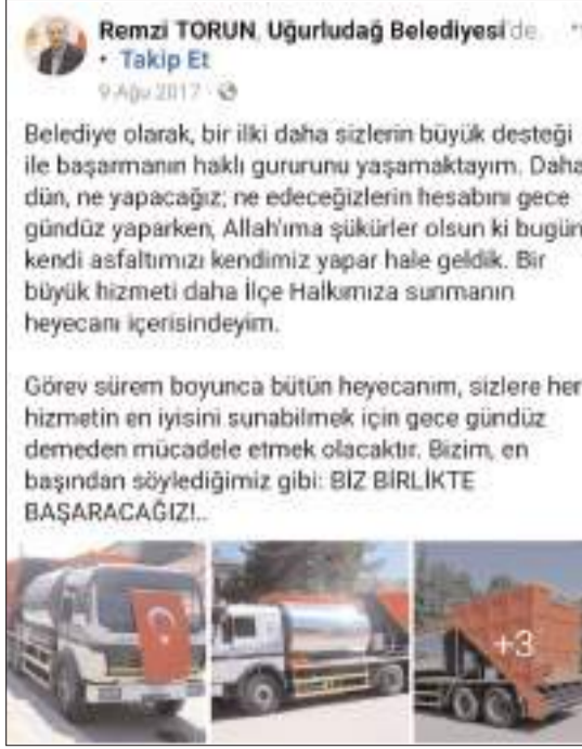
Uğurludağ Belediye Başkanı Remzi Torun'un araç alımı ile ilgili paylaşımı.