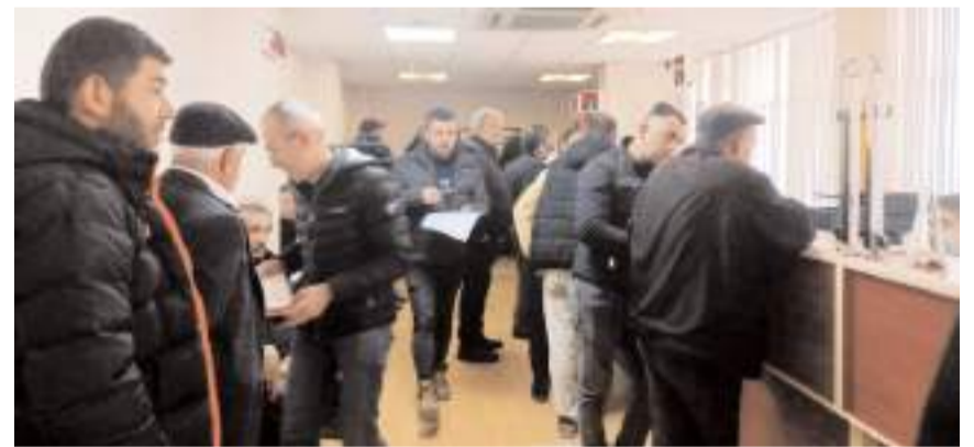
2024 ÇKS başvuruları Eylül ayında başladı.