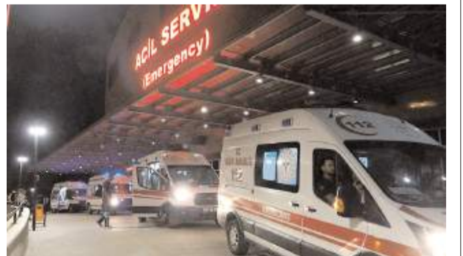
Olay Gülabibey Mahallesinde meydana geldi.

İhbar üzerine olay yerine polis ekipleri ve 112 sağlık ekibi sevk edildi. Sağlık ekiplerinin olay yerinde yaptığı ilk incelemede A.D.'in hayatını kaybettiği belirlendi. Genç cenazesi