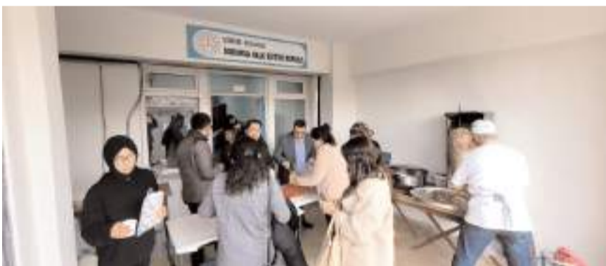
Uzmanlık sınavını kazanan öğretmenler öğrencilere döner ikram etti.