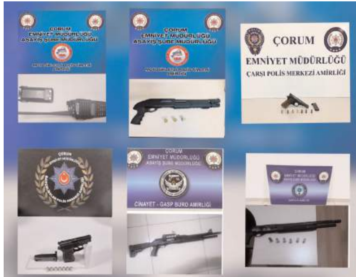
Denetimlerde çok sayıda ateşli silah ile uyuşturucu madde ele geçirildi.