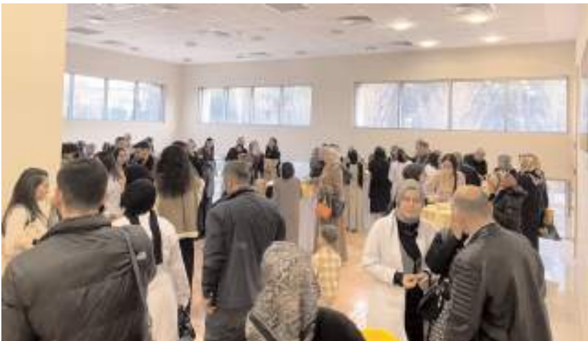
Programın sonunda kokteyli verildi.