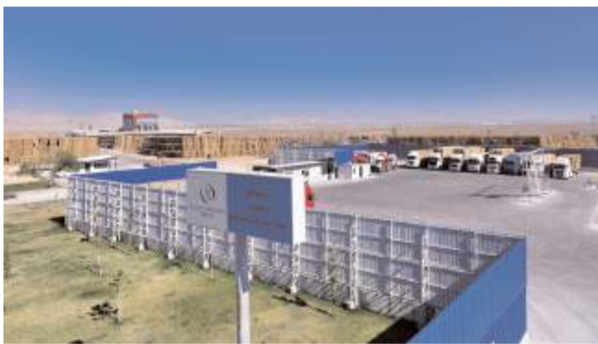
40 MW kurulu güce sahip Karaman BES projesi yılda 320 bin MWh elektrik üretiyor.