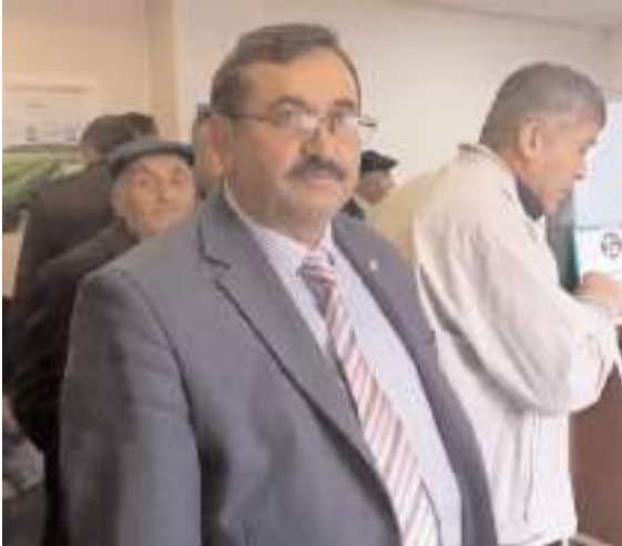
Çorum Ziraat Odası Başkanı Adem Özdemir, konu hakkında açıklamalarda bulundu.