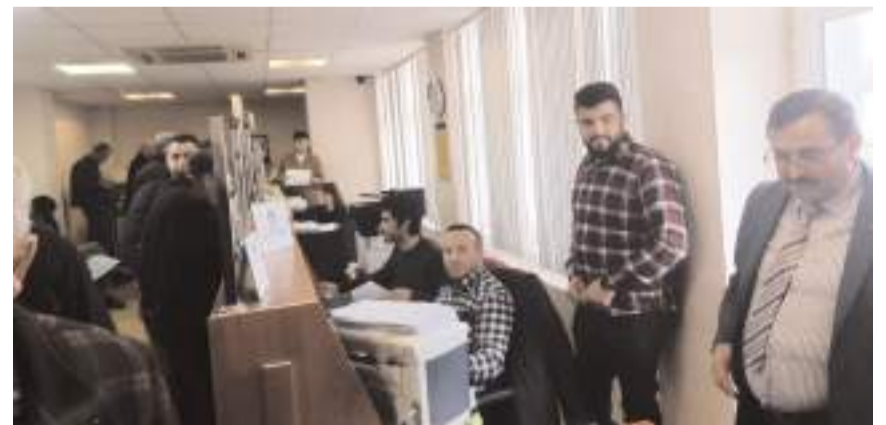
Çorum Ziraat Odasında ÇKS yoğunluğu yaşanıyor.

ahhünamelerin muhtarlıklar tarafından onay ve rildikten sonra Ziraat Odası'na ulaştırıldığı takdirde çiftçilerin mağduriyetinin önlenilebileceği gibi ülkemizde üretilen bitkisel ürünlerin gerçek verileri tespit edileceğinden arz ve talep de gerçek verilerin ortaya çıkacağını söyledi.