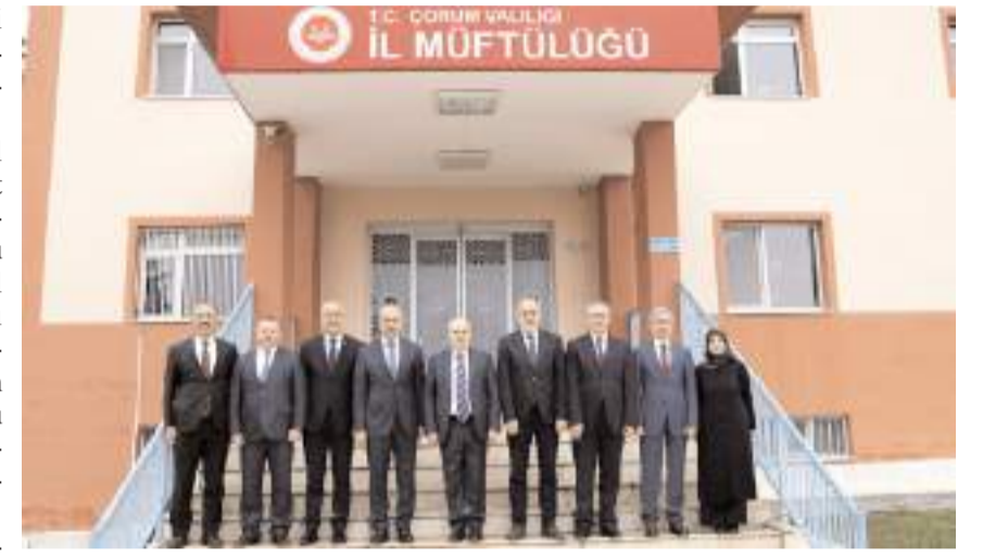
Ziyaretin anısına hatıra fotoğrafı çekildi.