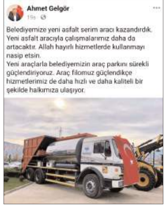
Osmancık Belediye Başkanı Ahmet Gelgör'ün aynı aracı satın aldıkları ile ilgili paylaşımı.