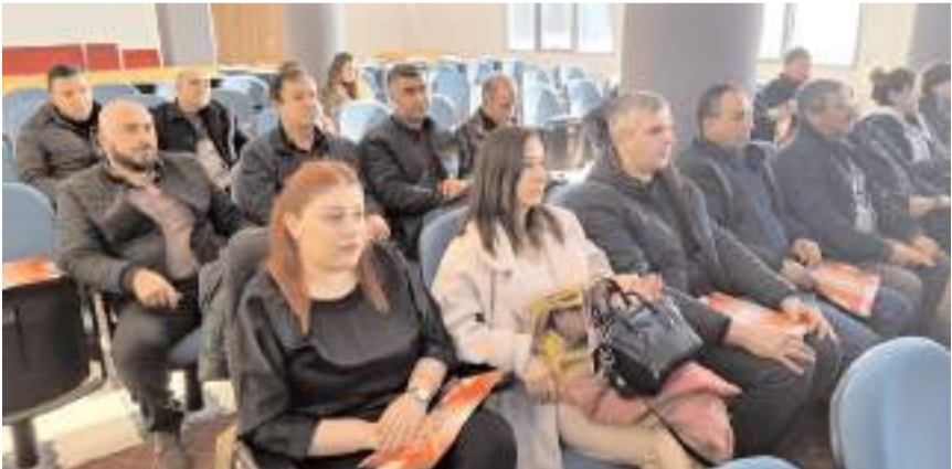
Eğitime il ve ilçe esnaf odalarının genel sekreterleri katıldı.