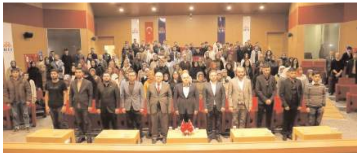
Meslek Yüksek Okulu Ethem Erkoç Konferans Salonunda yapılan programa ilgi yüksek oldu.

"Bu gençlik tarih yazacak, vallahi de yazacak billahi de. Türkiye yüzyılı'nın kapısını aralarken, entelektüel tavırlı, klas duruşlu, vatani için, milleti