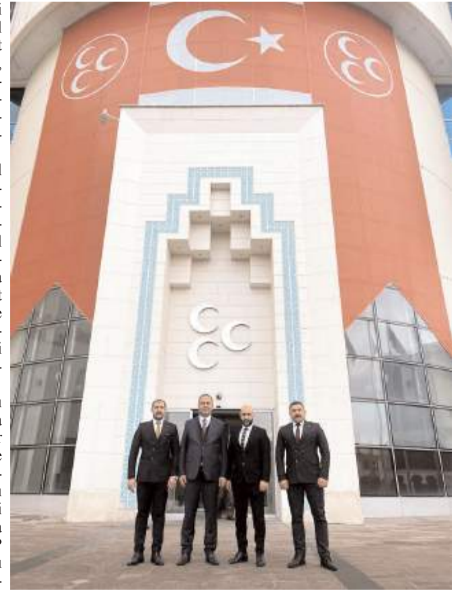
Toplantıda yerel seçimler ile ilgili değerlendirmelerde bulunuldu.

cek nesillere huzurlu, istikrarlı, güvenli, gelişmiş, temel sorunlarını köklü çözümlerle buluşturmuş bir ülkeyi miras bırakmak olduğunu belirten Bahçeli, 'Milleti ve ülkesinin varlığı için candan, yandan ve yarınlardan vazgeçmeye yeminli olan Milliyetçi-Ülkücü hareket için esas amaç kazanacağı belediye sayısından daha fazla Türkiye'nin ve Türk milletinin ebedi saadet ve selametidir. Zehirlenmiş ve zincirlenmiş muhalefetin seçenek olmaktan bütünüyle uzaklaştığı bu dönemde, yeni yüzyılı tek yürek halinde inşa etmeliyiz' diye konuştu. (Haber Merkezi)