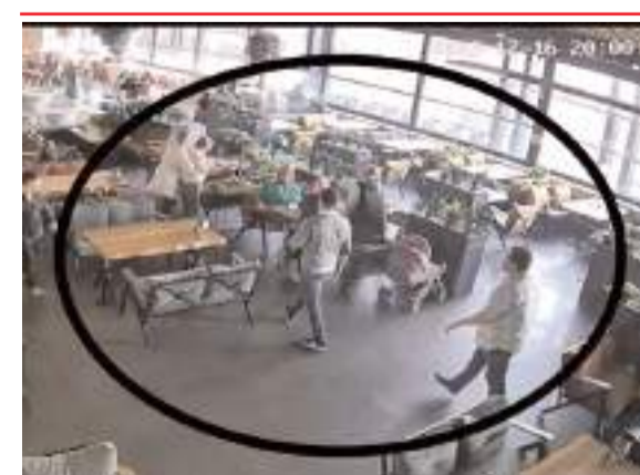
Olay Çorum'da bir restoranda meydana geldi.