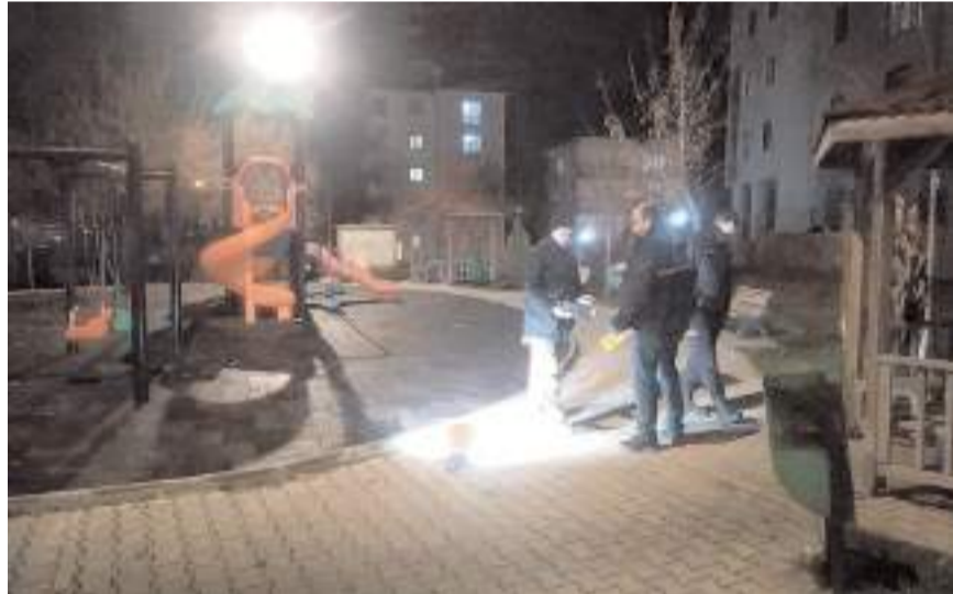
Polis ekipleri olay yerinde inceleme yaptı.