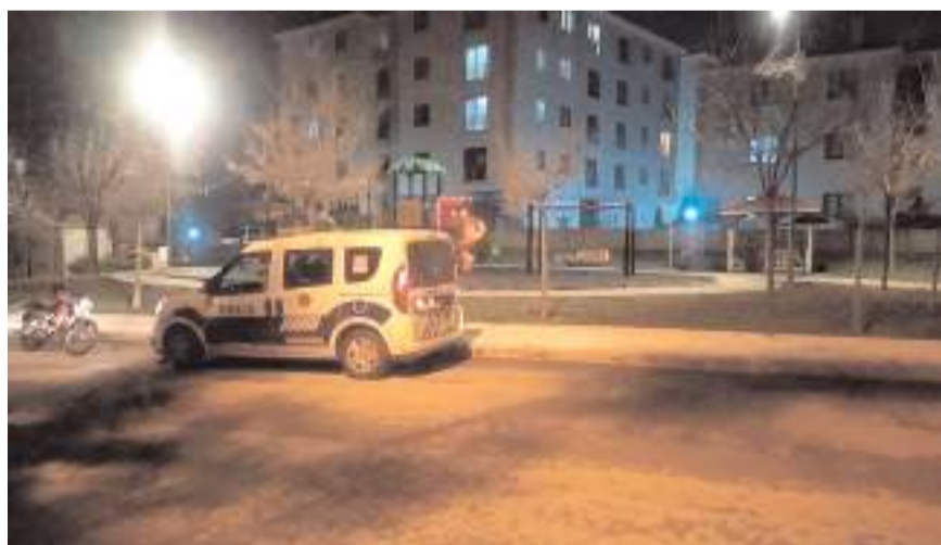
Olay, Bahçelievler Mahallesi Bahar Caddesi'nde meydana geldi.

Çorum'da bir parkta meydana gelen bıçaklı kavgada 1 kişi yaralandı.