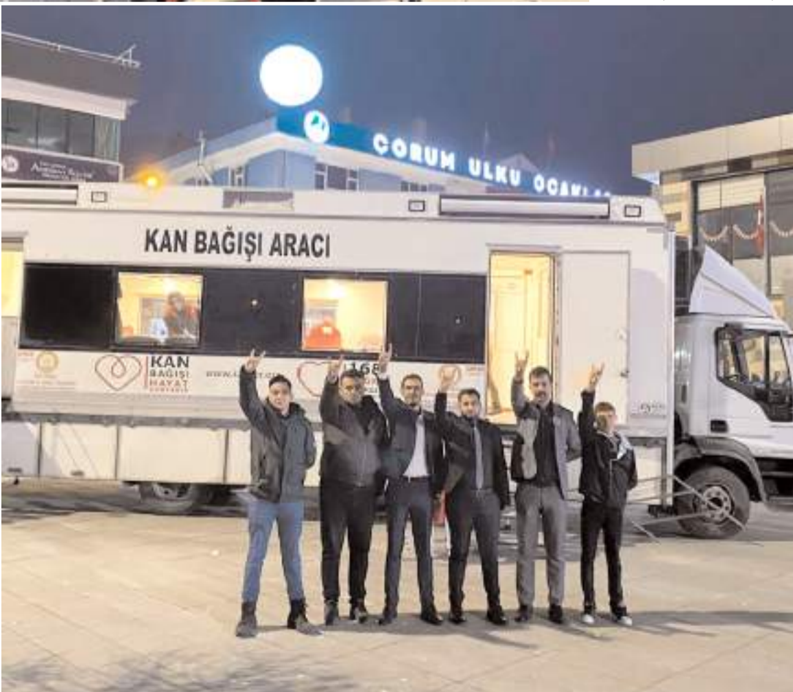
Kan bağışı kampanyasını Çorum Ülkü Ocakları Üniversite Birimi düzenledi.

Çorum Ülkü Ocakları Üniversite Birimi Türk Kızılay'ına kan bağışında bulundu.