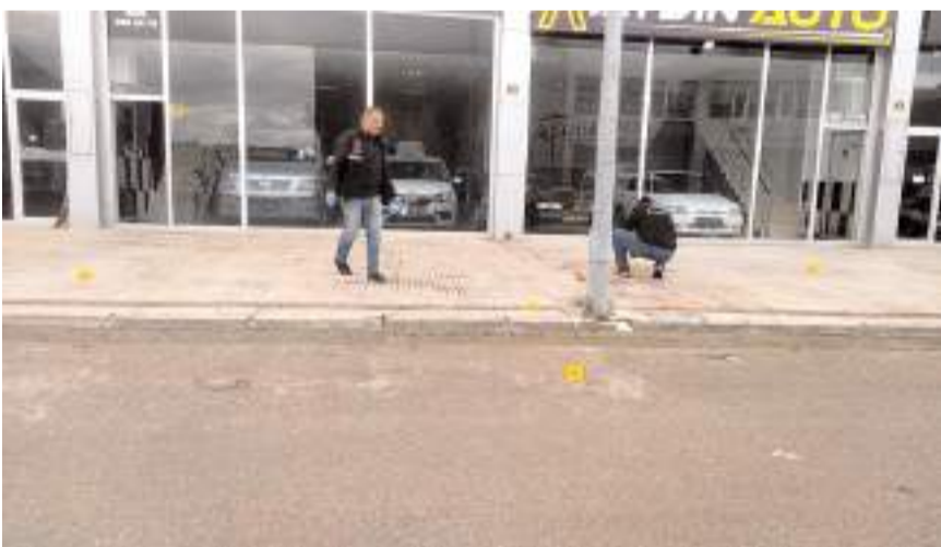
Polis ekipleri olay yerinde inceleme yaptı.

Çorum'da bir işletmeye silahlı saldırı düzenlendi. Saldırıda işletmenin camları ile içeride bulunan bir araç kurşunların hedefi oldu.