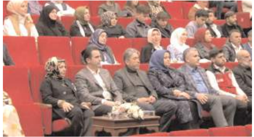
Program Recep Tayyip Erdoğan Kongre Merkezinde yapıldı.