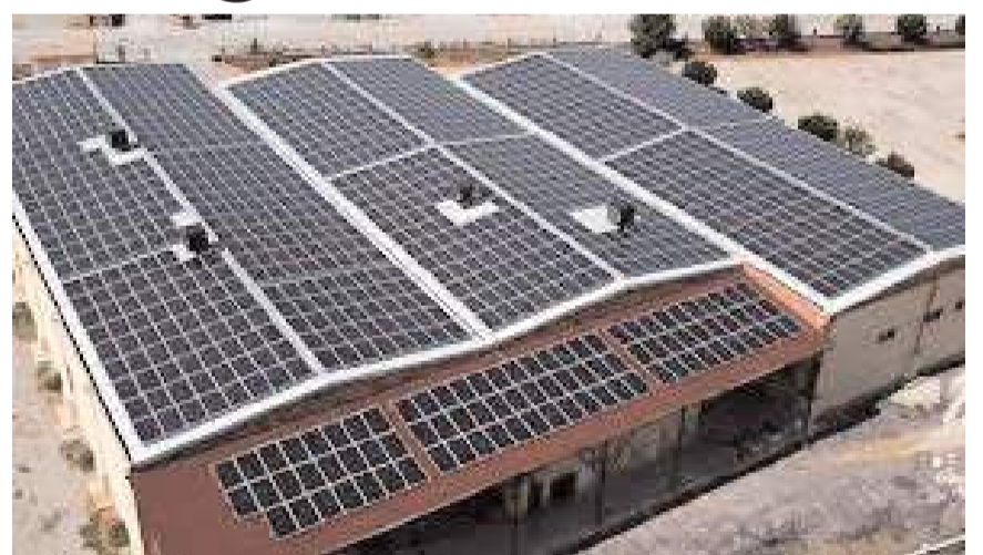
Proje kapsamında ayrılan 250 milyon dolarlık bütçe KOSGEB tarafından iki çağrı döneminde hazırlanacak projelere destek olarak verilecek.

"Küçük veya orta ölçekli KOBİ olmalıdır. İşletme Findeks kredi notu endeksinde göre "çok risk-