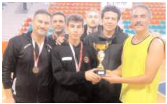
Dördüncü olan Basketbol Yıldızlarıspor kupasını aldı