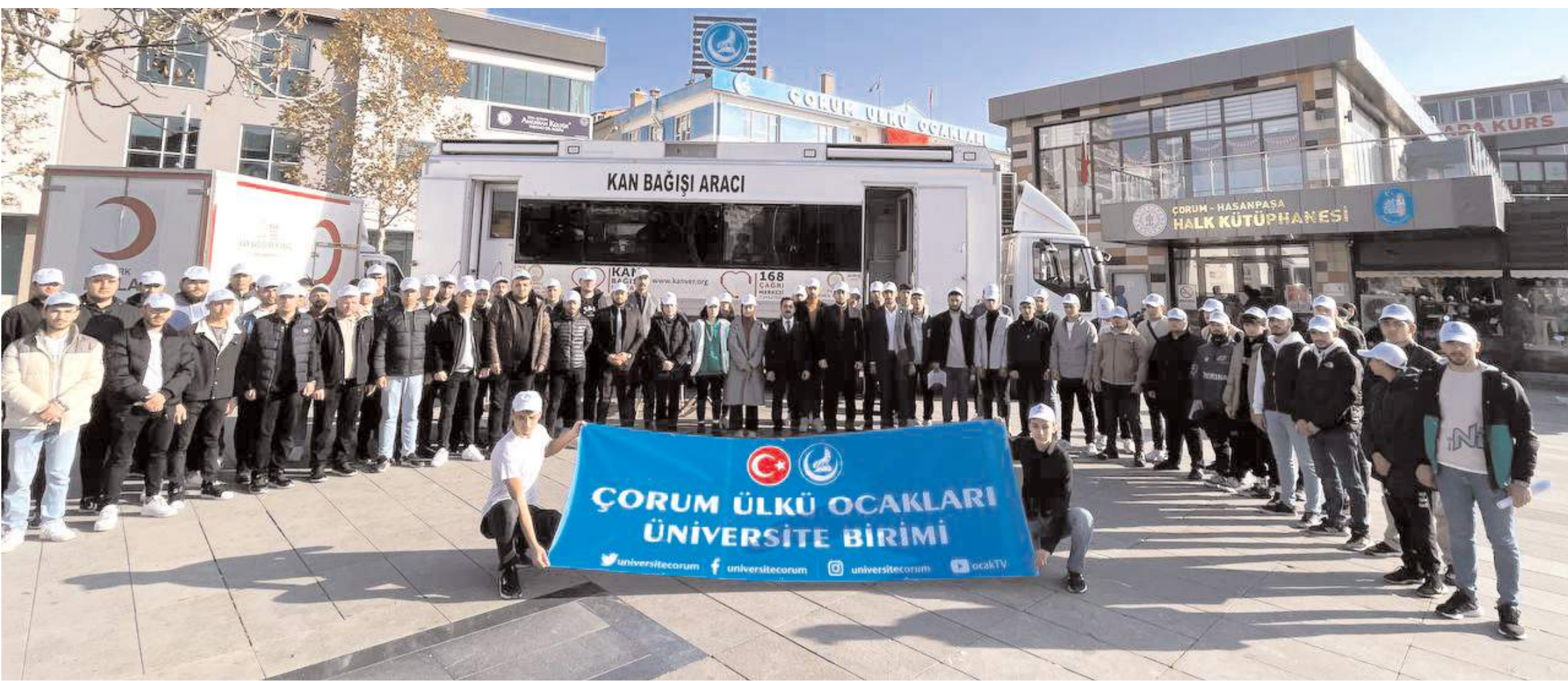
Kan bağışı öncesinde toplu hatıra fotoğrafı çekildi.