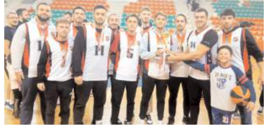
Gençlikspor takımı averajla kazandığı şampiyonluğun ikincilik kupasını aldı