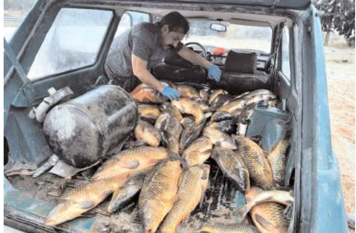
Kaçak avlanan sazan balıkları otomobilin bagajında bulundu.