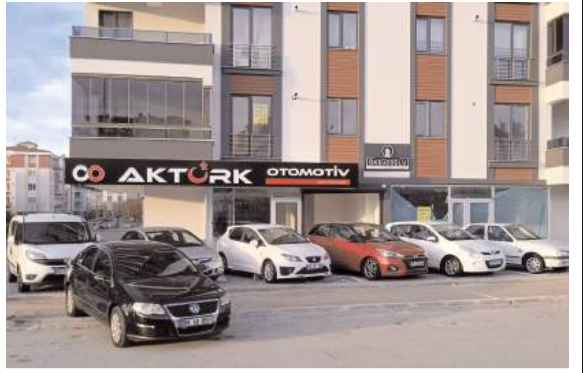
Aktürk Otomotiv Ulukavak Mahallesi Selçuk 1. Cadde Efe Apartmanı Numara 24/B adresinde hizmete açıldı.

Biz ya da ben, bir yere gittiğimde, oranın kapısının önüne kadar gider, tam kapısının önünde park edecek boş yer var mı diye bakarım. Hâlbuki oraya gidene kadar park edecek boş yerleri göre göre geçirim. Gideceğim yerin kapısının tam önünde boş yer olmayınca, geri döner önceki boş gördüğüm yerlere park etme gayretinde olurum. Bu huyumuzdan vazgeçip, açık kapalı otoparklara park ederek, yürüme alışkanlığı da hep beraber kazanmamız gerektiği kanaatindeyim."