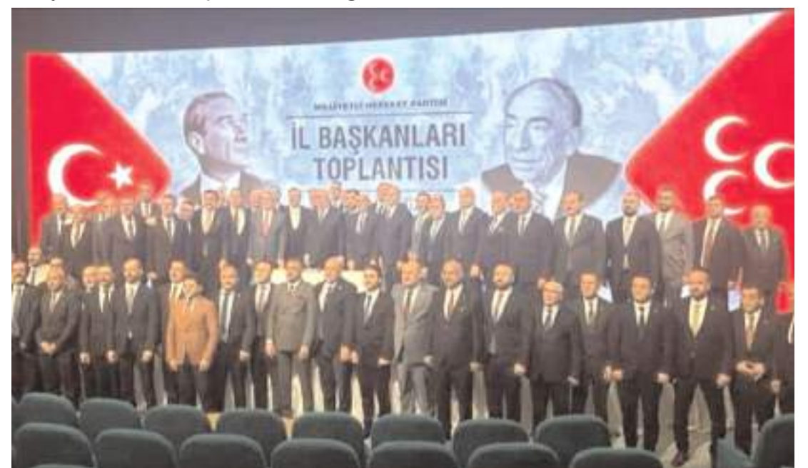
Toplantının sonunda hatıra fotoğrafı çekildi.