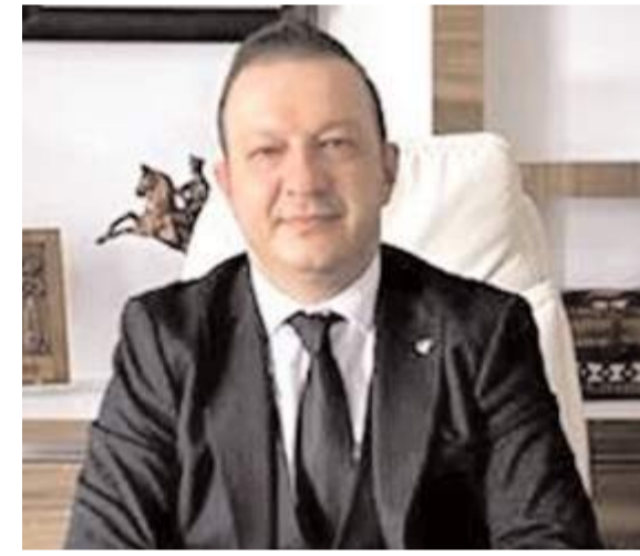
Eczacı Odası Başkanı Erol Afacan