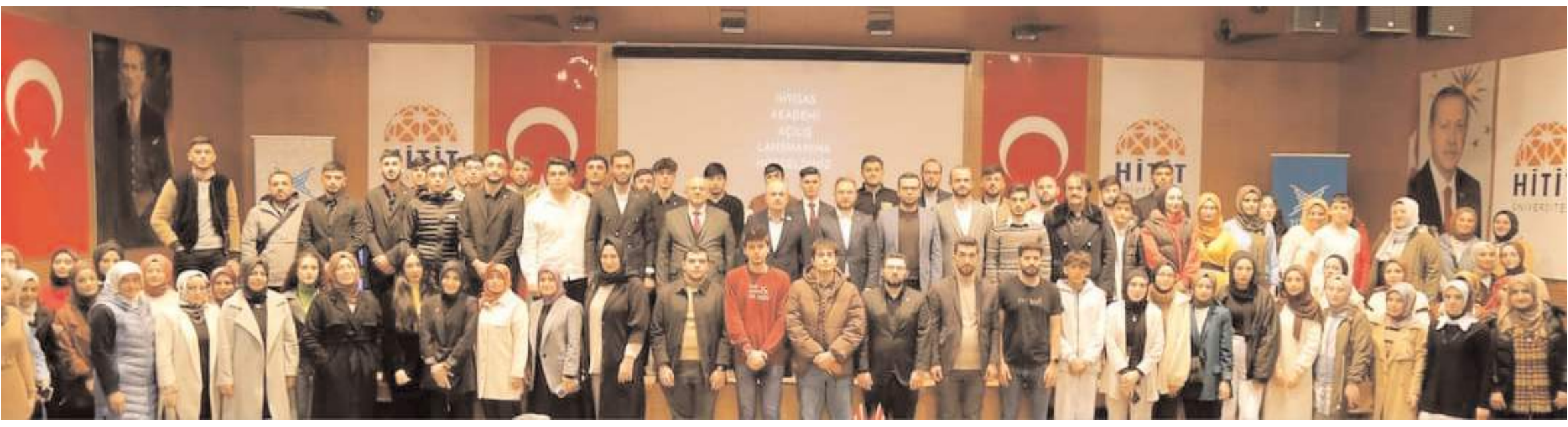
Türkiye Gençlik Vakfı (TÜGVA) Çorum Şubesi, İhtisas Akademi Projesinin tanıtım toplantısını yaptı.