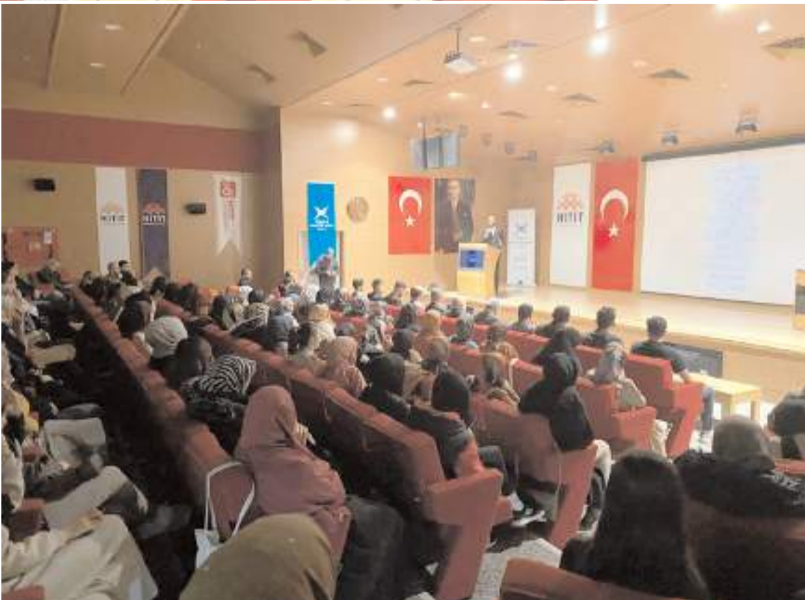
Proje kapsamında 9 farklı alanda alanlarında uzman hocalar öğrencilere ders verecekler.

İslam Dünyasında ki Kriz Bölgeleri ve Güncel Durumları, siber Güvenlikte Yapay Zekanın Rolü dersleridir. Çorum Valimiz Sayın Doç.Dr.Zülkif Dağlı Beyefendiye'ye her daim gençlerin yanında olduğu büyük bilgi birikimiyle bizlerin yolunu aydınlattığı için şükranlarımı iletiyorum. Bunun bir nişanesi olarak akademimizin en önemli derslerinden olan Türkiye'nin Yeni Dünya Düzeninde ki Yeri ve Türkiye Yüzyılı adlı dersi icra ettikleri için başta şahsım ve gençler adına teşekkür ediyorum" şeklinde belirtti. (Haber Merkezi)