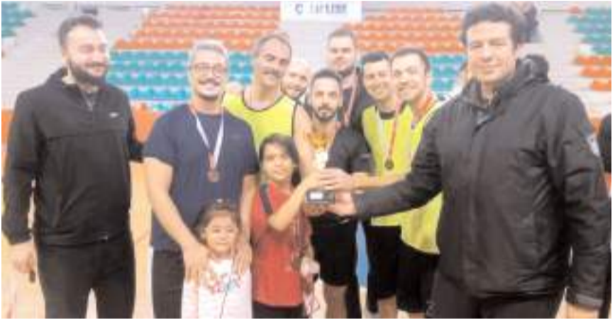
Vefaspor son maçını kazanarak üçüncülük kupasının sahibi oldu