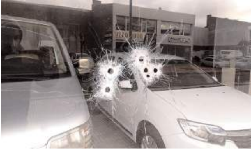
Olay Çorum Galericiiler Sitesi'nde meydana geldi.