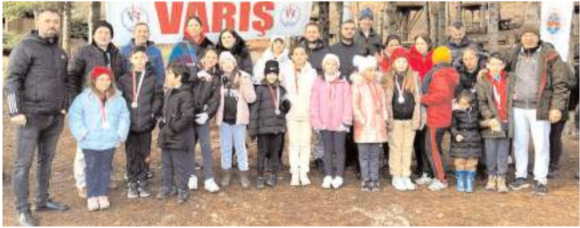
Yarışmalarda dereceye giren sporcular ve katılanlar ödül töreni sonrasında toplu halde görülüyor