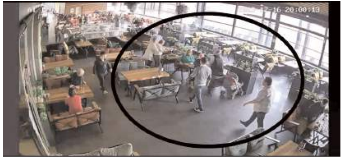
Olay Çorum'da bir restoranda meydana geldi.

Bakan Yerlikaya, operasyonlarda; 4 adet meskene, 10 adet arsaya, 1 adet özel tekneye, 3 adet lüks marka araç ve 2 adet motosiklete el konulmuştur. 850 bin dolar değerinde kripto varlığa, 3 adet kripto varlık soğuk cüzdanına, 4 milyon 210 bin Türk Lirasına, 101 bin 634 dolar ve 101 bin 090 Euro'ya, tabancalara, muhtelif miktarda uyuşturucu maddeye ve çok sayıda dijital materyale el konulduğunu açıkladı. (İHA)