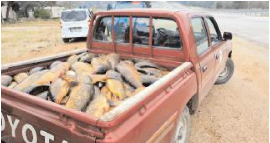
620 kilogram sazan balığına el konuldu.

Kargı Tarım ve Hayvancılık İlçe Müdürlüğü tarafından yapılan açıklamada kaçak avcılık ile mücadeleye devam edileceğinin altı çizildi.