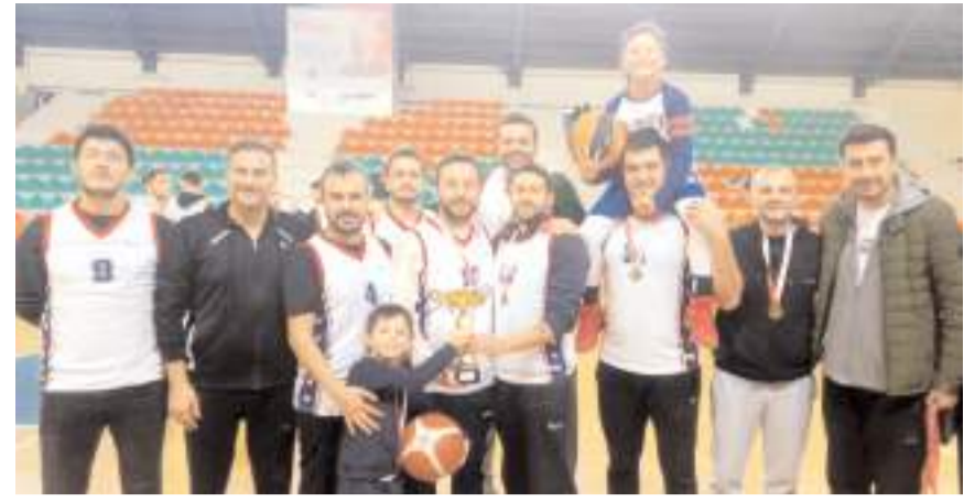
Çorum Gelişimspor takımı averajla kazandığı birincilik kupasını aldı

Çorum Gelişim Basketbol bu mağlubiyete rağmen aynı puana sahip Çorum Gençlikspor'u yendiği için ikili averaj üstünlüğü ile şampiyon olurken Gençlikspor ise ikincilik kupasını aldı.