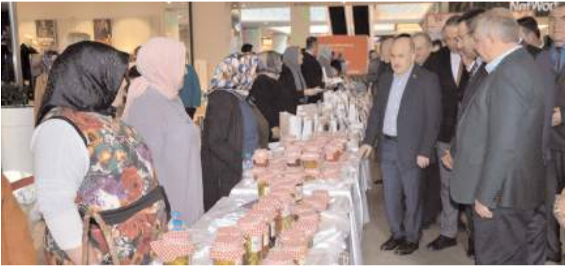
Osmançık Sosyal Yardımlaşma ve Dayanışma Vakfı Aile Destek Merkezi kursiyerleri AHL Park AVM'de sergi açtı.

Bu yazıyla amacımız, kamuoyunu ilaç tedarikinde yaşanan sorunlara dikkat çekmeye ve çözüm önerilerini gündeme getirmeye yönlendirmek. Sağlık sektöründe yaşanan bu tür zorluklar, tüm paydaşların işbirliğiyle çözüme kavuşturulmalıdır."