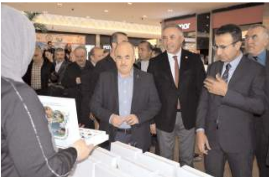
Protokol üyeleri stantları gezerek ürünler hakkında bilgi aldı.