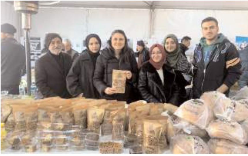
Çorum Eğitimci Sanayici İş Adamları Derneği, kermes leblebi satışı yaptı.