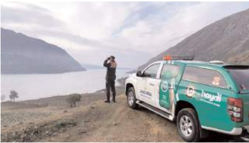
Jandarma ekipleri yasadışı balık avcılığı ile ilgili denetimlerine devam ediyor.

İl Jandarma Komutanlığından yapılan açıklamada, 15 Aralık-31 Mart tarihleri arasında tüm bölgelerde turna balığı yasağının başladığı belirtilerek, "Son üç ay içerisinde icra edilen denetim ve kontrollerde, amatör balıkçılık kurallarına uymayan (olta sayısı, zaman ve yer yasağı) 10 şahsa, izinsiz ya da kurallara uymadan ticari amaçlı su ürünleri avcılığı yapan 5 şahsa yasal işlem yapılmıştır. Yapılan işlemlerde yaklaşık 4000 metre uzunluğunda misina balık ağı ve yaklaşık 1000 kg iç su balığı ele geçirilmiştir. Ayrıca Çevre, Doğa ve Hayvanları Koruma Timi ve Jandarma devriyeleri tarafından amatör balıkçılık faaliyetlerinin 1380 sayılı Kanun, ilgili Yönetmelik ve Tebliğlere uygun olarak yapılmasının sağlanması, çevrenin, doğal hayatın ve hayvanların korunması, çevre bilincinin geliştirilmesi ve Hayvan Durum İzleme (HAY-Dİ) uygulaması hakkında vatandaşları bilgilendirerek farkındalığın artırılmasına yönelik çalışmalar hassasiyetle yürütülmektedir. Çevre, doğa ve hayvanların korunmasına yönelik faaliyetlere kararlılıkla devam edilecek olup, bu konuda vatandaşlarımızın ihbarlarını 112 Acil Çağrı Merkezi ve Hayvan Durum İzleme (HAYDİ) uygulaması üzerinden Jandarma'ya bildirilmesi olayların önlenmesi ve aydınlatılmasına büyük katkı sağlayacaktır" denildi. (Haber Merkezi)