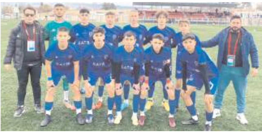
HE Kültürspor U 16 takımı ligin ikinci hafta maçında bugün İskilip'de puan arayacak

B grubunda ise ilk hafta farklı kazanarak liderlik koltuğuna oturan Çorum Anadolu FK bugün saat 14'de Osmançıkgücüspor deplasmanında liderliğini devam ettirmek için mücadele edecek. Grubun ilk hafta kazanan takımı Hattuşa Gençlikspor ise ilk haftayı bay geçen Çorumspor önünde galibiyet serisini devam ettirmek istiyor.