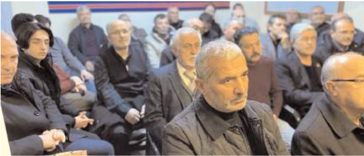
Söyleşiye ilgi yüksek oldu.