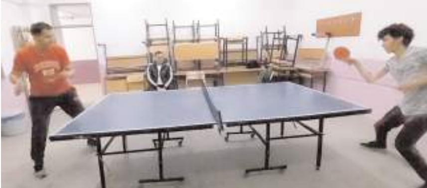
Başka bir sınıfta ise kurulan masa tenisi masasında çalışarak il dördüncüsü oldular