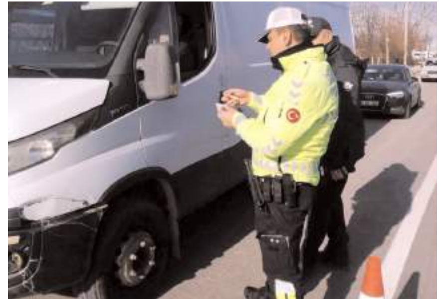
Polis ekipleri ticari araçları durdurarak lastiklerini kontrol etti.

Ekipler, inceledikleri araçların sürücülerine de kış lastiğinin önemini anlatan broşürler dağıttı.(AA)