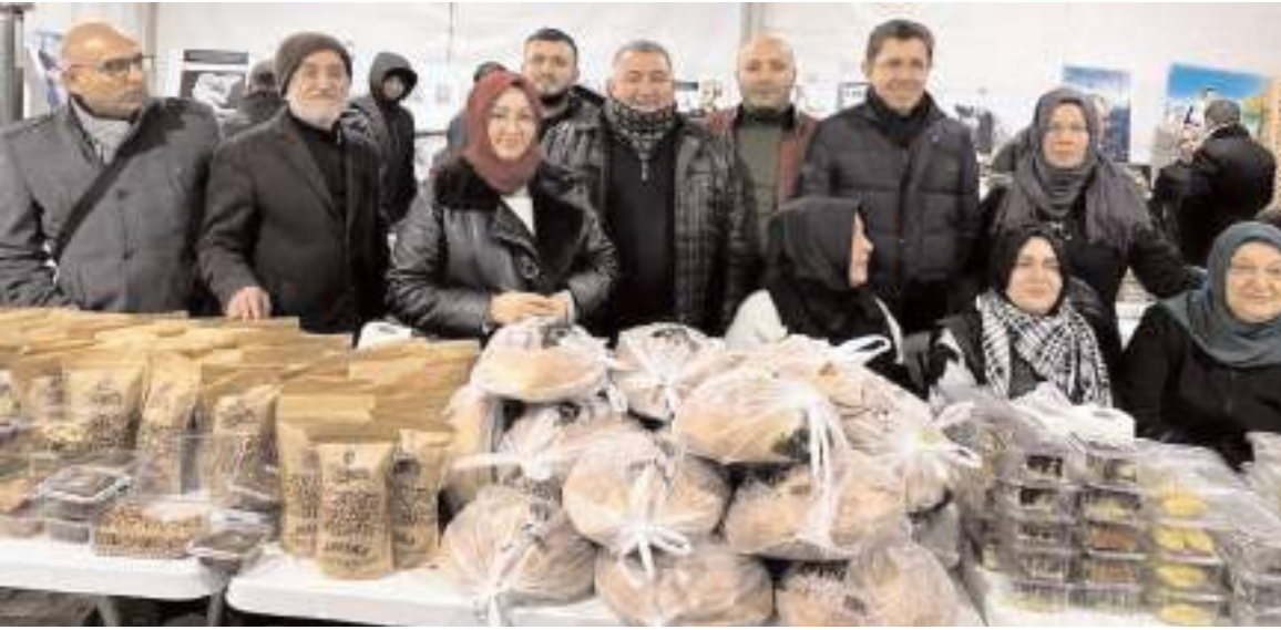
Vatandaşların leblebiye ilgisi yüksek oldu.

Ümraniye İl Dernekleri Platformu Tarafından, düzenlenen Filistin'e destek kermesine Çorum Eğitimci Sanayici İş Adamları Derneği (ÇESİAD)'de katkıda bulundu.