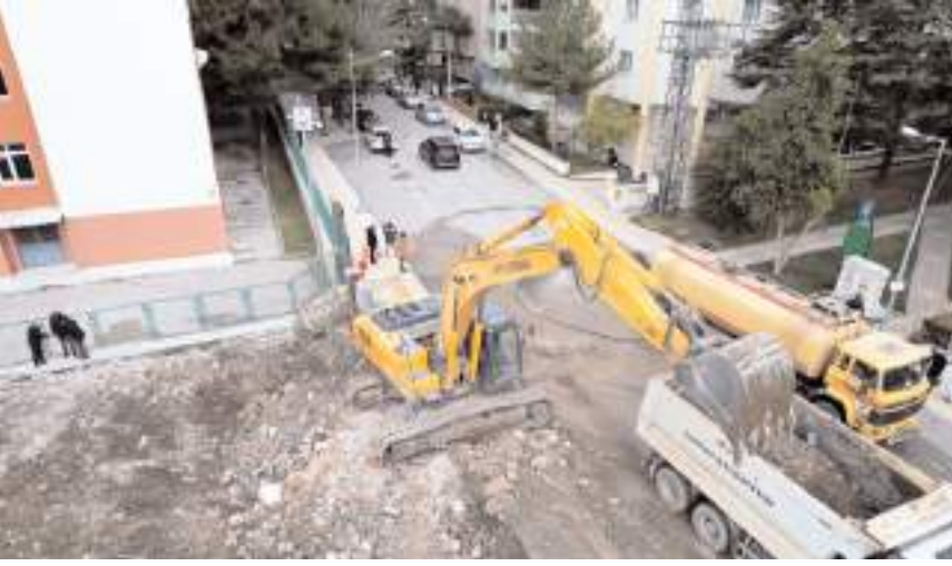
Belediye okulun bahçesinde genişletme çalışmalarına başladı.