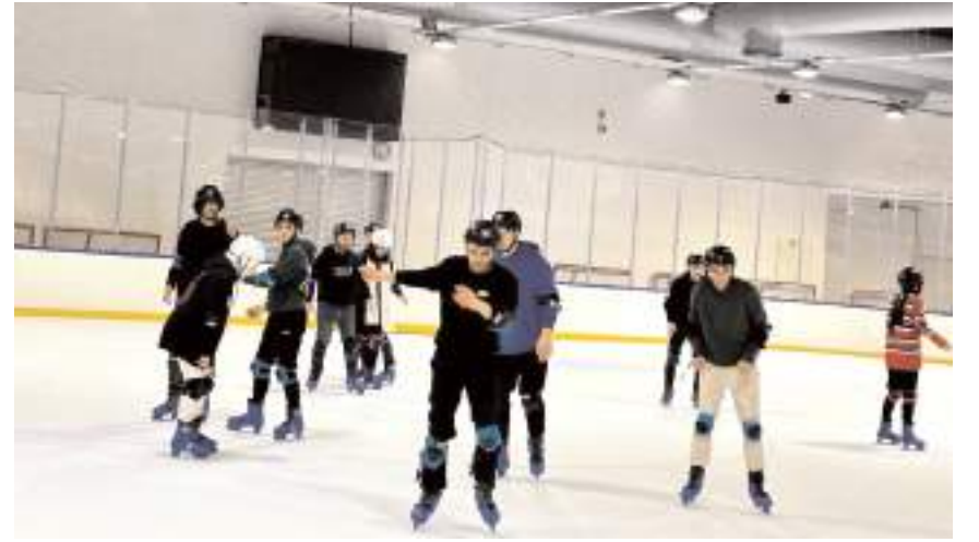
Öğrenciler güzel bir geçirdiler.