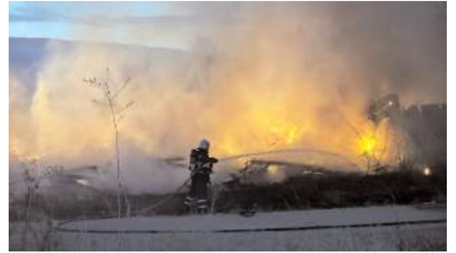
Yangın itfaiye ekipleri tarafından söndürüldü.

Ekiplerin yoğun çalışmaları sonucu yangın kontrol altına alındı.