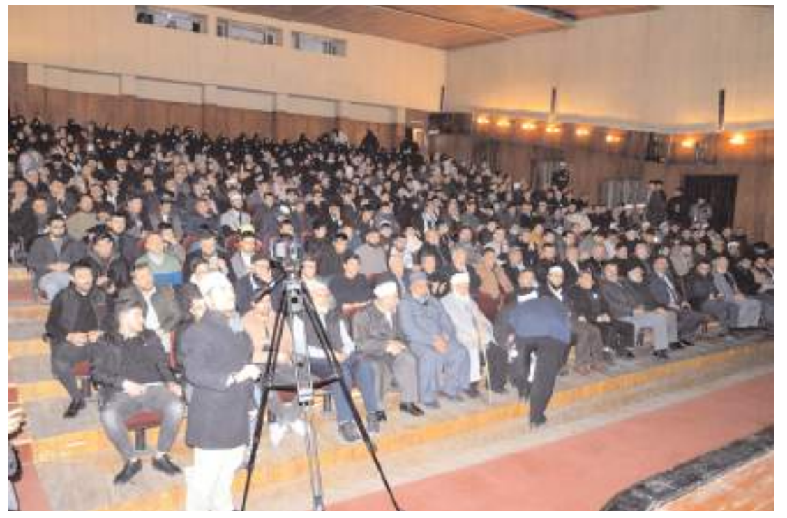
Konferansa ilgi yüksek oldu.