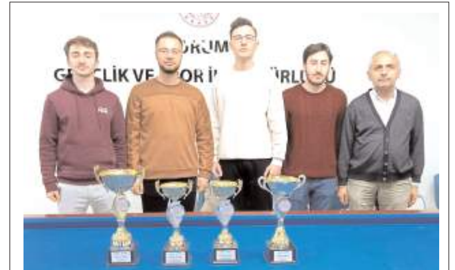
Yurtlar Bilardo Turnuvasında dereceye giren sporcular ödül töreni sonrasında toplu halde

90+2. dakikada Ali Ülgen Sakaryaspor 29 puanla Tuzlaspor ise 13 puanda maçın skorunu belirledi. dördüncü yer alırken kaldı.