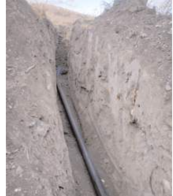
Proje KÖYDES programı kapsamında hayata geçirildi.