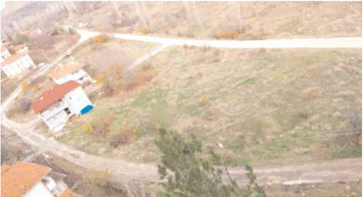
Atletizm branşında çalışma yapacakları parkur olmadığı için okul etrafındaki bu yollarda çalışma yapıyorlar

branşlarda öğrencilerini sporla tanıştıran ve onları topluma kazandırma adına çok önemli bir görev üstlenen Uğur Altuncu'nun çalışma yaptığı sınıflarda eğitimin yanında spor da yaptırarak çok önemli işlere imza atıyor.