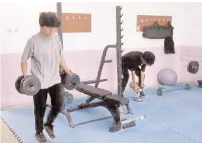
Bir sınıfta oluşturulan kondisyon ve halter aletlerinde kuvvet çalışması yapılıyor