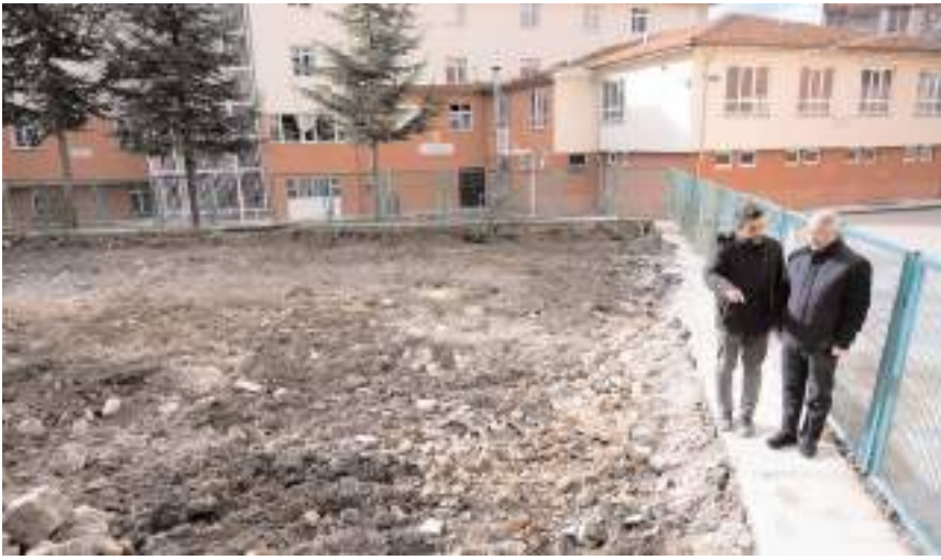
Başkan Aşgın, çalışmalarını yerinde inceledi.