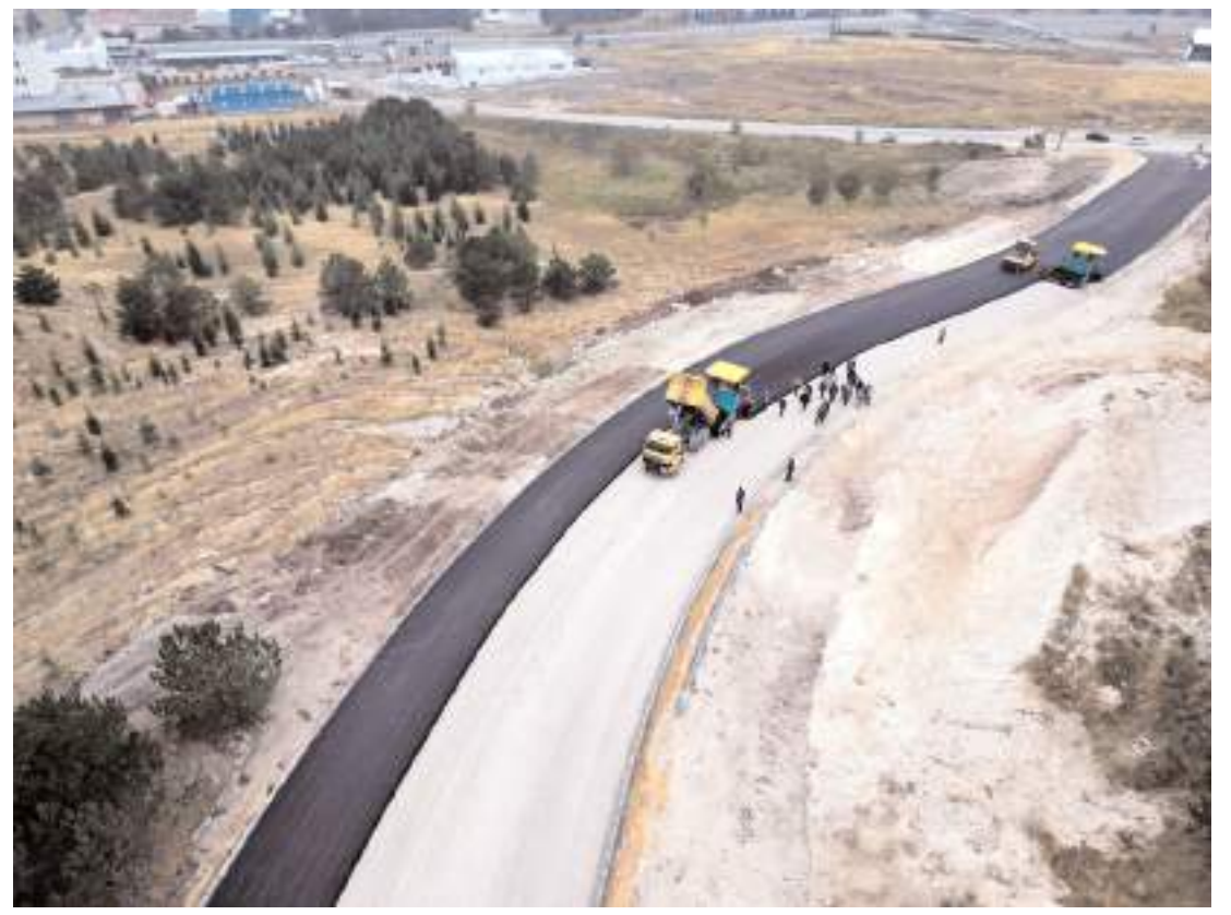
11 aylık süreçte 100 kilometre asfalt serildi.

Ahlatcı Yatırım 600 milyon TL ödenmiş sermayesi ile faaliyetlerine ana merkezi İstanbul'da olmak üzere 2 şube, 5 iribat bürosu ile Hisse Senedi, Vadeli Piyasalar, Opsiyon ve Yurtdışı Vadeli Ürünler, Yatırım Danışmanlığı, Bireysel Portföy Yönetimi, Kurumsal Finansman ve ayrıca Forex piyasalarında yatırımcılara hizmet vererek devam ediyor. (Haber Merkezi)