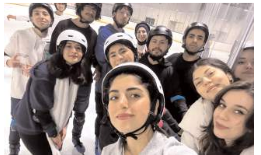
Öğrenciler günün anısına bol bol fotoğraf çekindiler.