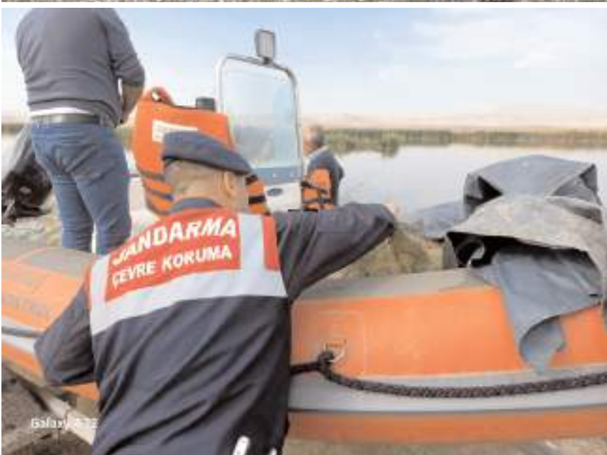
Denetimlerde 4000 metre uzunluğunda misina balık ağı ve yaklaşık 1000 kg iç su balığı ele geçirildi.