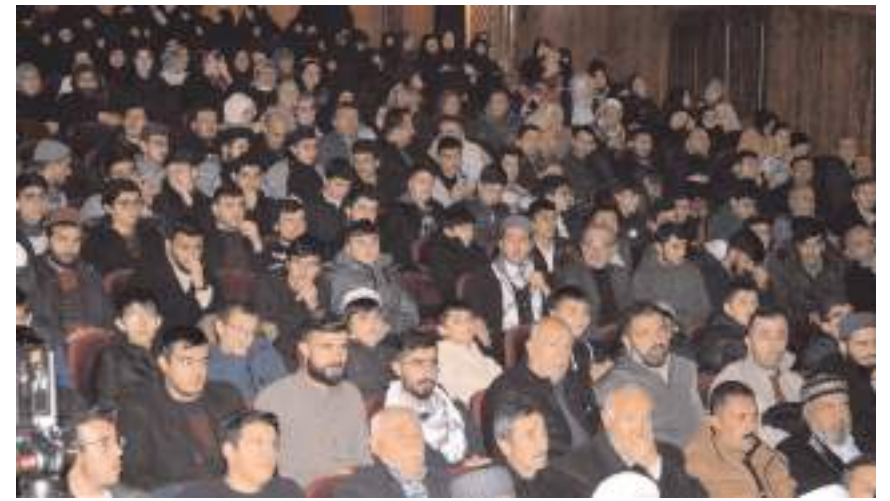
Konferans Devlet Tiyatro Salonunda yapıldı.