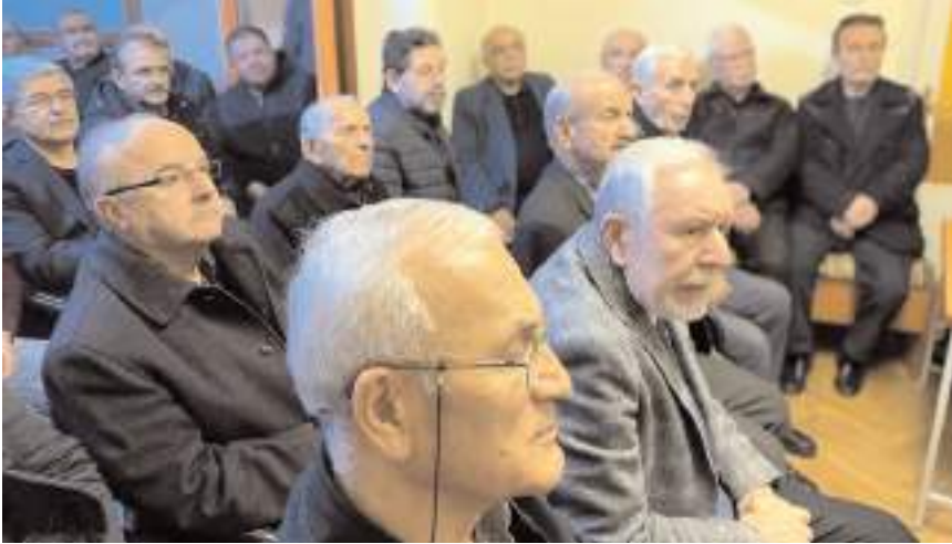
Program Türk Ocağı Çorum Şubesinde düzenlendi.