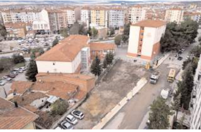
Belediye, yeni açılan alana çok amaçlı spor sahası inşa edecek.