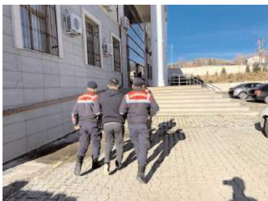
Ş.Y., Delice Cezaevine teslim edildi.

lunan firari şahıs, yakalanarak cezaevine teslim edildi.