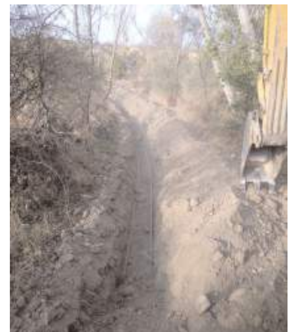
Proje kapsamında köylerin isale hatları yenilendi.