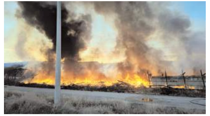
Yangında maddi hasar meydana geldi.