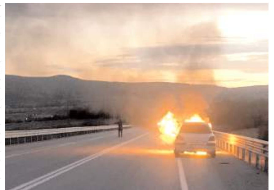
Yanan araç kullanılamaz hale geldi.

Çorum Belediyesine bağlı itfaiye ekiplerince