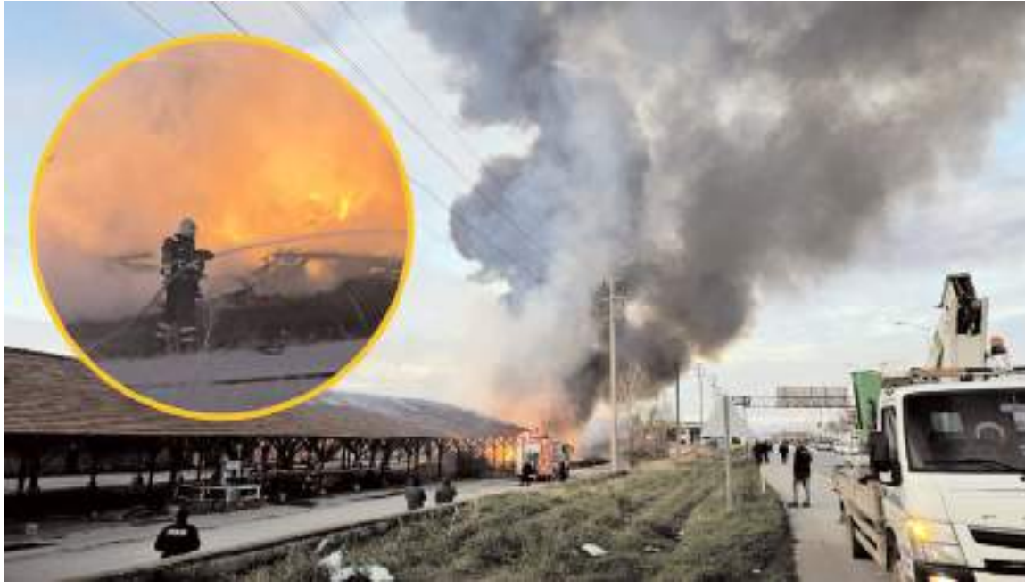
Olay Ankara yolunda bir kullanılan bir tuğla fabrikasında meydana geldi.