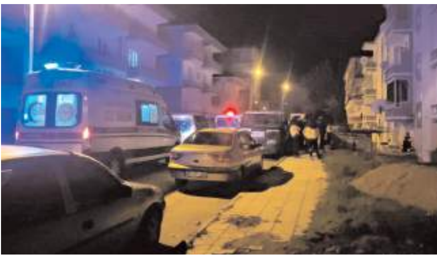
Yaralılar ilk müdahalenin ardından hastaneye kaldırıldı.

Çorum'da bir kişi, arazi yüzünden tartıştığı ağabeyi ile yeğenini bıçakla yaraladı.