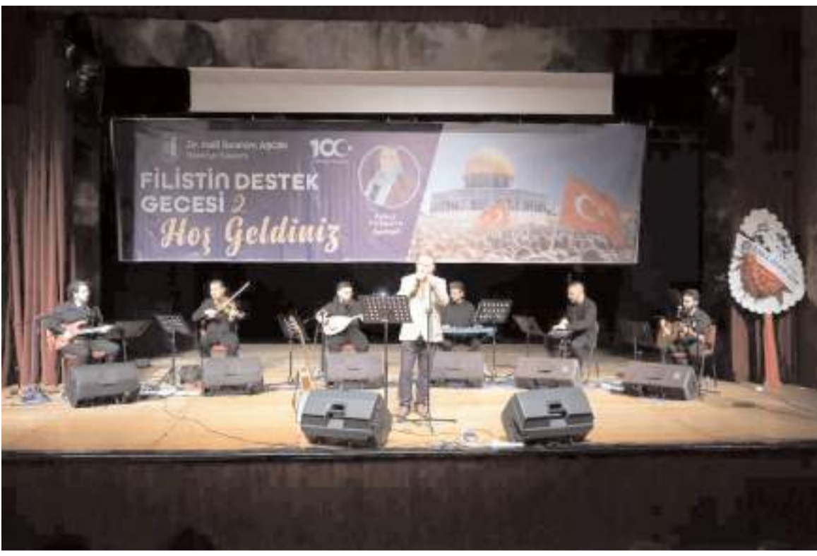
Filistin Destek Gecesi'nin ikincisi gerçekleştirildi.