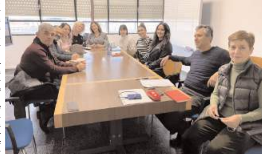
Projede Türkiye, Polonya ve Yunanistan'dan okullar yer alıyor.