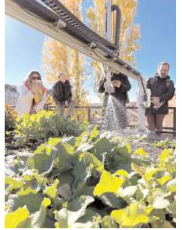
Öğretmenler modern tarım uygulamalarını incelediler.

Temiz ve sağlıklı bir çevre elde etmek için dünya genelinde bireyler, topluluklar ve uluslar arasında ortak bir işbirliğini amaçlayan proje, öğrencilerin olumlu şeyler üretmeye teşvik edilmesi, karbon ayak izinin hesaplanması, alternatif enerji kaynaklarının öğrenilmesi gibi hedeflere sahip.