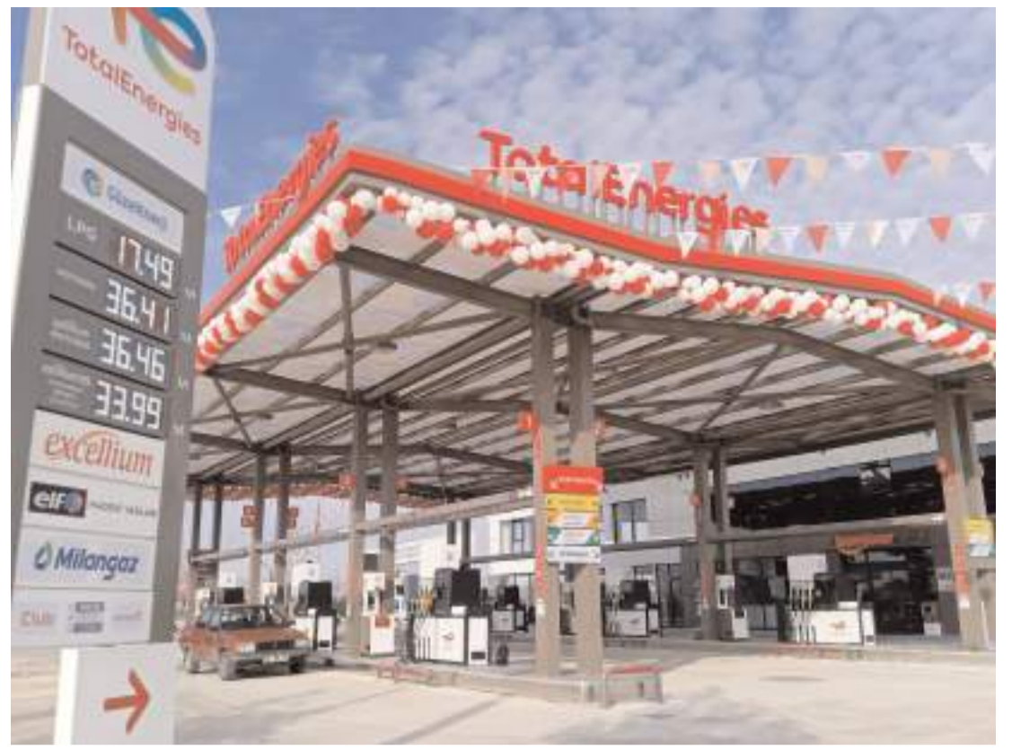
Güzel Petrol TotalEnergies otobüs terminali yanında bulunuyor.