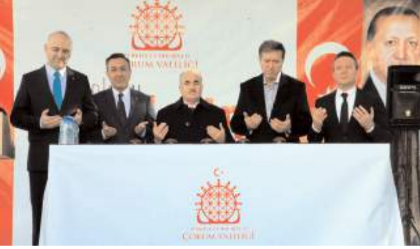
Yapılan duanın ardından okulun temeli atıldı.