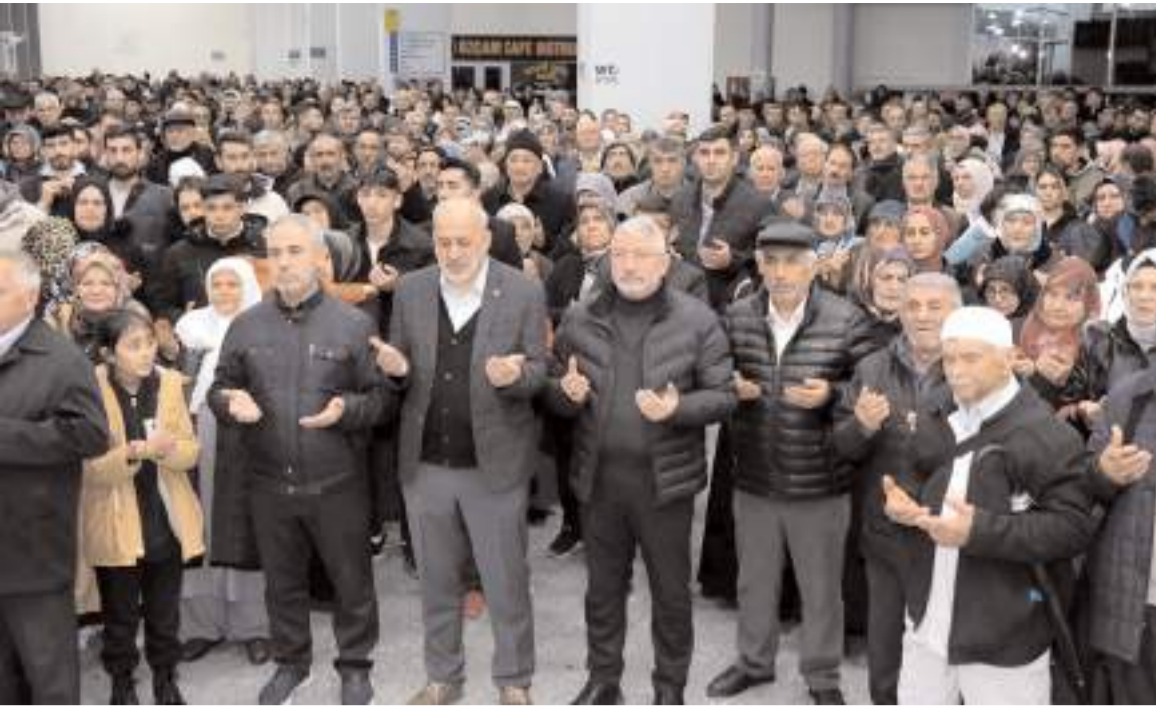
Yapılan duanın ardından umreciler kutsal topraklara uğurlandı.