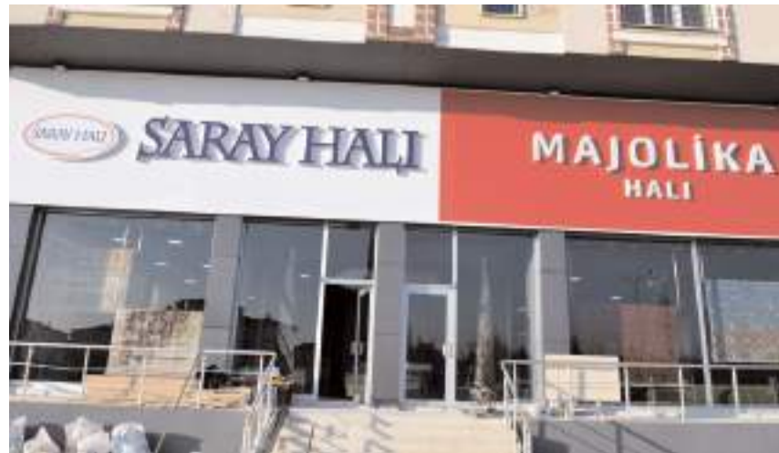
Saray Halı ve Majolika Ulukavak Mahallesi Çevre Yolu Bulvarı numara 128'de bulunuyor.