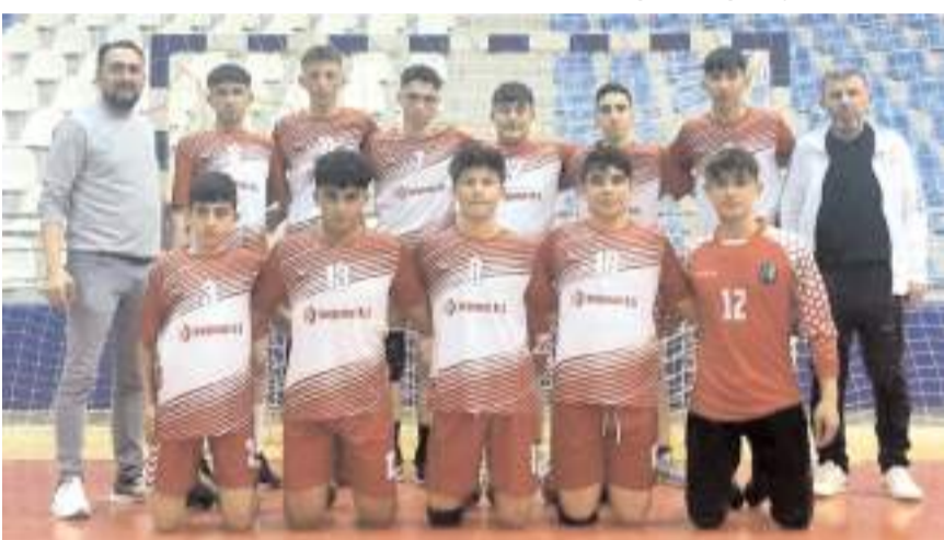
Şehit Mustafa Solak Anadolu İmam Hatip Lisesi grup ilk maçını kazandı