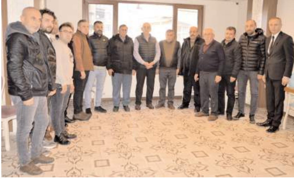
Lokantacılar ve Aşçılar Odası'na üye esnaflar basın açıklaması yaptı.