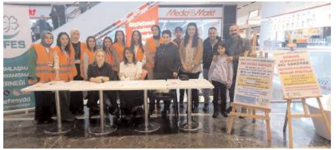
AHL Park AVM'de kurulan stantta vatandaşlara SMA hastalığına ilişkin bilgiler verildi.