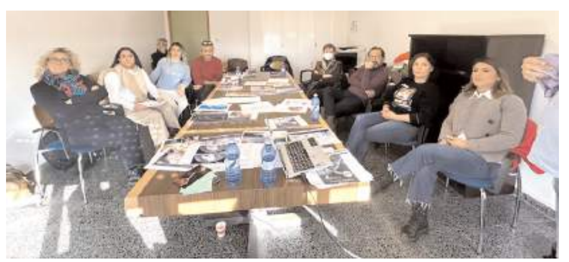
Mehmetçik Anadolu Lisesi öğretmenleri, İspanya'da iklim değişikliği çalıştayına katıldı.