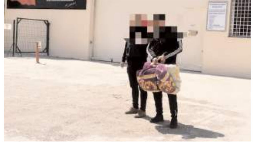
Jandarma ekipleri 13-18 Aralık tarihleri arasında operasyonlar düzenledi.

İl Jandarma Komutanlığından operasyonlar hakkında yapılan açıklamada, "Suç ve suçlulukla mücadelenin en önemli unsurları, kanunlara göre suç teşkil eden filleri işleyen suçluları yakalayıp adalete teslim etmek ve böylece potansiyel suçluları caydırma, kamu vicdanını rahatlatma, suçlunun davranış biçimini değiştirme ve gelecekte işlenecek olan suçların önüne geçme hedeflerine ulaşmaktır. Çorum İl Jandarma Komutanlığı sorumluluk bölgesinde, vatandaşlarımızın can ve mal güvenliğinin sağlanması, özellikle hırsızlık olaylarının önlenmesine yönelik önleyici tedbirlerle ve şüphelilerin yakalanması çalışmalarına 24 saat esasına göre kararlılıkla devam edil-