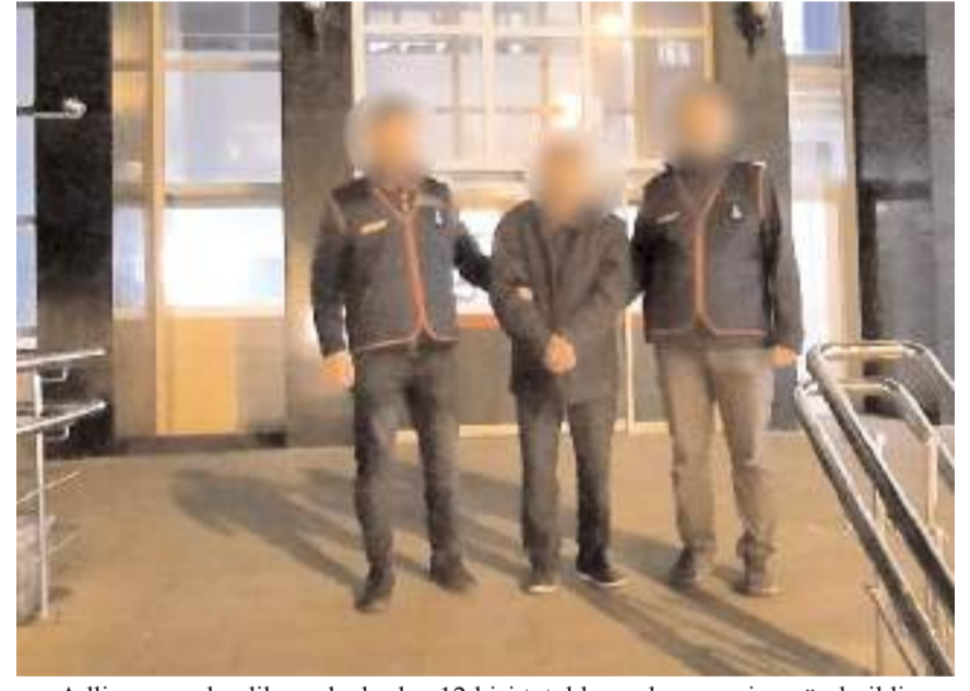
Adliyeye sevk edilen şahıslardan 12 kişi tutuklanarak cezaevine gönderildi.

mektedir. Vatandaşlarımızın şüpheli durumları 112 Acil Çağrı Merkezi üzerinden Jandarma'ya bildirilmesi, olayların önlenmesi ve aydınlatılmasına büyük katkı sağlayacaktır" denildi. (Haber Merkezi)