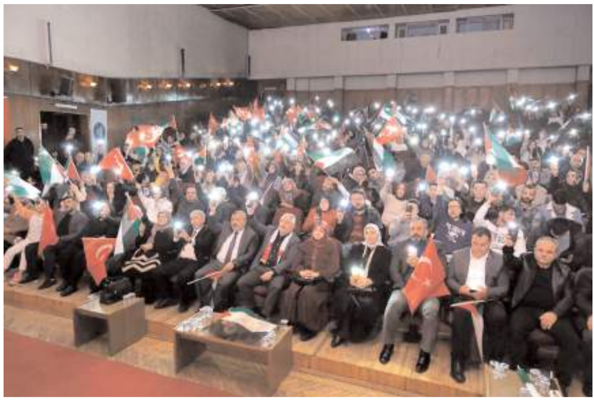
Devlet Tiyatro Salonunda yapılan programa ilgi yüksek oldu.