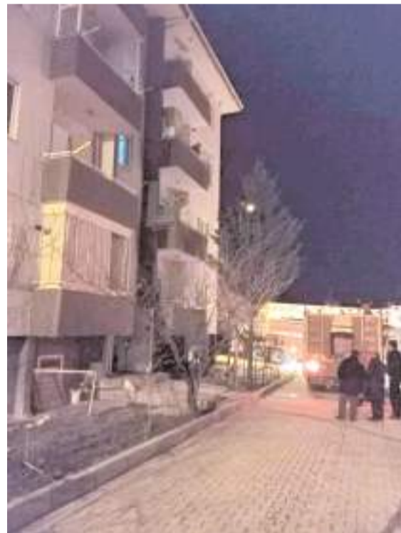
Olay Akçakent Mahallesi'nde bulunan bir evde meydana geldi.

Hastanesine kaldırılarak tedavi altına alındı. Kazayla ilgili olarak başlatılan incelemenin devam ettiği bildirildi. (İHA)