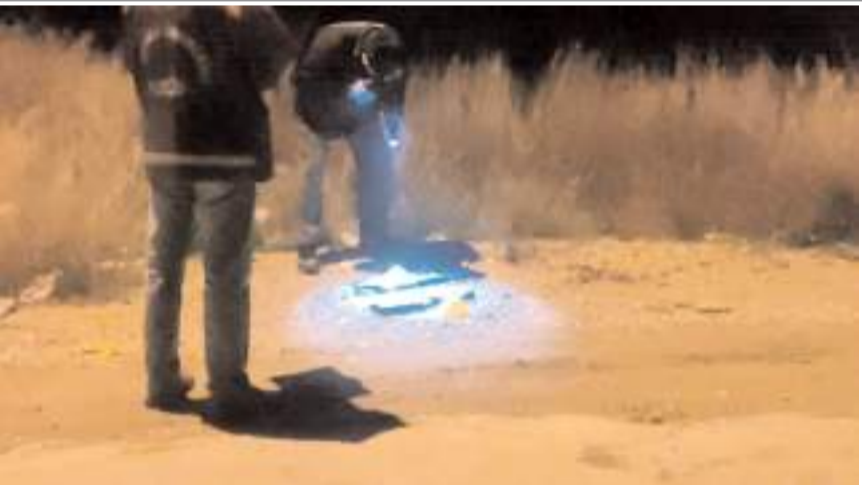
Olay Buhara 27. Sokak üzerinde bulunan boş bir arazide meydana geldi.

Yaralı şahıs 112 istasyonuna giderek yardım istedi