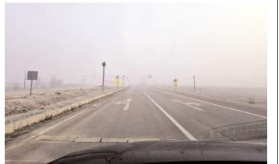
Kaza yoğun sis nedeniyle görüş mesafesinin yaklaşık 10-15 metreye düştüğü sabah saatlerinde meydana geldi.

Hastanesine kaldırılarak tedavi altına alındı. Kazayla ilgili olarak başlatılan incelemenin devam ettiği bildirildi. (İHA)