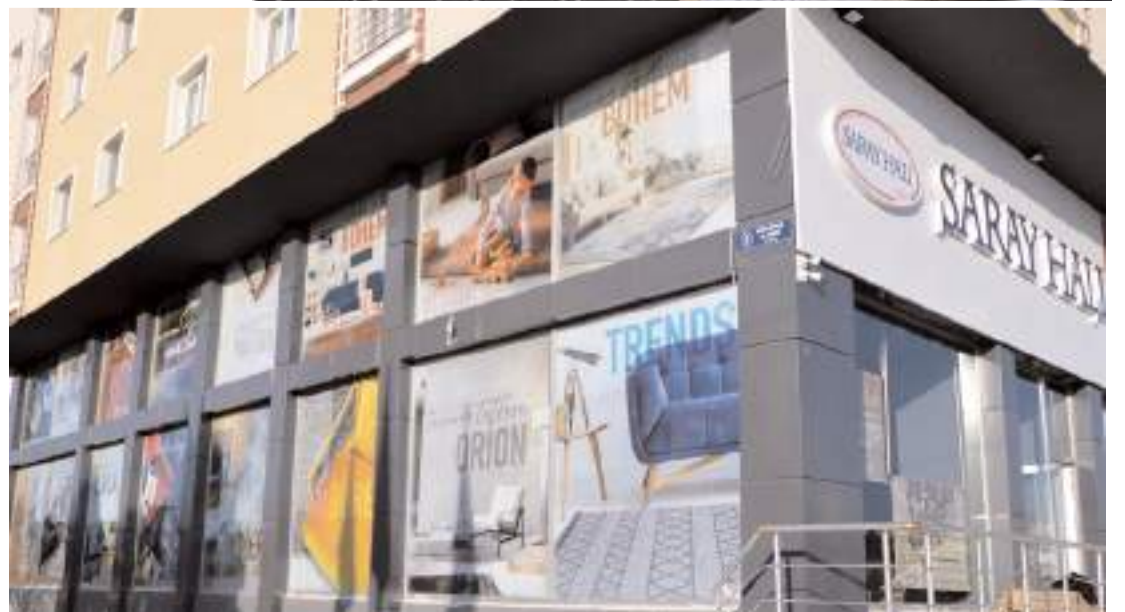
Firma 22 Aralık Cuma günü yapılacak törenle açılacak.