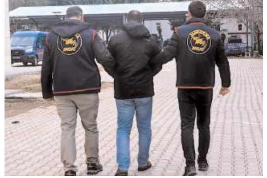
Operasyonda çeşitli suçlardan aranan 69 kişi yakalanarak adliyeye sevk edildi.