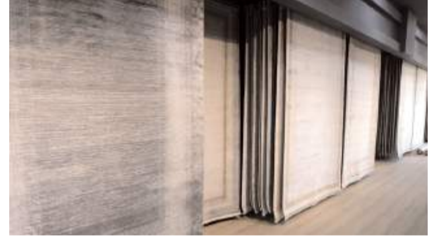
Firma Saray ve Majolika halılarının Çorum'daki tek yetkili satıcısı.