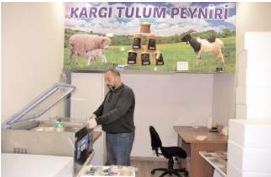
Proje TÜBİTAK'tan destek almaya hak kazandı.