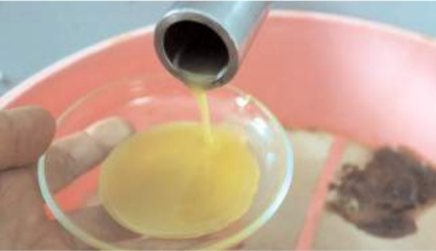
Aşağızeytin Köyü Yöresel Ürünler Kadın Girişim Kooperatifi zeytin yağı üretmeye başladı.