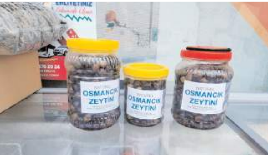
Osmancık zeytinini raflarda yerini aldı.