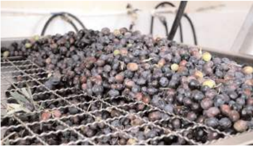
200 kilo zeytinden yaklaşık 30 kilo yağ çıkartılıyor.