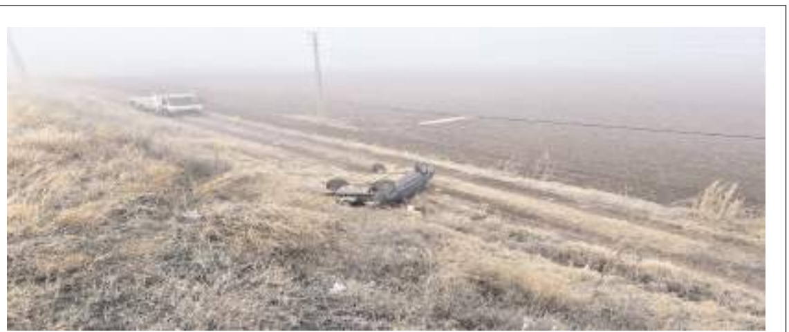
Kaza Alaca-Zile yolu Ekin Pazarı kavşağında meydana geldi.