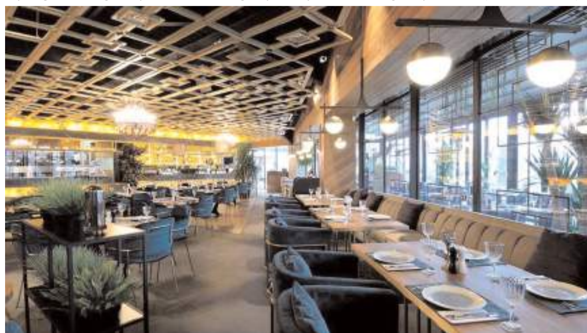
Fiyat Etiketi Yönetmeliği 1 Ocak 2024'ten itibaren geçerli olacak.

Ticaret Bakanlığı'ndan konuyla ilgili yapılan açıklamada, bazı işletmelerin enflasyon oranının ve maliyetlerin çok üzerinde fiyat artışı yaptığına dikkat çekildi. Açıklamada, tüketicilerden, işletmeler tarafından tam ve doğru bilgilendirilmedikleri yönünde şikâyetler alındığı bildirildi. Bu nedenle de düzenleme yapılması ihtiyacının olduğu kaydedildi. (Haber Merkezi)