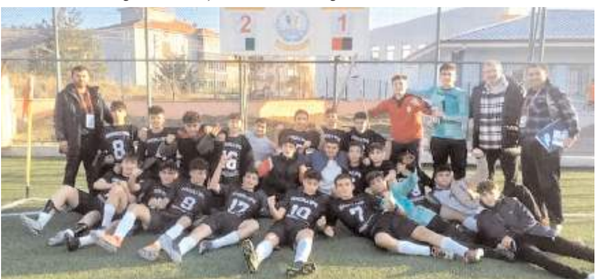
Sungurluspor U 16 ligindeki ikinci maçta evinde kazanarak üç puanın sevincini yaşadı

Gençlerbirliği ile Mimar Sinan arasındaki maçtan 2-0 galip ayrılan Mimar Sinan ikinci maçını kazanarak liderliğini sürdürdü. İlk haftanın kazanan diğer takımı İskilipgücüspor evinde HE Kültürspor ile 0-0 berabere kalarak ikinci haftayıbir puanla kapatırken Kültürspor ilk puanını aldı. İlk haftanın kaybeden iki takımı Sungurluspor ile Mavi Ay Gençlikspor arasındaki maçtan 2-1 galip ayrılan Sungurluspor takımı üç puanın sahibi oldu.