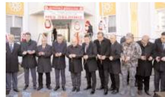
Yapılan duanın ardından açılış kurdelesini kesildi.