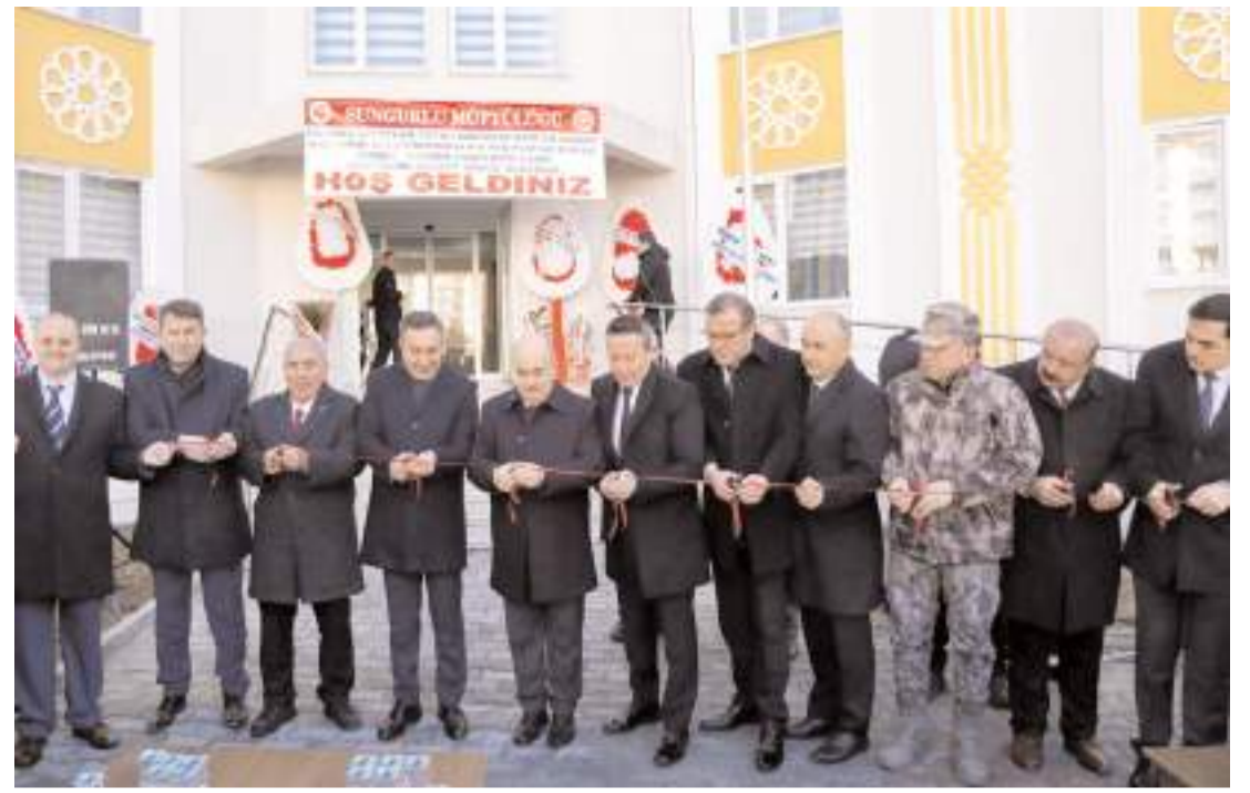
Yapılan duanın ardından açılış kurdelesi kesildi.

Ercan K'nin hayatı tehlikesinin bulunduğu öğrenildi.(AA)