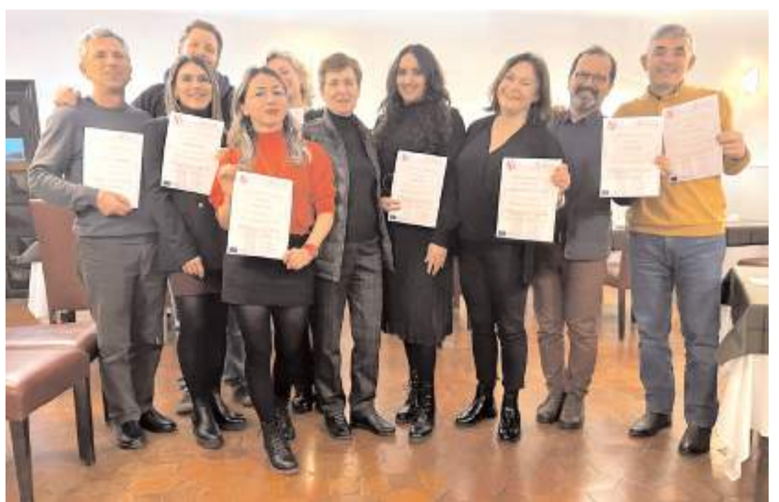
Çalıştayın sonunda öğretmenlere katılım belgeleri verildi.

Gençleri iklim değişikliği konusunda girişimci olmaya teşvik eden ve uluslararası toplantılarda çözüm önerilerini sunabilecek düşünce liderleri yetiştirmeyi amaçlayan projeyi Mehmetçik Anadolu Lisesi Öğretmenleri, iklim değişikliği konusunda farkındalık oluşturmak ve çözüm üretmek adına önemli bir adım olarak görüyor. (Haber Merkezi)