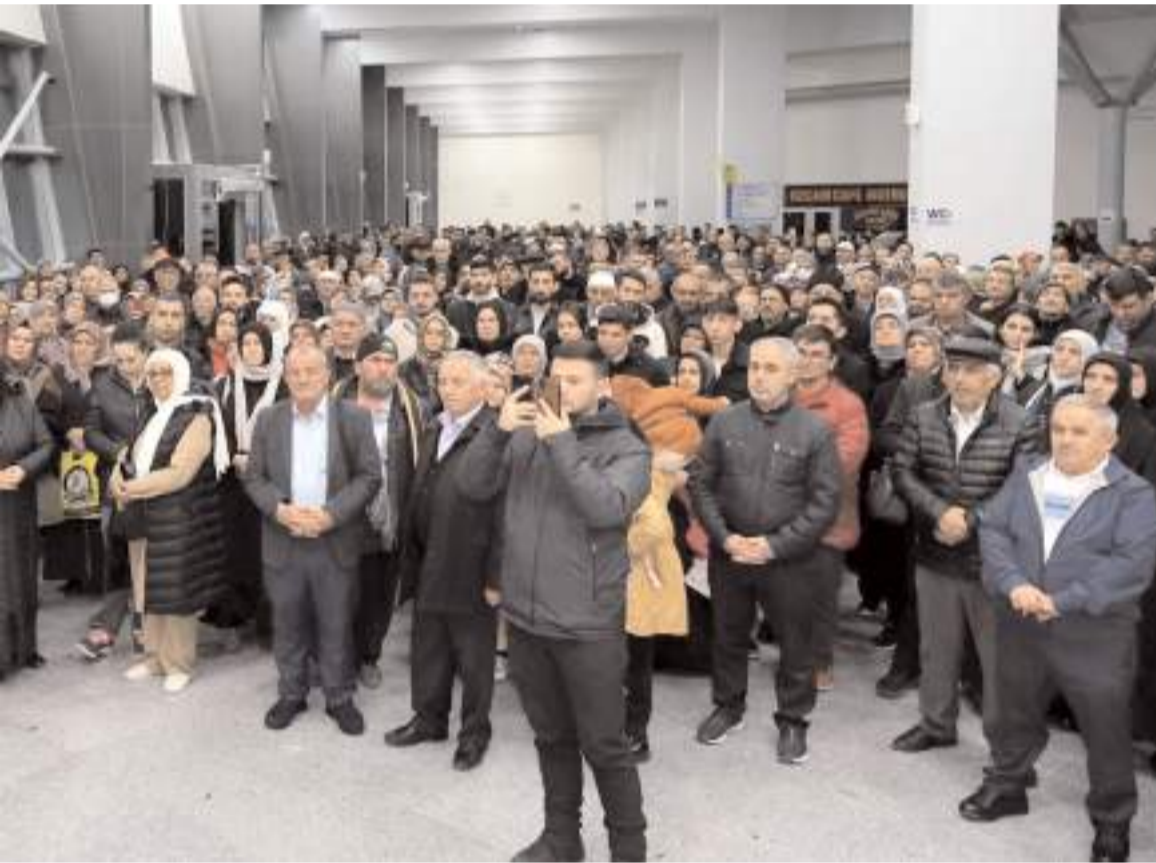
Uğurlama törenine katılım yüksek oldu.