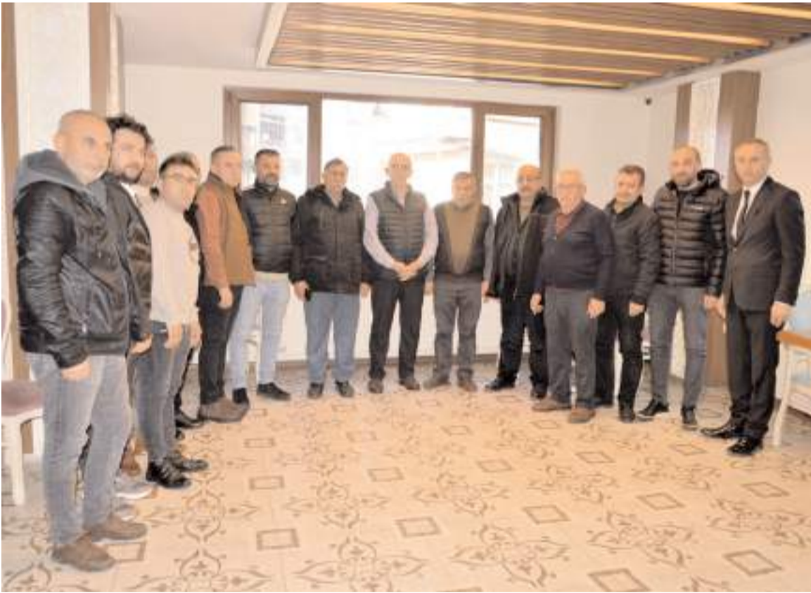
Lokantacılar ve Aşçılar Odası'na üye esnaflar basın açıklaması yaptı.