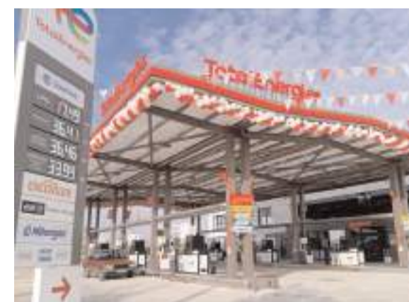
İşletme açılışa özel fiyatları ile müşterilerini bekliyor.