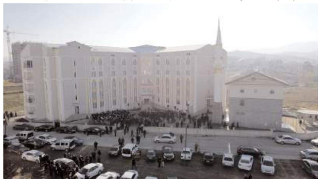
Komplekste Yatılı Hafızlık Kur'an Kursu, 4-6 Yaş Kur'an Kursu, Ahmet Hamide Çakıl-kum Camii ve Müftülük hizmet binaları bulunuyor.