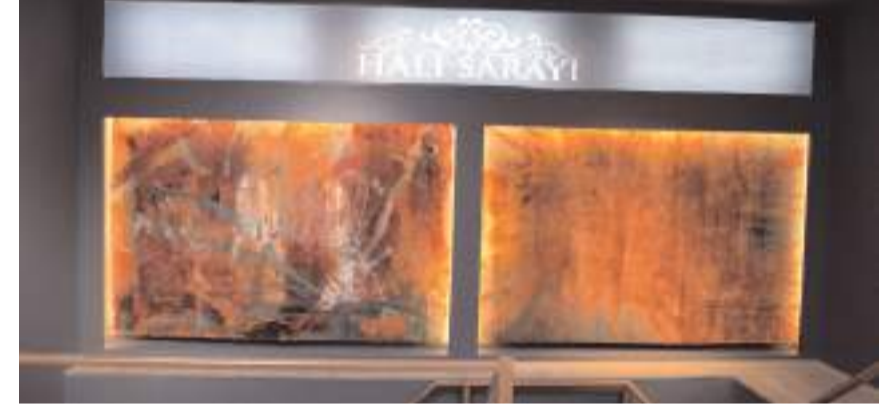
İşletme iki katlı ve 600 metrekare büyüklüğündeki mağaza ile müşterilerine hizmet verecek.