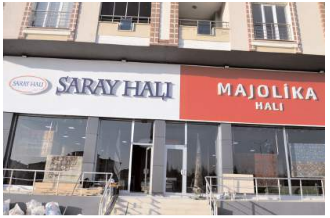
Saray Halı ve Majolika Uluvakavak Mahallesi Çevre Yolu Bulvarı numara 128'de bulunuyor.