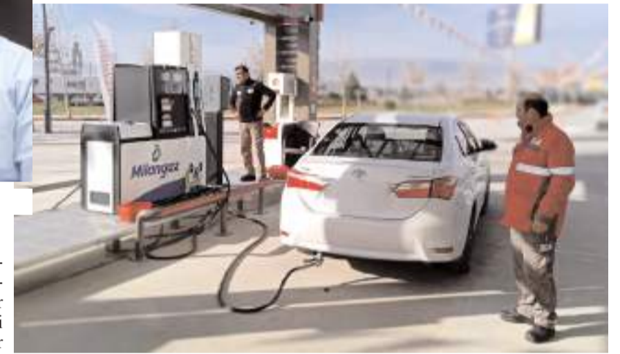
İşletme açılışa özel fiyatları ile müşterilerini bekliyor.

Güzel Petrol Total Energies Benzin İstasyonu