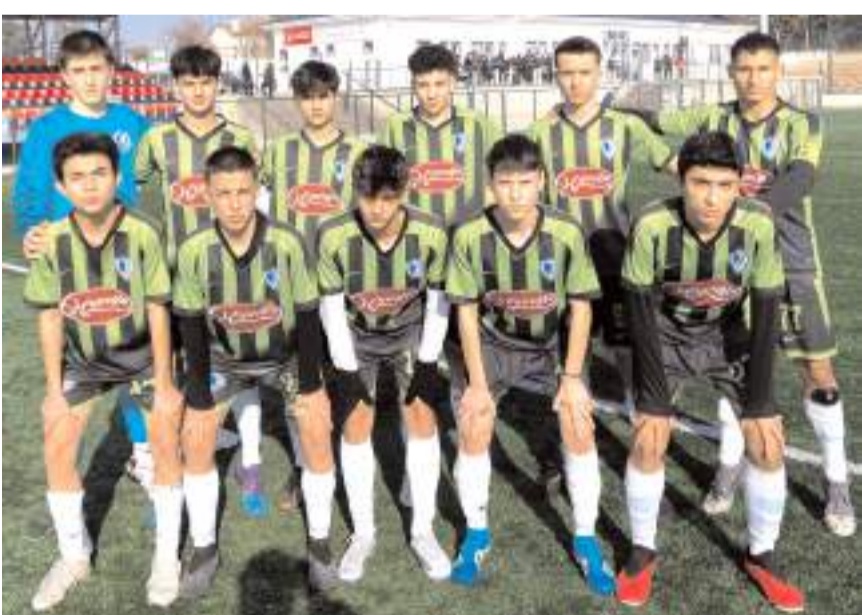
Mimar Sinan ligdeki ikinci maçını kazanarak liderliğini sürdürdü

MURAT ÇETİN hafta maçları dün oynandı. A grubunda ilk haftanın beş maçla tamamlandı. A grubunda ilk haftanın kazanan iki takımı