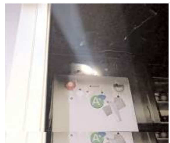
Kazada evde maddi hasar meydana geldi.

Edinilen bilgilere göre, Akçakent Mahallesi'nde N.A.'ya ait evin mutfak kısmında henüz bilinmeyen nedenle yangın çıktı. Dumanı gören mahalle sakinleri durumu itfaiye ekiplerine haber verdi. Kısa sürede olay yerine gelen belediye itfaiye ekipleri yangına müdahale etti. Yangın itfaiye ekiplerinin uzun uğraşları sonucu kontrol altına alındı. Yangında evin mutfak bölümünde bulunan eşyalar tamamen yanarak kullanılamaz hale geldi. (İHA)