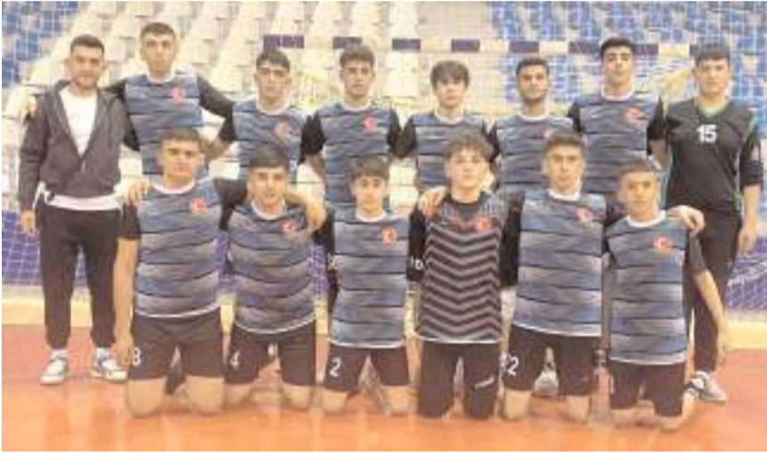
Şehit Emin Güner Mesleki ve Teknik Anadolu Lisesi Tokat grubuna galibiyet ile başladı

Grupta iki temsilcimizde dün akşam seansında ikinci maçlarını oynadılar. Şehit Mustafa Solak Anadolu İmam Hatip Lisesi grup birinciliği için Kastamonu Prof. Dr. Fuat Sezgin ile Şehit Emin Güner Mesleki ve Teknik Anadolu Lisesi ise Amasya 12 Haziran Anadolu Lisesi ile karşılaştılar. Temsilcilerimiz bu iki maçı kazanmalara halinde grupta birinci olarak yarı final grubuna yükselecekler.